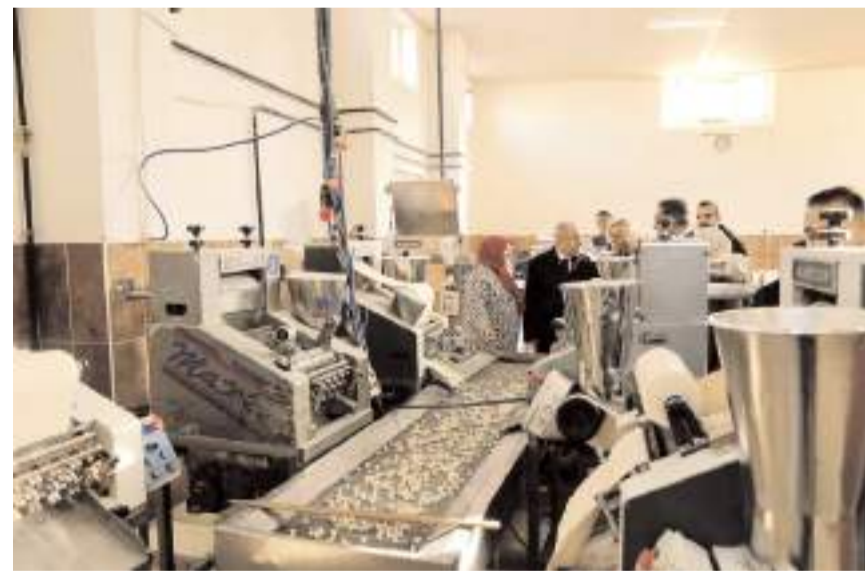
Kooperatifin üretim tesislerini gezen Vali Dağlı, ürünleri ve üretim aşamalarını inceledi.