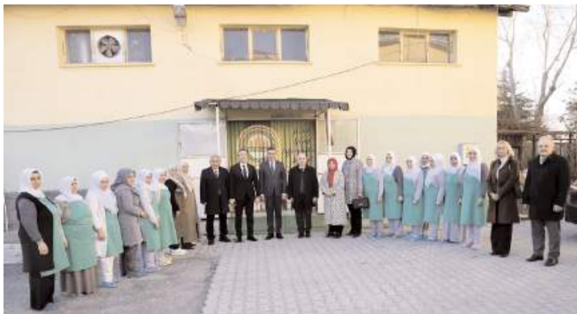
Dağlı'ya ziyarette protokol üyeleri de eşlik etti.