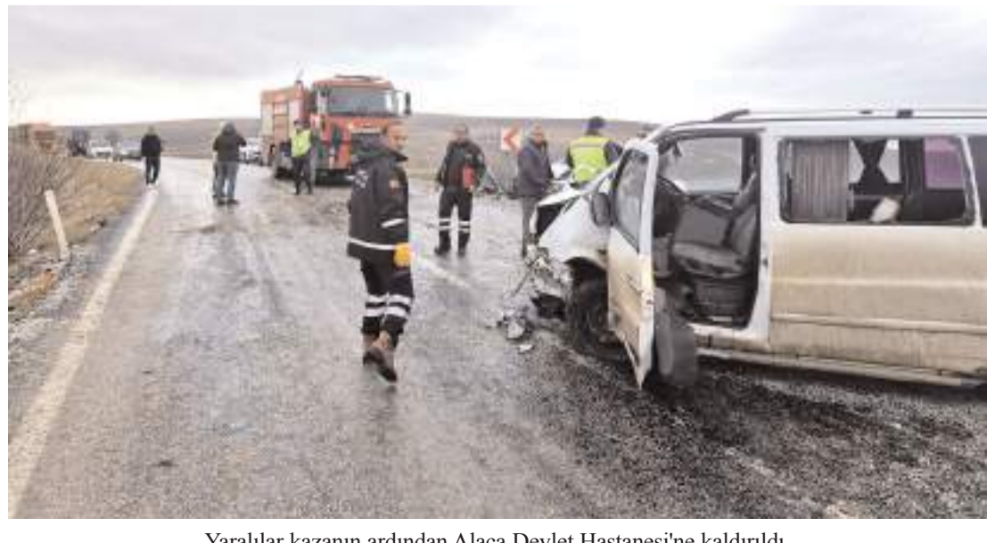
Yaralılar kazanın ardından Alaca Devlet Hastanesi'ne kaldırıldı.