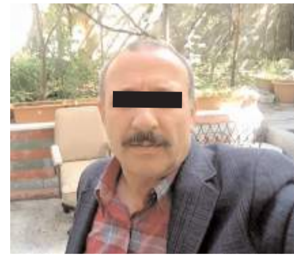
İskilip'te çıkan tartışmada baba, oğlunu bıçakladı.

■ Çorum'da aralarında bulunduğu 32 ilde DAESH terör örgütüne yönelik 'Kahramanlar-34' operasyonu düzenlendi. Operasyonda Çorum'da DAESH terör örgütü içerisinde faaliyet yürüten 11 şahıs yakalandı. * HABERİ'3'TE