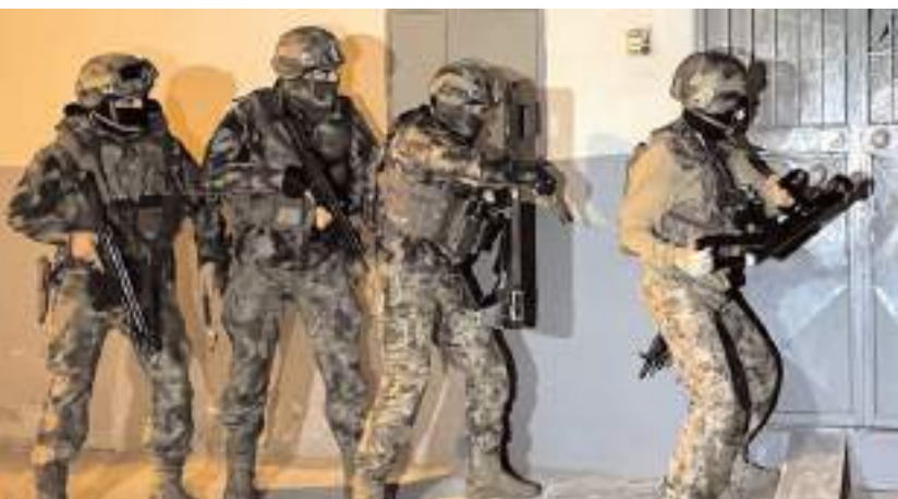
Çorum'unda aralarında bulunduğu 32 ilde DEAŞ'e yönelik operasyon yapıldı.

Operasyonları gerçekleştiren Kahraman Polislerimizi tebrik ediyorum. Allah ayaklarına taş değdirmesin. Yılın 365 günü, 4 mevsim, 12 ay, gece gündüz demeden operasyonlar düzenliyoruz. Terörle mücadele son terörist etkisiz hale getirilince kadar kararlılıkla devam edecek" (İHA)