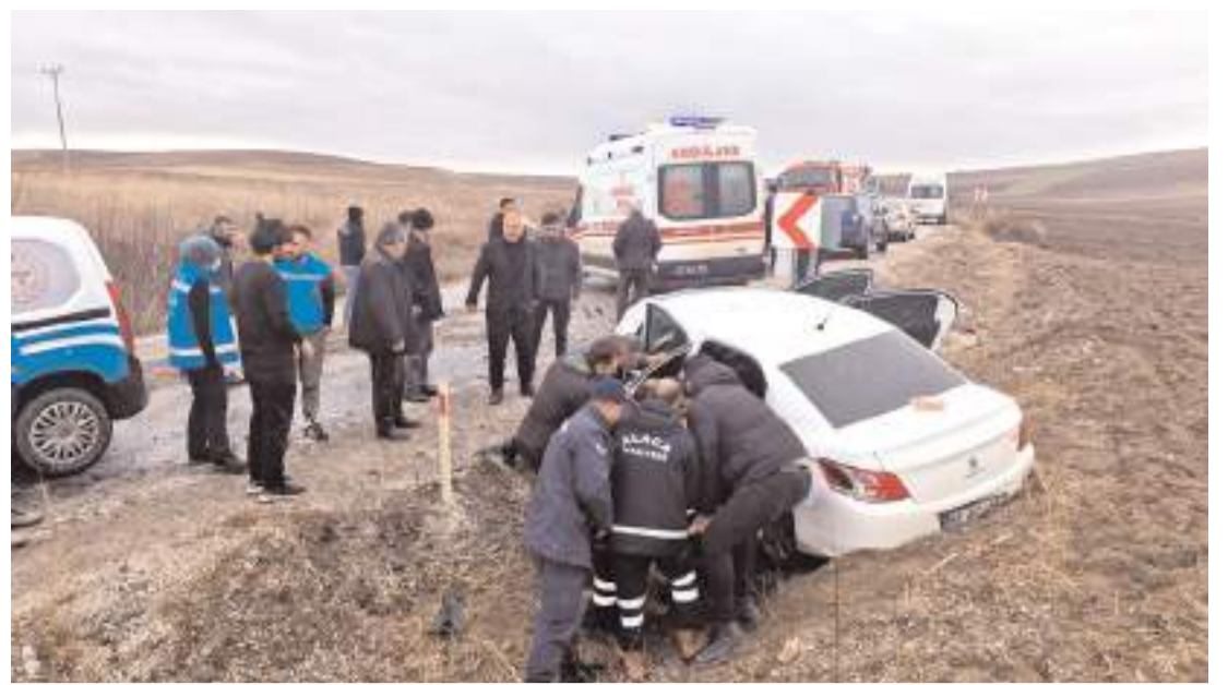
5 kişinin yaralandığı kazada otomobil ve ticari araç çarpıştı.