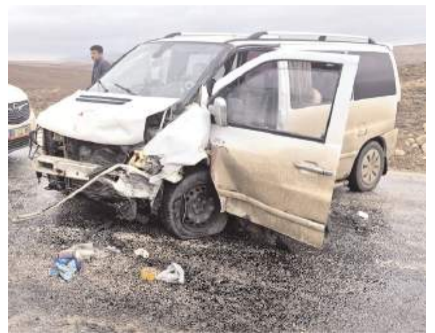
Kazada sürücüler ve yanındaki yolcular yaralandı.