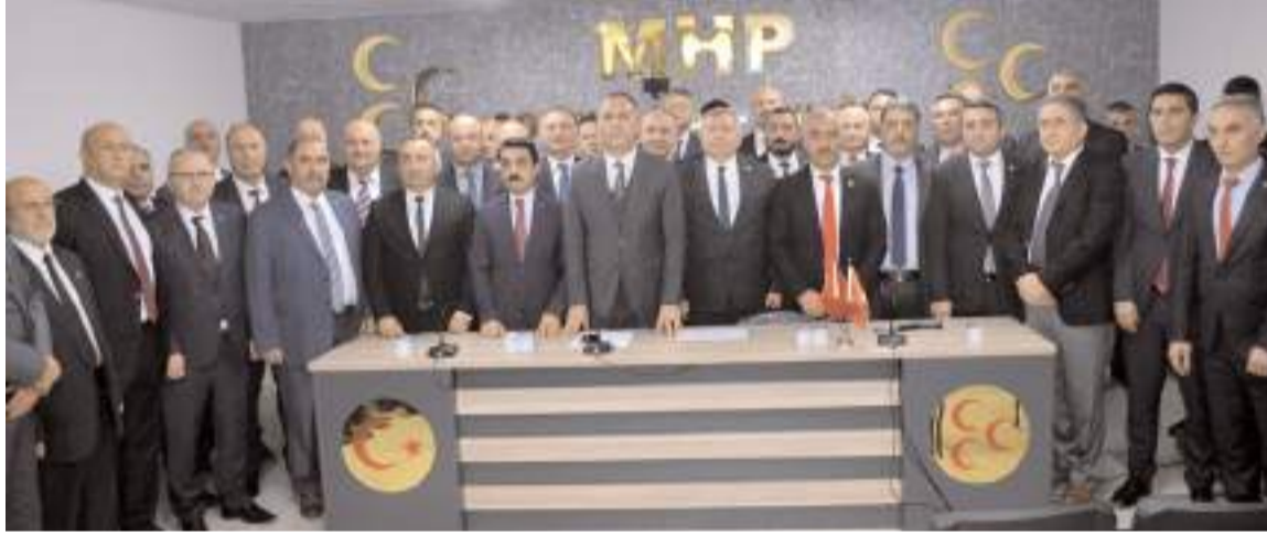
MHP İl Teşkilatı, belediye başkan aday adaylarını kamuoyuna tanıttı.

■ Milliyetçi Hareket Partisi (MHP) İl Teşkilatı, belediye başkan aday adaylarını kamuoyuna tanıttı. * HABERİ'2'DE