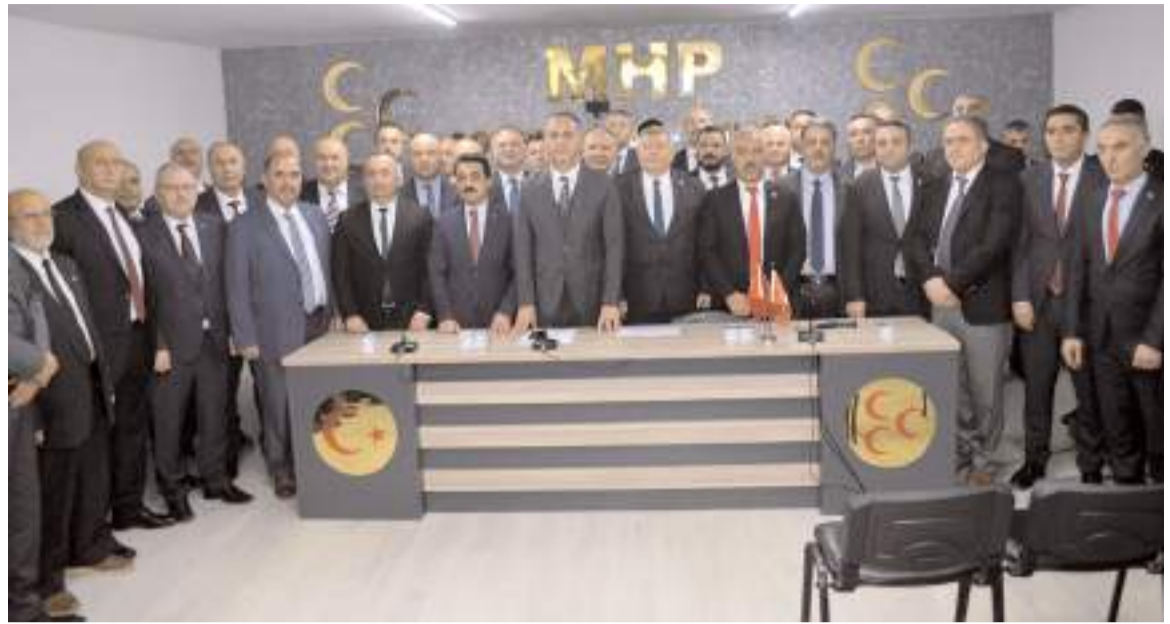
MHP İl Teşkilatı, belediye başkan aday adaylarını kamuoyuna tanıttı.

Cumhuriyetimizin 100. yılında, siyasetini, milli menfaatler çerçevesinde, milletin gözü önünde, milli varlığınıza halel getirmeyecek şekilde yapan, "ne işimiz var Suriye'de, ne işimiz var Libya'da, ne işimiz var Akdeniz'de" diyenlere inat, devletimizin egemenlik haklarını ve milletimizin çıkarlarını çiğnetmeyen, Suriye'nin kuzeyindeki terör hesaplarını bozan, yanı başımızda bir terör devleti kurulmasına müsaade etmeyen, milli davamız Kuzey Kıbrıs'ta Türklüğün kazanmasına destek olan, 30 yıldır işgal altındaki Karabağ'a Türk'ün şanlı bayrağını diken, gençlik yıllarımızda duvarlara yazdığımız, "Rehber Kur'an-Hedef Turan" ülkümüzü, Türk Devletleri Teşkilatına ete kemiğe büründüren, milliyetçi muhafazakâr insanımızın yüreğinde adeta bir sızı olan, Ayasofya'nın zincirlerini 86 yıl sonra kırıp, Ayasofya'yı ibadete açan, 40 yıldır ayağımıza pranga yapılan bölücü terörün kökünü kazıyan ve ekonomik operasyonlara boyun eğmeyip, milletimizi ezdirmeyen genel siyasetimiz gibi yerel siyasetimizde de başımız dik yürüyeceğiz. Bu düşüncelerle oluşturmuş olduğumuz yerel seçim stratejisi 31 Mart 2024 tarihinde yapılacak yerel seçimlerde genel merkezimizin öntümüzdeki günlerde almış olduğu karar doğrultusunda hareket edeceğiz. 31 Mart