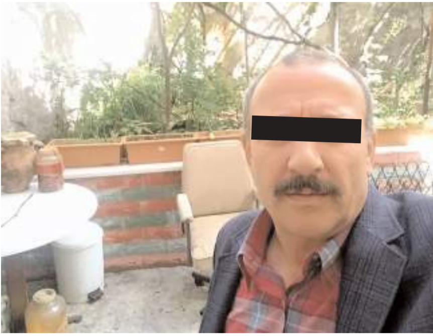
İskilip'te çıkan tartışmada baba, oğlunu bıçakladı.