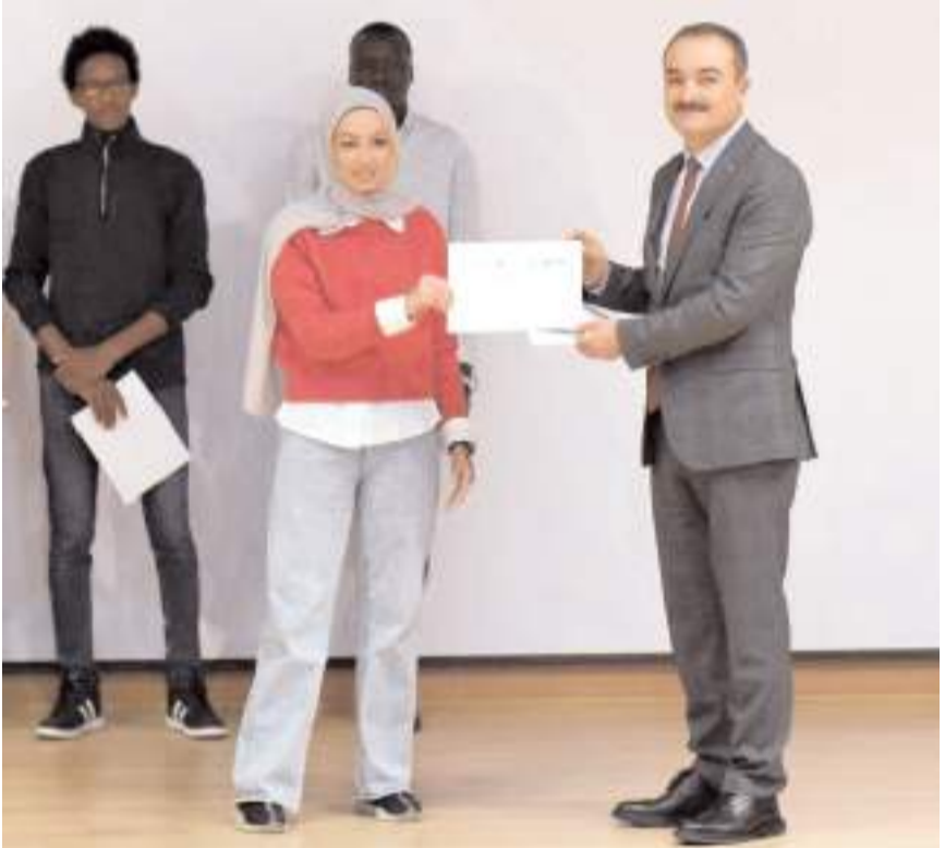
Eğitim programı 42 saat sürdü.