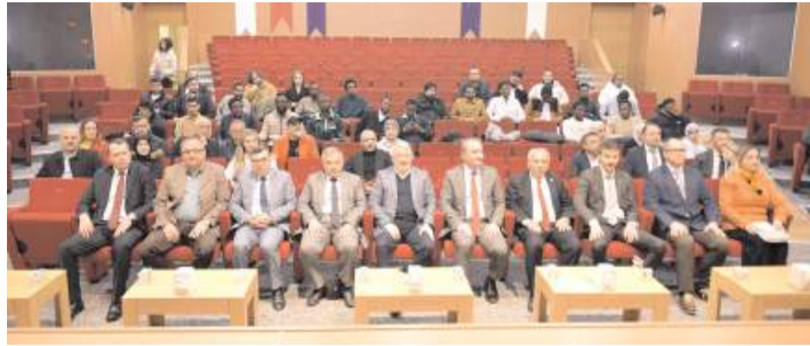
"Yabancı Uyruklu Öğrencilere Yönelik Dış Ticaret Eğitim Programı" tamamlandı.