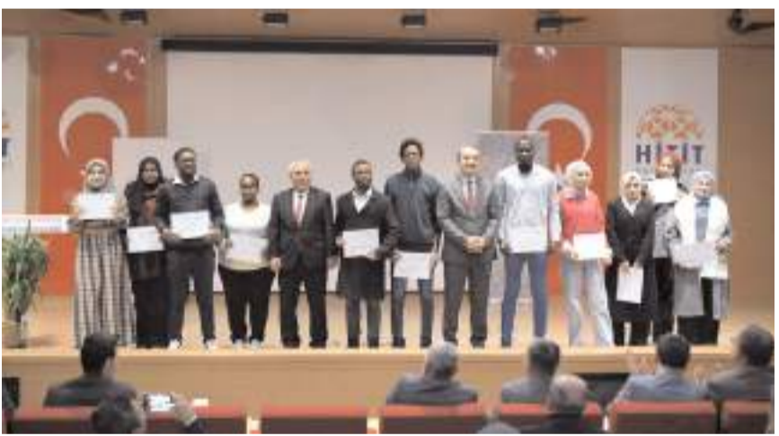
Programa 17 farklı ülkeden 49 uluslararası öğrenci katıldı.