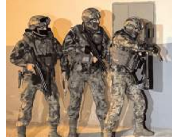
Çorum'da aralarında bulunduğu 32 ilde DAEŞ'e yönelik operasyon yapıldı.