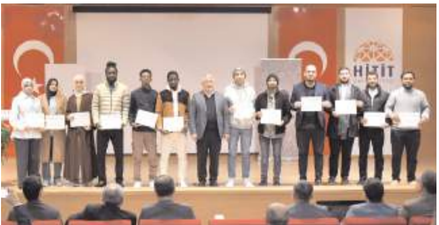
Programı başarıyla tamamlayan öğrencilere sertifikaları verildi.