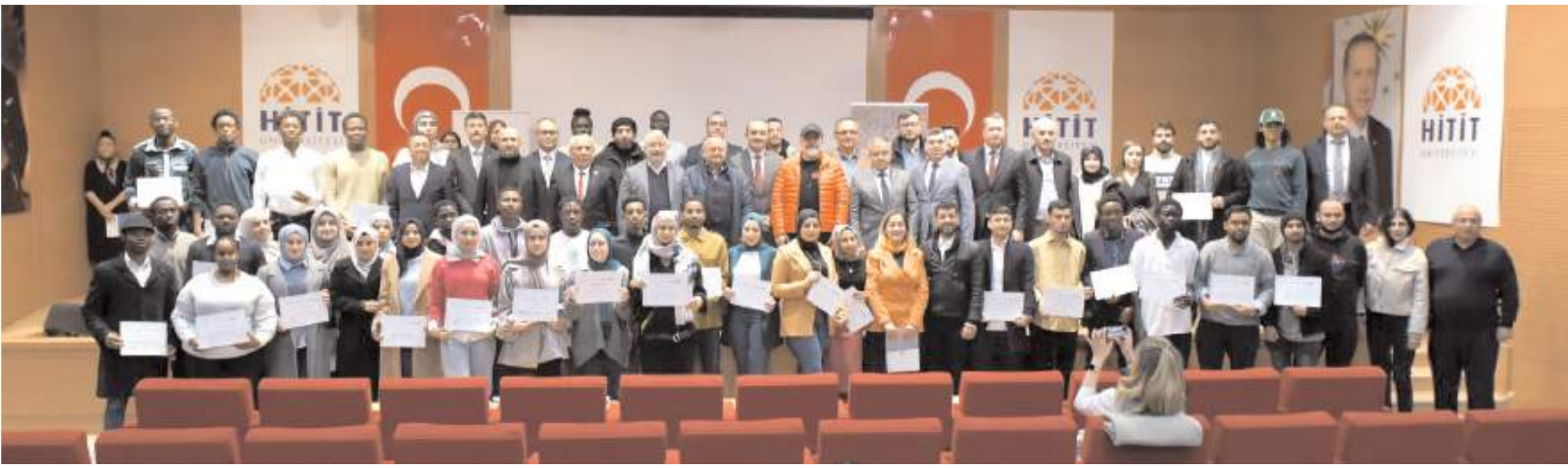
HİTÜ'nün uluslararası öğrencileri, Çorum'un dış ticaret elçileri olma yolundaki eğitimlerini tamamlayarak sertifikalarını aldılar.