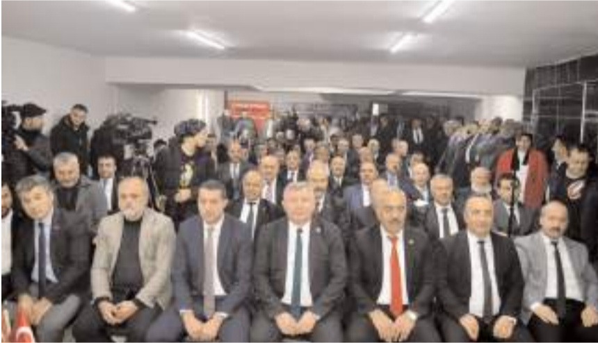
Toplantıya aday adaylarını yanısıra partililer de katıldı.