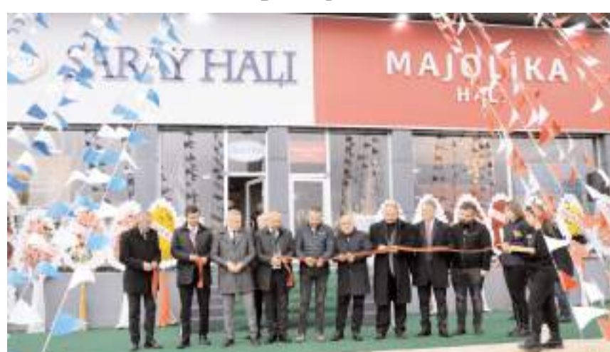
Saray Halı Ulukavak Mahallesi Çevre Yolu Bulvarı numara 128 (Vivense mobilya ve Hişiroğlu Leblebi yanı) adresinde hizmete girdi

■ Türkiye'nin en büyük halı markaları olan Saray Halı ve Majolika Çorum halkının hizmetine girdi. * HABERİ'12'DE