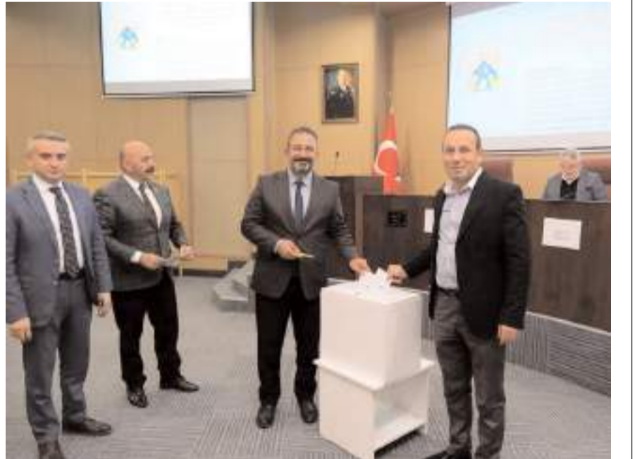
Toplantıda 2024 yılı yatırım programı ve bütçesi onaylandı.