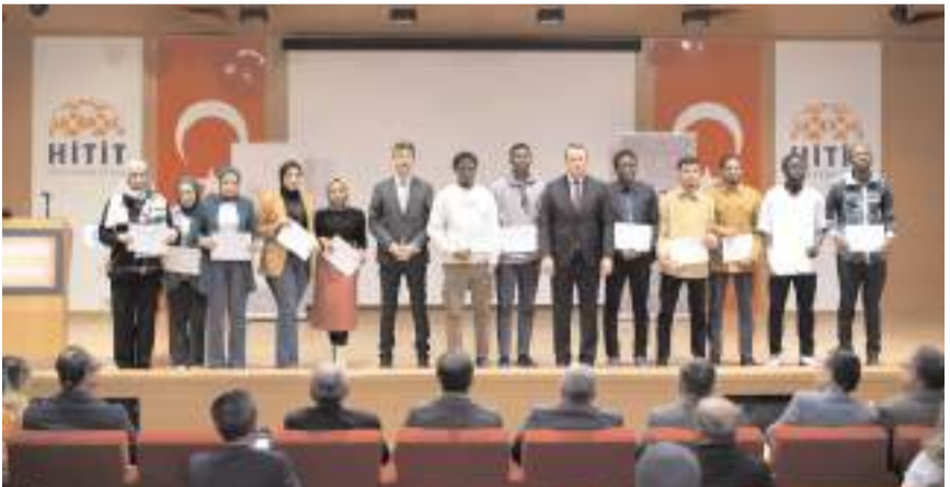
Eğitimde öğrencilere temel dış ticaret eğitimi verildi.