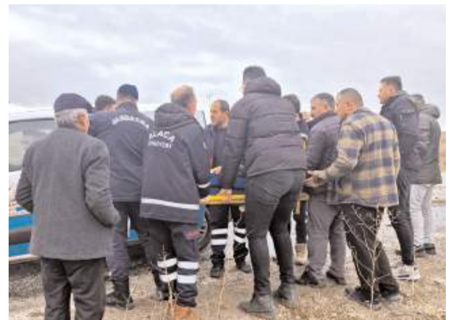
Yaralılara ilk müdahale olay yerinde yapıldı.