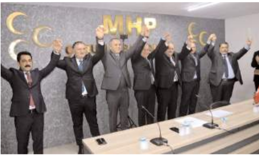
Tanıtım toplantısı MHP İl binasında gerçekleştirildi.