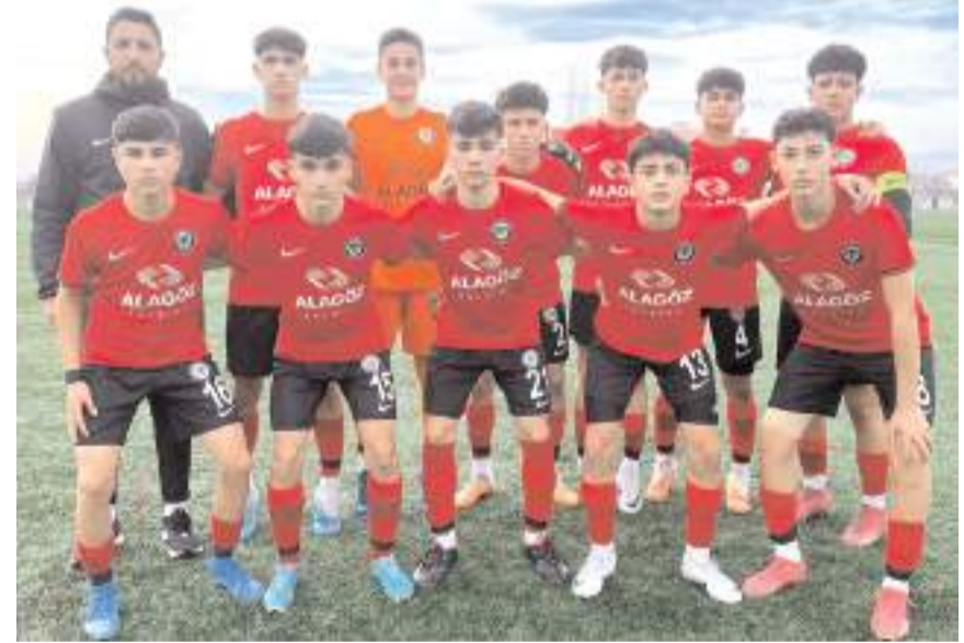
Çorum FK U 15 takımı yarın sahasında Boluspor önünde galibiyet arayacak

Bu kategoride dört maça 4 puanla beşinci sırada bulunan Boluspor ile aynı maça 3 puana sahip ve altıncı sırada bulunan Ahlatçı Çorum FK takımları karşılaşacaklar. Maçı Serpat Doğan yönetecek yardımcı-klarını ise Bahar Çakıcı ve Atahan Demir yapacaklar.