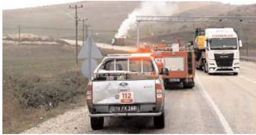
Tır, yapılan kontrolün ardından yeniden yola çıktı.

Sızıntıyı önleyemeyen sürücü, 112'den yardım istedi. İhbar üzerine bölgeye jandarma ve itfaiye ekipleri sevk edildi.