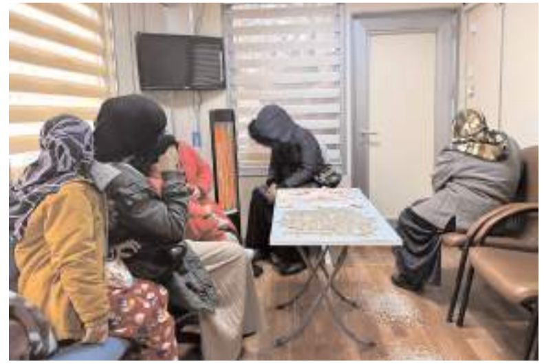
Zabıta Müdürlüğü ekipleri, ilencilere yönelik "Beyaz Mendil" operasyonu düzenledi.

Dilencilik yaparak elde edildiği belirlenen paraya el konularken, 5 dilenciye idari para cezası uygulandı.(AA)