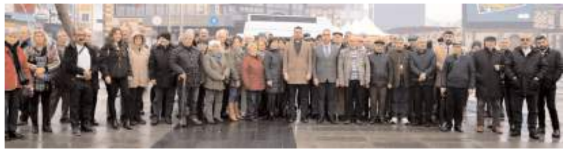
CHP'liler Bakan Tekin'in bütçe görüşmeleri sırasında yaptığı açıklamaya tepki göstererek, istifaya çağırıldılar.

Güneşin ritmik hareketine dayalı, Güneş Kabuğu Yöntemi sayesinde, binalarımız ve konutlarımızda maksimum güneşlenme, enerjinin korunumu, doğal ışığa erişim ve iyi bir yaşam kalitesi sağlanmış olacaktır. Atalarımız ne demiş "Güneş girmeyen eve, doktor girer." Adaylık ve akabinde Çorum Belediye Başkanlığı nasip olursa, bu bakış açısı ile mevcut planlarda revize yapılacak ve yeni imar planlarında da bu bakış açısı hakim olacaktır."