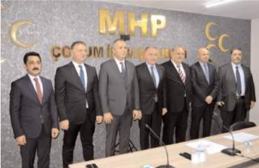
Çorum Belediye Başkanlığı için 4 isim başvurdu.