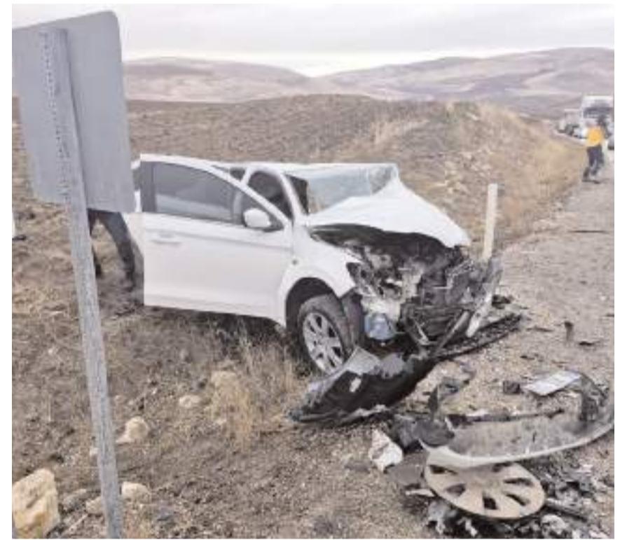
Kaza, Alaca-Zile kara yolunda meydana geldi.

Kazayla ilgili inceleme başlatıldı. (İHA)