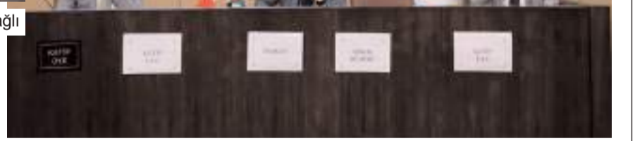
Birik toplantısı Belediye Meclis Toplantı Salonu'nda yapıldı.

Toplantıda ayrıca 2024 yılı yatırım programı ve bütçesi onaylandı.