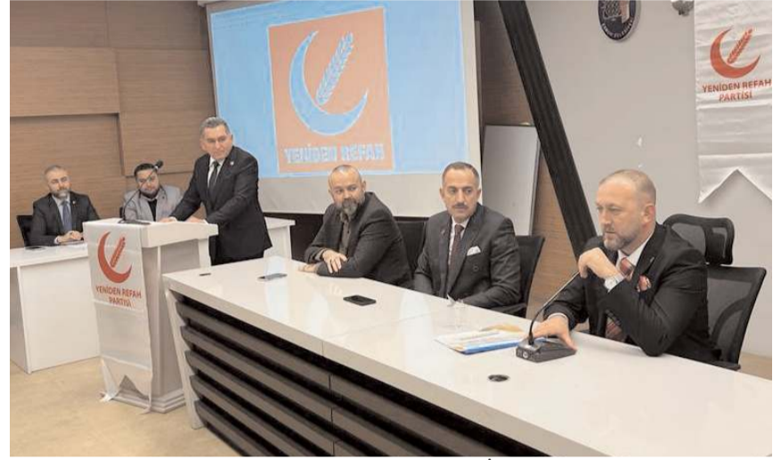
Temayül yoklaması Laçın, İskilip, Sungurlu belediye başkan aday adayları için yapıldı.

Yeniden Refah Partisi İl Başkanlığı ilçelerde belediye başkan adaylarını belirlemeye yönelik çalışmalarına devam ediyor.