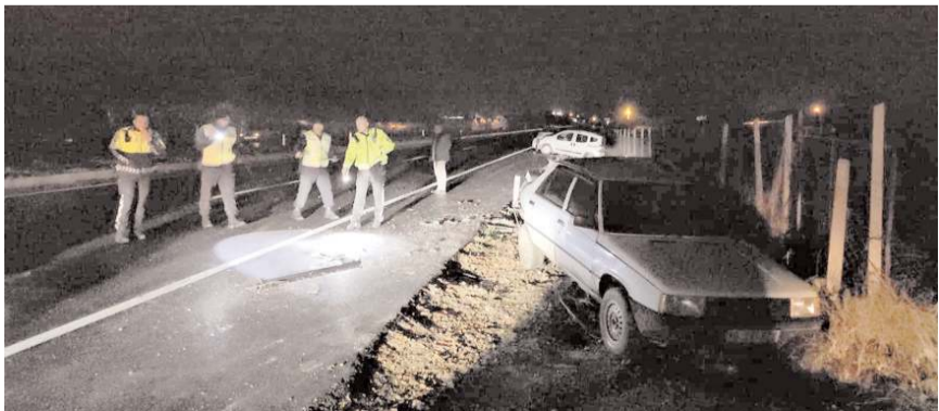
Kaza Çorum-İskilip kara yolunun 5'inci kilometresinde meydana geldi.

Kazada yaralanan hafif ticari aracın sürücüsü, sağlık ekiplerince yapılan müdahalenin ardından Hitit Üniversitesi Erol Olçok Eğitim ve Araştırma Hastanesine kaldırıldı.(AA)