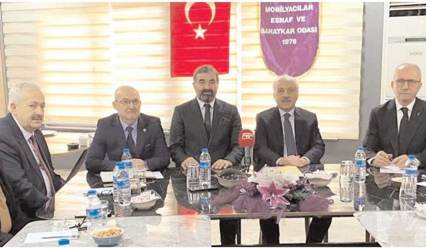
Toplantıya, Ankara, Bursa, Sakarya, Mardin, Düzce, Sivas, Amasya başta olmak üzere 25 oda başkanı katıldı.