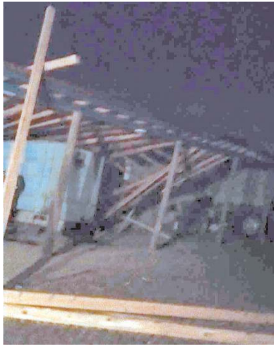
Çatıdan uçan parçaların üzerine düştüğü otomobilde hasar oluştu.

KOM Şube Müdürlüğü yaklaşan yılbaşı öncesi bu tür çalışmaların artarak devam edeceğini açıkladı.