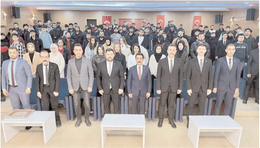
Konferansa ilgi yüksek oldu.