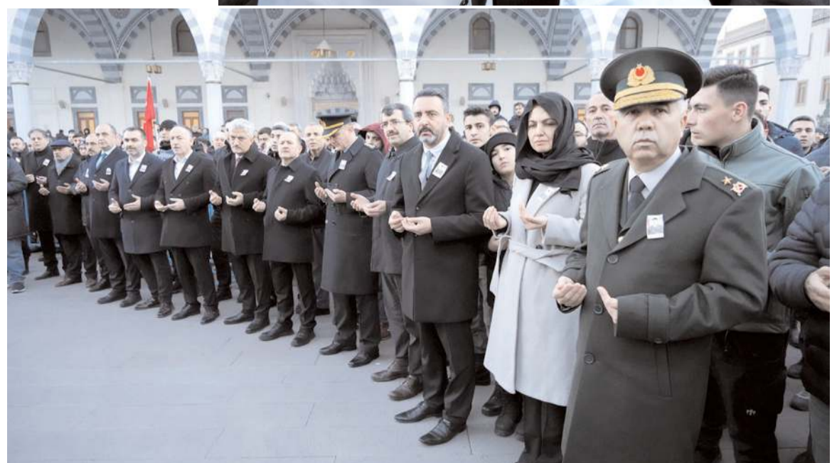
Şehidin cenazesi dualarla son yolculuğuna uğurlandı.