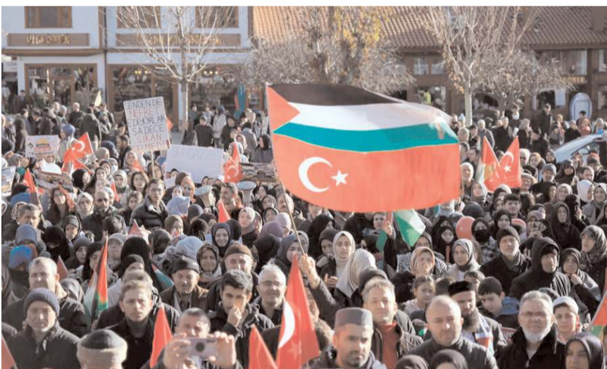
Yürüyüşte Türk ve Filistin bayrakları açıldı.