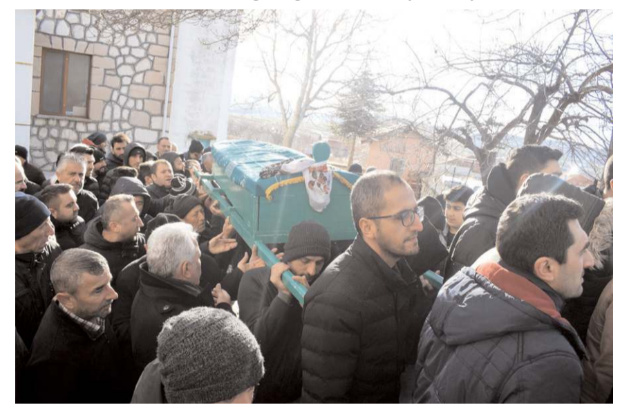
Kılınan cenaze namazının ardından merhumenin cenazesi köy mezarlığında toprağa verildi.