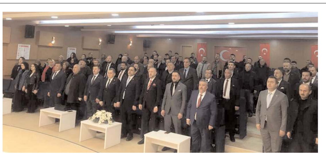
Temayül yoklaması Turgut Özal Konferans Salonunda yapıldı.