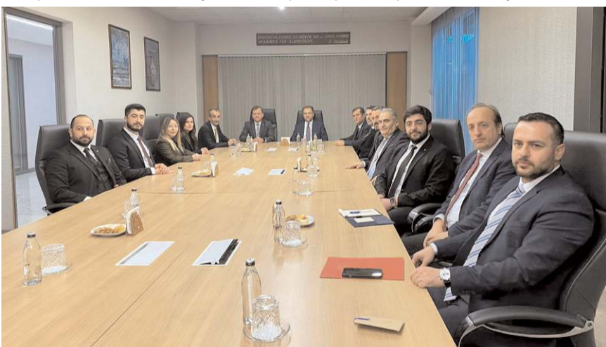
Ziyarete meslek lisesi mezunu gençlerin istihdamları konuşuldu.