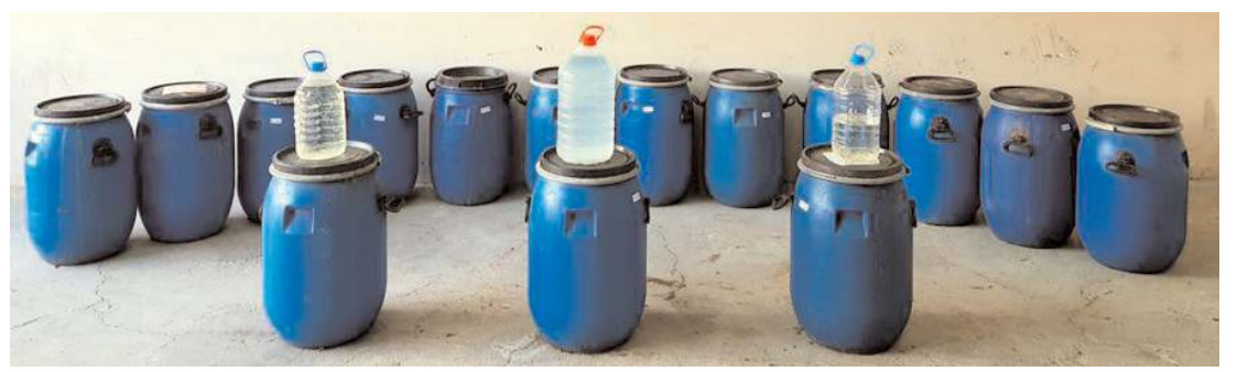
Düzenlenen operasyonda 876 kg el yapımı alkollü içki ele geçirildi.