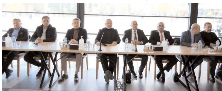
Toplantıya Belediye Başkanı Halil İbrahim Aşgın da katıldı.