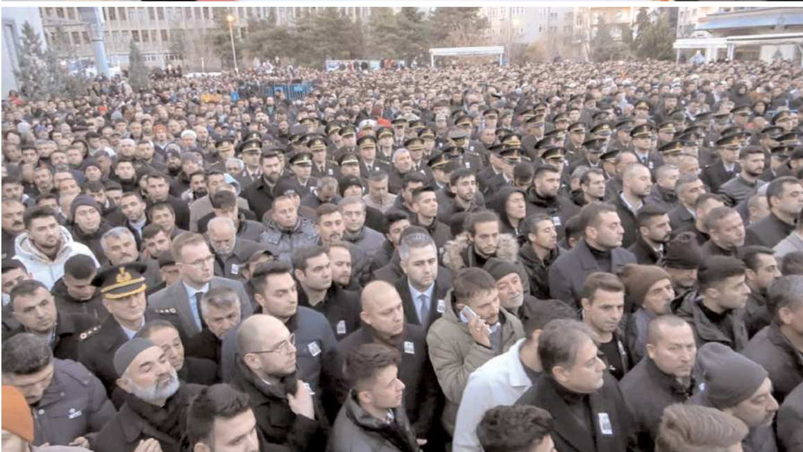
Kırıkkale Merkez Nur Camii'nde yapılan cenaze törenine binlerce vatandaş katıldı.