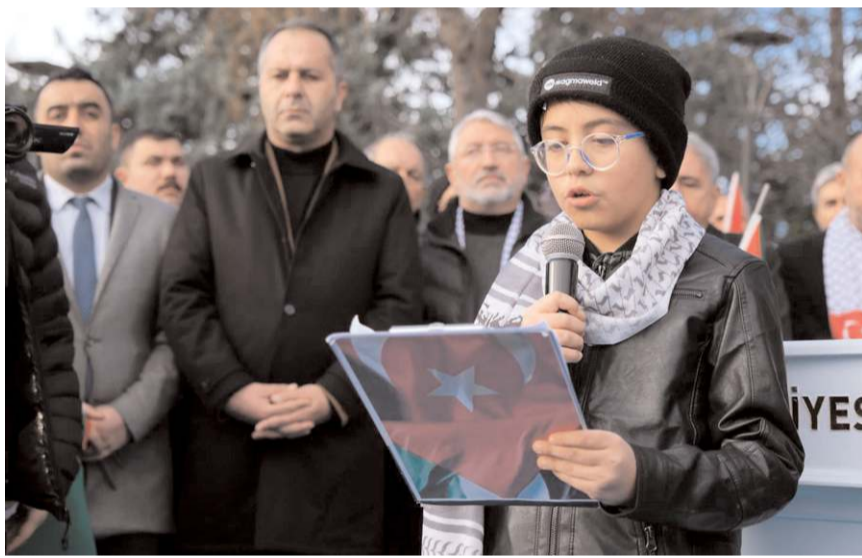
Çocuklar Filistin, Kudüs ve Gazze ile ilgili şiirler okudu.