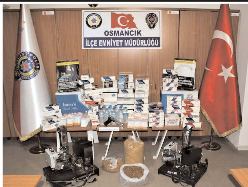
Operasyonda çok miktarda kaçak tütün ve makine ele geçirildi.

4 iş yeri, 1 ikamet ve 3 araçta yapılan aramada 2 elektrikli otomatik sigara sarma makinesi, ruhsatsız tabanca, 19 bin 300 dol-