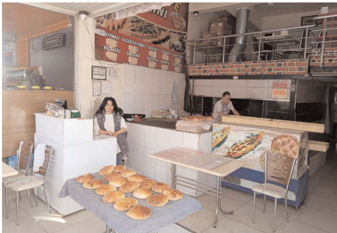
Hem kaliteli hem de ucuz pide salonu