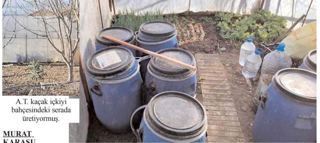
A.T. kaçak içkiyi bahçesindeki serada ürettiyor.