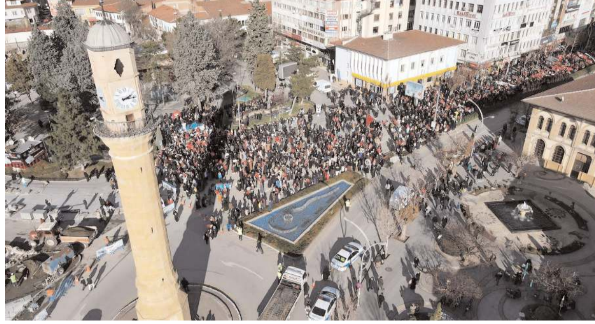
Valilik önünde başlayan yürüyüş Saat Kulesi Meydanında sona erdi.