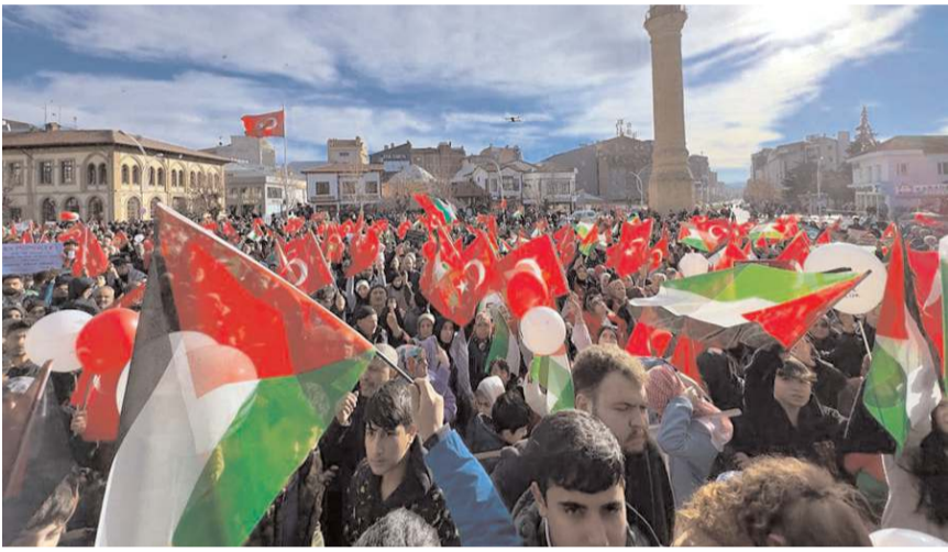
Yürüyüşe katılım yüksek oldu.