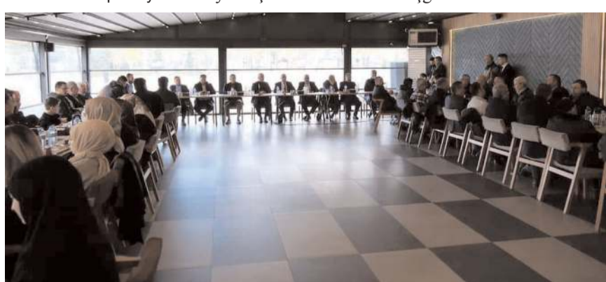
Toplantı Belediye Sosyal Tesislerinde yapıldı.