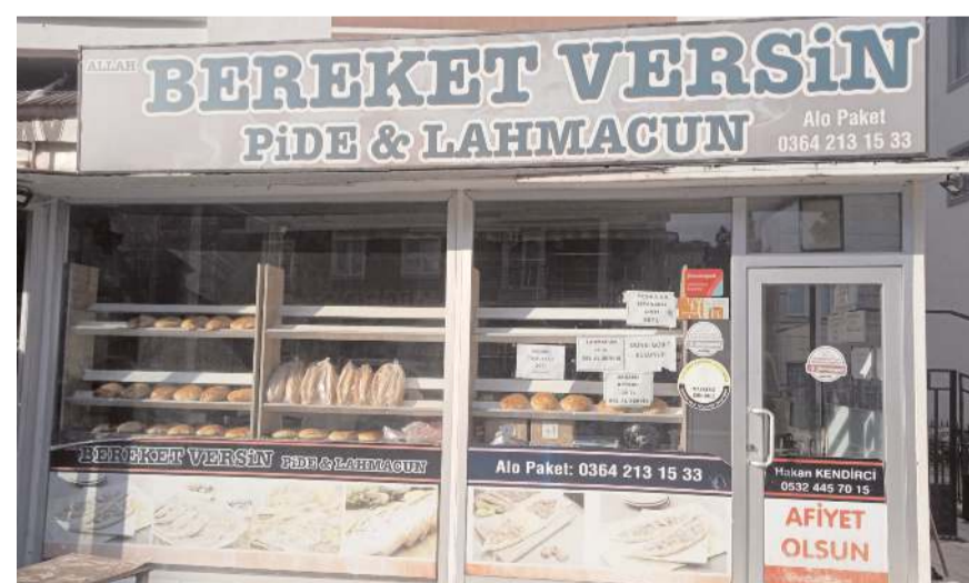
'Allah Bereket Versin Pide Lahmacun Salonu' Gülabibey Mahallesi Cemilbey Caddesi nde faaliyet gösteriyor.

Allah Bereket Versin Pide Lahmacun Salonu olarak paket servis hizmetlerinin de olduğunu belirten Kendirci; "Uygun fiyatlı lezzetli pidelemleri tatmak isteyen tüm hemşehrilerimizi bekliyoruz." dedi.