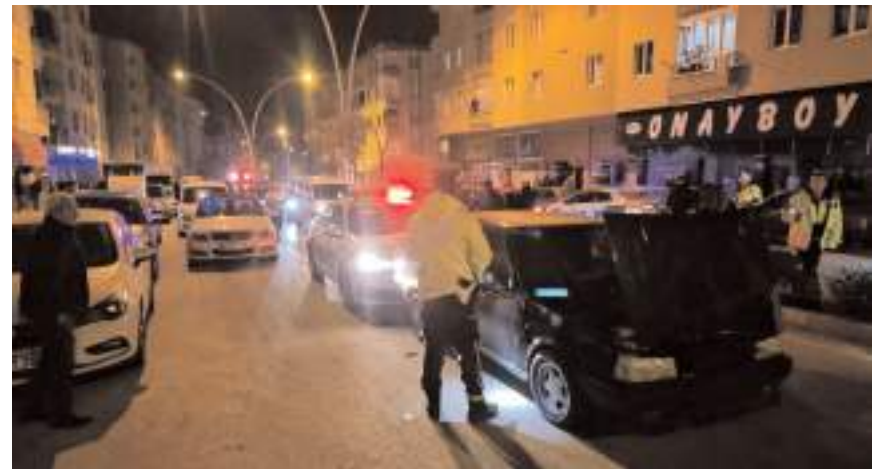
Gözaltına alınan sürücünün, 110 promil alkollü olduğu belirlendi.