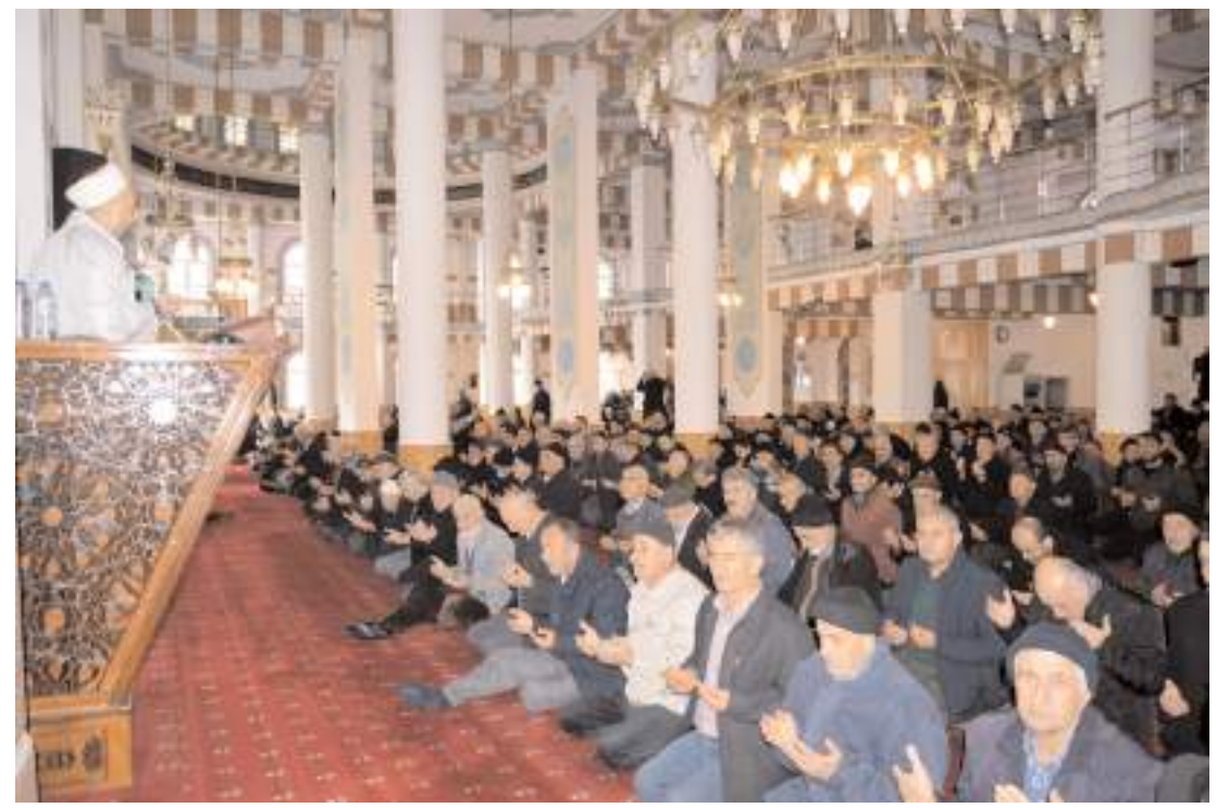
Mevlid-i Şerif programı Abdibey Camii'nde yapıldı.