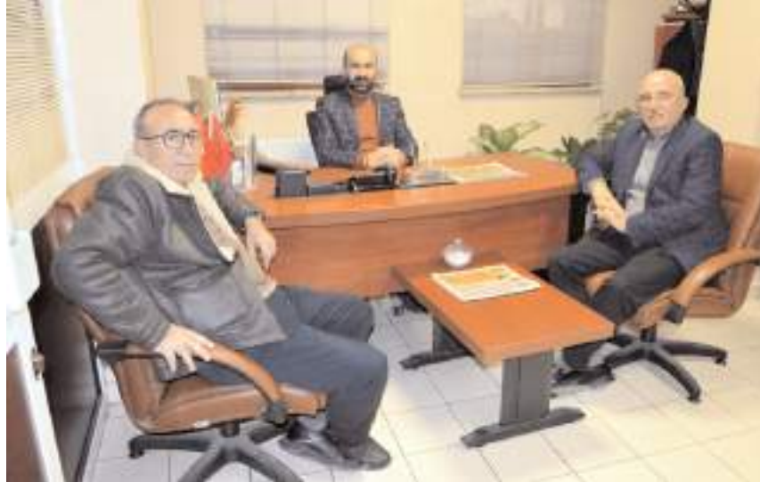
Ziyarete Çorum ve ülke gündemi üzerine sohbet edildi.