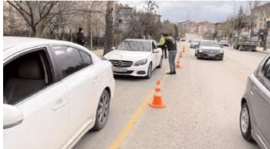
Denetimlerde 1.808 şahıs sorgulandı.