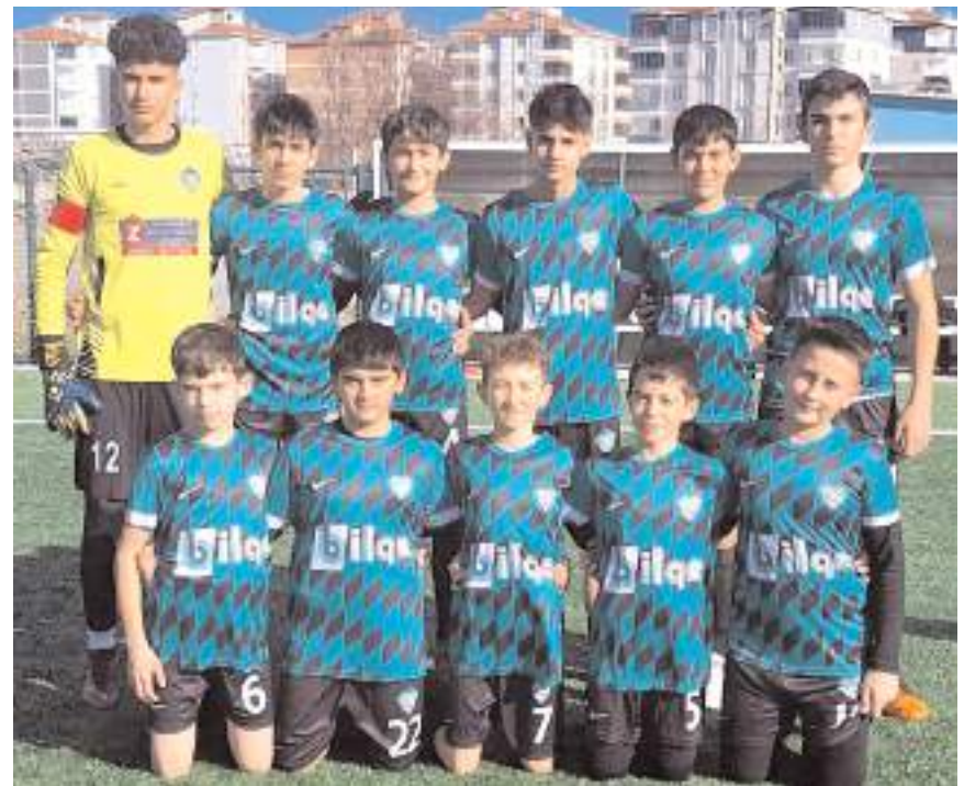
Kandiberspor ilk dört maçını kazanarak final grubu için avantaj yakaladı