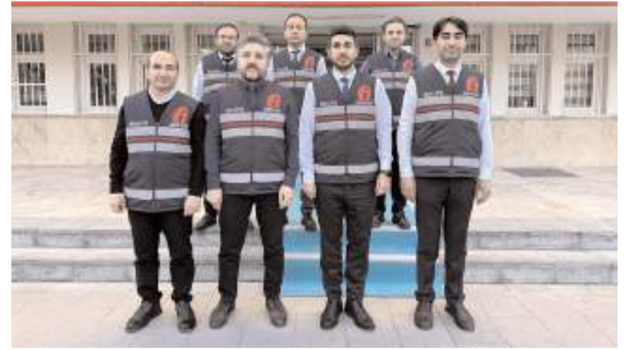
Vergi Denetim Ekibi yaygın ve yoğun denetimler yapıyor.

Çorum Defterdarlığı olarak mükelleflere yönelik vergi hizmetlerinin daha hızlı ve etkin bir şekilde yerine getirilmesi ve Çorum ekonomisine katkıda bulunulması amacıyla il merkezinde Gelir Müdürlüğü, Çorum Merkez Vergi Dairesi Müdürlüğü ve Hasanpaşa Vergi Dairesi, İlçelerde ise Sungurlu Vergi Dairesi Müdürlüğü ve Malmüdürlükleri olarak hizmetlerin yerine getirildiğinin belirtildiği açıklamada, "Çorum İli Merkez ve İlçelerinde Vergi Dairesi Müdürlüklerine ve Malmüdürlüklerine kayıtlı mükelleflere yönelik olarak Mükellefler ziyareti edilerek, vergi bilincinin geliştirilmesine yönelik bilgilendirme ve eğitim çalışmaları, mükelleflerin vergisel ödev ve yükümlülükleri ile ilgili gerekli tedbirleri almaları için hatırlatmalar, vergiye gönüllü uyumu sağlamak suretiyle tahsilatların yapılması için farkındalık artırılmaya yönelik çalışmalar, mükelleflerin vergi yasaları ile kendilerine tanınan haklardan yararlanmaları için bilgilendirme ve faali-