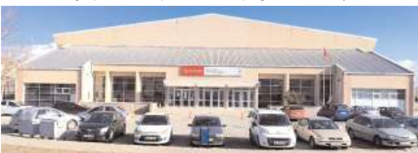
Akzent Toki Spor Salonu'nda bireysel branşlar için salon yapımı ihale edilecek