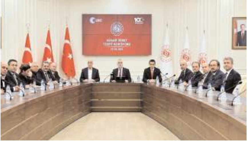
Yeni asgari ücreti Çalışma ve Sosyal Güvenlik Bakanı Vedat Işıkhan açıkladı.

"Bunun üstünde bir ücret verin. Ama maalesef işverenlerin yüzde 90'ı bu asgari ücretin üstünde bir ücret vermiyor. İnsanlara 'bu ücret ile geçinin' diyorlar. Herkes bir, iki dakika düşünsün, bu ücret ile geçinilebilir mi? Bu enflasyon bir an evvel dursun, bu asgari ücret pazarlığının da bu derece olmasına gerek yok. Ama enflasyon durmadığı müddetçe, yılda bir kere belirlenecek asgari ücretle milletin talebini yerine getiremeyiz. Sayın Bakanımın elinden gelen imkan bu, işveren temsilcisinin elinden gelen imkan bu. Sayın Bakanım, ben burada bir daha katılmadığımızı ifade etmek istiyorum, muhalefet şerhi koyacağız." A.A