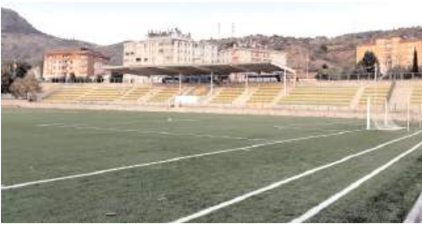
İskilip ilçe sahasının ışıklandırılması için gerekli ödenek ayrıldı