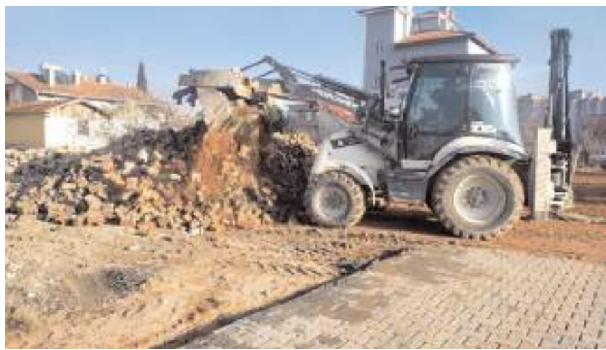
Yüklenici firma yollara döşediği kilit parke taşlarını kepçeyle söktü.

Edinilen bilgilere göre, Osmançık Belediyesi önceki ay kilitli beton parke taşı temini ve döşenmesi yapım işi için açık usul ihaleye gitti. Geçtiğimiz ay sonu verilen son tekliflerin ardından ihaleye alan firma sözleşmenin imzalandığı tarihten itibaren çalışmalara başladı. Yeşilçatma Mahallesi, İkizler Sokak, Demir Sokak, Çeltikçiler Sokak ve Tan Sokak'ta başlayan kilit parke taşı döşeme işi yüklenici firma tarafından yapılmaya baş-