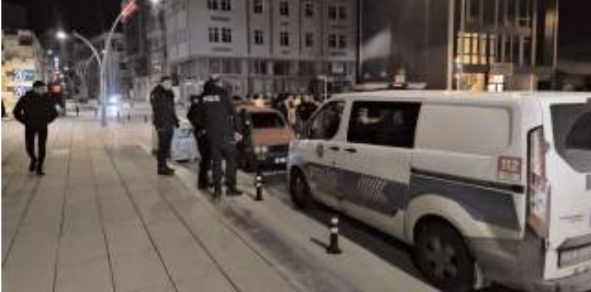
Şüpheli araç Yavruturna Mahallesi Kavukcu Sokak'ta durduruldu.

Gözaltına alınan 4 şüpheli polis merkezine götürüldü.(AA)