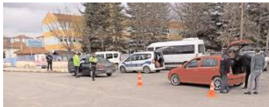
Denetimlerde 527 araç kontrol edildi.

İl Emniyet Müdürlüğü'nün asayiş ve güvenliğin sağlanmasına yönelik çalışmaları devam ediyor.