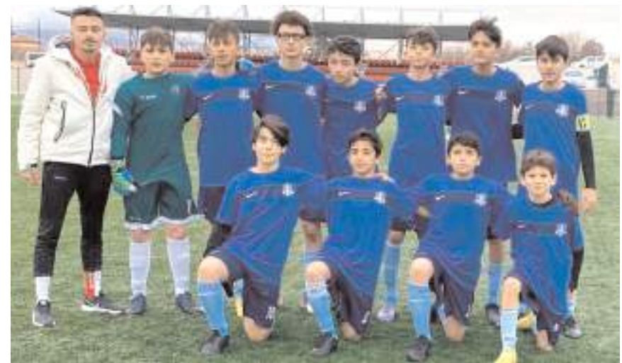
Vefa Gençlikspor dört maçta 10 puanla final grubu iddiasını sürdürüyor

Çorumspor - 1900 Gençlikspor. Çorum Anadolu FK- HE Kültürspor. Osmancık Kandiberspor- Vefa Devanespor. Osmancık Belediyespor- Kargıgücüspor. Gençlerbirliği- Hattuşa Gençlikspor. Mimar Sinan Gençlik- Vefa Gençlikspor. Maviyay Gençlikspor- İskilipspor. Mecitözü Gençlerbirliği- Sungurlu Belediye.