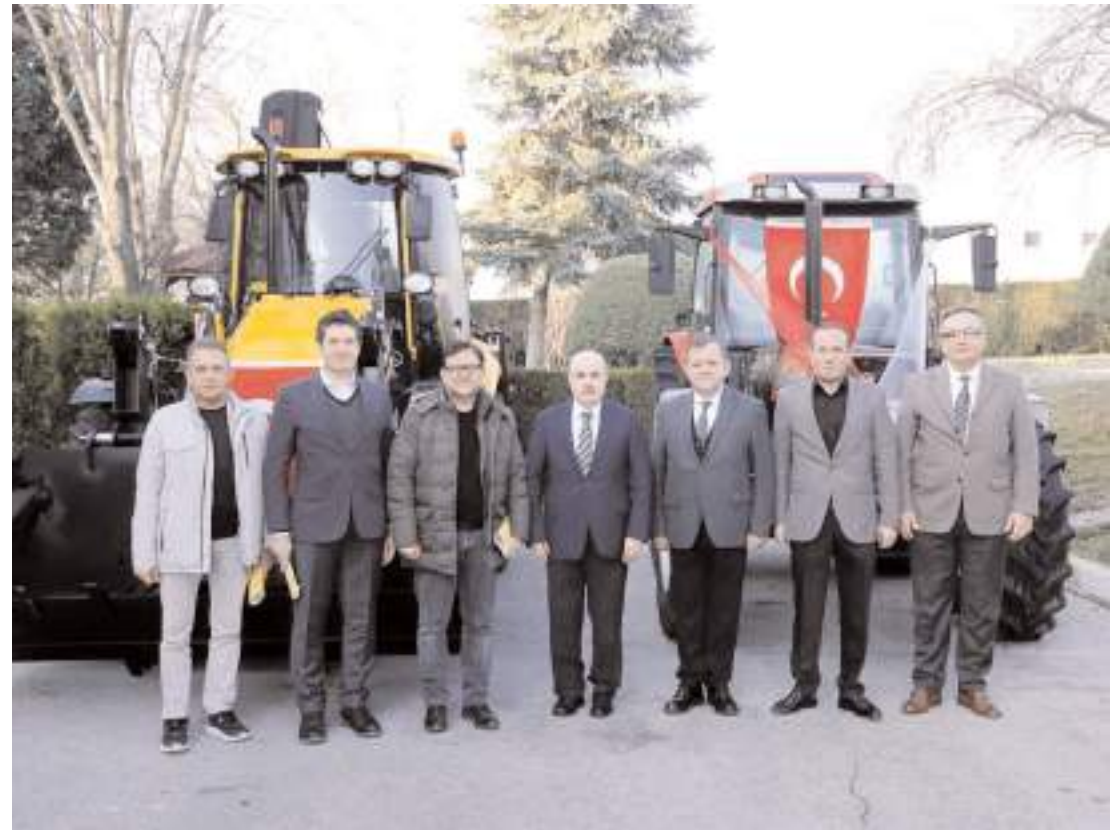
OSB'nin altyapı çalışmalarında kullanılmak üzere tedarik edilen araçlar hizmete alındı.