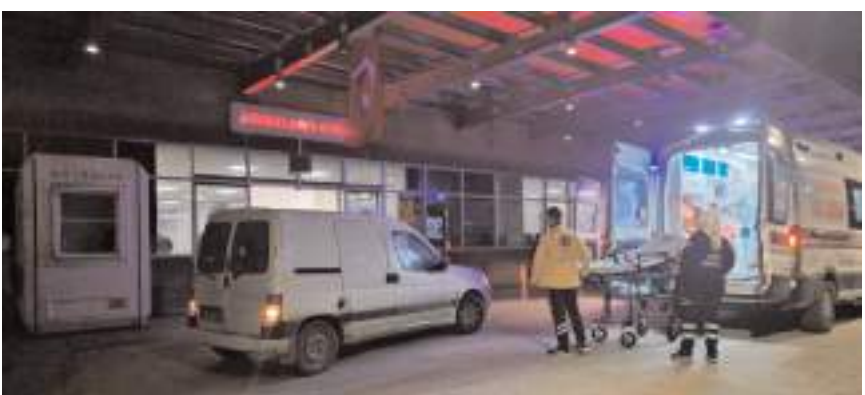
Yaralılar hastanede tedavi altına alındı.