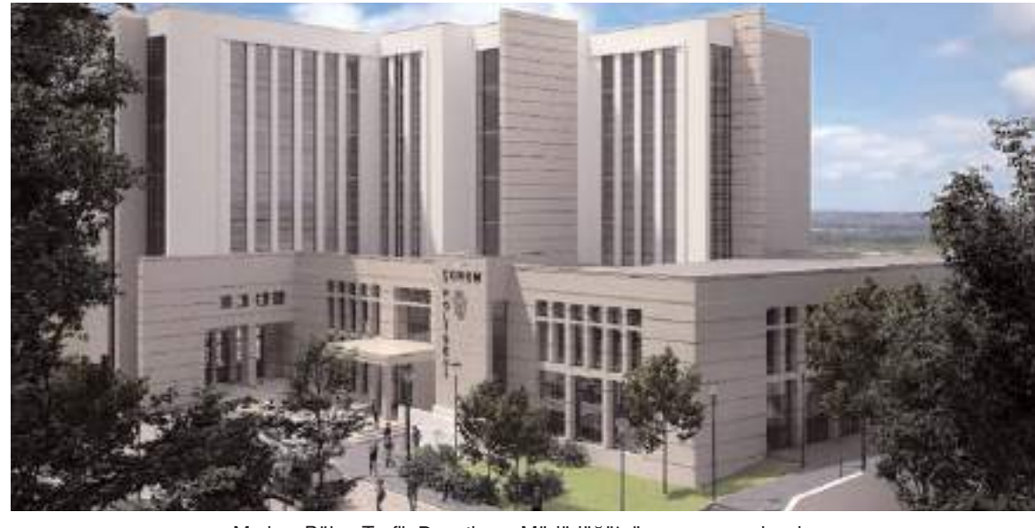
Merkez Bölge Trafik Denetleme Müdürlüğü'nün yanına yapılacak.

AK Parti Çorum Milletvekilleri Av. Oğuzhan Kaya ve Av. Yusuf Ahlatcı ile MHP Çorum Milletvekili Vahit Kayırcı yaptıkları ortak açıklamada Polis Moral Eğitim Merkezi ihalesinin 12 Ocak 2024 tarihinde gerçekleştirileceğini belirttiler. * HABERİ2'DE