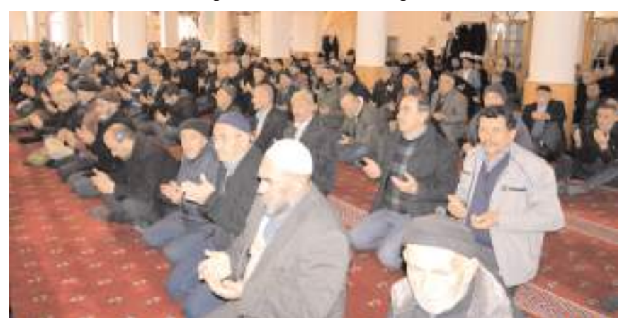
Programda tüm şehitler için dua edildi.