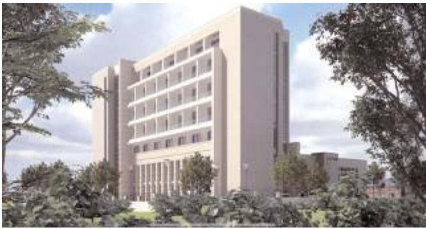
Merkez 55 bin metrekare alana inşa edilecek.