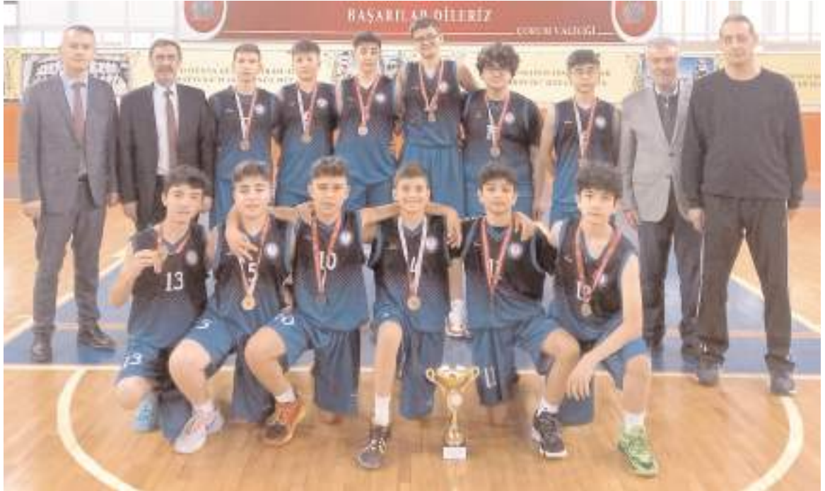
23 Nisan yıldız basketbol takımı kazandığı şampiyonluğun ardından antrenörleri ve okul idarecileri ile toplu halde

Atatürk Spor Salonu'nda oynanan final maçında ilk periyotu 9-6 önde tamamlayan 23 Nisan