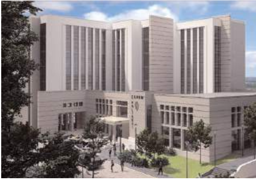
Merkez Bölge Trafik Denetleme Müdürlüğü'nün yanına yapılacak.

İhale sürecinin ardından da tesisin temeli atılacak ve belirlenen takvim doğrultusunda yapımına başlanacak" dediler. (Haber Merkezi)