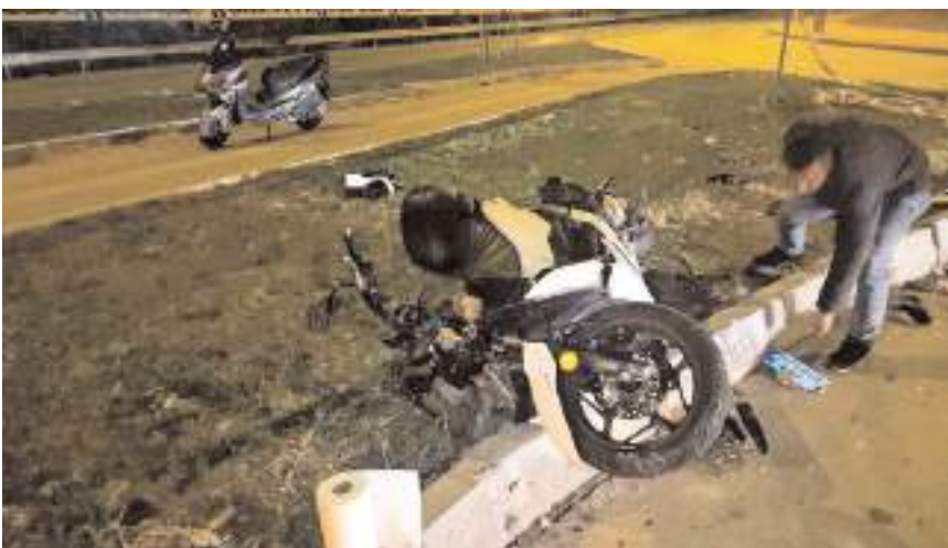
Kaza Antalya'da meydana geldi.