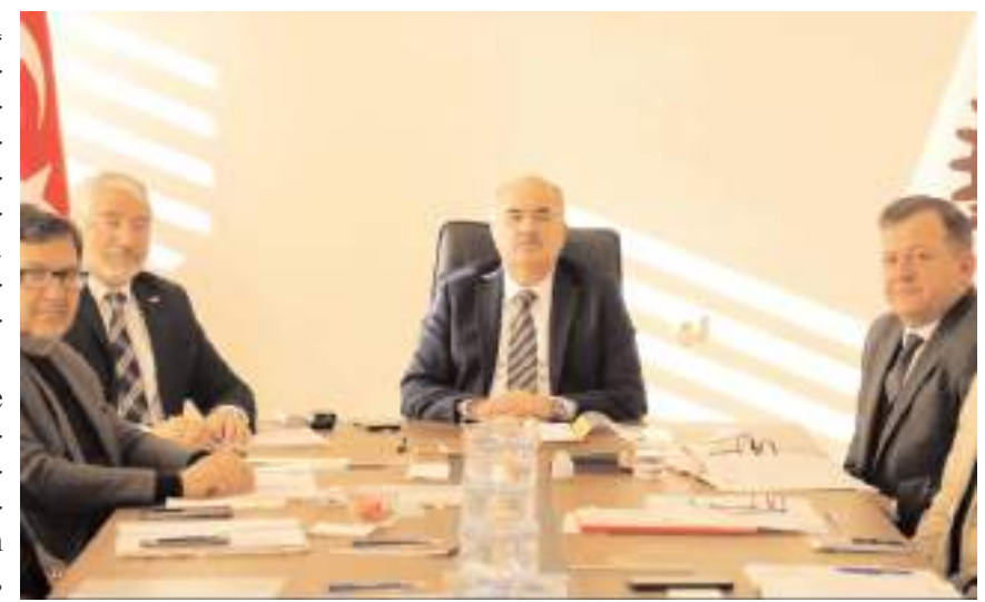
Toplantıda gündem maddeleri görüldü.

Toplantı sonrasında, OSB altyapı çalışmalarında kullanılmak üzere tedarik edilen araçlar hizmete alındı.