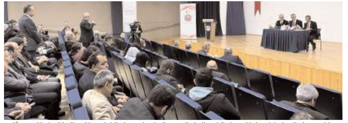
"İmam Hatip Okulları Yönetici Buluşmaları" Çorum Belediyesi Buhara Kültür Merkezi'nde yapıldı.