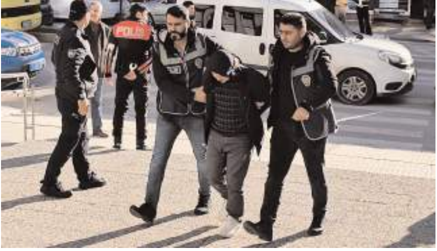
Mahkemeye çıkarılan E.H.M. serbest bırakıldı.

Emniyetteki işlemlerinin tamamlanmasının ardından adliyeye sevk edilen zanlılardan Muhammed K. tutuklandı, E.H.M. ise serbest bırakıldı.(AA)