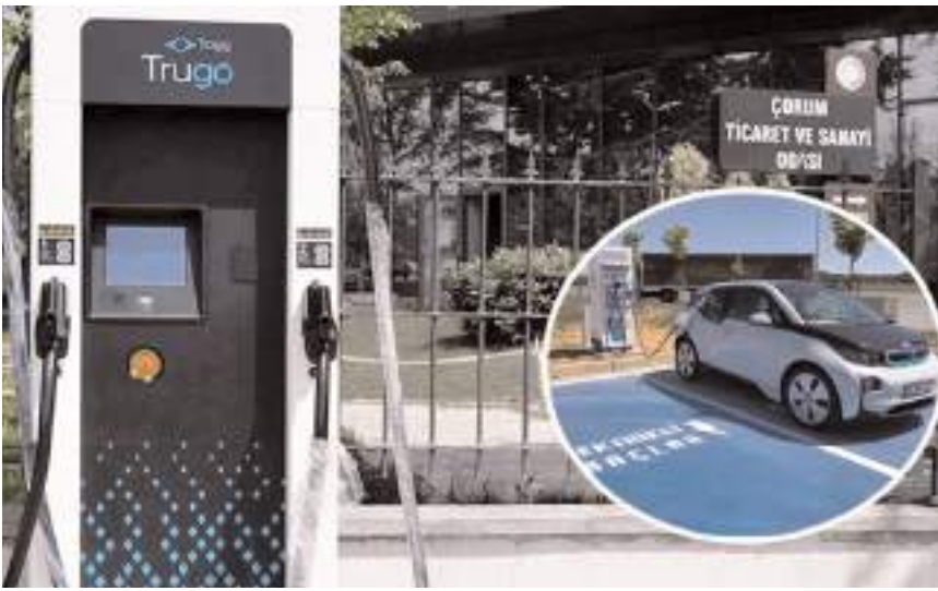
EPDK verilerine göre Çorum'da 28 tane elektrikli şarj istasyonu bulunuyor.

Yeşil şarj istasyonları yaygınlaşacak Türkiye'de elektrikli araçların ve şarj istasyonla-