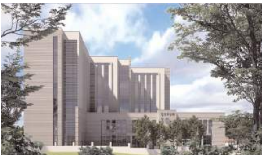
Tesis 10 bin metrekare kapalı alana sahip olacak.