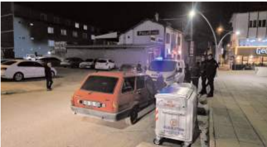
Polis ekipleri araçta arama yaptı.