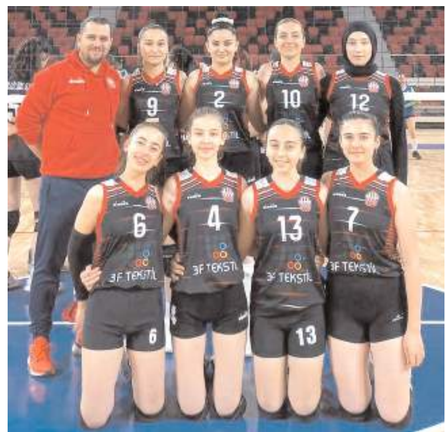
Genç kızlar voleybolda üst üste altıncı şampiyonluğu kazanan Osmancık Belediyespor