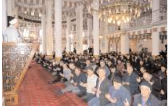
Mevlid-i Şerif programı Abdübek Camii'nde yapıldı.