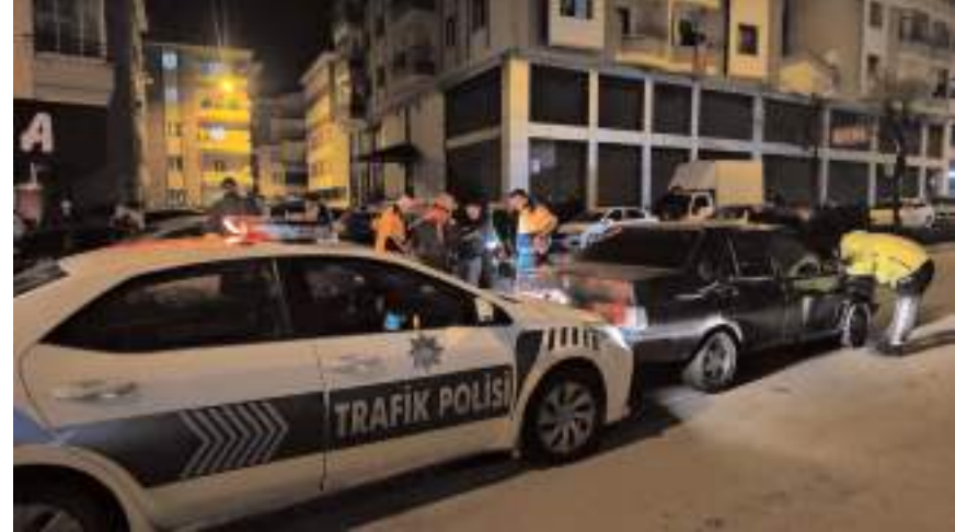
Kaçan araç Ulukavak Mahallesi Çiftlik Caddesi'de durduruldu.

Sürücüye toplam 54 bin 923 lira para cezası uygulanırken, otomobil trafikten men edildi.(AA)