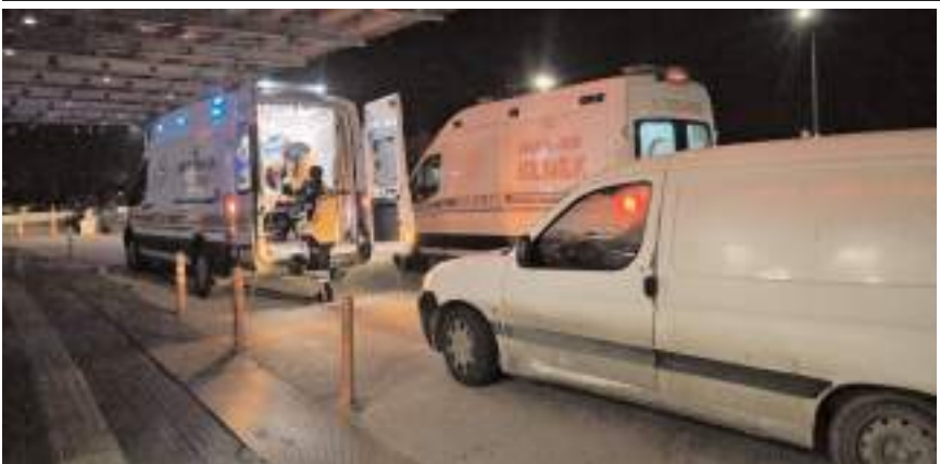
Olay Mahmut Lokum Sokak'ta medyana geldi.

Sağlık ekiplerince İskilipli Atıf Hoca Devlet Hastanesi'ne kaldırılan yaralıları burada yapılan müdahalenin ardından Hitit Üniversitesi Erol Olçok Eğitim ve Araştırma Hastanesi'ne sevk edildi.(AA)