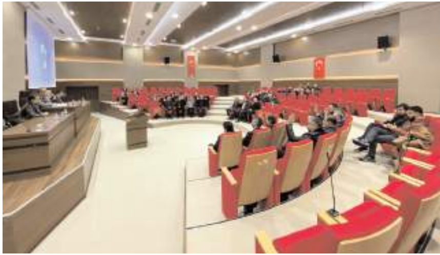
Toplantıda gündem maddeleri görüşülerek karara bağlandı.