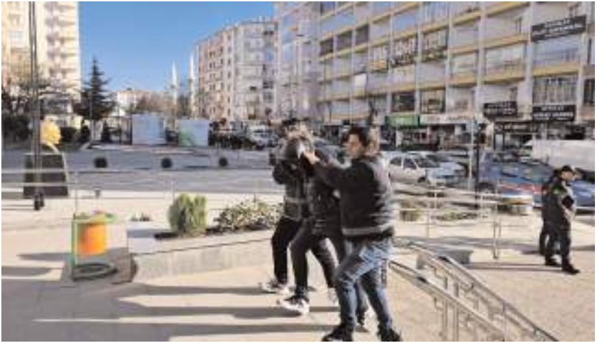
Zanlılardan Muhammed K. tutuklandı.