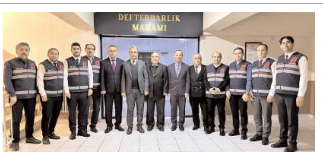
İl Defterdarlığı Vergi Denetim Ekibi oluşturdu.

Osmançık Belediyesi tarafından konuya ilişkin resmi bir açıklama yapılmazken, ilerleyen günlerde ihalenin tekrarlanarak belirlenen cadde ve sokaklara yeniden kilitli beton parke taşı döşenmesi bekleniyor. (İHA)