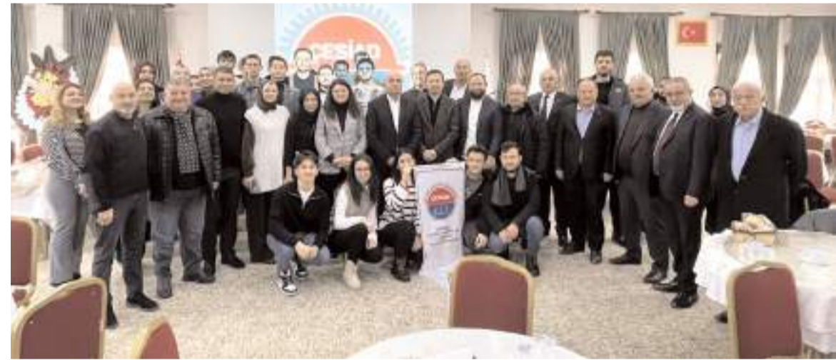
Program geleneksel hatıra fotoğrafının çekilmesinin ardından sona erdi.