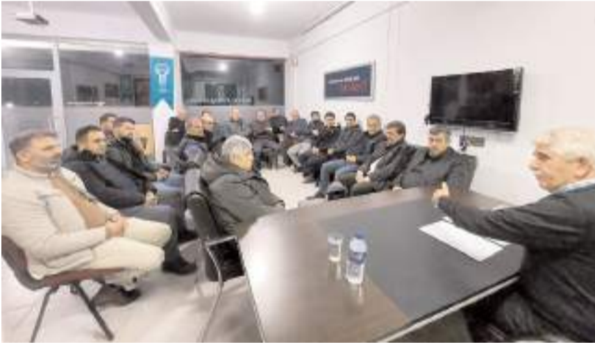
Söyleşi Türkiye Dil ve Edebiyat Derneği Osmaniçk Şubesi'nde yapıldı.