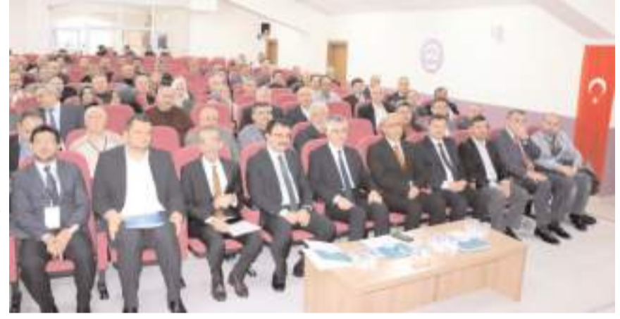
Panel Prof. Dr. Hayrettin Karaman Anadolu İmam Hatip Lisesinde yapıldı.