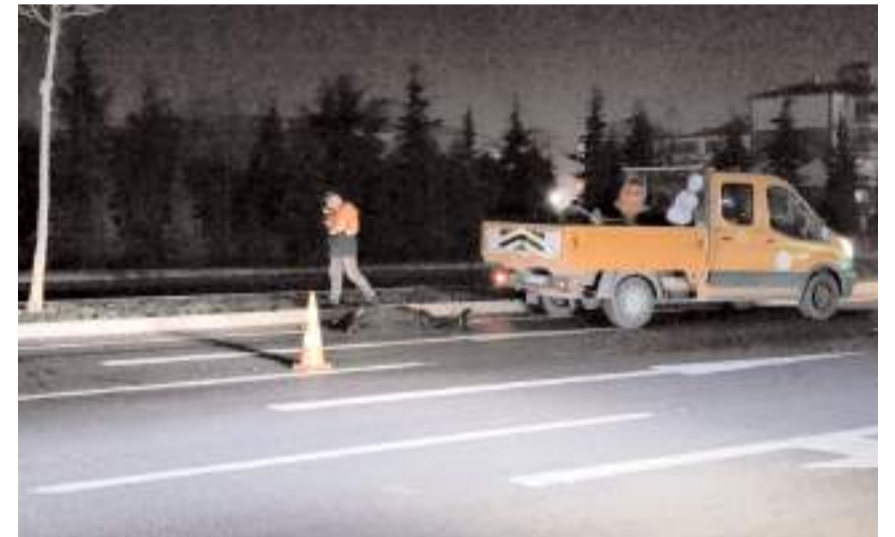
Telef olan eşeği Karayolları ekipleri olay yerinden kaldırdı.

Çarpma nedeniyle hasar oluşan otobüs polis ekipleri nezaretinde terminale çekilirken, yolcular firmaya ait başka bir otobüsle yola devam etti.(AA)