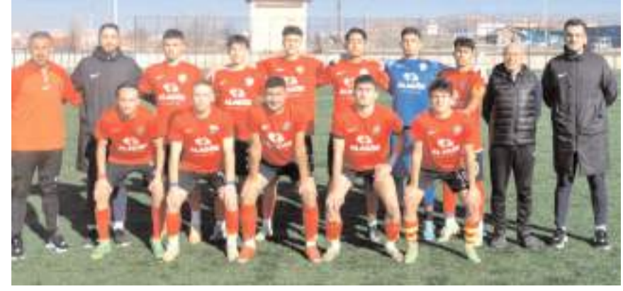
Ahlatcı Çorum FK U 19 takımı son haftalardaki çıkışı ile play-off potasına girdi

Lige yıl başı nedeni ile verilen ara nedeni ile bu hafta sonu maç oynanmayacak. Ahlatcı Çorum FK 6 Ocak cumartesi günü grup lideri Uşakspor ile zorlu bir maça çıkacak.