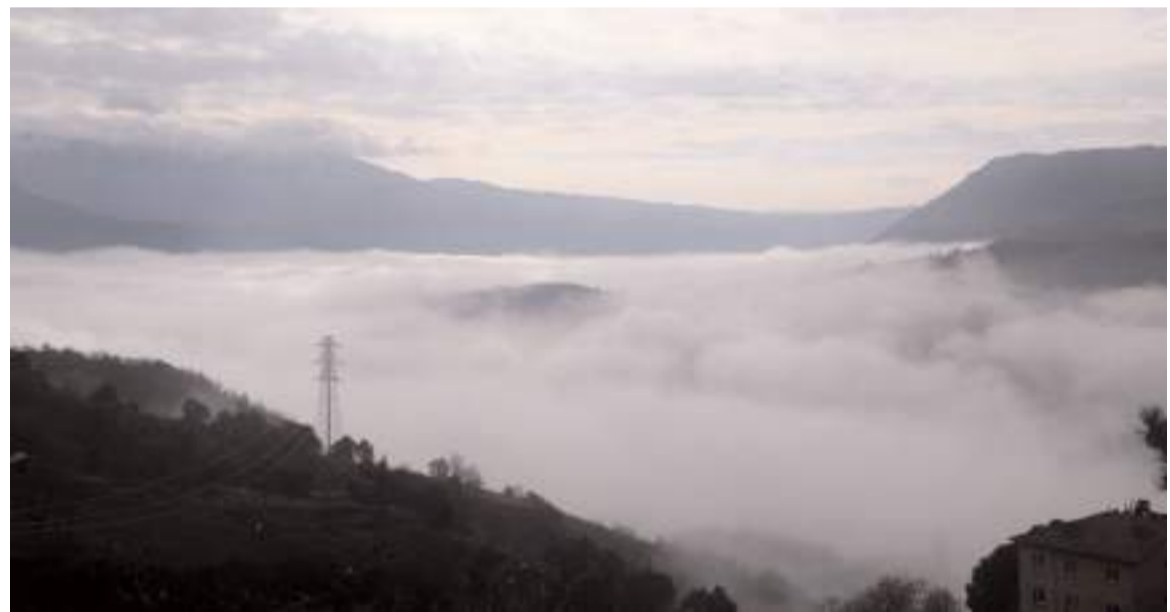
Siste kartpostallık görüntüler ortaya çıktı.