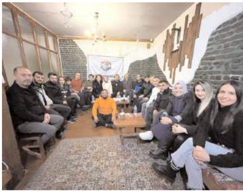
Çorum Dağcılar Birliği Spor Kulübü (ÇODAB) kuruluş sürecini tamamladı.

Gülhâne Askerî Tıp Akademisi'nin açılışı (1903) Yavuz Sultan Selim Hân'ın Kudüs'ü fethi (1517)