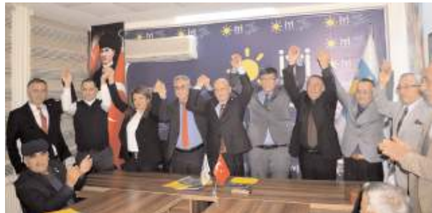
İYİ Parti'nin Dodurga, İskilip, Alaca, Bayat ve Kargı'nın belediye başkan adayları açıklandı.