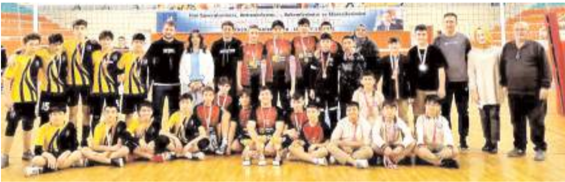
Yıldız erkeklerde ilk üç sırayı alan okul takımları kupa töreni sonrasında toplu halde görülüyor