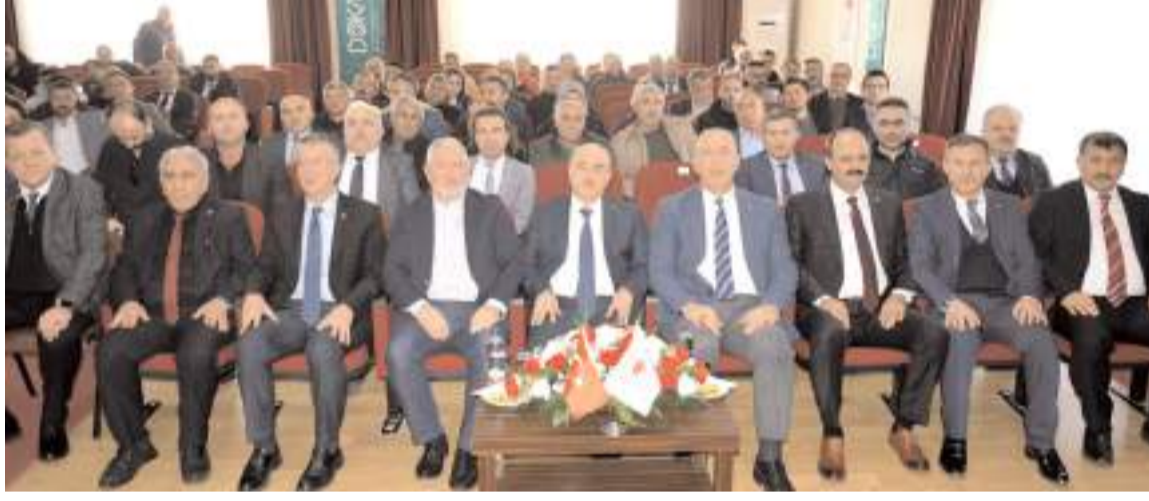
'Seracılığın Geliştirme Projesi' ve 'Çiğ Sütün Uygun Koşullarda Üretimi Projesi' için tanıtım ve teslim töreni düzenlendi.

■ Çorum Tarım ve Orman İl Müdürlüğü, Çorum Damızlık Sığır Yetiştiricileri Birliği ile DOKAP işbirliğiyle hazırlanan 'Seracılığın Geliştirme Projesi' ve 'Çiğ Sütün Uygun Koşullarda Üretimi Projesi' için tanıtım ve teslim töreni düzenlendi. * HABERİ'10'DA