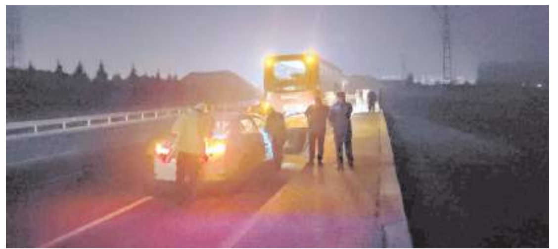
Olay Çevreyolu Bulvarı'nda meydana geldi.

Zeyrekli, "Osmancık Belediyesinden aldığımız 30 bin metrekare kilitli parke ihalemi vardı. Bu işi en hızlı şekilde bitirdik, Osmancık Belediyesi paramızı ödedi. Osmancık Belediyesiyle aramızda herhangi bir alacak verecek mevzumuz yoktur. Bizim personelimizin metrajlama hatasından kaynaklı bir kısım vardı, o da bu mahalleye denk geldi. Taşlarımızı geri aldık, burayı da temiz bir şekilde Osmancık Belediyesine teslim ettik." dedi.(AA)