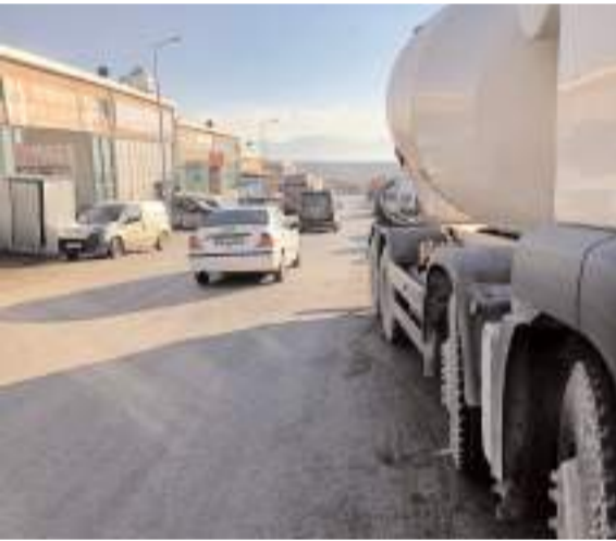
Esnaflar trafiğin yoğun olduğu bölgeye hız kesici kasis istiyorlar.