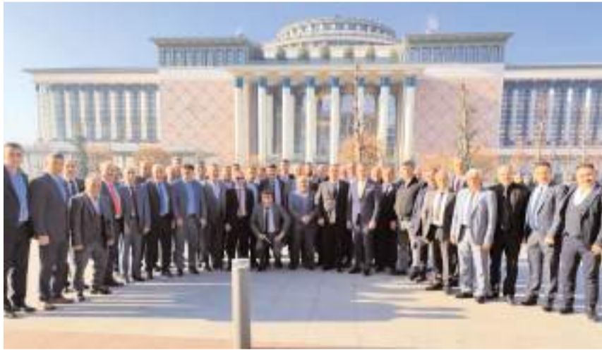
53. Muhtarlar Toplantısı Cumhurbaşkanlığı Külliyesi Sergi Salonu'nda gerçekleştirildi.

■ Cumhurbaşkanı Recep Tayyip Erdoğan'ın ev sahipliğinde 53. Muhtarlar Toplantısı gerçekleştirildi. Toplantıya Çorumlu muhtarlar da katıldı.