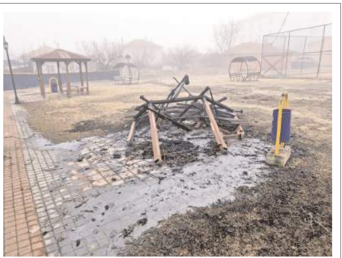
Kamelya tamamen kullanılmaz hale geldi.

Ö.Ö'nün ölümüyle ilgili soruşturma sürüyor.