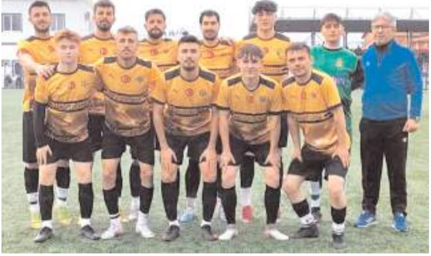
Kargiserispor evinde kazanarak kötü gidişe son vermek istiyor

Ligde şampiyonluk yarışından kopmak istemeyen Ulukavakspor ise ilk yarıda beş maçında henüz puanla tanışmayan Alaca Belediyespor deplasmanında galibiyet arayacak. Haftanın diğer maçında ise ligde alt sıralardan uzaklaşmak isteyen iki takım Kargiserispor ile HE Kültürspor takımları Kargı sahasında karşılaşacaklar.