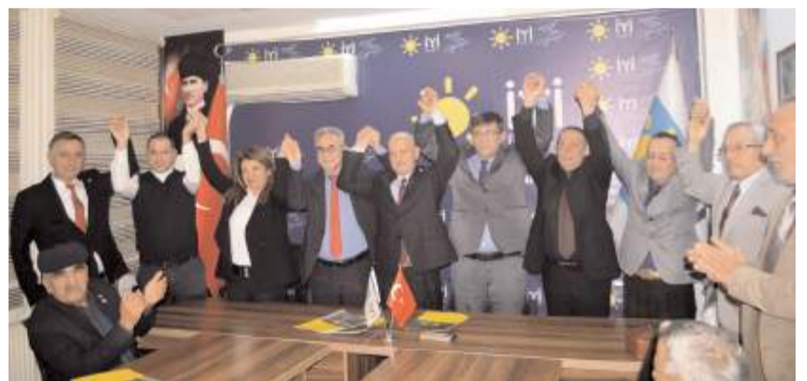
İYİ Parti'nin Dodurga, İskilip, Alaca, Bayat ve Kargı'nın belediye başkan adayları açıklandı.