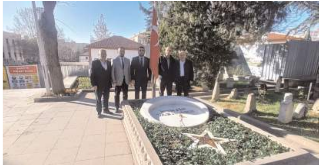
BBP Çorum İl yönetimi, merhum Muhsin Yazıcıoğlu'nun kabrini ziyaret ederek dua etti.