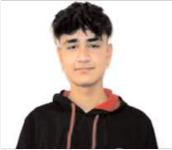
Ö.Ö, bilinmeyen bir nedenle hayatına son verdi.