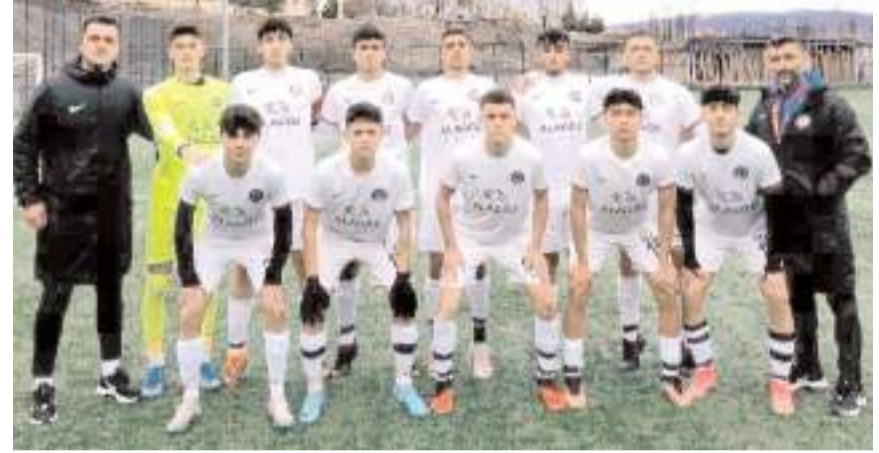
Ahlatcı Çorum FK U 17 takımı ilk iki devreyi namağlup olarak lider tamamladı