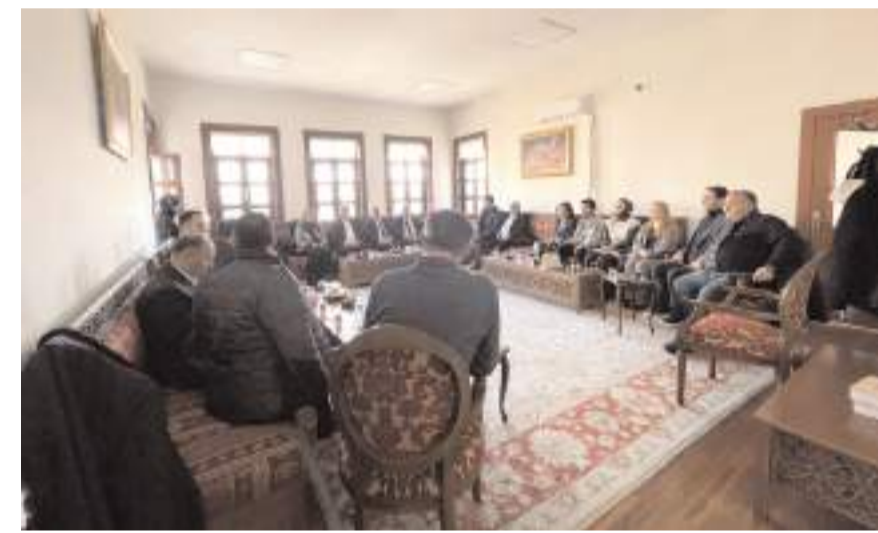
Kahvaltının ardından sohbet edildi.