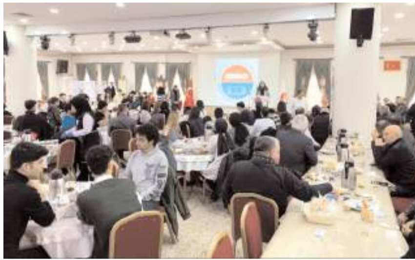
Program Sincan Belediyesi Kültür ve Sanat Evinde yapıldı.