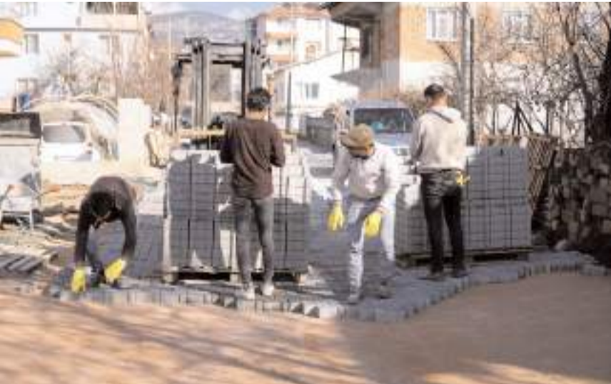
Sökülen kilit parke taşlarının yerine belediye ekipleri yenilerini döşedi.

"İlçemizin farklı mahallelerine ihtiyaç duyulan sokakların yapılması için 30 bin metrekare parke taşı ihale edilmiştir. Yüklenici firma belirli metrajlarda hak ediş hazırlayarak faturasını kesmiş ve ödemesini almıştır. Yeşilçatma Mahallemizin bir bölümünde yapılan çalışma onaydan geçmemiş ve kabul yapılmayarak hak ediş dışı tutulmuştur. İlgili firma burada yaptığı çalışmayı iptal ederek onaydan geçmeyen bölümdeki kilitli parke taşlarını geri sökmüştür. Bu alanda hızlıca telafi çalışması yapılmış ve mahalle sakinlerimiz mağdur edilmeden yerine yeniden parke taşı döşenmiştir. Söz konusu çalışma kapsamında belediyemizden herhangi bir zarar ya da maddi kaybı olmadığı gibi yüklenici firmanın da belediyemizden teslim ettiği işlerle