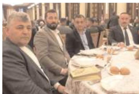
Toplantıya Çorumlu muhtarlarda katıldı.