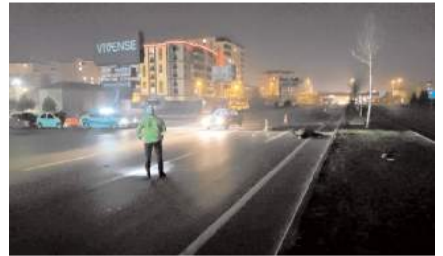
Kaza nedeniyle trafik kontrollü olarak verildi.