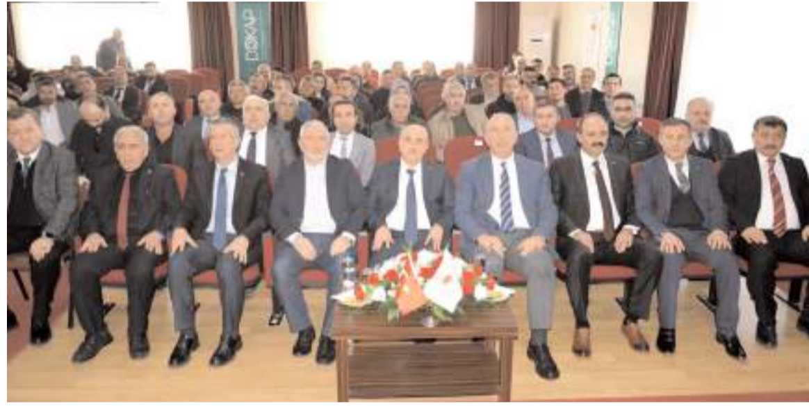
'Seracılığın Geliştirme Projesi' ve 'Çiğ Sütün Uygun Koşullarda Üretimi Projesi' için tanıtım ve teslim töreni düzenlendi.

Konuşmaların ardından sera kurulumu yaptıran üreticilere belgeleri verildi.