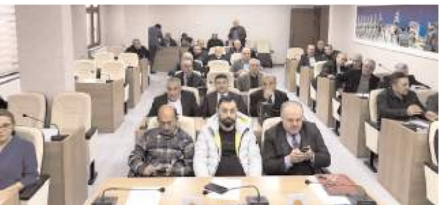
Toplantıda İskilip'e kurulacak olan OSB'ye İl Özel İdaresi'nin ortak olması konusu görüşüldü.