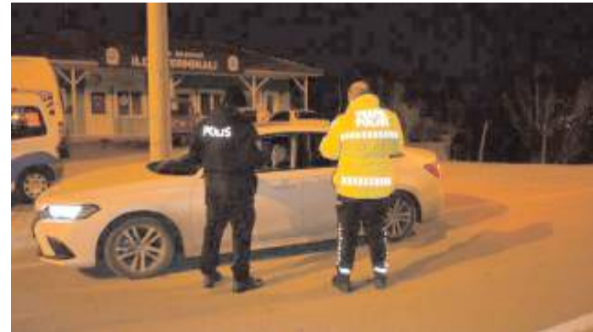
Ekipler ilçenin farklı noktalarında şok denetim yaptı.

yapıldığı denetimlerde sürücüler, alkollü direksiyon başına geçmemeleri gerektiği hatırlatıldı. (AA)