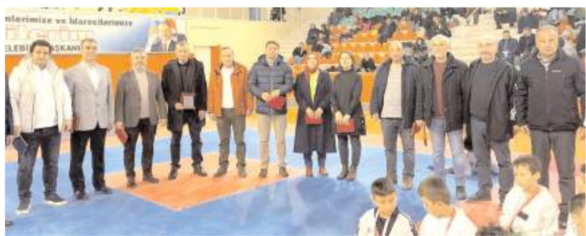
Plaket alan okul İdarecileri, kulüp yöneticileri ile daire müdürleri ve şube müdürleri toplu halde

düzenlenen törenle takım sıralamasında dereceye giren kulüplere kupa sporculara ise madalyaları verildi.