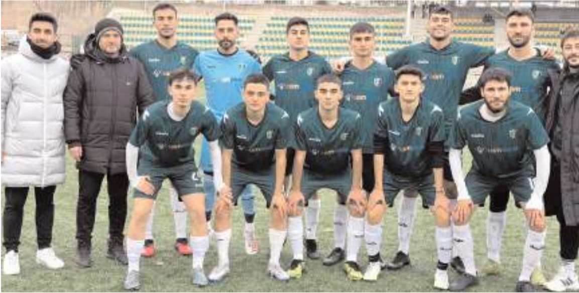
Mimar Sinan Gençlikspor İskilipgücü deplasmanında farklı kazanarak liderliğini maç fazlası ile devam ettirdi

resi 14 Ocak pazar günü oynanacak maçlarla başlayacak.