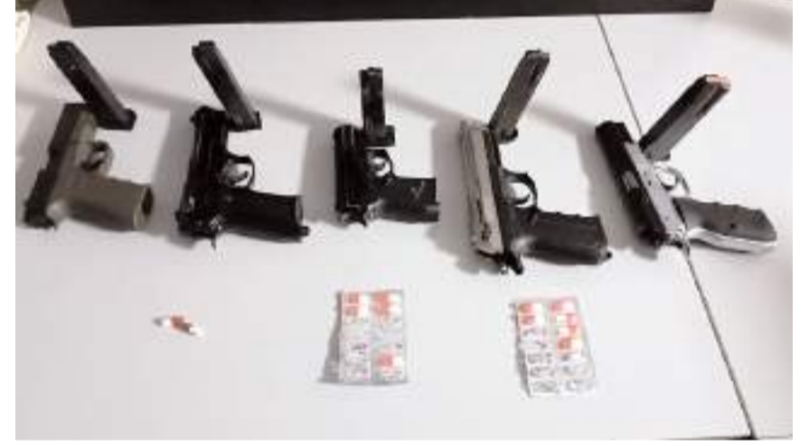
Denetimlerde çok sayıda kaçak ateşli silah ele geçirildi.