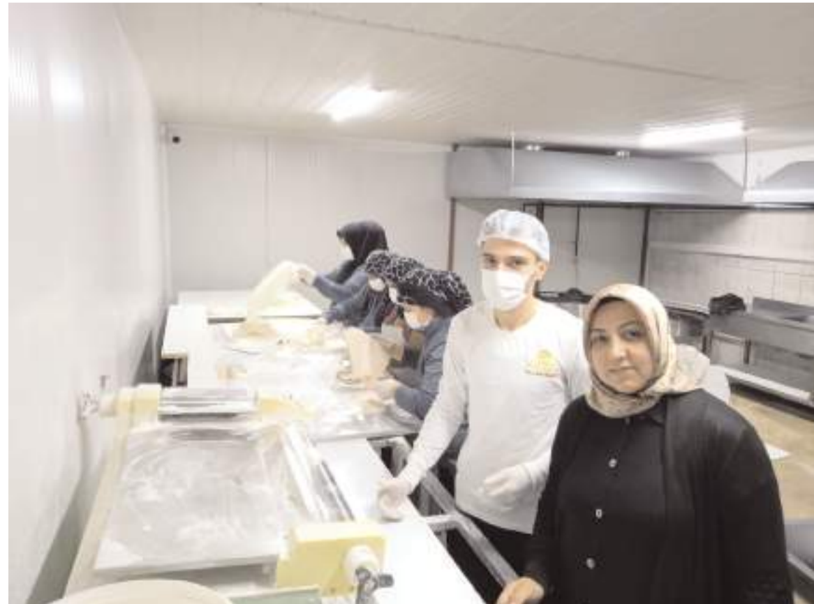
Yeni açılan fabrikada 5 bin yufka üretimi yapılıyor.