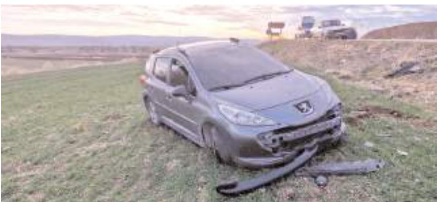
Kaza, Alaca-Sungurlu yolu Eskiyaar köyü mevkiinde meydana geldi.

Kaza ile ilgili başlatılan soruşturma sürüyor. (İHA)