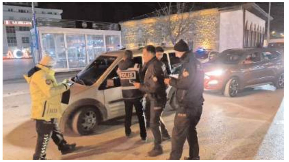
Alaca polisi yılbaşı gecesi şok denetim yaptı.