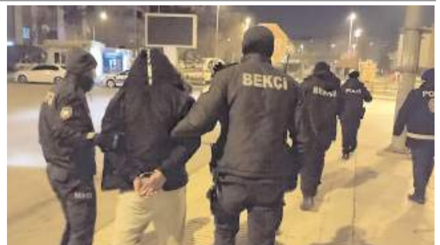
Kaçan şahıs polis tarafından yakalandı.

Olay yerinde gözaltına alınan şahıs ifadesi alınmak üzere karakola götürüldü. (İHA)