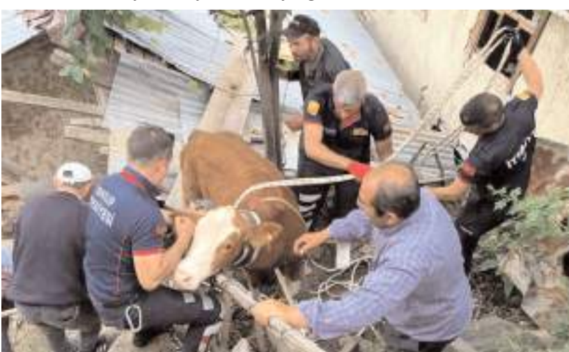
İtfaiye ekipleri 38 kurtarma operasyonu gerçekleştirdi.

İskilip Belediyesi'nden yapılan açıklama da, İtfaiye Müdürü'nün 7 gün 24 saat vatandaşların yanında olduğunu belirtilerek, "1 itfaiye noktası, 8 araç ve 24 personel ile tüm olaylara hazır bir şekilde görevimizin başındayız. 2023 yılında 118 yangın, 41 trafik kazası, 35 su baskını ve 38 kurtarma olaylarına müdahale ederek, 36 iş yeri denetimi gerçekleştirdik. Hizmet içi eğitimler kapsamında 370 kamu personeline yangın müdahale temel eğitimi verilerek, 4 kamu kuruluşunda tatbikat yapıldı" denildi. (İHA)