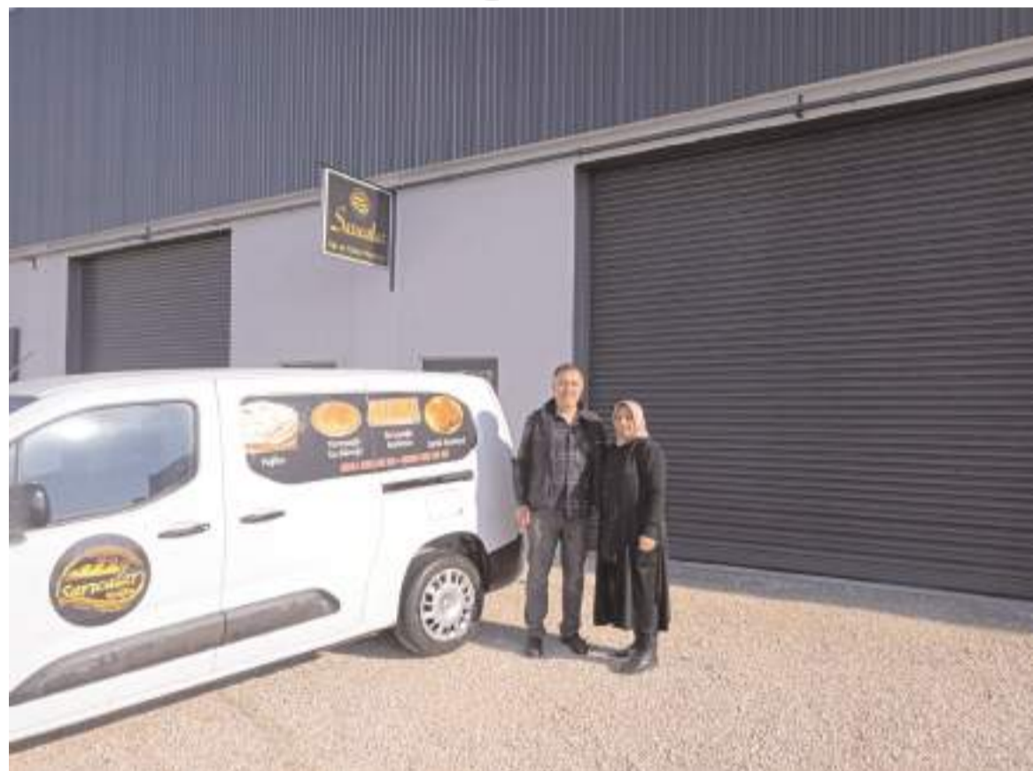
Sarıcalar Süt ve Unlu Mamuller Fabrikası İskilip yolun 2.kilometrede bulunuyor.

imiz olan ürünleri Çorum halkının damak tadına sunuyoruz. Doğal beslenmek isteyen hemşehrilerimiz bizleri tercih ediyor. Köy ürünlerimiz çok revaçta. Köy yumurtası, köy sütü, manda sütü, manda kaymağı, manda tereyağı, yufka, mantı, erişte, kadayıf, gözleme, bazlama ve baklagil çeşitleri ile hizmet veriyoruz. Ayrıca kendi ürettiğimiz yüzde 100 doğal tereyağımız ile Kırk kat has Çorum baklavası üretiyoruz. Sarıcalar markası ile bir çok zincir marketin reyonlarında ürünlerimiz bulunmaktadır. Bu da bizi çok mutlu ediyor." dedi