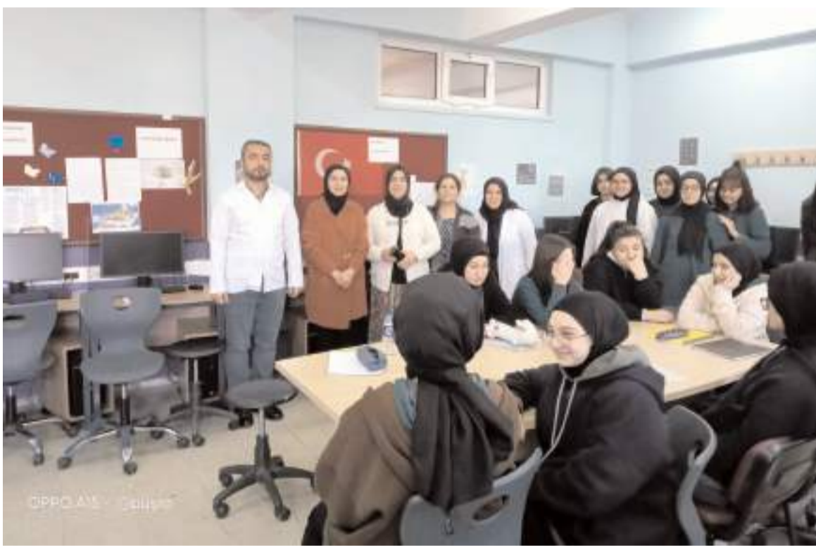
Buharaevler Anadolu İmam Hatip Lisesi proje ekibi hayata geçirdiği projelerle dikkat çekiyor.