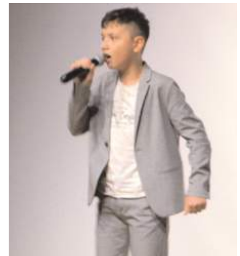
Gençler şiiirler seslendirdiler.