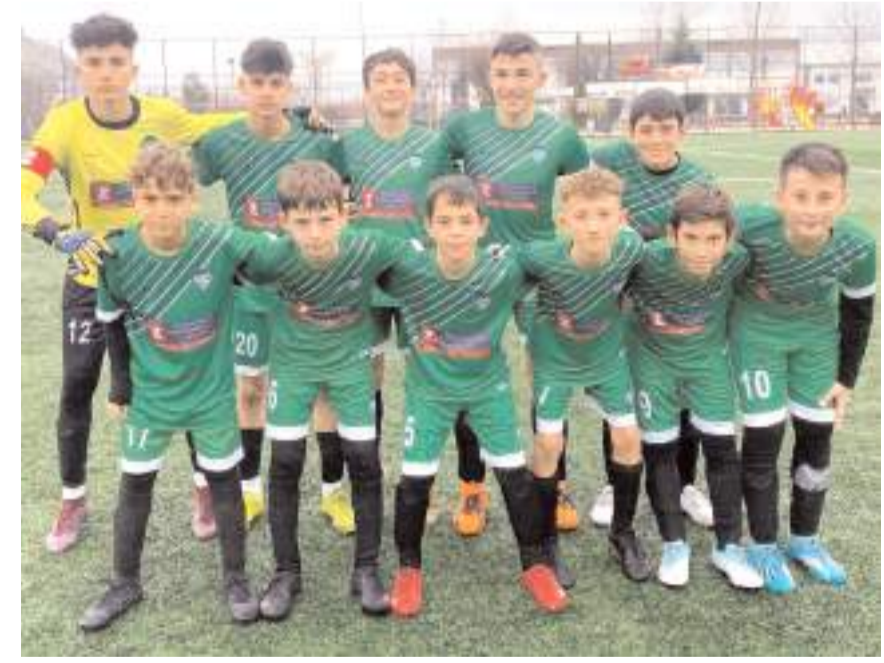
Kandiberspor beşinci maçından da galibiyet ile ayrılarak liderliğe yükseldi

zü Gençlerbirliği deplasmanında gol düellosunu 6-4 kazanarak üç puanın sahibi oldu.