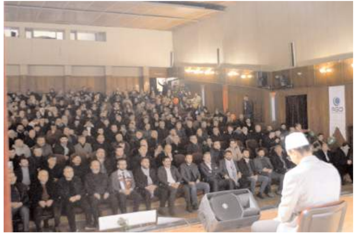
Devlet Tiyatro Salonunda yapılan program Kur'an-ı Kerim tilaveti ile başladı.