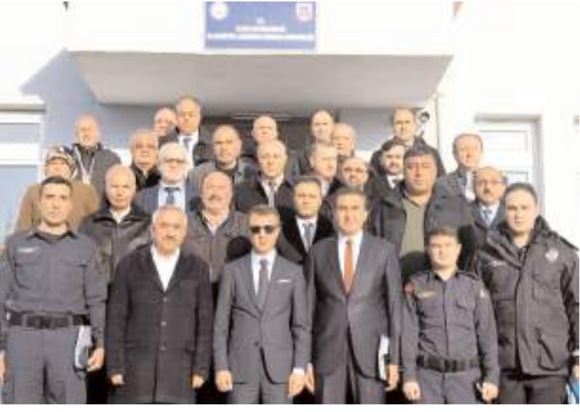
Toplantının ardından toplu hatıra fotoğrafı çekildi.

Alaca'da genişletilmiş güvenlik toplantısı, Alacahöyük Jandarma Karakolu'nda gerçekleştirildi.