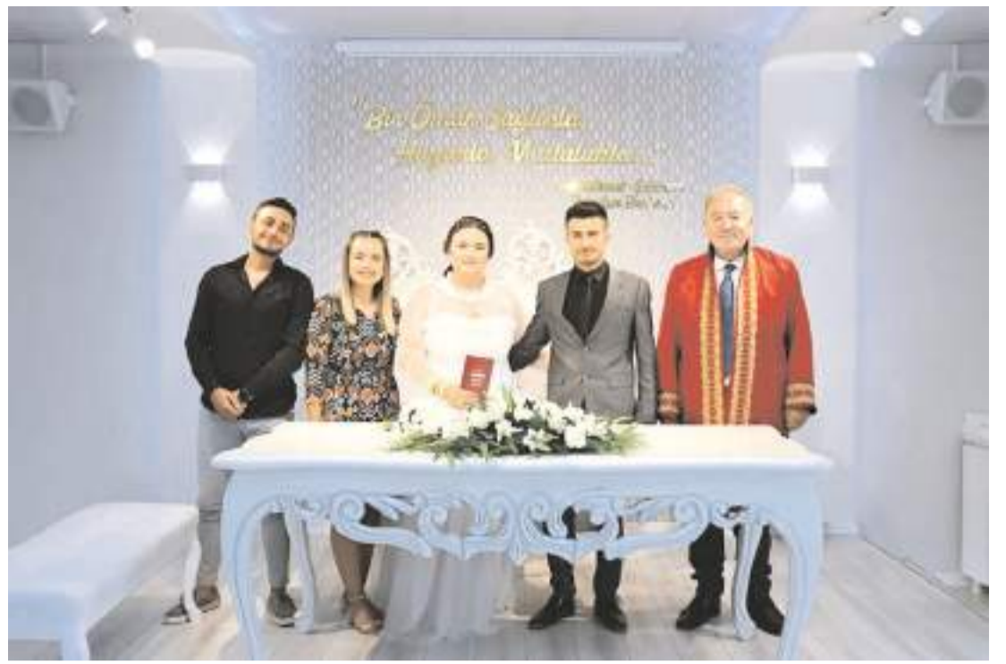
İlçede 2022 yılında 275 çift evlenmişti.