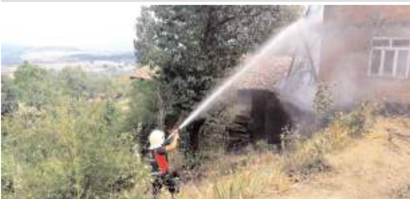
İtfaiye 2023 yılında 118 yangına müdahalede bulundu.

İskilip'te, itfaiye ekipleri son bir yılda 232 olaya müdahale etti.