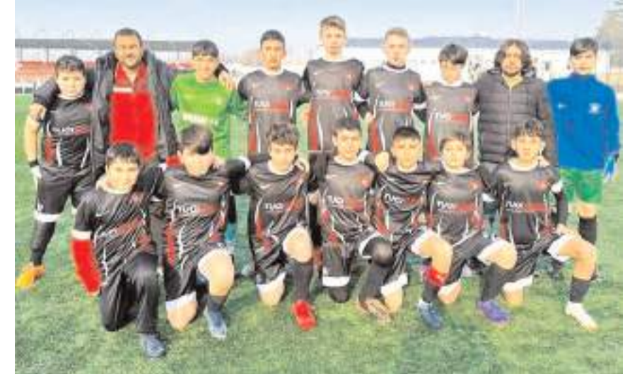
Hattuşa Gençlikspor kazanarak final grubu yolunda büyük avantaj yakaladı