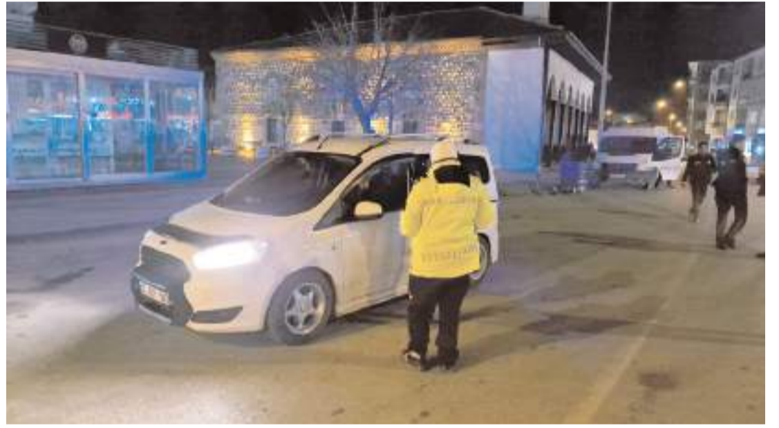
Yılbaşı gecesi yapılan uygulamada 250 şahıs sorgulandı.