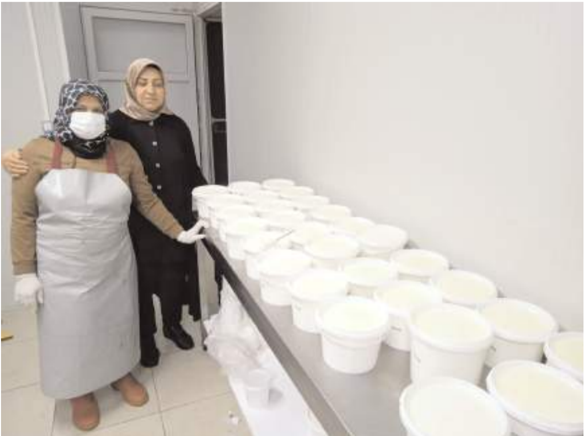
Firmada süt ürünlerinin üretiminde yapılıyor.