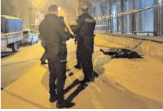
Olay Kale Mahallesi Zafer 3. Sokak'ta meydana geldi.