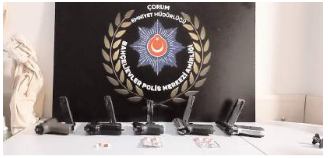
Huzur ve güveni için yılbaşı gecesi 66 polis ekibi ve 401 personel görevlendirildi.

Yakınları, Raad'ın solunum yollarından çeşitli hastalıkları olduğunu söyledi.(AA)