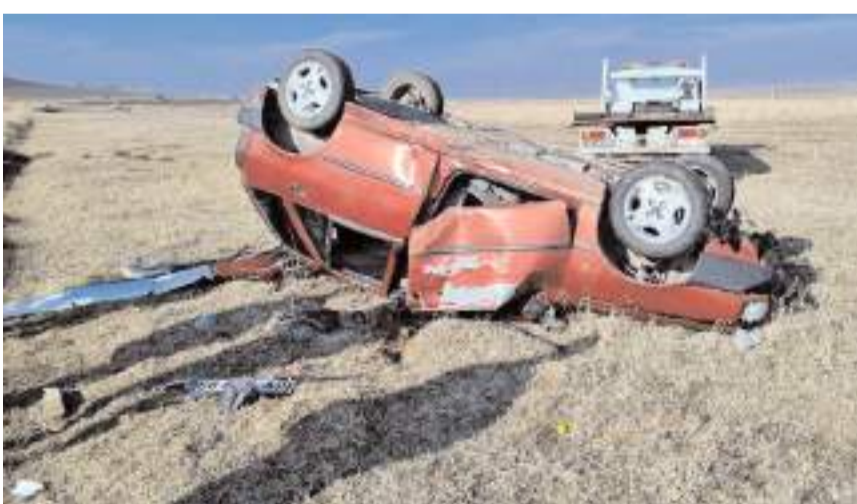
Kaza, Alaca - Baydığın yolunda meydana geldi.

Alaca'da, kontrolden çıkan otomobil takla atarak tarlaya uçtu. Kazada 3 kişi yaralandı.