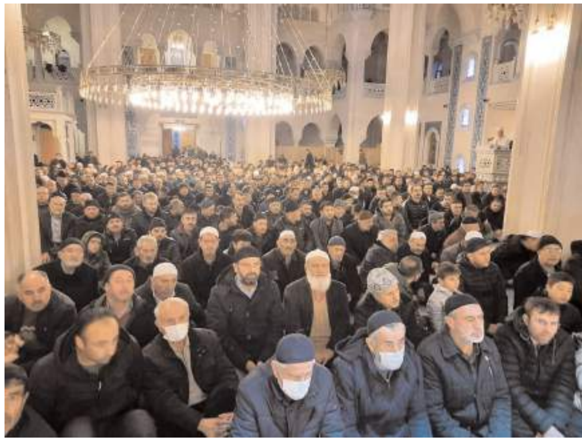
Akşemsettin Caminde dün sabah yapılan şehitler ve Kudüs için dua buluşmasına katılım yüksek oldu.