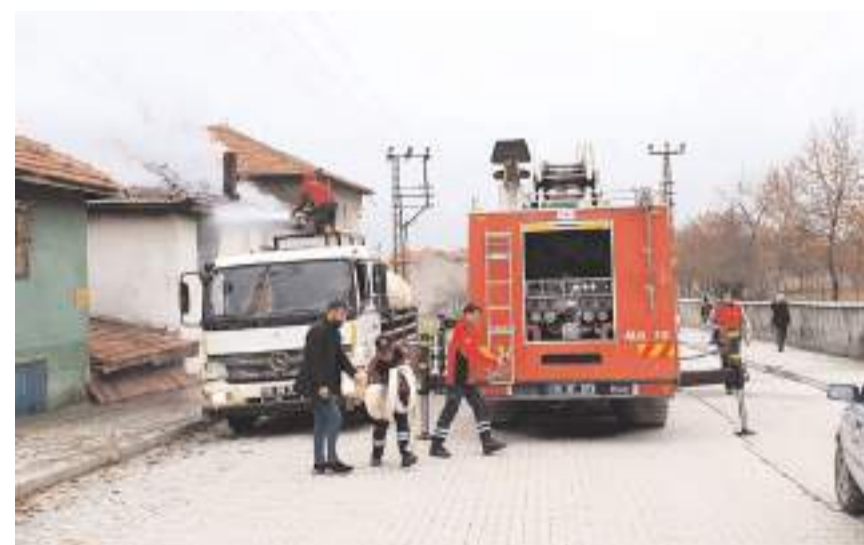
Ekipler ilçe merkezi ve ilçeye bağlı köylerde meydana gelen 34 ev yangınına müdahalede bulundu.

İtfaiye ekiplerinin 2023 yılı içerisinde ilçe genelinde meydana gelen 52 trafik kazasına da müdahale edilerek araçta sıkışan kazazedelerin kurtarılmasını sağladıklarını hatırlatan Başkan Şahiner, ayrıca ekiplerin 45 insan ve hayvan kurtarma ile 5 asansörde mahsur kalma olayına müdahale ettiklerini kaydetti. (İHA)