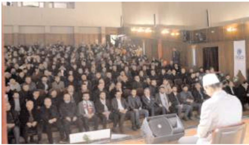
Devlet Tiyatro Salonunda yapılan program Kur'an-ı Kerim tilaveti ile başladı.

■ Anadolu Gençlik Derneği (AGD) Çorum Şubesi 'Mekke'nin Fethi ve Kudüs Gecesi' düzenledi. Devlet Tiyatro Salonunda yapılan programa ilgi yüksek oldu. * HABERİ'5'TE