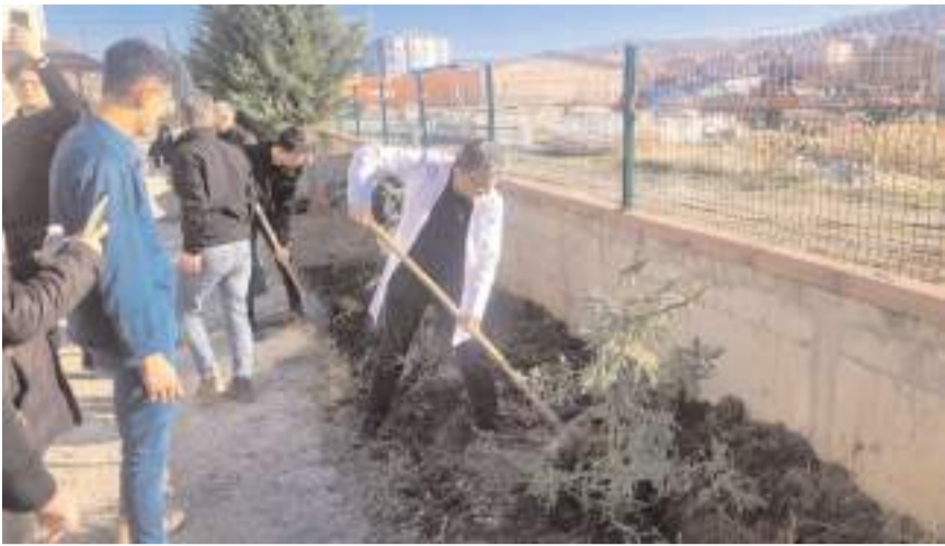
Öğrenciler fidanları okulun bahçesine diktiler.