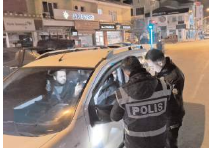
Uygulamalarda 600 araç sorgulandı.

Alaca'da vatandaşların yeni yılı huzur ve güven içerisinde geçirmesi sağlamak amacıyla Ankara Caddesi üzerinde yapılan yılbaşı tedbir uygulamasında 250 şahıs ve 600 araç sorgulandı. Yapılan uygulamada herhangi bir suç unsuruna rastlanmazken, vatandaşların huzuru için yeni yılda uygulamaların devam edileceği kaydedildi. (İHA)