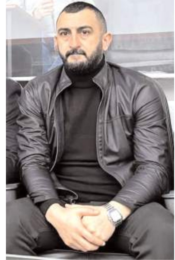
lübü ailesinin yeni yılını kutluyor sağlık ve mutluluklar diliyorum' dedi.

Büyük umutlarla beklediğimiz 2024 yılında ülke olarak şehit haberleri almadığımız, masum çocuklar ve kadınların tüm dünyada katledilmediği barış ve huzurun hakim olduğu gariban ve mazlumun rahat ettiği, sporun birleştirici güç temennisi ile Çorum Futbol Ku-