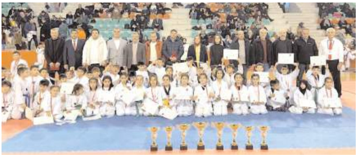
Turnuvada takımlarda dağıtılan kupalar ve küçüklerde dereceye giren sporcular ve kulüp yöneticileri toplu halde

Mekke'nin Fethi Budakaido turnuvasında 13 kulüpten 410 sporcu mücadele etti. Atatürk Spor Salonu'nda iki gün süren maçlar sonunda kızlarda takım birinciliğini HE Kültürspor kazanırken erkeklerde ise Adnan Menderes İlkokuluspor birincilik kupasının sahibi oldu.