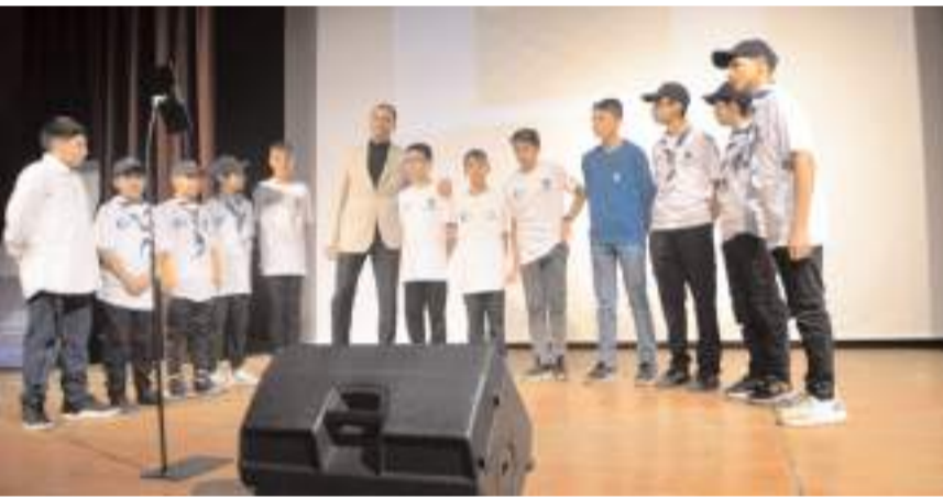
Ortaokullar Kaşif Gurupları hadisler okudular.