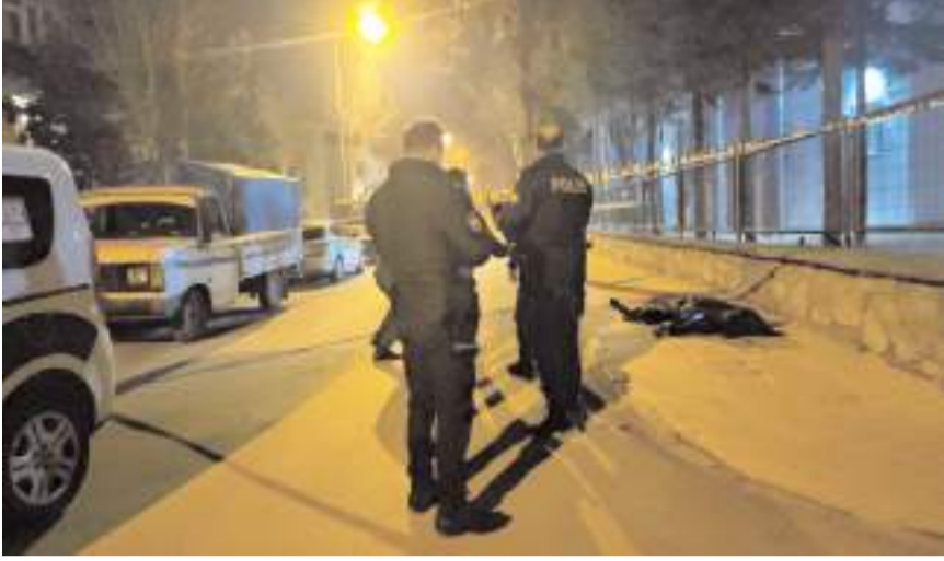
Olay Kale Mahallesi Zafer 3. Sokak'ta meydana geldi.