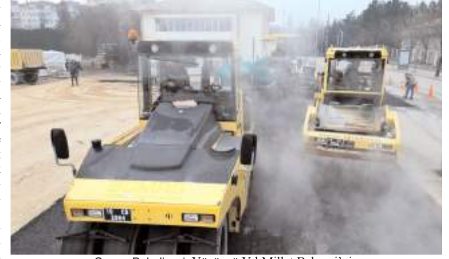
Çorum Belediyesi, Yüzüncü Yıl Millet Bahçesi'nin etrafında asfaltlama çalışması başladı.