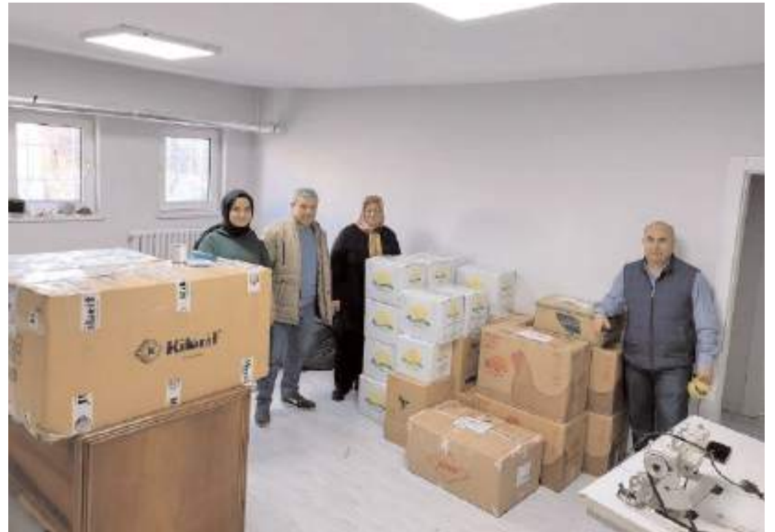
Her türlü kıyafeti içeren 30 adet yardım kolisi, Gazze'ye ulaştırılmak üzere hazır hale getirildi.