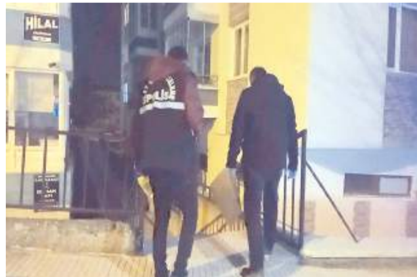
Polis ekipleri olay yerinde incelemede bulundu.