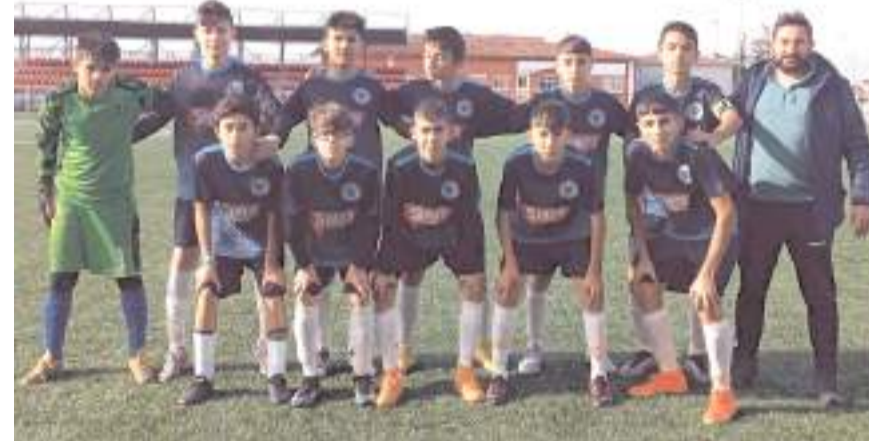
Yavruturna Ortaokulu Osmancık önünde 2-0 galip gelecek finale yükselmeyi başardı

GOLLER: Yağız ve Toprak (Yavruturna Ortaokulu).