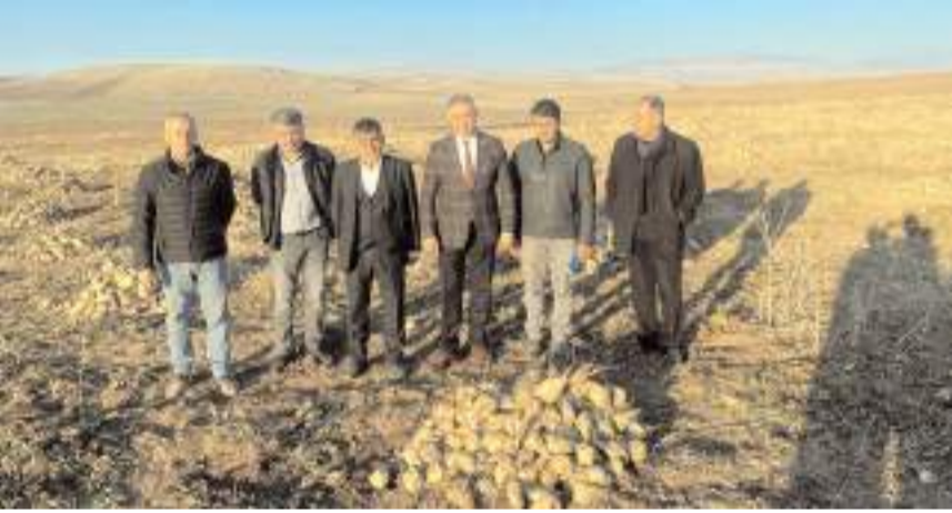
Şeker pancarı üreticileri sorun ve taleplerini dile getirdi.