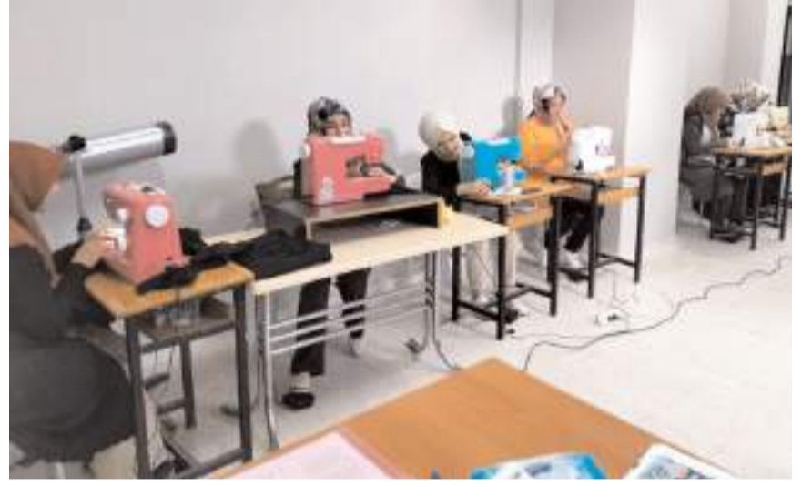
Kursiyerler çok sayıda kıyafet diktiler.

Milli Eğitim Bakanlığı Hayat Boyu Öğrenme Genel Müdürlüğü tarafından başlatılan "Biz Hep Yanımızdayız" temalı Gazze'ye giyecek yardımı kampanyası çerçevesinde, Sungurlu Halk Eğitimi Merkezi tarafından çocuk ve kadın giysileri başta olmak üzere her türlü kıyafeti içeren 30 adet yardım kolisi, Gazze'ye ulaştırılmak üzere hazır hale getirildi.