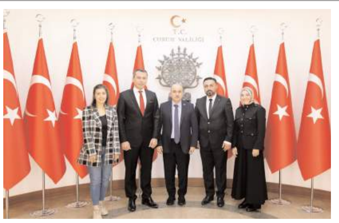
Çorum Dış Hekimleri Odası yönetimi Vali Zülkif Dağlı'yı ziyaret etti.

Sempozyum kapsamında 23 farklı üniversiteden katılan akademisyen ve uzmanlar tarafından 38 sunum gerçekleştirildi. (Haber Merkezi)