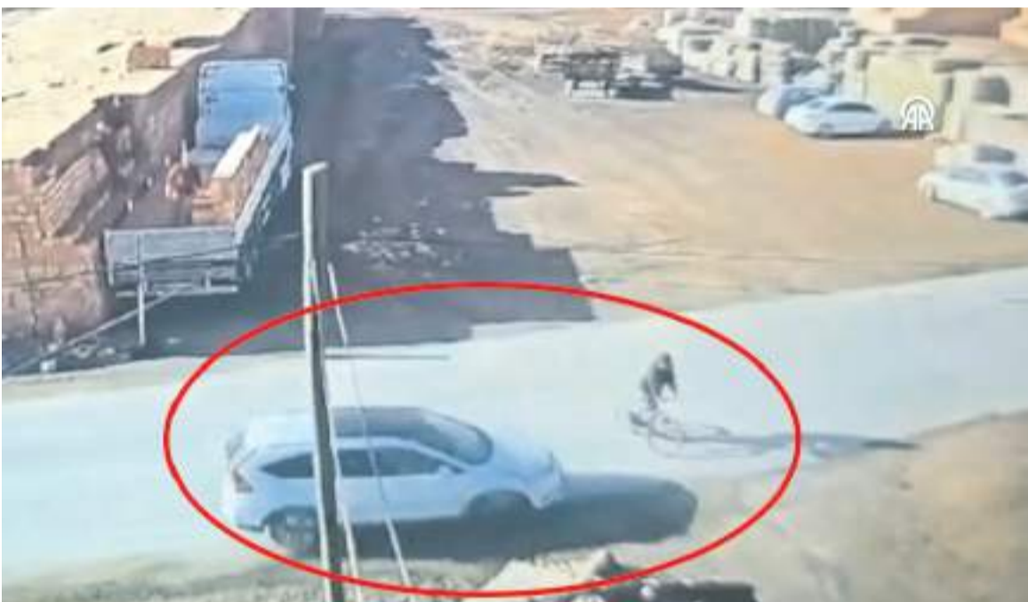
Kaza Çorum-Osmancık kara yolu Osmancık ilçe girişinde meydana geldi.

3 yılda bitirilmesi planlanan hastanenin ihalesinin aradan geçen 50 güne rağmen Sağlık Bakanlığı tarafından onaylanmaması akıllarda soru işareti bıraktı.