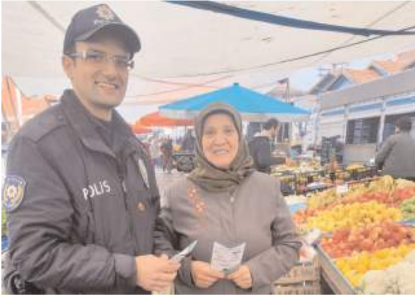
Polis ekipleri pazarda vatandaşlara projeyi anlatan broşür dağıttı.