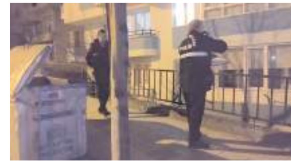
Yaralı şahıs hastanede tedavi altına alındı.