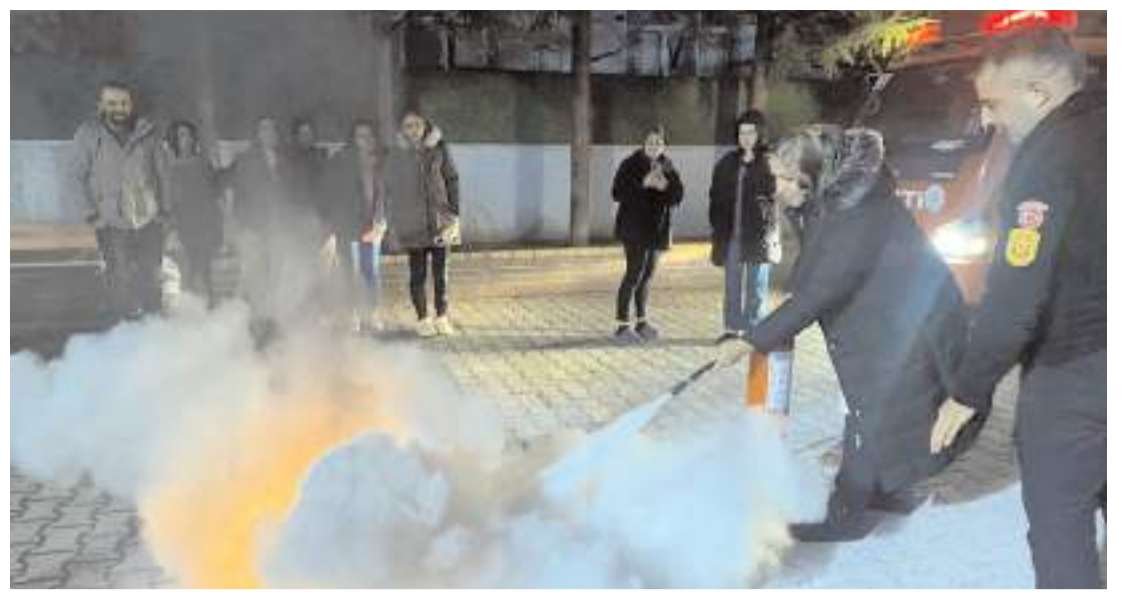
Öğrencilere yangına müdahale eğitimi uygulamalı olarak verildi.

Ayrıca sokakta görülen uyuşturucu ticaretini polise bildirmek isteyen vatandaşların ihbarında bulunabilecekleri "Uyuma" uygulaması ve web sitesi hakkında vatandaşlar bilgilendirildi.(AA)