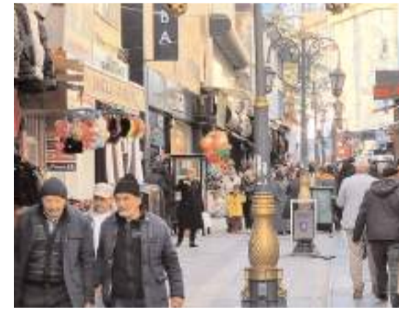
TÜİK verilerine göre Çorum'da genç nüfusun oranı yüzde 13.1