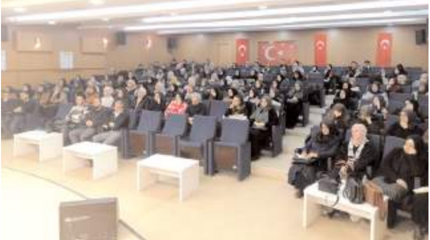
Panel Çorum İl Müftülüğü Diyanet Gençlik Merkezi tarafından yapıldı.