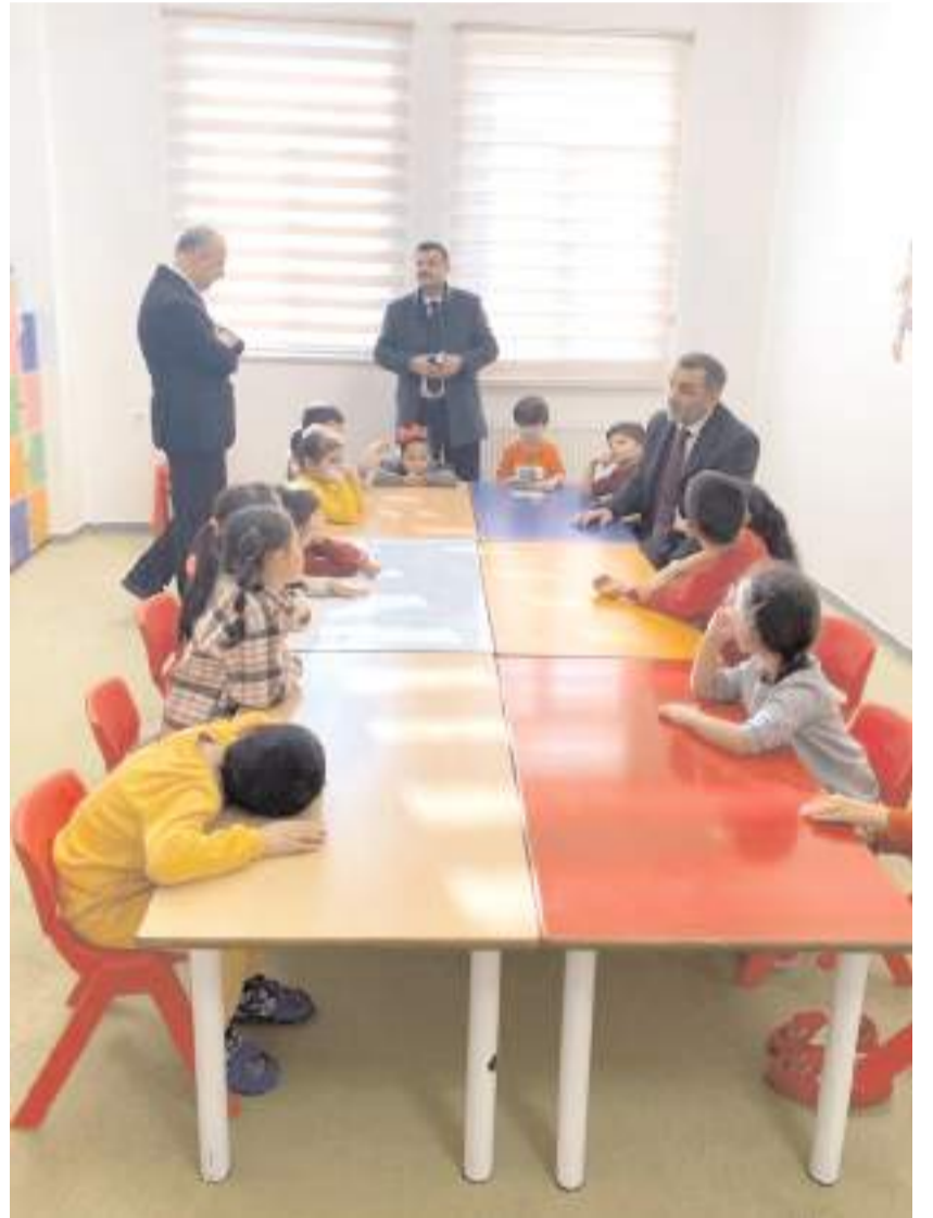
Diyanet İşleri Başkanlığı heyeti Şehit Ali Karşlı ve Hz. İbrahim Camii 4-6 Yaş Kur'an Kursunu ziyaret etti.