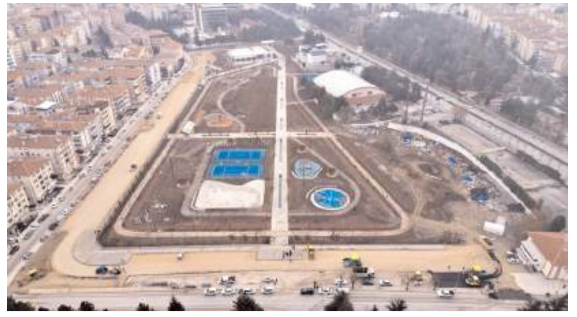
Yüzüncü Yıl Millet Bahçesi'nde çalışmalar bitmek üzere.