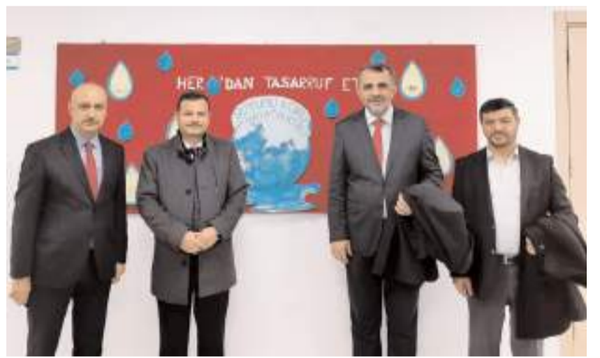
Diyanet İşleri Başkanlığı heyeti Lalezar Yatılı Hafızlık Kur'an Kursunu ziyaret etti.