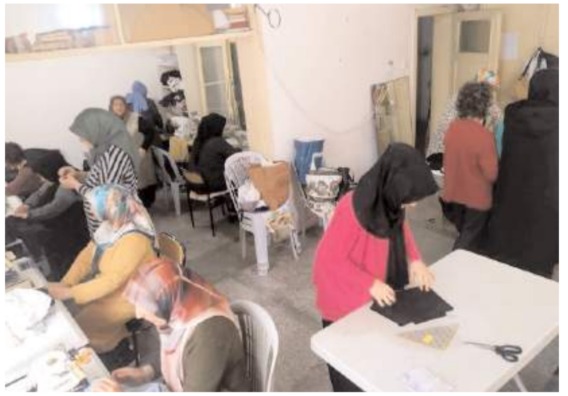
Sungurlu Halk Eğitimi Merkezi kursiyerleri, "Biz Hep Yanımızdayız" temalı Gazze'ye giyecek yardımı kampanyasına destek oldular.