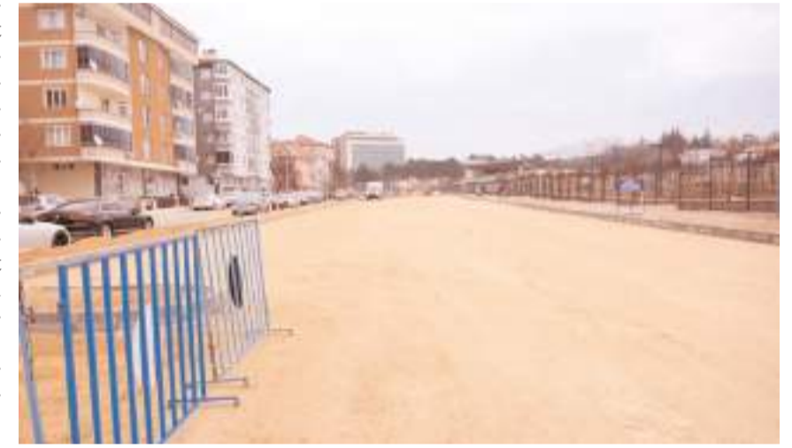
Yüzüncü Yıl Millet Bahçesi'nin çevresinde yeni otopark alanları oluşturuldu.