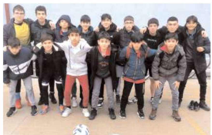
Yıldırım Beyazıt İmam Hatip yarı final maçını kazanarak finale yükselmeyi başardı