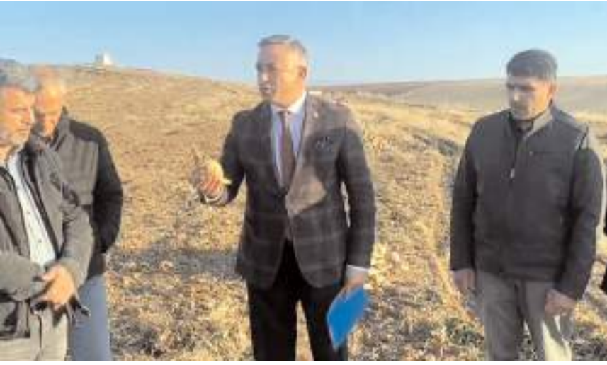
CHP Çorum Milletvekili Mehmet Tahtasız, Kızıllı Köyü'nde şeker pancarı üreticileri ile buluştu.

"Fabrika bize şeker pancarlarını sökmemiz için program yaptı. Program dahilinde biz şeker pancarlarını söküyoruz. Söktükten sonra 7 gün içerisinde pancarları kaldırmamız gerekirken çeşitli bahanelerle pancarı 40 ile 90 gün arasında tarlada bekletiyor. Tarlada bekleyen pancar fire veriyor. Normalde 100 ton pancar vereceğiz diye yazıldıysak 90 güne kadar tarlada bekleyen pancar yüzde 40, yüzde 60 oranında fire veriyor. Böyle olunca da kota açığımız oluşuyor. Kota açığı nedeniyle de bize ceza kesiyor. Yani firma kendi hatasından kaynaklanan zararı yine bize yüklüyor. Bu zararı Konya'dan şeker pancarı olarak fireyi kapatmaya çalışıyoruz. Parası olan bunu yapıyor. Parası olmayan da 200-300 bin lira ceza ödüyor. Kapatamadığı zaman da firma kendi hatasını çiftçiye yüklüyor ve çiftçiden para kesiyor. Hem pancarını düşük fiyata alıyor hem de kotadan dolayı yüzde 33 oranında ceza kesiyor. Firma yetkililerine de ulaşamıyoruz. Karşımızda muhatap bulamıyoruz. Şimdi telefonlarımızda da dahi çıkmıyorlar." (Haber Merkezi)