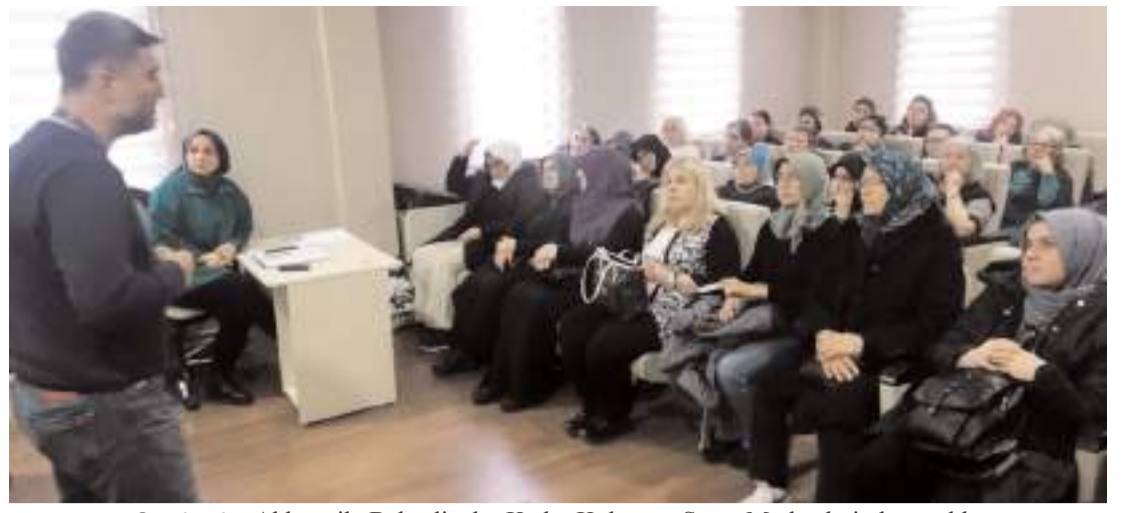
Seminerler Akkent ile Bahçelievler Kadın Kültür ve Sanat Merkezlerinde yapıldı.