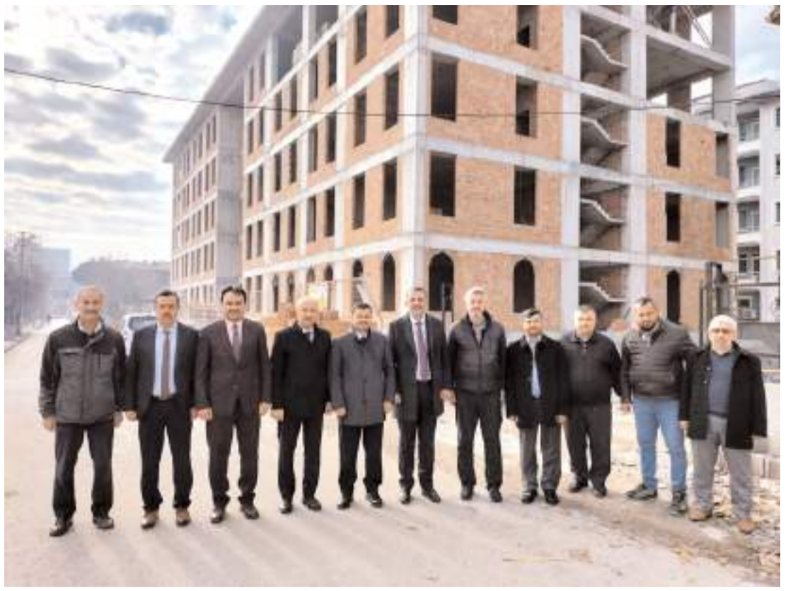
Diyanet İşleri Başkanlığı heyeti inşaatı devam eden Hıdırlık Hafızlık Kur'an Kursunda incelemede bulundu.