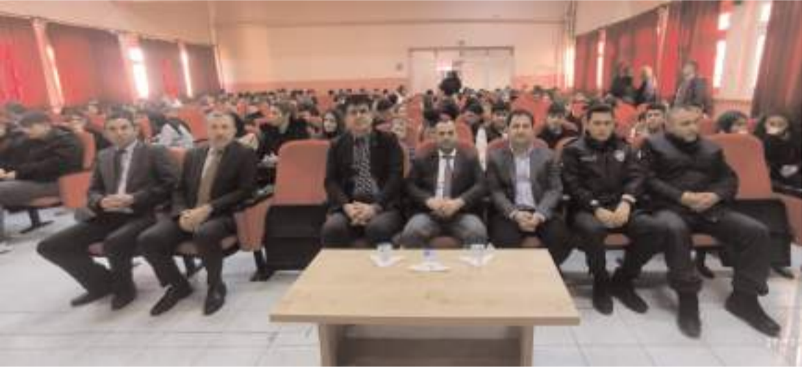
Program Mecitözü Yatılı Bölge Okulu Konferans Salonu'nda yapıldı.