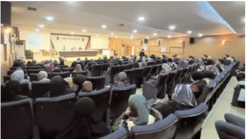
Turgut Özal İş Merkezi Konferans Salonunda yapılan panele çok sayıda genç katıldı.