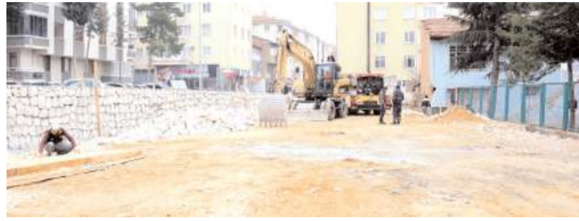
Şehit Erol Olçok Anadolu İmam Hatip Lisesi için yapılacak spor alanında Belediye çalışmalarını sürdürüyor