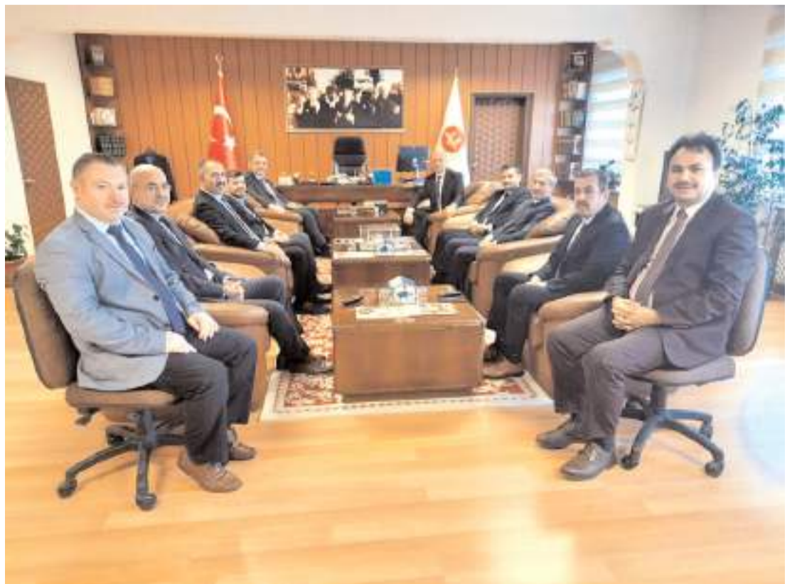
Diyanet İşleri Başkanlığı heyeti İl Müftülüğü'ne ziyarette bulundu.