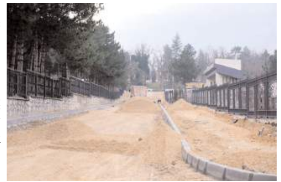
Gazi Caddesi ile Bayındır 1. Sokak arasında yeni bir yol açıldı.