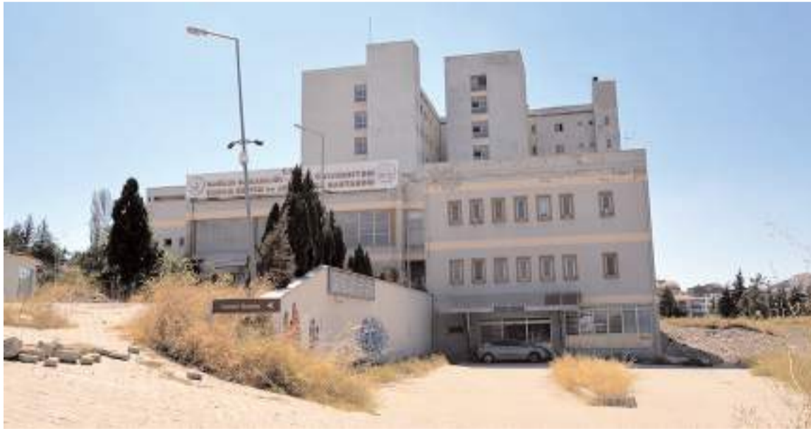
Hastane ihalesi 13 Kasım 2023 tarihinde yapılmıştı.