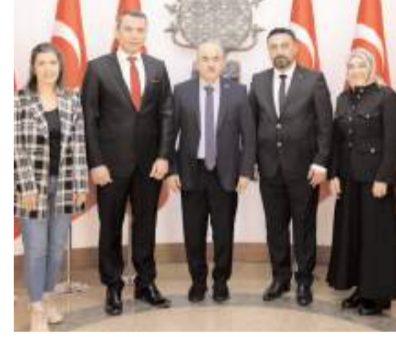
Çorum Dış Hekimleri Odası yönetimi Vali Zülkif Dağlı'yı ziyaret etti.