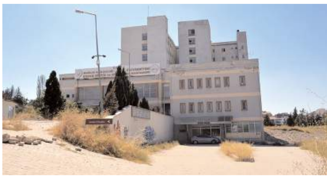
13 Kasım'da yapılan ihale henüz onaylanmadı.

Ahlatcı Holding, Türkiye'de altın üretimi ve ihracatı konusunda 2019, 2022, ve 2023 yılında sektörün ihracat lideri olmuştur. Holding, ana faaliyet alanı olan kuyumculuk ve altın sektörlerinde Türkiye iç pazarının en büyük üreticilerinden biridir. (Haber Merkezi)