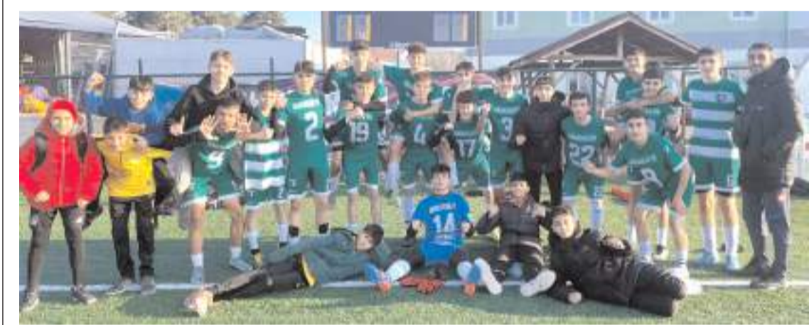
Çorum Anadolu FK ligdeki üçüncü maçında kazanarak liderliğe yükseldi

Yurtiçi ve yurtdışından tüm Giresunluların takip edebileceği etkinlik saat 20.00'den itibaren Giresunspor Resmi YouTube kanalı üzerinden canlı olarak yayımlanacak.