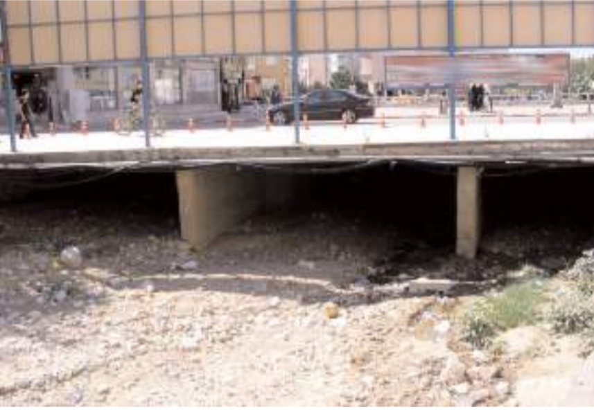
Diğ. Budaközü ve Akçay dereleri ıslah edilecek.