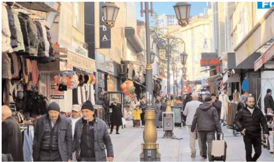
TÜİK verilerine göre Çorum'da genç nüfusun oranı yüzde 13.1