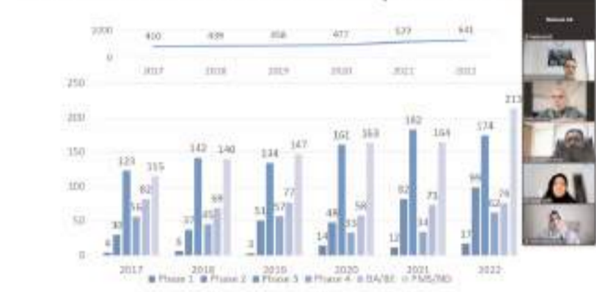
"Sağlık Hizmetlerinde Yenilikler ve Teknoloji Sempozyumu" çevrimiçi olarak yapıldı.