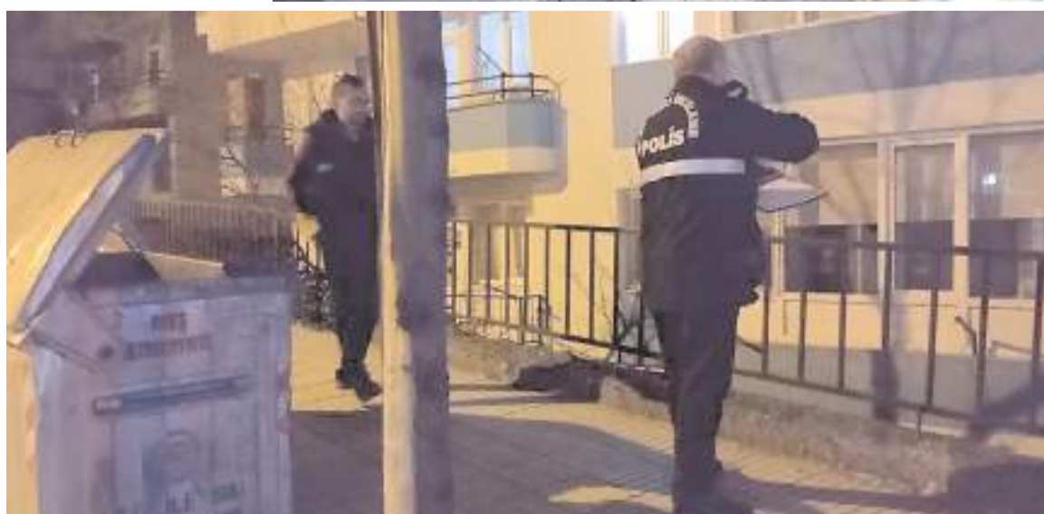
Yaralı şahıs hastanede tedavi altına alındı.