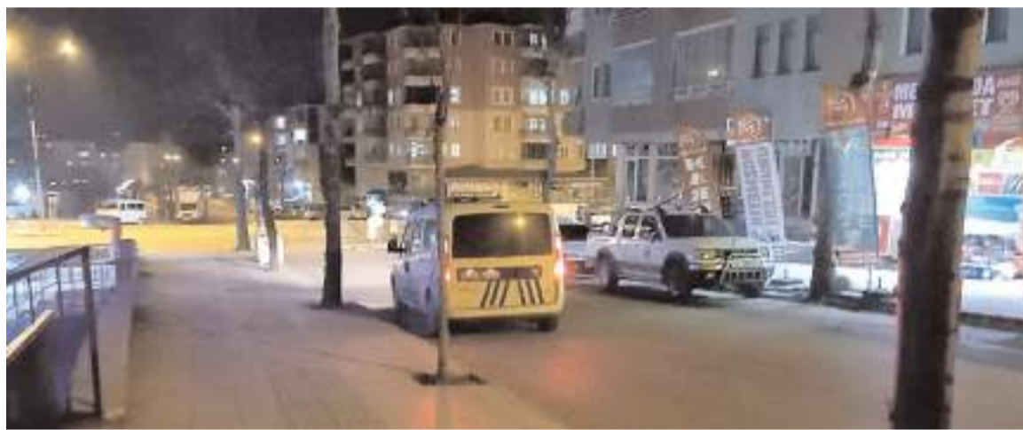
Olay, Gülabibey Mahallesi'nde meydana geldi.

Hakimiyet, merhume Allah'tan rahmet, ailesine ve yakınlarına başsağlığı diler.