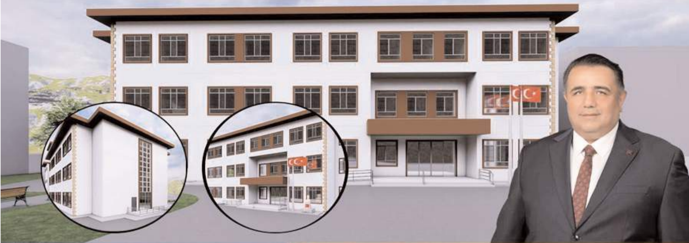
Toplam inşaat alanı 3424 metrekare olacak okulda 16 derslik bulunacak.