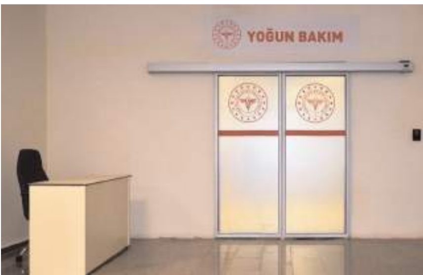
Yeni yoğun bakım ünitesi büyük bir eksikliği giderdi.