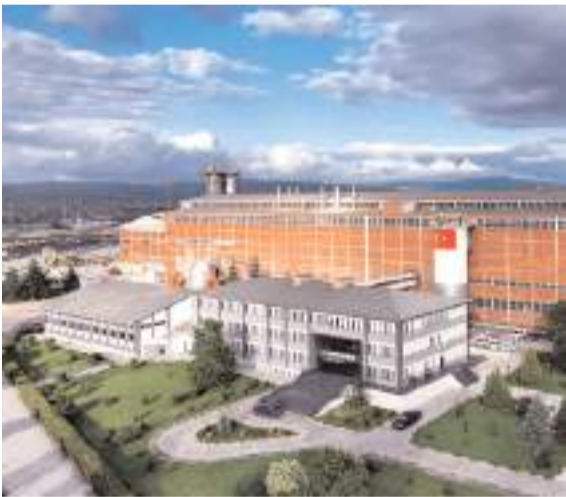
Safi Çorum Şeker Fabrikasından yapılan açıklamada bugüne kadar olduğu gibi bundan sonrada üreten çiftçilerin yanında olmaya devam edileceği belirtildi.