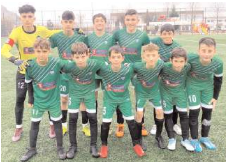
Kandiberspor U 14 takımı beşinci maçından da galibiyetle ayrılarak liderliğini sürdürdü