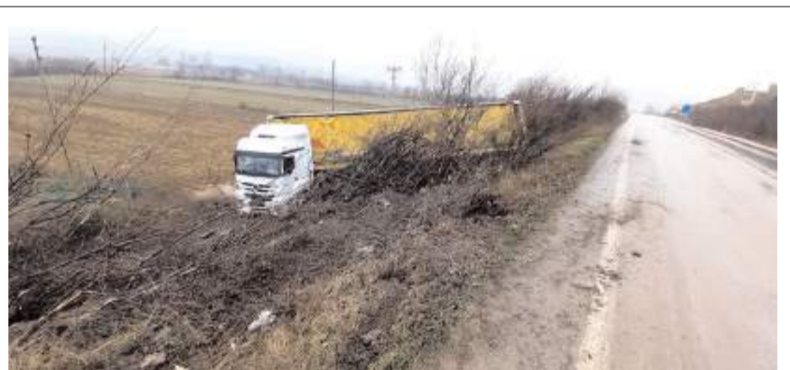
Kaza Yıldızköy mevkiinde meydana geldi.

Kaza ile ilgili başlatılan soruşturma sürüyor. (İHA)