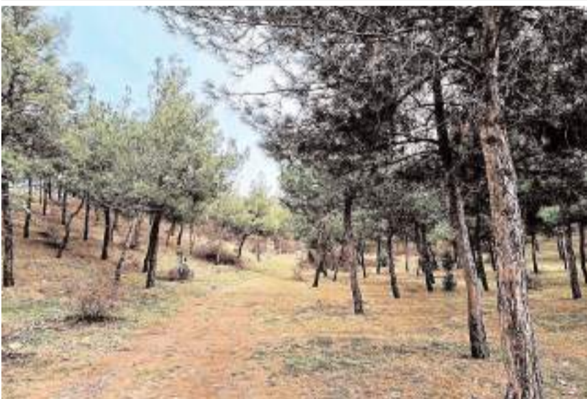
Etkinlik ÇEDES projesi kapsamında yapıldı.