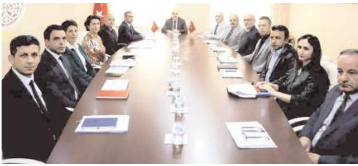
Vali Zülkif Dağlı Gençlik ve Spor İl Müdürlüğünde faaliyetler hakkında detaylı brifing aldı