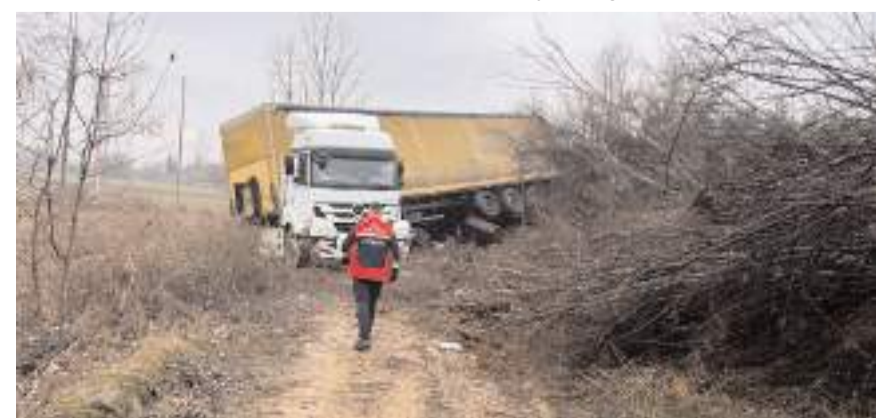
Kazada tır sürücüsü yaralandı.