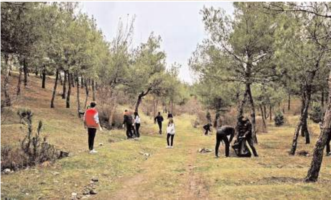
Öğrenciler ilçede bulunan ormanlık alanda temizlik yaptılar.

Osmancık İsmail Karataş Mesleki ve Teknik Anadolu Lisesi öğrencileri, ÇEDES projesi çerçevesinde ormanlık alanı temizledi.