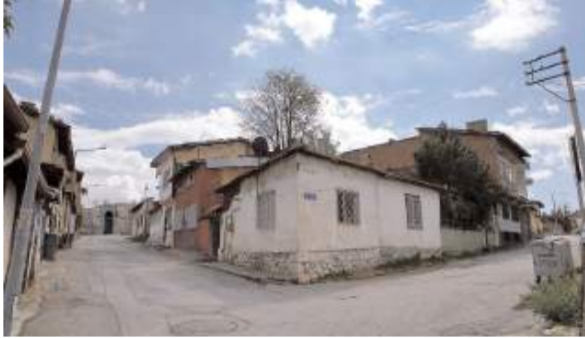
Vatandaşlar şehrin merkezinde bulunan bölgenin metruk görüntüsünden şikayetçi.

Tarihi Çorum Kalesi çevresinde hayata geçirilmesi planlanan kentsel dönüşüm projesinde ki belirsizlik mülk sahiplerini endişelendiriyor. Vatandaşlar bölgede kentsel dönüşümün öndeki engellerin kaldırılarak projenin bir an önce hayata geçirilmesini istiyor.