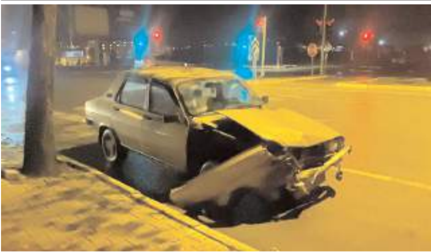
Kaza Hastane Kavşağı'nda meydana geldi.