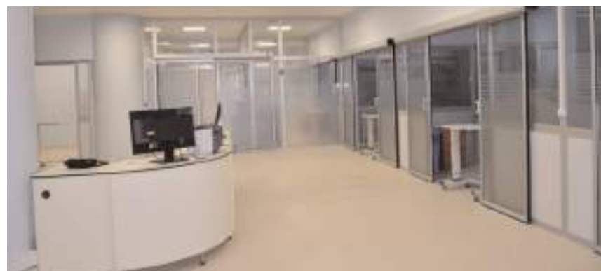
Yeni yoğun bakım ünitesinde 16 yatak bulunuyor.