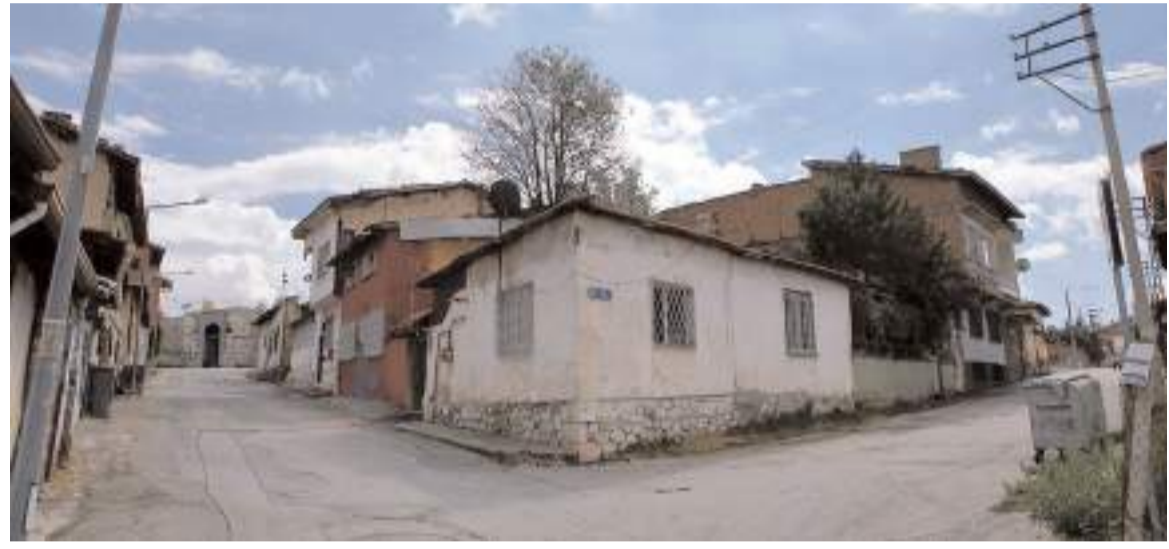
Vatandaşlar şehrin merkezinde bulunan bölgenin metruk görüntüsünden şikayetçi.

Hak sahipleri projenin akıbeti ile ilgili çıkacak sevindirici gelişmeleri dört gözle beklerken, 2024 yılında projenin yeniden hayata geçirilmesini hayal ediyor.