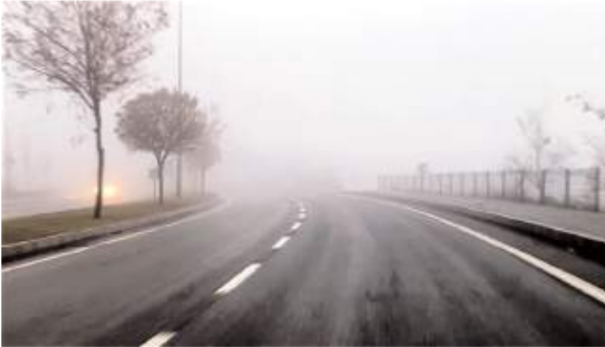
Yoğun sis trafikte görüş mesafesini kısalttı.