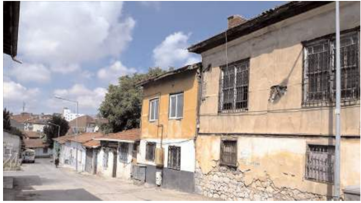
Riskli alan ilan edilen Kale bölgesinin kentsel dönüşümü ile ilgili belirsizlik devam ediyor.