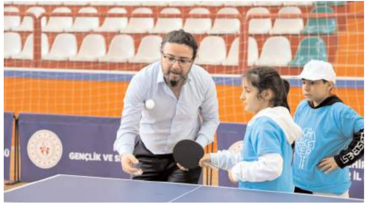
Proje, 6 yılda 411 okul, 160 bin çocuk ve 430 öğretmene ulaştı.

Proje içerisinde Kırşehir merkez ve ilçelerden 56 devlet okulundan 15 bini aşkın öğrenci, profesyonel masa tenisi eğitim imkanına kavuşacak. Yalnızca öğrencileri değil öğretmenleri de