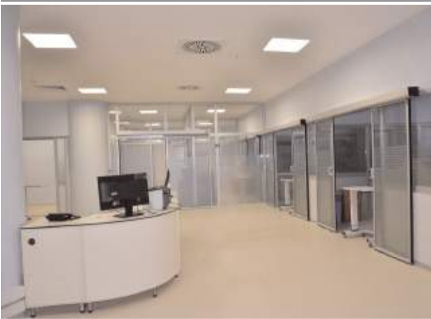
Yeni yoğun bakım ünitesinde 16 yatak bulunuyor.