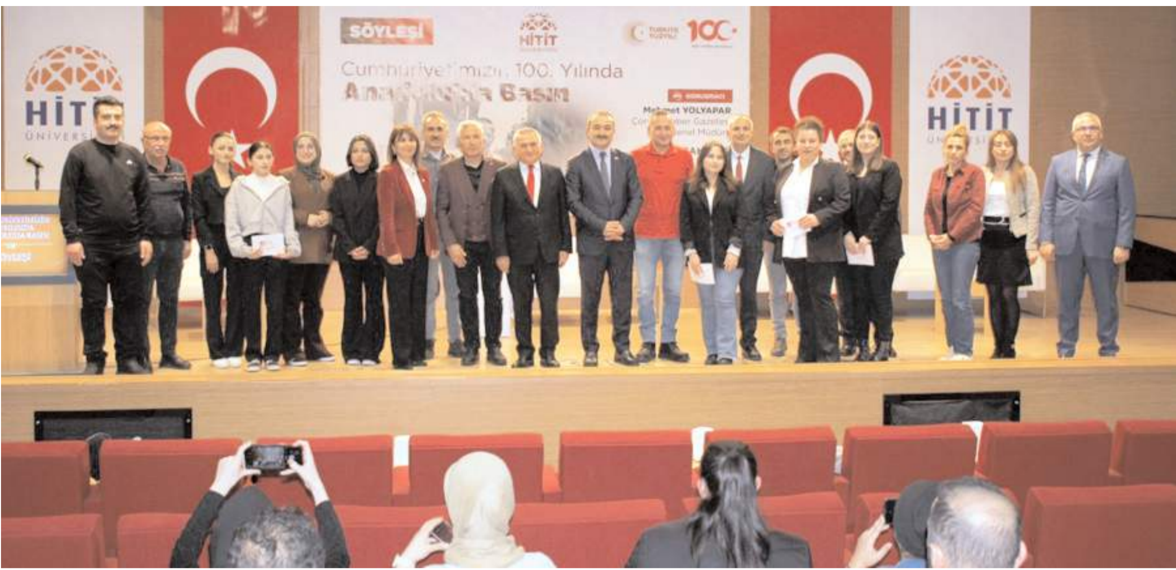
Programın sonunda günün anısına toplu fotoğraf çekildi.