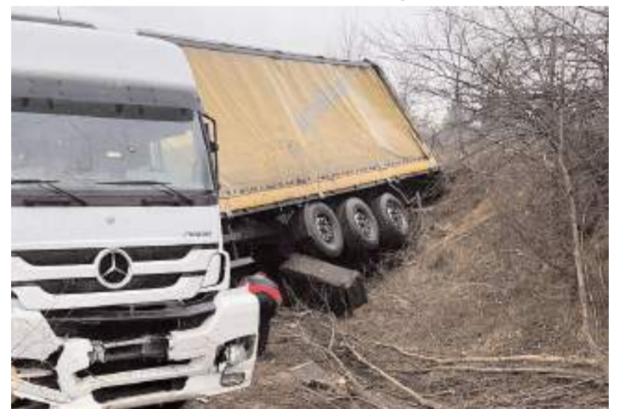
Kazada tırda maddi hasar meydana geldi.

Kazayla ilgili inceleme başlatıldı. (İHA)