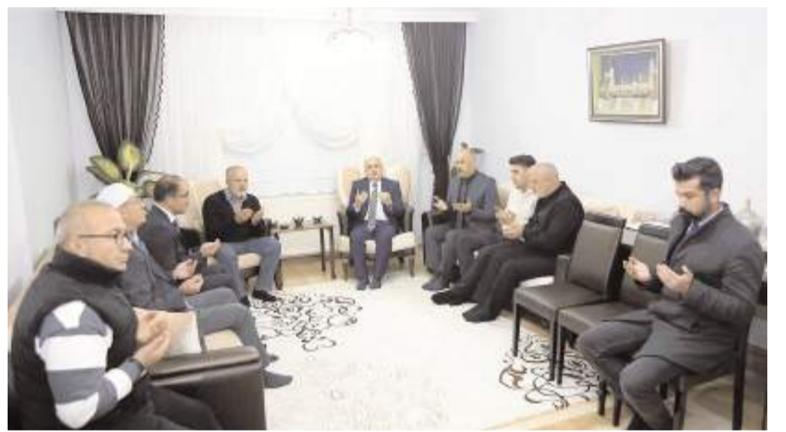
Ziyarette Kur'an-ı Kerim okunarak tüm şehitler için dua edildi.