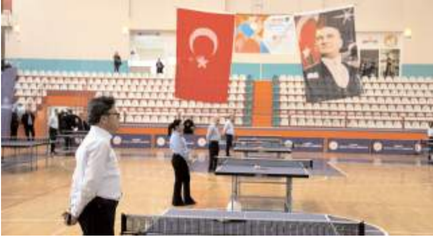
Uçan Raketler, çocuk ve gençlerin masa tenisi yoluyla sağlıklı yaşam ve düzenli spor yapma alışkanlığı kazanmasını hedefliyor.

Hitit tarafından başlatılan ve Türkiye Masa Tenisi Federasyonu partnerliği ile yürütülen Uçan Raketler Türkiye'nin tek sürdürülebilir masa tenisi projesidir. 2018 yılında başlayan proje kapsamında; ihtiyaç sahibi okulların belirlenerek ilk olarak masa tenisi ekipmanları sağlanıyor ve antrenörler de gönüllü öğretmenlerden oluşuyor. Daha sonra Türkiye Masa Tenisi Federasyonu tarafından verilen profesyonel eğitimle antrenörlük sertifikası alan öğretmenler tarafından öğrencilerin eğitim süreci başlıyor. Projenin en önemli hedeflerinden birisi de masa tenisi alanında genç yeteneklerin keşfedilip desteklenerek, ülkemizi bu alanda dünyada temsil edecek sporcuların kazanılması. Uçan Raketler projesi ile şu ana kadar Çorum, Isparta, Trabzon, Şanlıurfa, Sakarya'da, Kahramanmaraş, Malatya ve Kırşehir'de 160 binden fazla çocuk profesyonel masa tenisi eğitimi imkanına kavuştu. (İHA)