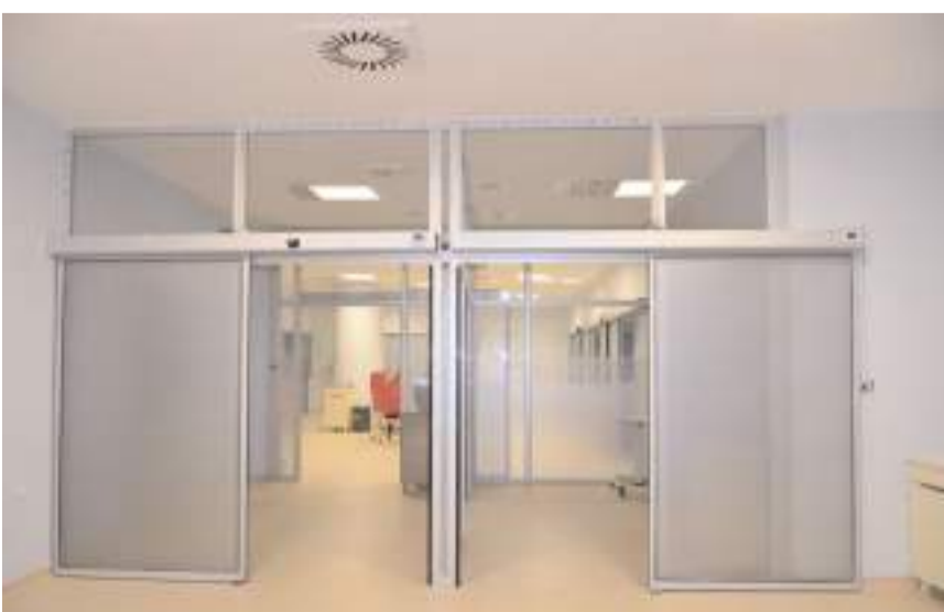
Yoğun bakım ünitesi Ocak 2024 itibarıyla hizmete başladı.

Hitit Üniversitesi Erol Olçok Eğitim ve Araştırma Hastanesinde yeni yoğun bakım ünitesi faaliyete başladı. Yeni yoğun bakım ünitesinde 16 yatak bulunuyor.