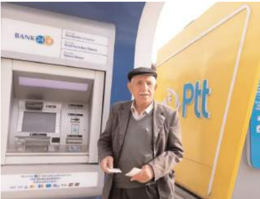
Vatandaşlar para çekmek için artık ilçeye gitmeyecek.

"Beldemize kurulan PTT ATM'si hizmet vermeye başlamıştır. ATM kurulum sürecinde emeği geçen başta Ulaştırma ve Altyapı Bakanımız Abdülkadir Uraloğlu'na Çorum milletvekilleri Yusuf Ahlatcı