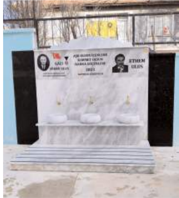
Çeşme Dumlupınar İlkokulu'nun bahçesine yapıldı.