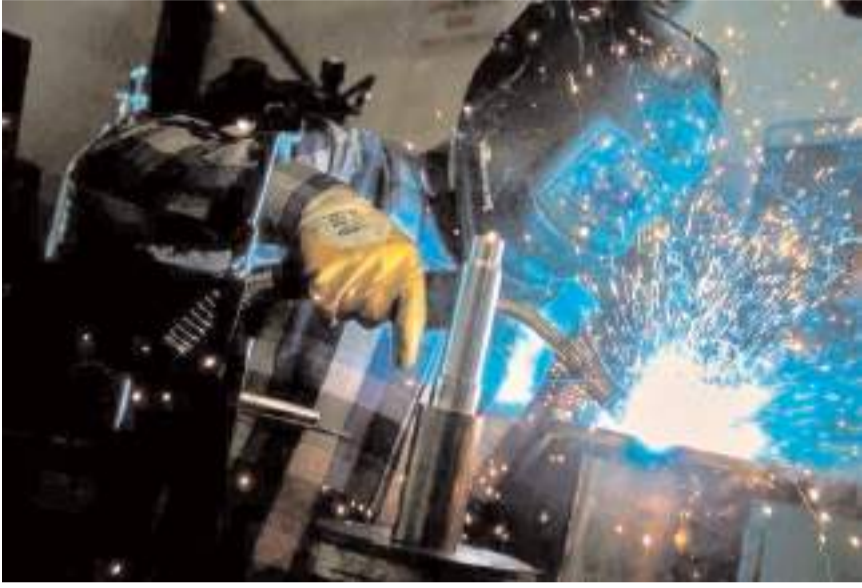
Türkiye İhracatçılar Meclisi ihracat verdilerini açıkladı.