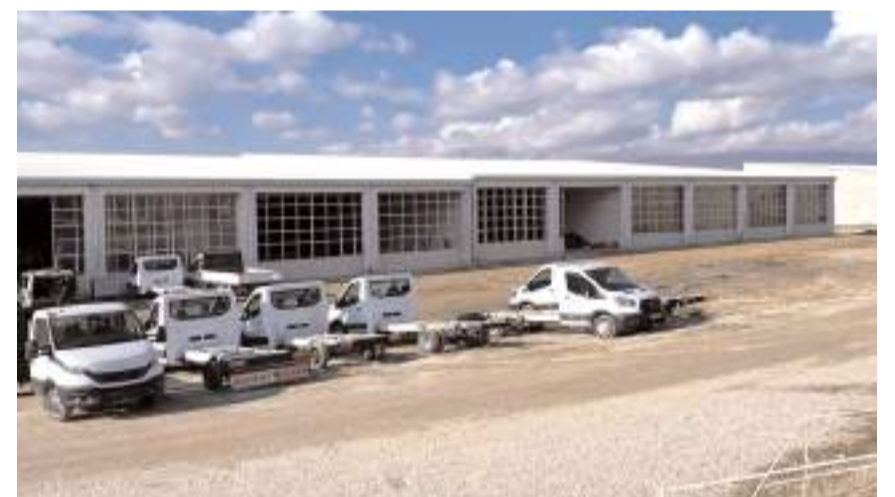
Kooperatif Milli Emlak'a ait yaklaşık 260 dönümlük araziyi satın alarak kapsama alanını genişletti.