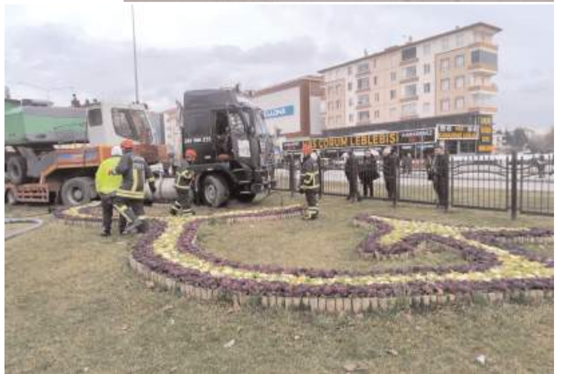
İş makinesi yüklü tır daha sonra çekici ile olay yerinden kaldırıldı.