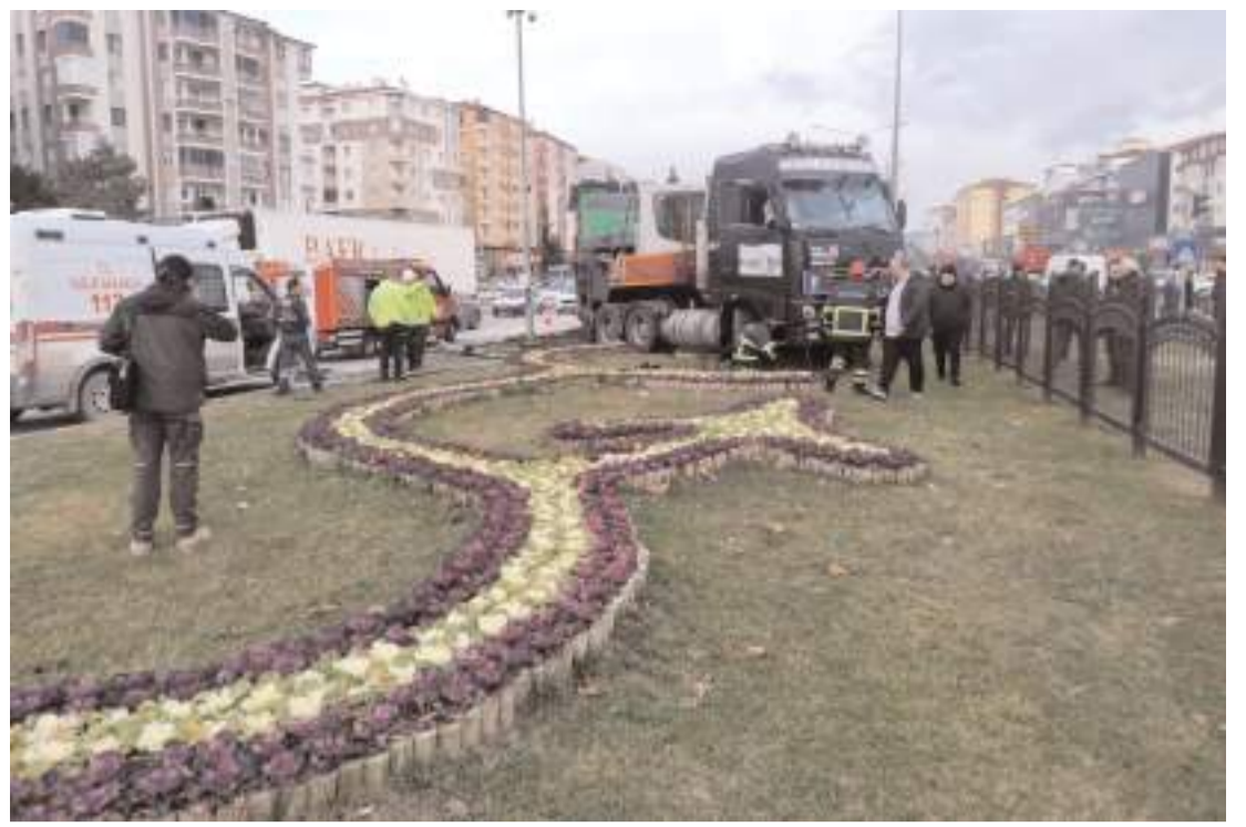
Kaza, İlim Yayma Kavşağı'nda meydana geldi.

Yapılan trafik kontrollerinde çeşitli suçlardan aranan 2 şahıs yakalanırken 3 adette ruhsatsız tabanca ele geçirildi. (Haber Merkezi)