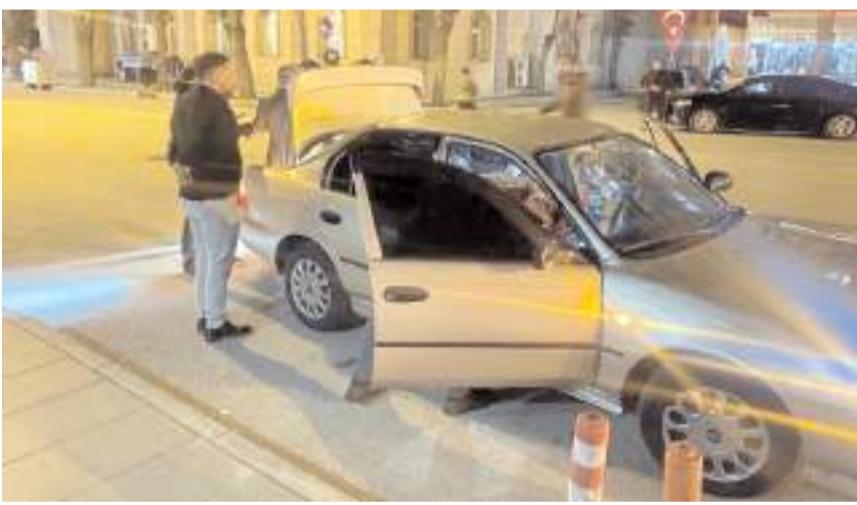
Aralık ayında 25 bin 826 araç kontrol edildi.