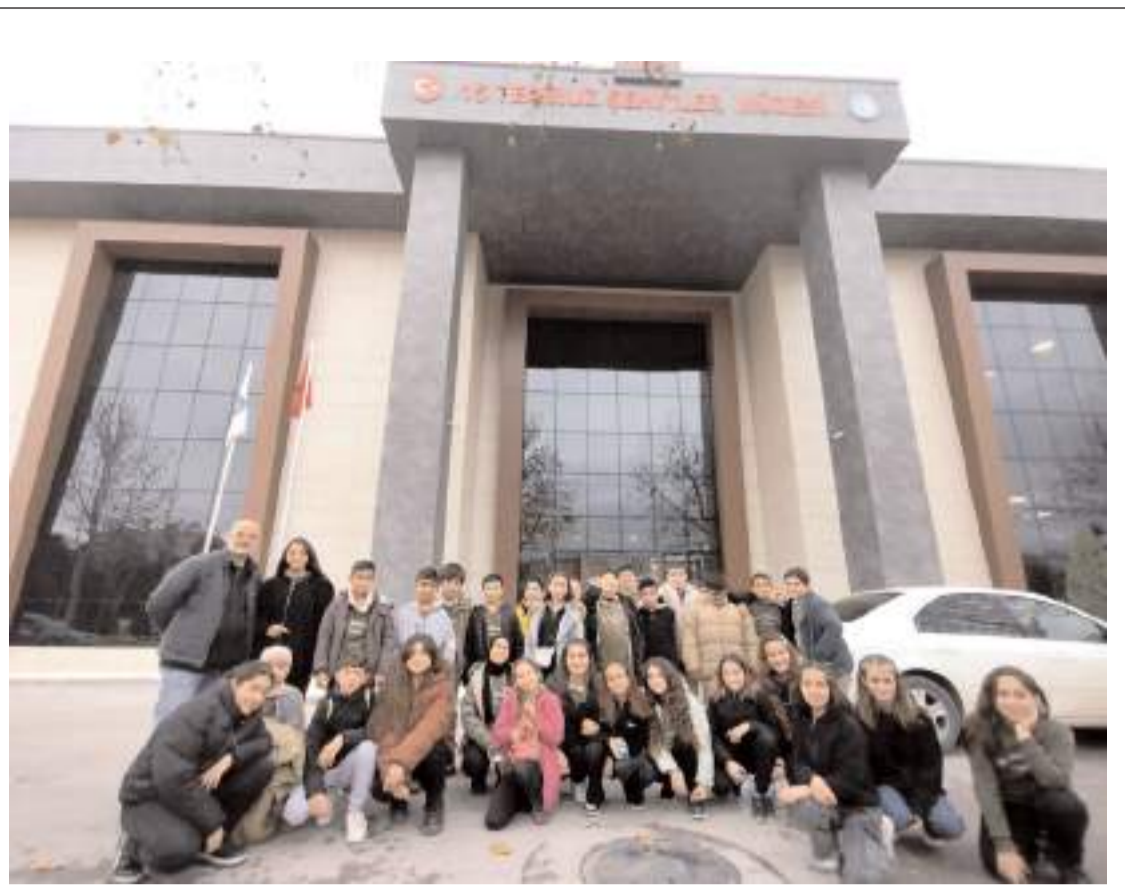
Öğrenciler 15 Temmuz Şehitler Müzesi önünde hatıra fotoğrafı çekindiler.

"Son iki senede en büyük 500 sanayi kuruluşu kârlarını dört kat arttırmıştır. GSYİH'de emekçilerin payı düşerken, sermayenin payı düzenli bir biçimde yükselmektedir. Hükümetin izlediği politikalar nedeniyle yükselen enflasyonu düşürmenin yolu, bunun yükünü emekçilere yüklemek, onların reel ücretlerini düşürmek değildir. Enflasyondan kazanıp kârlarına kâr katan sermaye, enflasyonu düşürmek için gerekli bedeli ödemeli, kârlarından taviz vermelidir. Şirketlerin aşırı kârları yüksek oranda vergilendirilmeli, elde edilen gelirler halkın artan yoksulluğuna bir nebze olsun telafi etmek için kullanılmalıdır. Ücretler hem özel sektörde hem de devlet işletmelerinde gerçek enflasyona göre arttırılmalıdır. Enflasyon düşürülmelidir. Ancak emekçileri yoksullaştırarak değil. Onları hayat pahalılığına karşı korumak suretiyle düşürülmelidir. Enflasyonun kazananı sermaye, enflasyonu düşürmenin yükünü üstlenmelidir. Elbette, ne hükümetin bunu kendiliğinden yapması ne de sermayenin tatlı kârlarından vazgeçmesi mümkündür. İşte bu nedenle, işçiler, emekçiler, enflasyon ve hayat pahalılığına karşı insanca bir yaşam, güvenceli bir gelecek için iş yerlerinde ve tüm yaşam alanlarında örgütlenerek mücadele etmeliyiz ve geleceğimizi kazanmalıyız." (Haber Merkezi)