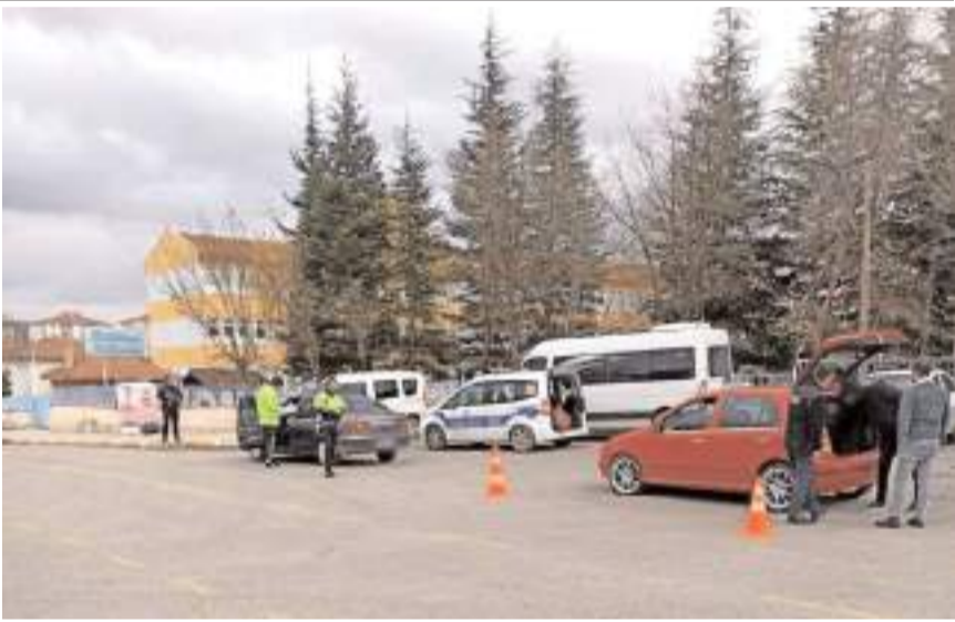
Polis ekipleri son bir haftada 1.991 şahıs sorguladı.

Uygulamalarda 10'u ruhsatsız tabanca, 6'sı kurusıkı tabanca ve 8'i tüfek olmak üzere toplam 24 adet ateşli silah, 69 adet tabanca fişegi ve 8 adet av fişegi olmak üzere toplam 77 adet fişek, 15 adet