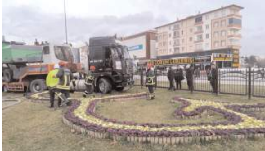
İş makinesi yüklü tır daha sonra çekici ile olay yerinden kaldırıldı.