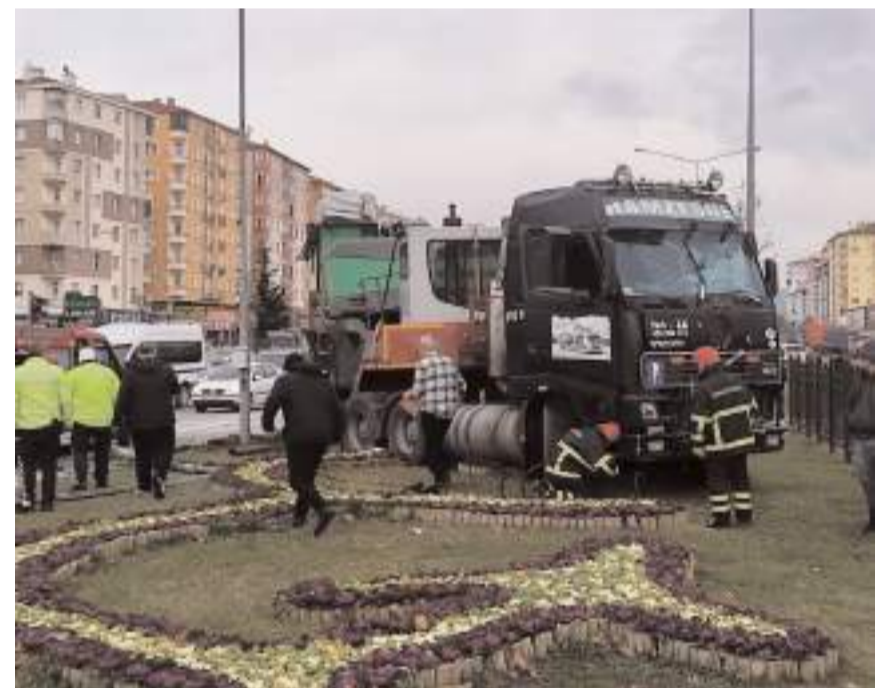
İtfaiye ekipleri araçta çıkan küçük çaplı yangını söndürdü.

Kaza nedeniyle Çevre Yolunda trafik bir süre dururken, tırın çekilmesinin ardından normale döndü.