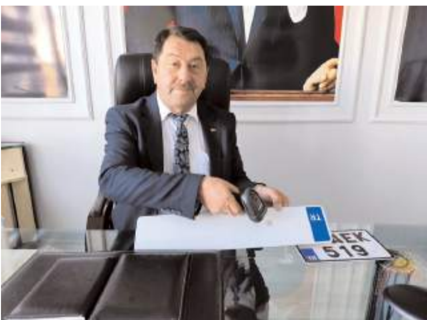
Yeni uygulama ile sahte plakanın önüne geçilecek.

Çorum'da taşıt plakalarında 1 Ocak 2024 tarihi itibarıyla yeni dönem başladı. Motorlu taşıt satışı ile devir ve tescilinden sonra yeni bastırılan plakalarda 'barkod/karekod' uygulaması hayata geçirildi.