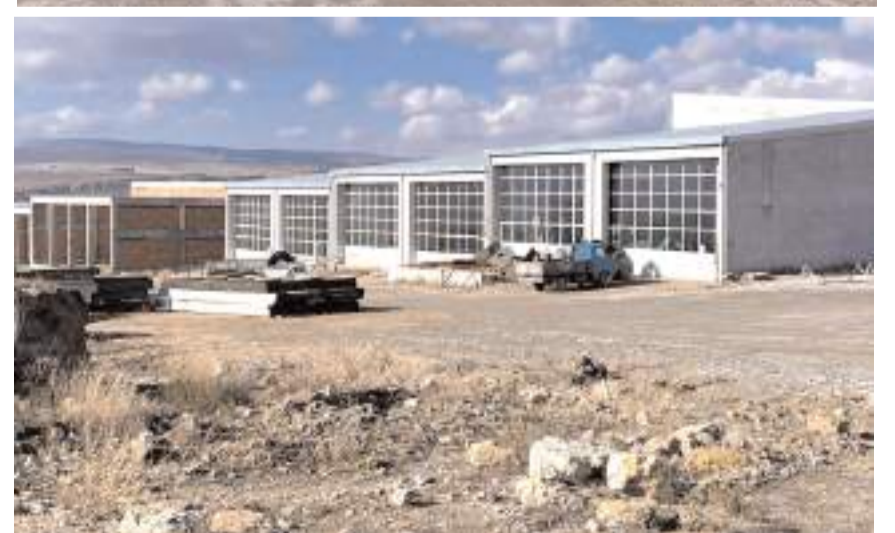
Yeni arazi ile birlikte kooperatifin kapsadığı alan yaklaşık 1000 dönüme ulaştı.