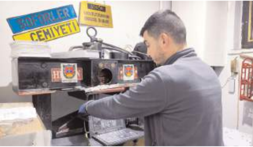
Şimdilik sadece yeni satışlarda plaka değişimi zorunlu hale geldi.