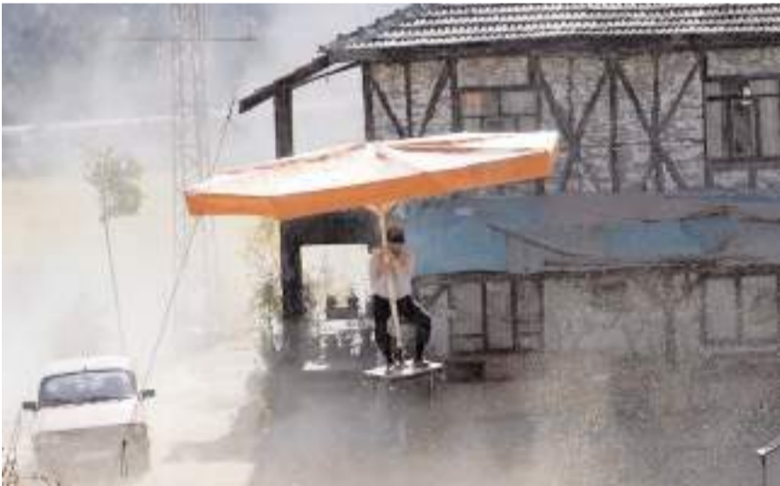
Filmin çekimleri Çorum'da yapıldı.