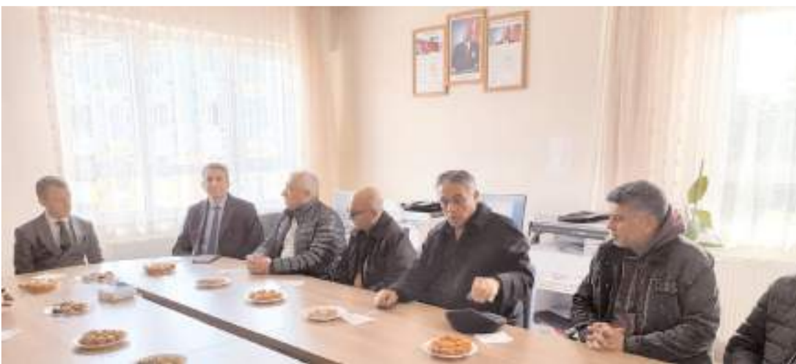
Açılışın ardından okul yönetimi çeşitli ikramlarda bulundu.