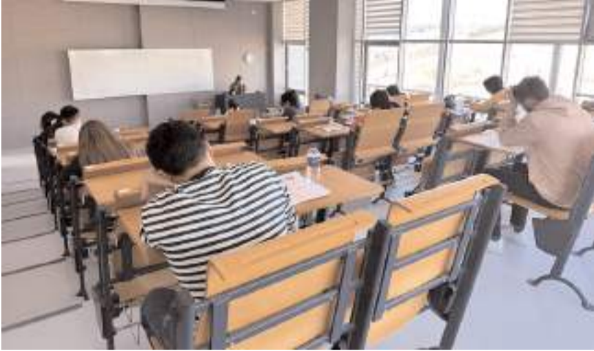
Deneme sınavına 365 öğrenci ve mezun katıldı.

Doç. Dr. Demire, adayların hazırlık eğitim videolarına Kariyer ve Mezunlar Ofisi web sayfası üzerinden erişebileceklerini aktardı. (Haber Merkezi)