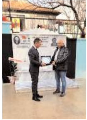
Çeşme düzenlenen törenle açıldı.

Okul Bahçesine yapılan çeşmenin üzerine Aşk olsun içenlere, rahmet olsun hakka göçenlere yazıldı. Açılışın ardından okul yönetimi tarafından öğretmenler odasında protokole çeşitli ikramlarda bulunuldu. (İHA)