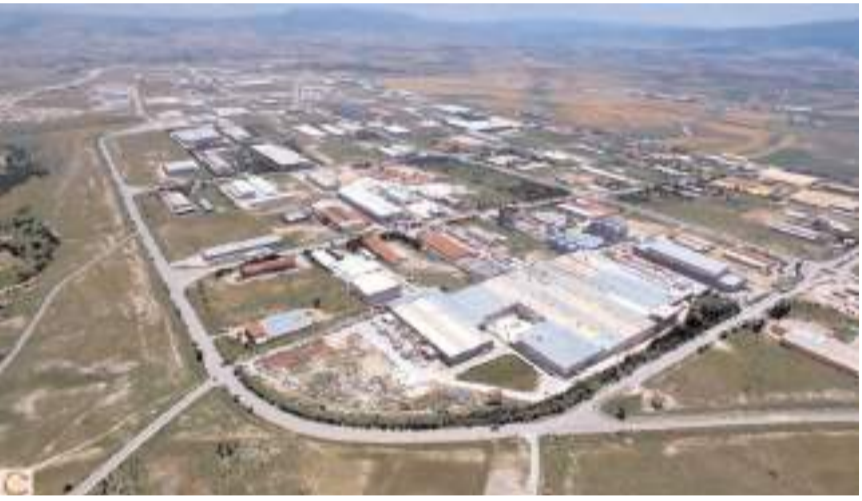
Çorum, en çok ihracat yapan ilk 20 il arasında yer aldı.