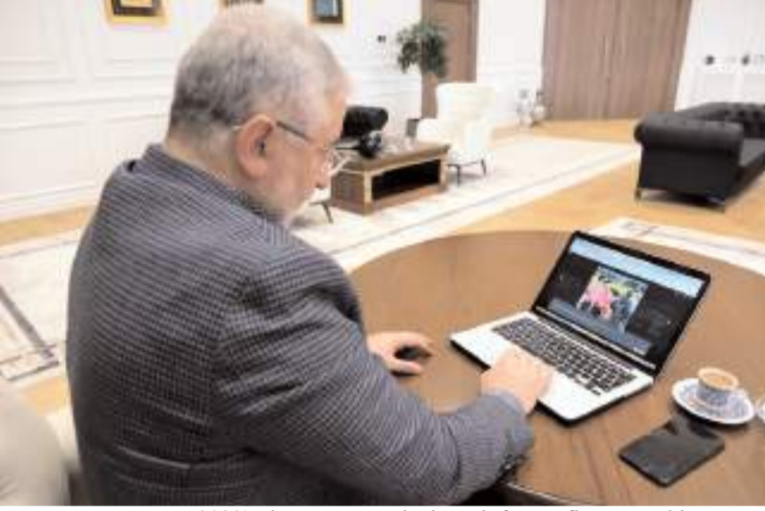
Başkan Aşgın, 2023'e damga vuran olaylara ait fotoğrafların yer aldığı "Yılın Kareleri 2023" oylamasına katıldı.

İnsanlık dramı yaşanan Gazze ile ilgili, "Gazze: Kanıt" başlığı altında oylama yapılmasından ötürü Anadolu Ajansı'nı tebrik eden Aşgın, "Çünkü orada insanlığa yönelik saldırı var. Her türlü yasaklı silahlar kullanılmakta. Bu anlamda tarihe not düşmek önemli. İnşallah İsrail uluslararası mahkemelerde yargılanacak ve yargılanırken de bu fotoğraflar mutlak delil olarak kullanılacak. Bu kategorideki her bir fotoğraf seçime değer." ifadelerini kullandı.(AA)