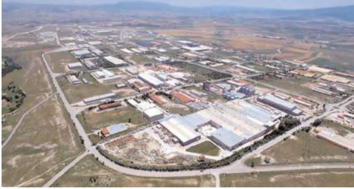
Çorum, en çok ihracat yapan ilk 20 il arasında yer aldı.