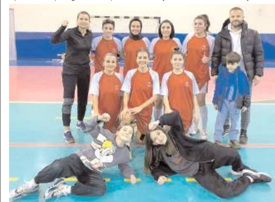
Çorum Milli Eğitim Müdürlüğü takımı yarı finali kazanarak finale yükselmeyi başardı