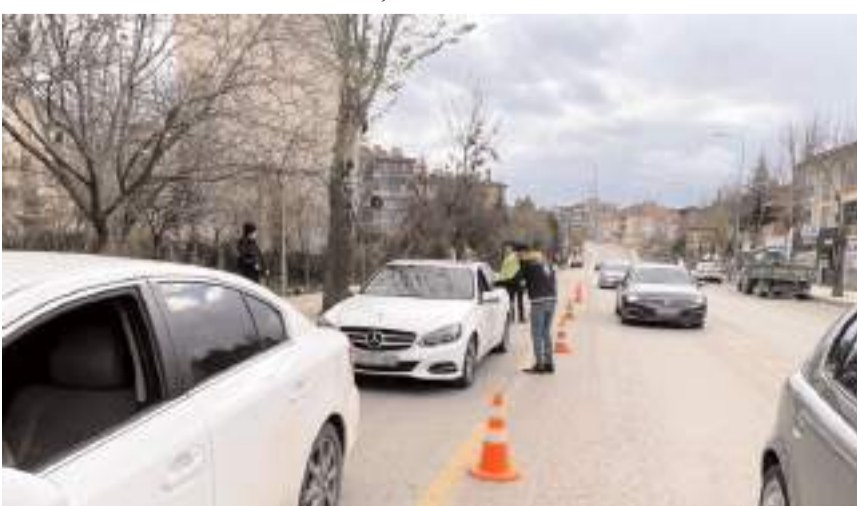
98 araç sürücüsüne seyir halinde cep telefonu kullanmaktan, ceza kesildi.

İl Emniyet Müdürlüğü, Aralık ayı trafik istatistiklerini açıkladı.