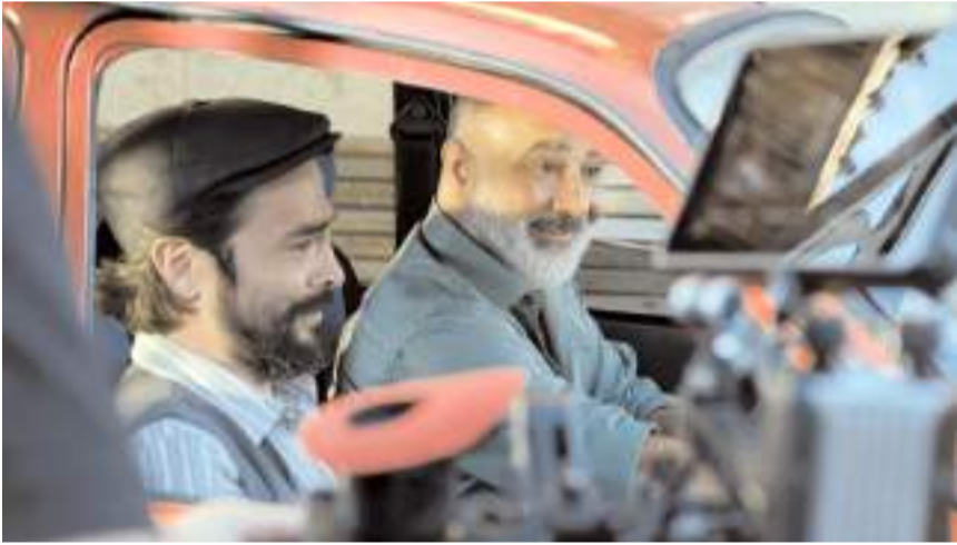
Film 2 Şubat'ta vizyona girecek.