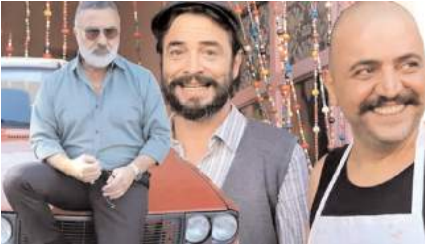
Filmde ünlü oyuncular rol aldı.

Çorum'da yaşayan 'Sadık' ve ailesi binlerce yıllık aile geleneği olarak yoğurtçuluk yapmakta, yoğurtlarının lezzeti ve şifasıyla bilinmektedirler. Bu efsane yoğurdun sırrı ise ailenin en büyüğü olan Dede tarafından saklanmakta ve yoğurtları o yapmaktadır. Ancak bir yaz günü dedenin evinin çatısına kar yağması her şeyi değiştirecektir... Efsaneye göre sırta sahip olanın çatısına yaz günü kar yağarsa o sır başkasına aktarılmalı, aileden başka birine el verilmelidir. Eğer verilmezse, ailenin başına büyük felaketler gelecek ve helak olacaklardır. Bir an önce el verilmesi için Yoğurtçuoğlu ailesinin tüm fertleri bir araya gelmelidir. Buna 'Sadık'ın İstanbul'da yaşayan ve ailesiyle görüşmeyen ikiz kardeşi 'Özgür'de dâhildir. İkiz kardeşler 'Sadık' ve 'Özgür' binlerce yıldır nesilden nesile aktarılan efsane yoğurdun sırrını Dede'lerinden alabilmek için amansız bir mücadeleye girişeceklerdir.