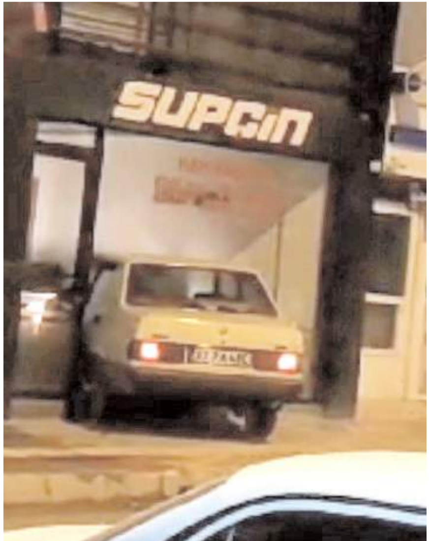
Kazada otomobil ile iş yerinde maddi hasar meydana geldi.

Kaza anı ise o sırada orada bulunan bir kişinin cep telefonu kamerasına saniye saniye yansdı. Görüntülerde otomobilin kaldırırma çıktığı, ardından ise işyerine girdiği, işyerinin camlarının kırıldığı, sürücünün otomobili ile geri manevra yaparak çıktıktan sonra olay yerinden uzaklaştığı ve ofis malzemelerinin hasar gördüğü yer alıyor. (İHA)