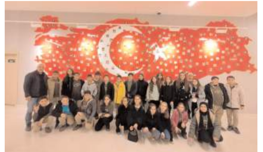
Öğrenciler 15 Temmuz Şehitler Müzesini gezdi.