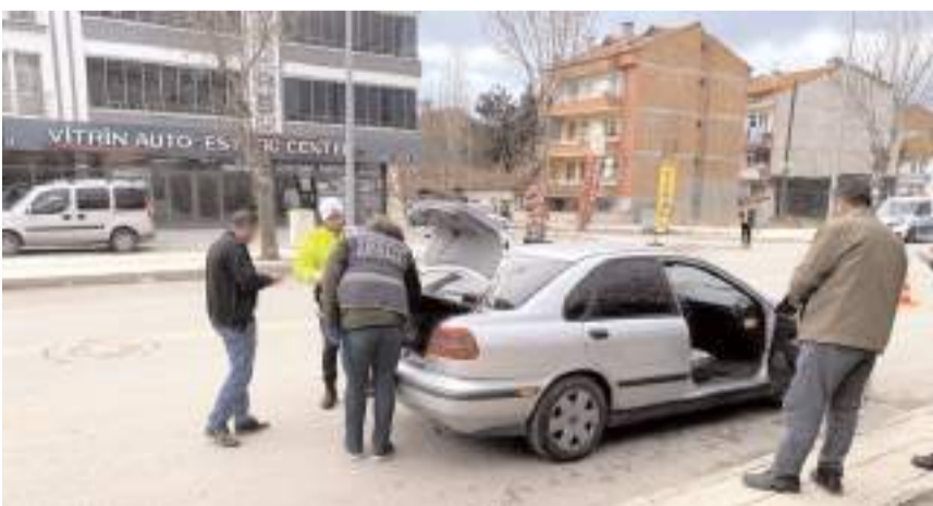
4 bin 088 araç sürücüsüne ceza kesildi.