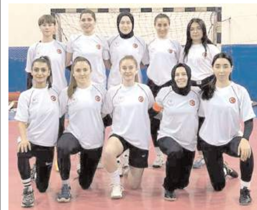
Şehit Erol Olçok Eğitim ve Araştırma Hastanesi yarı finali kazanarak finale yükseldi

Bu maçın ardından saat 20'de ise Eğitim ve Araştırma Hastanesi ile Milli Eğitim Müdürlüğü takımları turnuvanın ilk şampiyonu olmak için karşılaşacaklar. Bu maçın ardından düzenlenen törenle takımlara kupa sporculara ise madalyaları verilecek.