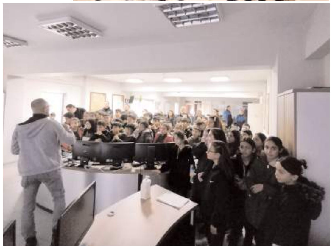
Öğrenciler İl Emniyet Müdürlüğü binasını gezdiler.