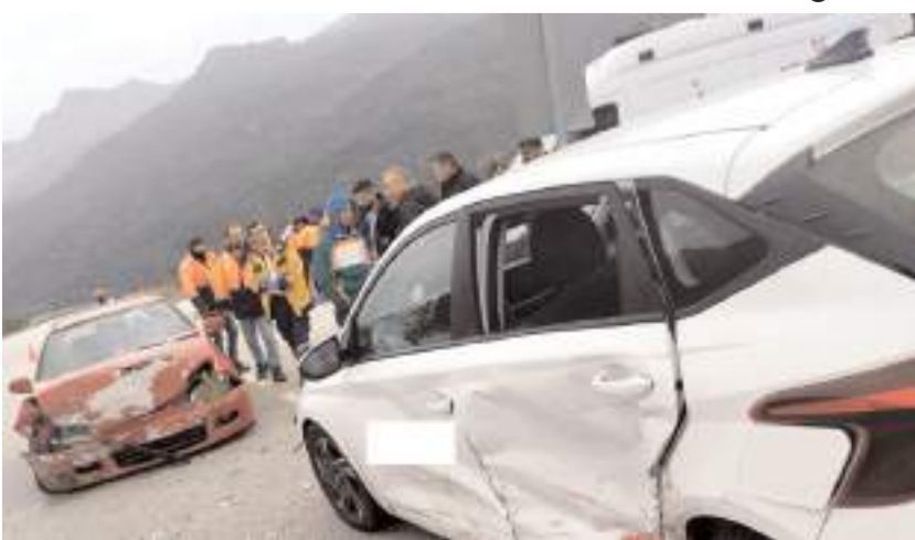
Kaza Osmancık'ta meydana geldi.