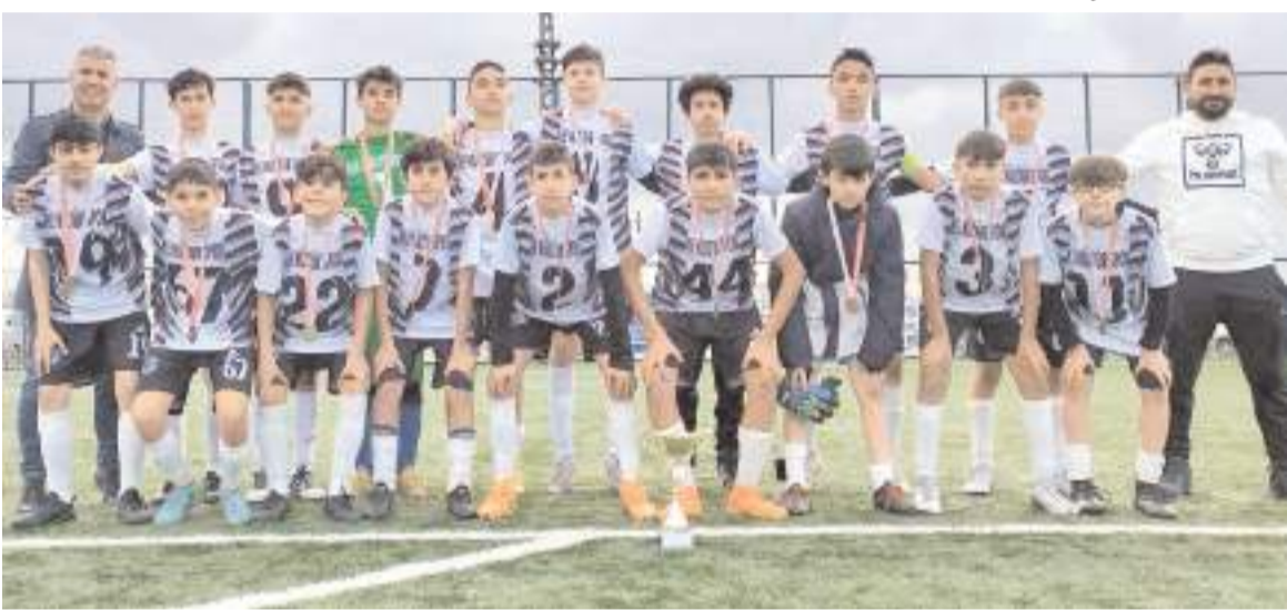
Yıldızlar futbolunda şampiyon olan Yavruturna Ortaokulu kupa töreni sonrasında idareci ve antrenörleri ile birlikte

taokulu büyük sevinç yaşadı. Final maçının ardından düzenlenen törenle yıldızlar futbolunda dereceye giren okullara kupa ve sporculara madalyaları verildi. Yavruturna Ortaokulu gruplarda ilimizi temsil edecek.