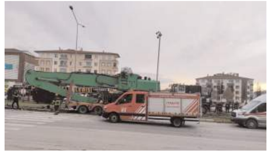
Olay yerine polis, sağlık ve itfaiye ekipleri sevk edildi.

Çorum'da freni arızalanan tır, refüje çıktı. Kazada iki kişi hafif yaralandı.