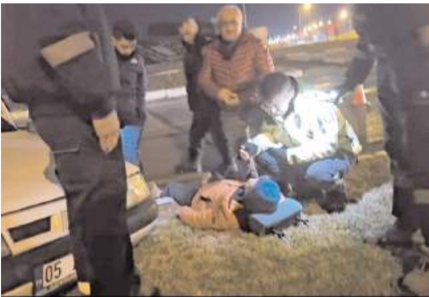
Yaralanan sürücüye ilk müdahaleyi polis ekipleri yaptı.

Yaralıları, sağlık ekiplerince Hitit Üniversitesi Erol Olçok Eğitim ve Araştırma Hastanesine kaldırıldı.(AA)