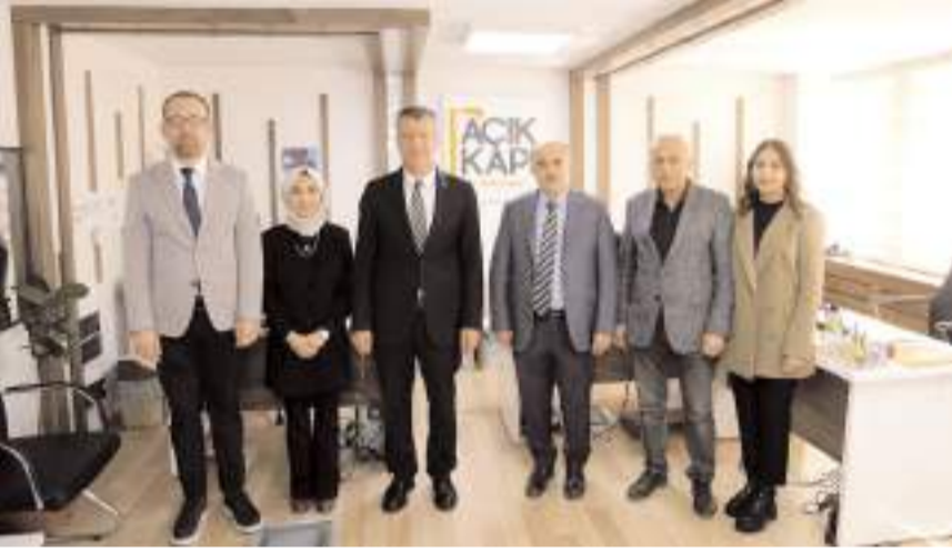
Açık Kapi Şube Müdürlüğü Valilik Ek Bina-1 giriş katında faaliyet gösteriyor.