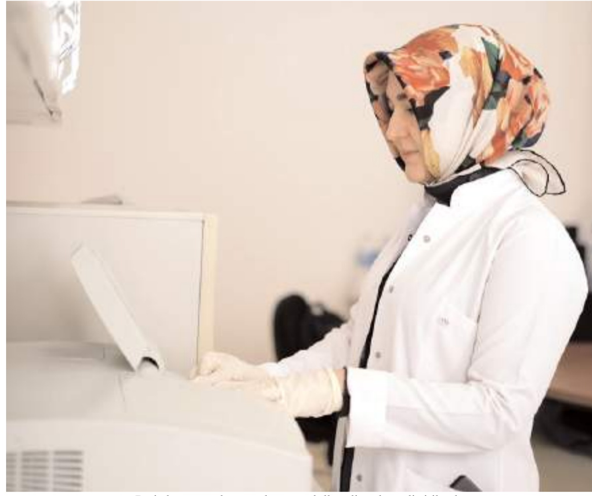
Proje kapsamında, nano boyutta akıllı polimerler geliştirilerek, çevre kirlenmelerin kadın üreme sağlığı üzerindeki etkileri araştırılacak.