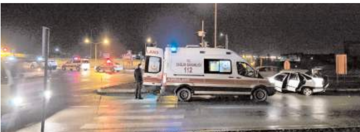
Kaza nedeniyle kavaştta trafik bir süre kontrollü olarak verildi.