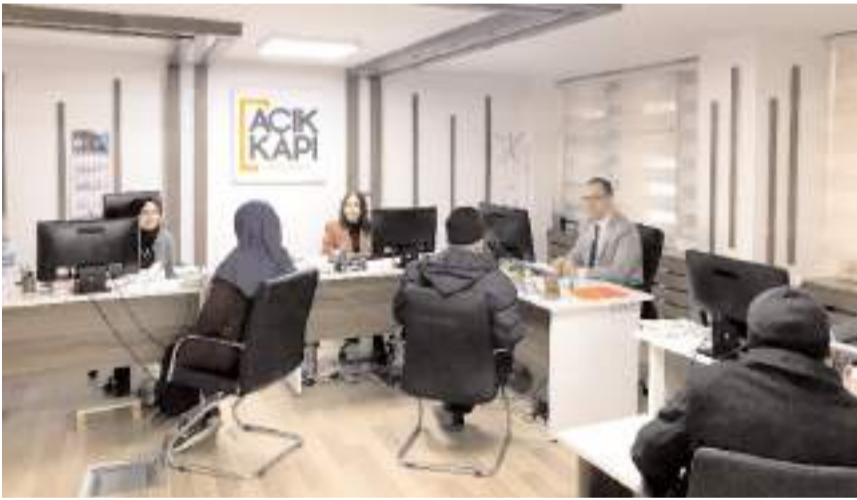
Açık Kapi Bürolarından yönlendirilen başvurular ilgili kurum tarafından en geç 7 iş günü içerisinde cevaplandırılıyor.