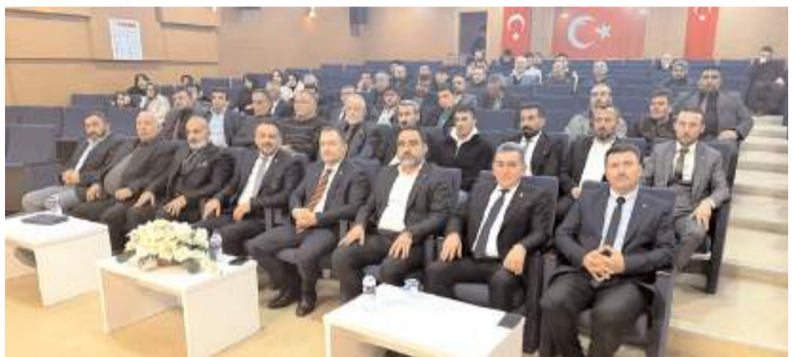
Toplantıda yerel seçimler ile ilgili yapılan çalışmalara görüldü.