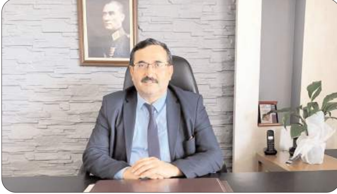
Ziraat Odası Başkanı

Her zaman ve her koşulda Çorum çiftçisinin yanında yer alarak Çorum'un tarım alanında Türkiye'de söz sahibi iller arasında olması için gecesini gündüzüne katan ve en son Tarım ve Orman Bakanlığınca kayıt dışı hisseli veya kaydı olmayan çiftçilerin kayıt altına alınması ve desteklerden yararlandırılması amacıyla oluşturulan Çiftçi Kayıt Sistemini'ne başvurular sırasında çiftçilerle bizzat yakından ilgilenen, çiftçilerle birlikte yürüyen, son 1 ay içerisinde başvuruları yetiştirmek ve üreticileri mağdur etmemek amacıyla yoğun bir tempoda hizmet veren, mesai mefhumu gözetmeksizin, hakkaniyetli bir şekilde çalışan, tüm çiftçilerin talebine kulak veren değerli ağabeyim