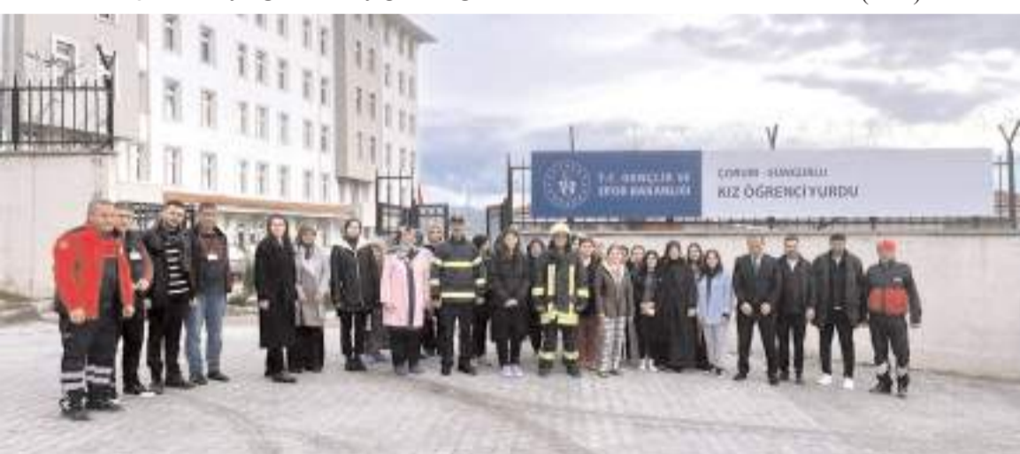
Tatbikatın ardından toplu hatıra fotoğrafı çekildi.

Kredi ve Yurtlar Genel Müdürlüğüne bağlı Sungurlu Yurt Müdürlüğü'nde yangın tahliyesi ve tatbikatı gerçekleştirildi.