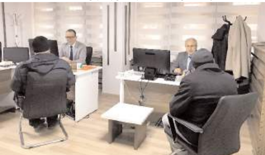
Açık Kapi Bürolarına kurulduğu günden bugüne kadar 38 bin 370 başvuru ulaştı.