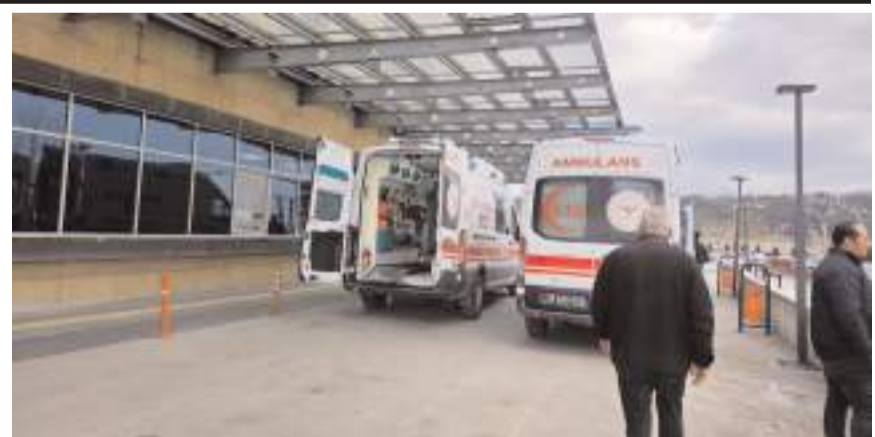
Yaralı sürücü hastanede tedavi altına alındı.

Kamyonetin el frenini çekmeyi unuttuğu belirlenen Reha B'nin bacaklarında kırıklar oluştuğu öğrenildi.(AA)