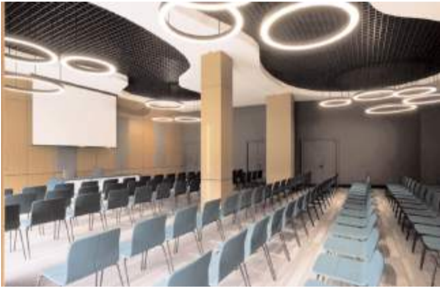
Merkezin ihalesi 25 Ocak 2024 tarihinde gerçekleştirilecek.