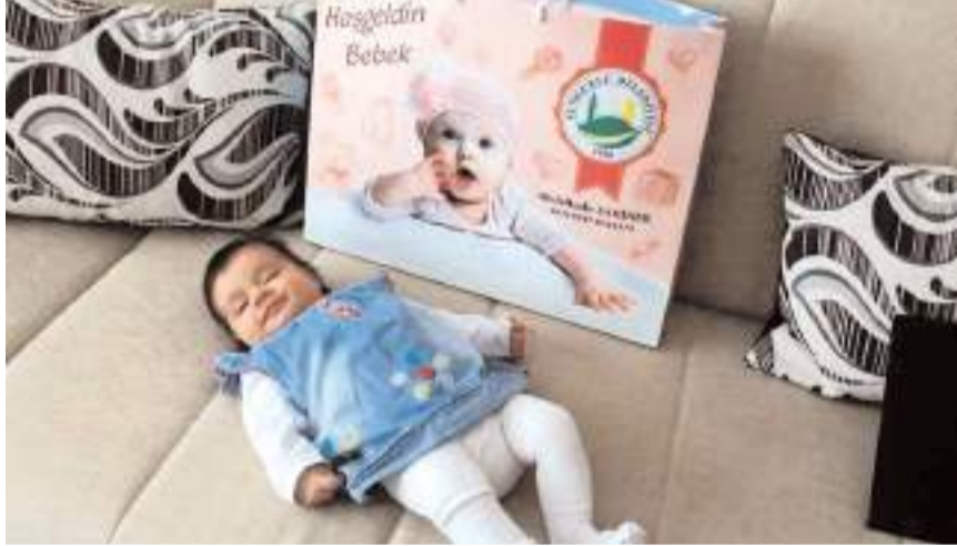
Sungurlu Belediyesinin "Hoş Geldin Bebek Projesi" devam ediyor.