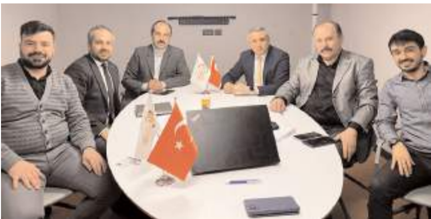
Ziyarette HalkEt ürünlerinin 2024 yılında da Tarım Kredi Marketlerde satılması konusu görüşüldü.

Bademli'ye misafirperverlikleri için şükranlarını sunuyorum. İnşallah Halk Et olarak 2024 yılında da ülkemizin hemen hemen