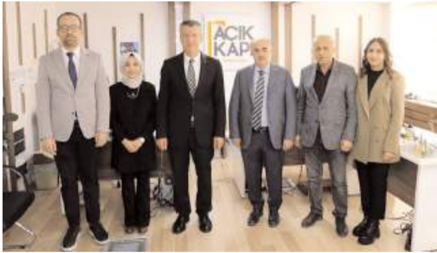
Açık Kapı Şube Müdürlüğü Valilik Ek Bina-1 giriş katında faaliyet gösteriyor.

Valilik bünyesinde faaliyetlerini yürüten Açık Kapiya 2023 yılında il genelinde toplam 5 bin 313 başvuru yapıldı.