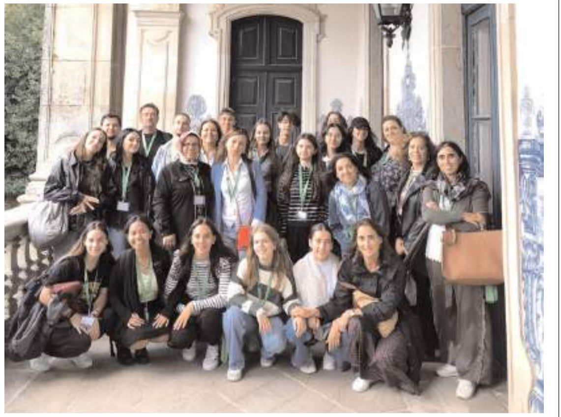
Atatürk Anadolu Lisesi'nin de paydaşı olduğu Erasmus+ projesinin ilk ayağı tamamlandı.

Protokol kapsamında Sosyal Yardımlaşma ve Dayanışma Vakfında bulunan İş ve Meslek Danışmanlarının işe yönlendirdiği kişilerden işe başlayanlara işe yönlendirme yardımı ve belirli bir süre iş hayatında kalanlara ise işe başlama yardımı Sosyal Yardımlaşma ve Dayanışma Vakfı tarafından verilecek. (Haber Merkezi)