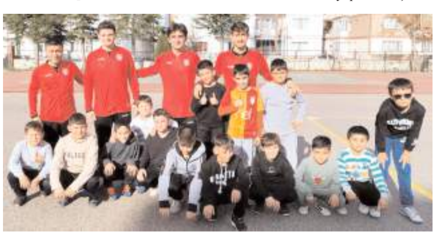
Gülabibeyspor futbolcular Mehmet Akif Ersoy Ortaokulu öğrencileri ile