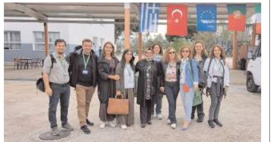
Proje kapsamında iklim değişikliği ve küresel ısınmanın önlenmesine yönelik faaliyetler yapıldı.

özelliklere sahip akranlarıyla bir araya gelerek deneyimlerini paylaşarak küresel bir bakış açısı da kazandılar.