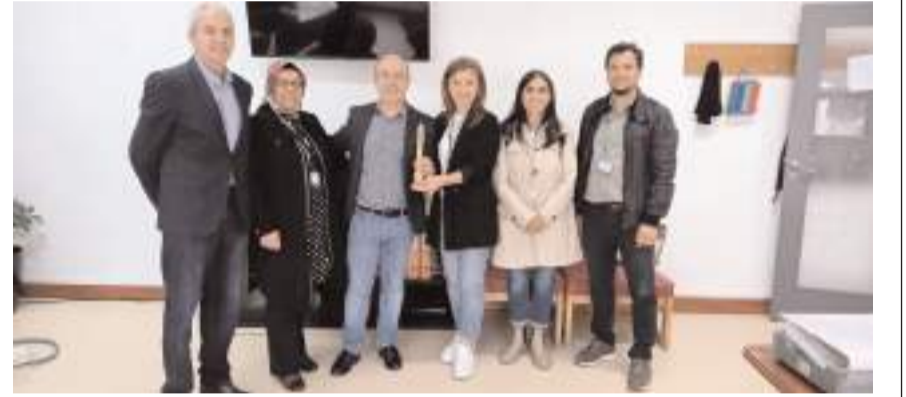
Erasmus+ projesinin ilk uluslararası çalışması Portekiz'de gerçekleştirildi.

Katılımcılar, aynı zamanda farklı kültürel