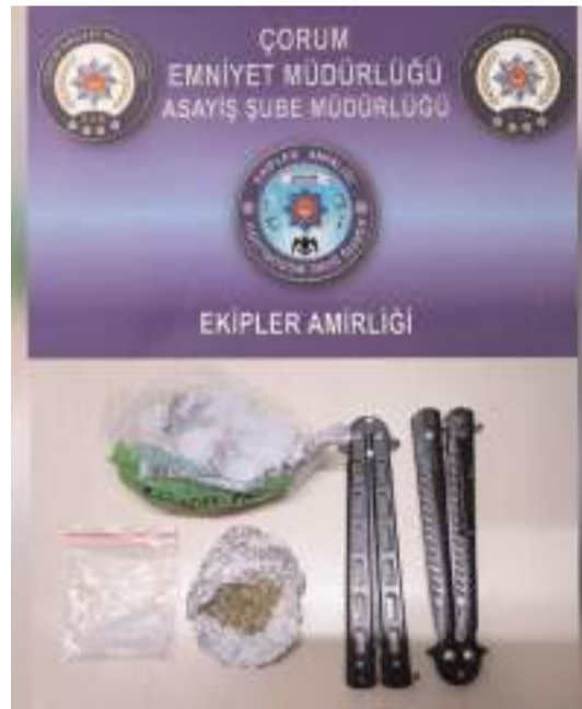
Denetimlerde uyuşturucu madde ile 17 adet ateşli silah ele geçirildi.

mak üzere toplam 17 adet ateşli silah, 10 adet kesici ve delici alet, 178 adet tabanca fişegi, 195 adet sentetik ecza maddesi, 86 gr. metamfetamin maddesi, 13 gr. esrar maddesi, 1 gr. bonzai maddesi, 1 adet hassas terazi, 2 adet uyuşturucu madde aparatı ele geçirildi. (Haber Merkezi)