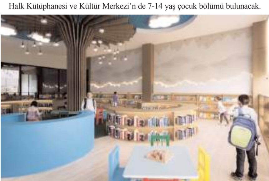
Merkezin 2025 yılında bitirilmesi planlanıyor.