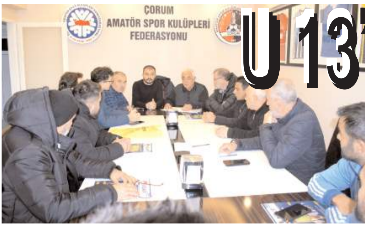
Üç kategorinin teknik toplantısına taban birlikleri temsilcileri ve mücadele edecek kulüpler katıldılar