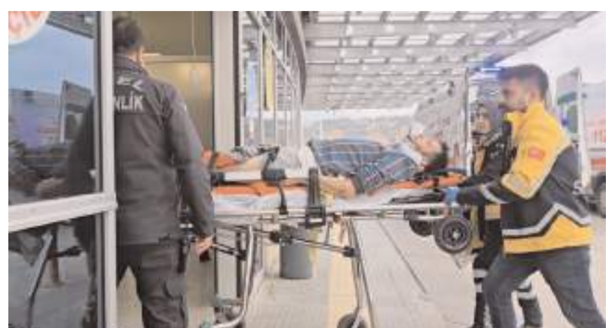
Reha B'nin bacaklarında kırıklar oluştuğu öğrenildi.