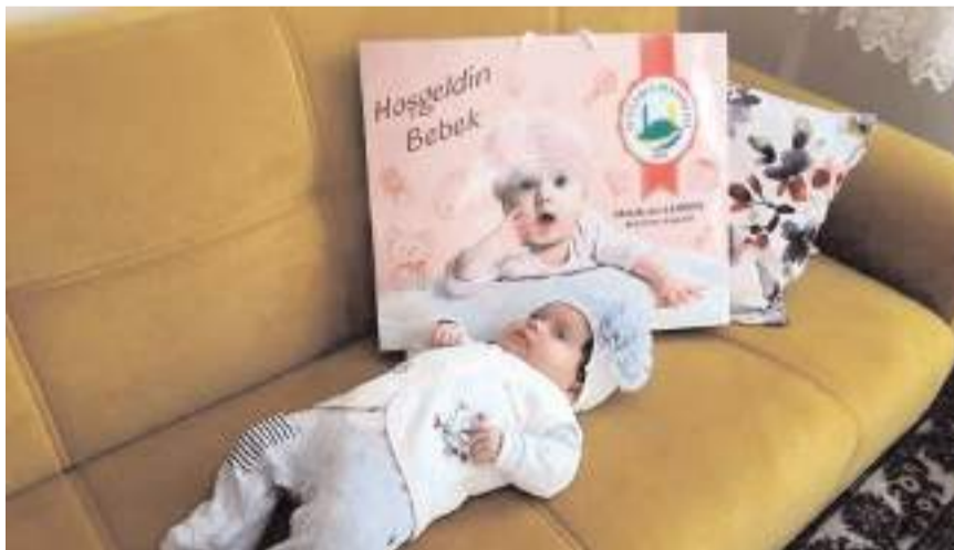
Proje kapsamında 2023 yılında 277 bebeğe ulaşıldı.