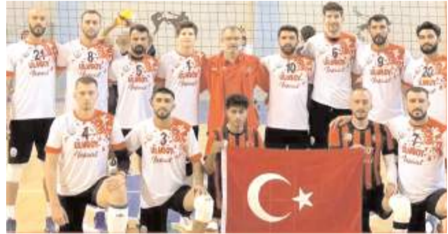
Sungurlu Belediyespor play-off için kritik maça Maliye Voleybol'u konuk edecek