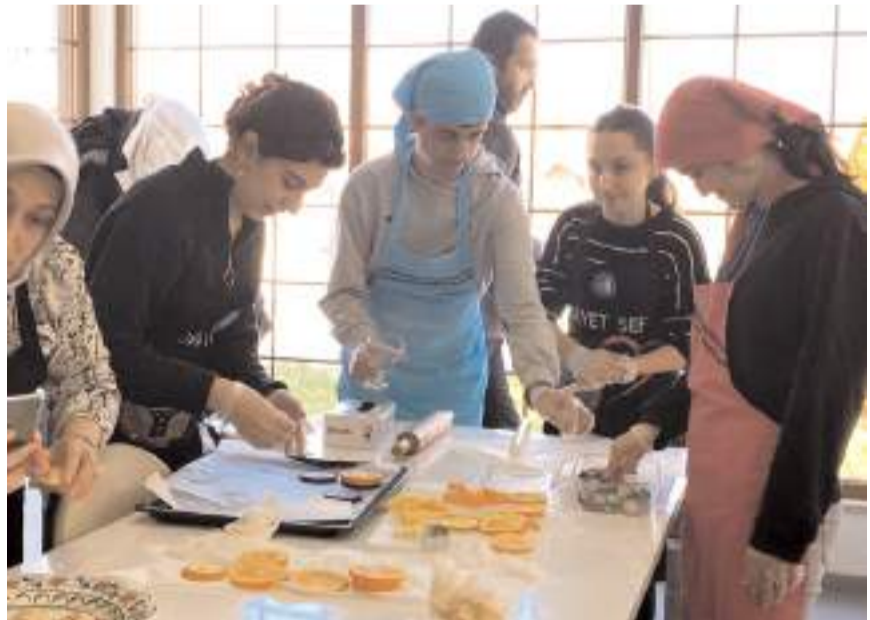
Etkinlik, Hitit Üniversitesi Sağlık Bilimleri Fakültesi Beslenme ve Diyetetik Bölümü, Beslenme ve Diyetetik Kulübü öğrencileri rafine şekersiz ve yulafli kurabiyeler yaptılar.