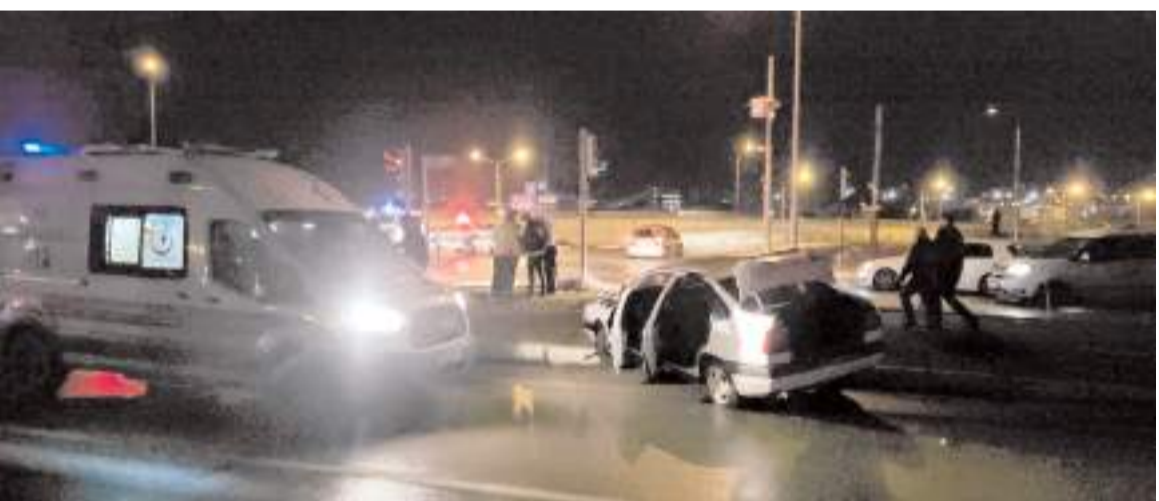
Kaza Burunçiftlik Kavşağı'nda meydana geldi.

ekipleri sevk edildi. Sağlık ekiplerince Sungurlu Devlet Hastanesi'ne kaldırılan yaralı, buradaki müdahalenin ardından Hitit Üniversitesi Erol Olçok Eğitim ve Araştırma Hastanesi'ne sevk edildi.(AA)