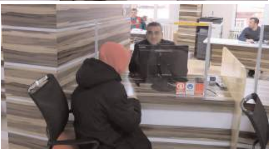
SYDV içerisinde İŞKUR'da görevli İş ve Meslek Danışmanları görev yapmaya başladı.

Çorum Çalışma ve İş Kurumu İl Müdürlüğü (İŞKUR) Çorum Sosyal Yardımlaşma ve Dayanışma Vakfı (SYDV) arasında imzalanan işbirliği protokolü kapsamında yeni bir uygulama hayata geçirildi.