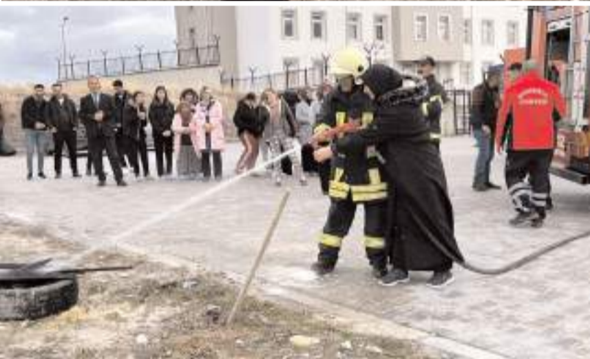
Öğrencilere yangına nasıl müdahale edecekleri uygulamalı olarak gösterildi.