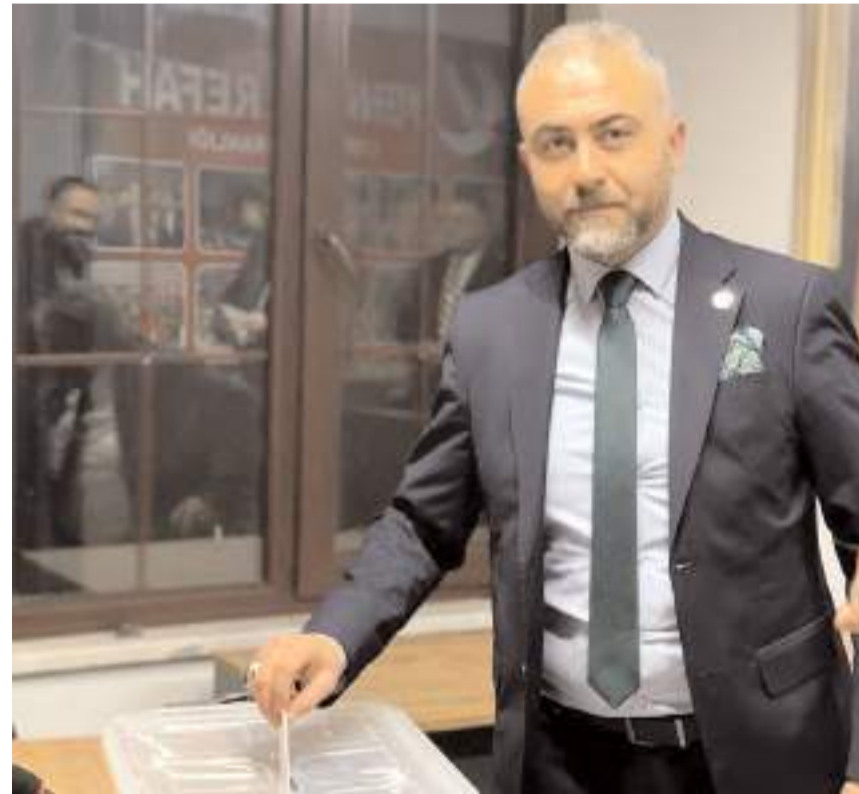
Yeniden Refah Partisi İl Teşkilatı, Osmancık adayı için sandığa gitti.

Partiden yapılan açıklamada, ilerleyen günlerde ise Çorum merkez aday adayları için temayül yoklaması yapıp aday adaylık sürecinin tamamlanacağı belirtildi. (Haber Merkezi)