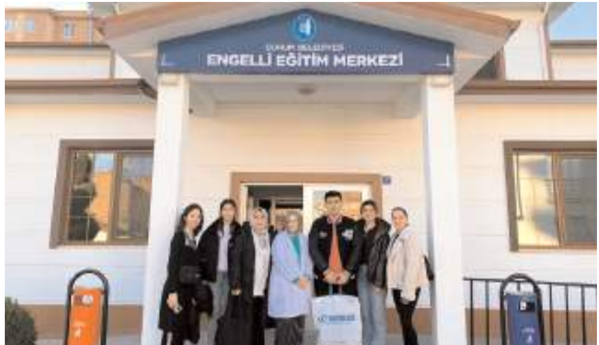
Programın sonunda hatıra fotoğrafı çekildi.

Hitit Üniversitesi öğrencileri, Çorum Belediyesi Engelli Eğitim Merkezinde özel bireyler için kurabiye yaptı.