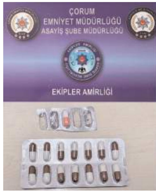
17 adet ateşli silah, 10 adet kesici ve delici alet, 178 adet tabanca fişegi, 195 adet sentetik ecza maddesi, ele geçirildi.