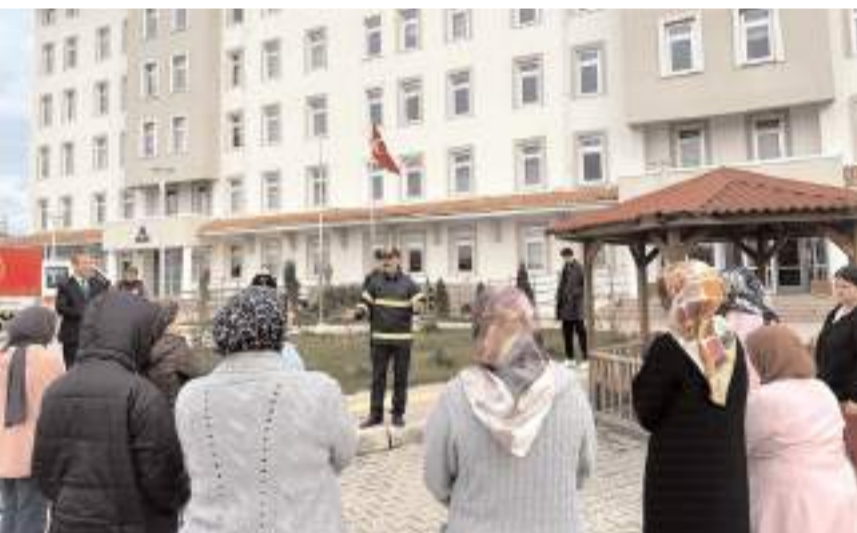
Öğrencilere yangın anında yapılması gerekenler anlatıldı.