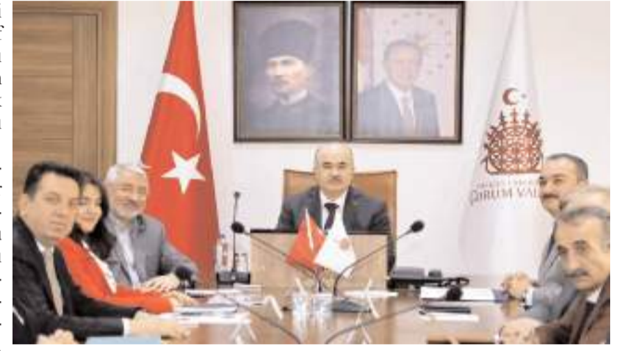
Toplantıda, tesisin yapım amacı, son durumu ve tamamlandıktan sonra yapılacak faaliyetler değerlendirildi.