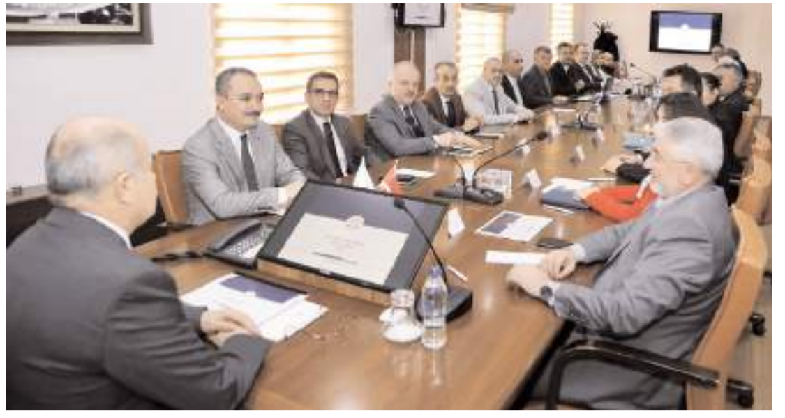
Toplantı Vali Doç. Dr. Zülkif Dağlı'nın başkanlığında yapıldı.

Açık Kapi Sistemine 2023 yılında il genelinde toplam 5 bin 313 başvuru yapılırken kurulduğu günden bugüne kadar toplam başvuru sayısının 38 bin 370'e ulaştığının belirtildiği açıklamada, "2023 yılı içerisinde Valiliğimizde 46 Halkla Buluşma Günü Toplantısı düzenlenerek toplantılara katılan 450 vatandaşımız talep, öneri ve şikâyetleri doğrultusunda ilgili birimlere gereği için yönlendirilmiştir. Ayrıca yıl boyunca açık kapiya bizzat gelen bütün vatandaşlarımızla talep, öneri ve şikâyetleri ile ilgili yüz yüze görüşme yapılarak, birbirine ilgilendirilmiştir. "Açık Kapi, Milletin Kapısı" sloganıyla şikâyet, talep ve önerisi olan tüm vatandaşlarımızı derlerine çözüm ortağı olabilmek için Valiliğimiz Ek Bina-1 giriş katında hizmet veren Açık Kapi Şube Müdürlüğüne bekliyoruz" ifadelerine yer verildi. (Haber Merkezi)