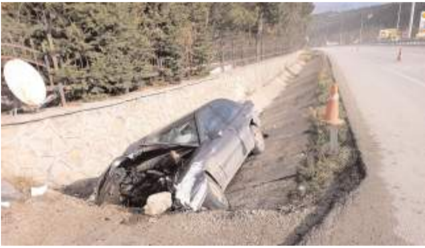
Kaza Bölge Trafik Denetleme Şube Müdürlüğü önünde medyana geldi.

Çorum'da otomobilin şarampole devrildiği kazada 1 kişi yaralandı.