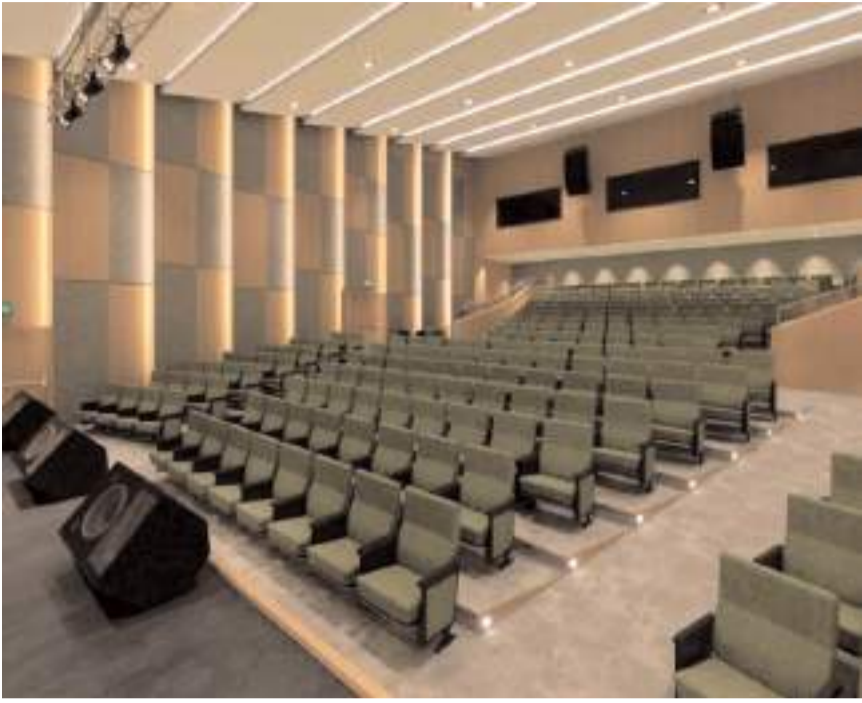
Osmanlıcık'a Halk Kütüphanesi ve Kültür Merkezi yapılacak.