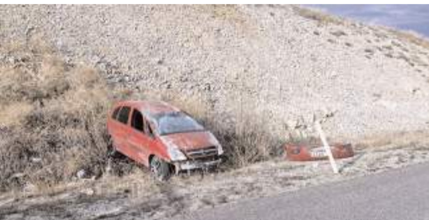
Kazada otomobilde maddi hasar meydana geldi.

Kazayla ilgili olarak başlatılan tahkikatın devam ettiği bildirildi.