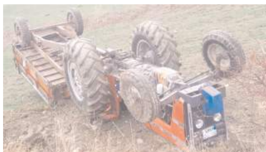
Kaza Küçük Polatlı köyü yakınlarında meydana geldi.

Sungurlu'da traktörün devrilmesi sonucu 1 kişi yaralandı.