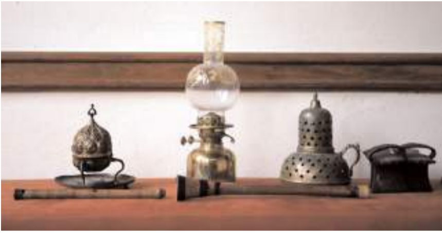
Han'da Çorum'un geçmişini yansıtan eserler sergilenecek.

namiklerini, birikimini yansıtan muazzam bir yere dönüşecek." ifadelerini kullandı.