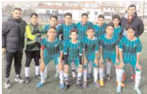
Mimar Sinan U 14 takımı final grubu mücadelesi veriyor

Haftanın Maçları : Gençlerbirliği - Maviay Gençlikspor. Sungurlu Belediyespor- Vefa Gençlikspor. Mecitözü Gençlerbirliği- İskilipspor. Osmancık Belediyespor-Vefa Devanespor. Mimar Sinan- Hattuşa Gençlikspor. Çorum Anadolu FK- Osmancık Kandiberspor. Çorumspor- HE Kültürspor. Kargıgücüspor- 1907 Gençlikspor.