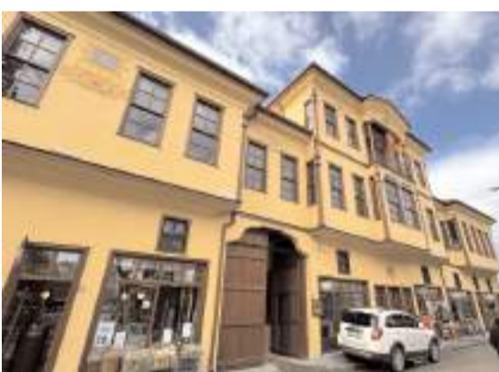
Velipaşa Hanı, Çorum Belediyesince restore edilerek turizme kazandırıldı.