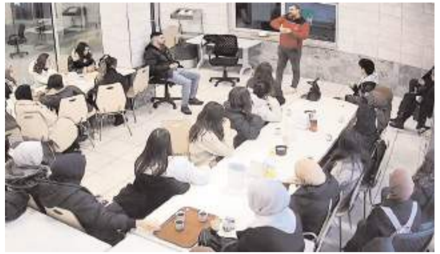
Eğitime Hitit Üniversitesi Beslenme ve Diyetetik Bölümü öğrencileri katıldı.

Çorum Belediyesi Halk Et Kombinası kapılarını üniversite öğrencilerine açtı. Hitit Üniversitesi Beslenme ve Diyetetik Bölümü öğrencileri, "Et ve Et Ürünleri" konusunda Halk Et Kombinasında uygulamalı ders işledi.