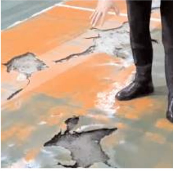
Tahtasız Spor Salonunun zeminin içler acısı halini gösterdi

Ayrıca okulun bahçesinin de kötü durumda olduğunu ifade eden CHP Çorum Milletvekili Tahtasız, "Okulun yıkılan eski binasının yerine anaokulu yapılacak. Ancak inşaat atıkları okulun bahçesinde. Okulun spor salonunun yanında bahçenin de düzenlenmesi gerekiyor" dedi.