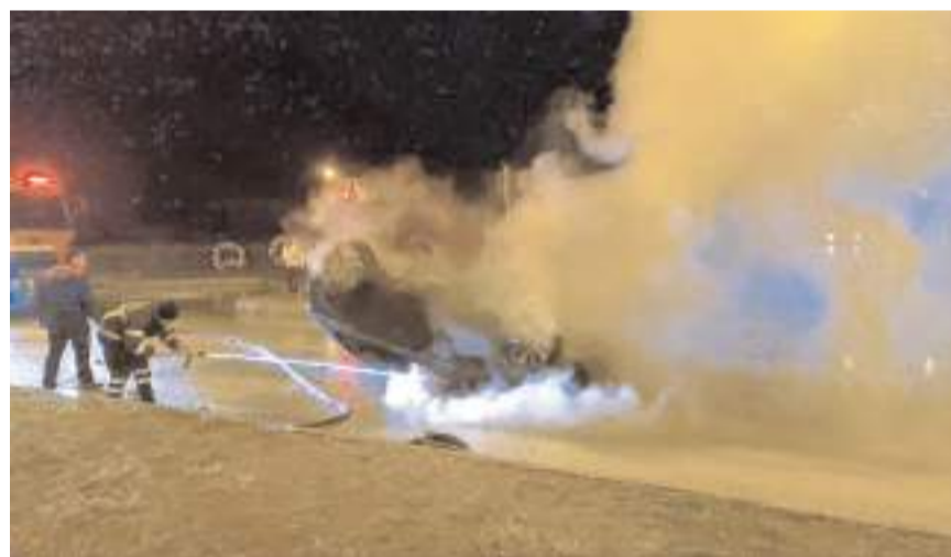
Araçta çıkan yangını itfaiye ekipleri söndürdü.

İhbar üzerine kaza yerine polis, itfaiye ve sağlık ekipleri sevk edildi.