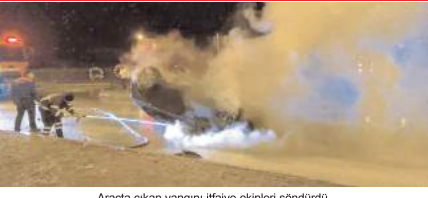
Araçta çıkan yangını itfaiye ekipleri söndürdü.

■ Alaca ilçesinde takla atıktan sonra yanmaya başlayan otomobildeki 2 kişi yaralandı. * HABERİ'4'TE