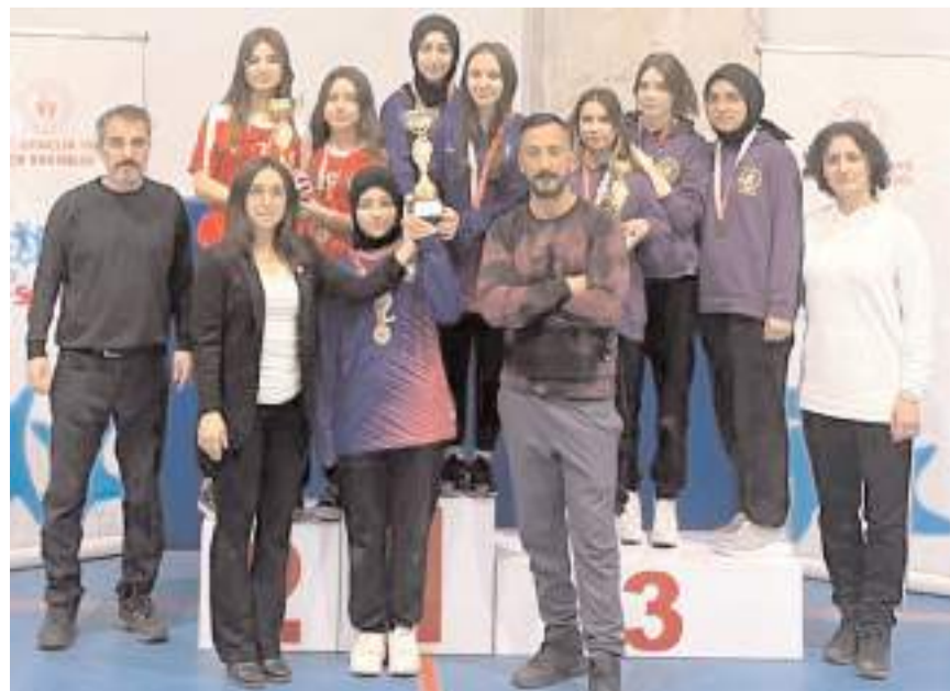
Floor Corling'de dereceye giren okullar kupa töreni sonrasında toplu halde