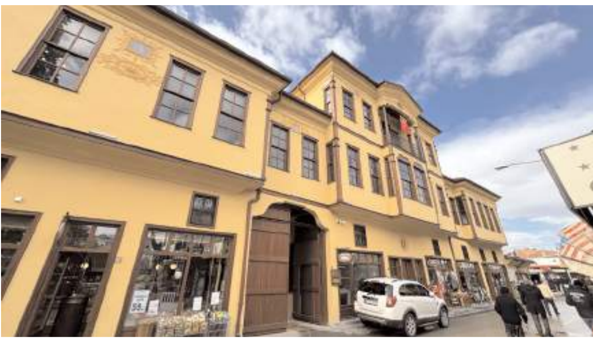
Velipaşa Hanı, Çorum Belediyesince restore edilerek turizme kazandırıldı.