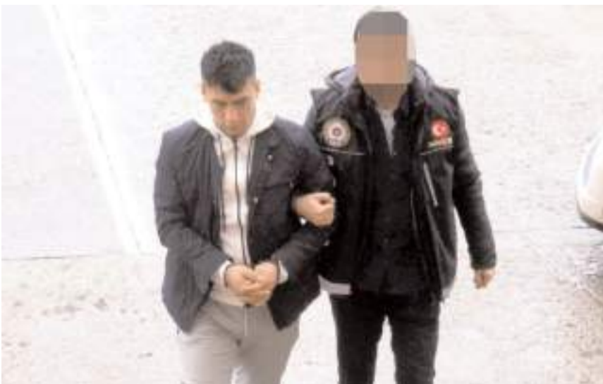
Şüpheli, emniyetteki işlemlerinin ardından sevk edildiği nöbetçi hakimlikçe tutuklandı.

Gözaltına alınan şüpheli, emniyetteki işlemlerinin ardından sevk edildiği nöbetçi hakimlikçe tutuklandı.(AA)