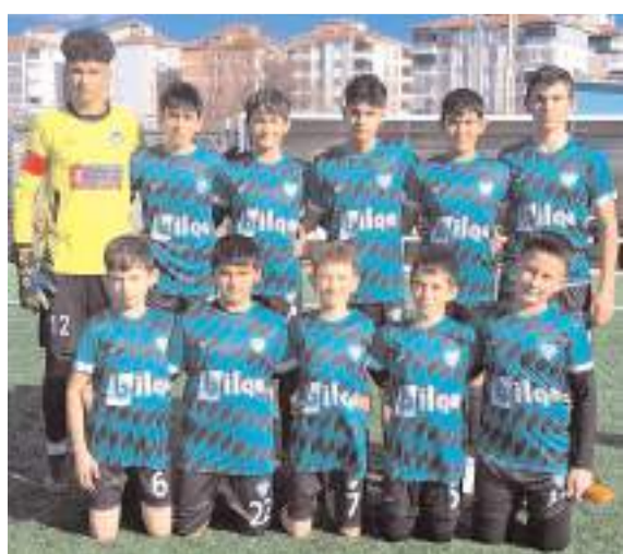
Osmancık Kandiberspor son haftaya lider giriyor