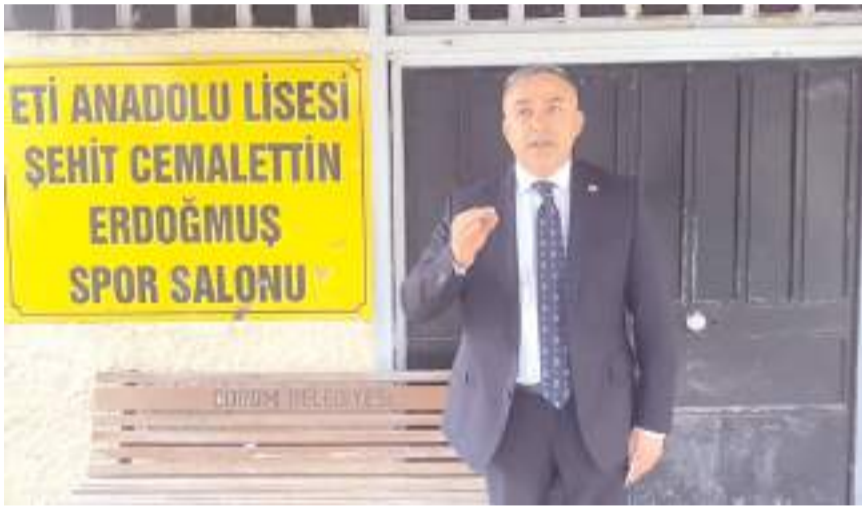
Mehmet Tahtasız Eti Lisesi Spor Salonu önünde yetkilileri salon tadilatı için uyardı