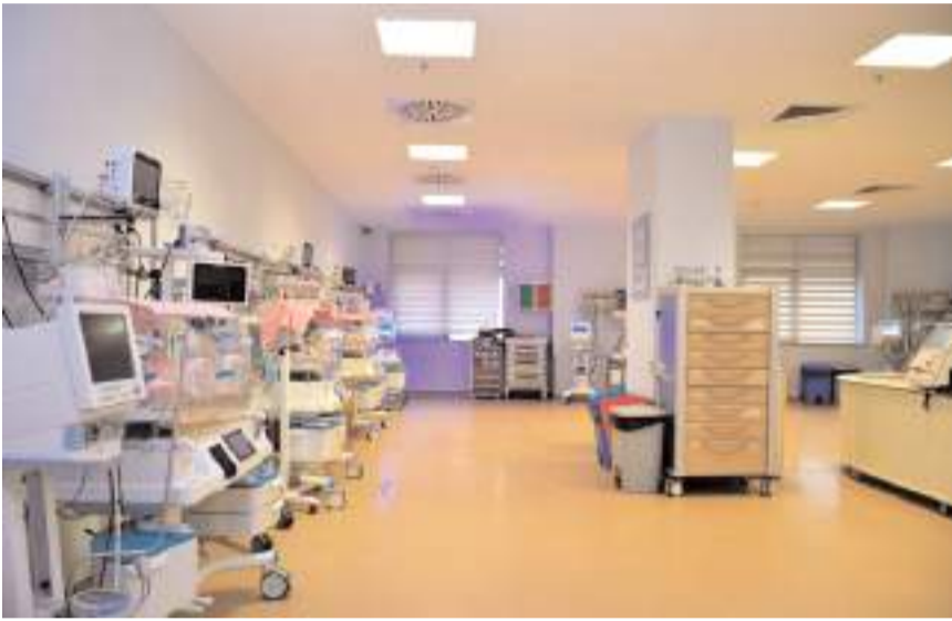
Yenidoğan yoğun bakım ünitesinde 13 yatak bulunuyor.