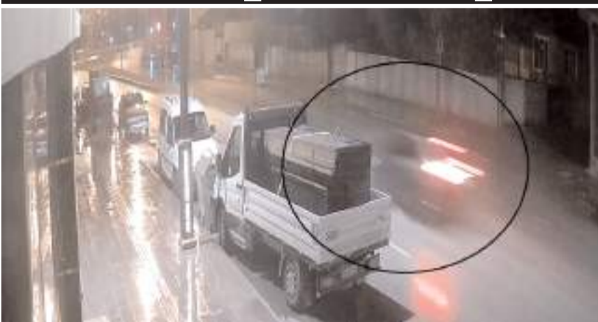
Olay anı güvenlik kameralarına yansdı.

Alaca'da kontrolden çıkan cip takla attı. Kazanın ardından alev alan araçtaki 2 kişiyi itfaiye ekipleri kurtardı. Kazanın saniye saniye güvenlik kamerasına yansdı.