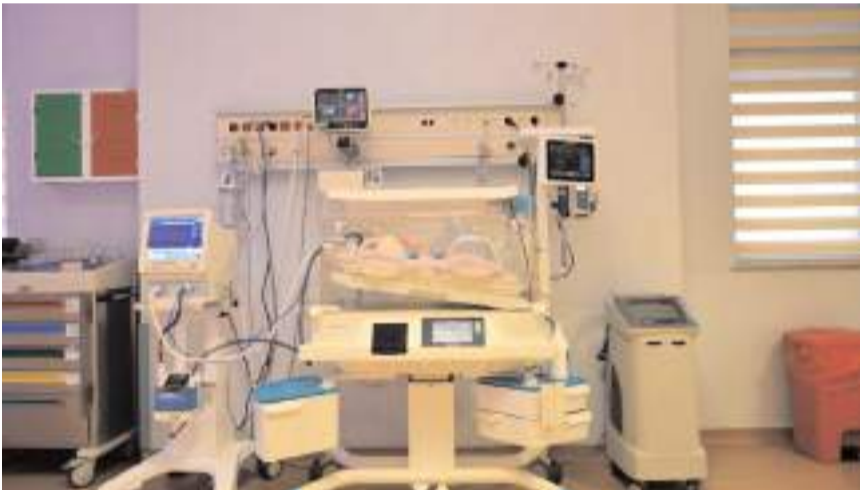
Yenidoğan yoğun bakım ünitesi bölgede ilk olma özelliği taşıyor.

Sadece şehre değil bölgeye de hizmet veren Hitit Üniversitesi Erol Olçok Eğitim ve Araştırma Hastanesinin yoğun bakım kapasitesini artırmaya yönelik çalışmalar devam ediyor. Çalışmalar kapsamında 25 Aralık 2023 tarihinde 16 yataklı erişkin 2. seviye yoğun bakım ünitesi ruhsatlandırılarak hizmete açılmıştı.