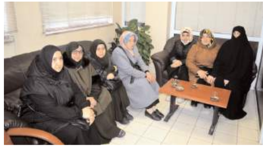
Ziyarete SP Kadın Kolları yönetim kurulu üyeleri de katıldı.