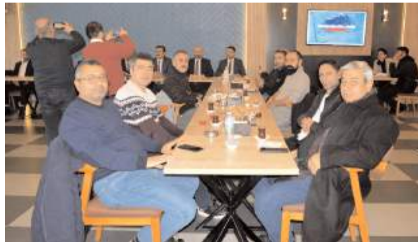
Çorum Belediyesi Meydan Sosyal Tesislerinde yapılan programa çok sayıda basın mensubu katıldı.

Konuşmasının sonunda 10 Ocak Çalışan Gazeteciler Günü nedeniyle tüm gazetecilerin gününü kutlayan Tahtasız; "Gecisini-gündüze katan her türlü zorluğa rağmen halkın haber alma hakkını korumak için emek veren tüm gazetecilerin 10 Ocak Çalışan Gazeteciler Günü'nü kutluyorum. Cumhurbaşkanımızın 30 Haziran'da yayınladığı kamuda tasarruf genelgesi ile emekçi basınımızın bir çok can damarı kesildi. 196 ülke arasında 185.sıradayız basın özgürlüğünde. Bu şekilde ol-