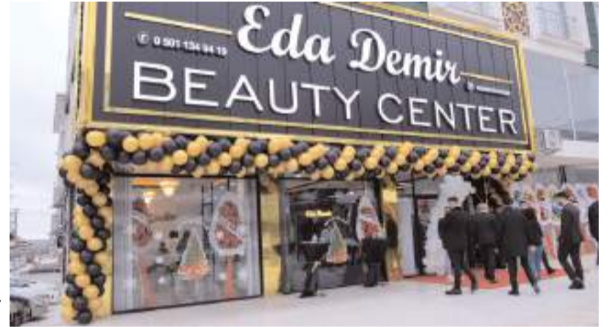
İşletme Ulukavak Mahallesi Osmaniye Caddesi numara 293/A'da (İkizler Benzinliği karşısı) bulunuyor.