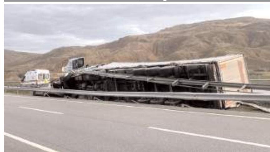
Kaza, Kırıkkale-Çorum D200 kara yolu üzerinde meydana geldi.

Kırıkkale'de seyir halinde tır ile otomobilin çarpıştığı kazada 3 kişi yaralandı.