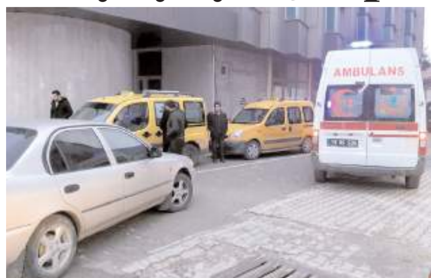
Kaza, Şekerpinar Mahallesi İsmetpaşa Ortaokulu önünde meydana geldi.

Edinilen bilgilere göre kaza, Şekerpinar Mahallesi İsmetpaşa Ortaokulu önünde meydana geldi. A.T. yönetimindeki 19 SN 002 plakalı otomobil, yolun karşısına geçmeye çalışan Y.Y.'ye çarptı. Çarpmanın etkisiyle yere düşen Y.Y. yaralandı. Yaralı kaza yerine çağrılan ambulansla Sungurlu Devlet Hastanesi'ne kaldırılarak tedavi altına alındı. Kazayla ilgili olarak başlatılan soruşturmanın devam ettiği öğrenildi. (İHA)