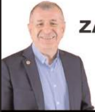
Prof. Dr. Ümit ÖZDAĞ Zafer Partisi Genel Başkanı