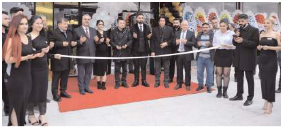
Yapılan duanın ardından açılış kurdelesini kesildi.