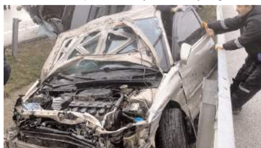
Kazada her iki araçta da maddi hasar meydana geldi.

Kazaya ilişkin inceleme başlatıldı. (İHA)