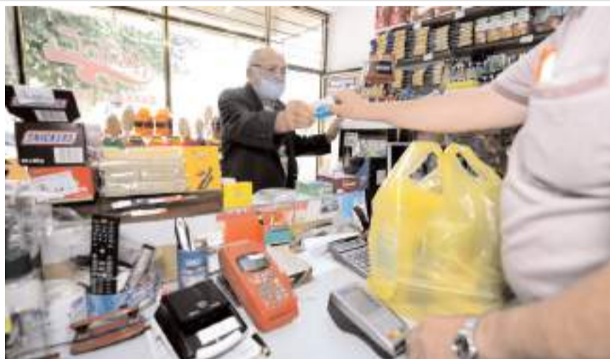
Sosyal Destek Kartını 6 bin 895 aile kullanıyor.

Gıda Bankası yerine Sosyal Destek Kart uygulamasını hayata geçirdiklerini hatırlatan Belediye