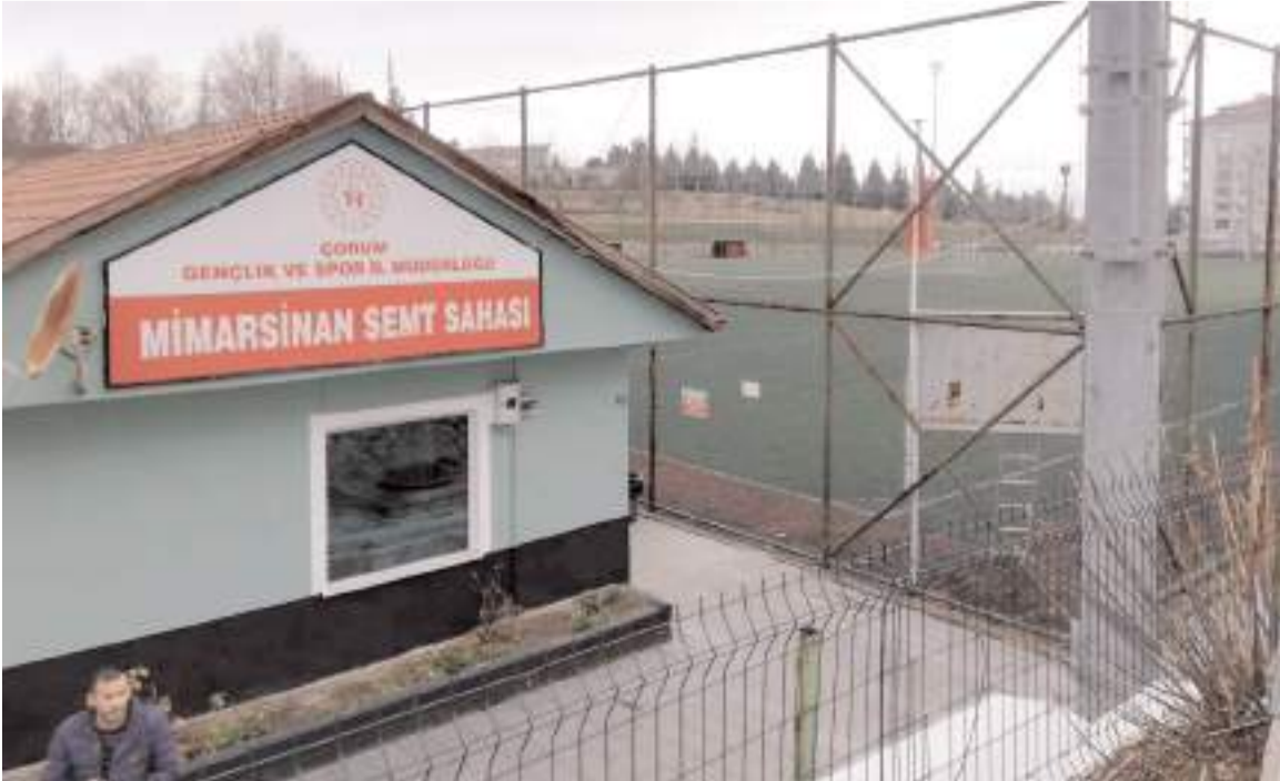
Mimar Sinan semt sahasının modernizasyonunun ilk etabının ihale süreci başladı