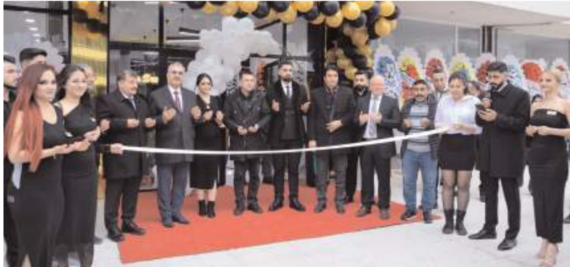
Yapılan duanın ardından açılış kurdelesini kesildi.

■ Türkiye'de 4 şubesi bulunan Eda Demir Beauty Center 5. şubesini Çorum'da açtı. * HABERİ8'DE