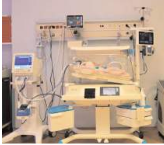
Yenidoğan yoğun bakım ünitesinde 13 yatak bulunuyor.