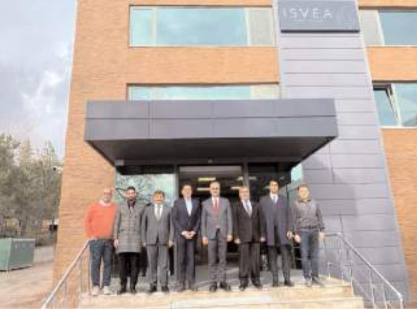
Ziyaretlerin anısına hatıra fotoğrafı çekildi.