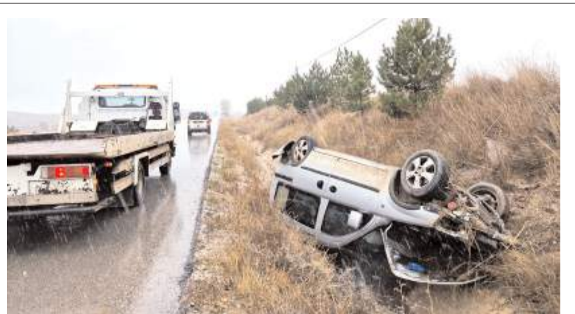
Kaza, Çorum-Alaca karayolu İbrahim köyü mevkiinde meydana geldi.

Kaza anında ait güvenlik kamerası görüntüleri ortaya çıktı. Görüntülerde kavşağa yaklaşan cipin refüje vurduktan sonra takla attığı daha sonra alev aldığı anlar yer aldı. Kazada yaralanan 2 kişinin yardımına yoldan sürücülerin koştuğu görüldü. (İHA)