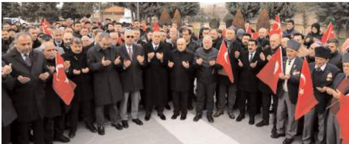
Çorum Şehitliğinde yapılan programda Kur'an-ı Kerim okunup tüm şehitler için dua edildi.