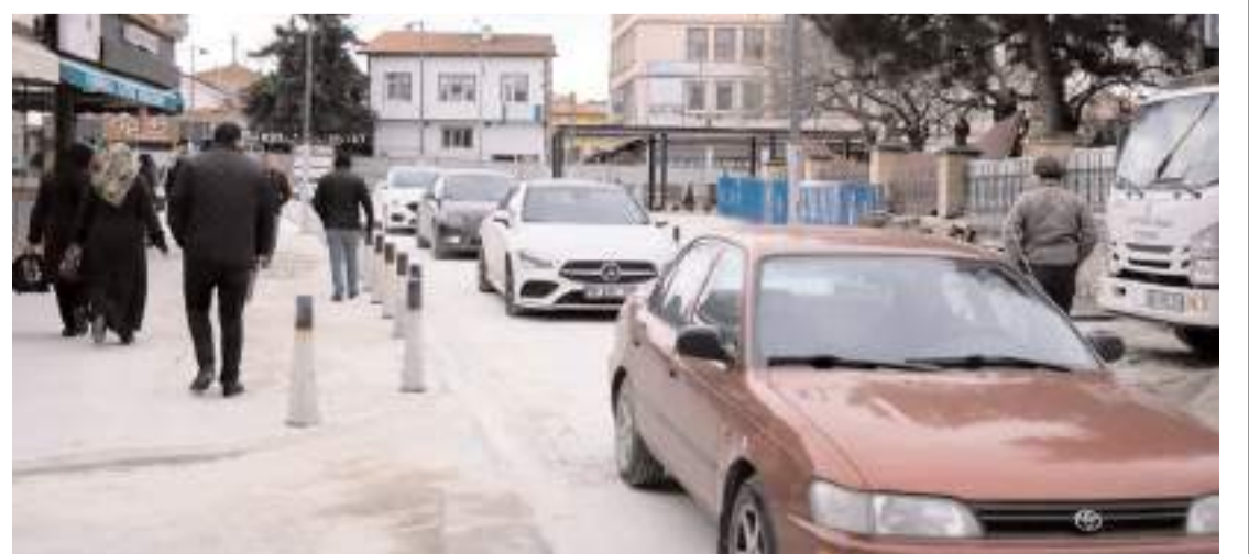
Gazi Caddesini Osmancık Caddesine bağlayan yol yeniden trafiğe açıldı.