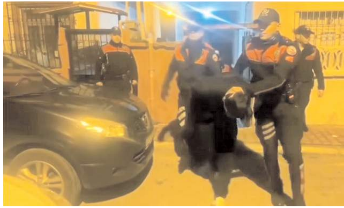
Operasyonlar kapsamında Çorum'da da gözaltılar yapıldı.