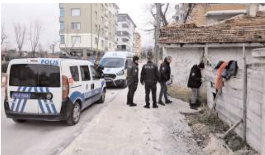
Olay Üçtutlar Mahallesi Muratevler 18. Sokak'ta meydana geldi.

Sokak'taki ikametlerinde tartışma çıktı.