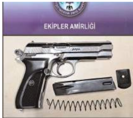
Uygulamalarda ruhsatsız tabanca, 5 kurusıkı tabanca, 7 tüfek ele geçirildi.

Çorum polisinin yaptığı şok uygulamalarda çok sayıda silah ve uyuşturucu madde ele geçirildi.