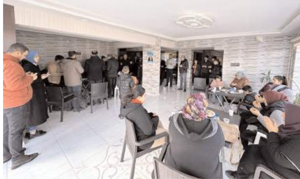
Açılışa çok sayıda davetli katıldı.

31 Aralık 2002 tarihinde 48 yaşında hayatını kaybeden Tunaboşlu, evli ve 2 çocuk babasıydı.