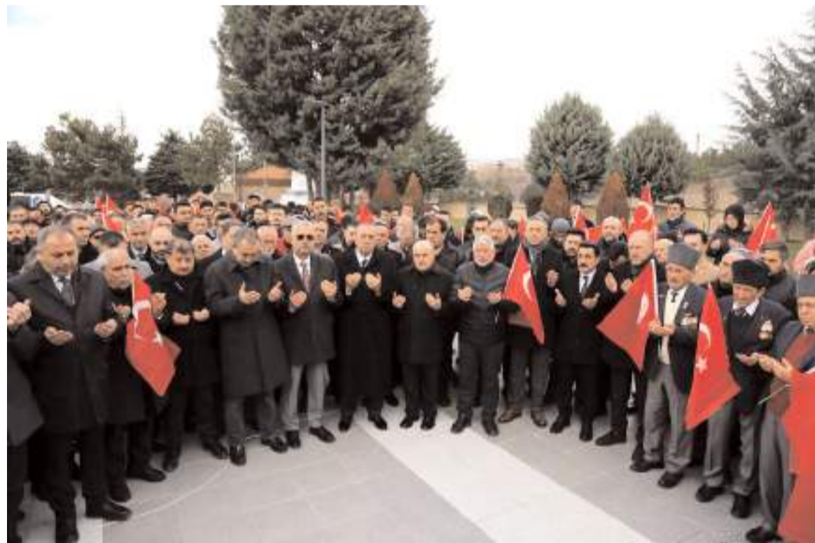
Çorum Şehitliğinde yapılan programda Kur'an-ı Kerim okunup tüm şehitler için dua edildi.

Program kapsamında Irak'ta hain terör örgütü tarafından şehit edilen 9 askerimiz ve tüm şehitlerimiz için Kur'an-ı Kerim okunarak dua edildi.