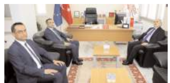
Çorum Valisi Doç. Dr. Zülkif Dağlı, TKDK İl Koordinatörlüğünü ziyaret etti.

Türkiye İhracatçılar Meclisi (TİM) verilerine göre Çorum'dan geçtiğimiz yıl 1 milyar 42 milyon 309 bin dolarlık mücevher ihracatı gerçekleştirildi. Çorum 6 milyar 428 milyon 677 bin dolarlık ihracat yapan İstanbul'un ardından ikinci sırada yer aldı. * HABERİ'8'DE