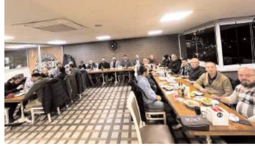
Program Çakır Sami Kebap Salonu'nda yapıldı.