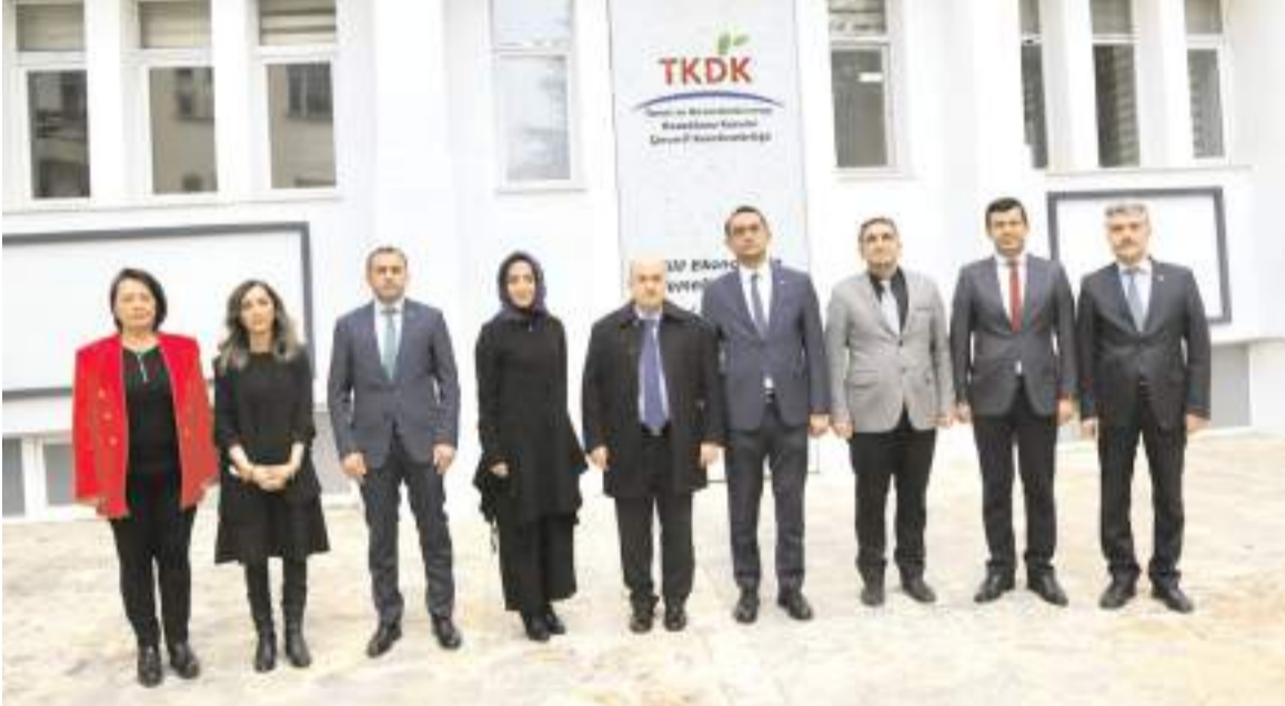
Ziyaretin sonunda günün anısına hatıra fotoğrafı çekildi.