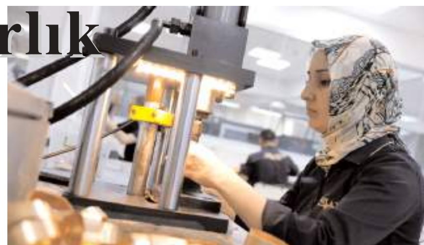
Mücevher sektörünün en fazla ihracat gerçekleştirdiği ülke 3 milyar 205 milyon 310 bin dolarla Birleşik Arap Emirlikleri oldu.

Çorum'u, 7 milyon 102 bin dolar ihracat artışıyla İzmir, 2 milyon 307 bin dolarla Antalya ve 2 milyon 76 bin dolarla Adana izledi. (A.A)