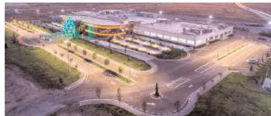
En çok mücevher ihracatı yapan illerde İstanbul'un ardından ikinci sırada Çorum'a yer aldı.