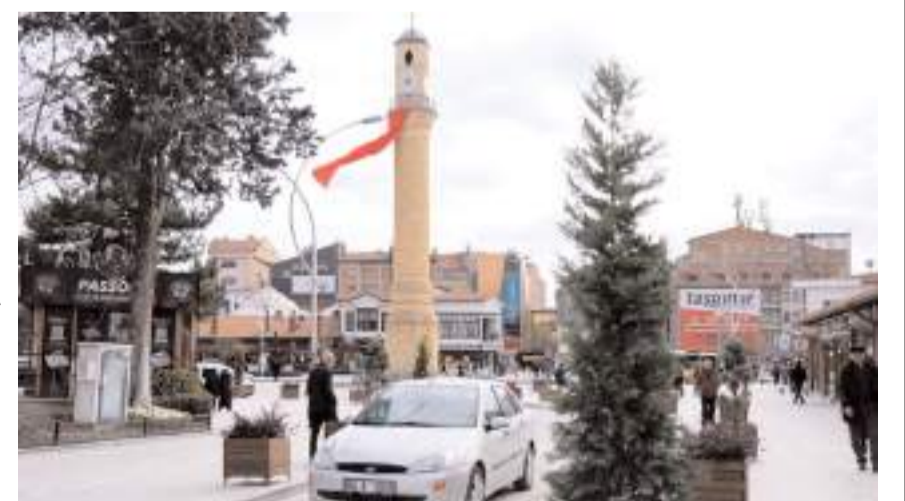
Tarihi Kent Meydanı çalışmasında sona gelindi.

Gazi ve İnönü Caddelerinden gelen araç sürücülere, Osmancık Caddesi istikametini tek yön olarak kullanmaya başladı.