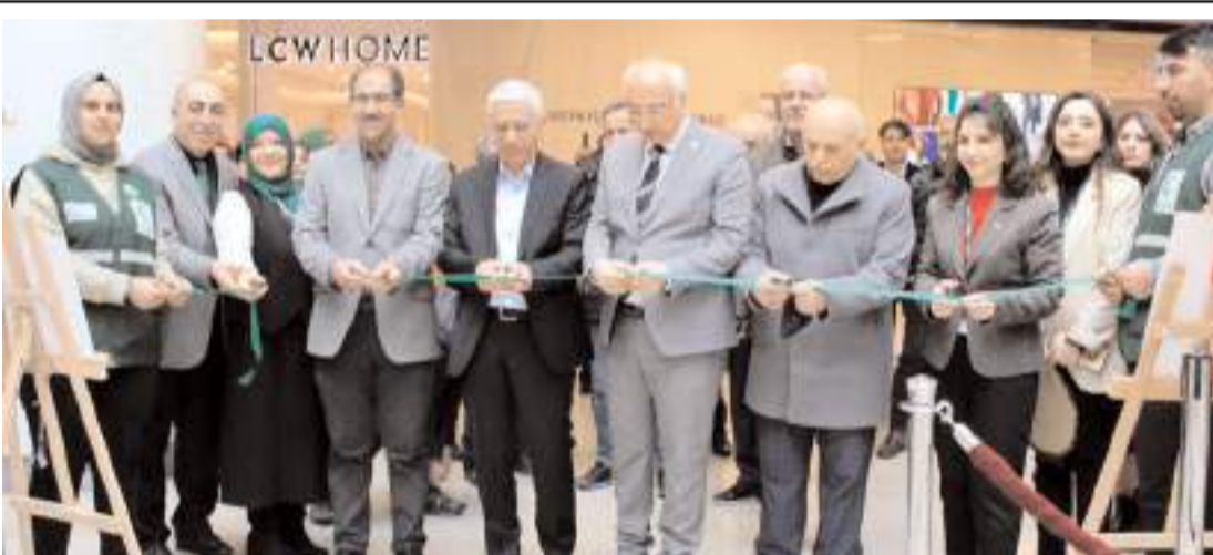
Serginin açılış kurdelesini protokol üyeleri kesti.