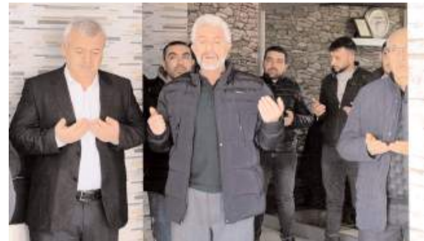
Seçim ofisi dualarla açıldı.