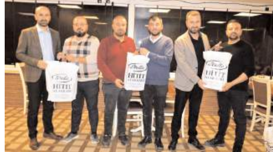
Basın mensuplarına günün anısına hediye verildi.