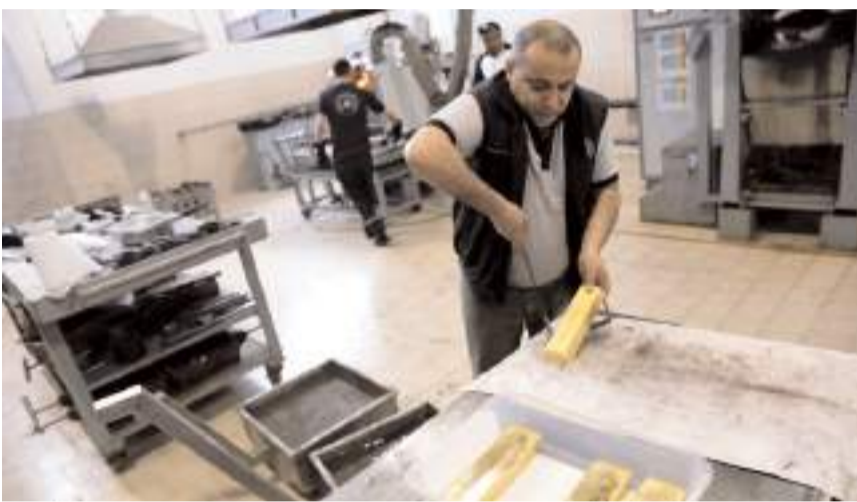
TİM verilerine göre Çorum'dan geçtiğimiz yıl 1 milyar 42 milyon 309 bin dolarlık mücevher ihracatı yapıldı.

Söz konusu dönemde, Kastamonu'dan 50 milyon 958 bin dolarlık, Ankara'dan 36 milyon 361 bin dolarlık ve Samsun'dan 23 milyon 537 bin dolarlık mücevher ihracatı yapıldı.