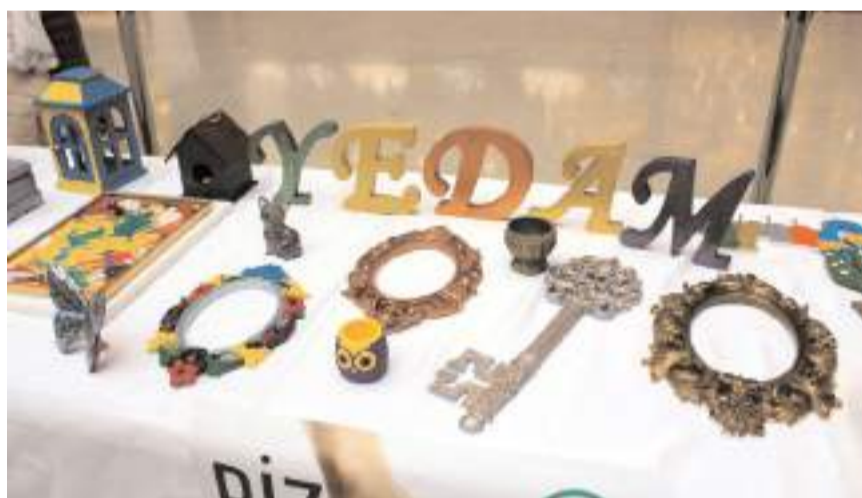
Sergide YEDAM danışmanlarının tasarladıkları eserler yer alıyor.

Davetliler YEDAM Atölyesinde tasarlanan eserleri gezerek bilgi aldılar.