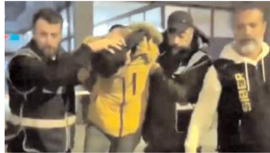
Gözaltına alınan şüpheliler çıkartıldıkları mahkeme tarafından tutuklandılar.

Şüpheli şahıslar, çocukların kullandığı müstehcen yayınları ükkeye sokmak, çoğaltmak, satmak, nakletmek, ihraç etmek, suçu ve suçluyu övmek, bir ev hayvanını veya evcil hayvanı kasten öldürmek ve suç işlemeye alenen tahrik etmek suçlarından tutuklandı.