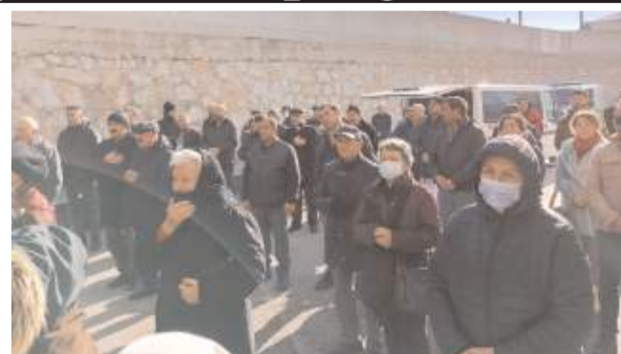
Hacı Bektaş Veli Vakfı'nda yapılan törene merhumenin ailesi, yakınları ile çok sayıda basın mensubu katıldı.