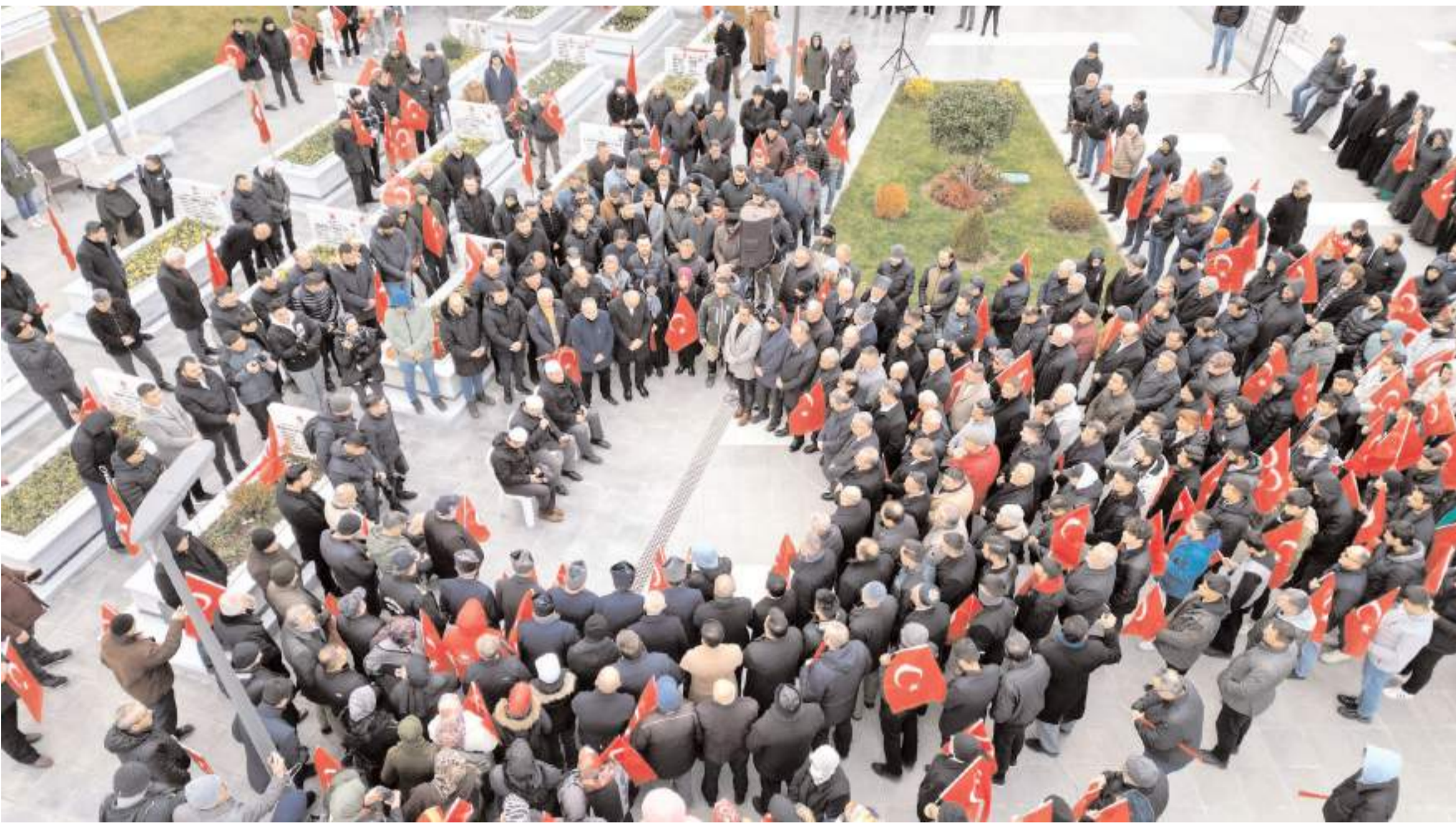
Çorum'da yüzlerce kişi Türk bayrağını alarak Şehitliğe koştu.