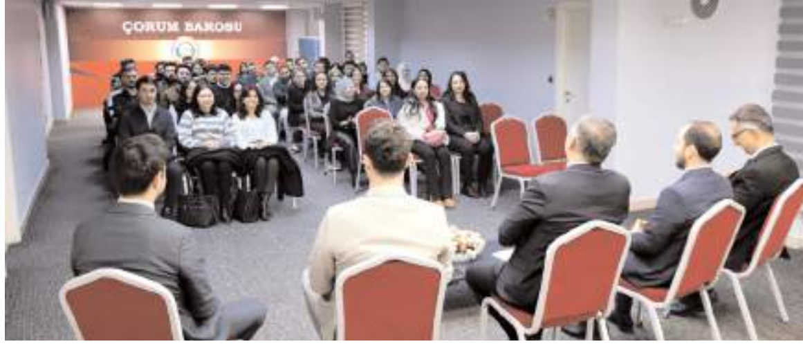
Çorum Barosu'nda yeni dönem staj eğitim seminerleri 1 yıl boyunca devam edecek.