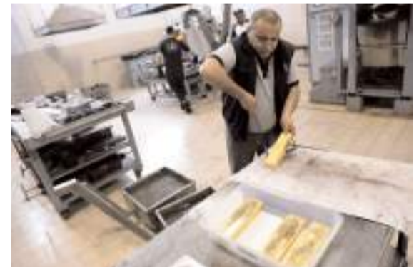
Mücevher sektörünün en fazla ihracat gerçekleştirdiği ülke 3 milyar 205 milyon 310 bin dolarla Birleşik Arap Emirlikleri oldu.