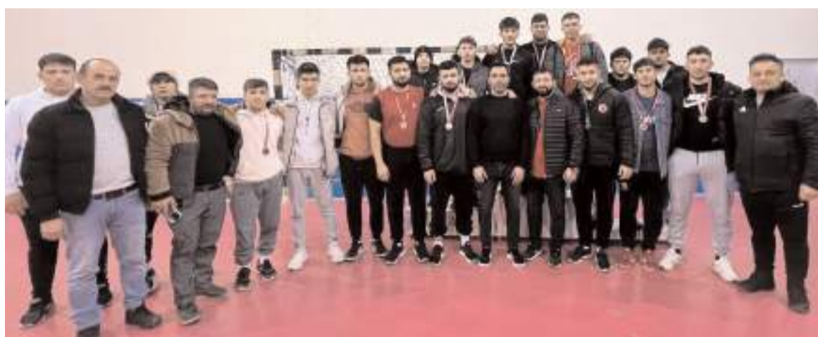
U 20 Gençler Serbest Güreş il birinciliğinde dereceye giren sporcular ödül töreni sonrasında toplu halde

Müsabakalar sonunda düzenlenen törenle sıklletlerinde dereceye giren sporculara madalya verildi. Sıklletlerinde birinci olan sporcular Çorum'u gruplarda temsil etmeye hak kazandılar.