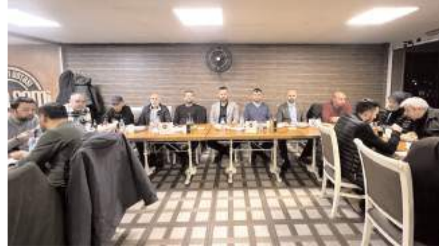
Yemeğe katılım yüksek oldu.