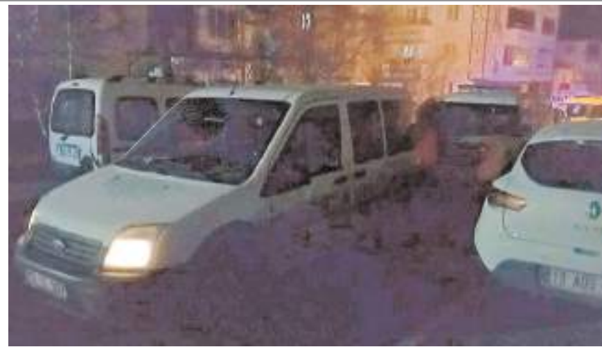
Olay Küçük Sanayi Sitesi'nde meydana geldi.

Edinilen bilgiye göre, Çorum'da Küçük Sanayi Sitesi'nde polis ekiplerinin "dur" ihtarına uymayan 19 ACB 548 plakalı otomobil, uygulama noktasından kaçmaya çalıştı. Gülabibey Mahallesi Vatan Caddesi üzerinde ters yöne giren sürücü, polis ekiplerince kısa sürede yakalandı. Yapılan kontrollerde sürücünün ehliyetsiz olduğu tespit edildi. Sürücü ve araçta bulunan 3 kişi, ifadeleri alınmak üzere polis merkezine götürüldü. Trafik güvenliğini tehlikeye atarak ehliyetsiz araç kullanan sürücüye, ters yöne girmekten, spin atmaktan ve "dur" ihtarına uymamaktan toplamda 74 bin 767 lira idari para cezası uygulandı. (İHA)