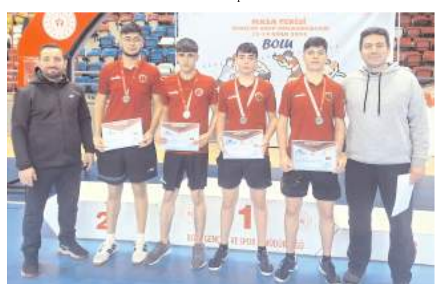
Bolu'da yapılan bölge birinciliğinde ikinci olarak Türkiye finallerine katılmaya hak kazanan Spor Lisesi Erkek takımı ödül töreni sonrasında öğretmenleri ile

Üç okulumuz 13-15 Şubat tarihlerinde Aydın'da yapılacak Türkiye Şampiyonasında mücadele edecekler.