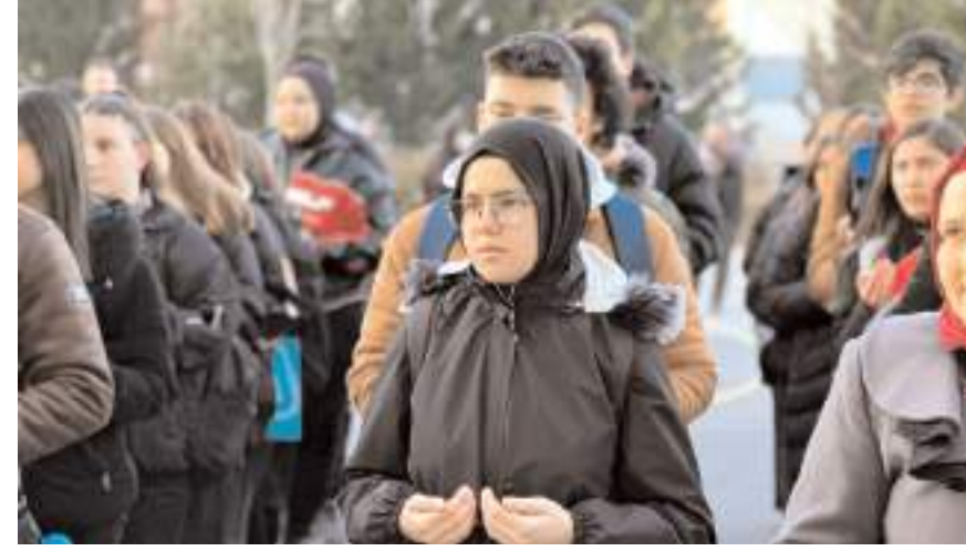
Şehitler için dua edildi.