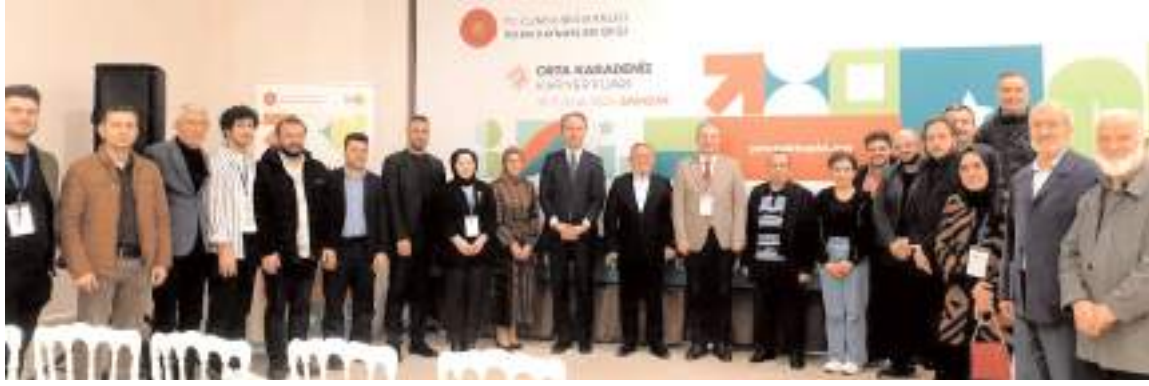
Orta Karadeniz Kariyer Fuarı (OKAF'24) Samsun'da açıldı.