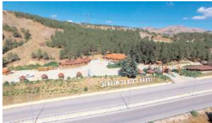
Sıklık Tabiat Parkı 272 hektar alandan oluşuyor.