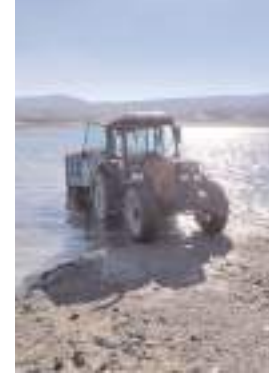
Baraja giren traktör çamura saplandı.