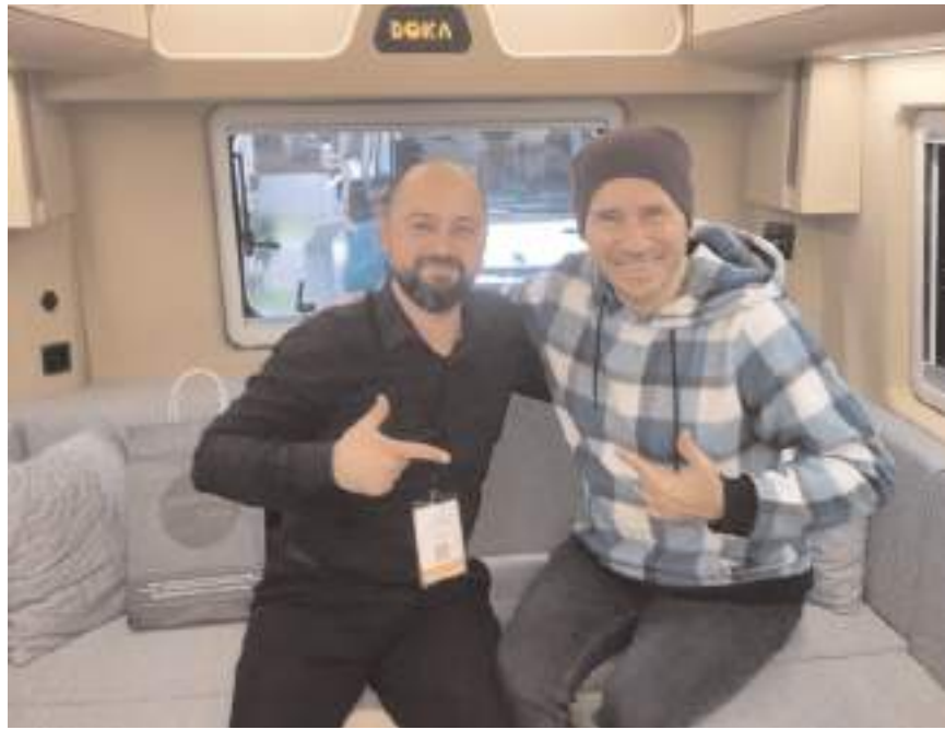
Ünlü sanatçı Emre Yücelen de DOKA Karavan standını ziyaret ederek ürünleri inceledi.