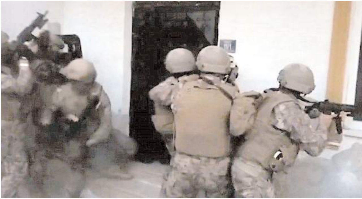
Operasyon 78 ilde yapıldı.

Ağrı, Burdur, Düzce, Giresun, Siirt, Sivas, Karabük, Kırıkkale, Zonguldak, Iğdır, Nevşehir, Tokat, Uşak, Van, Amasya, Erzincan, Kilis, Niğde, Rize, Trabzon, Yozgat, Artvin, Bingöl, Bolu, Çankırı, Karaman, Kırşehir, Tunceli, Adıyaman, Ardahan, Bartın, Bilecik, Bitlis, Kars ve Şırnak olmak üzere toplam 78 ilde evlerde, iş yerlerinde ve yol aramalarında yapılan 'MERCEK-9' operasyonlarında bin 230 ruhsatsız tabanca ve 163 ruhsatsız kurusıkıdan çevrilmiş tabanca olmak üzere toplam bin 393 tabanca yakalandı. İlk 5 şehirlerimizde yakalanan ruhsatsız silahlar ile gözaltına alınan şüpheliler ise şöyle; İstanbul'da 322 tabanca, 23 uzun namlulu tüfek ele geçirildi. 471 şüpheli gözaltına alındı. İzmir'de 92 tabanca ele geçirildi. 138 şüpheli gözaltına alındı. Adana'da 85 tabanca ele geçirildi. 101 şüpheli gözaltına alındı. Bursa'da 52 tabanca, 2 uzun namlulu tüfek ele geçirildi. 76 şüpheli gözaltına alındı. Şanlıurfa'da 56 tabanca, 2 av tüfeği ele geçirildi. 59 şüpheli gözaltına alındı. Operasyonları gerçekleştiren Kahraman Jandarmamız ve Kahraman Emniyetimizi tebrik ediyorum. Allah ayaklarına taş değdirmesin. Milletimizin duası sizinle. Ruhsatsız silah temin edenlerle ve silah kaçakçılarıyla mücadelemiz kararlılıkla sürecek." (İHA)