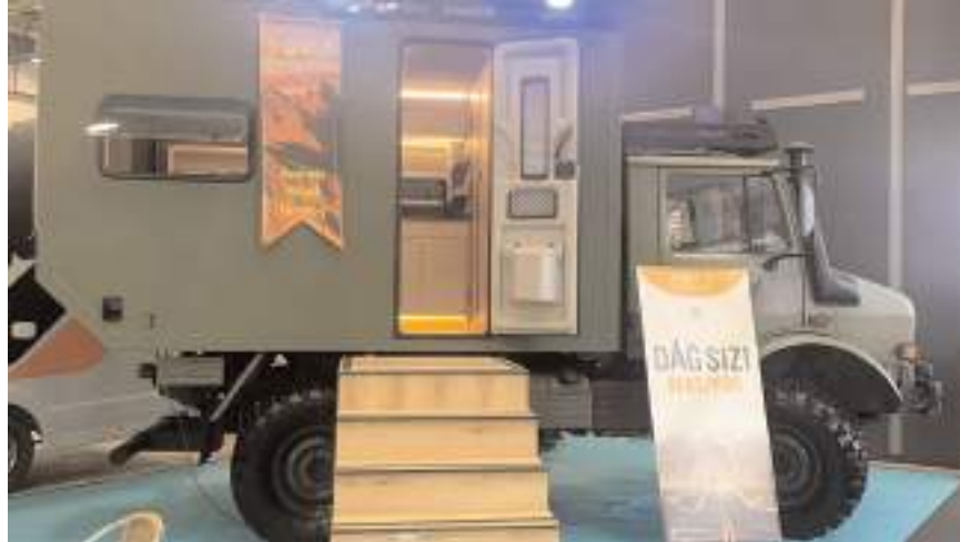
DOKA Karavanın arazi aracı üzerine yaptığı karavan büyük ilgi gördü.