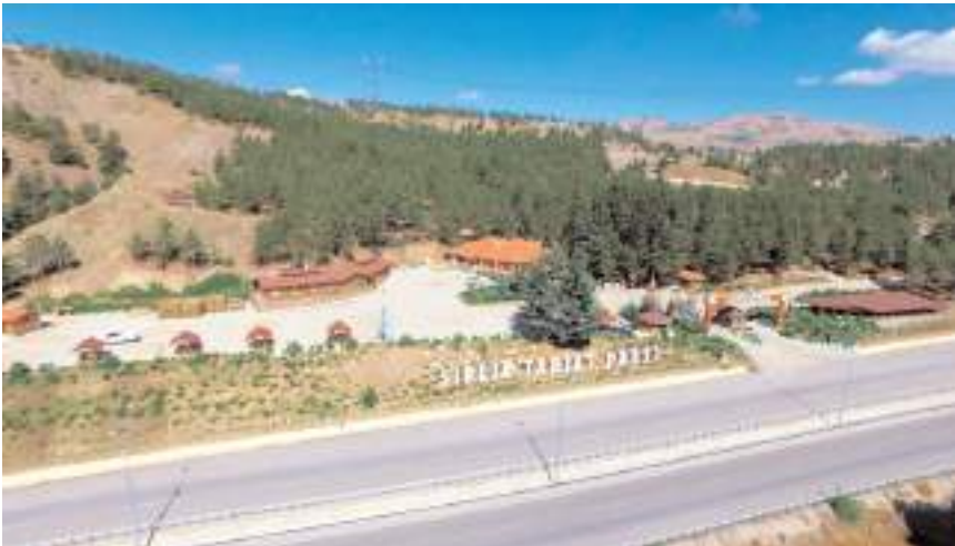
Sıklık Tabiat Parkı 272 hektardan oluşuyor.