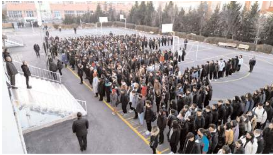
Şehit olan askerler için okullarda saygı duruşunda bulunuldu.