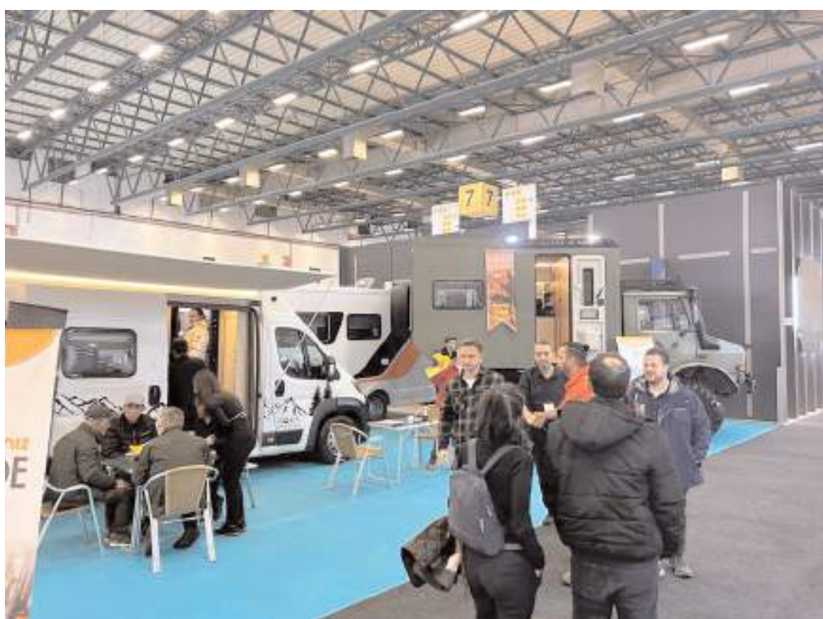
DOKA Karavanın standı fuarda büyük ilgi gördü.

DOKA Karavan Çorum Sanayi Sitesi, Ankara yolu 5.Cadde'de faaliyetlerini sürdürüyor.