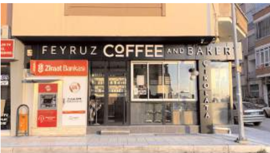
Feyruz Coffee, Albayrak Caddesi No: 21'de faaliyet gösteriyor.