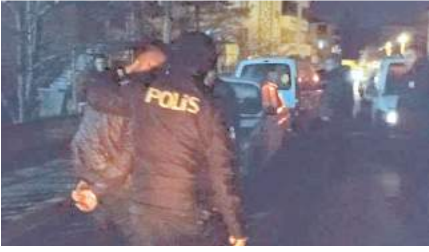
Sürücü ve araçta bulunan 3 kişi, ifadeleri alınmak üzere polis merkezine götürüldü.

■ Çorum'da polis ekiplerinin "dur" ihtarına uymayıp trafik güvenliğini tehlikeye atan ehliyetsiz sürücüye, toplamda 74 bin 767 lira idari para cezası uygulandı.