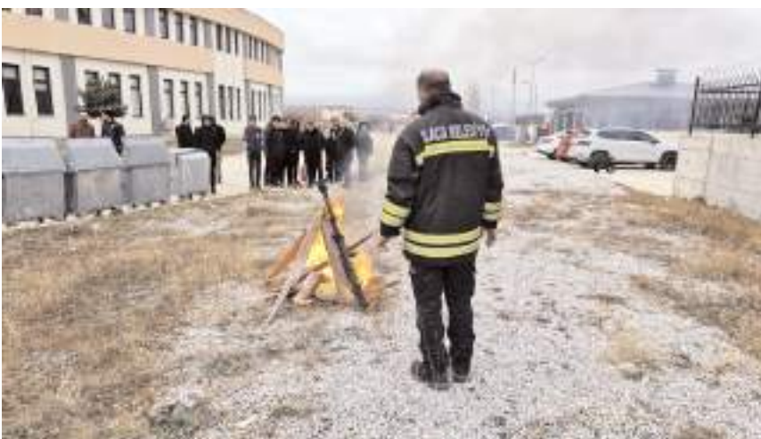
Eğitimi Alaca Belediyesi itfaiye ekipleri verdi.

Kredi Yurtlar Kurumu tarafından Hitit Üniversitesi Alaca Meslek Yüksekokulu öğrencilerinin yangın anında neler yapmaları gerektiğini uygulamalı tatbikat düzenlendi. Alaca Belediyesi itfaiye ekiplerinin de katıldığı yangın tatbikatında, itfaiye ekipler tarafından yakılan ateşe