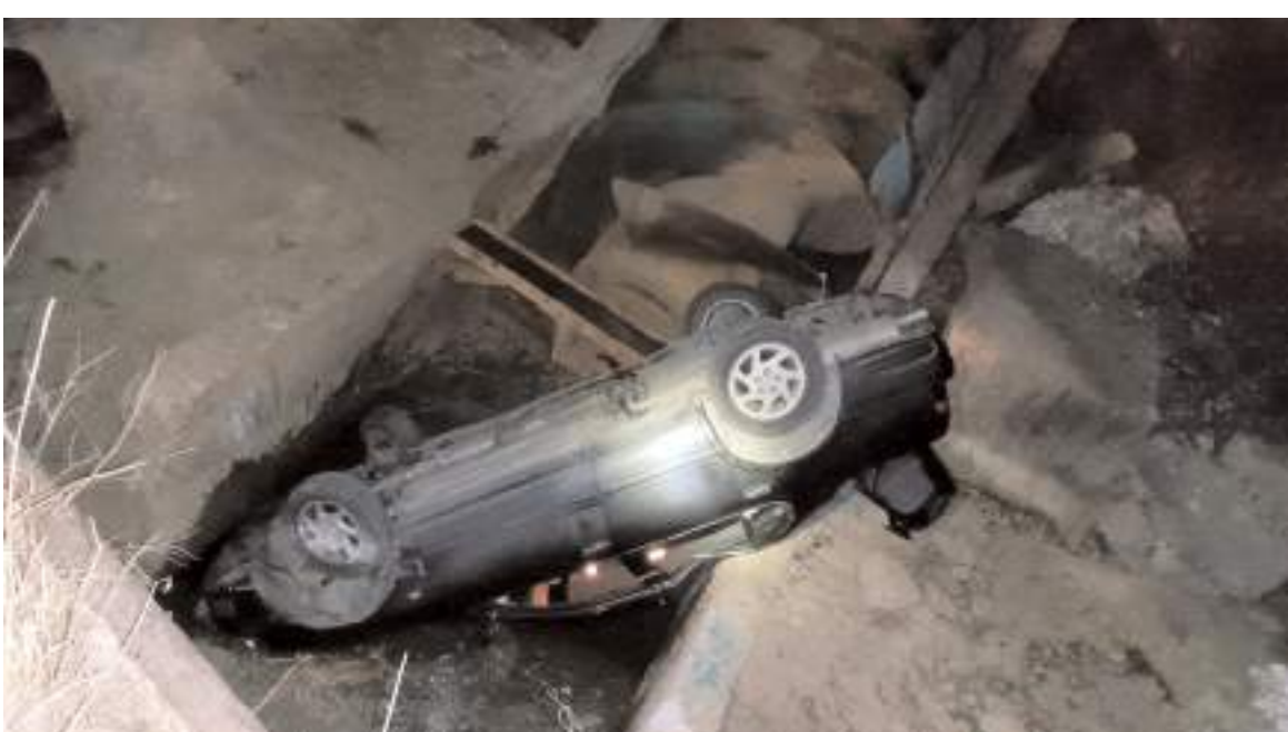
Kazada otomobilde maddi hasar meydana geldi.