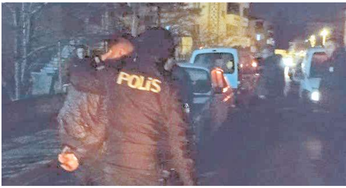
Sürücü ve araçta bulunan 3 kişi, ifadeleri alınmak üzere polis merkezine götürüldü.