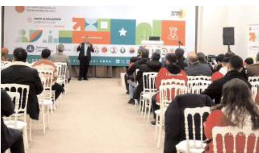
TÜYAP Samsun Fuar ve Kongre Merkezi'nde düzenlenen fuarda Kariyer buluşmaları yapıldı.