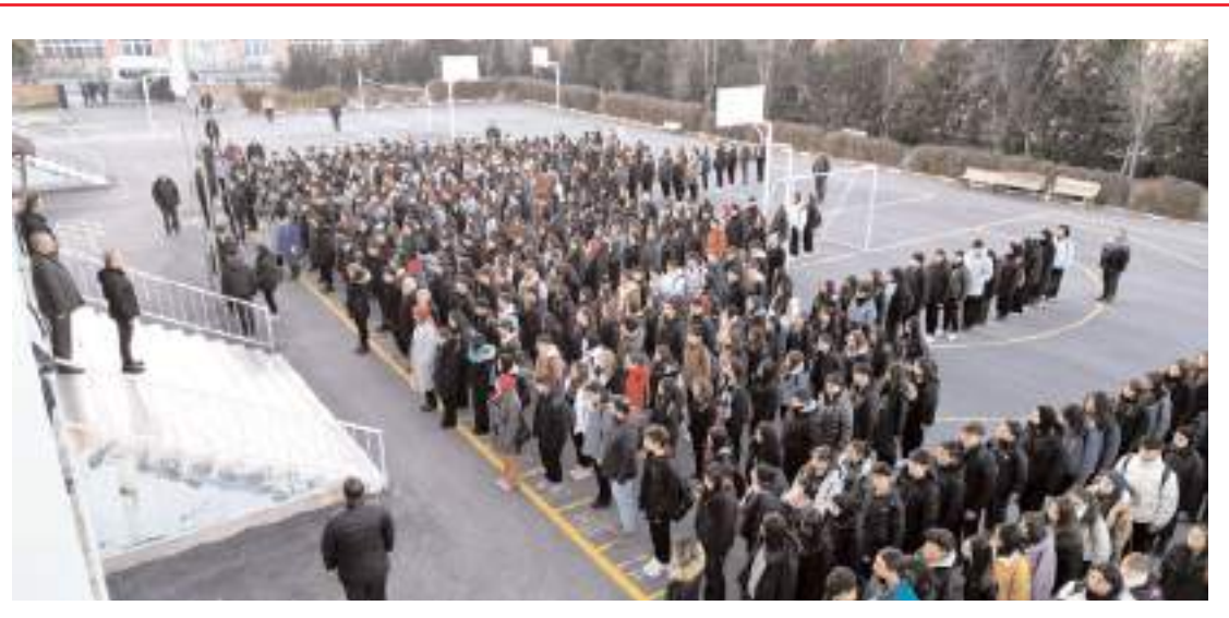
Şehit olan askerler için okullarda saygı duruşunda bulunuldu.