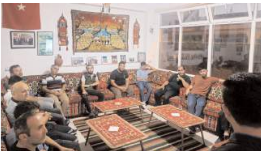
8 adet avcı eğitim kursunda 166 kişiye eğitim verildi.