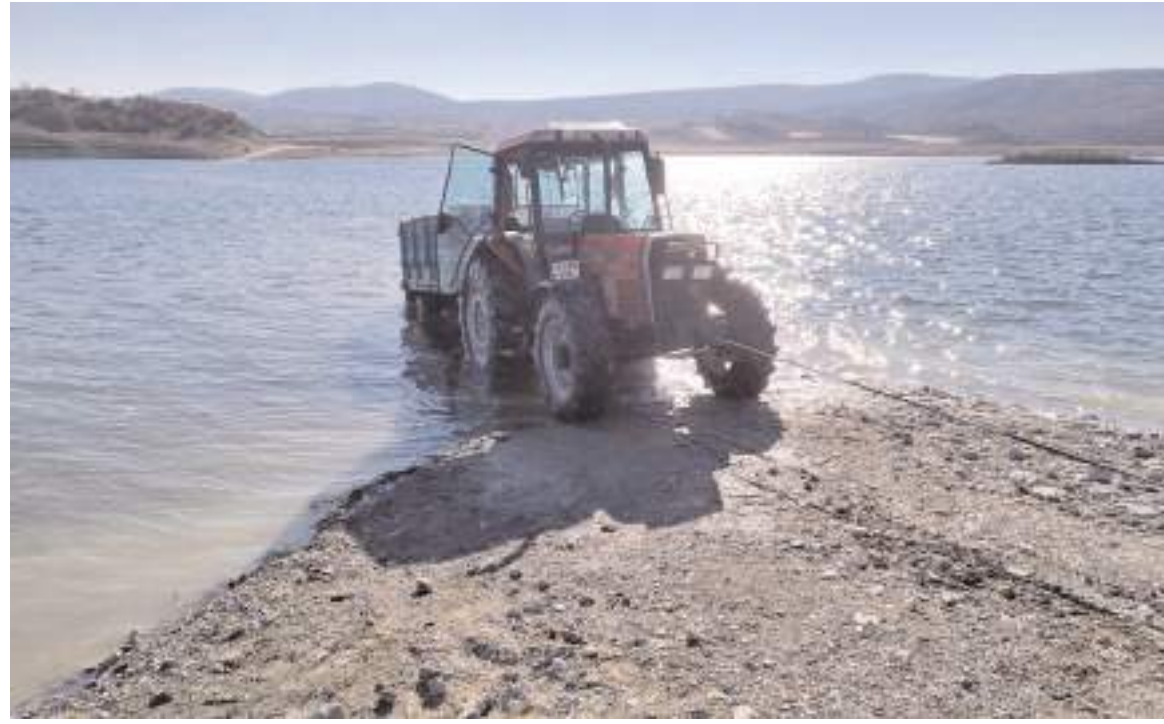
Baraja giren traktör çamura saplandı.

2023 yılında kira yardımı için 111 kişi başvururken 4 milyon 087 bin 818 TL ödeme yapıldı. (Haber Merkezi)