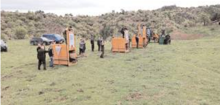
Geçen yıl Osmancık'ın Başpınar Köyü yakınlarındaki türe uygun habitat alanına 4 adet kızıl geyik salındı.