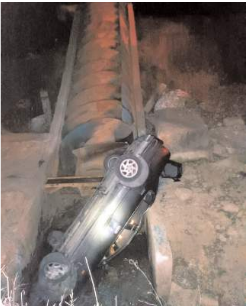
Kaza, Çorum-Uğurludağ karayolunda meydana geldi.

Kaza ile ilgili başlatılan soruşturma sürüyor. (İHA)