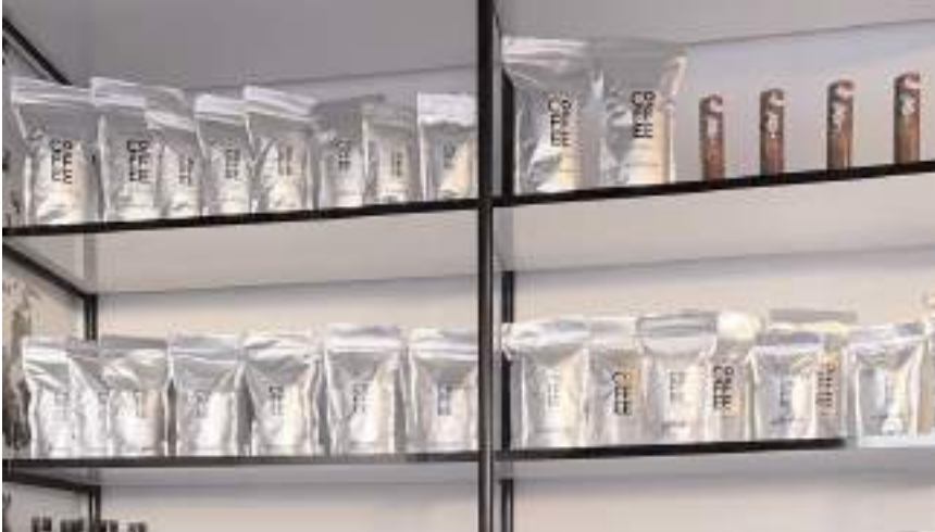
Feyruz Coffee, Safranbolu Lokumu ve Mabel Çikolataları ile ürün çeşidini zenginleştirdi.