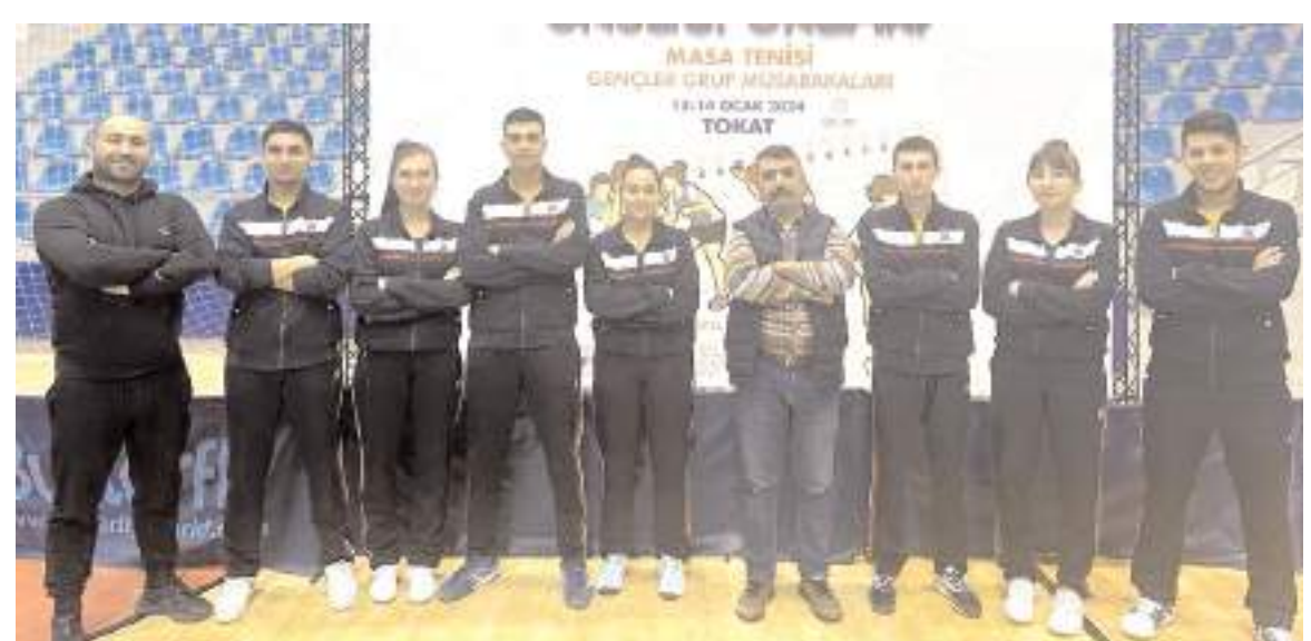
Tokat'ta yapılan bölge birinciliğinde şampiyon olarak finallere katılmaya hak kazanan Özel Pınar Anadolu Lisesi kız ve erkek takımları müsabakaların ardından toplu halde görülüyor