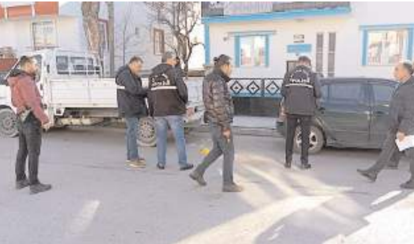
Olay, Gülabibey Mahallesi Yenidoğan Caddesi'nde meydana geldi.

Olayla ilgili başlatılan soruşturma sürdüğü bildirildi. (İHA)