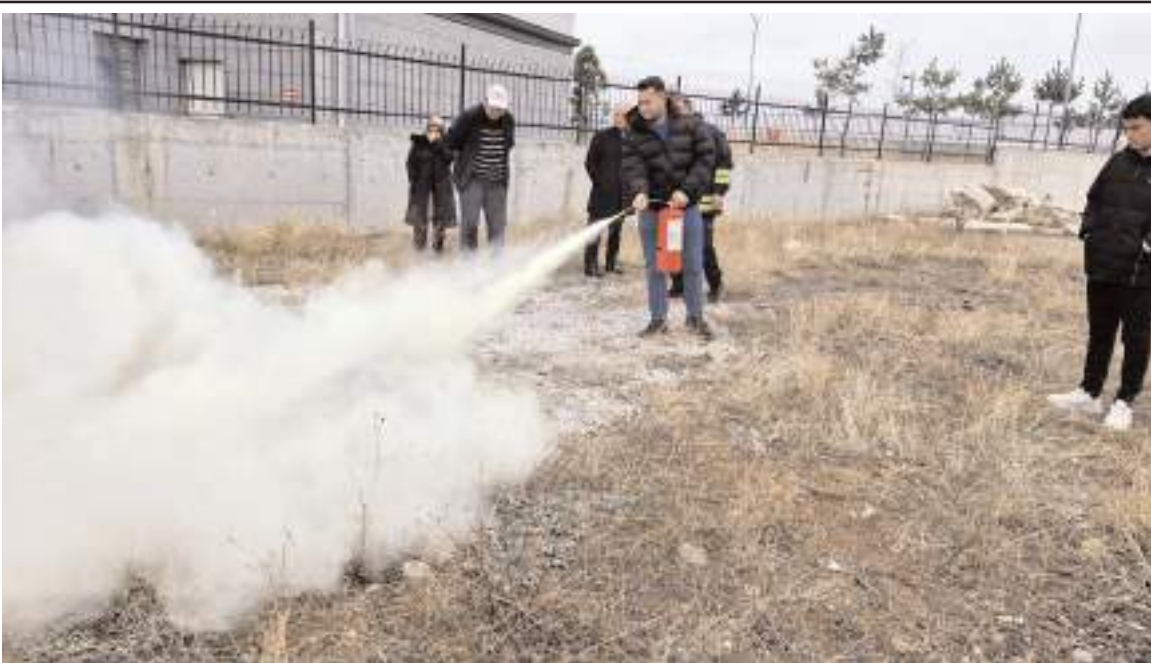
Tatbikatta öğrencilere uygulamalı olarak yangın söndürme teknikleri gösterildi.

kullanmaktayım. Gittiğimiz yerlerde de insanlara mesaj veriyor. Çünkü bu arabalar zamanında halkımızın toplu taşımada kullanılan araçlardı. Eski insanlar bu aracı gördüklerinde o günlerin hikâyelerini anımsıyorlar. Kimisi yolculuk yapmış, kimisinin düğün arabası olmuş, kimisinin gelin arabası olmuş. Bu şekilde insanlar aracımı ilgiyle izliyorlar. O da bizi mutlu ediyor" şeklinde konuştu. (İHA)