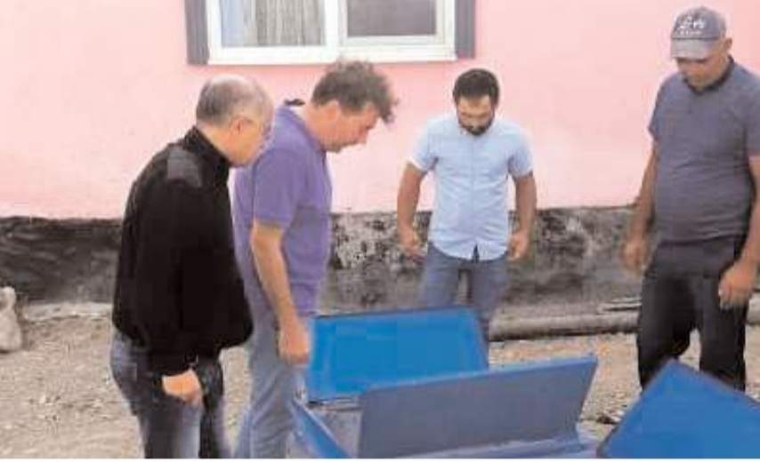
Merkez Köylere Hizmet Götürme Birliğinin 198 üyesi bulunuyor.