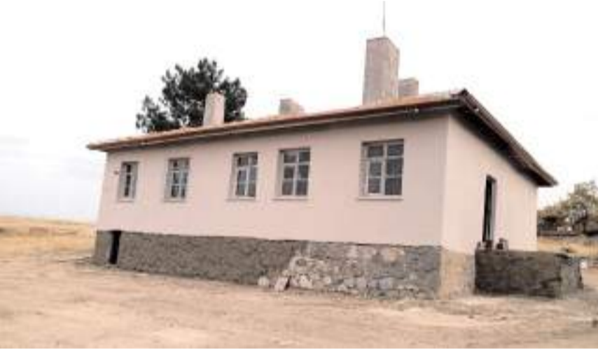
Merkez Köylere Hizmet Götürme Birliği köylerde sosyal ve kültürel tesis, köy konağı ve cami bakım onarımı yaptırdı.