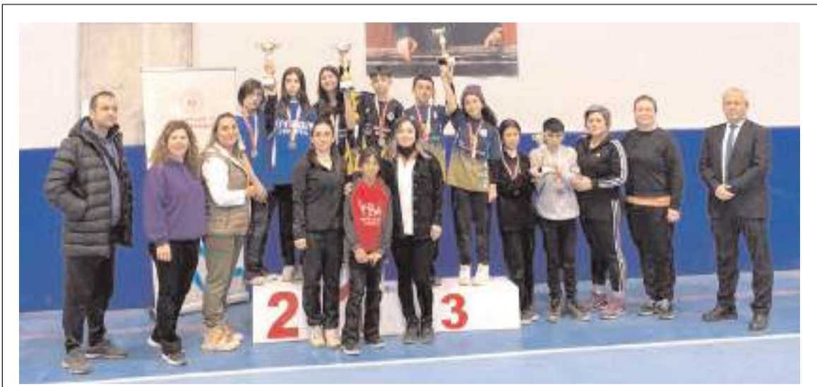
Okullu Yıldızlar Karma Curling'de dereceye giren okulların idareci, öğretmenleri ve sporcuları toplu halde