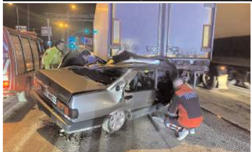
Yaralıları sıkıştıkları yerden itfaiye ekipleri kurtardı.

Tokat'ın Erbaa ilçesinde tıra ok gibi saplanan otomobilde sıkışan sürücü, itfaiye ekipleri tarafından kurtarılarak hastaneye kaldırıldı.