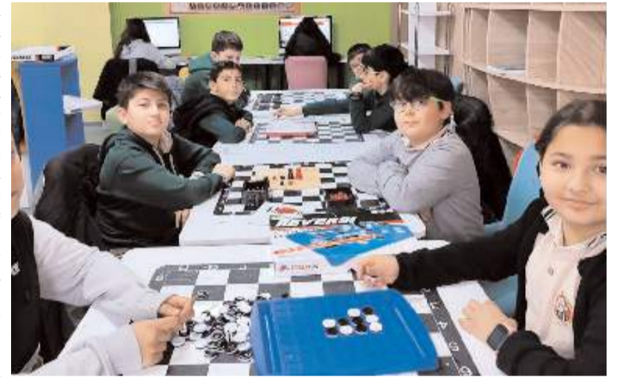
İl genelinde yaklaşık 98 bin öğrenci karneye alacak.

Okullarda yapılan dönem sonu faaliyet haftası kapsamında, Çorum Şehitleri Müzesi, Çorumina, Millet Bahçesi ve Çorum Müzesi gezilirken okullarda, en sevdiğini paylaş, kermes, bilgi yarışmaları, yetenek paylaşım saati, görsel sanat etkinlikleri, sosyal sorumluluk, bilim ve spor saati gibi birçok etkinlik okul ve çevre şartları göz önünde bulundurularak öğrencilerin ilgisini çekecek şekilde düzenlendi. (Haber Merkezi)