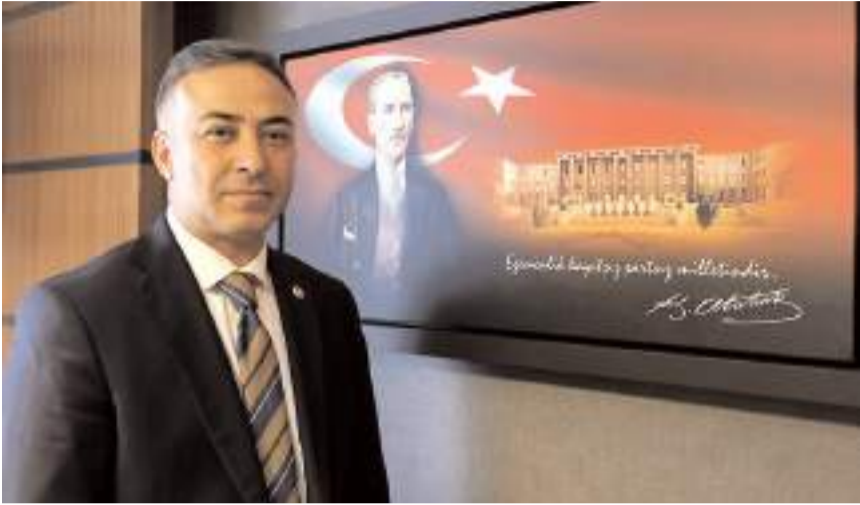
CHP Çorum Milletvekili Mehmet Tahtasız

yapan Tahtasız; "Milletvekillerimizin oyları ile Cumhuriyet Halk Partisi Grup yönetimine seçilmenin mutluluğunu yaşıyorum. Bugün yapılan seçimde TBMM İdari Amirliğine seçilen Artvin Milletvekilimiz Sn. Uğur Bayraktutan, benimle birlikte grup yönetimize seçilen Uşak Milletvekilimiz Sn. Ali Karaoba, Gaziantep Milletvekilimiz Sn. Hasan Öztürkmen ve Kars Milletvekilimiz Sn. İnan Akgün Alp'i de tebrik ediyor, başarılı bir dönem geçirmeyi diliyorum. Genel Başkanımız Sayın Özgür Özel ve tüm milletvekillerimize yürekten teşekkür ediyorum." ifadelerini kullandı