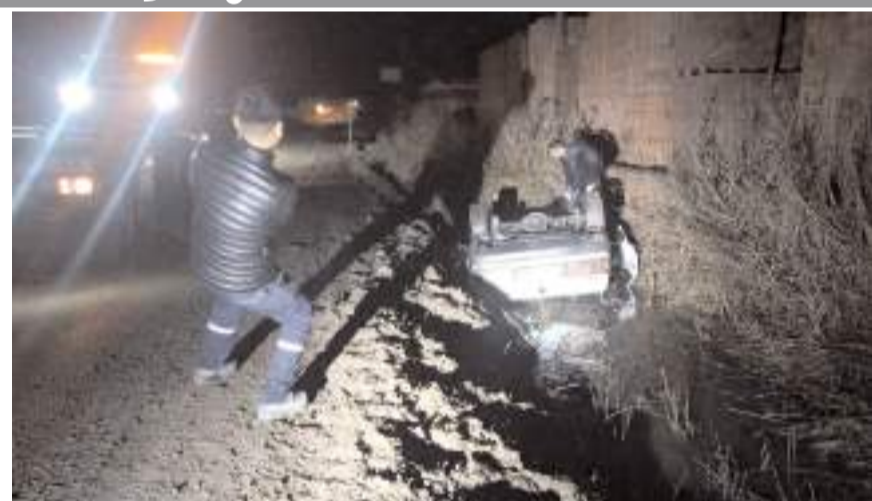
Kaza, Çorum-Osmancık karayolu, Çengele mevkiinde meydana geldi.