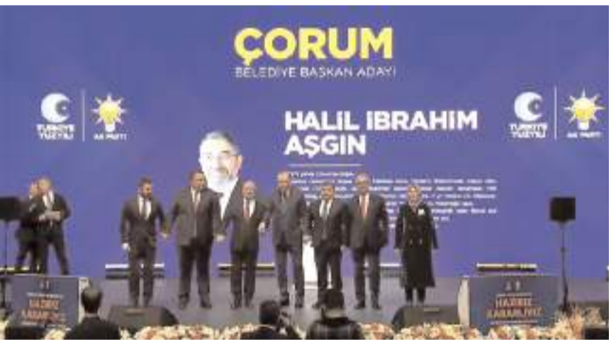
Aday tanıtım toplantısına AK Parti Çorum Teşkilat Başkanlarında katıldı.