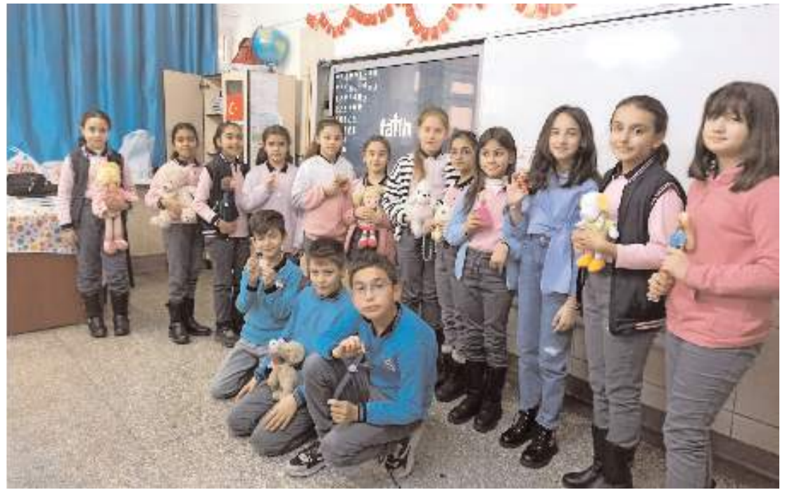
Okullarda "Dönem Sonu Faaliyet Haftası" renkli görüntülere sahne oldu.