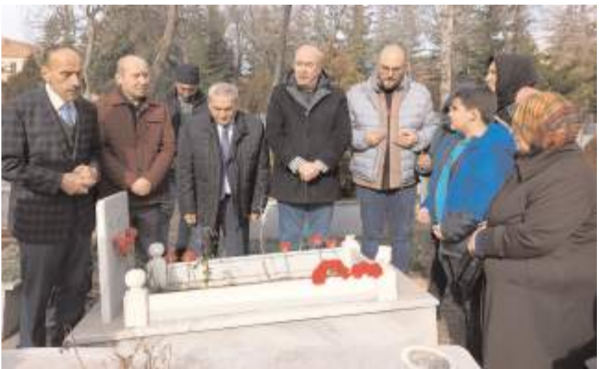
Gazeteci-Yazar Mahmut Tunaboğlu için mezarı başında anma programı yapıldı.