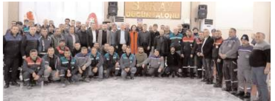
Programda günün anısına hatıra fotoğrafı çekildi.