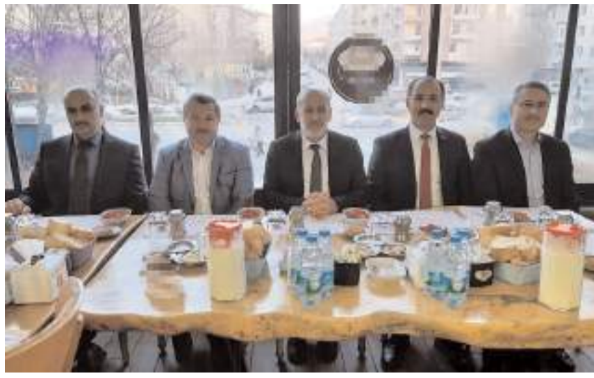
Ataması olan Müftülük şube müdürleri için "Veda ve Vefa Programı" düzenlendi.