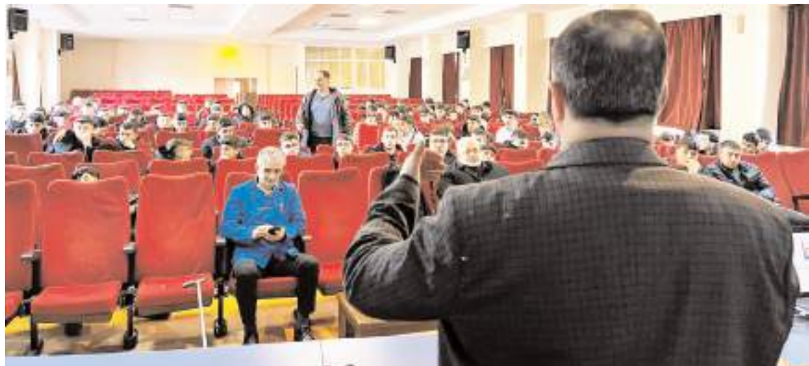
Program Şehit Emin Güner Mesleki ve Teknik Anadolu Lisesi konferans salonunda yapıldı.