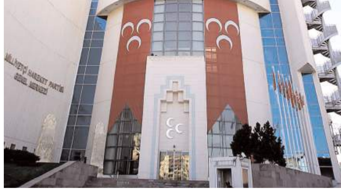
Milliyetçi Hareket Partisi Çorum'un ilçelerinden 10 tanesinin başkan adayını açıkladı.

MHP'nin açıkladığı listede Mecitözü, Oğuzlar, Ortaköy, Düvenci ve Aşdavul yer almadı.