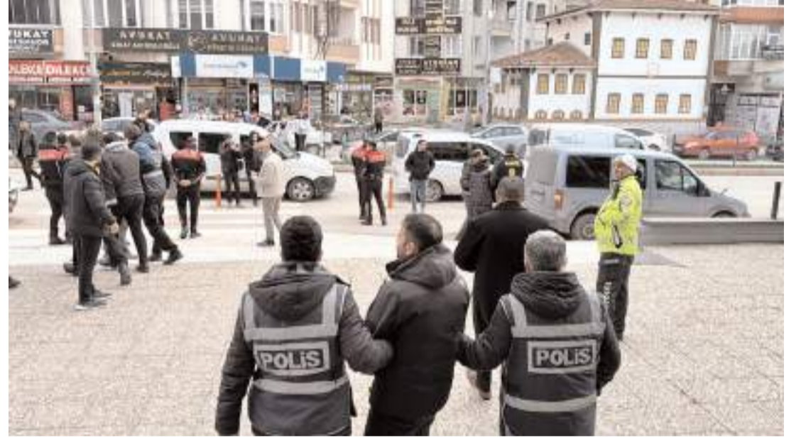
Tutuklanan zanlılar cezaevine götürüldü.

Emniyetteki işlemlerinin ardından adliyeye sevk edilen zanlılar, çıkarıldıkları hakimlikçe tutuklandı.(AA)