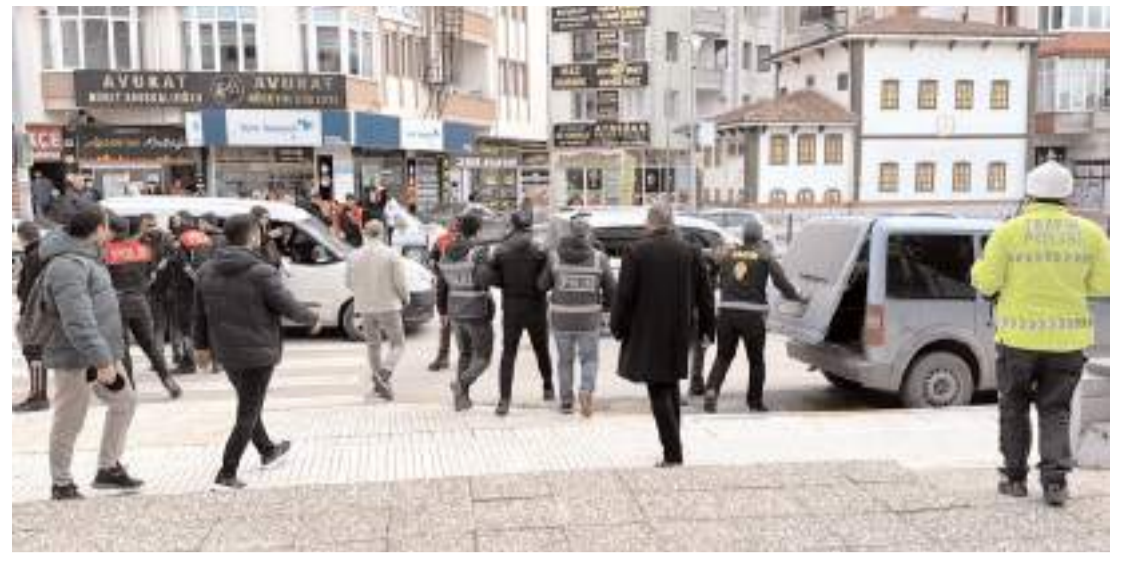
Emniyetteki işlemlerinin ardından adliyeye sevk edilen zanlılar, çıkarıldıkları hakimlikçe tutuklandı.