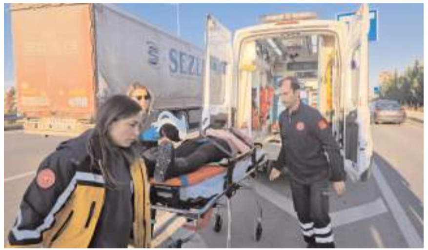
Yaralıları olay yerinde yapılan ilk müdahalenin ardından hastaneye kaldırıldı.

Yaralıları sağlık ekiplerince yapılan müdahalenin ardından Hitit Üniversitesi Erol Olçok Eğitim ve Araştırma Hastanesine kaldırıldı.(AA)