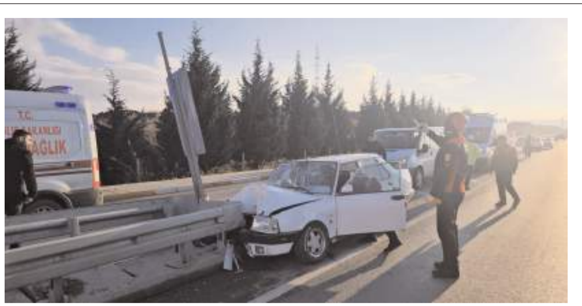
Kaza İskilip kara yolu köprülül kavşağında meydana geldi.

45 adet tabanca mermisi, 22 adet av fişegi, 170 adet sentetik ecza maddesi, 2 gram esrar maddesi, 73 gram metamfetamin maddesi, 1,33 gram bonzai maddesi de ele geçirildi. Uygulamalarda 465 araç kontrol edilirken 2 araca 25.954 TL idari para cezası kesildi. (Haber Merkezi)