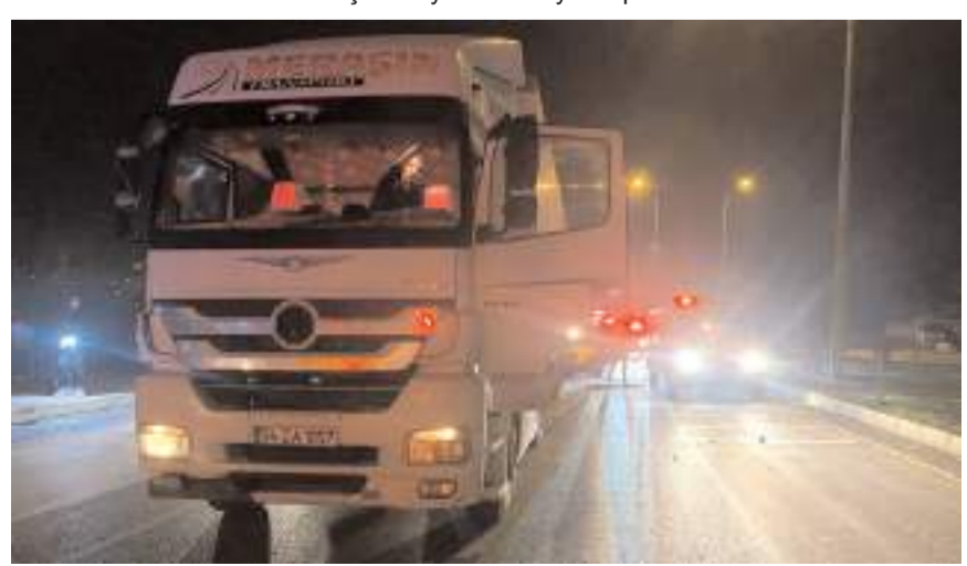
Kaza, saat 22.00 sıralarında Erbaa D-100 karayolunda meydana geldi.