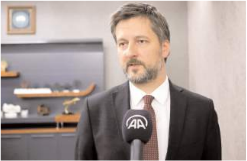
Macaristan'ın Ankara Büyükelçisi Viktor Matis, Çorum'da açıklamalarda bulundu.

"2023 senesinin sonunda stratejik seviyedeki işbirliğimizi geliştirmiş stratejik seviyesine yükselttik. Bu, çok nadiren olan bir seviye ve iki ülkenin gerçekten iyi şekilde işbirliği yaptığı anlamına geliyor. Küresel siyasette ve küresel güvenlik konularında da işbirliğimiz gerçekten iyi. Çünkü problemleri çıktıkları yerde çözme anlayışıyla hem Türkiye hem Macaristan hareket ediyor. Uluslararası kuruluşlarda da NATO olsun, Avrupa Birliği konusunda da yolunuz olsun veya Türk Devletleri Teşkilatı olsun, işbirliğimiz iyi. Ortak projelere imza atıyoruz ve birçok konuda hemfikiriz, beraber hareket etme kabiliyetimiz var."(AA)