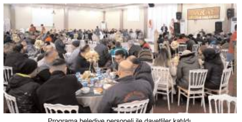
Programa belediye personeli ile davetliler katıldı.