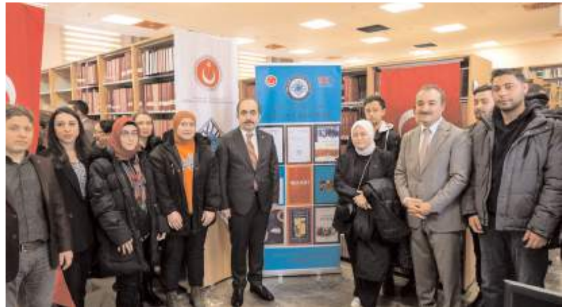
Açılışın ardından hatıra fotoğrafı çekildi.