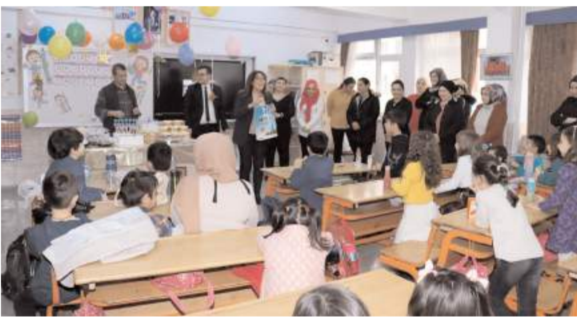
Yarı tatil bugün başlayacak.

zesi İzmir-Bornova'da Doğançay Mezarlığında toprağa verildi. (Haber Merkezi)