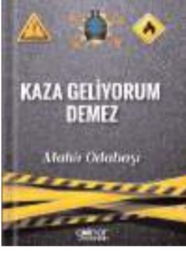
"Kaza Geliyorum Demez" Mahir Odabaşı'nın 4. kitabı