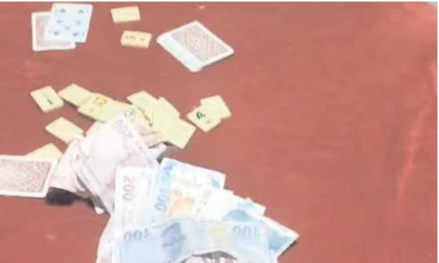
Operasyonda ele geçirilen malzemelere ve paralara el konuldu.

M.G.'ye işlem yapılırken ride bulunan çok sayıda maktan para cezası uygulandı. (İHA)