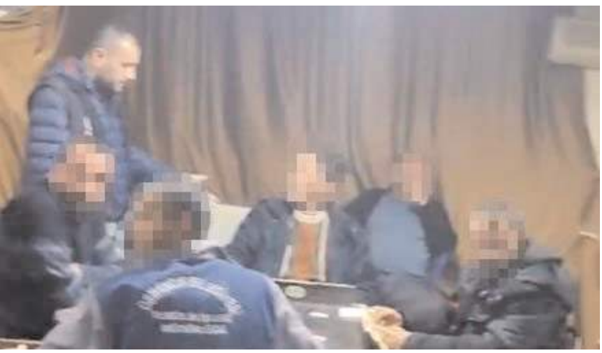
Operasyonda kumar oynarken yakalanan 6 kişiye cezai işlem uygulandı.