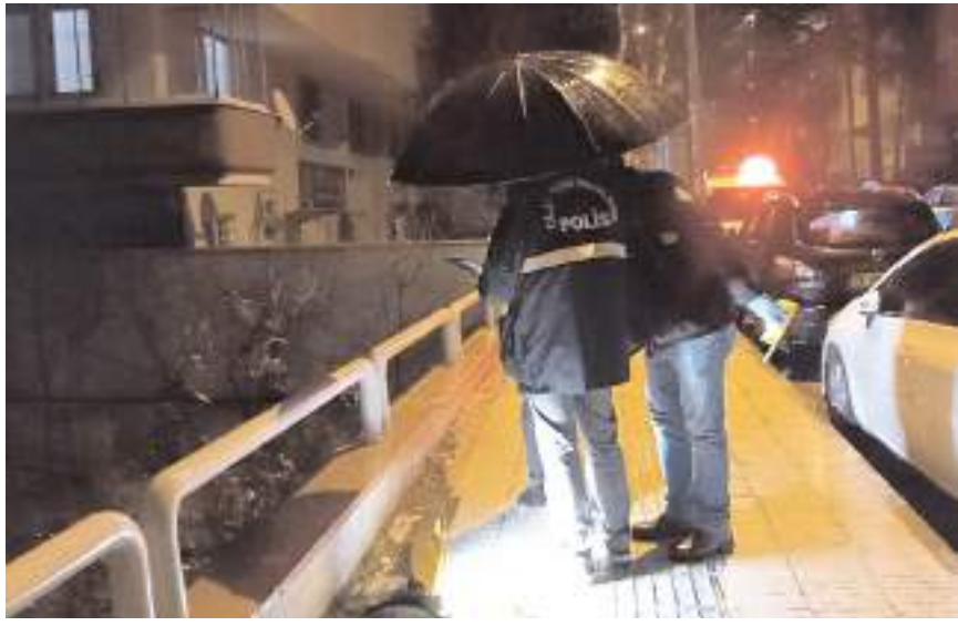
Olay, Üçtutlar Mahallesi Stad 1. Sokak'ta meydana geldi.