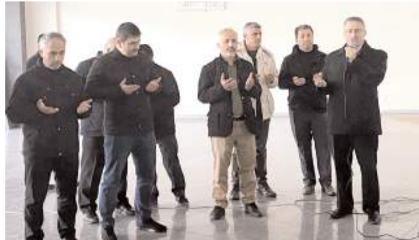
Umreciler dualarla kutsal topraklara uğurlandılar.

Yarıyıl tatilini fırsat bilen öğretmen, öğrenci ve velilerden oluşan 33 kişi Diyanet İşleri Başkanlığı Umre Organizasyonu ile umre vazifesini yerine getirmek üzere ilimizden kutsal topraklara uğurlandı.