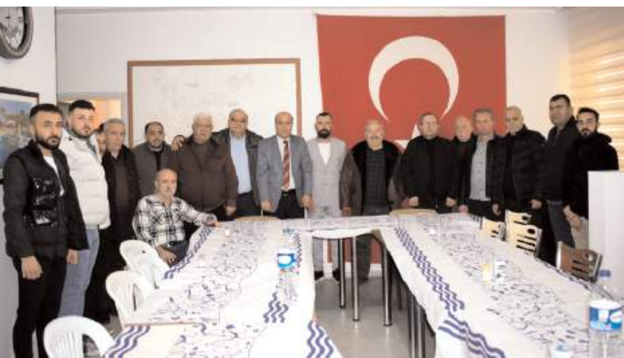
Ulukavak Mahallesi Yaşatma Dayanışma Derneği dernek merkezinde toplantı düzenledi.

Adenoidektomi ve Tonsillektomi (Geniz Eti ve Bademcik Ameliyatları), Allerjik Rinit (Saman Nezlesi) Tanı ve Tedavilerini başarı ile uygulamakta. (Haber Merkezi)