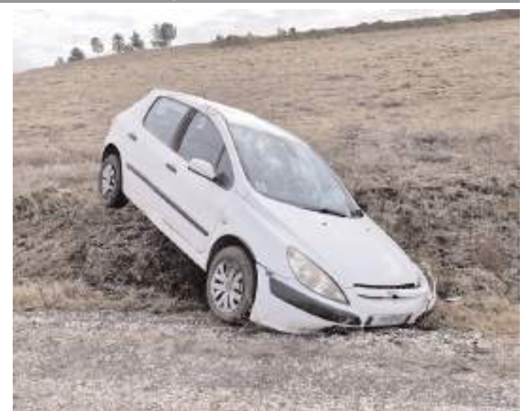
Kaza, Alaca'nın Ünalın köyü yakınlarında meydana geldi.

Kazayla ilgili olarak başlatılan soruşturmanın sürdüğü bildirildi. (İHA)