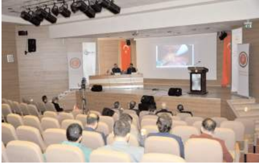
Ameliyathaneden canlı yayında salonda bulunan ve sosyal medya üzerinden Türkiye genelindeki katılımcılar saniye saniye gerçekleştirilen işlemleri izledi.