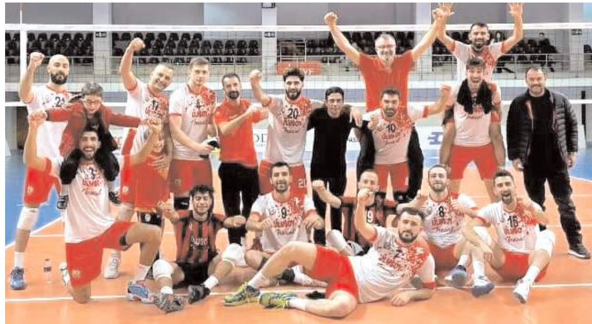
Sungurlu Belediyespor, Başkanlık Beşiktaşlılar deplasmanında 3-0 kazanarak play-off potasındaki yerini korudu

Üçüncü sette tempoyu hiç düşürmeyen ve etkili bir başlangıç yaparak rakibinin maça ortak olmasına izin vermeden Sungurlu Belediyespor bu setide 25-14'lük skorla alarak maçtan 3-0 galip ayrıldı ve ligde son iki maça ikinci sırada girdi. Temsilcimiz bu iki maçı kazanması halinde diğer maçların sonuçlarını beklemeden final grubuna yükselen takım olacak.