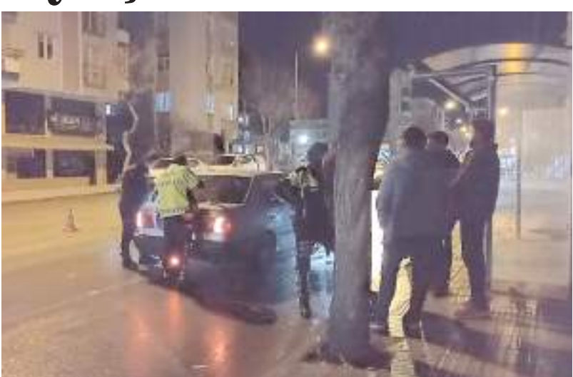
Olay Ata Caddesi'nde meydana geldi.

Çorum'da polis ekipleri tarafından yapılan şok uygulamada, durdurulan bir araçtan uyuşturucu madde ve kullanım aparatı ele geçirildi. Olayla ilgili 3 kişi gözaltına alındı.