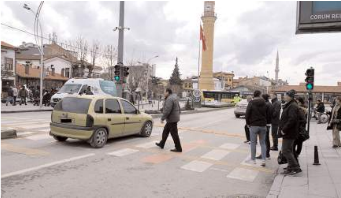
PTT önüne Belediye trafik ışıkları yerleştirdi.