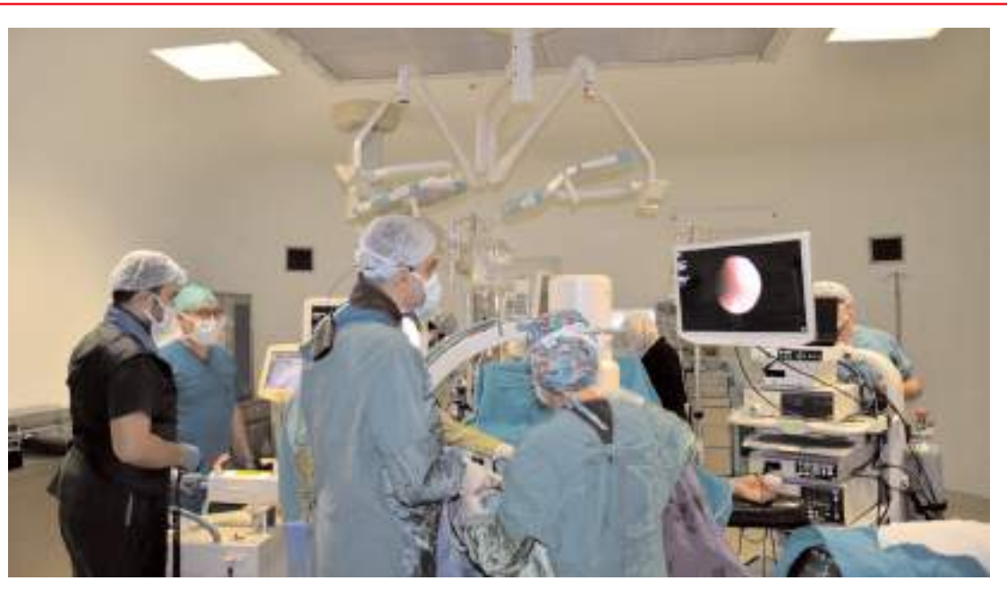
Üroloji alanında güncel tedavilerin ve laporoskopik canlı cerrahilerinin anlatıldığı etkinlikte iki hastanın ameliyatı kapalı ameliyat tekniği ile gerçekleştirildi.