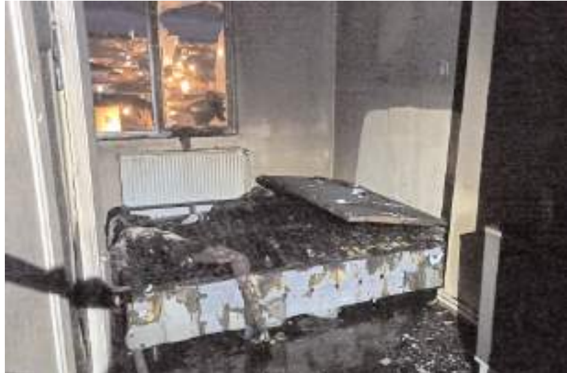
Olay Turan Mahallesi 7005. Sokakta bir apartman dairesinde meydana geldi.

Sungurlu'da bir evde prizde takılı gece lambasından kaynaklanan yangın çıktı.