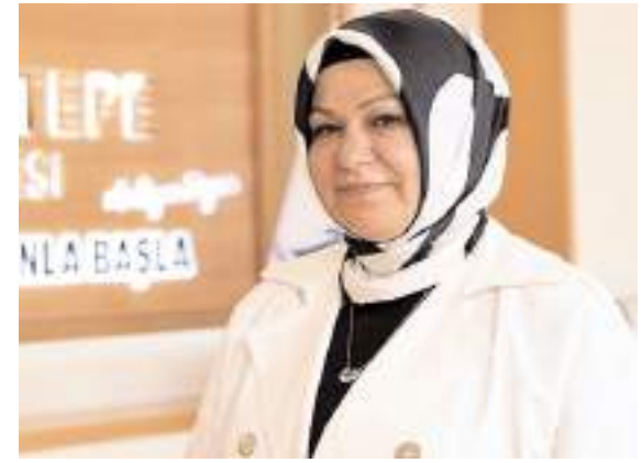
Sancaktepe Belediye Başkanı hemşehrimiz Şeyma Döğücü