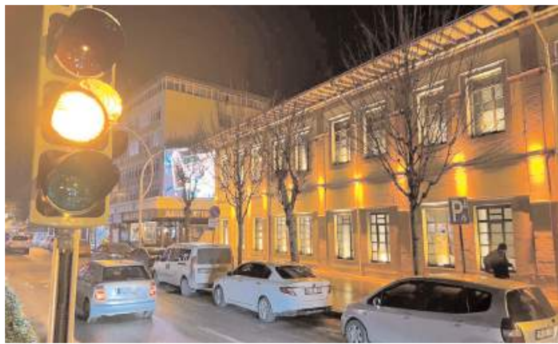
Gazi Caddesi'nde PTT Şubesi önündeki yaya geçidine trafik ışıkları yerleştirildi.

Mahallemizin sorunları çözmek için aday oldum. Ayrıca çevreci bir muhtar aday olarak, "mahallemizi daha yeşil bir yer haline getirmek için, tercihimizi bizi seçerek bu fırsatı bir kez senede daha kaçırmayalım" derim. 31 Mart 2024 Pazar günü gerçekleştirilecek olan Mahalli İdareler Seçimlerinde oylarınıza ve desteklerinize talibim. Gayret bizden, destek sizden ve başarı Allah'tandır. Tüm mahalle sakinlerimizi saygıyla selamlarken diğer muhtar adaylarımıza da başarılar dilerim."