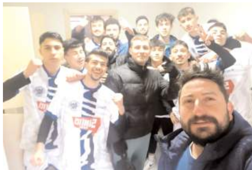
HE Kültürspor maç sonu soyunma odasında galibiyet selfisi

Maçın kalan bölümünde İskilipgücüspor'un beraberlik çabası sonuç vermedi ve maçtan 2-1 galip ayrılarak Kültürspor ligdeki üçüncü galibiyetini aldı ve 9 puanla beşinci sıraya yükselirken İskilipgücüspor 9 puanda kaldı ve bir basamak gerileyerek altıncı sıraya geriledi ve ateş hattına indi.