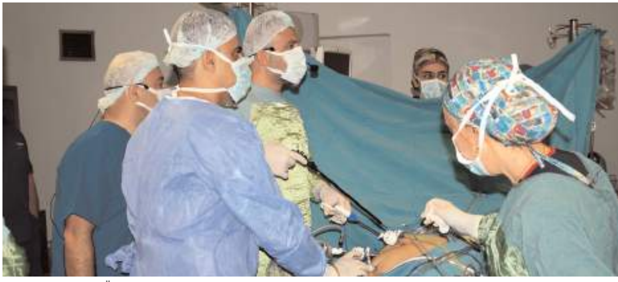
Üroloji alanında güncel tedavilerin ve laporaskopik canlı cerrahilerinin anlatıldığı etkinlikte iki hastanın ameliyatı kapalı ameliyat tekniği ile gerçekleştirildi.