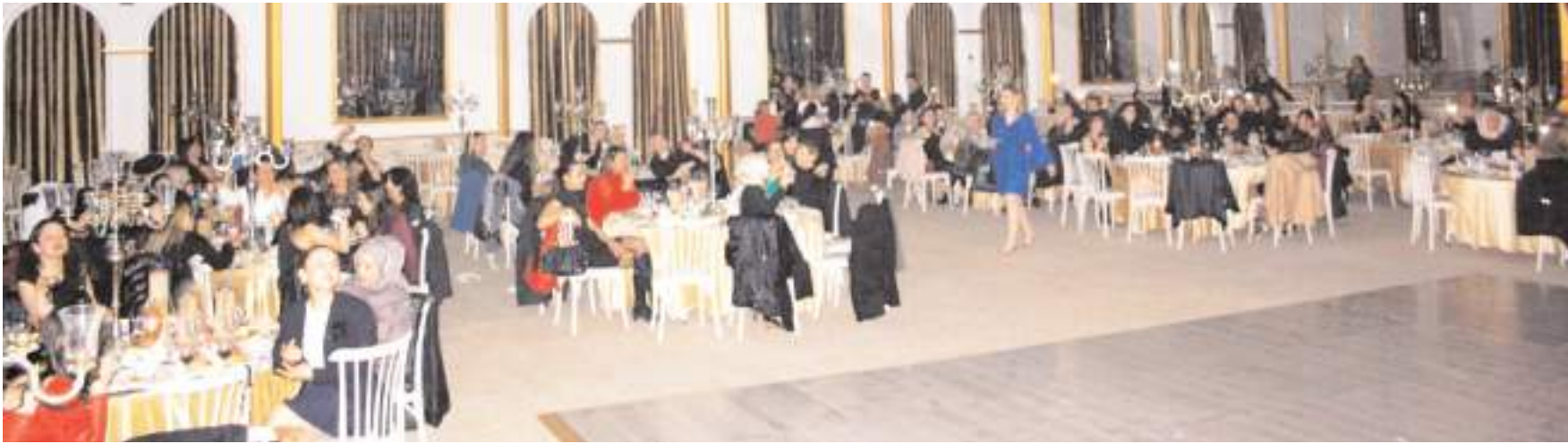
Kadın Muhasebeciler ve Muhasebe Çalışanları Derneği 1.yılı nedeniyle kutlama programı düzenledi.

Fazilet toplumunda genel ahlak, fazilet temeline oturur ve bu ahlaka aykırı davranışların alenen (açıkça) ortaya konması engellenir.