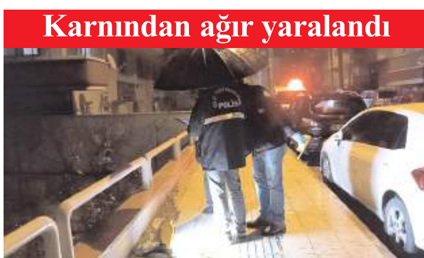
Olay, Üçtutlar Mahallesi Stad 1. Sokak'ta meydana geldi.

■ Çorum'da motosikletli şahsın silahlı saldırısına uğrayan vatandaş ağır yaralandı. Saldırıcıyı gerçekleştiren şahıs ise saklandığı evden yakalanarak gözaltına alındı. * HABERİ2'DE