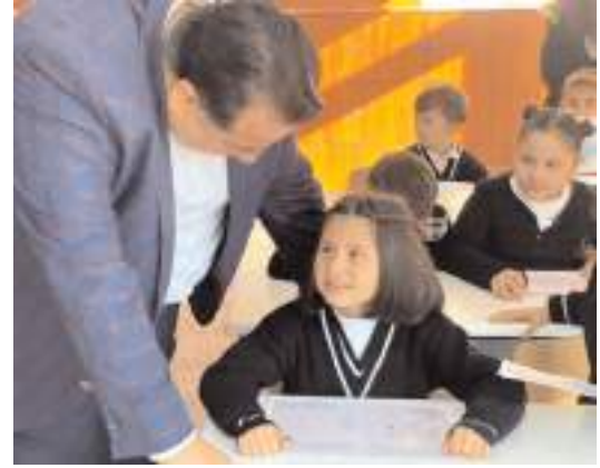
Milletvekili Oğuzhan Kaya, yarıyıl ile ilgili değerlendirme buldu.

Kaya, "Bu duygu ve düşüncelerle; ülkemizi yarınlar taşıyacak olan sevgili öğrencilerimizi ve onları hayata hazırlayan kıymetli yönetici ve öğ-