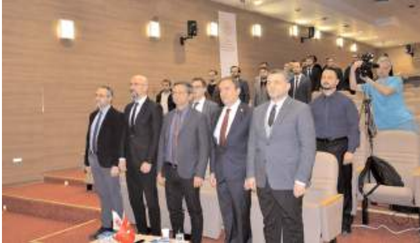
Kurs, Hitit Üniversitesi Tıp Fakültesi, Erol Olçok Eğitim ve Araştırma Hastanesi ve Minimal İnvaziv Üroloji Derneği iş birliğinde düzenlendi.