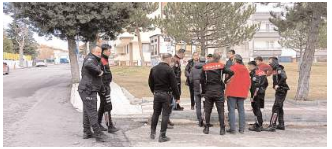
Olay, Bahçelievler Mahallesi Karşıyaka Sokak üzerinde bulunan bir çocuk parkında meydana geldi.