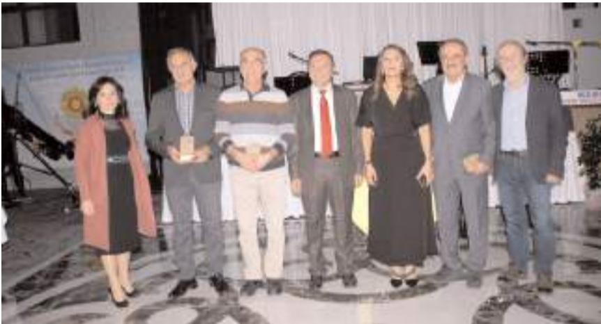
Emekliye ayrılan sendika üyelerine plaket verildi.