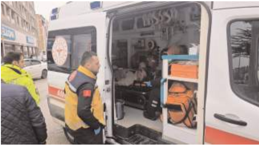
Yaralı sürücüye ilk müdahale olay yerinde sağlık ekipleri tarafından yapıldı.