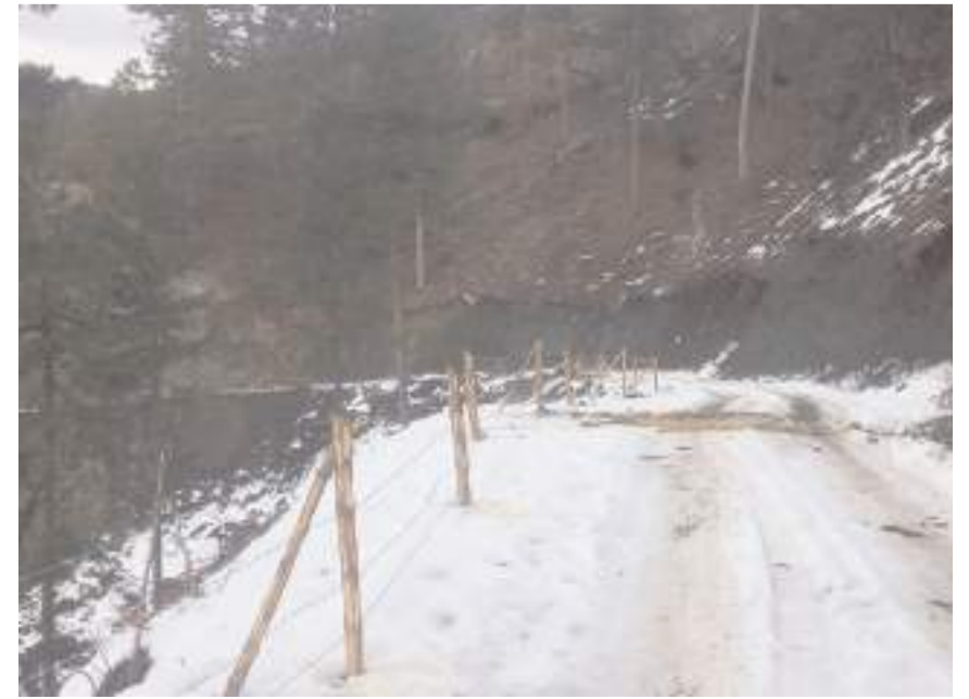
Kargı'lı köylülerin toplam alacağının 35 milyon TL olduğu belirtildi.