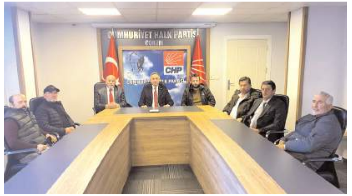
Orman köylüleri CHP Çorum Milletvekili Mehmet Tahtasız'ı ziyaret ederek sorunlarını dile getirdiler.

Zanlılara ait araçta yapılan aramada 21 bin tablet sentetik ecza ile suçtan elde edildiği değerlendirilen 33 bin 200 lira, 300 dolar ve 50 avro ele geçirilmişti. (AA)