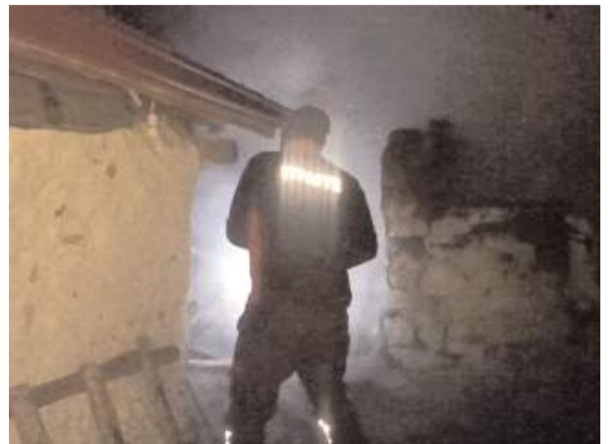
Yangında kömürlükte maddi hasar meydana geldi.

Yangınla ilgili başlatılan soruşturma sürüyor.