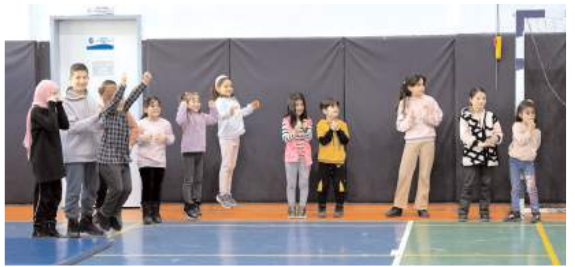
Çorum Belediyesi'nin öğrenciler için düzenlediği "Sömestir Eğlenceleri" başladı.