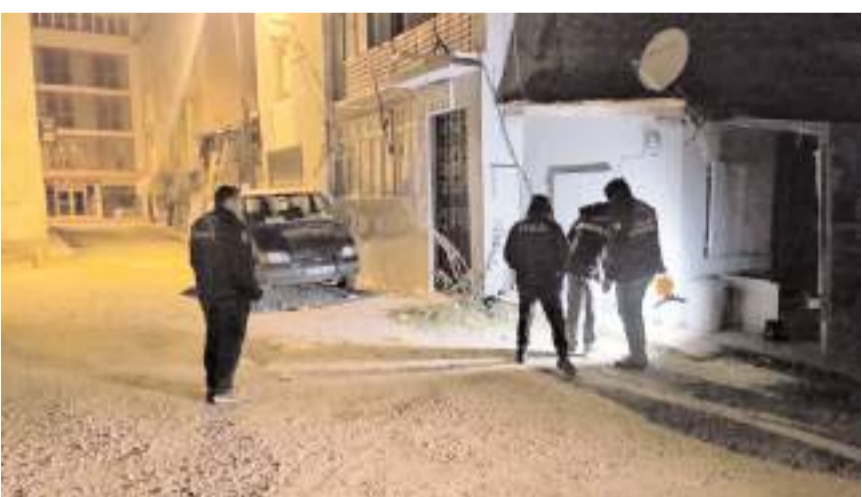
Polis ekipleri silahlı saldırı olayının meydana geldiği yerde inceleme yaptı.