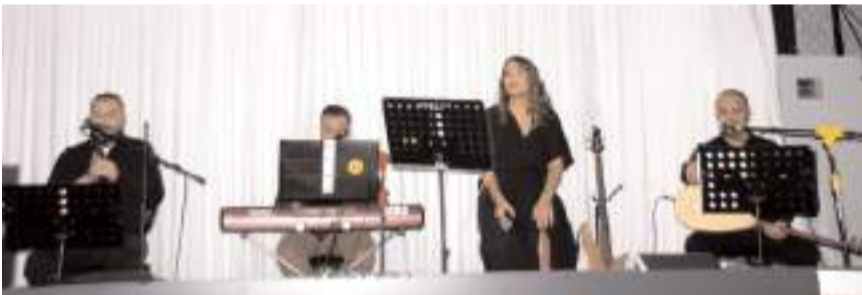
Programda müzik dinletisi yapıldı.

Program canlı müzik eşliğinde çekilen halaylarla sona erdi.