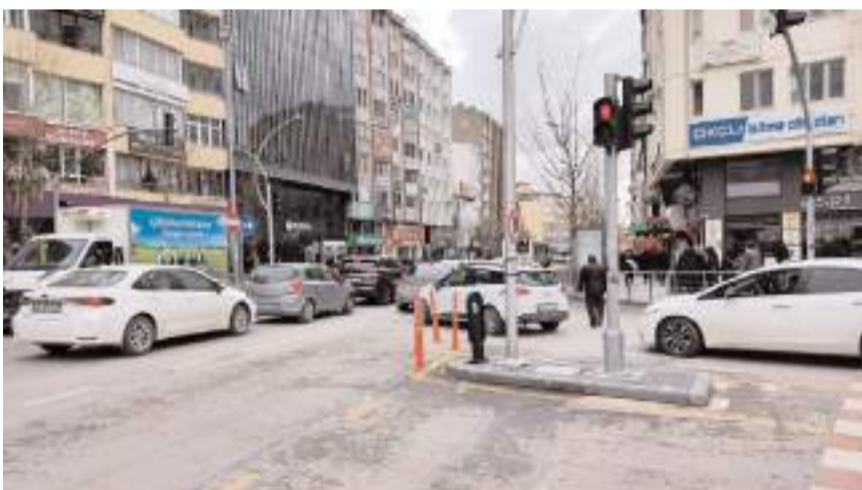
Gazi ve İnönü Caddelerinde süreli park uygulamasının getirilmesi isteniyor.