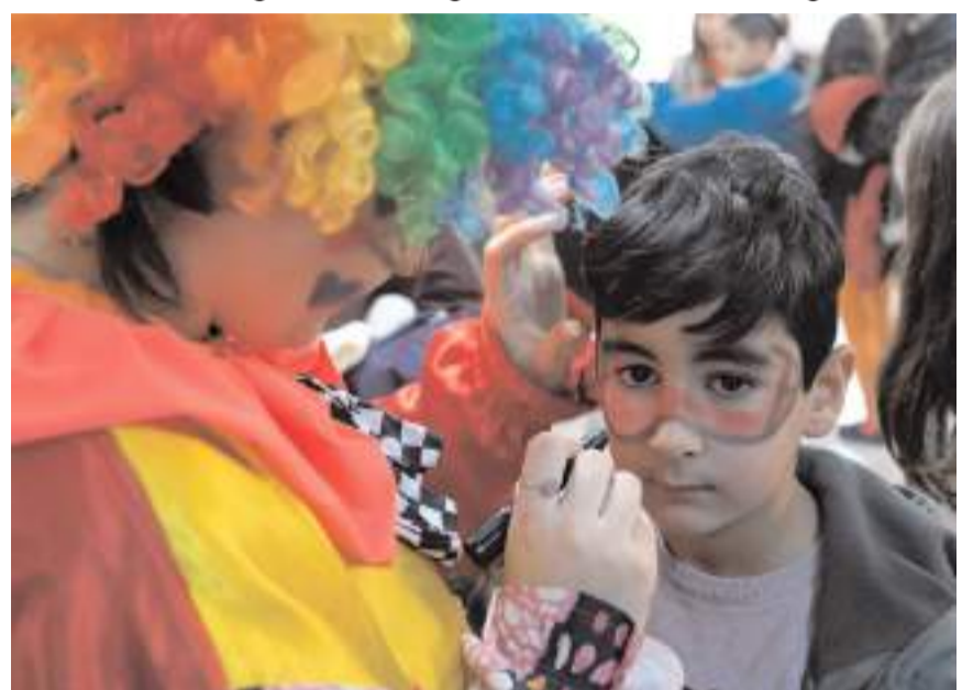
Eğlenceler kapsamında çok sayıda etkinlik yapılacak.