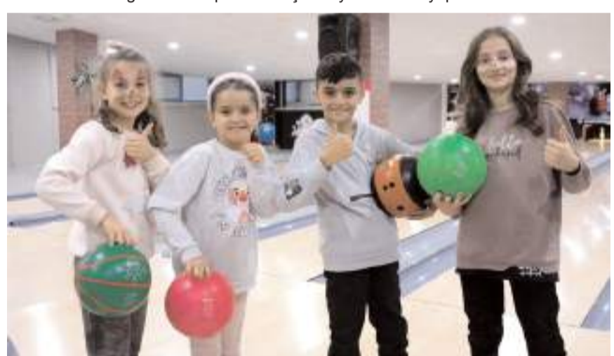
Sömestir eğlenceleri Buhara Kültür Merkezi'nde 1 Şubat'a kadar devam edecek.