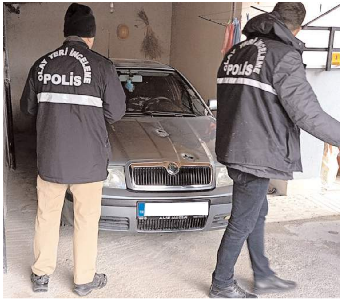
Olay, Gülabibey Mahallesi Kafkas Evler 8. Sokakta meydana geldi.