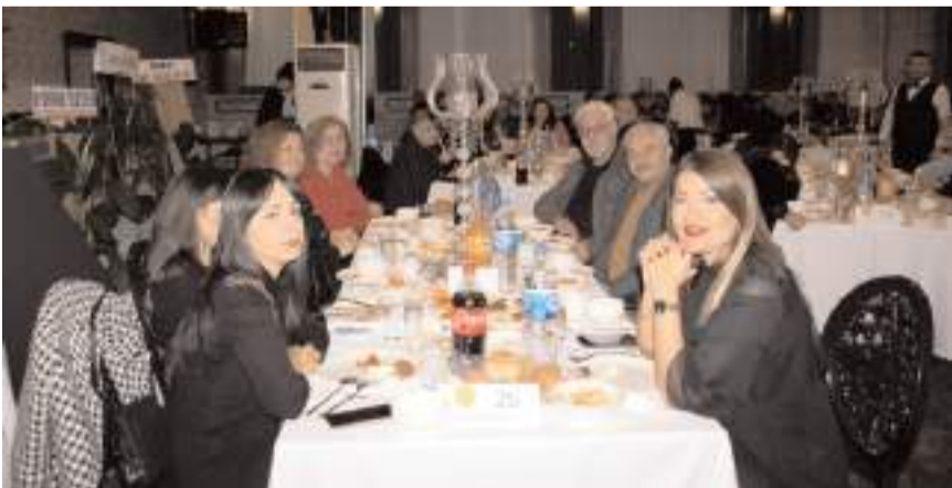
Programa katılım yüksek oldu.