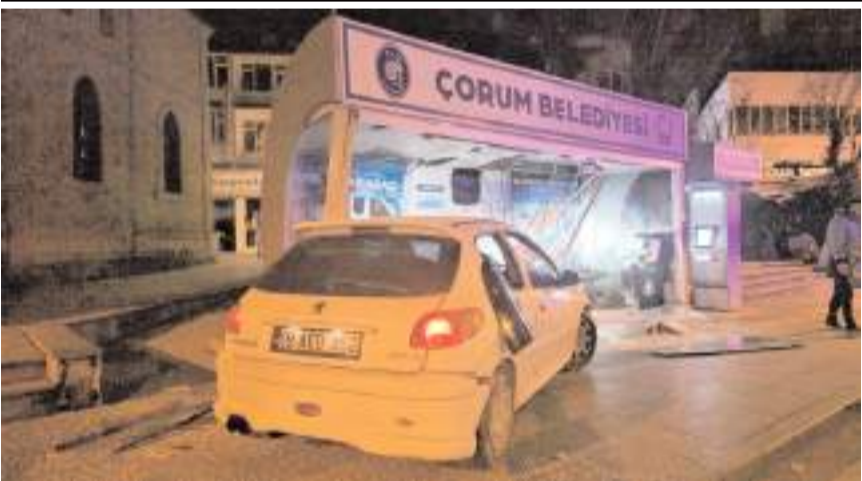
Olay Kubbeli Cami yanında meydana geldi.