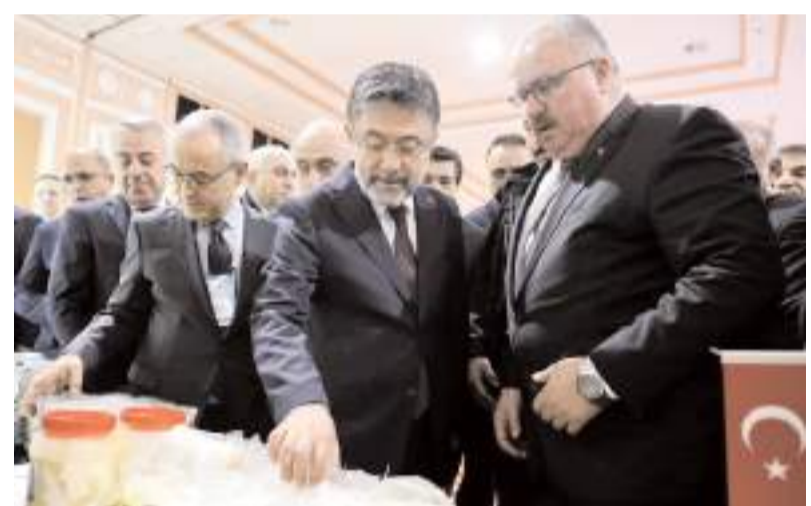
Çalıştaya Tarım ve Orman Bakanı İbrahim Yumaklı da katıldı.

Bakan Yumaklı, "Bu çalıştaya katılmak hususlardan ciddi bir beklentimiz var. Bizim oluşturduğumuz kapsamı büyük oranda teyit edecek. Buradan çıkacak sonuçta eğer eksik bıraktığımız bir şey varsa hayvancılık politikamıza ekleyeceğiz. Çiğ süt eylem planımızın sonucunda süt üretiminde sürdürülebilirliğin korunmasını ve piyasa istikrarının sağlanmasını bekliyoruz. Üreticilerimizin güçlendirilmesini, çiğ sütün Avrupa Birliği (AB) kriterlerine uygun hale getirilmesini hedefliyoruz." diye konuştu