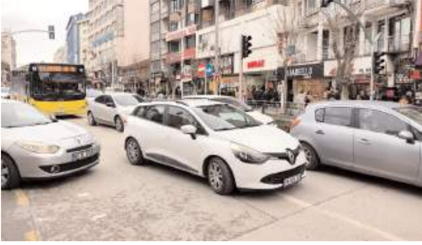
Çorum'da trafiğe kayıtlı araç sayısı Aralık ayı sonu itibarıyla 197 bin 111 oldu.

■ Türkiye İstatistik Kurumu (TÜİK) trafiğe kayıtlı taşıt istatistiklerini açıkladı. TÜİK verilerine göre Çorum'da trafiğe kayıtlı taşıt sayısı 2023'te bir önceki yıla göre 10 bin 903 adet artış gösterdi. * HABERİ7'DE