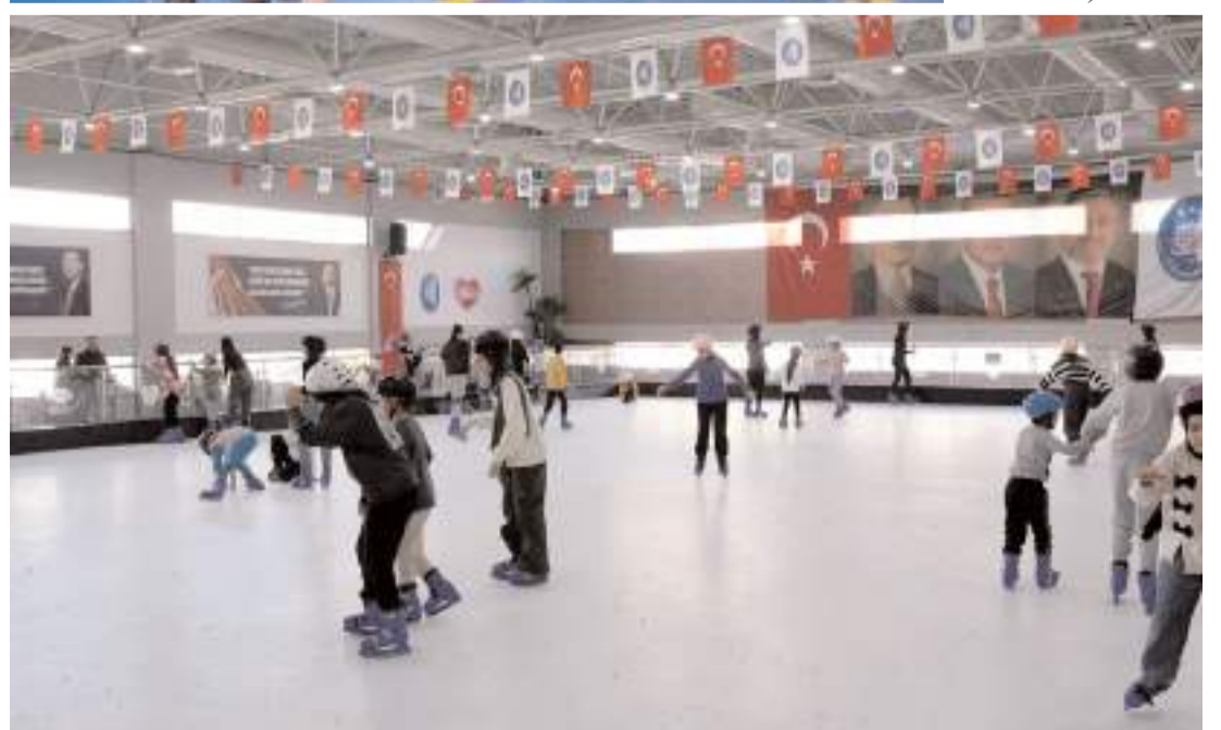
Sömestir eğlencelerinin ikinci etabı ise AHL Park AVM'de yapılacak.

Çorum Belediyesi'nin yarıyıl tatiline giren öğrenciler için düzenlediği "Sömestir Eğlenceleri" başladı. Çocuklar birbirinden eğlenceli etkinliklerle tatilin tadını çıkarıyor.