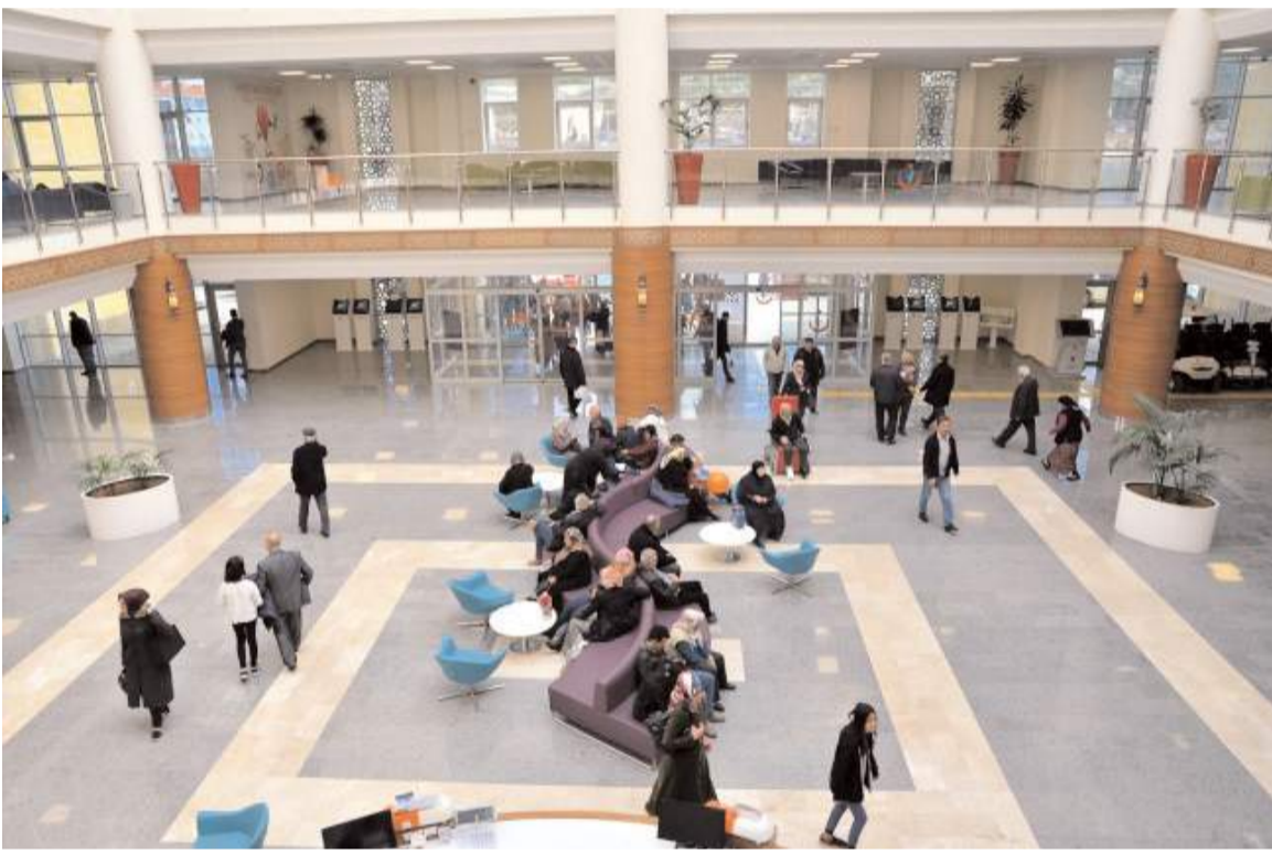
Hastanede geçen yıl 520 bin kişi MHRs'den randevu alarak muayene olmuş.