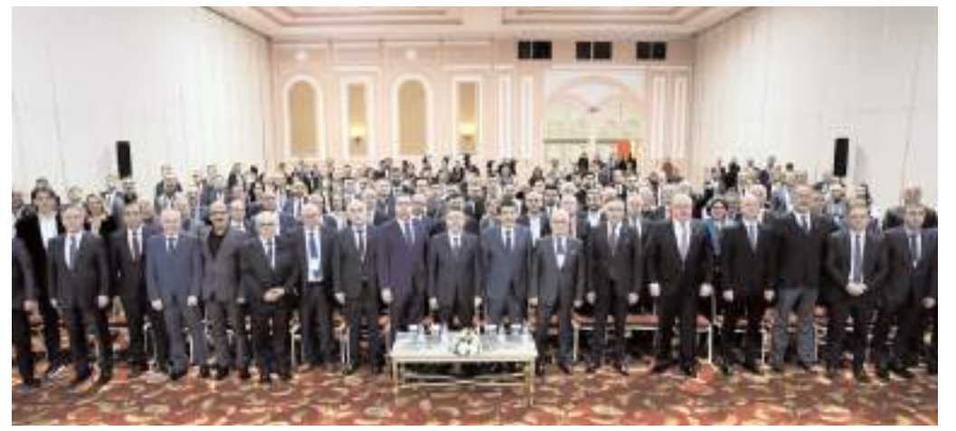
‘Üretim ve Üreticinin Yüzyılı’ temalı ‘Ulusal Süt Çalıştayı’ Antalya’da yapıldı.

Gür, "Bundan 5 yıl önce de başkanımızın ilk ziyaret ettiği yer Çorum Esnaf ve Sanatkar Odaları Birliği olmuştu. Bir kez daha seçim sürecinde ilk ziyaret ettiği yerin ÇESOB olması bizlere son derece mutlu etti. Geride kalan 5 yıl boyunca belediyemizle birlikte şehrimiz için çalışmalar yaptık. Bu süreçte bizlere verdiği desteklerden dolayı Belediye Başkanımıza teşekkür ederiz. Çıktığı bu yolda başarı diliyoruz. Önümüzdeki seçim sürecinin huzurlu ve sağlıklı, şehrimize yakışır şekilde, birlik ve beraberlik içerisinde geçmesini temenni ediyoruz" ifadelerini kullandı. (Haber Merkezi)