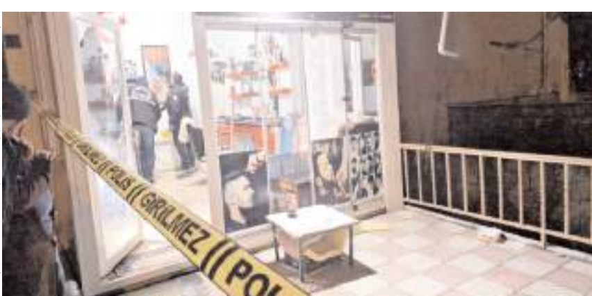
Olayda iş yerinde maddi hasar meydana geldi.

Camları kırılan ve içerisinde hasar oluşan iş yerinde olay yeri ekiplerince inceleme yapıldı.