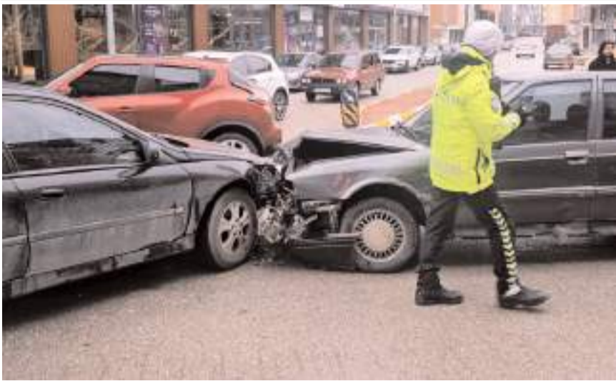
Kaza Yeni Yol Mahallesi Kıbrıs Caddesi'nde meydana geldi.