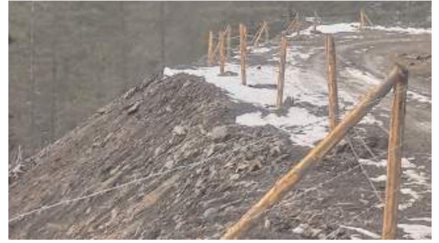
Köylüler Ocak ayında teslim ettikleri ağaçların faturasını 2023 Aralık ayında kesmelerine rağmen ödemeleri yapıldı.

Tahtasız, konuyla ilgili Tarım ve Orman Bakanı İbrahim Yumaklı'nın yanıtı istemiyle soru önergesi verdiğini de sözlerine ekledi. (Haber Merkezi)