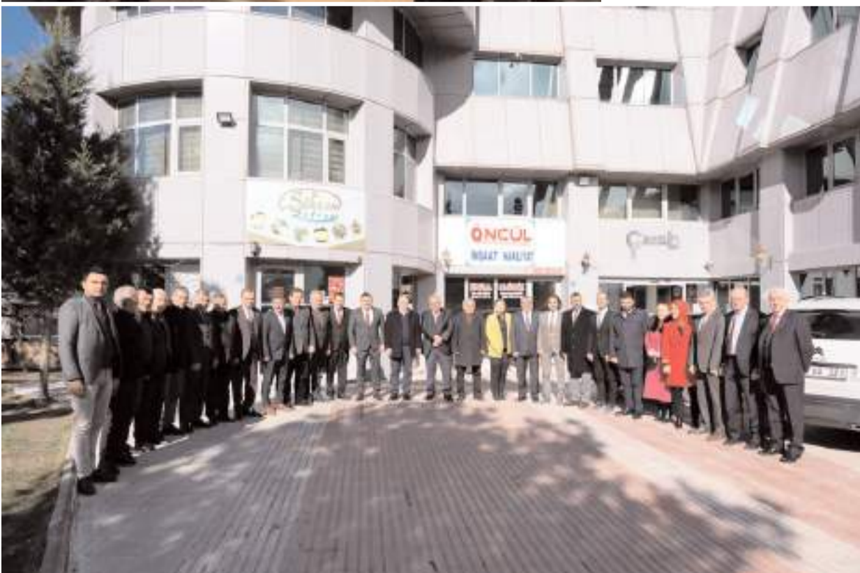
Ziyaretin sonunda toplu hatıra fotoğrafı çekildi.