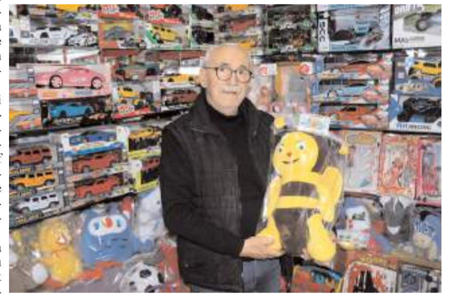
Kadınların yaptığı peluş oyuncaklara ilgi yüksek oldu.