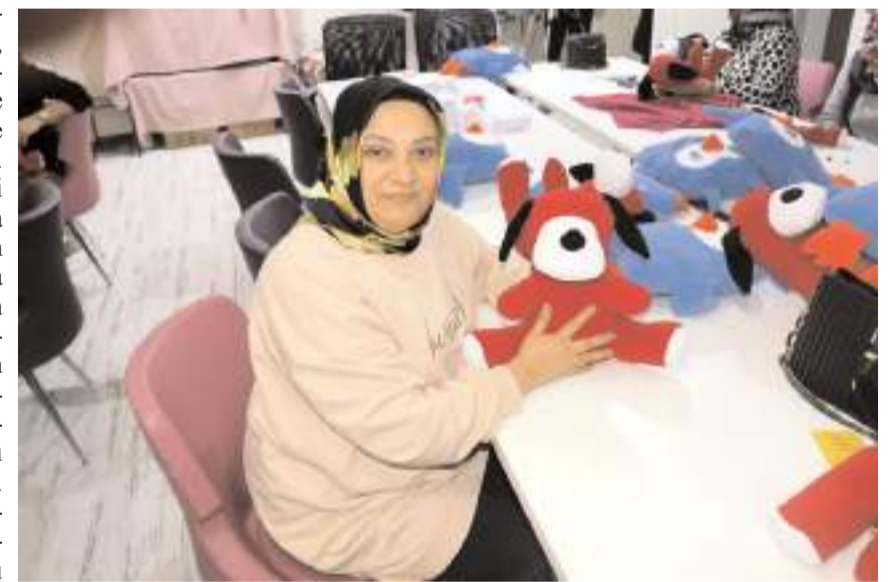
Kadınlar Babil Kadın Kooperatifinde oyuncak üretimi yapıyor.

oluyoruz. Aileye ve evimize destek oluyoruz. Burayı evimiz gibi yaptık" ifadelerini kullandı.