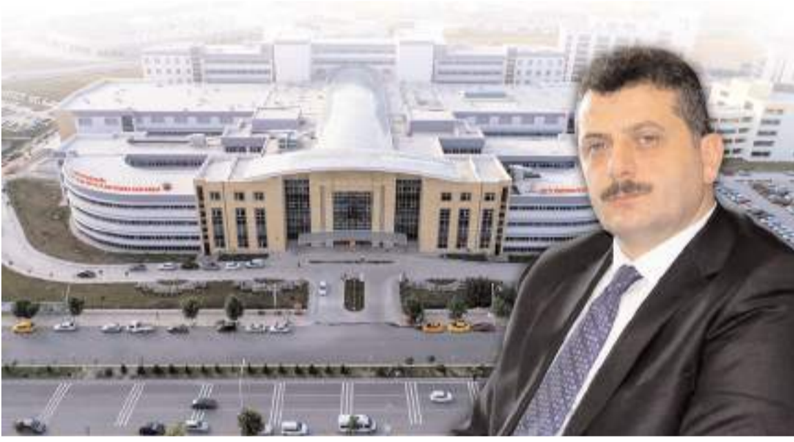
Hastanede 2023 yılında 1 milyon 778 bin muayene yapıldı.

■ Hitit Üniversitesi Erol Olçok Eğitim ve Araştırma Hastanesi'nden yapılan açıklamaya göre, hastanede 2023 yılında 1 milyon 778 bin muayene yapıldı. Bunlardan 520 bini MHR'S'den randevu ile gerçekleşirken 69 bin 295 kişi ise randevu aldığı halde muayene olmaya gitmedi. * HABERİ2'DE