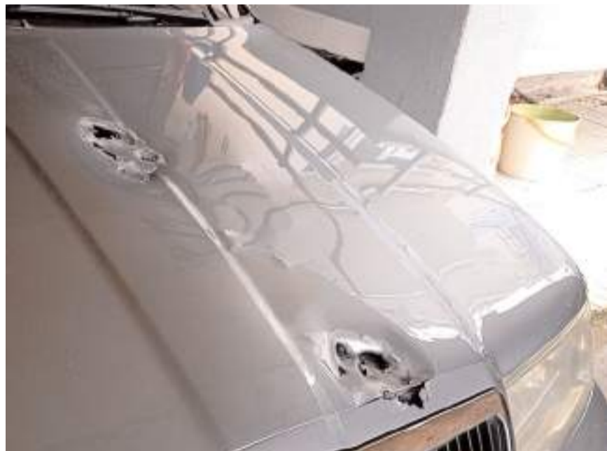
Olayda otomobilde maddi hasar meydana geldi.