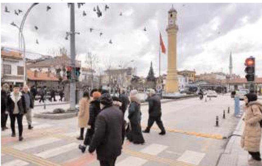
Gazi ve İnönü Caddelerinde bulunan yaya geçidi sayısının azaltılması isteniyor.

"Yukarıda belirttiğim öneriler her hangi bir maliyet gerektirmeyen basit tedbir ve düzenlemelerle hayata geçirilebilecek çözümlerdir. Bunun yanı sıra Gazi ve İnönü Caddeleri için Hitit Üniversitesi Kuzey Kampüsünden başlayarak TOKİ'ye uzanan hafif raylı bir sistem düşünülebilir. Ayrıca, Saat Kulesi çevresine son derece modern, dünyada örnekleri bulunan hem yayaların güvenliği, hem de akıcı bir trafik için farklı çözümler üretilebilir." (Haber Merkezi)