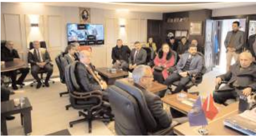
Ziyarete AK Parti teşkilat yöneticileri de katıldı.