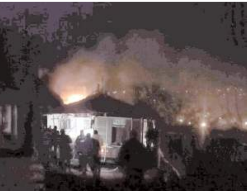
İtfaiye ekipleri yangını büyümeden söndürdü.