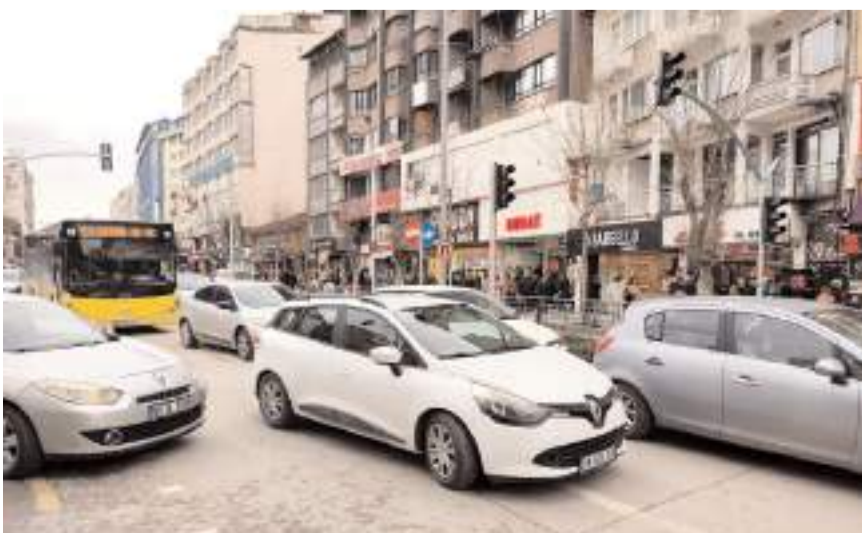
Çorum'da ise trafiğe kayıtlı araç sayısı Aralık ayı sonu itibarıyla 197 bin 111 oldu.

2023 yılında 197 bin 111 adet trafiğe kayıtlı aracın dağılımı ise şu şekilde gerçekleşti: "Otomobil 90 bin 847, minibus 2 bin 466, otobüs 1003, kamyonet 24 bin 186, kamyon 6 bin, motosiklet 25 bin 662, traktör 46 bin 488, özel amaçlı 459."