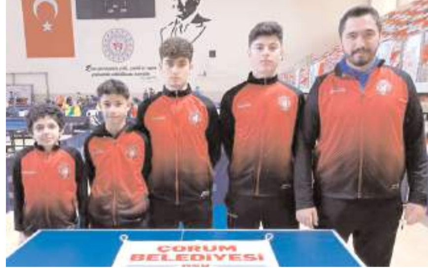
Çorum Belediyespor erkek takımı ikinci etap sonunda final grubuna yükselmeyi başardı

Play-off maçları sonunda 1. lige yükselen takımlar belli olacak.