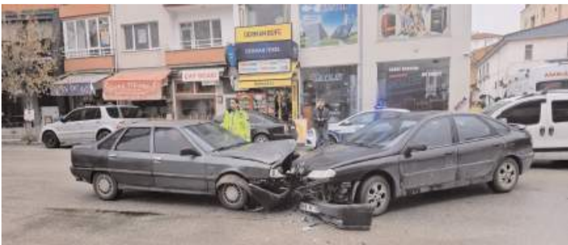
Kaza nedeniyle trafik bir süre durdu.