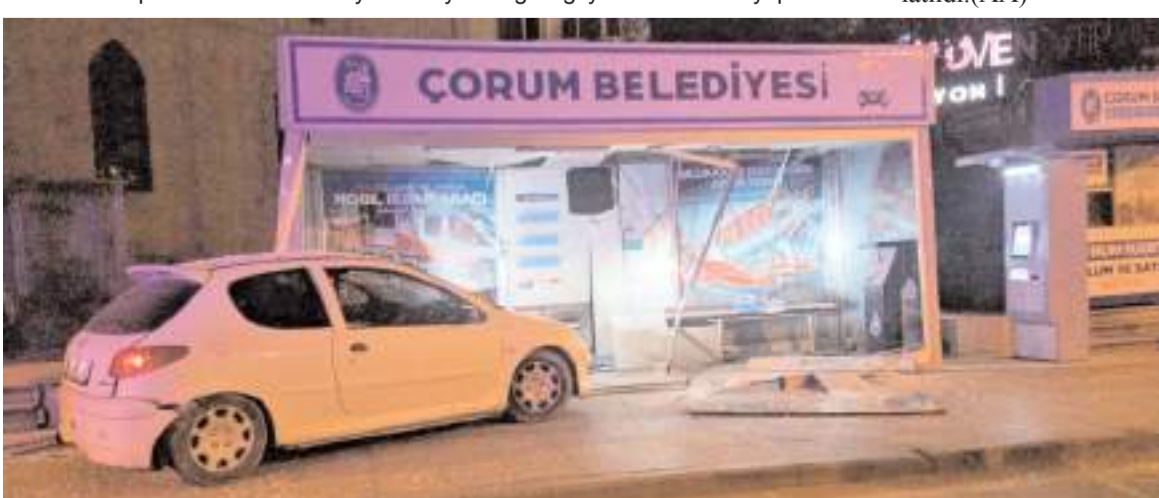
Aracın çarptığı otobüs durağında maddi hasar meydana geldi.

Çorum'da karşı yönlerden gelen iki otomobilin çarpıştığı kazada 1 sürücü yaralandı.