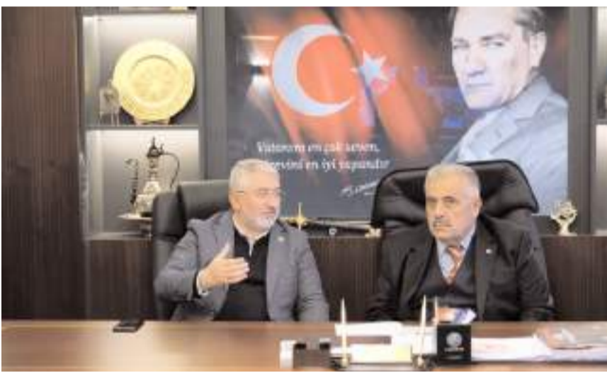
Başkan Aşgın, ziyaretinde esnafa yönelik yaptıkları hizmetlerden bahsetti.