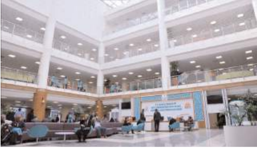
Hastanede 2023 yılında 1 milyon 778 bin muayene yapıldı.

Hastane yönetimi bu duruma tepki göstererek; "1 dakikanızı ayırarak 1 kişiye daha tedavi şansı tanıyabilirsiniz." ifadelerine yer verdi