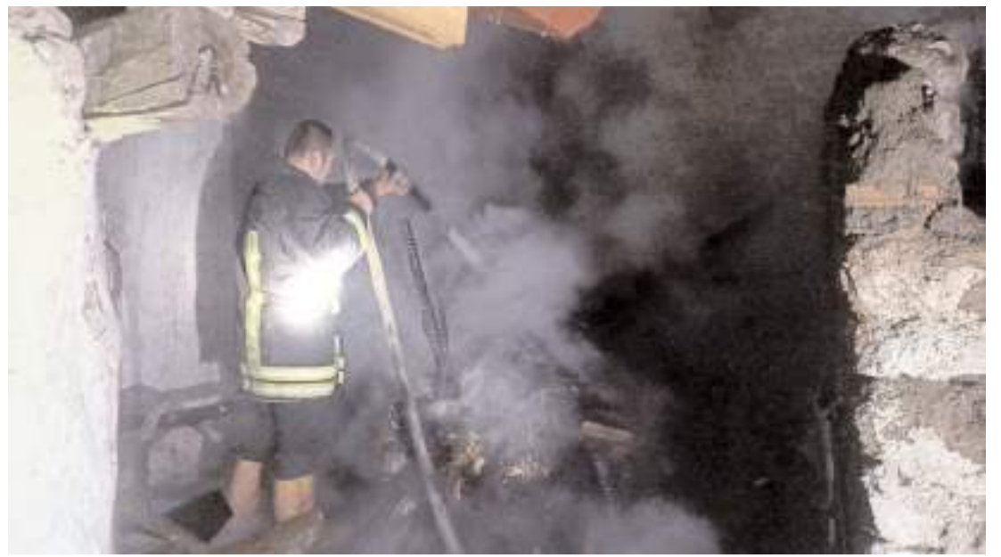
Yangın Hacettepe Mahallesi 1040. Sokak'ta bir evin kömürlük kısmında çıktı.