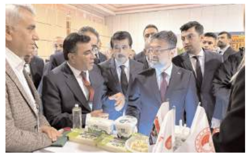
Çorum Damızlık Sığır Yetiştiricileri Birliği stant açtı.