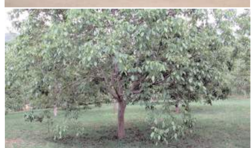
Oğuzlar Cevizi, ilçe sınırları içinde 510 metreden 1260 m rakıma kadar değişen yükseltide yetişiyor.