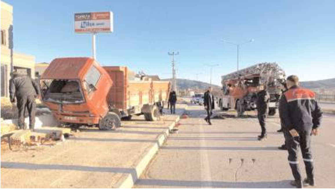
Kaza, Koyunbaba Mahallesi, Rifat Göbel Caddesinde meydana geldi.

Cuma gününden itibaren Çorum'da hava sıcaklığı ise 4-5 derece arasında seyredecek.