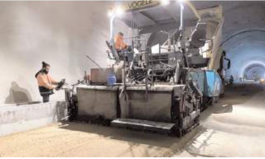
Tünellerin içinde asfalt çalışmaları yapılıyor.