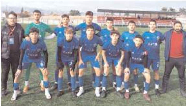
Kültürspor play-off yolundaki rakibini yenerek ikincilik için umutlarını artırdı