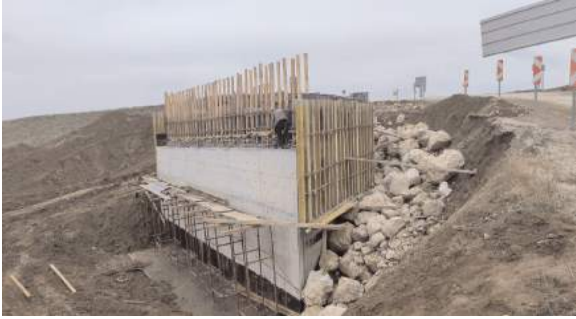
Körpü Bayat-Eskialibey Köyü arasında bulunuyor.

Vali Dağlı'nın konuşmasının ardından kamu kuruluşlarının yöneticileri, Çorum'da yürütülen çalışmalarla ilgili sunum yaptı.