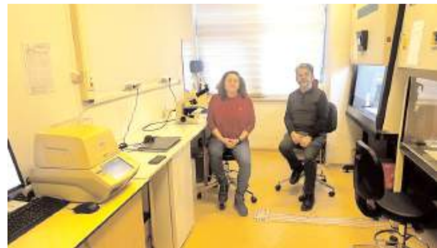
Projenin ortakları arasında Hitit Üniversitesinde bulunuyor.