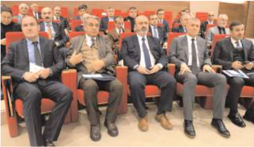
Toplantıya kaymakamlar, şube müdürleri ve bölge müdürleri ile kurulun diğer üyeleri katıldı.