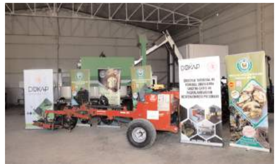
'Ceviz Üreticilerinin Desteklenmesi' projesi kapsamında Oğuzlar Ceviz Üreticileri Birliği'ne ceviz hasat makinesi hibe edildi.

Oğuzlar 77 çeşidinden üretilen ve Oğuzlar ilçesinin simgesi olan Oğuzlar Cevizi, ilçe sınırları içinde 510 metreden 1260 m rakıma kadar değişen yükseltide yetişir. Çok şiddetli soğuklara maruz kalmadığı sürece düzenli olarak meyvesini verir. Oğuzlar Cevizi kendine özel dallanma biçimiyle diğer cevizlerden çok kolay olarak ayırt edilebilir. Ağaç gövdesi gri renkli olup, sık dallı olarak gelişir. Oğuzlar Cevizinde meyvenin dış rengi koyu yeşildir ve meyvenin ucu hafifçe sivri görünümündedir. İç rengi açık sarıdır ve uzun süre bu rengini muhafaza edebilir. Oğuzlar Cevizinin meyveleri eylül sonlarında hasat edilir ve kurutulur. Oğuzlar Cevizinin lezzetli meyvesi, kabuktan bütün olarak kolay ayrıldığından, cevizi kabuktan ayırmak için özel bir alete gerek duyulmaz.