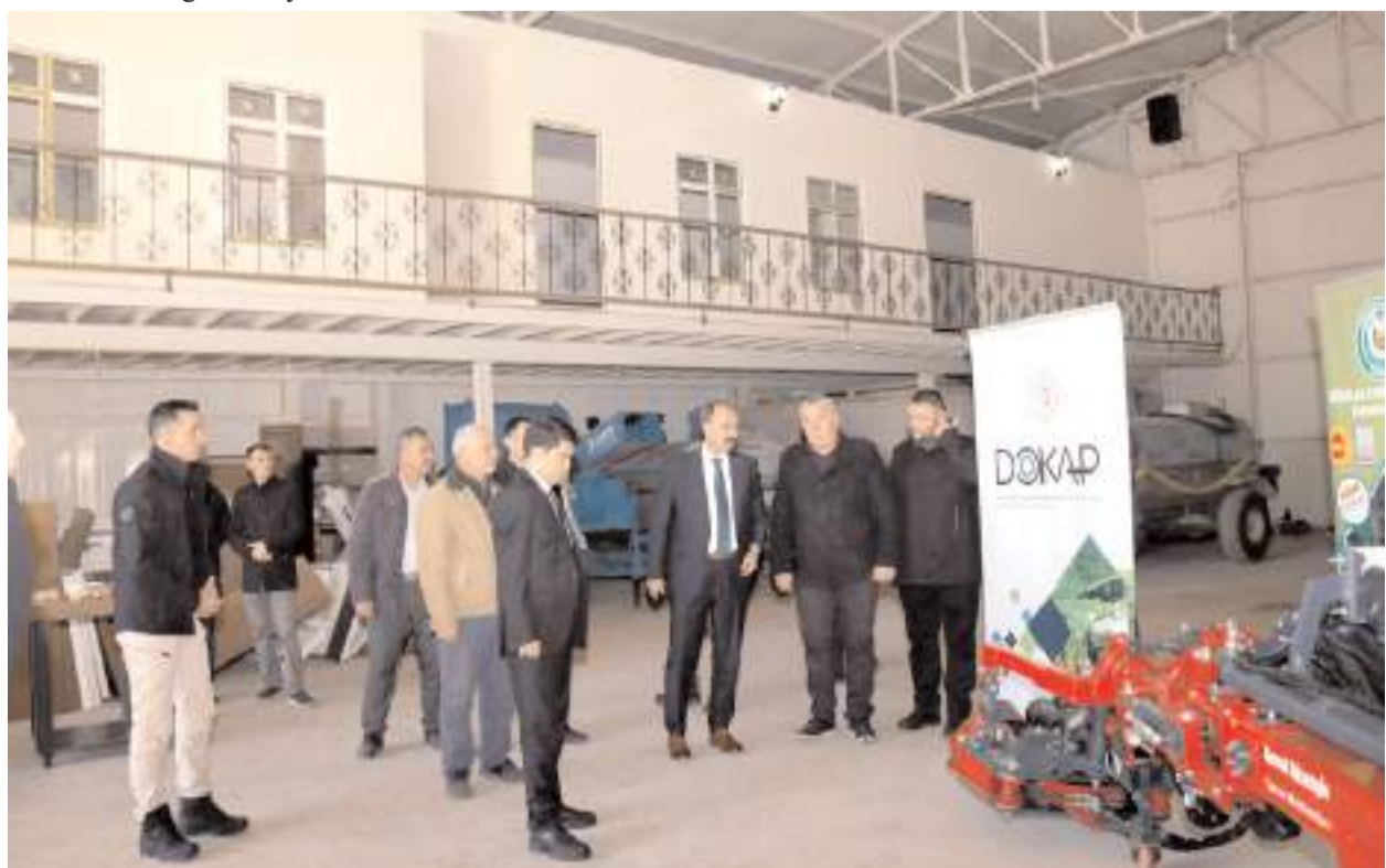
Protokol üyeleri makineyi yakından inceledi.