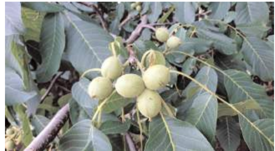
Oğuzlar Cevizi 2020 yılında Türk Patent ve Marka Kurumunca tescillenmişti.