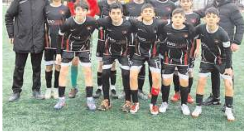
Hattuşa Gençlikspor Çorumspor önünde farklı kazanarak final grubuna yükseldi

SAHA: Devane. HAKEMLER: İsmail Sırma, Abdullah Enes Gökçüney, Sefa Kabak.