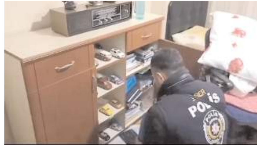
Operasyonlar 20 ilde yapıldı.

İçişleri Bakanı Yerlikaya, sosyal medya hesabından yaptığı açıklamada, "Sibergöz-16" operasyonlarında 35 şüphelinin yakalandığını belirterek, "Çocuklarımızı koruma için suçlularla mücadele etmeye kararlıyız. Emniyet Genel Müdürlüğü Siber Suçlarla Mücadele Daire Başkanlığı koordinasyonunda, Ankara Siber Suçlarla Mücadele Şube Müdürlüğüne yürütülen çalışmalar kapsamında, Ankara merkezli Adana, Ağrı, Aydın, Bolu, Bursa, Çorum, Denizli, İstanbul, Kayseri, Kırkkale, Konya, Malatya, Muğla, Sakarya, Sinop, Sivas, Te-kirdağ, Tokat, Yalova'da eş zamanlı operasyonlar düzenlendi. Sosyal medya uygulamaları üzerinden grup kurularak çocukların müstehcen görüntülerinin para karşılığı satışı sunulduğu, çeşitli ödeme kanalları ile ödemelerin gerçekleştirildiği ve sosyal medya platformlarında çocuk istismarı görüntülerinin paylaş-tığı tespit edildi. Operasyonları sonucunda çok sayıda dijital materyale el konuldu. Operasyonları gerçekle-