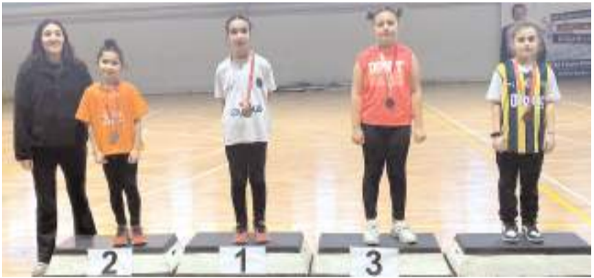
Dereceye giren sporculara madalyaları düzenlenen törenle verildi