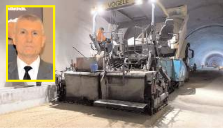
Tünellerin içinde asfalt çalışmaları yapılıyor.

Karayolları Bölge Müdürü Rifat Silov, Kırkdilim'de 3 tüp tünelin yapımının tamamlandığını ve üst yapı çalışmalarını kapsamında asfalt seriminin başladığını belirterek, tünelleri yaz aylarında tamamen trafiğe açmayı hedeflediklerini söyledi.