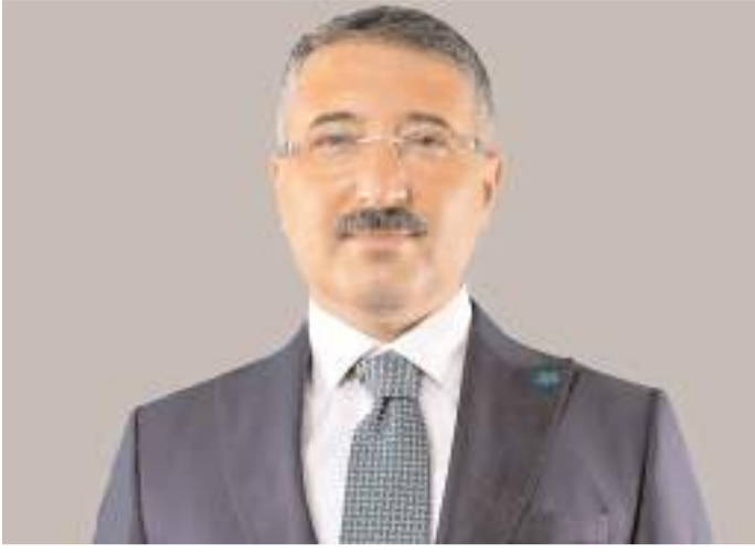
Av. Rumi Bekirođlu