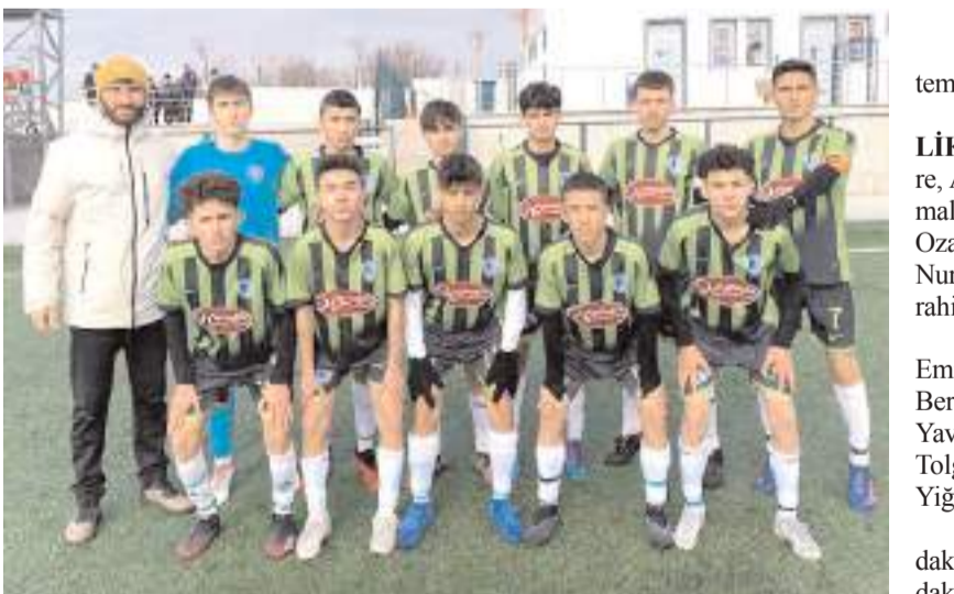
Mimar Sinan grubundaki sekizinci maçında farklı kazanarak yoluna kayıpsız devam etti