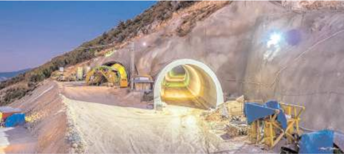
Kırkdilim'de 3 tütünelin yapımı tamamlandı.