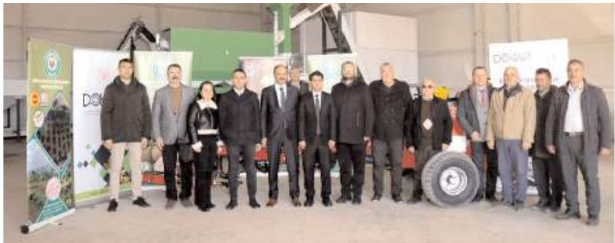
Ceviz hasat makinesi yapılan törenle teslim edildi.

Resmi İlanlar: www.ilan.gov.tr 'de (Basın: 1973214)