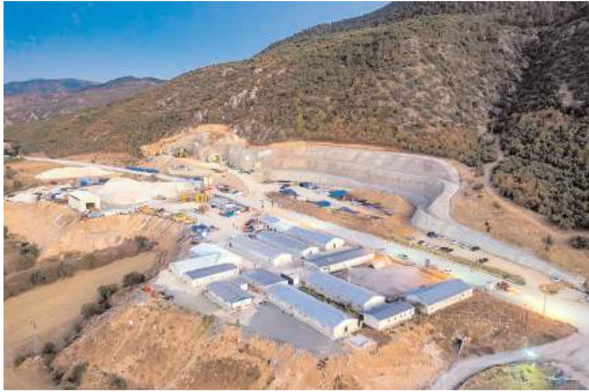
Kırkdilim'in yaz aylarında tamamen trafiğe açılması hedefleniyor.

Yaz ayında Kırkdilim'i tamamen trafiğe açmayı hedeflediklerini belirten Silov;" Kırkdilim geçişinde bugüne kadar T1 tüneli (2x1389m), T2 tüneli (2x1157m) ve T3 tüneli (1553m) olmak üzere 2x4100m uzunluğundaki 3 adet tünelde kazı+destekleme+nihai kemer betonu imalatları tamamlanmış olup tünellerinde kablo kanalı ve üst yapı çalışmaları kesintisiz olarak tüm hızıyla devam etmektedir." dedi