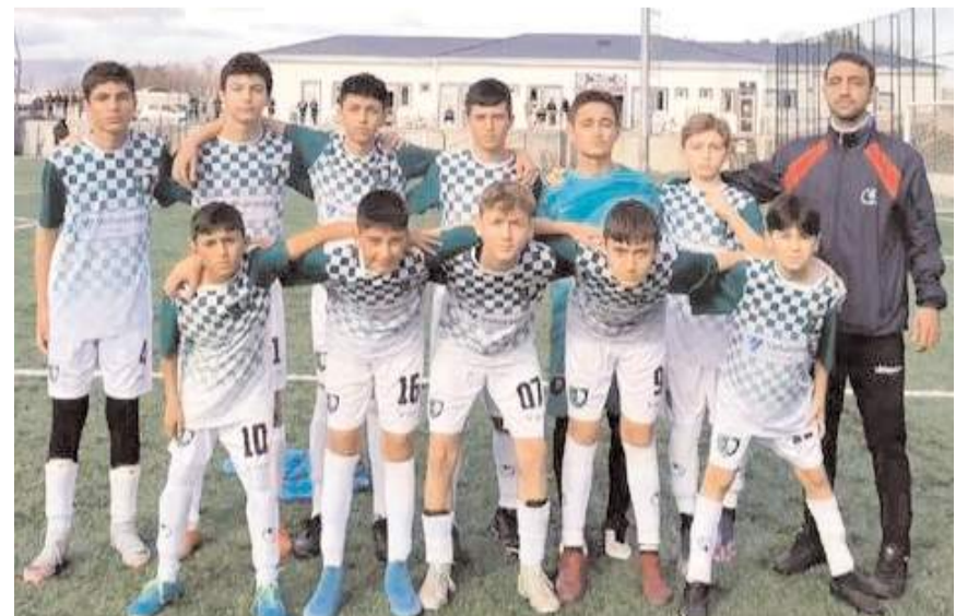
Hattuşa Gençlikspor grubunda yedinci maçında kazanarak kayıpsız devam etti

GOLLER: Emirhan (2), H.Ege (2), Yiğit (2), Yusuf.