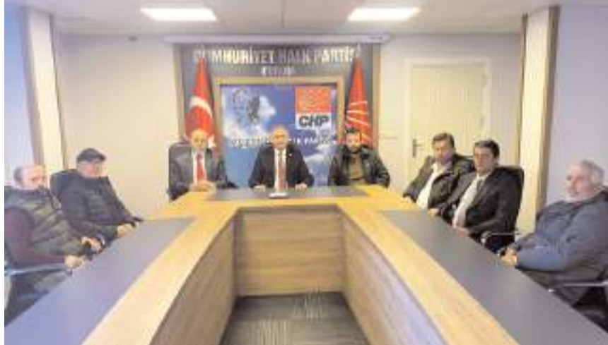
Milletvekili Mehmet Tahtasız

"Kargı ilçemizin köylerinde yaz kış demeden uzun yıllardır orman kesimi yapan esnaf ve köylülerimiz tarafına ulaşarak sorunlarını aktarmak istedi. İl Başkanlığımızda yaptığımız görüşmede sorunlarını dinledikten sonra hem Tarım ve Orman Bakanı Sayın İbrahim Yumaklı'nın yanıtlaması istemiyle soru önergesi verdim hem de konuyu basın aracılığıyla kamuoyuna taşıdım. Sayın Murat Erdal benim yaptığım bu açıklamadan memnun olacağı yerde rahatsızlığımı dile getirmiş ve açıklamayı doğru bulma-