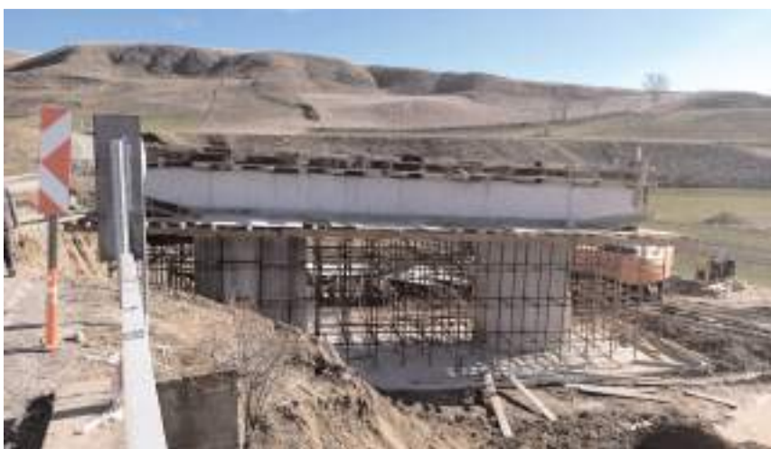
Körpü 81 metre uzunluğuna sahip.

16.10.2023 tarihinde işe başlanılmıştır. Proje kapsamında 81 metre uzunluğunda, 3 açıklıklı, fore kazıklı, öngörme prefabrik kirişli köprü ile toprakarme bağlantı yolu bulunmaktadır. Günümüze kadar 56 adet toplam 957 metre fore kazık ve elevasyon çalışmaları tamamlanmış olup perde ve başlık kiriş çalışmaları devam etmektedir. Kalan proje yapım imalatlarının 2024 yılı Temmuz ayı itibarıyla tamamlanıp köprü ile toprakarme bağlantı yolunun trafiğe açılması planlanmaktadır." dedi.