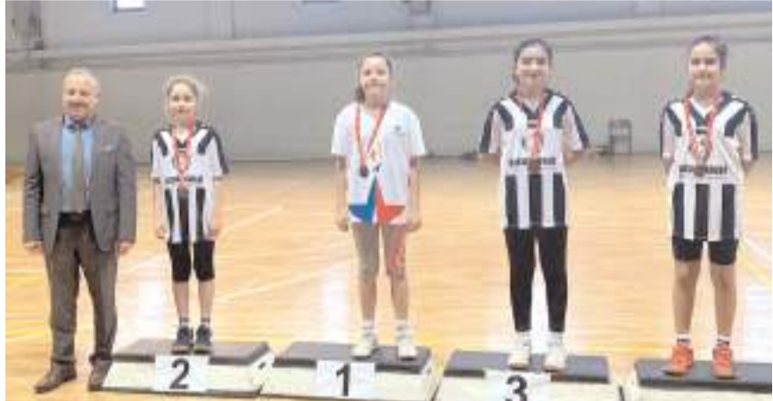
Dereceye giren sporculara madalyaları düzenlenen törenle verildi