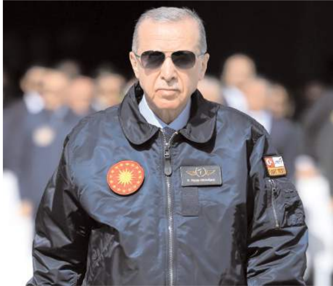
Barut fabrikasının 15 Şubat'ta Cumhurbaşkanı Recep Tayyip Erdoğan tarafından açılışının yapılması planlanıyor.