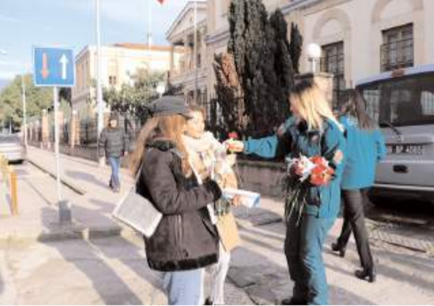
Orta Karadeniz Gümrük ve Ticaret Bölge Müdürlüğü personeli vatandaşlara çiçek hedyi etti.