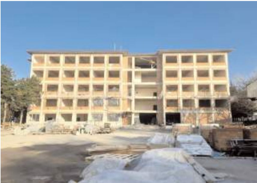
24 derslikli Merkez Atatürk Ortaokulu