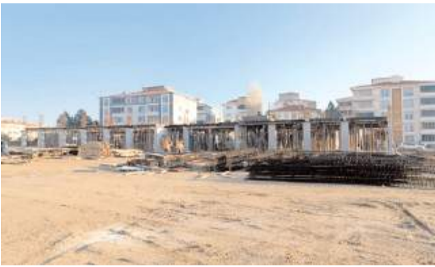
24 derslikli Merkez İbrahim Çayırı Ortaokulu