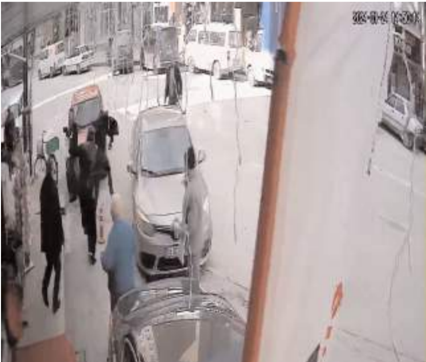
Olay Alaca'da Zile Caddesi'nde bir iş yerinde meydana gelmişti.