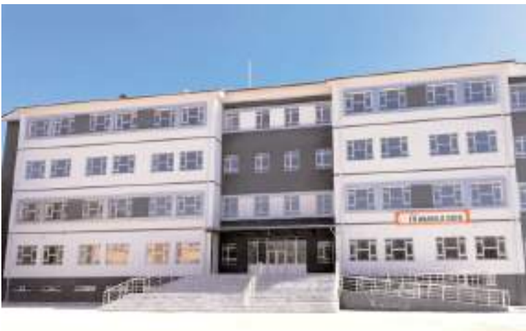
24 derslikli Eti Anadolu Lisesi