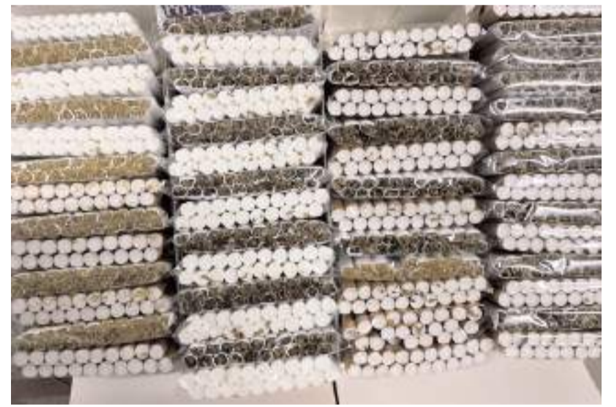
Operasyonda 77 bin 100 makaron (filtreli sigara kağıdı) ele geçirildi.

Operasyonda 2 kişi gözaltına alındı.(AA)