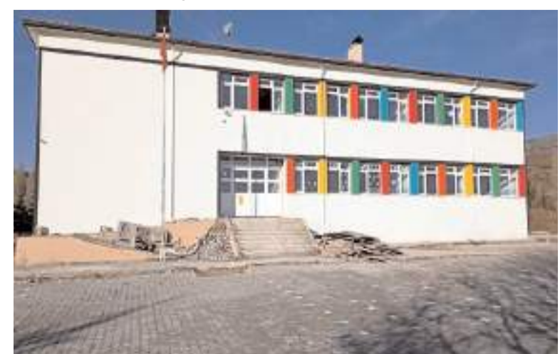
Oğuzlar Kayı İlkokulu