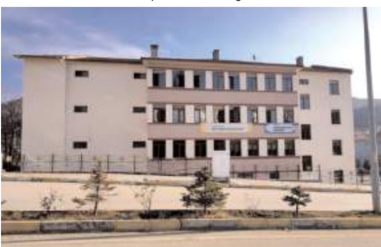
İskilip Anadolu İmam Hatip Lisesi

İl Milli Eğitim Müdürlüğünden yapılan açıklamada, 2023 yılında yapılan yeni okullar ile okulların tadilatları konusuna değinildi.