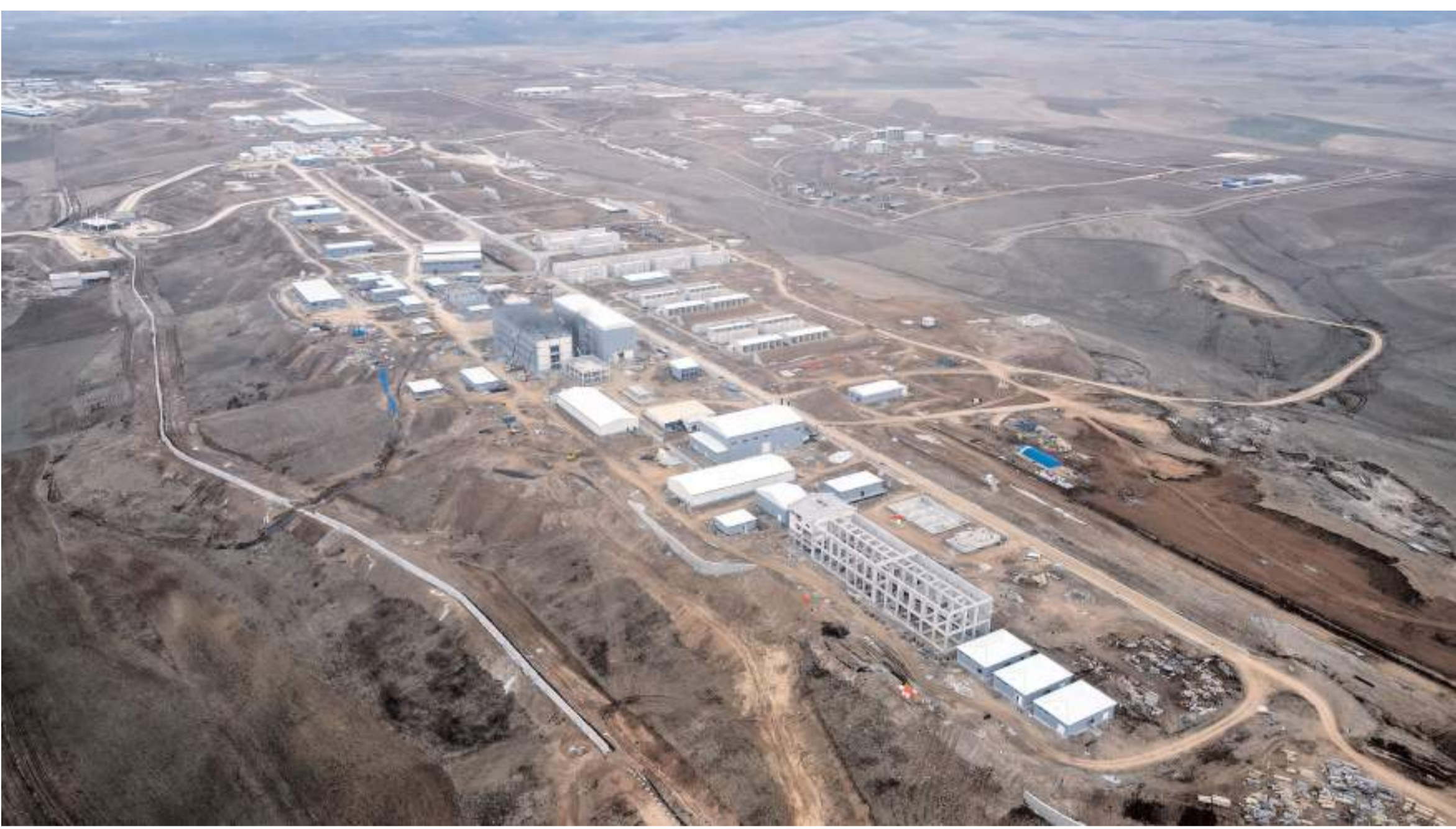
Ahlatcı Holding tarafından kurulan Türkiye'nin en büyük barut fabrikası Sungurlu Organize Sanayi Bölgesinde inşa ediliyor.