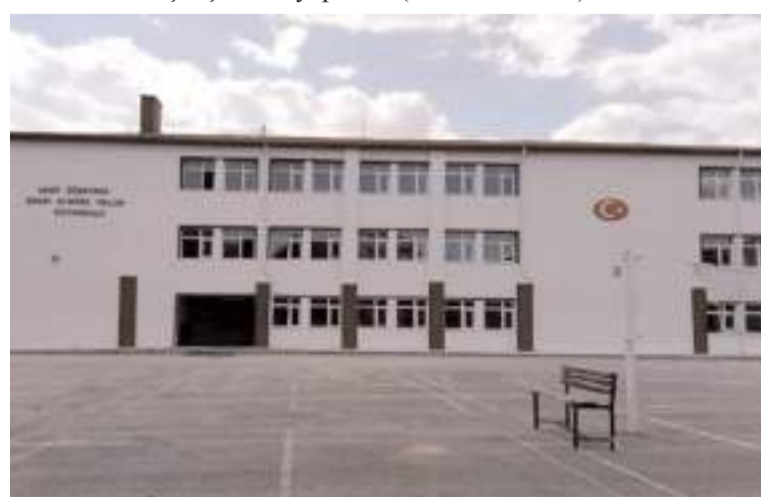
Osmaniye Şehit Öğretmen Şenay Aybüke Yalçın Ortaokulu