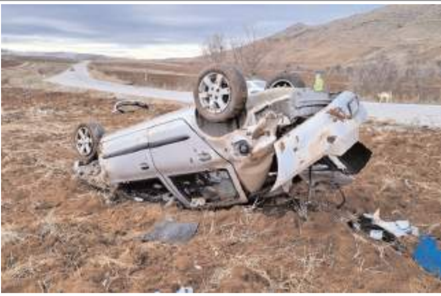
Kaza Alaca-Tokat karayolu Sancı köyü yakınlarında meydana geldi.

Sürücü emniyet kemeri sayesinde yara almadı