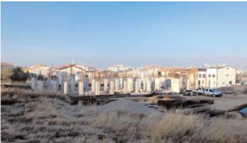
24 derslikli Üçutlar Mahallesi İlkokulu