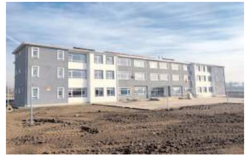
12 derslikli Özel Eğitim Okulu