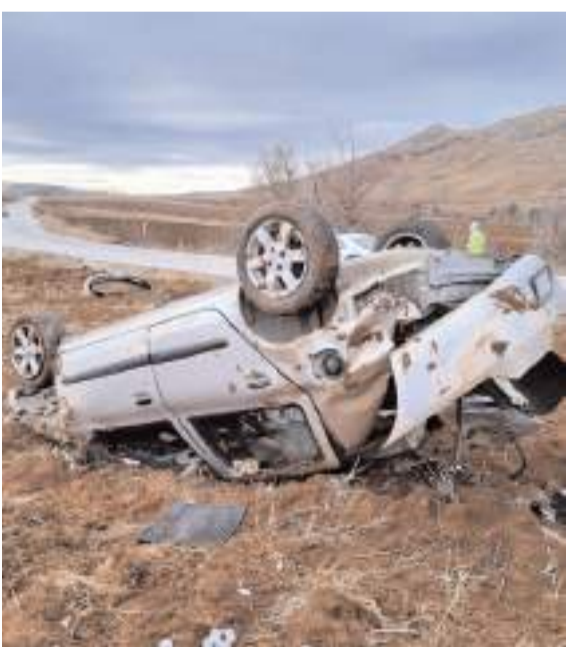
Kaza Alaca-Tokat karayolu Sancı köyü yakınlarında meydana geldi.