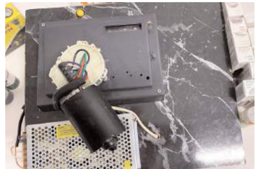
Operasyonda elektronik sigara sarma makinesi ele geçirildi.