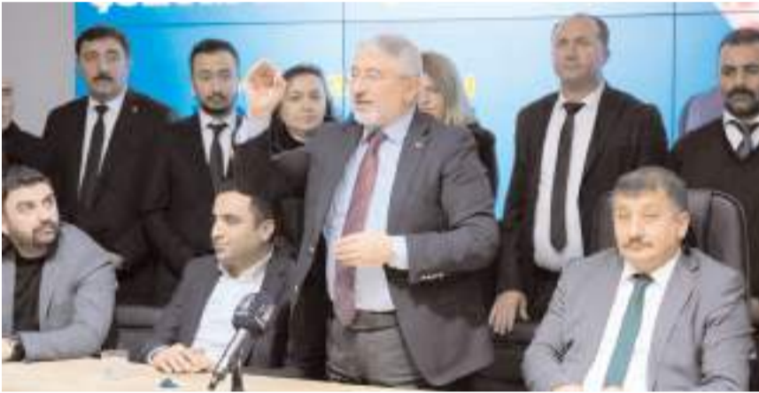
Başkan Aşgın, ziyarete değerlendirmelerde bulundu.