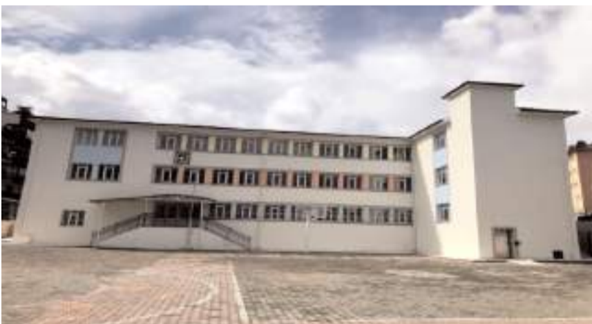
İskilip Misakımilli İlköğretim Okulu