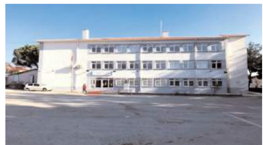
Kargı Yunus Emre İlkokulu