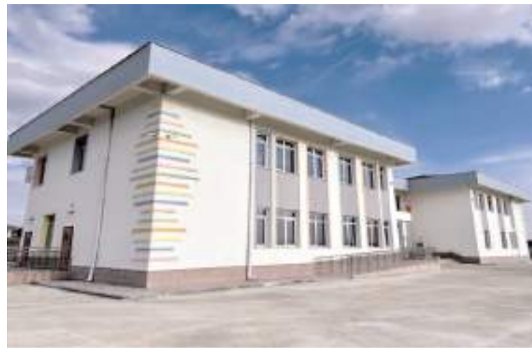
8 derslikli Özel Eğitim Anaokulu