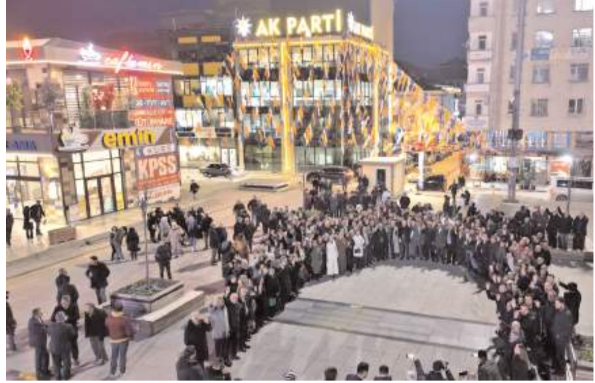
Ziyaretin sonunda Kadeş Meydanında toplu hatıra fotoğrafı çekildi.

31 Mart 2019 seçimlerinden hemen sonra 1 Nisan'da çalışmaya başladıklarını o günden bugüne geçen 5 yılda gezmedikleri, girmedikleri cadde-sokak, oturmadıkları çay ocağı, sıkılmadık el, girmedikleri kamu kurumu kalmasının altını çizen Başkan Aşgın, "Hamd olsun biz 5 yıldır kış demeden, yaz demeden, sıcak demeden, soğuk demeden halkımızın sofrasında, esnafımızın dükkânında, Gecemiz gündüzümüz aşkla böyle geçti" dedi.