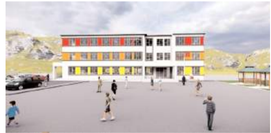
12 derslikli Dodurga İmam Hatip Lisesi