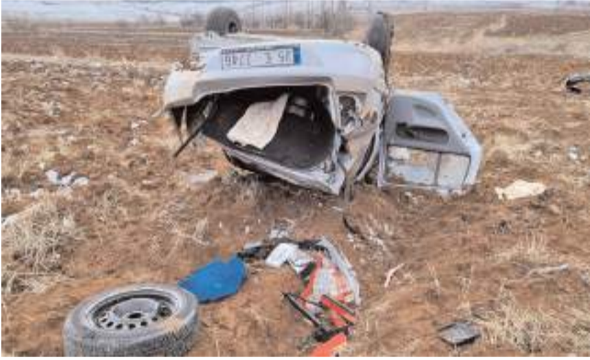
Kazada otomobilde maddi hasar meydana geldi.