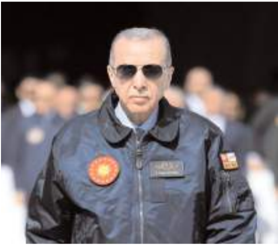
Barut fabrikasının 15 Şubat'ta Cumhurbaşkanı Recep Tayyip Erdoğan tarafından açılışının yapılması planlanıyor.

Sungurlu Organize Sanayi Bölgesine (OSB) Ahlatcı Holding tarafından kurulan Türkiye'nin en büyük barut fabrikasının 15 Şubat'ta Cumhurbaşkanı Recep Tayyip Erdoğan tarafından açılışının yapılması planlanıyor.