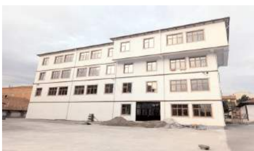
12 derslikli Merkez Zafer İlkokulu

İl Milli Eğitim Müdürlüğü bir taraftan yeni okullar yaparken diğer taraftan ise bazı okullarda deprem güçlendirmesi yapıyor. İl merkezi ve ilçeler de 2023 yılında 3 okulun yapımı tamamlanırken 11 okulun ise inşası devam ediyor.