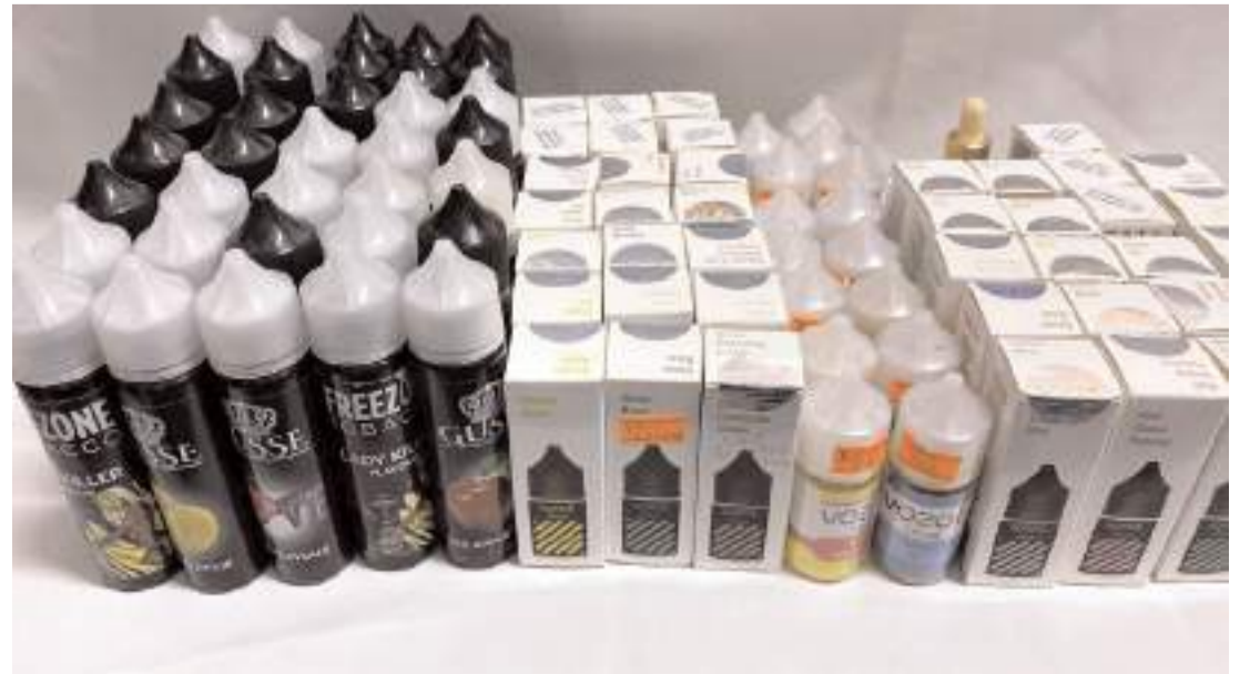
Operasyonda 92 likit sıvı ele geçirildi.