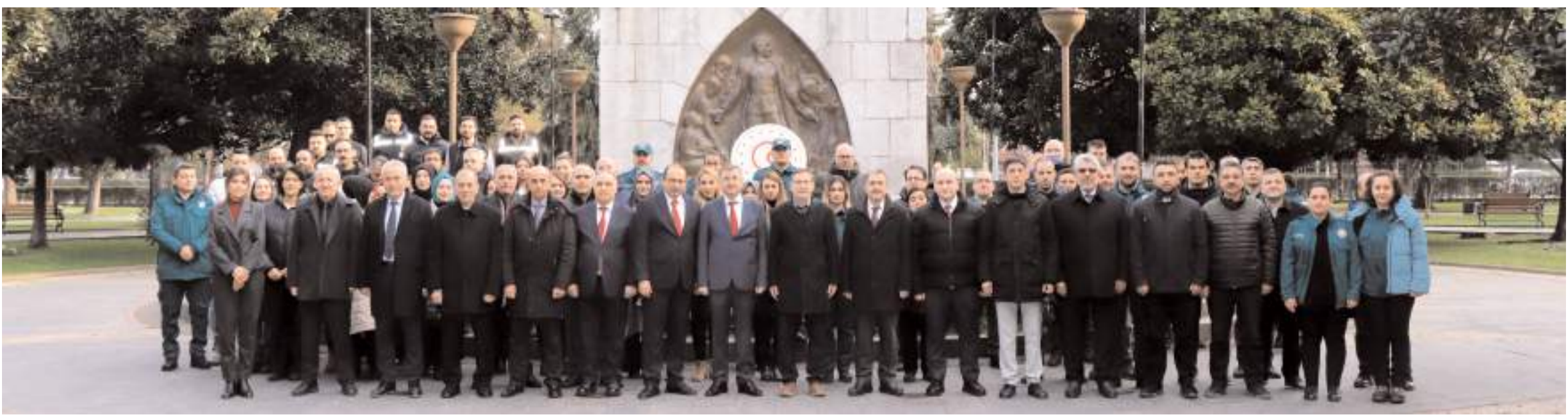
Orta Karadeniz Gümrük ve Ticaret Bölge Müdürlüğü Dünya Gümrük Gününü kutladı.