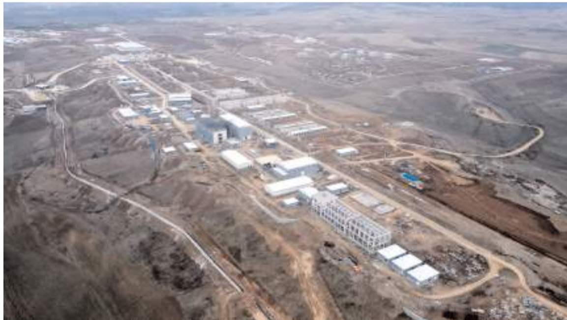
Ahlatcı Holding tarafından kurulan Türkiye'nin en büyük barut fabrikası Sungurlu Organize Sanayi Bölgesinde inşaa ediliyor.