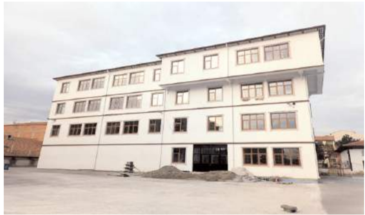
12 derslikli Merkez Zafer İlkokulu

Bakım onarım: 2023 yılında ilimiz merkez ve ilçelerinde bakım onarım kapsamında inşaat alanında; çatı onarımı, dış cephe tadilatı ve boyası, ıslak zemin fayans tamirati işi, merdiven onarımı, yangın merdiveni yapımı, çevre düzenlemesi, istinat duvarı yapımı, PVC kapı ve pencere değişimi, drenaj yapımı, engelli rampa yapımı. Elektrik alanında; asansör tesisatı onarımı, çevre aydınlatma, elektrik tesisatı onarımı. Makine alanında; kombi bakımı, kalorifer sistemi yapım işi, boyler işi vb. toplamda 145 okulda bakım onarım çalışmaları yapıldı." (Haber Merkezi)