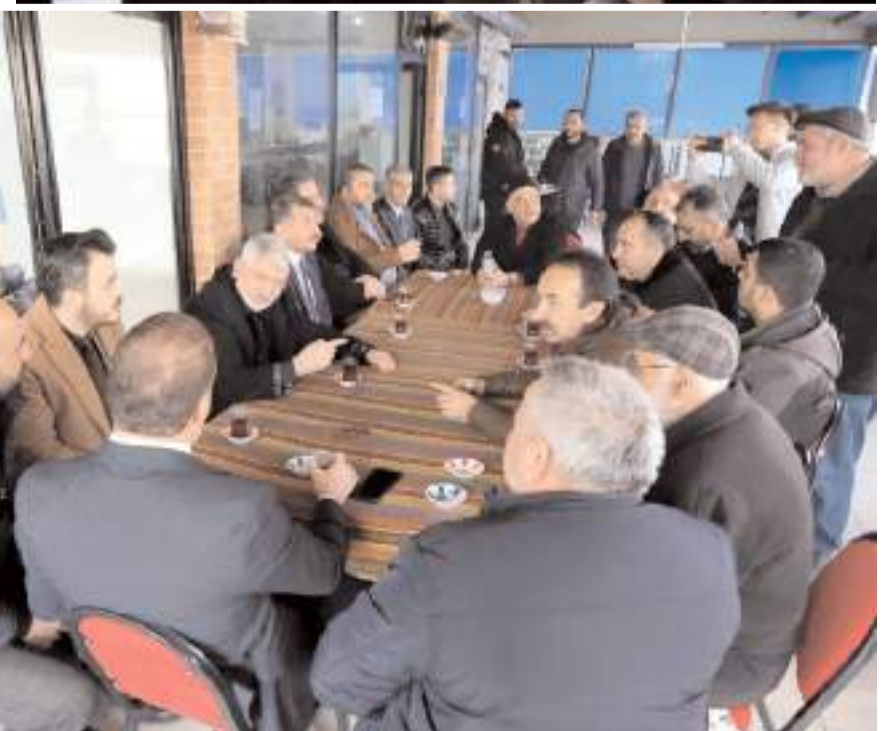
Başkan Aşgın beraberindekilerle birlikte esnafı ziyaret etti.