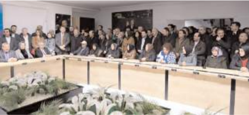
Ziyarete teşkilat üyelerinin ilgisi yüksek oldu.