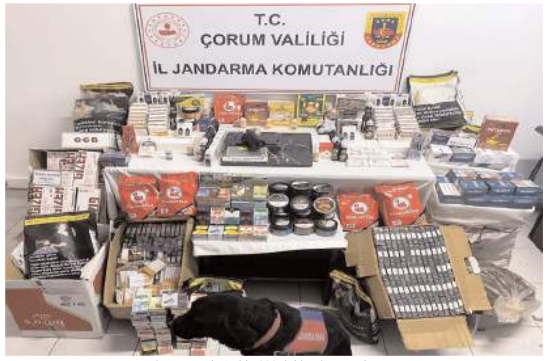
Operasyonda 17 bin 900 doldurulmuş makaron, 59 bin 200 boş makaron, 63 kilogram kaçak tütün ele geçirildi.

Çorum'un Alaca ilçesi Zile Caddesi'ndeki iş yerlerinde E.E. ve oğlu K.E. ile A.B. ve oğlu S.B. arasında tartışma çıkmış, kavgaya dönüşen olayda E.E. ve oğlu K.E. bıçakla yaralanmıştı. Yaralılar kendi imkanlarıyla hastaneye başvururken, zanlılar ise polis ekiplerince yakalanmıştı. (AA)