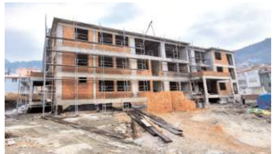
16 derslikli Kargı Cumhuriyet Yatılı Bölge Ortaokulu