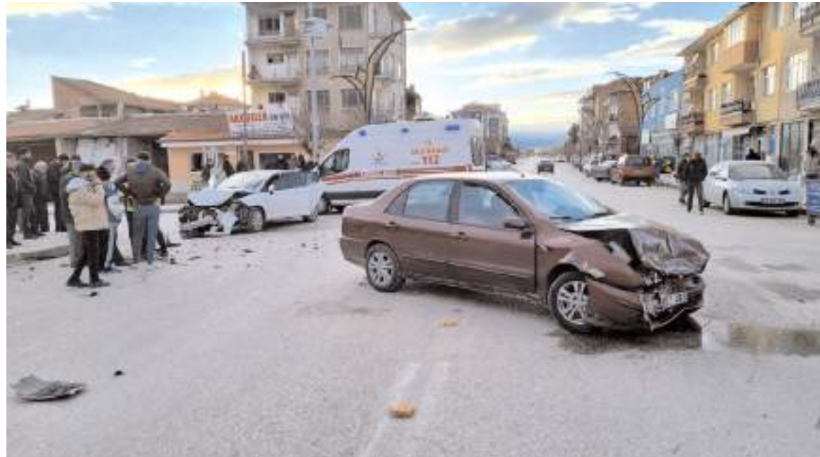
Kazada her iki araçta da maddi hasar meydana geldi.

Alaca Devlet Hastanesi'ne kaldırılarak tedavi altına alındı. Kaza ile ilgili başlatılan soruşturma sürüyor. (İHA)