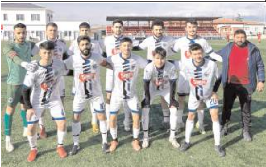
HE Kültürspor ligde çıkışını Ulukavakspor önünde sürdürdü ve rahatladı