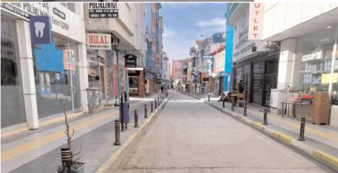
Azap Ahmet Sokak esnafında sokağın tarihi bir görünüme kavuşturulmasını istiyor.