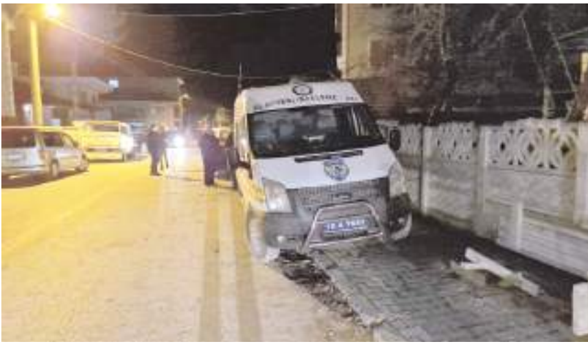
Olay Yıldızhan Mahallesi'nde bir evde meydana geldi.