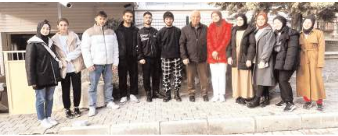
Sungurlu Kredi ve Yurtlar Kurumunda kalan öğrenciler müze evi gezdiler.