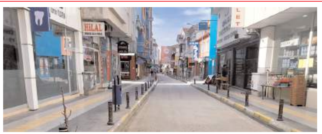
Azap Ahmet Sokak esnafında sokağın tarihi bir görünüme kavuşturulmasını istiyor.

■ Çorum'da bir grup emekli yaptıkları basın açıklaması ile maaşlarında iyileştirme yapılmasını istediler. Emekliler adına konuşan Murat Kırçı, en düşük emekli maaşının asgari ücretten aşağı olmaması gerektiğini belirtti. * HABERİ7'DE