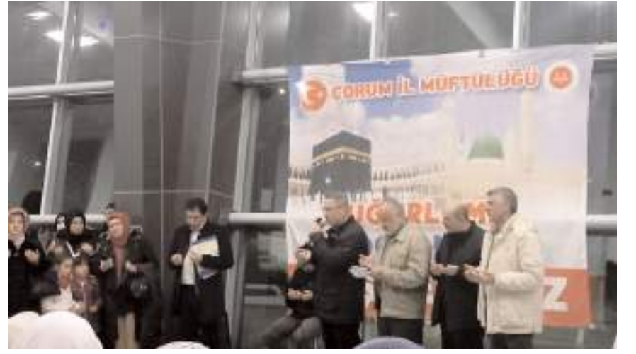
Umreciler dualarla kutsal topraklara uğurlandı.