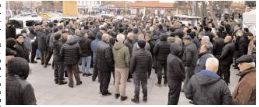
PTT önünde yapılan eyleme katılım yüksek oldu.

dilenci durumuna düşürmek, vatan sevgisini sorgulamak, kimsenin hakkı da haddi de değildir" ifadelerini kullandı.