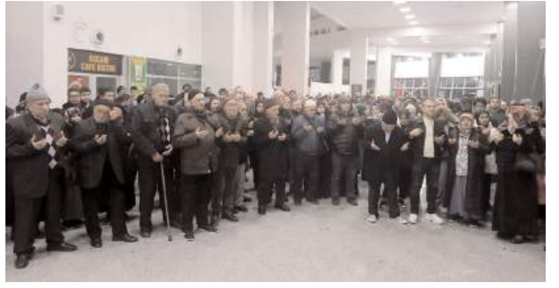
Umreciler için Çorum Otobüs Terminalinde uğurlama programı düzenlendi.

Genç çifti tebrik eden Pehlivan, bir ömür boyu mutluluklar diledi.