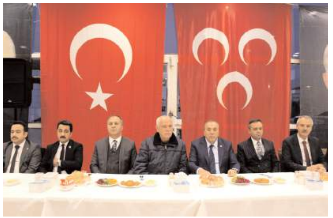
Programı Milliyetçi Hareket Partisi Sungurlu Teşkilatı düzenledi.

Tunceli ve Bingöl cidden risk altında. Yapılanlar çok yararlı ama Tunceli'yi gerçekten tam anlamıyla depreme hazırlayacak şeyler değil. Bu iş Belediye ile birlikte omuz omuza yapılmalı. Kentin tüm bileşenleri, yani Tunceli'nin halkı, altyapısı, yapı stoku, ekosistem ve çevresi ve ekonomisinin olası depremde ne kadar ve nasıl zarar göreceği araştırılıp tespit edilmeli ve bunlar üzerinde zarar azaltıcı çalışmalar yapılarak deprem dirençli hale getirilmelidir. Sayın valimize hassasiyeti için teşekkür ederim, sevgiyle."