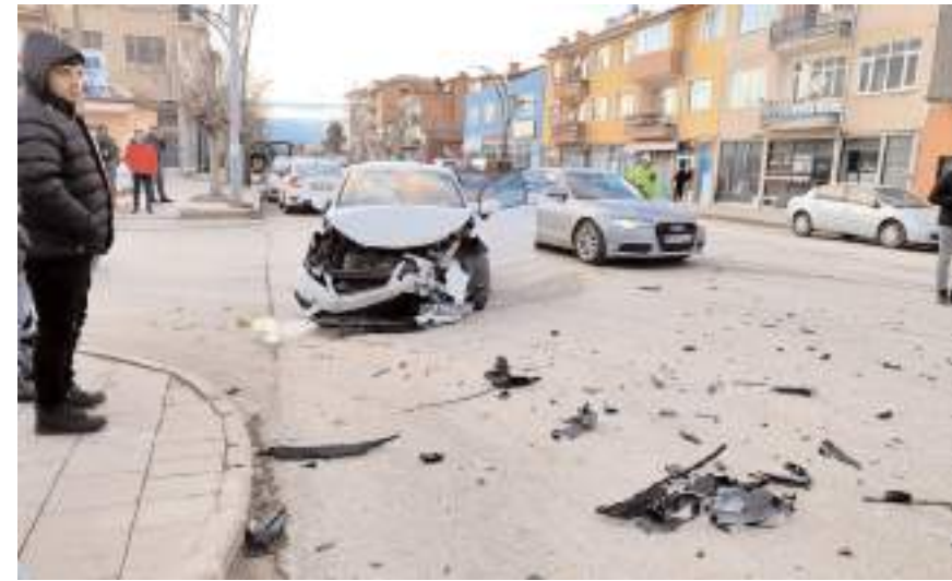
Kaza, Ankara Caddesi'nde meydana geldi.