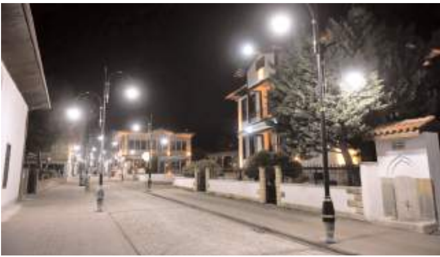
Şeyh Eyüp Sokak baştan aşağıya yenilendi.