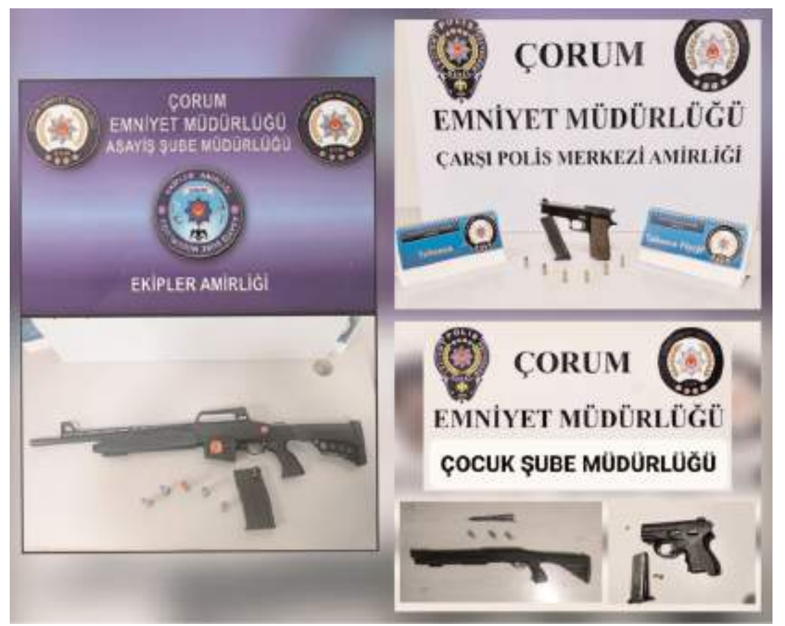
Çorum İl Emniyet Müdürlüğü asayiş ve güvenliğin sağlanmasına yönelik çalışmalarına devam ediyor.