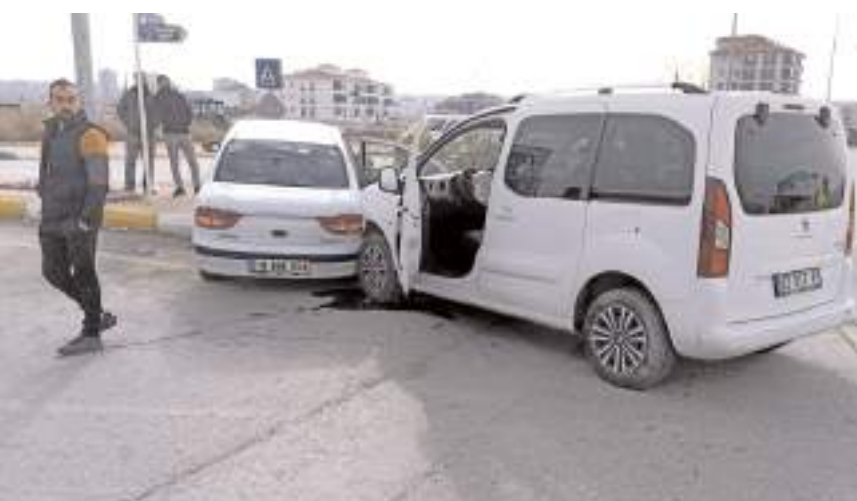
Kaza Necmettin Erbakan Caddesi ile Öğretmen Lisesi Caddesi'nin kesiştiği kavşakta meydana geldi.

Yaralılar sağlık ekiplerince yapılan müdahalenin ardından Hitit Üniversitesi Erol Olçok Eğitim ve Araştırma Hastanesi'ne kaldırıldı.(AA)