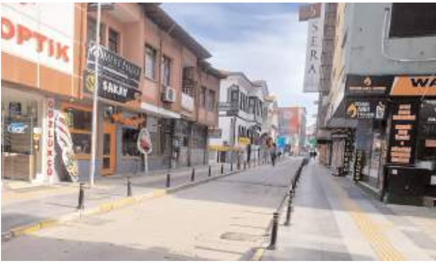
Şeyh Eyüp Sokak'ta 'Tarihi Kültür Yolu' projesi hayata geçirildi.