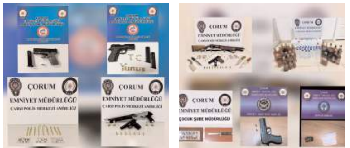
Operasyonlarda çok sayıda silah ve mühimmat ele geçirildi.

gram bonzai, 3 adet payp, 1 adet telsiz, 1 adet cep telefonu, 14 şişe sahte bandrollü viski, 11 adet 5 litre bidon içerisinde kaçak etil alkol, 29 adet 500 mililitre pet şişe içerisinde kaçak votka ve 29 bin 500 TL para ele geçirildi. (İHA)