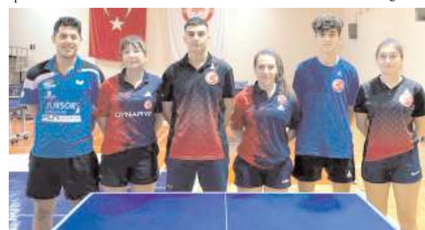
Çorum Spor İhtisas kulübünden milli takımda mücadele eden sporcular toplu halde