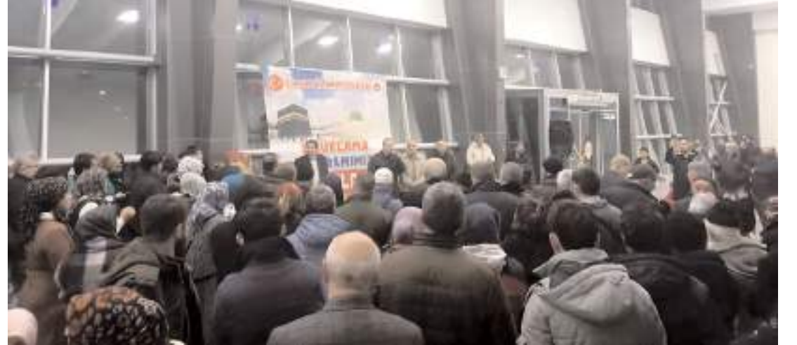
Uğurlama programında umrecileri yakınları yalnız bırakmadı.