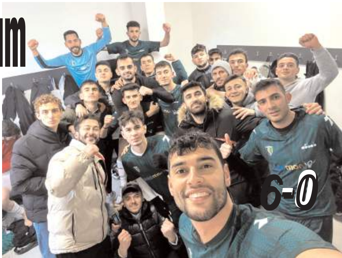
Mimar Sinan Gençlikspor İskilipspor önünde farklı kazanarak liderliğini devam ettirdi

Bu galibiyet ile Mimar Sinan 27 puanla liderliğini devam ettirirken İskilipspor takımı ise 15 puanla üçüncü sırada kaldı.