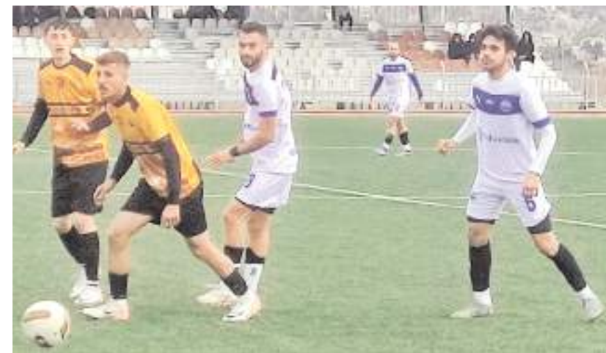
İskilipgücüspor, Kargı deplasmanından üç puanla dönerek moral buldu

Sahadan 3-2 galibiyet ile ayrılan İskilipgücüspor 12 puana yükselerek tehlikeli bölgeden tamamen uzaklaştı, Kargiserispor ise 9 puanda kaldı.