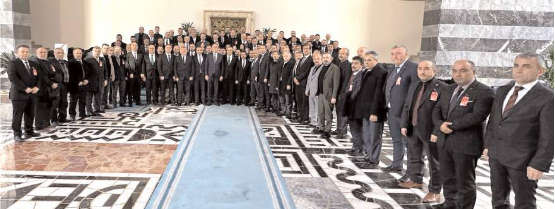
Ziyaretin sonunda toplu hatıra fotoğrafı çekildi.