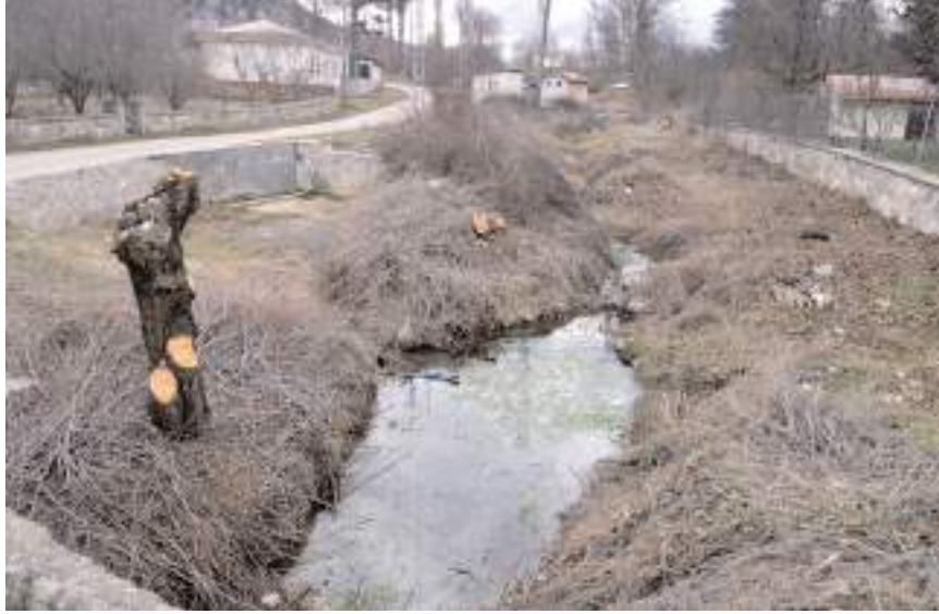
Köy halkı çevre köylerin foseptik kuyularının kendi derelerine aktığını belirttiler.