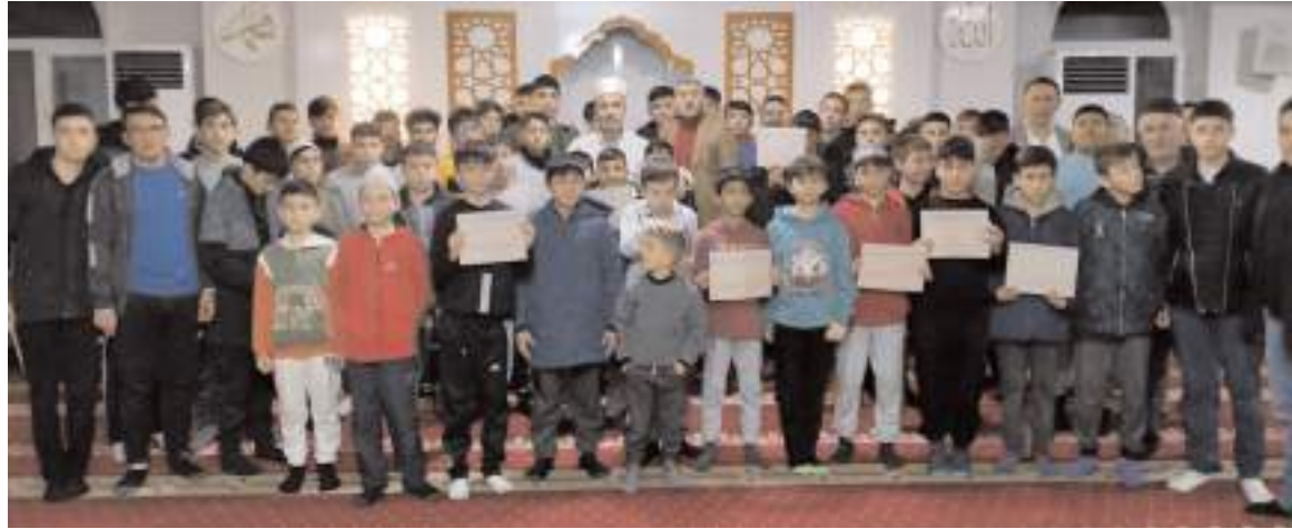
Ödül töreninin ardından hatıra fotoğrafı çekildi.