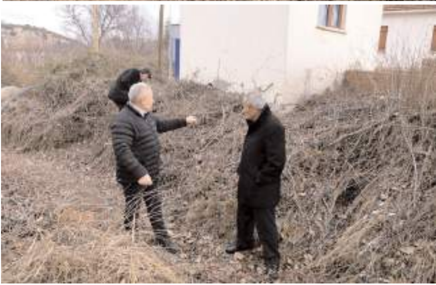
Köy halkı içme suyu sorununun çözülmesini istiyor.