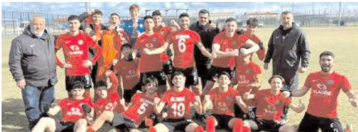
Ahlatıcı Çorum FK U 19 takımı zorlu Afyonspor deplasmanında kazanarak final grubu için avantaj yakaladı