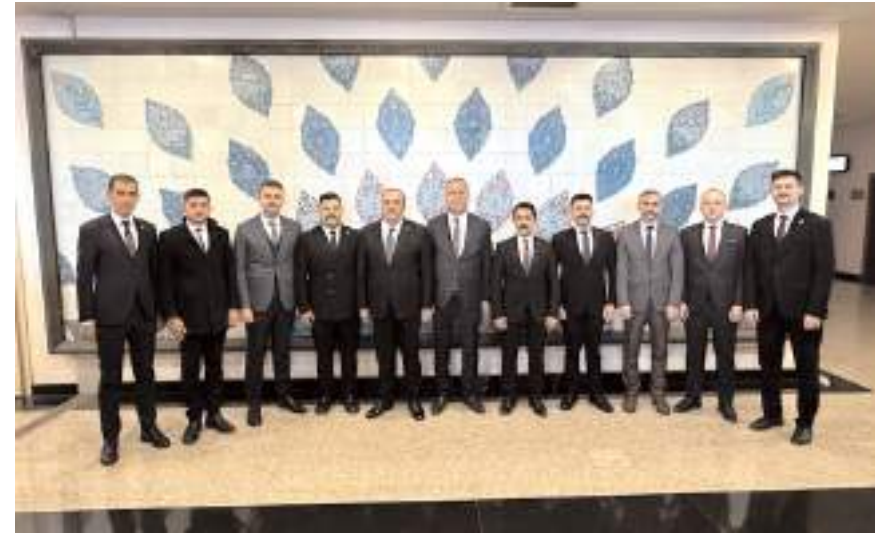
Ziyaretin anısına hatıra fotoğrafı çekildi.

Ziyaretle ilgili MHP'den yapılan açıklamada, "İl Yönetimimiz, Merkez İlçe, İlçe Yönetimlerimiz, İl Ülkü Ocakları Başkanlığımız, İlçe Ocak Başkanlıklarımız, KAÇEP Birimimiz, sendikalarımız ve sivil toplum örgütlerimizle bir olduğumuzu, tek ses olduğumuzu, partimizin her daim emrinde olduğumuzu vurgulamaktayız. Parti politikalarımızdan sapmadan, Cumhuriyet İttifakı ruhunu benimsemiş teşkilatımızla liderimiz Dr. Devlet Bahçeli Bey'in emrindeyiz. Genel merkezimizin yerel seçimler için aldığı kararları harfiyen uygulayacağız. Genel merkezin politikalarını ve stratejilerini takip ederek, yerel seçimlerde parti içinde birlik ve disiplin sağlayarak, başarılı bir seçim kampanyası yürütme konusunda kararlıyız. Bugün burada olduğu gibi bundan sonra partimizin ve liderimizin emrinde olacağız. Allah'ın izniyle Çorum'a Milliyetçi Hareket Partisi ve Cumhuriyet İttifakı mührünü vuracağız" ifadelerine yer verildi. (Haber Merkezi)