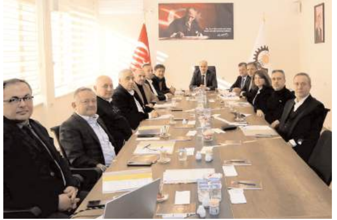
Toplantıda OSB'deki imar, parselasyon ve altyapı çalışmaları ile ilgili konular görüşüldü.

OSB Toplantı Salonunda gerçekleştirilen toplantıda, Çorum OSB'deki imar, parselasyon ve altyapı çalışmaları ile ilgili konular görüşüldü. (Haber Merkezi)