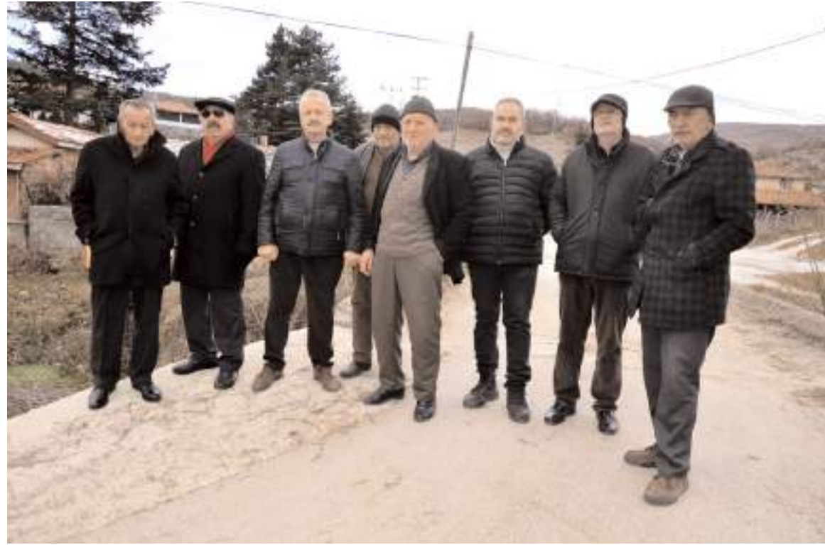
Köy sakinleri sorunlarını dile getirdi.

Köyün bir çok sorunu olduğunu ancak en önemli sorunlarının içme suyu sorunu olduğunu sözlerine ekleyen köy sakinleri; "Artık pis su içmek istemiyoruz." diye konuştu.