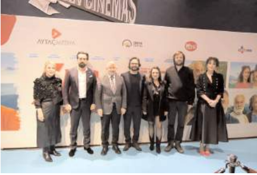
Filmin oyuncularını gösterim öncesinde basın toplantısı düzenledi.

Filmin yapımcısı Aytaç Ağdağ da, filmi Çorum'da çekmeye karar verdiklerinde Çorumluların çok misafirperver olduğunu bildiklerini dile getirerek, "Ne kadar doğru bir karar verdiğimizizi görmüş olduk. Bu nedenle ilk galayı burada yapmaya ve Çorumlulara izlettirmeye karar verdik. İlk galanın burada yapılmasının nedeni de Çorumluların misafirperverliğidir. Filmde Çorum'un şivesi, insanı ve zenginliğini göstermeye çalıştık. Filmin seyrine ve beğenisine bağlı. Çorum'da film çekmeye devam etmeyi istiyoruz" ifadelerini kullandı. Filmin gösterimi öncesi ve sonrasında davetliler oyuncularla bol bol hatıra fotoğrafı çektiler. Film izleyenler ise çok beğendiklerini dile getirdiler. Film 2 Şubat'ta gösterime girecek.