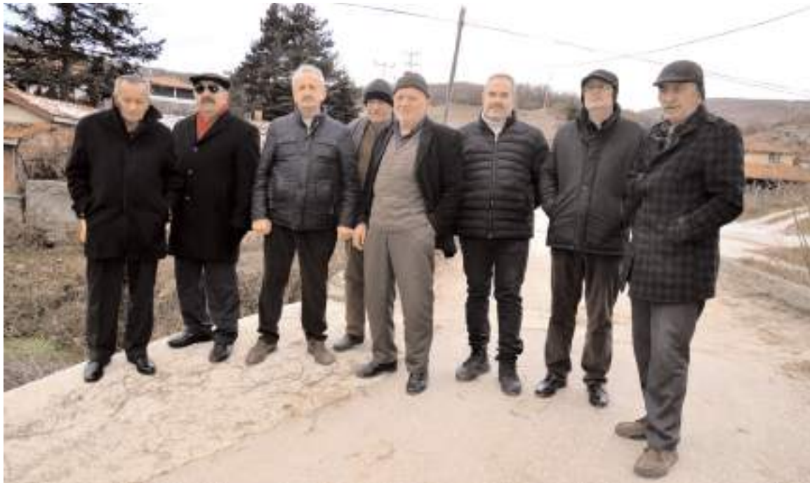
Köy sakinleri sorunlarını dile getirdi.