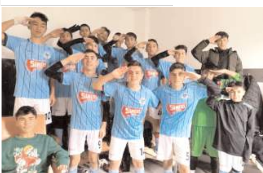
Final Grubunda ilk yarıyı lider tamamlayan HE Kültürspor avantajını korumak istiyor

Hattuşa Gençlikspor- Osmancık Kandiberspor.