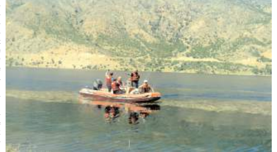
İl Tarım ve Orman Müdürlüğü, iç sularda denetimler yaptı.

Tarımsal Altyapı ve Arazi Değerlendirme Şube Müdürlüğü olarak 2023 yılında 5403 Sayılı Toprak Koruma ve Arazi Kullanımı Kanununun 13. ve 14. maddeleri kapsamında 112 dekar alanın tarım dışı kullanımına izin verilmemiştir. 89 izinsiz tarım dışı kullanımlar için, 3.203.878,00 TL idari para cezası uygulanmıştır" şeklinde belirtildi.