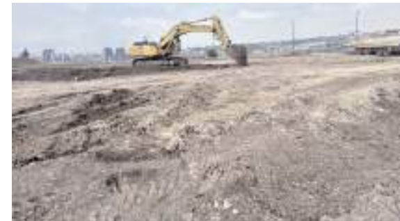
Kuzey Kampüsü caminin temel kazı çalışmaları başladı.