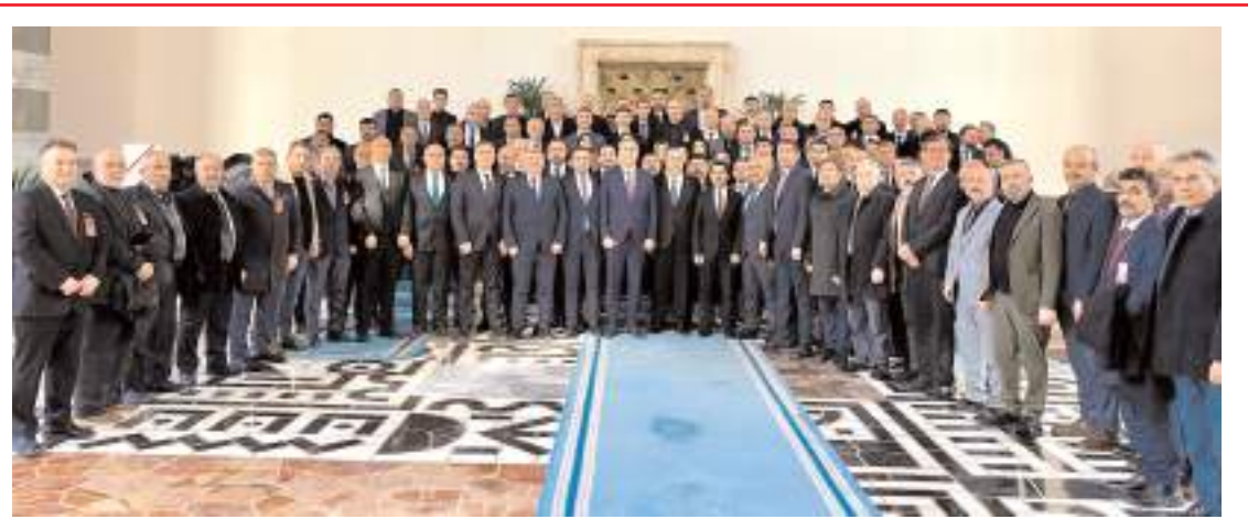
Milliyetçi Hareket Partisi (MHP) İl Teşkilatı Türkiye Büyük Millet Meclisini ziyaret etti.