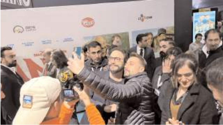
Davetliler oyuncularla bol bol hatıra fotoğrafı çekindiler.