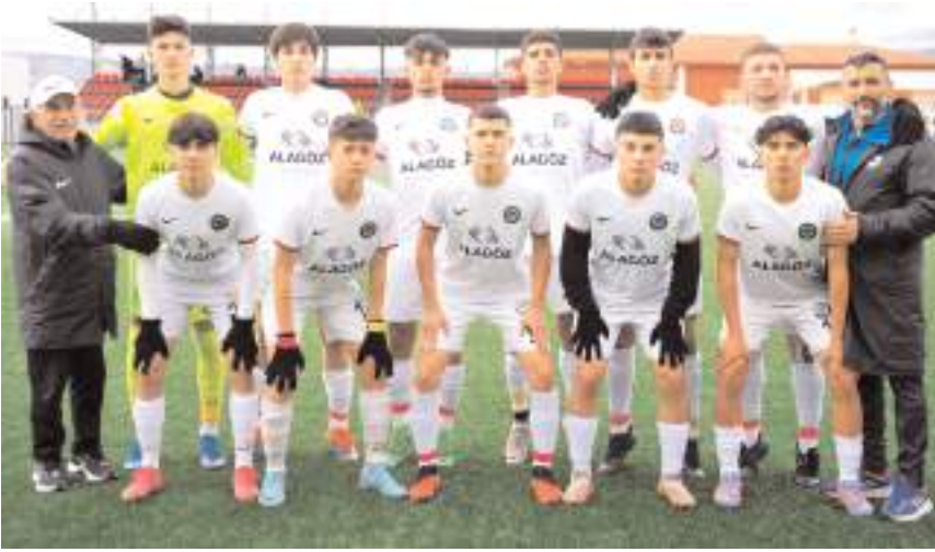
U 17 takımı 13. maçında 11. galibiyetini alarak final grubunu büyük oranda garantiledi

Grupta Uşakspor 25 puanla lider durumda bulunurken Ispartaspor 23 puanla ikinci Ahlatıcı Çorum FK 21 puanla üçüncü bir maçta Afyonspor ise aynı puanla dördüncü sırada bulunuyor.