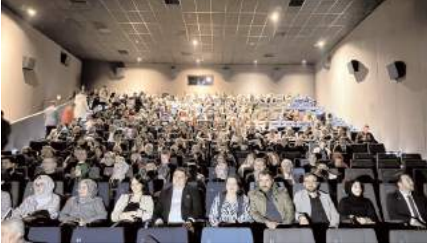
Filmin Çorum'da yapılan ilk galasını çok sayıda davetli izledi.