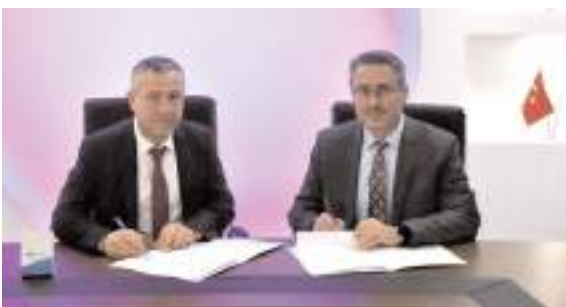
19.02.2024 tarihinde başlayacak olan program 19.08.2024 tarihinde sona erecek.