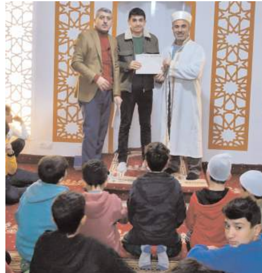
Camiye devam eden gençlere her yıl olduğu gibi bu yılda takdir ve onur belgesi ile ödüllendirdi.