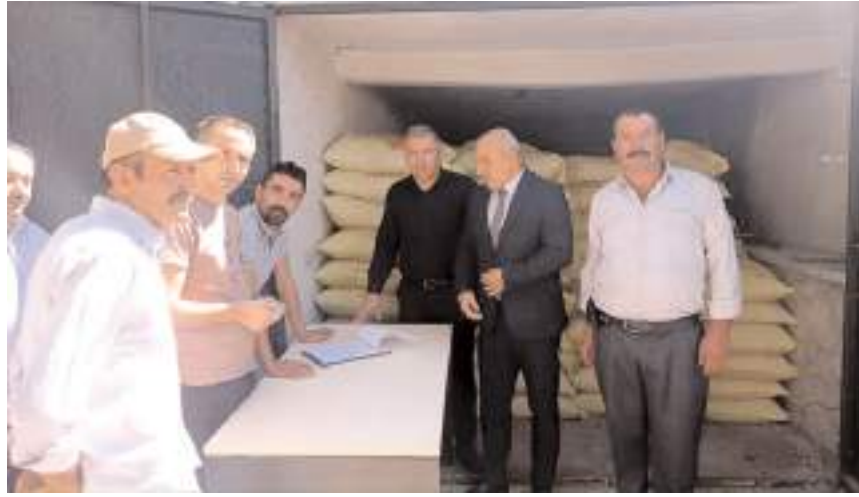
1504 kişiye 330 ton arpa, 804 kişiye 180 ton tritikale ve 1159 kişiye 165 ton nohut tohumu dağıtıldı.