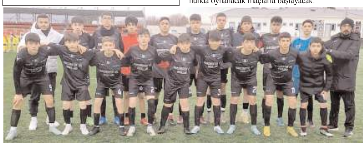
HE Kültürspor U 16 takımı zorlu maçı kazanarak final grubuna yükselmeyi büyük oranda garantiledi