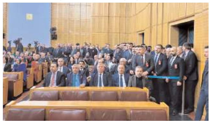
MHP İl Teşkilatı grup toplantısına katıldı.