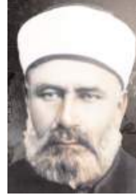
İskilipli Atıf Hoca