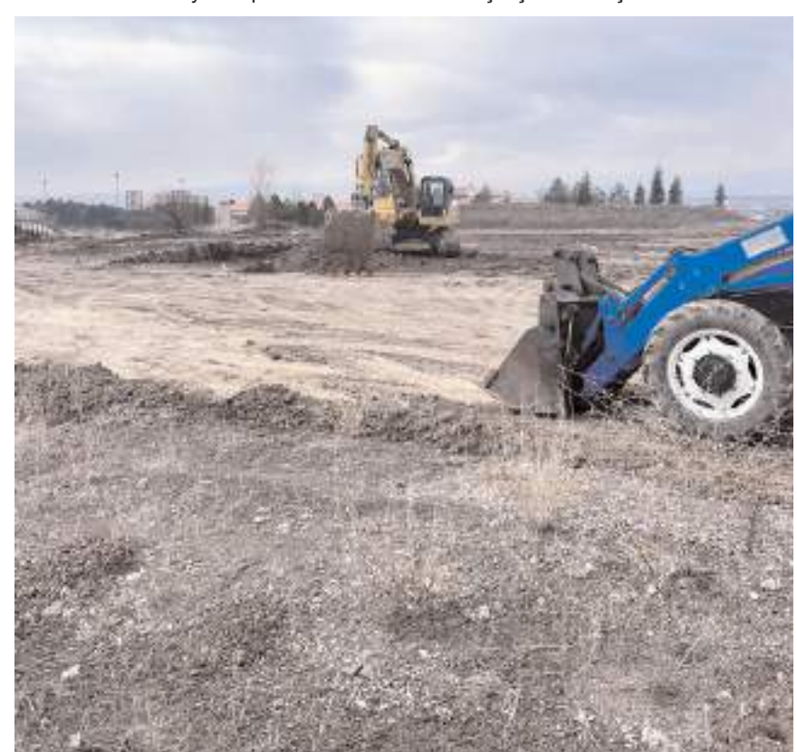
Cami hayırseverlerin destekleri ile yapılacak.