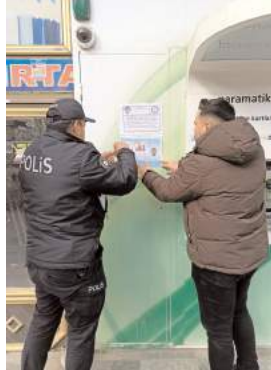
Sungurlu'da son dönemlerde artış gösteren telefon dolandırıcılığına karşı ilçe genelinde seferberlik ilan edildi.

andaşların şüpheli bir durumda olup olmadığını gözlemlerken yine polis ekipleri aynı bölgede vatandaşları bilgilendirmek amacıyla el ilanı dağıtarak vatandaşları uyarıyorlar. Polis ekipleri tarafından uygun görülen noktalara uyarı afişleri astılar. (İHA)