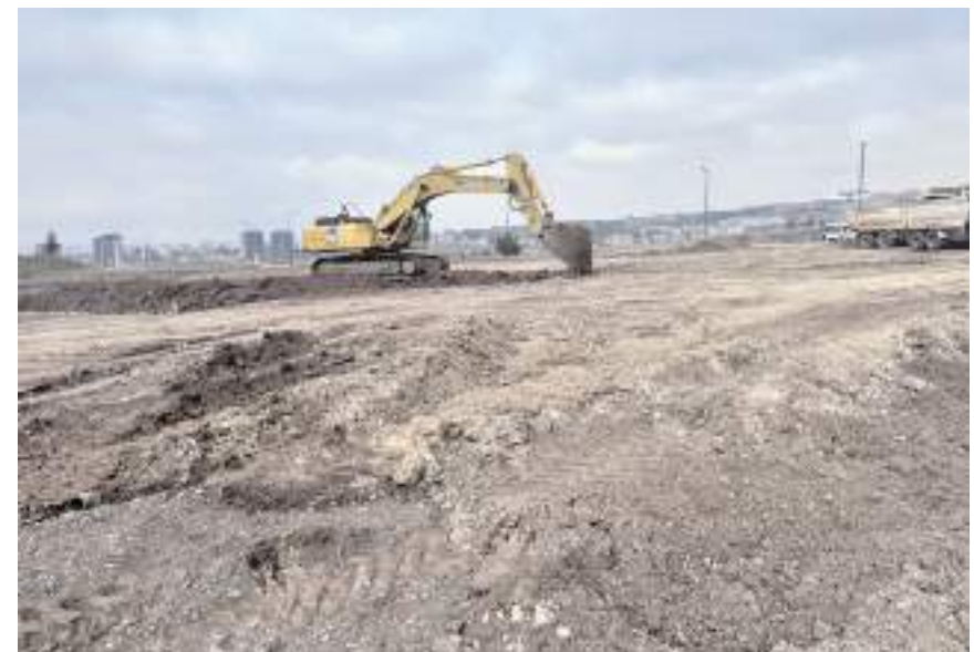
Kuzey Kampüsü caminin temel kazı çalışmaları başladı.