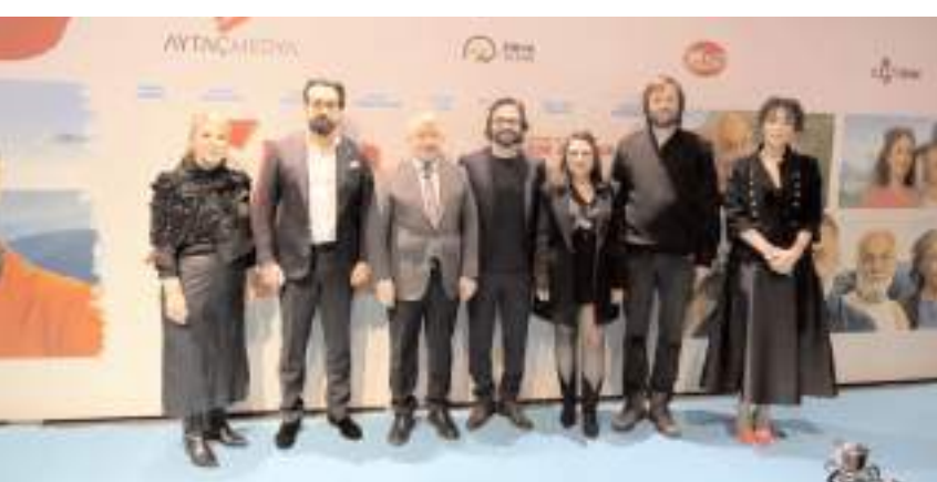
Filmin oyuncularını gösterim öncesinde basın toplantısı düzenledi.

Çekimleri Çorum'da gerçekleştirilen ve ünlü oyuncuların rol aldığı 'Efsane' filminin ilk galası Çorum'da yapıldı.