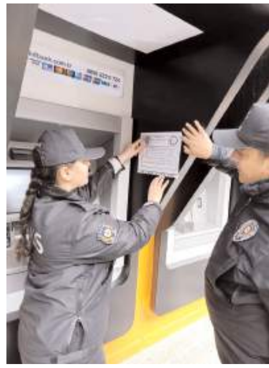
Ekipler vatandaşların yoğun olarak buldukları alanlara bilgilendirici afişler astılar.