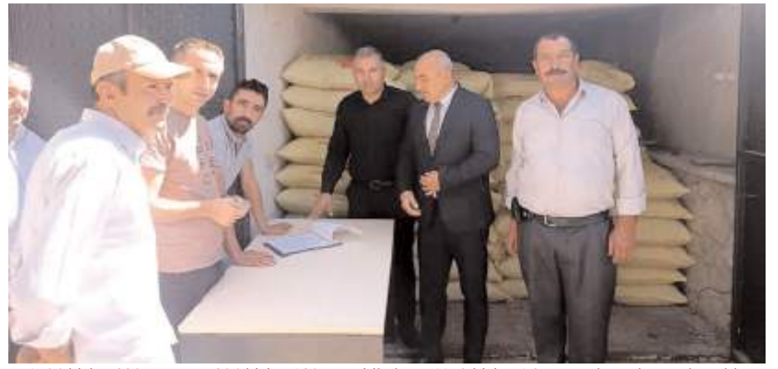
1504 kişiye 330 ton arpa, 804 kişiye 180 ton tritikale ve 1159 kişiye 165 ton nohut tohumu dağıtıldı.

Şanver, yeni şiir kitapları çıkarmak istediğini sözlerine ekledi.(AA)