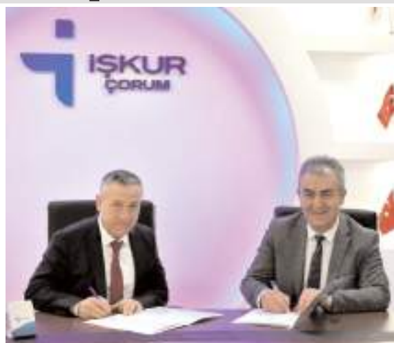
19.02.2024 tarihinde başlayacak olan program 19.08.2024 tarihinde sona erecek.

TYP'lere program süresince Adrese Dayalı Nüfus Kayıt Sistemine göre (ADNKS) aynı adreste ikamet eden kişilerden yalnızca birisi katılabilecek. Adrese Dayalı Nüfus Kayıt Sistemine (ADNKS) göre aynı adreste oturanların, programa başvuru yapılan tarih dikkate alınarak ulaşılabilen en yakın döneme ait gelir getirici bir işte çalışma sonucu elde ettikleri toplam kazançlarının asgari ücret tespit komisyonu tarafından belirlenen net asgari ücretin 1,5 katını aşması halinde