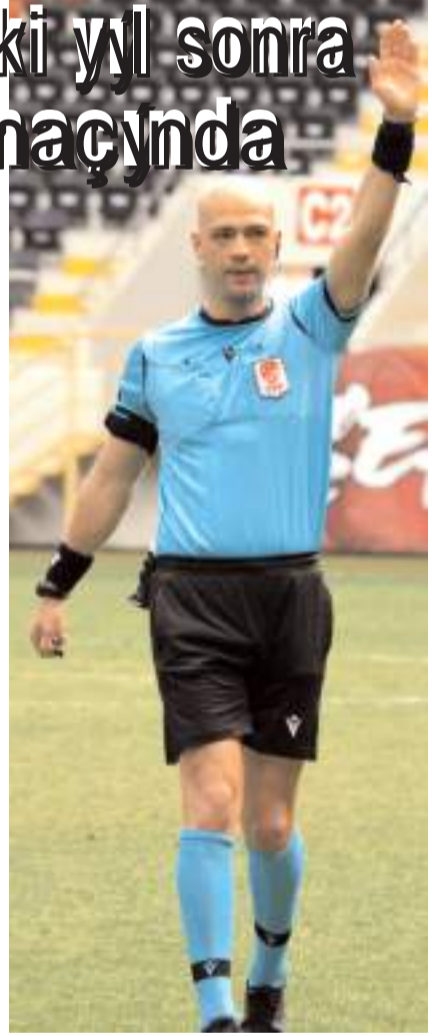
Yiğit Arslan Ahlatçı Çorum FK'nın son saniyede golü ile 2-1 yendiği 1461 Trabzon maçını yönetti.

Yiğit Arslan bugüne kadar Süper Lig'de 5, 1. ligde 61, 2. ligde 33, 3. ligde ise 27 maçta düdüklü çaldı. Maçın yardımcı hakemleri ise Kastamonu'dan Oğuz Terzi ve Rize'den Selahattin Altay. Maçın dördüncü hakemi