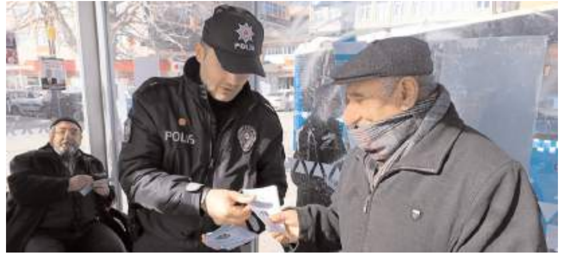
Polis ekipleri telefonla dolandırıcılık olaylarına karşı vatandaşlara bilgilendirici broşürler dağıttı.

Daha sonra Valimiz Sayın Doç.Dr. Zülkif Dağlı'nın küpün getirilip müze bahçesinde sergilenmesi talimatı üzerine 23.01.2024 günü Jandarma bahçesinden alınan küp aynı gün Çorum Müzesi bahçesindeki yerine nakledilmiştir. Çorum Müzesi uzman arkeologları tarafından incelenen küpün, Roma Dönemine MS 2-3 yüzyıllara tarihlendiği ve kendi döneminde yörede yaşayan çiftçiler tarafından hububat ve tahıl ürünlerinin depolanması ve saklanması için kullanılan iri küplerden olduğu anlaşılmıştır. Müze bahçesinde sergilenen küple ilgili envanter ve diğer çalışmalar devam etmektedir" denildi. (Haber Merkezi)