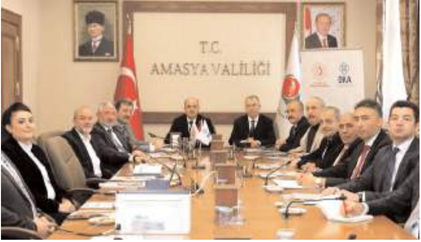
OKA yılın ilk toplantısını Amasya'da yaptı.