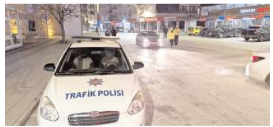
Denetimlerde 150 şahsın GBT kontrolü yapıldı.