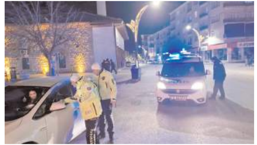
Polis ekipleri ilçenin belirli bölgelerinde uygulama noktaları oluşturdu.

Alaca İlçe Emniyet Müdürlüğü'ne bağlı Asayiş ve Trafik Şube Müdürlüğü ile mahalle bekçilerinin katılımı ile Ankara Caddesi üzerinde uygulama yapıldı. Denetimlerde 150 şahsın GBT kontrolü yapılırken uygulamalar sırasında 60 araçta alkol ve evrak kontrolü gerçekleştirildi. Yapılan kontrollerde herhangi bir olumsuzlukla karşılaşılmazken, Polis ekiplerinin huzur uygulamaları ve şok denetimlerinin devam edeceği bildirildi. (İHA)