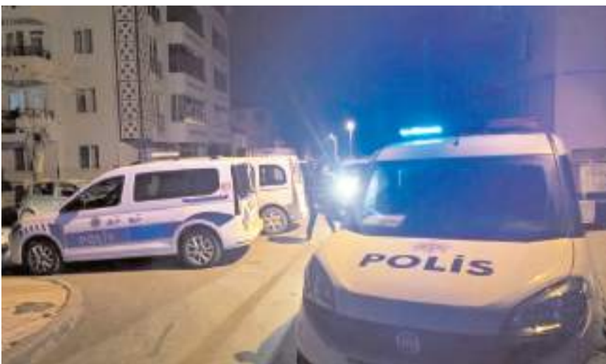
Olay Kale Mahallesi Aksaray 1. Cadde'de meydana gelmişti.

Zanlılarla araç sahibi arasında husumet olduğu öğrenildi.(AA)