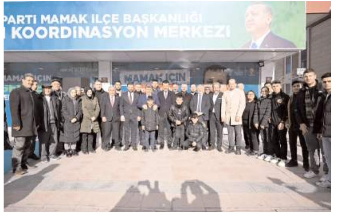
Çorum heyeti Asım Balcı'nın Seçim Koordinasyon Merkezini ziyaret etti.