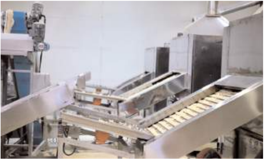
Fabrika GES ile yıllık 1,5 milyon lira civarında elektrik faturasından tasarruf sağladı.