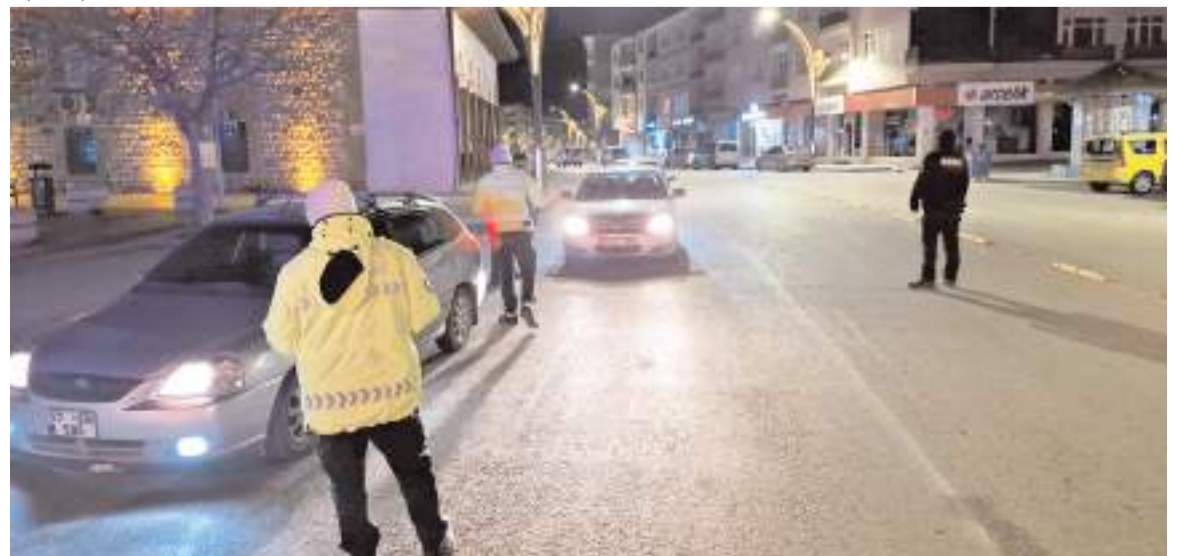
Yapılan kontrollerde herhangi bir olumsuzlukla karşılaşılmadığı belirtildi.