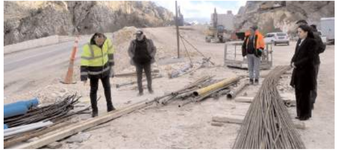
Tünel çalışmalarının yıl içinde bitirilmesi hedefleniyor.