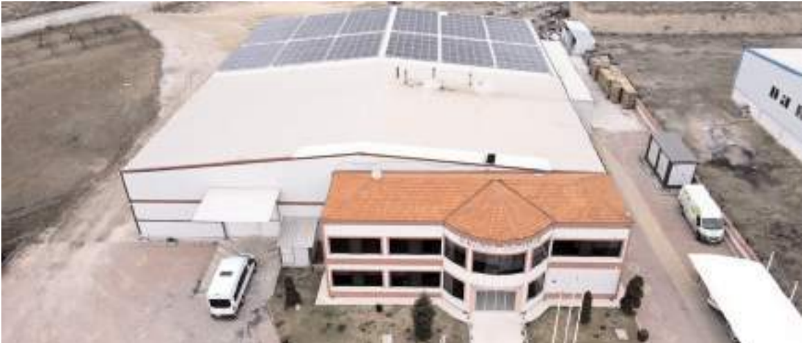
Çatı GES, yaklaşık 1 yılda kendini amorti etmiş.