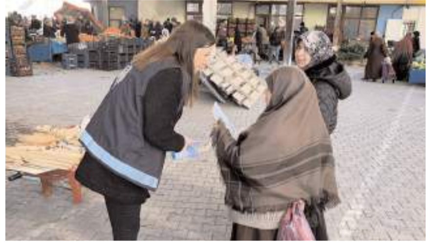
Polisler vatandaşları dolandırıcılık olaylarına karşı uyardı.