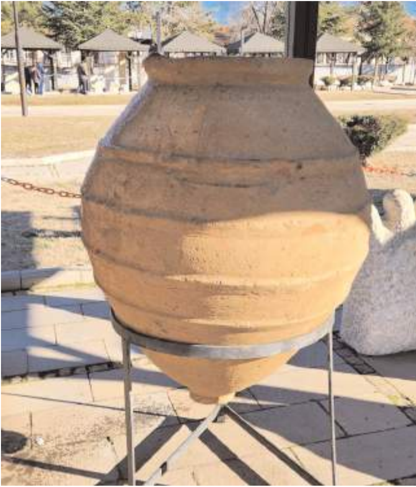
Tarihi küp Çorum Müzesi bahçesinde sergilenmeye başlandı.

Çorum Müzesi bahçesinde sergilenmeye başlandı