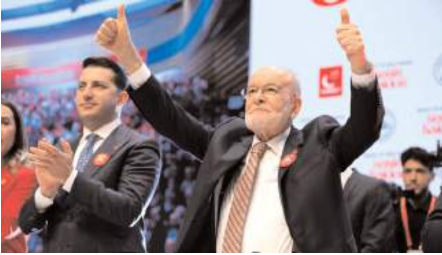
Saadet Partisi Genel Başkanı Temel Karamollaoğlu

Tanıtım programında konuşan Saadet Partisi Genel Başkanı Temel Karamollaoğlu, "İsrafın 'i'sine dahi tahammülümüz yoktur. Vatanın cebinden kuruş kuruş toplanan paraları milyar milyar savurma dönemine mutlaka bunun için son vereceğiz. Kaynaklarımızı verimli kullanacak bu konuda çok ama çok hassas davranacağız. Titiz davranacağız. Yolsuzluğa asla müsamaha göstermeyeceğiz. Belediyelerimizin kapısından arsız, hürsüz girmeyecektir. Bizim belediye başkanlarımızın kursağından bir lokma yetim malı geçmez. Belediye kaynaklarını ise yetim malına sahip çıkar gibi değerlendireceğiz. Biz bu anlayışla israf, rüşvet ve yolsuzluk düzenine son vereceğiz. 1 Nisan sabahından itibaren ihaleler üzerinden birilerinin köşeyi dönme devri sona erecektir" dedi. (Haber Merkezi)