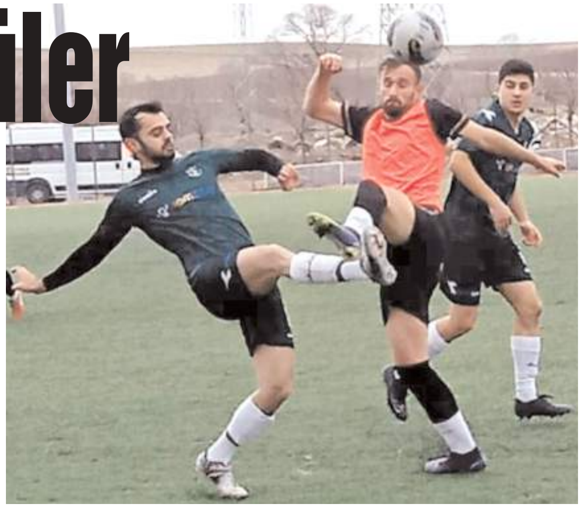
Alaca Belediyespor ile Mimar Sinan arasındaki zorlu maçtan 1-1 beraberlik ile ayrıldılar ve iki takımında işine yaramadı

İkinci yarıda Mimar Sinan galibiyeti korumak için orta sahaya kalabalık tutarak kontrataklarla etkili olmaya çalıştı. Ev sahibi Alaca Belediyespor ise son bölümde risk aldı ve baskı kurdu. Maçın 90+7. dakikasında ceza sahası yan çizgisinden kazanılan faul atışı Vedat kullandı ceza saha-