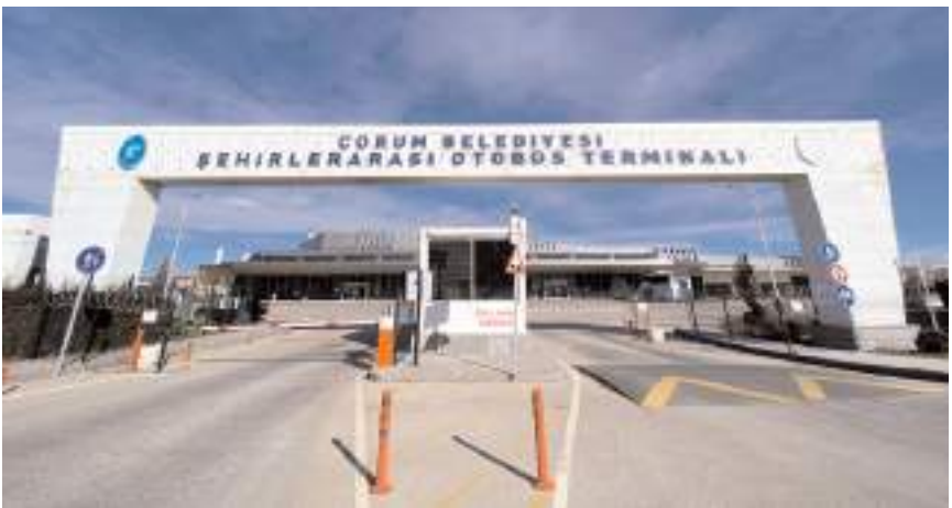
Terminalin giriş çıkışlarına düzenleme yapıldı.