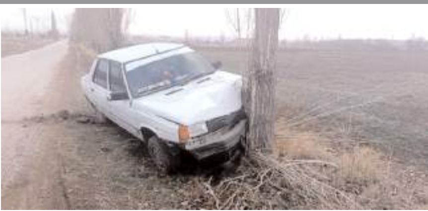
Kaza Alaca - Boğaziçi (Hışır) köyü yolundan meydana geldi

Jandarma ekipleri olayla ilgili soruşturma başlattı. (İHA)