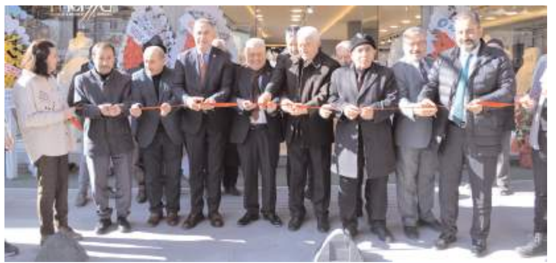
Yapılan duanın ardından açılış kurdelesini kesildi.

Yolcu girişleri ise artık sadece tek kapıdan sağlanacak. Yolcu ve yolcu yakınları otopark alanının bulunduğu kapıdan terminale giriş yapabilecekler. Ayrıca yolcu bekleme salonuna girişlere güvenlik amacıyla x-ray cihazları monte ediliyor. Güvenlik amacıyla yapılan düzenlemelerle vatandaşların seyahatlerini daha güvenli ve kontrollü hale getirmeyi amaçlanıyor. (Haber Merkezi)