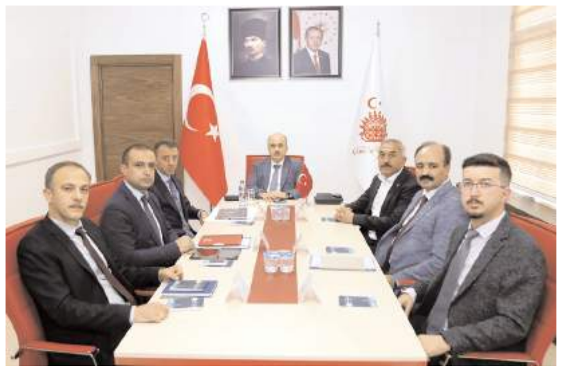
Alaca OSB'nin tüzel kişiliği için çalışma yapılacaktır.