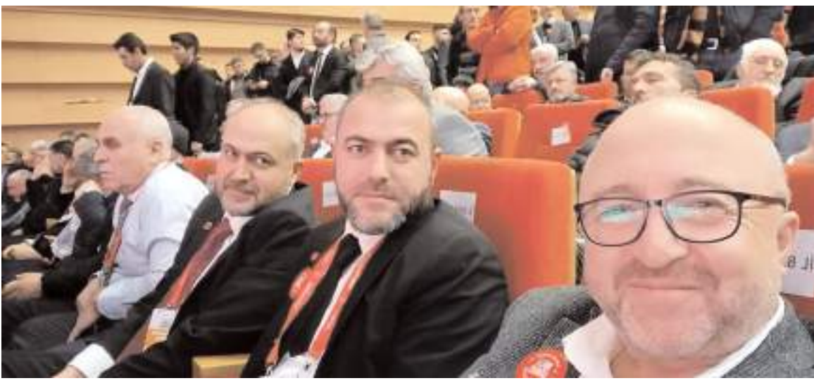
Ankara ATO Congressium'da yapılan tanıtım programına katılan Çorum SP heyeti...