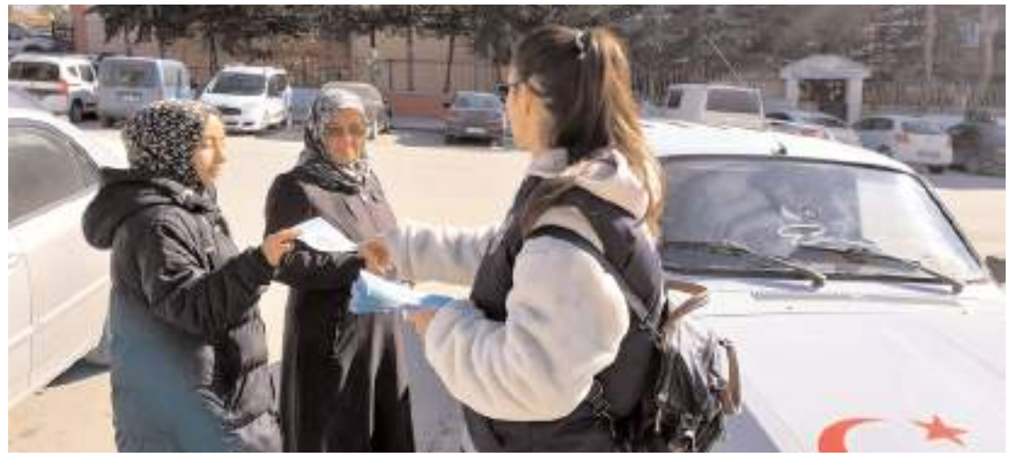
Polis ekipleri vatandaşlara bilgilendirici broşürler dağıttılar.

Kazada yaralanan otomobil sürücüsü ile takside bulunan anne ve bebeği, sağlık ekiplerinin müdahalesinin ardından Hitit Üniversitesi Erol Olçok Eğitim ve Araştırma Hastanesi'ne kaldırıldı.(AA)