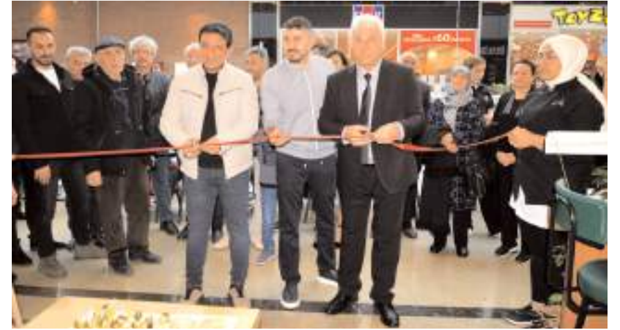
Yapılan duanın ardından açılış kurdelesini kesildi.