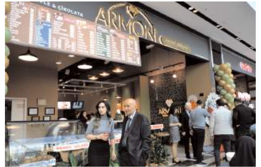
Armoni Lezzet Atölyesi AHL Park AVM'de faaliyete başladı.