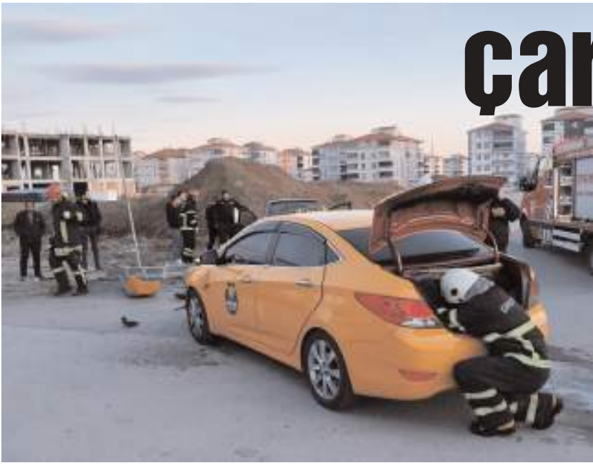
Kaza Buharaevler Mahallesi Bayat Gediği 1. Sokak'ta meydana geldi.