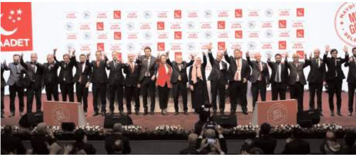
Programda 9'u büyükşehir, 26'sı il belediye başkanı olmak üzere 339 belediye başkan adayı tanıtıldı.