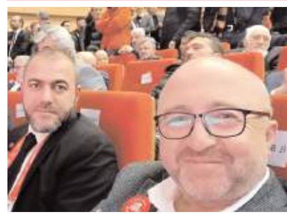
Ankara ATO Congressum'da yapılan tanıtım programına katılan Çorum SP heyeti...