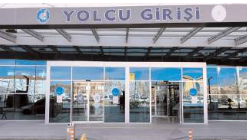
Terminal içerisine yaya girişleri x-ray cihazının bulunduğu tek kapıdan yapılacaktır.

Çorum Belediyesi, şehirlerarası otobüs terminalinde güvenlik amacıyla bazı düzenlemelere gitti. Otopark alanına giriş kapısının yeri değiştirirken, terminal içerisine yaya girişleri ise x-ray cihazının bulunduğu tek kapıdan yapılacaktır.