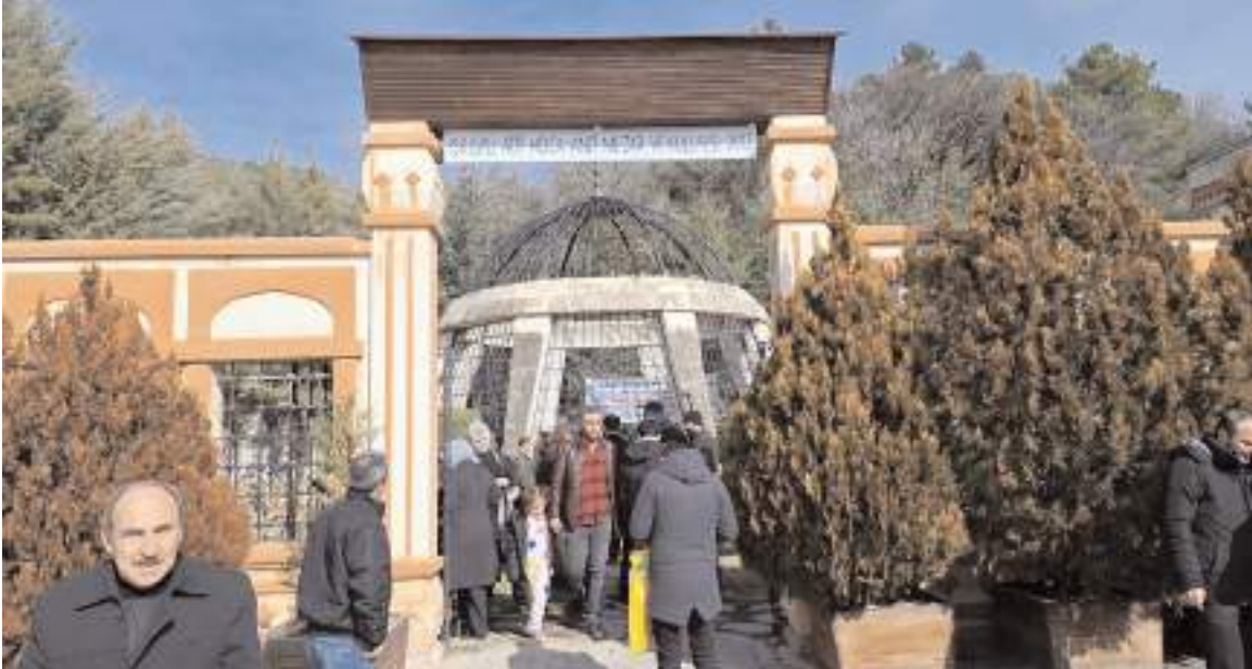
İskilipli Atıf Hoca Anıt Mezar ve Külliyesi

İskilipli Atıf Hoca ölümünün 98. yılında memleketi Çorum'un İskilip ilçesindeki kabri başında anıldı.