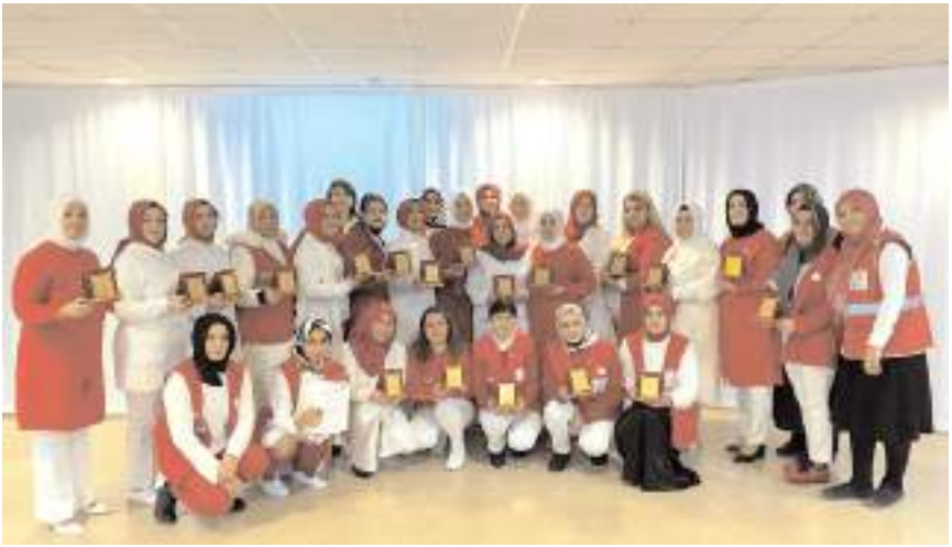
Günün anısına hatıra fotoğrafı çekildi.