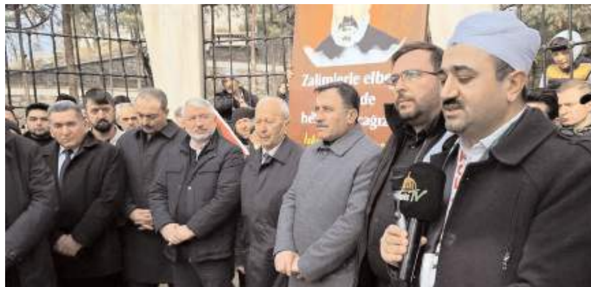
İskilipli Atıf Hoca ölümünün 98. yılında kabri başında anıldı.