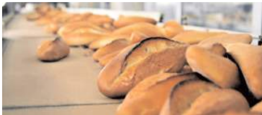
Yeni fiyat tarifesini 3 Şubat 2024 Cumartesi gününden itibaren geçerli olacak.