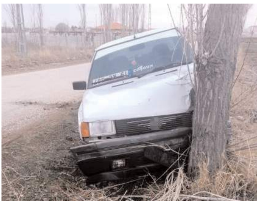
Kazada araçta maddi hasar meydana geldi.