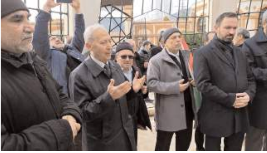
Programda Kur'an-ı Kerim tilavetinin ardından dua edildi.