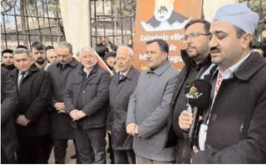
İskilipli Atıf Hoca ölümünün 98. yılında kabri başında anıldı.