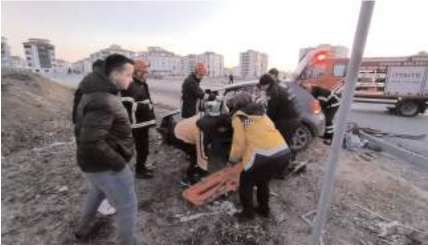
Yaralılara ilk müdahale 112 acil sağlık ekipleri tarafından olay yerinde yapıldı.

Çorum'da otomobil ile taksinin çarpıştığı kazada yaralanan 1'i bebek 3 kişi, tedavi altına alındı.