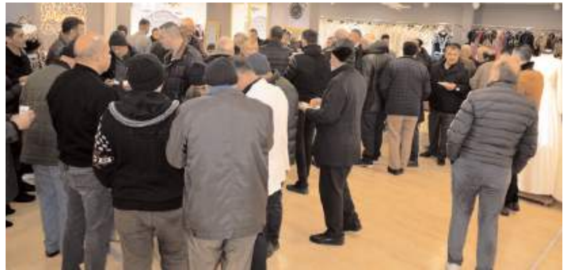
Açılışa çok sayıda davetli katıldı.