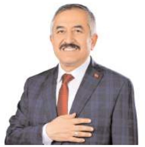
Alaca Belediye Başkanı Halil İbrahim Şaltu

OSB'nin ilçe ekonomisine büyük katkı sağlayacağını ifade eden Başkan Şaltu, "Alaca ilçesinde; müteşebbislerin ihtiyaç duyduğu fiziksel ve teknolojik altyapısı tamamlanmış büyük alanı üretim parselleri oluşturmak, yerli ve milli sanayi tesisleri yanında tarıma dayalı sanayiye geliştiren tesislerin kurulması, üretim için gerekli tüm giderlerin daha az maliyetle sürekli ve güvenli olarak arzının sağlanması, üretim sonrası oluşan ürünlerin güvenli bir şekilde depolanması, hammadde ve enerji israfının önlenmesi, sevkiyat ve üretimden kaynaklanan atıkların sürekli, kontrollü ve çevreye duyarlı olarak uzaklaştırılmasının sağlanarak üretimde sürekliliğin sağlanması, işsizliğin azaltılması, istihdamın artırılması ve katma değeri yüksek, son teknoloji tesisler kurarak Alaca ilçesine, çevre ilçelere ve Çorum iline katkı sağlanması amacıyla Organize Sanayi Bölgesi kurulmasına karar verildi" dedi.