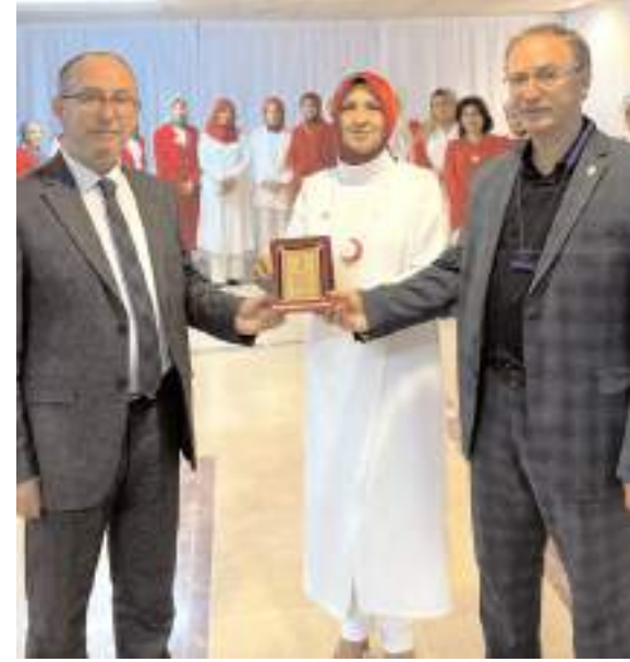
Çorum Kadın Teşkilatı gönüllülerine, Kızılay yönetim kurulu tarafından plaket takdim verildi