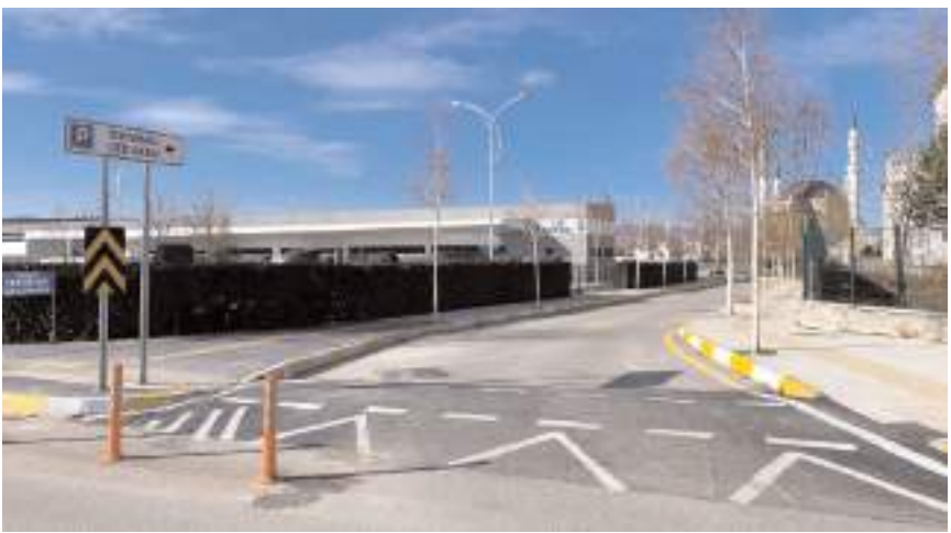
Sivil araçlar yeni düzenlemeyle Öğretmen Lisesi 1. Sokak üzerinden otoparka girebilecek.