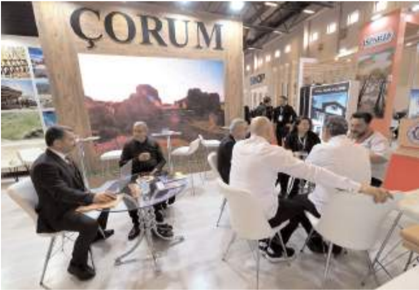
Ziyaretçiler Çorum hakkında bilgi aldılar.