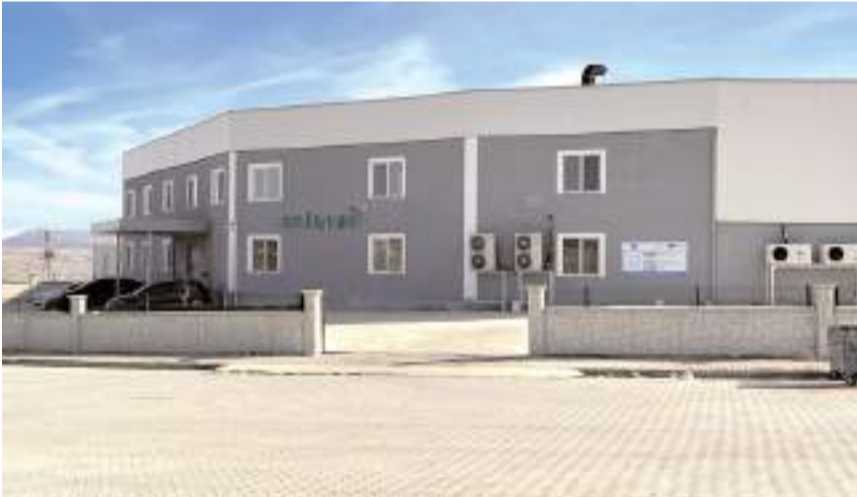
Natrooil Gıda Türkiye'nin en hızlı büyüyen 100 şirketi arasına girmeyi başardı.