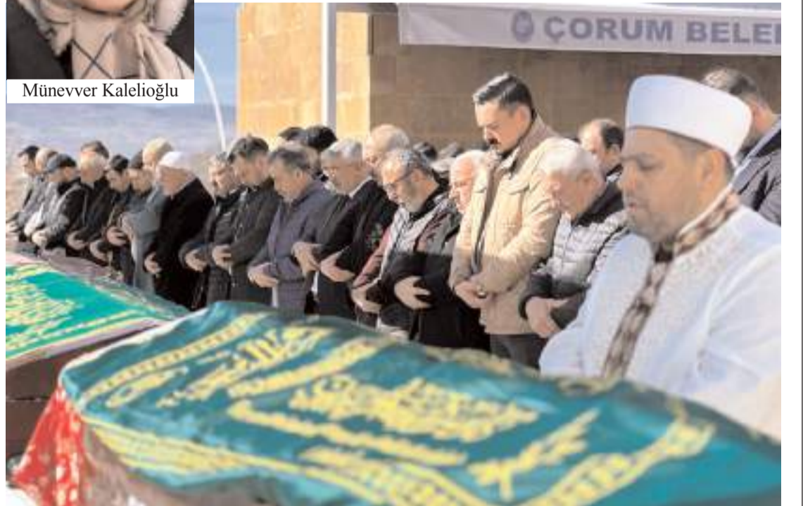
Merhumenin cenazesi Akşemseddin Cami'nde kılınan cenaze namazının ardından Ulu Mezarlıkta toprağa verildi.