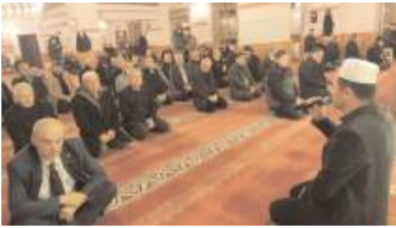
Mevlid-i Şerif programı Emre Camii'nde yapıldı.