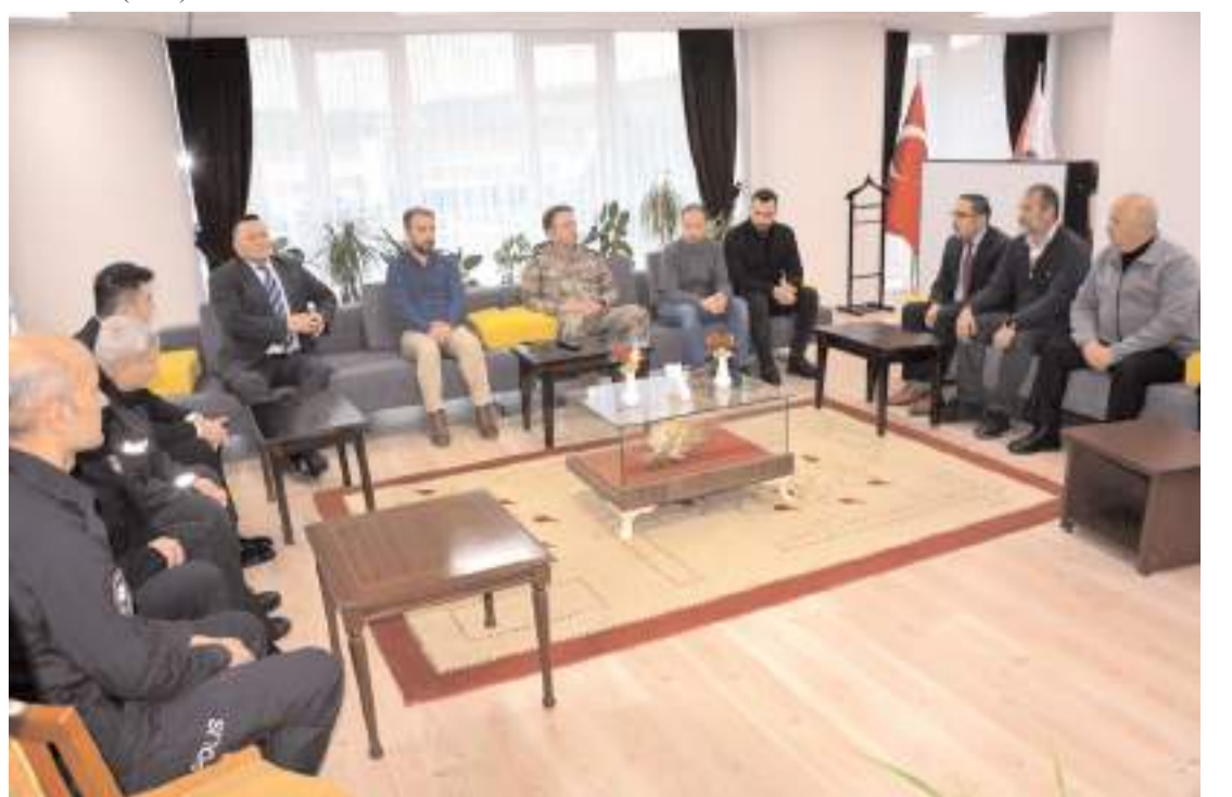
Pehlivan toplantıda deprem bölgesinde görev yapan polislerle de bir araya geldi.