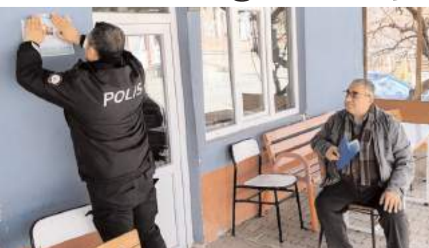
Vatandaşların mağduriyet yaşamaması amacıyla çalışma başlatıldı.

Çorum'un Laçın ilçesinde polis, vatandaşları telefon dolandırıcılığına karşı uyardı.