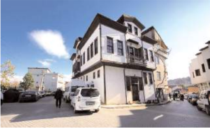
Tarihi konağın Mecitözü Kültür ve Sanat Konağı olarak hizmet verecek.

■ Mecitözü'nde bulunan Özel İdare Konağı'nın kullanıma açılması amacıyla Orta Karadeniz Kalkınma Ajansının (OKA) desteğiyle çalışma yürütülecek.