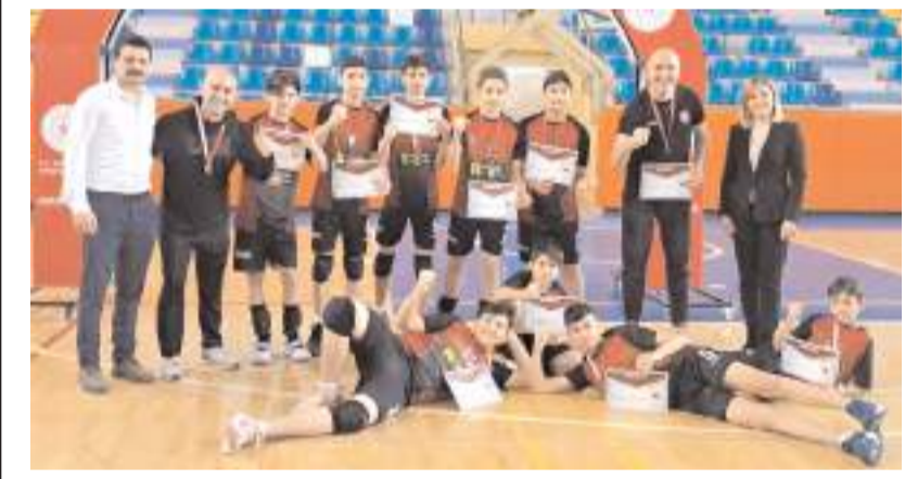
Ahmet Tevfik İleri Ortaokulu Kırkkale'de grup birinciliği ödülleri ile toplu halde

Dört grupta oynanacak maçlar sonunda gruplarında ilk iki sırayı alan sekiz takım A ve B grubu olarak ikiye ayrılacak ve Karaman grubunda mücadele edecek Osmaniye MEM takımı final grubuna yükselmesi halinde 27-29 Şubat'ta Karaman'da çıkamaması durumunda ise Osmaniye'de 1. lige yükselme final grubunda mücadele edecekler. İki grupta oynanacak maçlar sonunda ilk iki sırayı alan dört takım 1. lige yükselcekler.