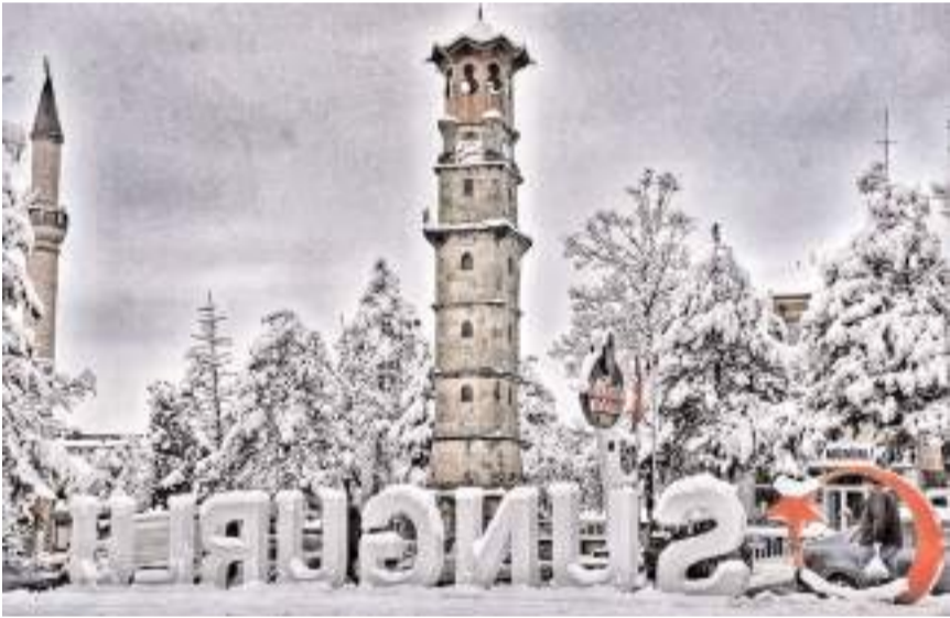
Sungurlu'nun genel nüfusu 49 bin 86 olarak açıklandı.

Yayınlanan sonuçlara göre, 25 bin 1'i erkek, 24 bin 85'i kadın olmak üzere Sungurlu'nun genel nüfusu 49 bin 86 olarak açıklandı. Merkez nüfus ise 16 bin 391'i erkek, 15 bin 640'ı kadın olmak üzere toplam 32 bin