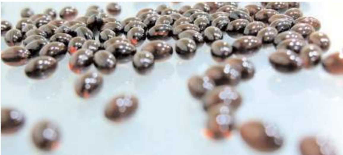
Natrooil Gıda, tıbbi aromatik bitkisel ürünler sektöründe faaliyet gösteriyor.