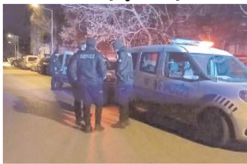
Olay Bahçelievler Mahallesi Bahçelievler 4. Sokak'ta meydana geldi.

Çorum'da sokakta yürüttükleri esnada tanımadıkları şahıslar tarafından para istenen 2 kişi para vermeyince bıçaklandı.