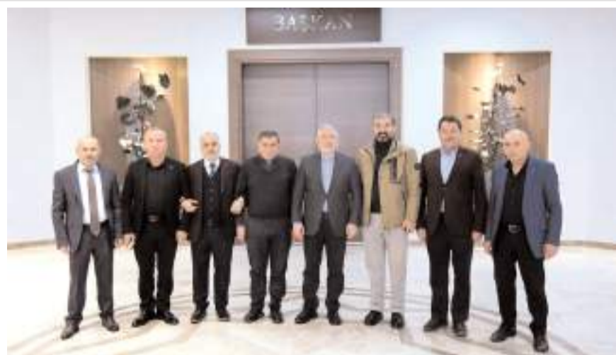
Ziyaretin sonunda hatıra fotoğrafı çekildi.