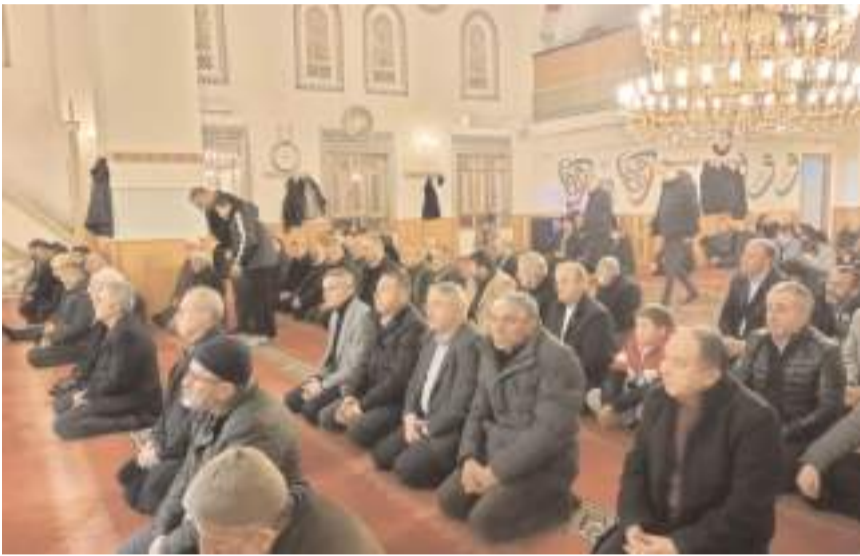
Kur'an-ı Kerim tilavetinin ardından Mevlid-i Şerif okundu.