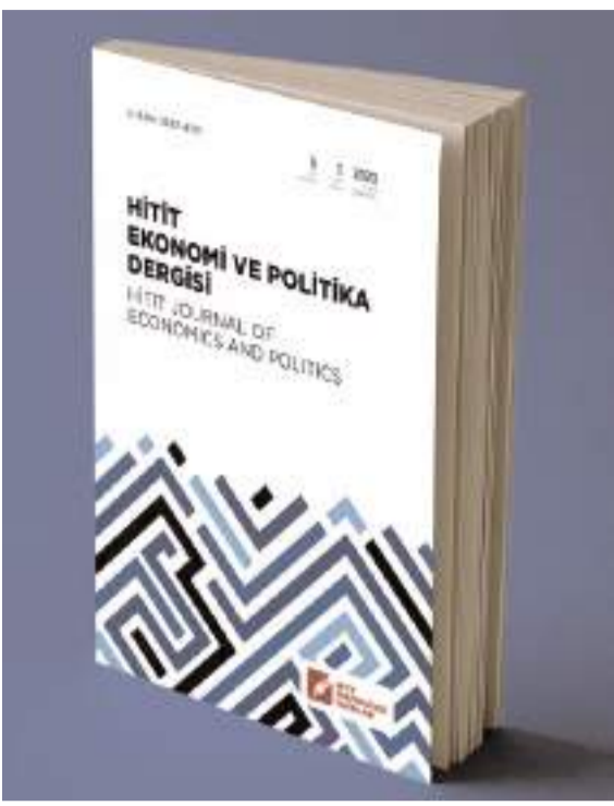
Hitit Ekonomi ve Politika Dergisi, ulusal ve uluslararası alandaki gelişimini sürdürüyor.

İktisadi, idari ve siyasi bilimler alanlarındaki bilimsel çalışmalara yer veren "Hitit Ekonomi ve Politika Dergisi", DOAJ indeksine kabul edildi.