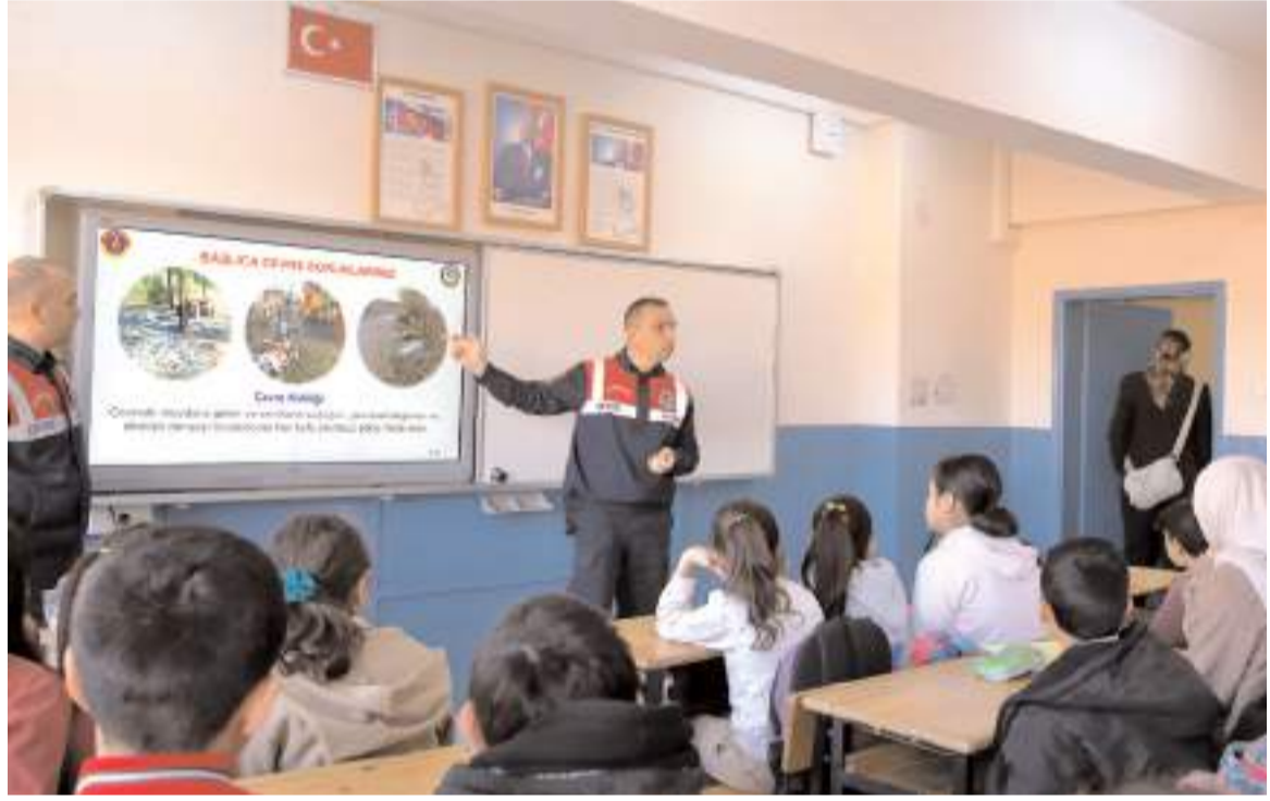
Eğitimlerde öğrencilere temiz çevrenin önemi anlatılıyor.

Okullarda eğitim faaliyetlerinin devam edeceği bildirildi. (AA)