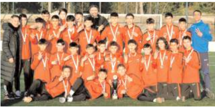
U 15'de Çorum şampiyonu olan Çorum Anadolu FK Beşiktaş ile hazırlık maçı yapacak

Dün grubunda ikinci maçında Bolu Şehit Mustafa Bilgili Ortaokulu ile karşılaşan Ahmet Tevfik İleri Ortaokulu rakibi önünde zorlanmadan 3-0'lık net bir galibiyet alarak grup birincisi olarak yarı final grubunda mücadele etmeye hak kazandı.