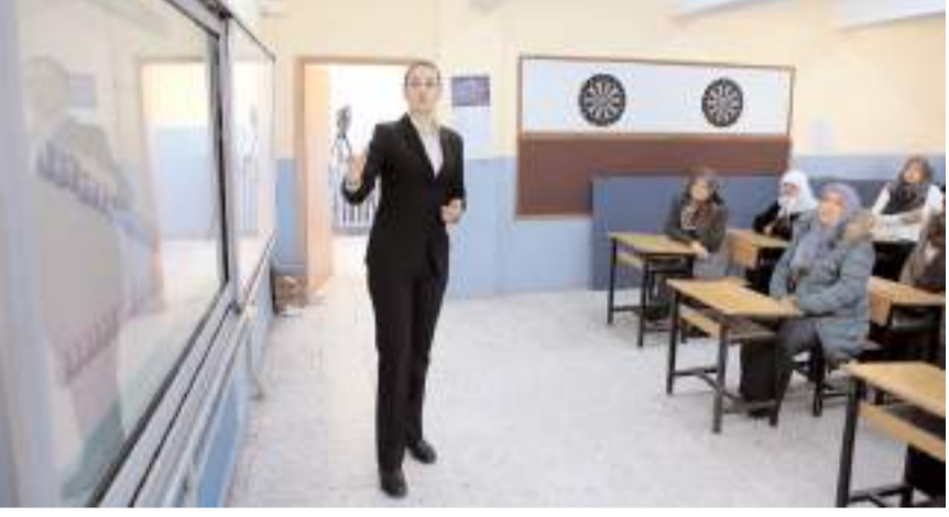
Ailelere zararlı alışkanlıklar, madde bağımlılığı ile mücadele anlatılıyor.