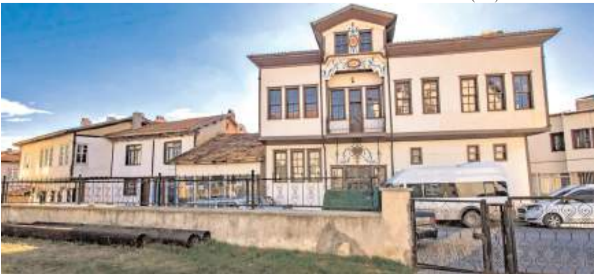
Tarihi konağın Mecitözü Kültür ve Sanat Konağı olarak hizmet verecek.