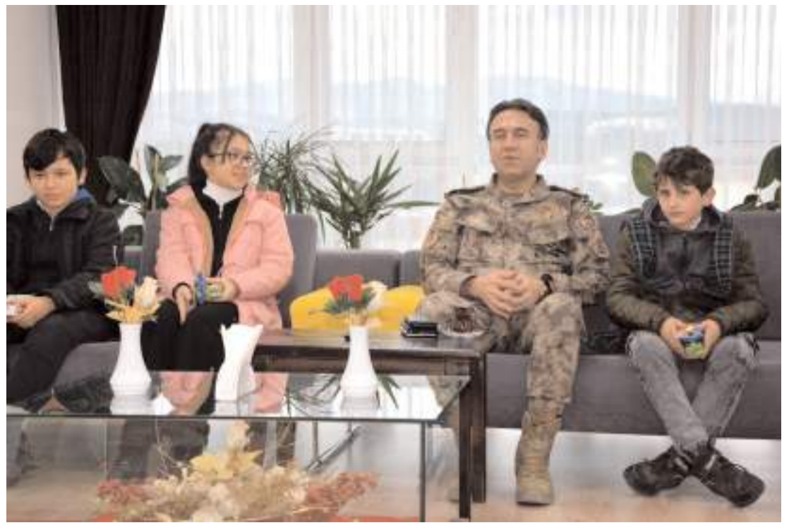
Emniyet Müdürü Arif Pehlivan, depremzede öğrenciler ve meslektaşlarıyla bir araya geldi.

Emniyet birimleri, ilçede otobüs durakları, banka önleri ve kuyumcuların bulunduğu bölgelerde dolandırıcılık yöntemleri hakkında bilgi içeren el ilanı dağıttı. (AA)