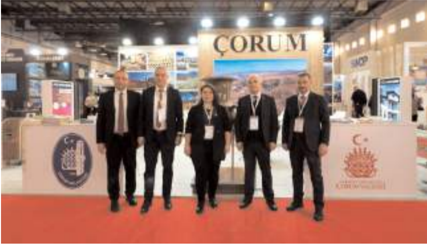
EMITT – Doğu Akdeniz Uluslararası Turizm ve Seyahat Fuarı İstanbul'da açıldı.