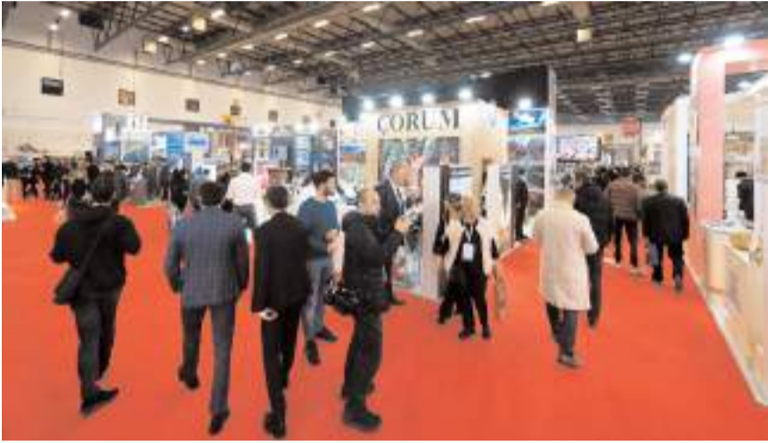
Fuarda Çorum'un tanıtımı için stant kuruldu.