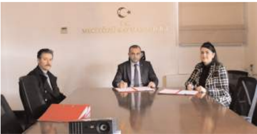
Konağın kullanıma açılması amacıyla OKA desteğiyle çalışma yürütülecek.