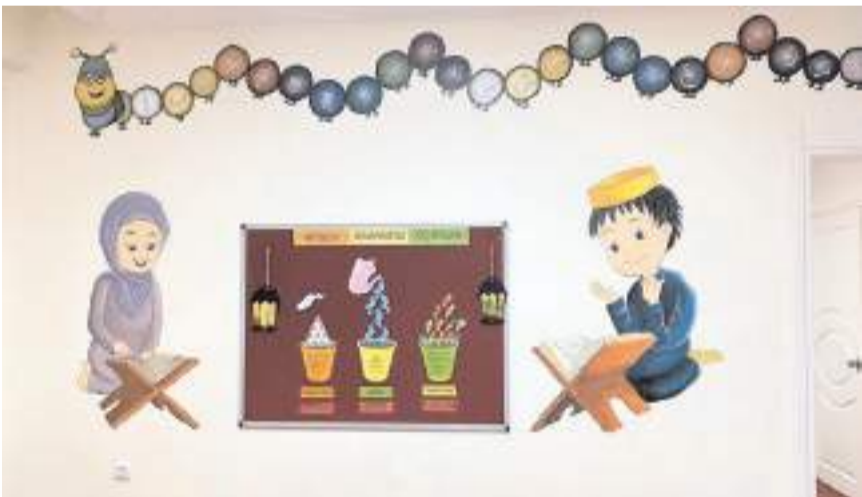
Ortaköy İlçe Müftülüğü 4-6 yaş Kur'an Kursu dersliği yenilendi.