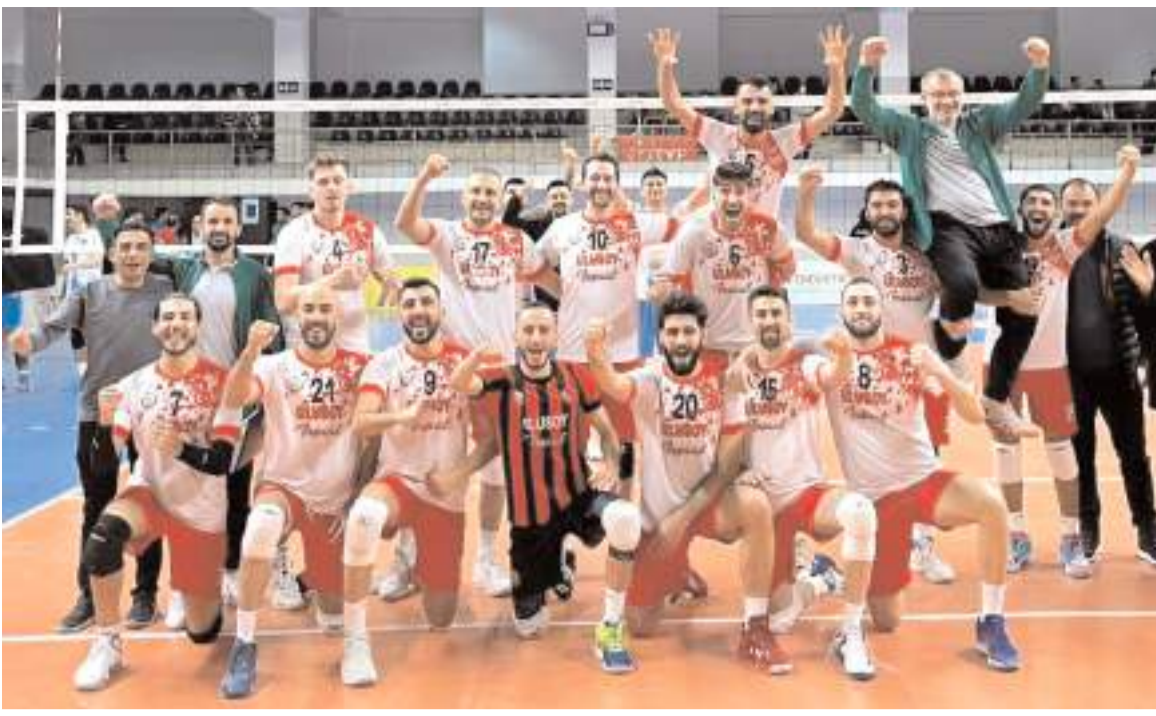
Sungurlu Belediyesi Spor'un Osmaniye'de oynayacağı play-off yarı finalindeki rakipleri belli oldu