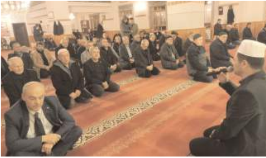
Mevlid-i Şerif programı Emre Camii'nde yapıldı.

Türkoğlu ailesi, mevlide katılanlara ve emeği geçen herkese teşekkür etti. (Haber Merkezi)