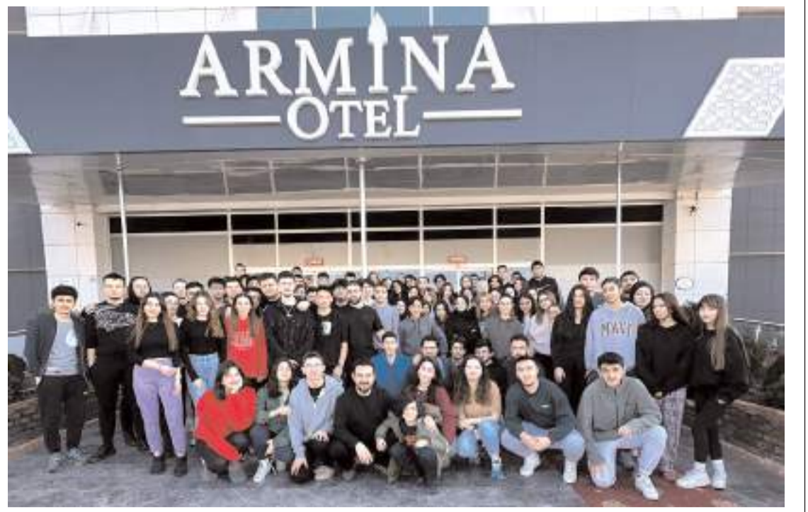
Ahmet Duran Eğitim Merkezi, geleneksel hale getirdiği yarıyıl kampını tamamladı.