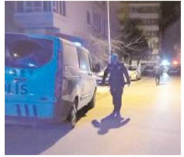
Olay Bahçelievler Mahallesi Bahçelievler 4. Sokak'ta meydana geldi.