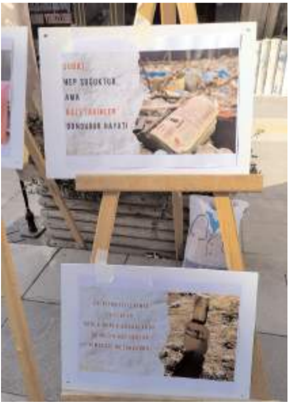
Etkinlikte fotoğraflarla depreme dikkat çekildi.