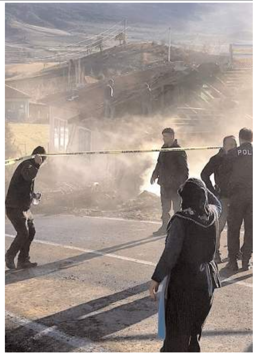
Yangında büyük çapta maddi hasar meydana geldi.

Yangınla ilgili inceleme başlatıldı. (İHA)