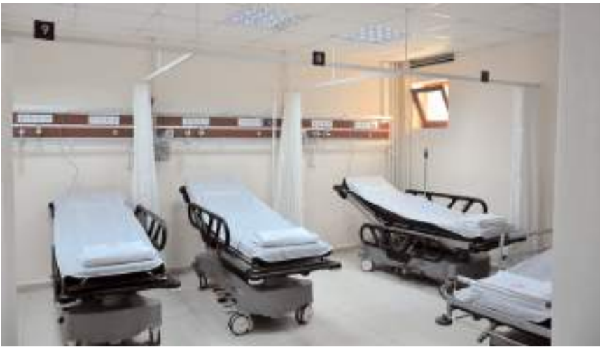
Yetişkin Gözlem Alanı ve Acil Kritik Bakım Ünitesi hizmete açıldı.