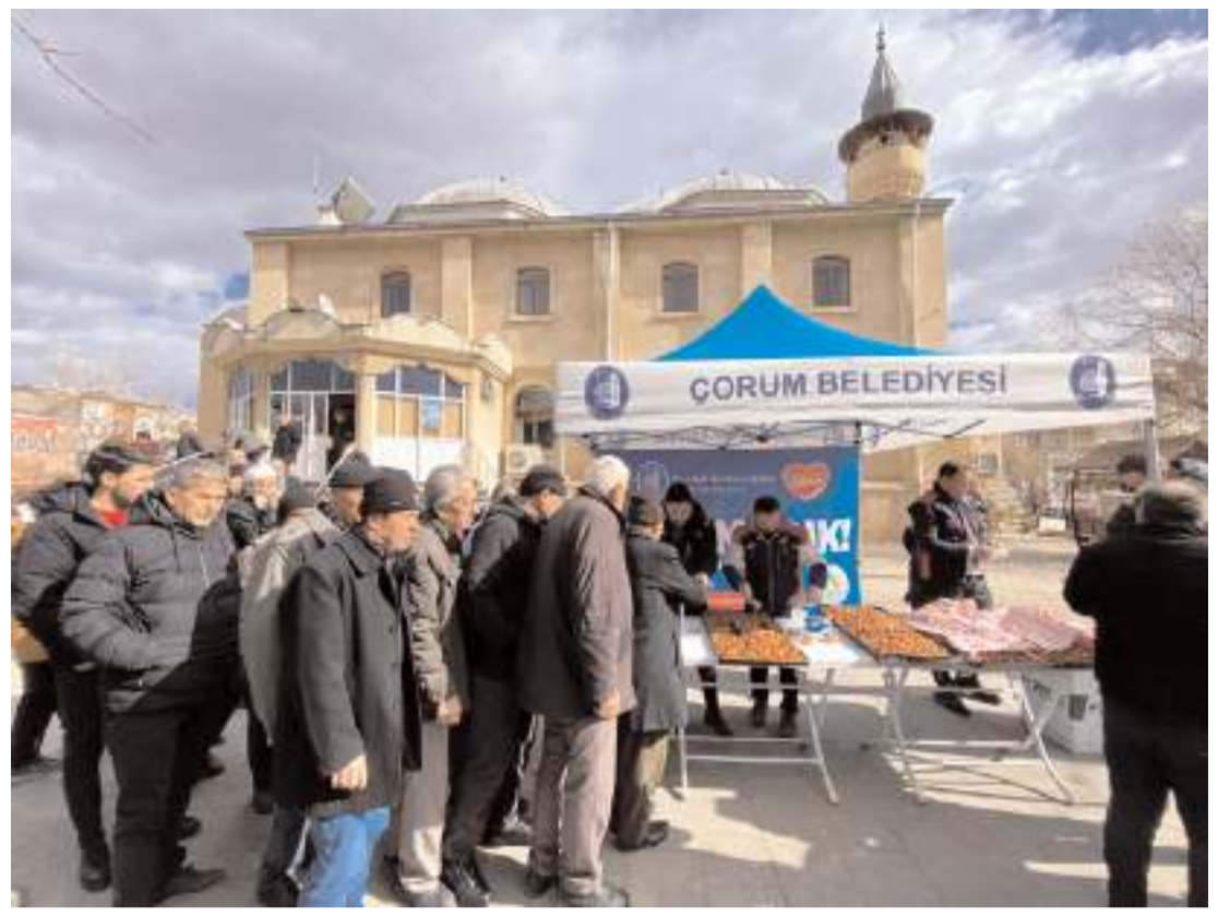
Afşin'de depremzedelerin acılarını paylaşan Çorum Belediyesi ekipleri, Miraç kandilini Afşin halkıyla birlikte idrak etti.

kaybettiler. Evleri, araçları, belki de tüm mal varlıkları saniyeler içinde yok oldu. Evet, bu büyük bir felaket. Ancak Türkiye'miz de büyük bir ülke. Önemli olan husus, imkânlarımızı doğru değerlendirerek, süreci iyi yönetebilmektir. Maalesef deprem öncesi hazırlık sürecini iyi yönetemediğimiz ortada, fakat deprem sonrası süreci sağlıklı yönetememiz de elzemdir. Üzerinden bir yıl geçmesine rağmen elle tutulur adımlar atılmadı. Biz deprem bölgemiz ve oradaki vatandaşlarımızla sürekli olarak irtibatımız. Durumlarımızı da yakından takip ediyoruz. Ancak verilen vaatlerin yerine getirilmediğini bizzat oradaki vatandaşlarımızdan görüyoruz. Televizyonlarda ortak yayınlar yapıp milyonlarca lira para toplandı. Herkes büyük büyük laflarla yardımlar yaptığını ilan etti ama hala onlarca insanımız sefalet içinde yaşıyor. Deprem öncesi ciddiyetsizlik, deprem anındaki aciziyet ve sonrasında koordinasyon konusundaki beceriksizlik maddi ve manevi kayıplarımızı kat be kat arttırmıştır. Bu bölgede, tarihi tam olarak bilinmese de, tahmini olarak beklenen bir deprem konusunda onlarca uzman, yüzlerce kez uyarılmıştı. Yapılması gereken hazırlıklar hususunda belki binlerce rapor hazırlanmıştır; şimdi soruyoruz hangisi dikkate alındı? Depreme hazırlık konusunda neler yapıldı, daha doğrusu neler yapılmadı? Bunları sormak her bir vatandaşımızın hakkı olduğu gibi, biz muhalefet partilerinin de sorumluluğudur; bunlara cevap vermek ise iktidardakilerin görevidir" dedi. (Haber Merkezi)