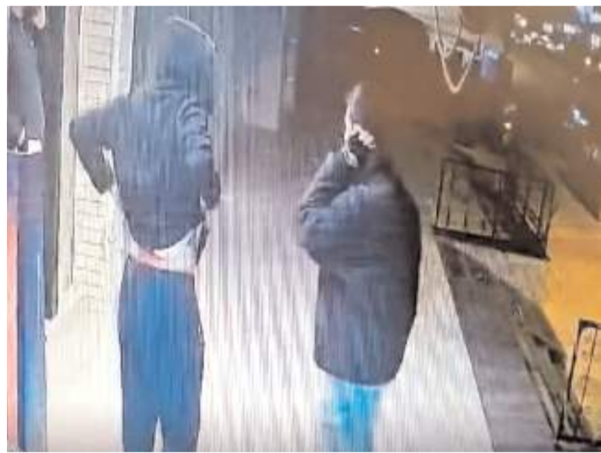
Olay Bahçelievler Mahallesi Bahar Caddesi'nde meydana geldi.