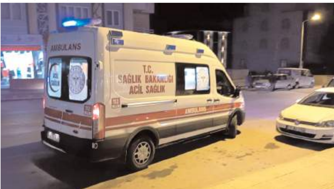
Yaralı şahıs Hitit Üniversitesi Erol Olçok Eğitim ve Araştırma Hastanesi'ne kaldırılarak tedavi altına alındı.