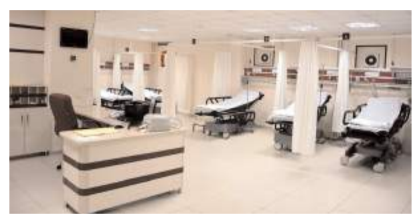
Yetişkin Gözlem Alanı ve Acil Kritik Bakım Ünitesi hizmete açıldı.