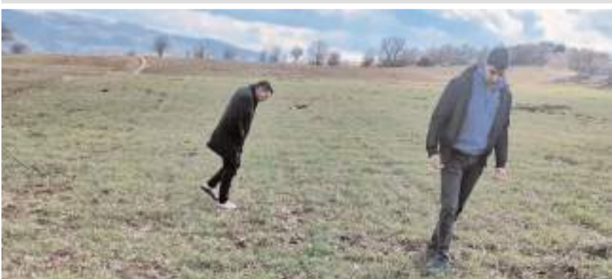
İncelemeyi Oğuzlar İlçe Tarım Müdürlüğü ekipleri yaptı.