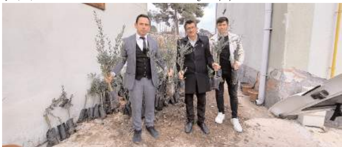
İlçede alternatif ürün olarak zeytin yetiştiriciliğinin teşvik edilmesi hedefleniyor.