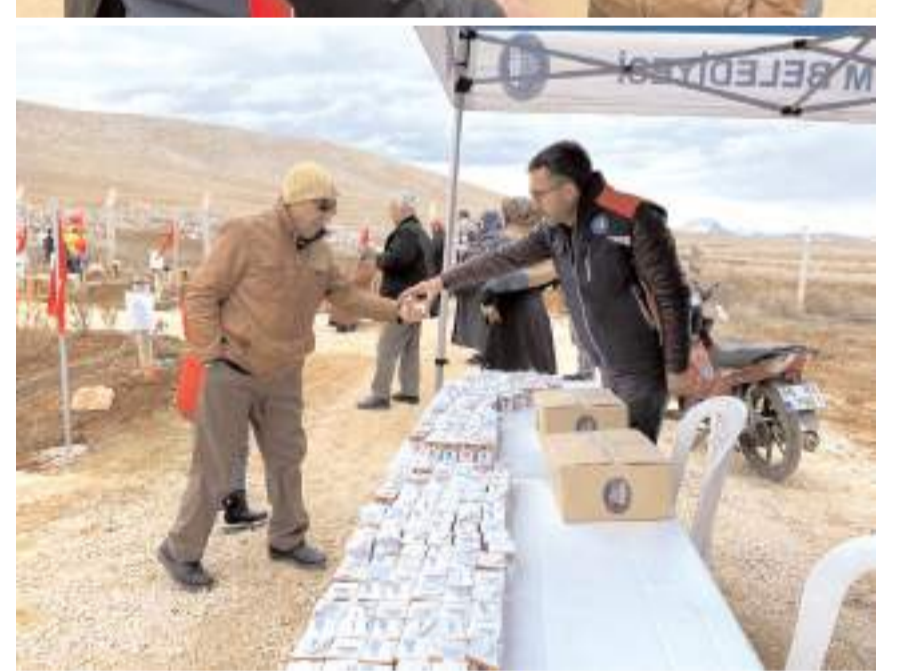
Belediye, depremde hayatını kaydedenler için kabristanda düzenlenen anma programına katılarak lokum ikram etti.