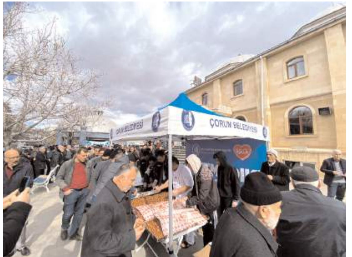
Kültür ve Sosyal İşler Müdürlüğü ekipleri, Afşin Ulu Cami'de de vatandaşlara lokma ve lokum ikramında bulundu.