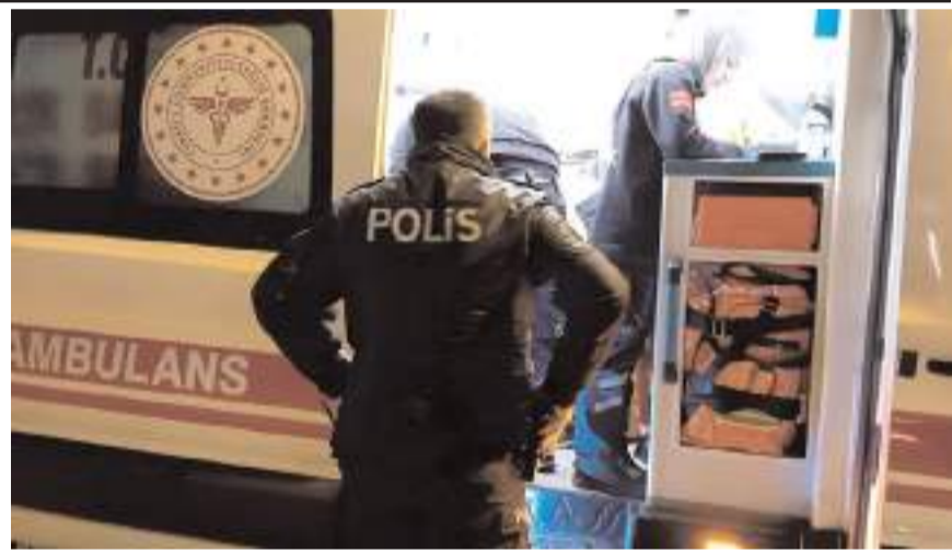
Yaralı şahsa ilk müdahale sağlık ekipleri tarafından yapıldı.

Polis ekipleri bıçaklı yaralama olayını gerçekleştiren şahıs hakkında yakalama çalışması başlattı. (İHA)