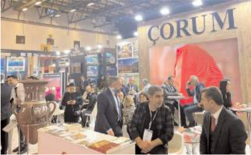
Standta Çorum tarihi ve turistik ile kültürel mirası tanıtılıyor.