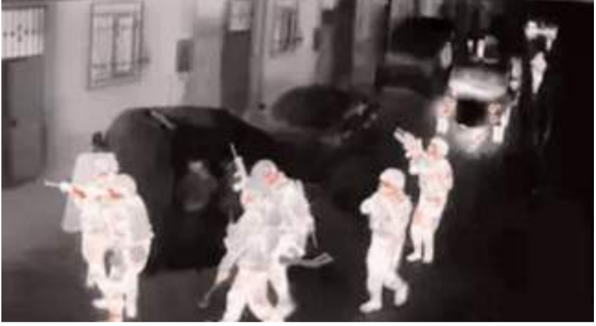
Operasyon 33 ilde yapıldı.

Daire Başkanlığı koordinesinde, İl Emniyet Müdürlüklerimizce düzenlenen operasyonlarda Adana'da 5, Adıyaman'da 3, Afyonkarahisar'da 17, Ankara'da 8, Antalya'da 3, Bingöl'de 1, Bitlis'te 1, Bolu'da 4, Bursa'da 2, Çorum'da 3, Diyarbakır'da 7, Düzce'de 1, Eskişehir'de 1, Elazığ'da 2, İstanbul'da 2, Gaziantep'te 6, İzmir'de 11, Karabük'te 1, Kayseri'de 5, Kırkkale'de 1, Kırşehir'de 6, Kilis'te 6, Kocaeli'de 3, Konya'da 4, Kütahya'da 1, Manisa'da 9, Mardin'de 3, Mersin'de 6, Muğla'da 2, Sakarya'da 8, Samsun'da 2, Şanlıurfa'da 11, Yalova'da 2 şüpheli yakalandı" ifadelerine yer verdi. (İHA)