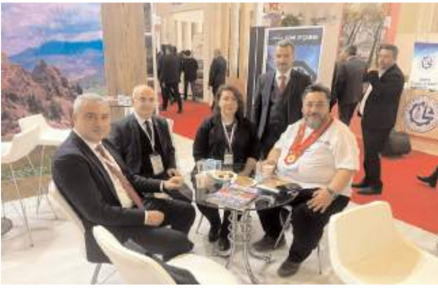
EMITT Fuarı'nın 27.'si düzenleniyor.