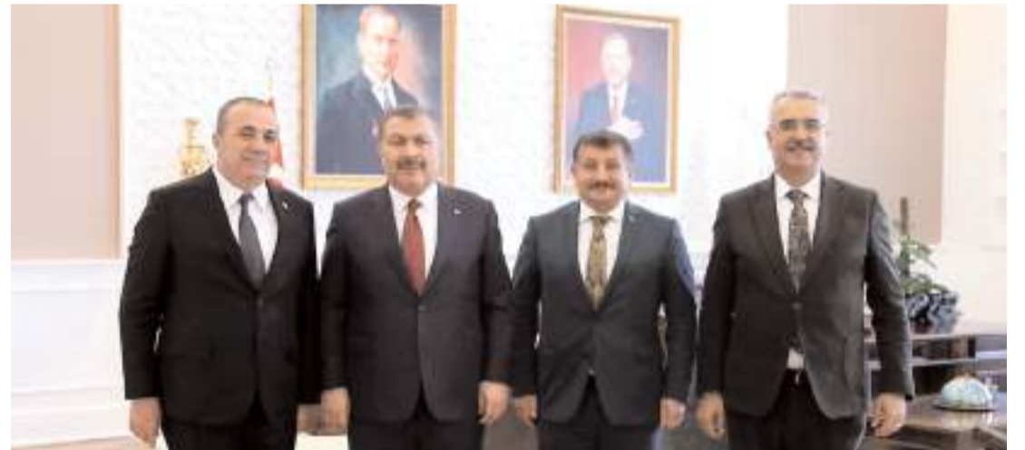
Çorum heyeti Sağlık Bakanı Dr. Fahrettin Koca'yı ziyaret etti.

İYİ Parti Çorum heyeti, ziyaret sonunda Akşener ile hep birlikte hatıra fotoğrafı çektiler, seçimlerin startını verdi. (Haber Merkezi)