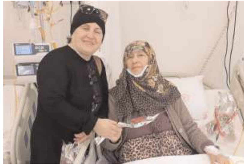
Ziyarete çiçek hediye edildi.

Çorum'da faaliyet gösteren kanser dernekleri 4 Şubat Dünya Kanserliler Günü nedeniyle Onkoloji Tanı ve Tedavi Merkezini ziyaret ettiler. Onkosav, Kan-Der ve Kader derneklerinin yöneticileri 4 Şubat Dünya Kanserliler Günü nedeniyle Onkoloji Tanı ve Tedavi Merkezini ziyaret ederek, hastalara ve merkez çalışanlarına çiçek hediye ettiler.