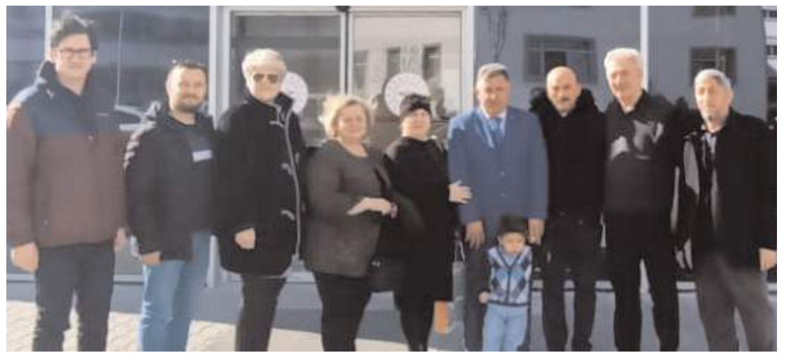
Ziyaretin anısına Onkoloji Tanı ve Tedavi Merkezi önünde hatıra fotoğrafı çekildi.

Şehrin tanıtımına yönelik çalışmaları önemsediklerine dikkat çeken Başkan Aşgın, "Bunun için ülkemizdeki önemli fuarlarda şehrimizi tanıtmak için yer alıyoruz. EMITT Fuarı da turizm ve tanıtım anlamında en önemli fuarlardan biri. Hazırladığımız tanıtım videolarıyla ve yayınlarıyla şehrimizi ve kültürümüzü uluslararası bu fuarda tanıtıyoruz. EMITT Fuarı'nın şehrimizin tanıtımına katkı vermesini temenni ediyorum" dedi. (Haber Merkezi)