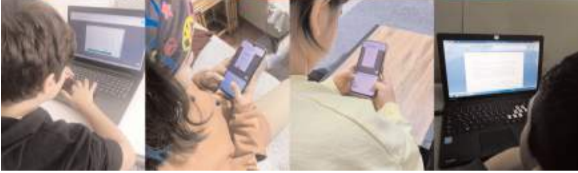
Öğrenciler Afşin'de ki okullara mailler ile mesaj göndererek dijital mektup etkinliği düzenlediler.