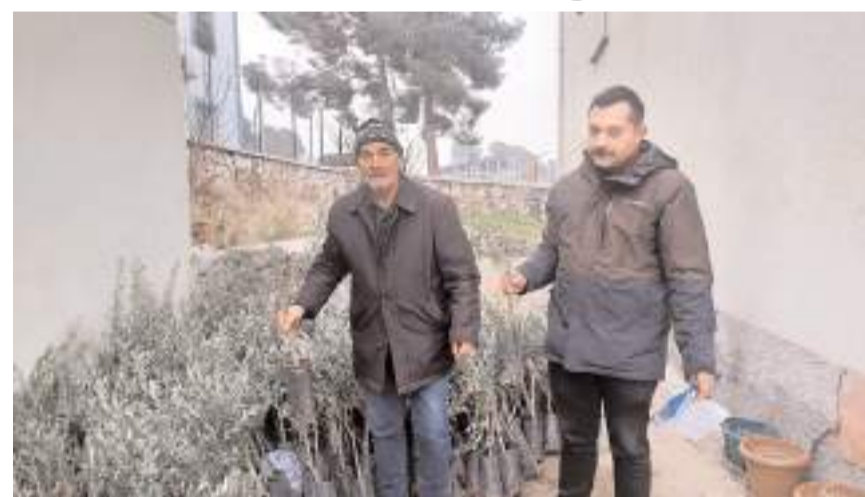
Kargı'da "Zeytin Yetiştiriciliğini Yaygınlaştırma ve Geliştirme Projesi"ni hayata geçirdi.

Öte yandan zeytin bahçeleri kurulması için Kargı İlçe Tarım ve Orman Müdürlüğü tarafından yürütülen çalışmalar da devam ediyor.(AA)