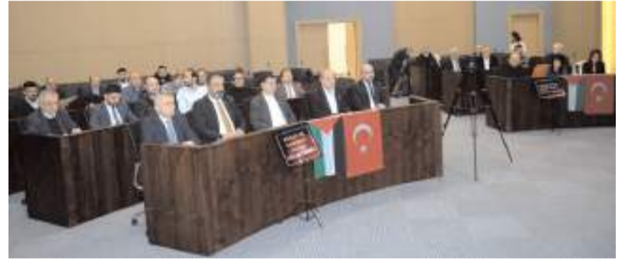
Toplantıda gündem maddeleri görüşülerek karara bağlandı.

de dahil olmak üzere kısırlaştırma çalışmalarına başladığını söyledi. Ulukavak Mahallesi Özgürevler 6. Sokak-