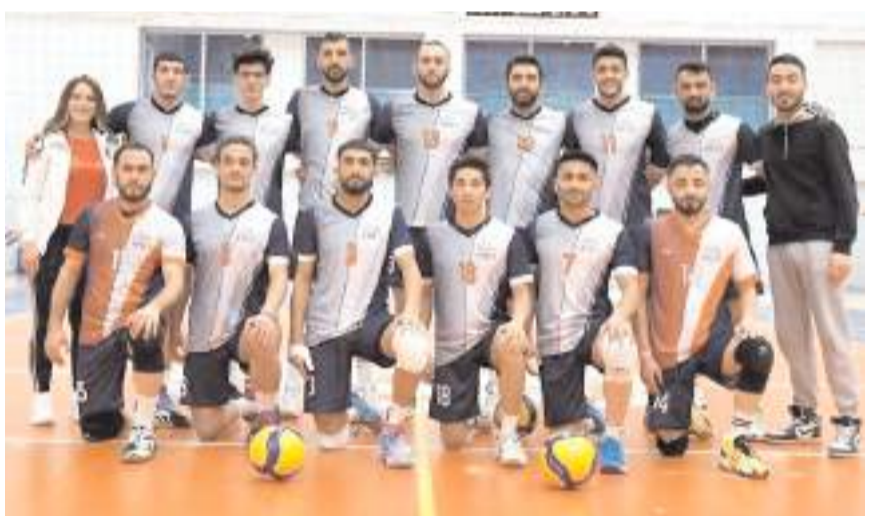
Erkek takımı ise bugün son maçını kazanarak finallere gitmek istiyor

Erkeklerde ise beş takımın mücadele ettiği grup birinciliğinde son maçlar bugün oynanacak. Grupta ilk üç maçını kazanan Hitit Üniversitesi erkek takımı bugün grubundaki son maçında Yalova Üniversitesi ile karşılaşacak. Temsilcimiz bu maçı kazanması halinde grup birincisi olara finallere gitmeye hak kazanacak. Maç saat 10'da Hitit Üniversitesi 15 Temmuz Spor Salonu'nda başlayacak.