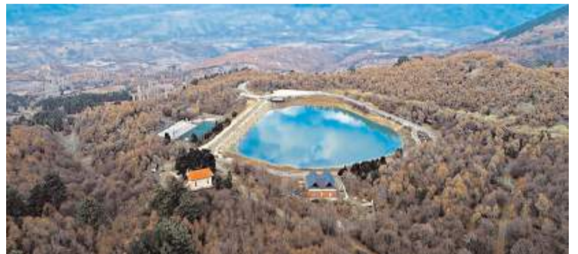
Laçın Yeşil Göl Mesire Alanı güzelliği ile dikkat çekiyor.

BİLSEM'de görevli öğretmenlerle de kısa bir toplantı yapan Vali Dağlı, özverili çalışmalarından dolayı merkezdeki görevli öğretmenlere teşekkür etti. (İHA)