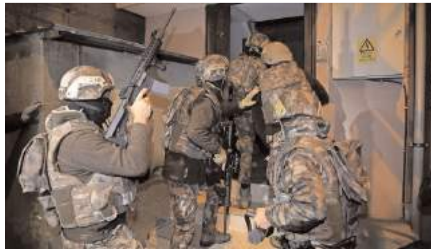
Operasyonda Çorum'da 3 şüpheli gözaltına alındı.