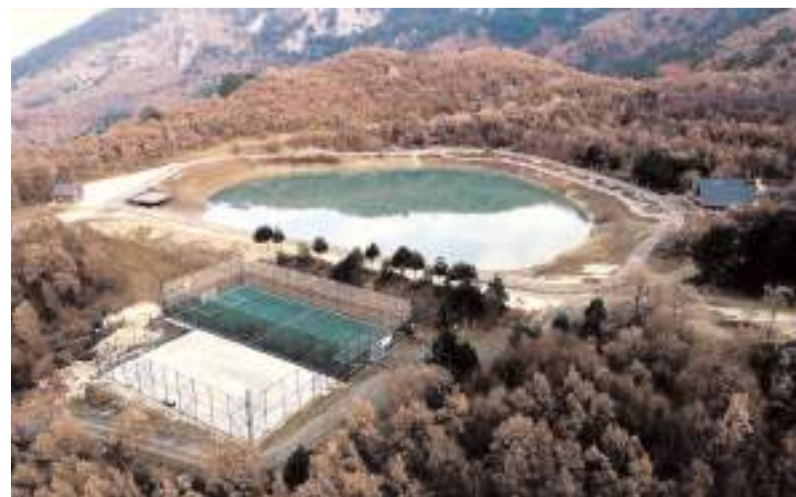
Proje kapsamında Laçın Yeşil Göl mesire alanına bungalov ev yapılacak.