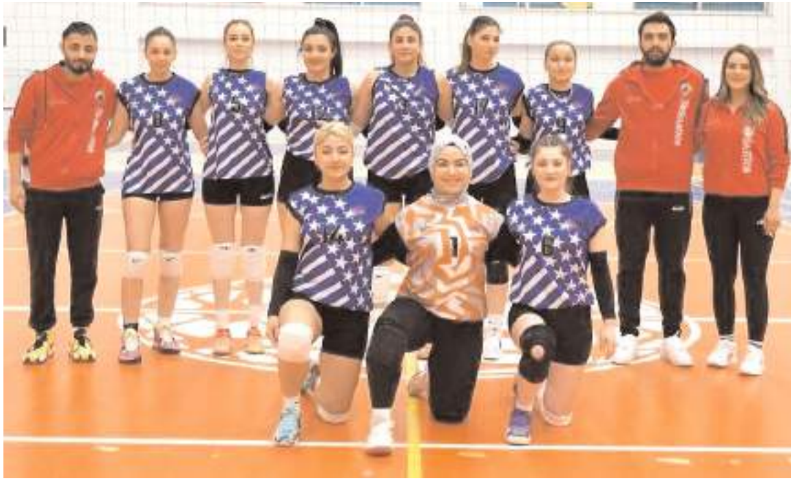
Kadın voleybol takımı bölgesel ligi birinci olarak bitirdi ve final biletini aldı