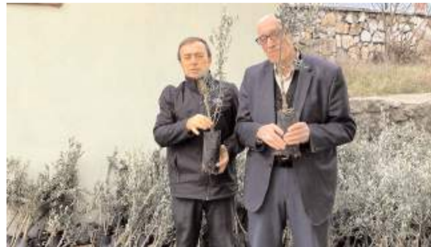
Dikilecek zeytin fidanları İlçe Tarım ve Orman Müdürlüğünde çiftçilere teslim edildi.