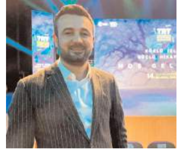
TRT İç Yapımlar Daire Başkanı Mesut Eker