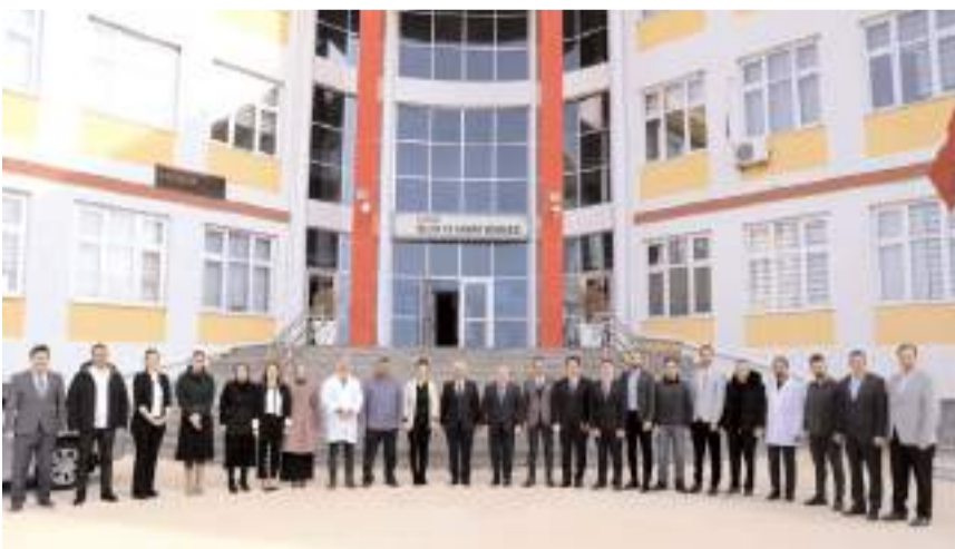
Ziyaretin anısına hatıra fotoğrafı çekildi.