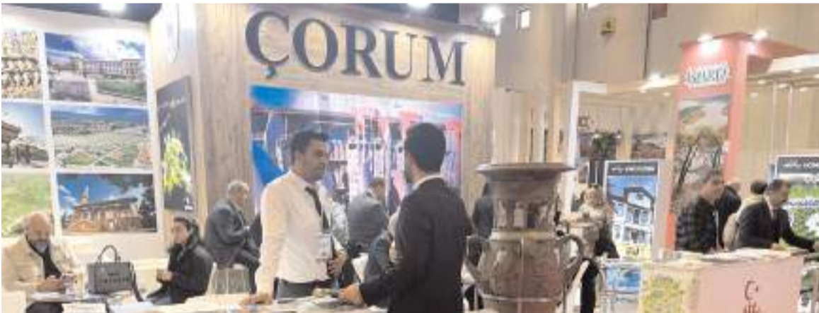
EMITT Fuarı bugün sona erecek.