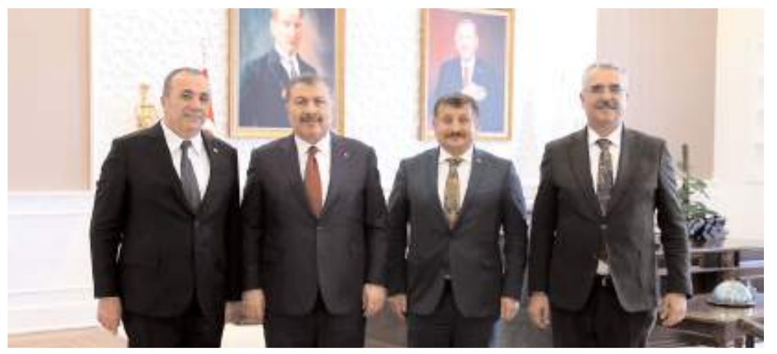
Çorum heyeti Sağlık Bakanı Dr. Fahrettin Koca'yı ziyaret etti.