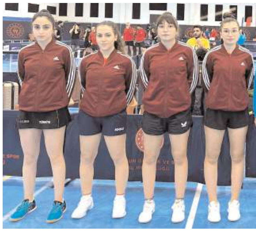
Çorum Spor İhtisas kadın takımı Çorum'da play-off için mücadele edecek

Çorum'da yapılacak 4. etap müsabakaları sonunda ilk dokuz sırayı alan takımlar play-off'da mücadele ederken son dokuz sıradaki yer alan takımlar ise ligde kalma mücadelesi verecek. Son altı sırada yer alacak takımlar 1. lige düşecek.