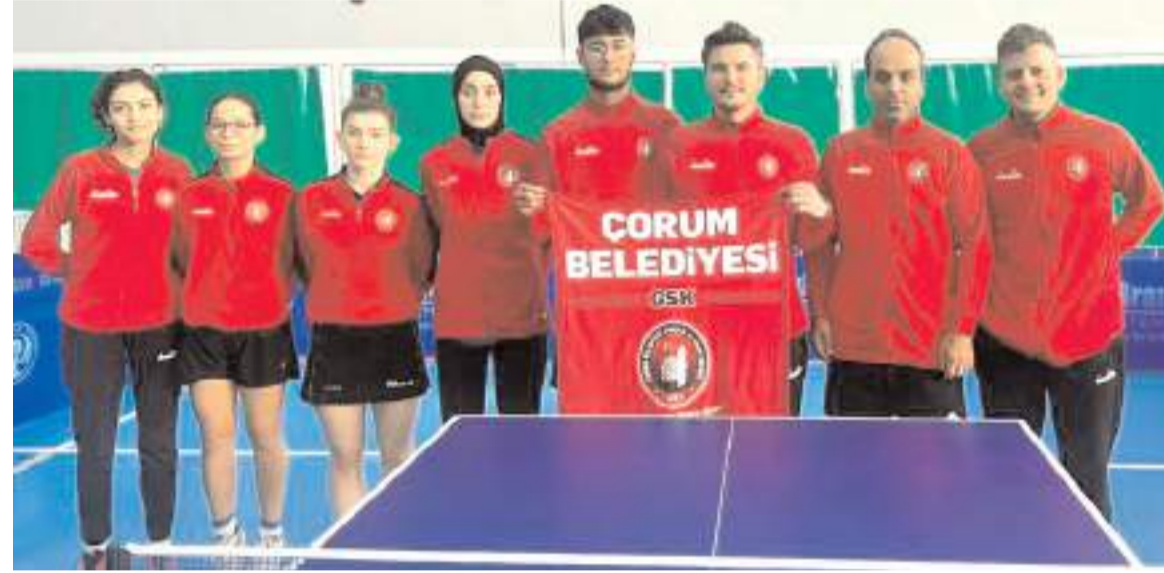
Çorum Belediyespor bayan ve erkek takımları ev sahipliğini yapacakları son etapta play-off mücadelesi verecekler

3 gün boyunca devam edecek müsabakalarda finale kalan oyuncuların final karşılaşması ise 11 Şubat Pazar günü saat 20.00'de yapılacak.