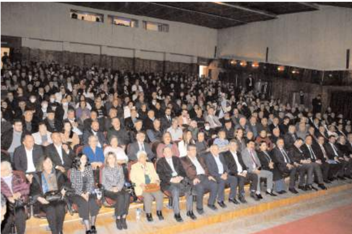
Devlet Tiyatro Salonunda yapılan tanıtım toplantısına katılım yüksek oldu.