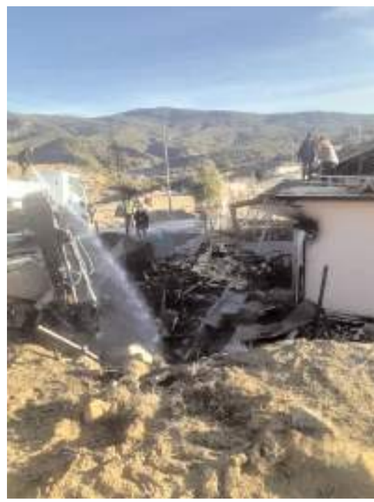
Olay, Ortaköy ilçesinde meydana geldi.

17 kahvehane, 9 kafe, 37 çay ocağı, 5 oyun salonu ve 9 otopark kontrol edildiği uygulamada, 3 aranan şahıs yakalandı, 668 araç kontrol edildiği, 8 araç sahibine 64 bin 854 lira idari para cezası uygulandı. (İHA)