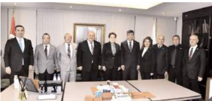
Ziyaretin anısına hatıra fotoğrafı çekildi.

İYİ Parti Genel Başkanı Meral Akşener, Çorum heyetini makamında kabul etti.