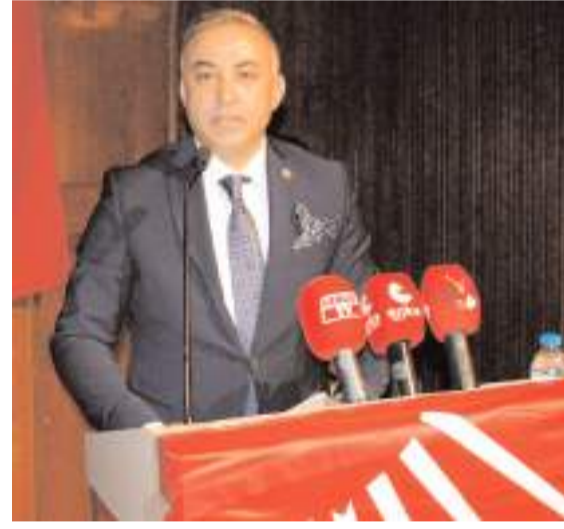
CHP Çorum Milletvekili Mehmet Tahtasız

Konuşmasında iktidara yüklenen Tahtasız, Çorum halkını 22 yıldır kandırdıklarını belirterek; Çorum ili 22 yıldır AK Parti belediyeçilik anlayışıyla yönetiliyor ama 22 yıldır Çorum kandırılı-