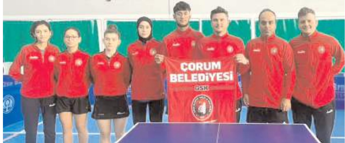
Çorum belediyespor erkek takımı final grubunda bayan takımı ise klasmanda mücadele edecek