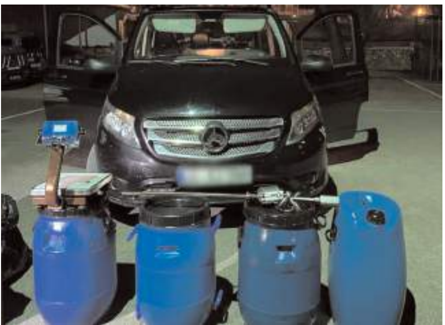
Dolandırıcılardan ele geçirilen malzemelere el konuldu.