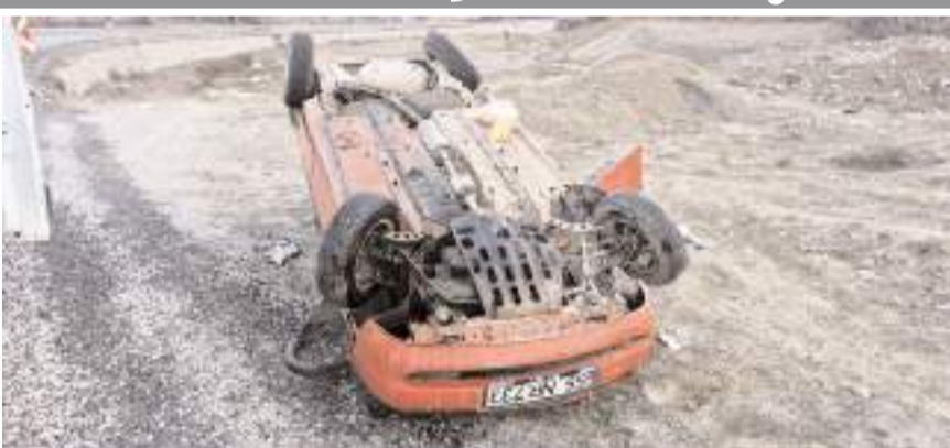
Kaza, Alaca'nın Budak Ören köyü yakınlarında meydana geldi.