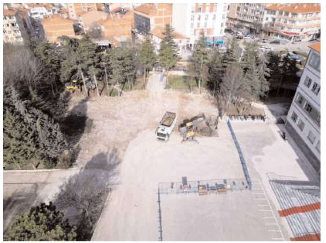
Çorum Belediyesi ekipleri Eti Anadolu Lisesinin bahçesinde çalışmalara başladı.