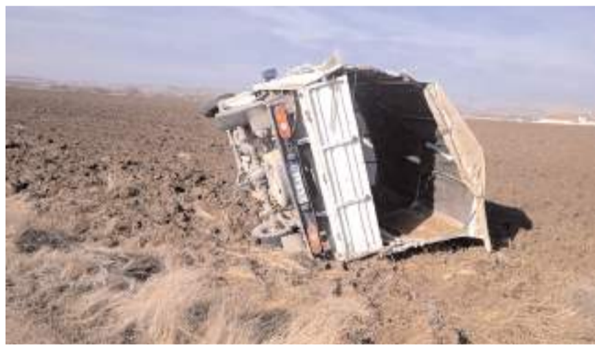
Kaza Çal köyü yolunda meydana geldi.