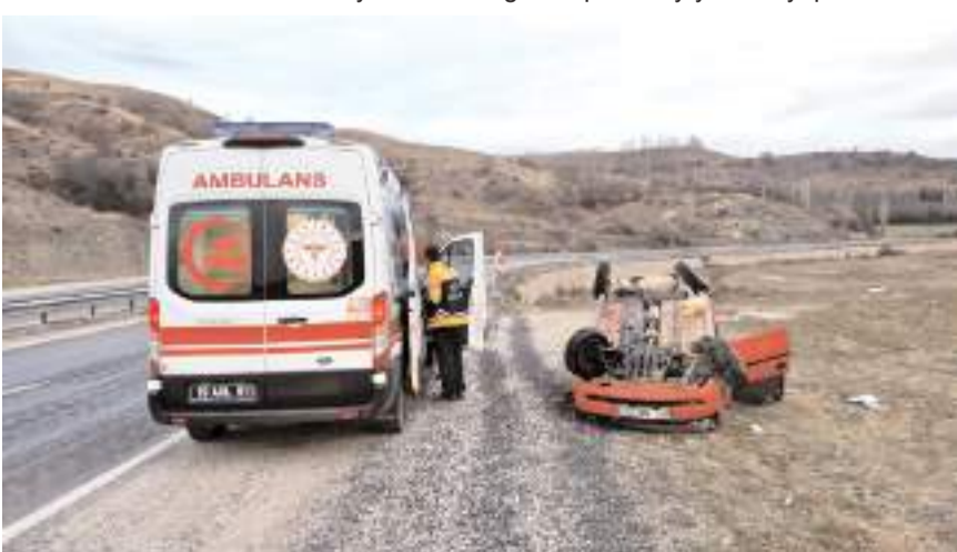
Yaralılar hastanede tedavi altına alındı.

Alaca'da tarlaya uçan otomobildeki 2'si çocuk 3 kişi yaralandı.