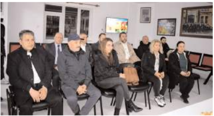
Ziyarette ADD üyeleri de hazır bulundu.