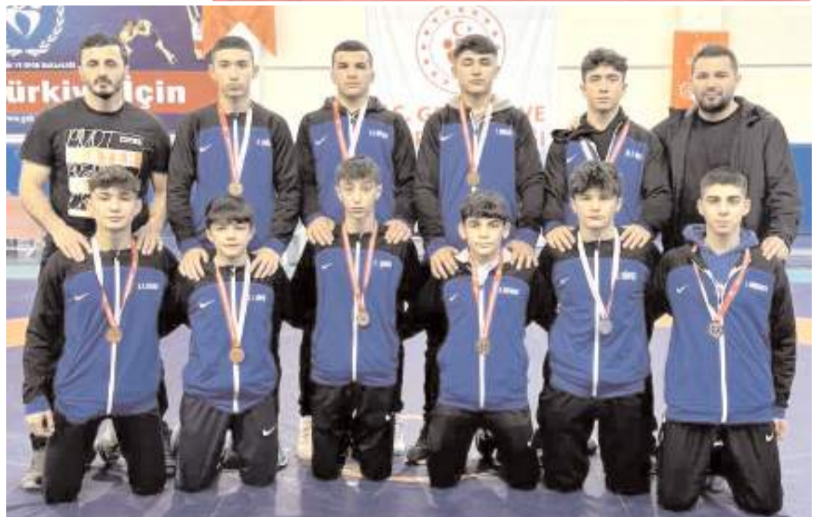
U 17 güreş il birinciliğinde Milli Eğitimspor kulübü sporcuları Türkiye Şampiyonası vizesi almayı başardılar