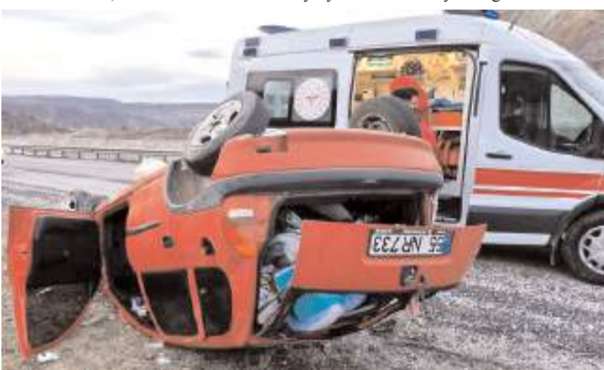
Yarılılara ilk müdahaleyi 112 acil sağlık ekipleri olay yerinde yaptı.