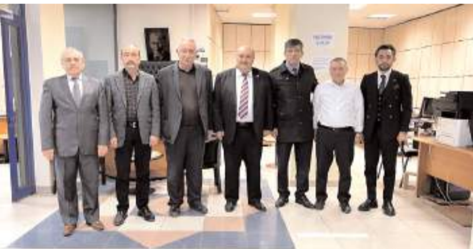
İYİ Parti heyeti, Çorum Esnaf ve Sanatkarlar Kredi Kefalet Kooperatifi Yönetim Kurulunu ziyaret etti.