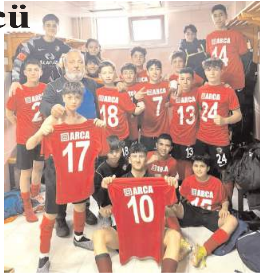
Çorum FK U 14 takımı Keçiöregücü galibiyeti sonrası soyunma odasında