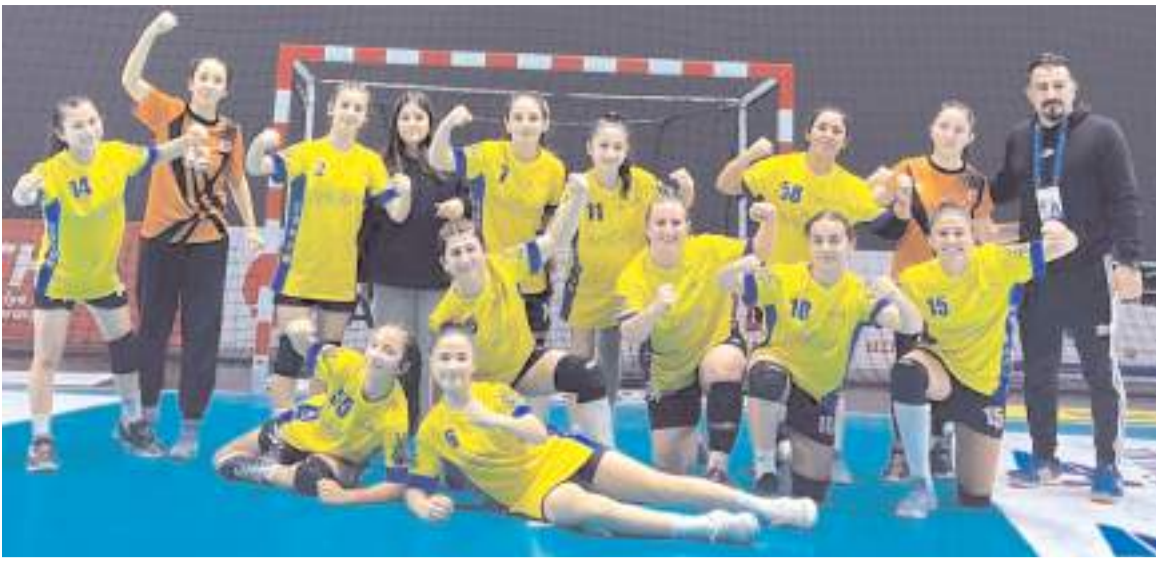
Çorum Gençlikspor kız hentbol takımı Ankara deplasmanında sezonu galibiyet ile tamamladı