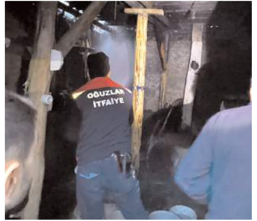
İtfaiye ekipleri yangını büyümeden söndürdü.

Dodurga ve Oğuzlar belediyelerine bağlı itfaiye ekiplerince söndürülen yangın nedeniyle evde hasar meydana geldi.(AA)