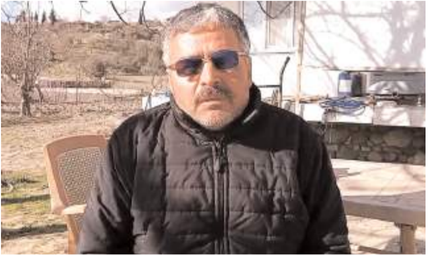
Mağdur çiftçi Bünyemin Y, yaşadıklarını anlattı.