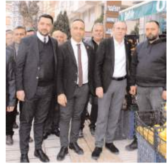
CHP Çorum Belediye Başkan Adayı Levent Çöphüseyinoğlu