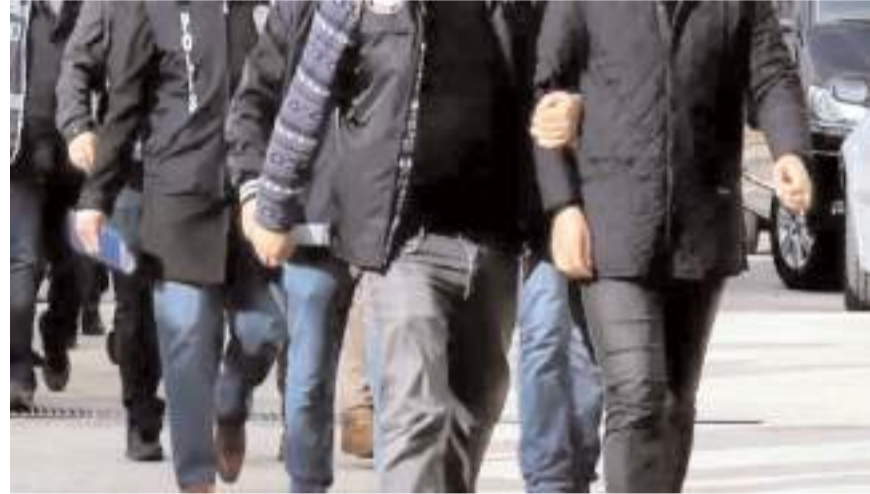
74 ilde yapılan operasyonda 26 uzun namlulu tüfek, 164 ruhsatsız av tüfeği olmak üzere toplam 998 silah ele geçirildi.

Operasyonları gerçekleştiren Kahraman Jandarmamız ve Kahraman Emniyetimizi tebrik ediyorum." (İHA)