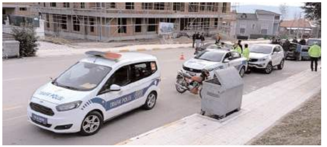
Emniyet ekipleri çok uygulamalara devam ediyor.

Kazayla ilgili başlatılan soruşturmanın devam ettiği bildirildi. (İHA)