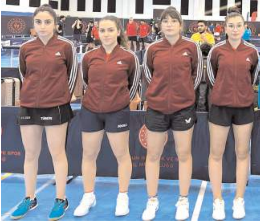
Çorum Spor İhtisas bayan takımı set averajı ile final grubuna yükselme şansı kaçırdı

12. sırada tamamlayan Çorum Belediyespor kadın takımında klasmanda ligde kalma mücadelesi verecek.