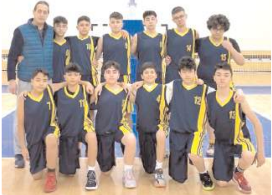
23 Nisan Ortaokulu Sinop grubunda ilk maçından galibiyet ile ayrıldı

Çorum şampiyonu 23 Nisan Ortaokulu erkek takımı grupta ikinci maçında bugün saat 12'de Samsun Boğaziçi Ortaokulu son maçında ise yarın saat 10'da Ankara Özel Tefvik Fikret Ortaokulu ile karşılaşacak. Gruplarında birinci olan takımlar direk yarı final grubuna yükselecek. Gruplarında ikinci olan takımlar perşembe günü oynayacakları maçı kazanan takımda yarı final grubuna yükselecek.