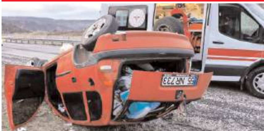
Yarılıra ilk müdahaleyi 112 acil sağlık ekipleri olay yerinde yaptı.

■ Alaca'da takla atarak tarlaya uçan otomobildeki 2'si çocuk 3 kişi yaralandı.