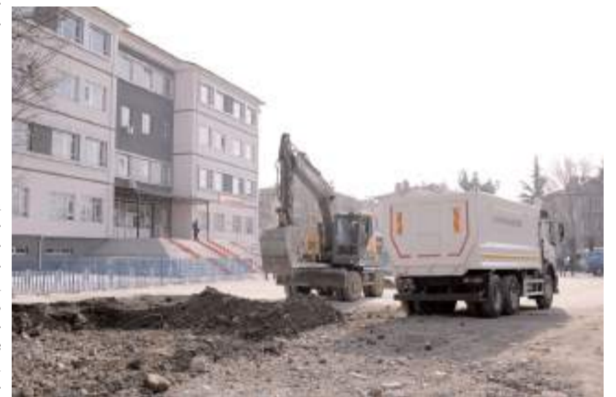
Çalışmalar kapsamında okul bahçesinde park yapılacak.

çirkin görüntünün ortadan kaldırılması hem de atıl durumdaki alanın tekrar kullanıma kazandırılması amacıyla bir çalışma başlattık. Okul binasının hemen öndeki bölüme öğrencilerimiz spor yapabileceği, basketbol ve voleybol sahalılarının olduğu, teneffüslerde dinlenebilecekleri alanlar oluşturacağız. Eski okul binasının bulunduğu yol kenarındaki bölümü ise mahalle sakinlerinin kullanımına sunacağız. Okuldan bağımsız ayrı giriş kapısının bulunacağı bu bölüm ise yürüyüş yolları, dinlenme alanları, kamelyalar, oyun guruplarının yer alacağı millet bahçesi tarzında bir alan haline gelecek. Ekiplerimiz bugün itibarıyla çalışmalara başladı. En kısa sürede mahallemize yakışır bir projeyi daha tamamlayarak halkımızın hizmetine sunmuş olacağız" dedi. (Haber Merkezi)