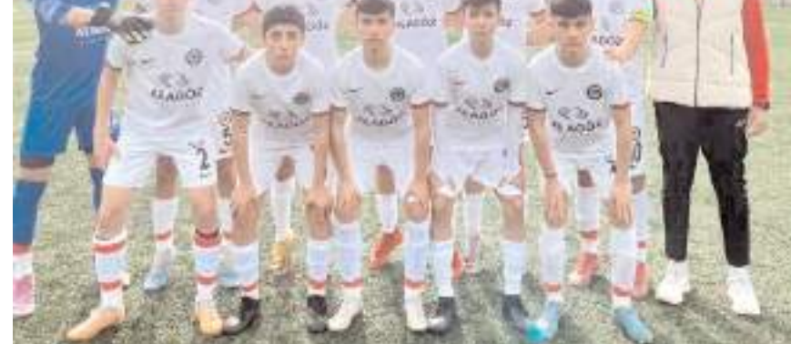
U 15 takımı evinde Keçiöregücü karşısında galibiyeti koruyamadı bir puanla ayrıldı

GOLLER: 44. dak. Enis (Ahlatcı Çorum FK), 65. dak. Tayfun Ege (Keçiöregücü).