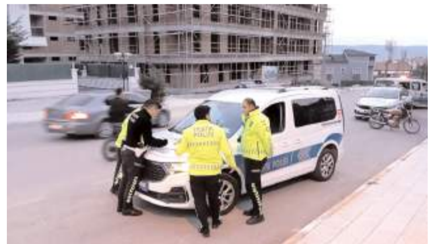
Olay Üçtutlar Mahallesi Binevler 3. Cadde'de meydana geldi.