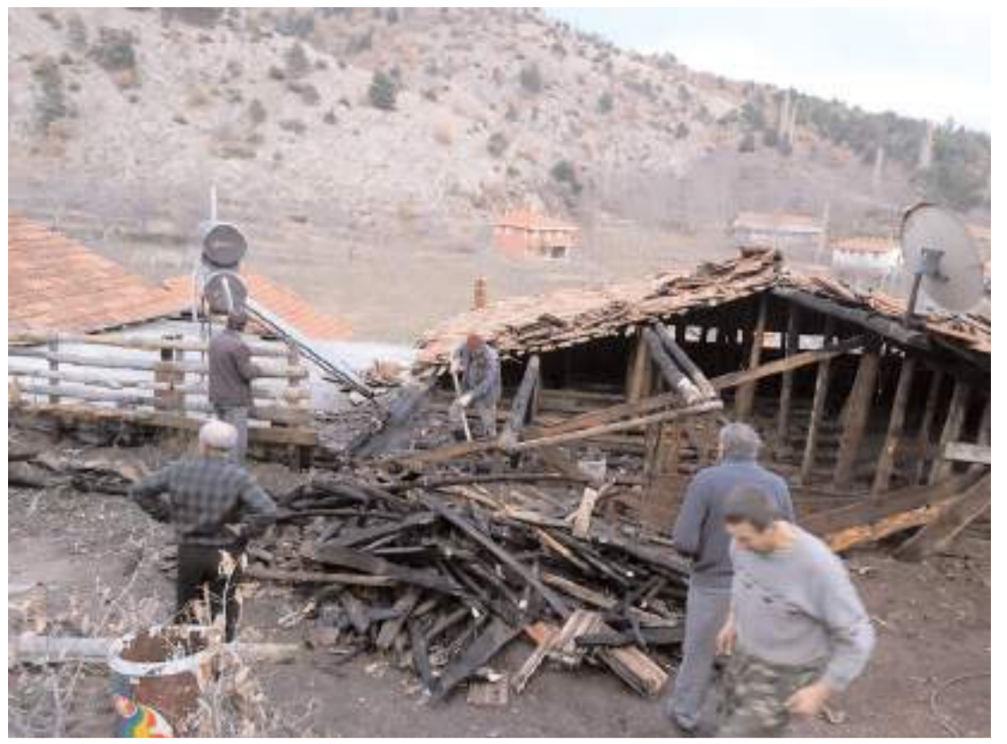
Olay Dodurga'nın Dikenli köyü Soğukeşme Mahallesi'nde meydana geldi.