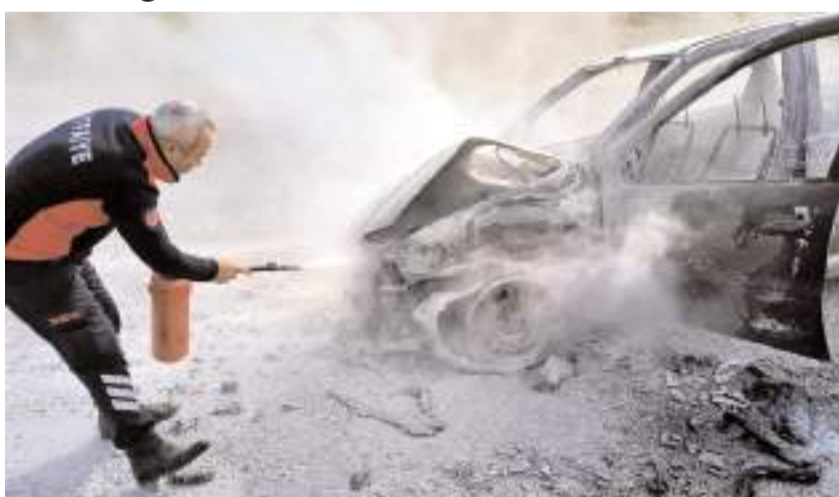
Olay Aşağıfındıklı köyü yolunda meydana geldi.

Sungurlu'da seyir halinde alev alan otomobil kule döndü.