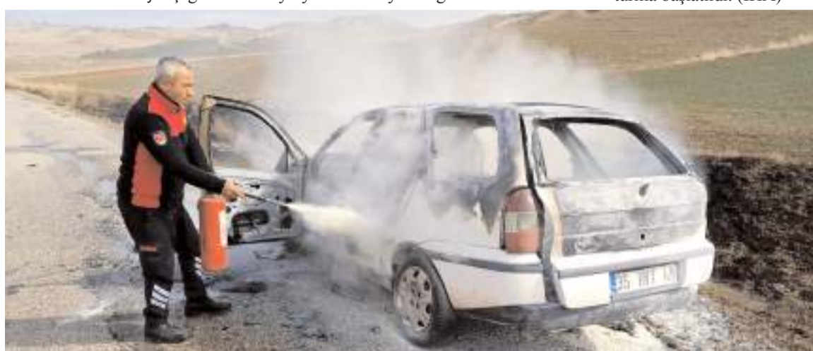
Yangını itfaiye ekipleri söndürdü.