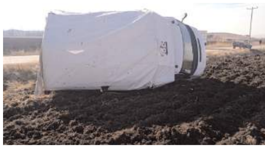
Kazada kamyonette maddi hasar meydana geldi.