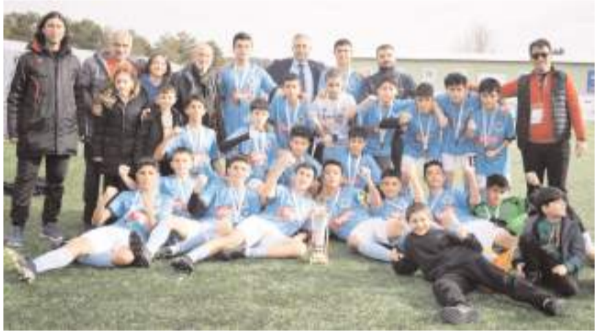
HE Kültürspor takımı final grubunu namağlup tamamlayarak şampiyonluk kupasının sahibi oldu. Kültürspor takımı kupa töreni sonrasında toplu halde