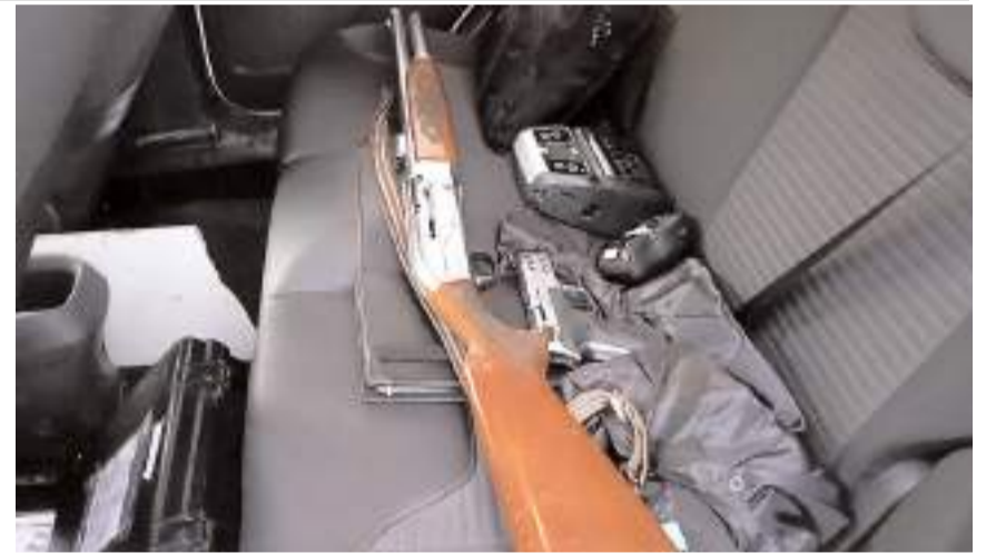
Araçta yapılan aramada 1 adet ruhsatsız av tüfeği ve 1 adet tabanca ele geçirildi.

Edinilen bilgiye göre, Üçtutlar Mahallesi Binevler 3. Cadde'de şok uygulama yapan Çorum İl Emniyet Müdürlüğü Trafik Şube Müdürlüğü ekipleri, şüphe üzerine durdurdukları bir araçta arama yaptı. Yapılan aramada 1 adet ruhsatsız av tüfeği ve 1 adet tabanca ele geçirildi. Araç sürücüsü ifadesi alınmak üzere polis merkezine götürülürken, yapılan uygulamada 51 araç sorgulandı. Kurallara uymayan sürücülere toplam 32 bin 663 TL idari para cezası uygulandı. (İHA)