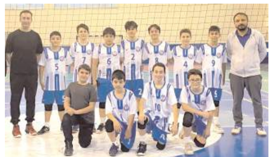
23 Nisan voleybol takımı grupta ilk maçını rahat kazanarak iyi bir başlangıç yaptı