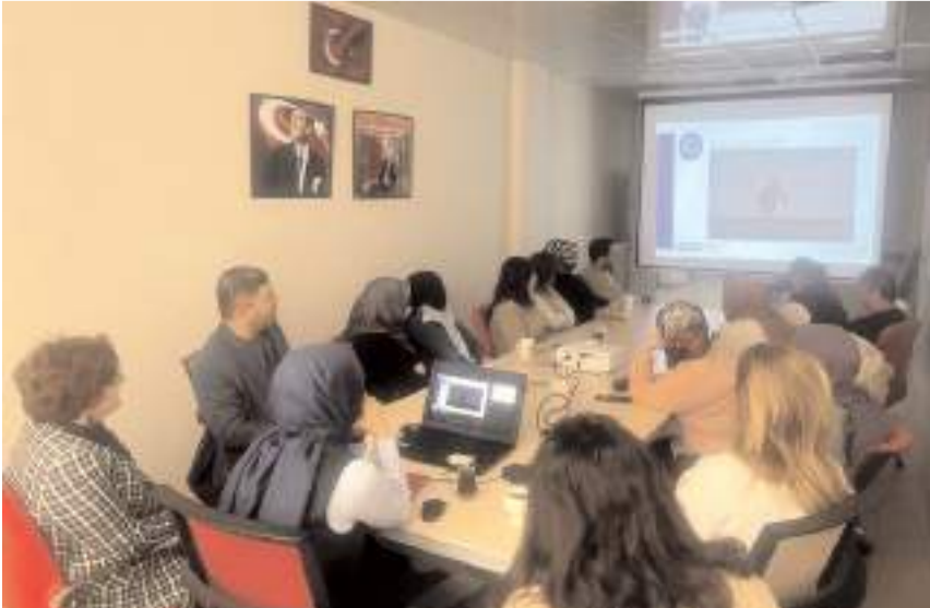
Etkinlikte uyuşturucu maddelerin zararları kapsamlı şekilde anlatıldı.

Sungurlu Aile Destek Merkezinde kursiyerler ile sosyal hizmet merkezi personeline madde bağımlılığı eğitimi verildi.