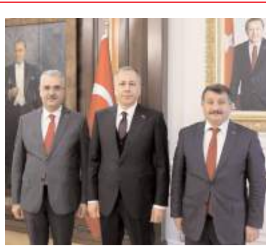
AK Parti Çorum Milletvekili Av. Yusuf Ahlatcı beraberinde AK Parti İl Başkanı Av. Murat Günay ile birlikte İçişleri Bakanı Ali Yerlikaya'yı ziyaret etti.