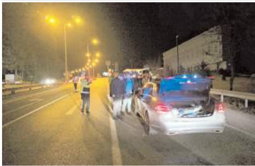
Kaçan otomobil Çorum-Samsun kara yolu Bölge Trafik Denetleme Şube Müdürlüğü önünde durduruldu.

Çorum'da trafik polislerinden kaçan sürücüye para cezası uygulandı.