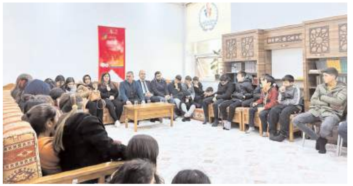
Osmancık Gençlik Merkezi'nde yapılan etkinliklere gençlerin ilgisi yüksek oluyor.

Gelgör, "Kızılırmak'ın kenarında, Osmancık Kalesi ve Koyunbaba Köprüsü ile birlikte şehrin vitrinini oluşturan, yeşil dokusuyla şehrimizin güzelliğini yansıtan bir alan. Bu alana Ata'mızın ismini vererek güzel bir hizmeti taçlandırmış olduk." dedi.(AA)