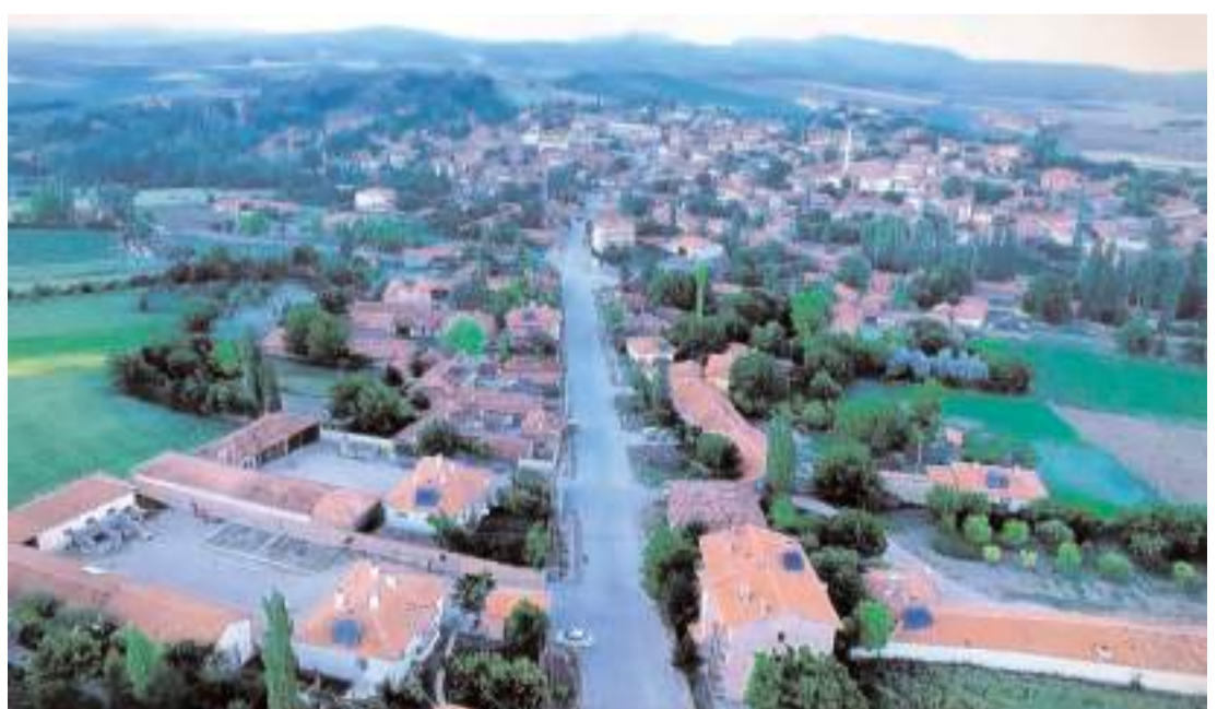
Konaklı'nın belediye statüsü nüfusunun azalması nedeniyle 2013 yılında sona ermişti.

EN AZ NÜFUS BALIYAKUP KÖYÜ Çorum merkeze bağlı en az nüfusa sahip köyü ise 19 kişi ile Bahiyakup köyü oldu. Köyde 12 erkek, 7 kadın yaşıyor.