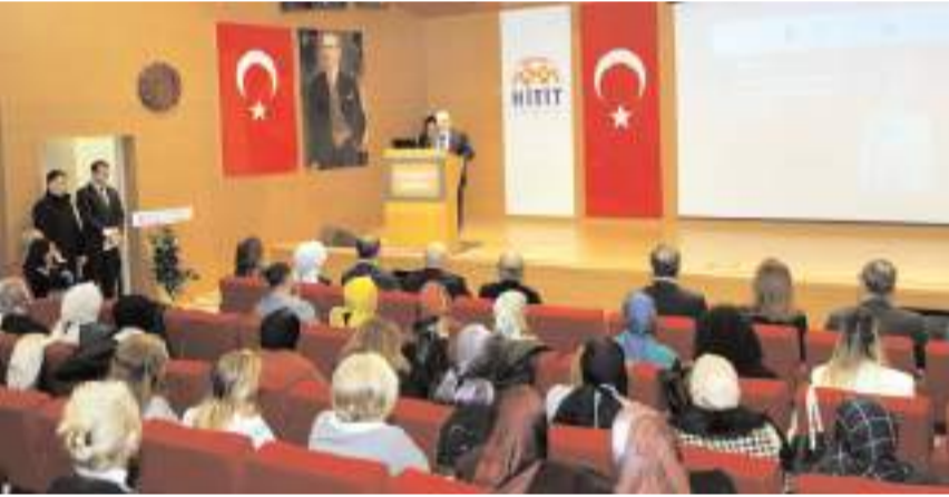
Çalıştayın ilki 2017 yılında yapılmıştı.