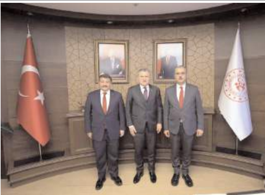
AK Parti Çorum Milletvekili Av. Yusuf Ahlatcı beraberinde AK Parti İl Başkanı Av. Murat Günay ile birlikte Gençlik ve Spor Bakanı Osman Aşık Bak'ı ziyaret etti.

AK Parti Çorum Milletvekili Av. Yusuf Ahlatcı, Gençlik ve Spor Bakanı Osman Aşık Bak'ı ziyaret ederek şehrin taleplerini iletti.