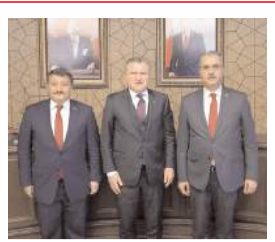
AK Parti Çorum Milletvekili Av. Yusuf Ahlatcı beraberinde AK Parti İl Başkanı Av. Murat Günay ile birlikte Gençlik ve Spor Bakanı Osman Aşık Bak'ı ziyaret etti.