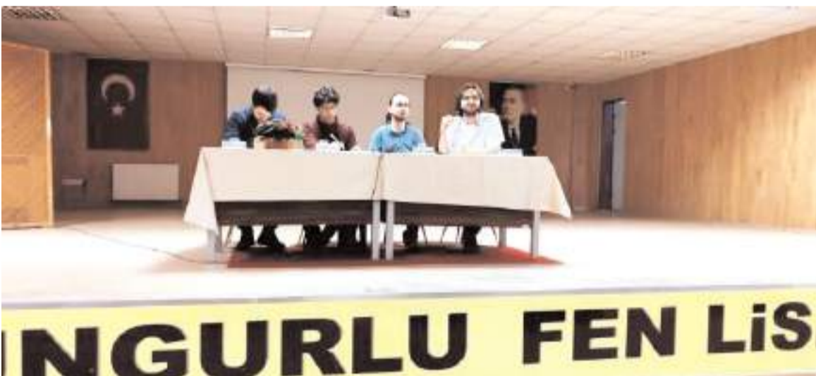
Üniversite öğrencileri üniversiteye hazırlanan öğrencilere tavsiyelerde bulundu.

üniversite adayı tüm gençlerimizi bekliyoruz" dedi. (Haber Merkezi)