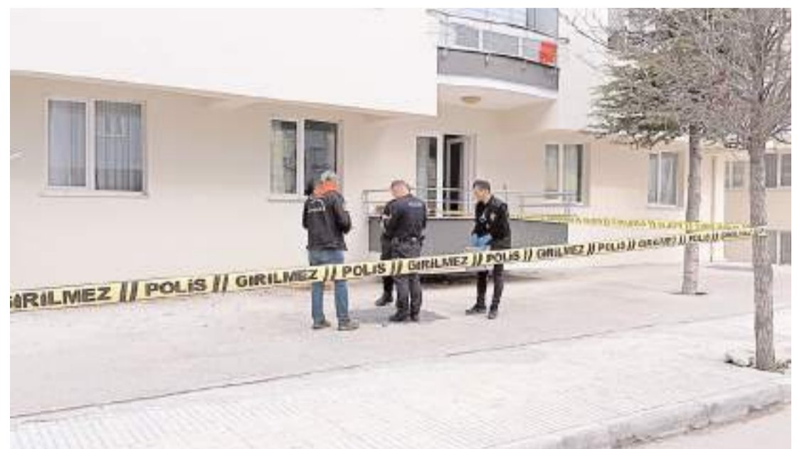
Olay, Üçtutlar Mahallesi Ahçılar 13. Sokak'ta meydana geldi.

Kazayla ilgili soruşturma başlatıldı.