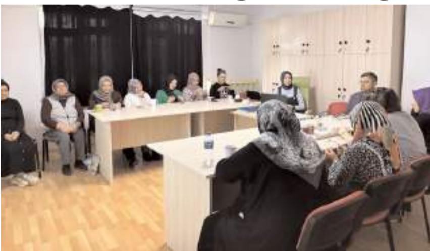
Eğitime, Aile Destek Merkezindeki kursiyer ve sosyal hizmet merkezi personeller katıldı.