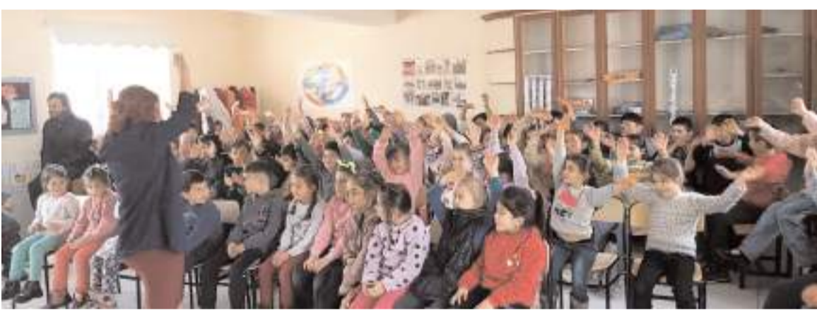
Öğrenciler şenlikte neşeli dakikalar geçirdiler.