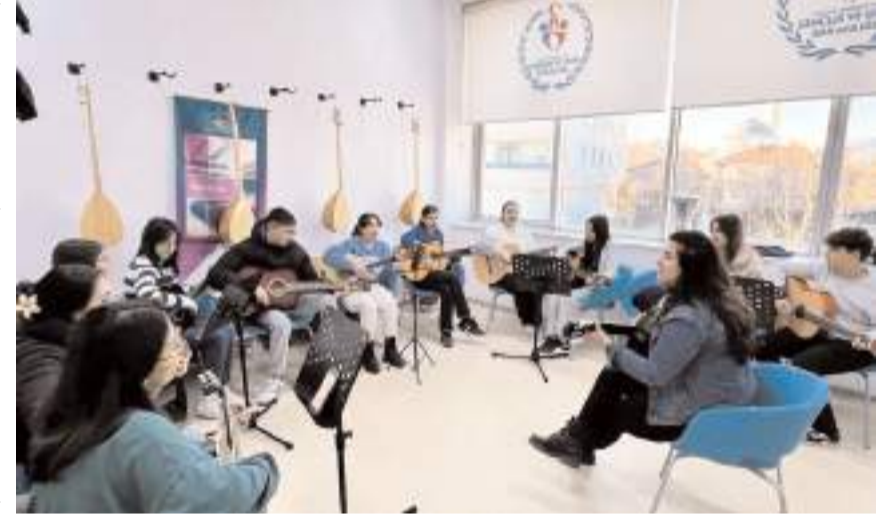
Merkezde müzik kursları da veriliyor.