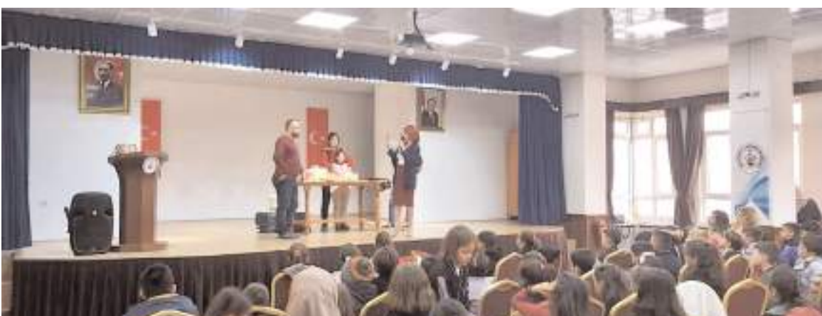
Şenlik İskilip Öğretmenevi ve Akşam Sanat Okulu Konferans Salonu'nda yapıldı.

Etkinliğin çocukların bilimle tanışması ve öğrenme duygusunun gelişmesine katkı sağlamak amacıyla yapıldığı belirtildi.(AA)