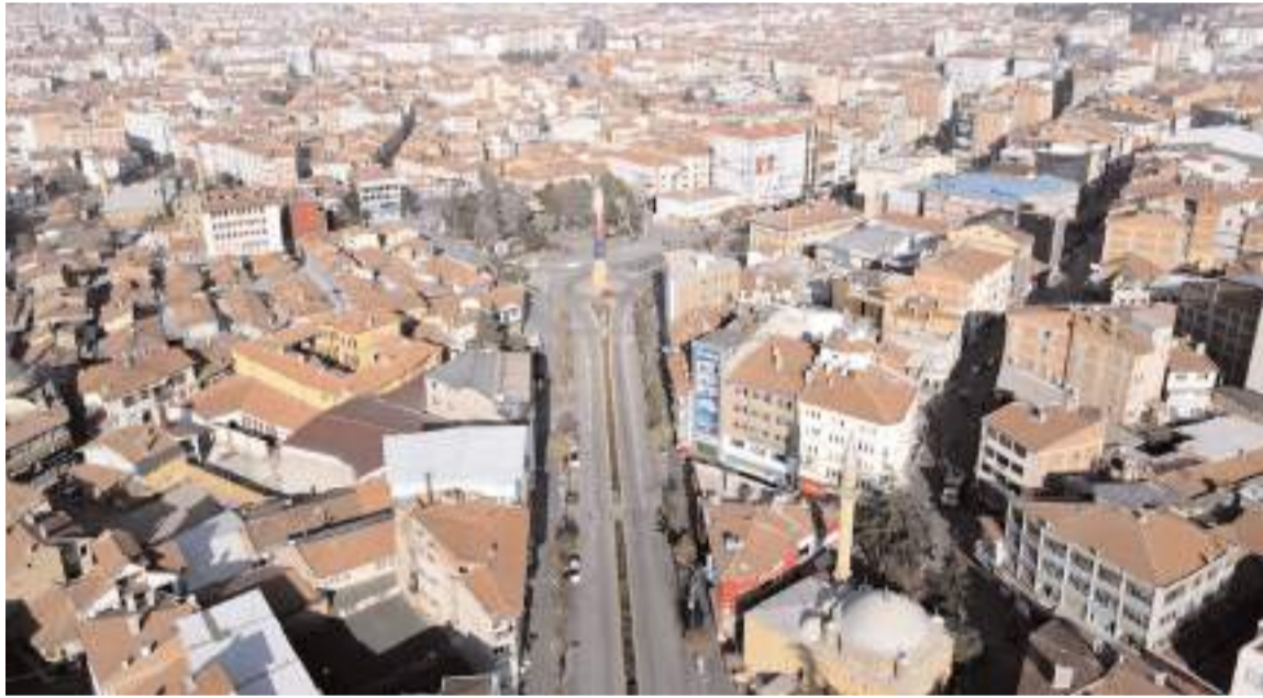
Çorum'un en büyük mahallesi 59 bin 943 ile yine Ulukavak Mahallesi oldu.