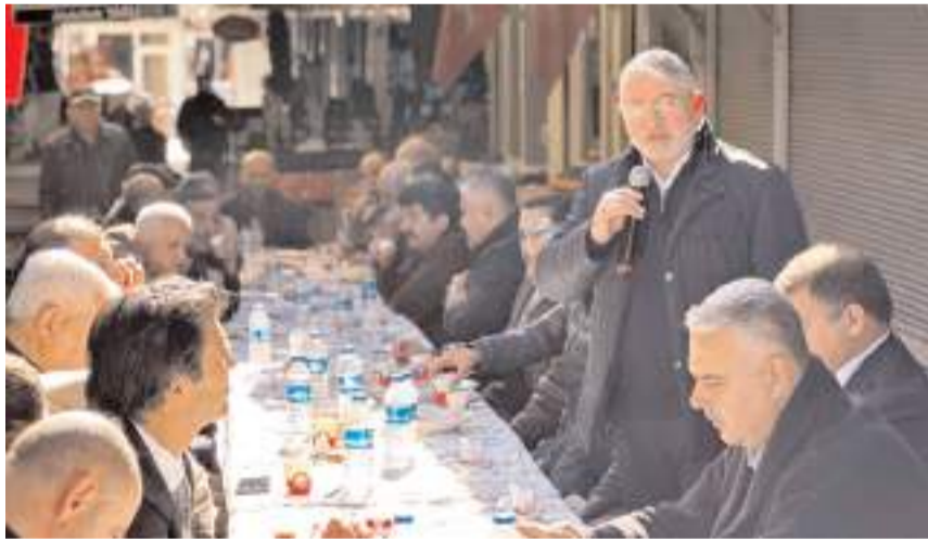
Başkan Aşgın, arasta esnafıyla bir araya geldi.

■ Çorum Belediyesi, Çöplü Arastası'nda 3. ve 4. etap cephe sağıklaştırma çalışmaları için hazırlıklara başladı. Belediye Başkanı Dr. Halil İbrahim Aşgın, ilk iki etabin ardından arastanın kalan kısımlarında da yenileme çalışmaları yapacaklarını açıkladı.