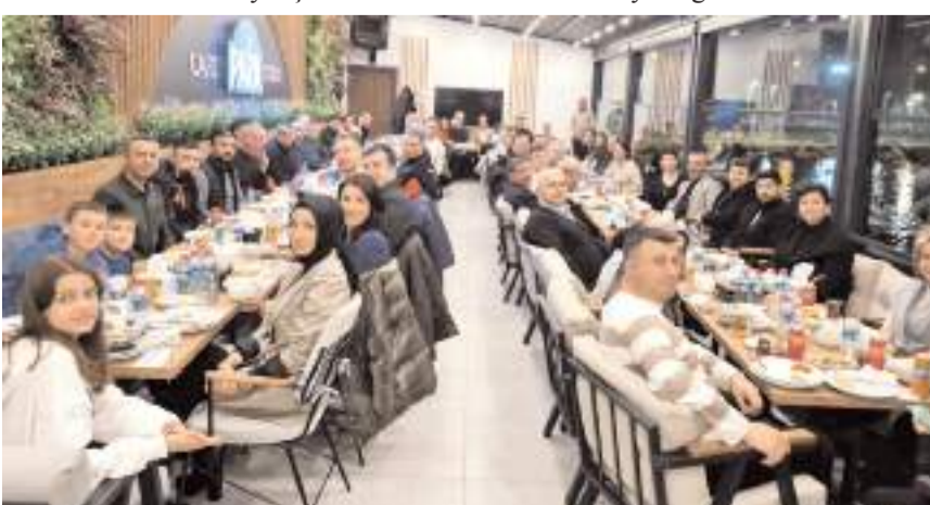
Veda programına katılım yüksek oldu.