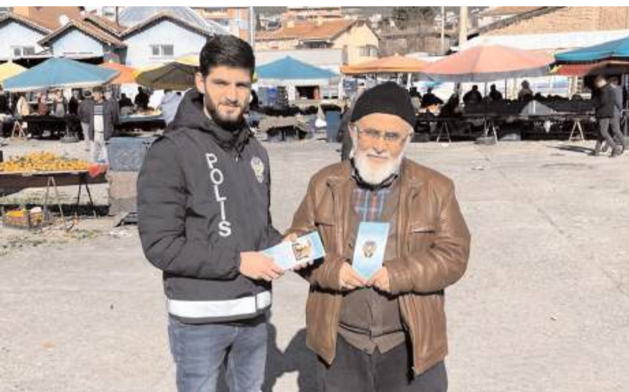
Emniyet birimleri, semt pazarında vatandaşlara dolandırıcılık yöntemleri hakkında bilgi içeren el ilanı dağıttı.