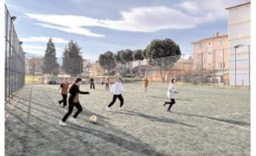
Merkezde öğrenciler rahat bir ortamda ders çalışma, kitap okuma ve spor yapma imkanı buluyorlar.