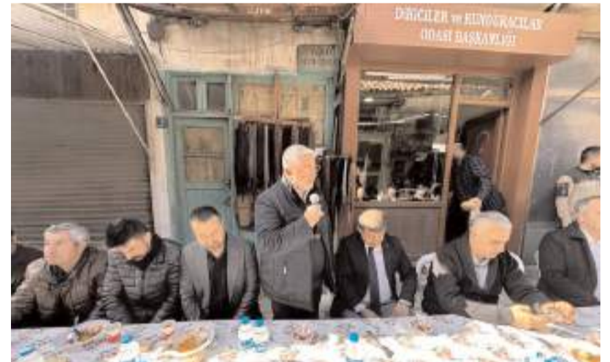
Başkan Aşgın, arasta ile ilgili yaptıkları çalışmalar hakkında açıklamalarda bulundu.