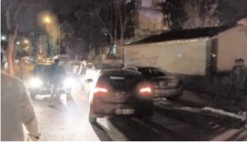
Araç Ulukavak Mahallesi Atalay 1. Caddede park halindeki bir araca çarparak durdu.

■ Çorum'da polis ekiplerinin 'dur' ihtarına uymayarak araçla kaçmaya çalışan şahıslar, uzun süren kovalamacının ardından kaza yapınca yakalandı.