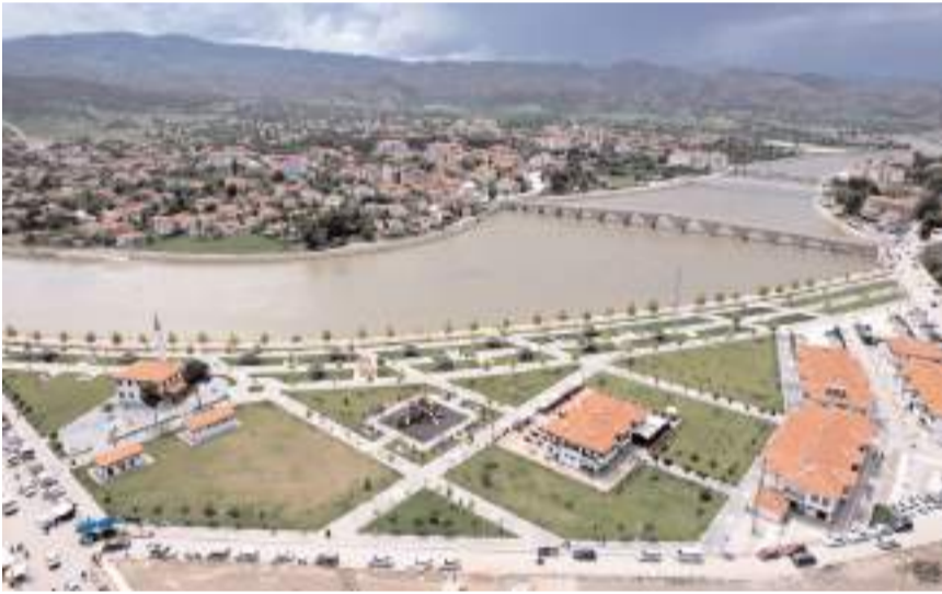
Osmancık Millet Bahçesi Kızılırmak'ın kenarına yapıldı.