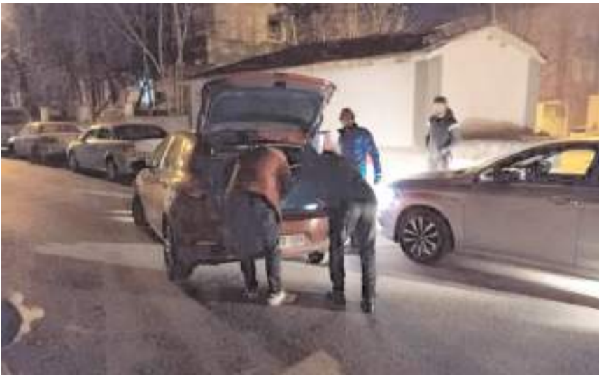
Polis ekipleri araçta arama yaptı.