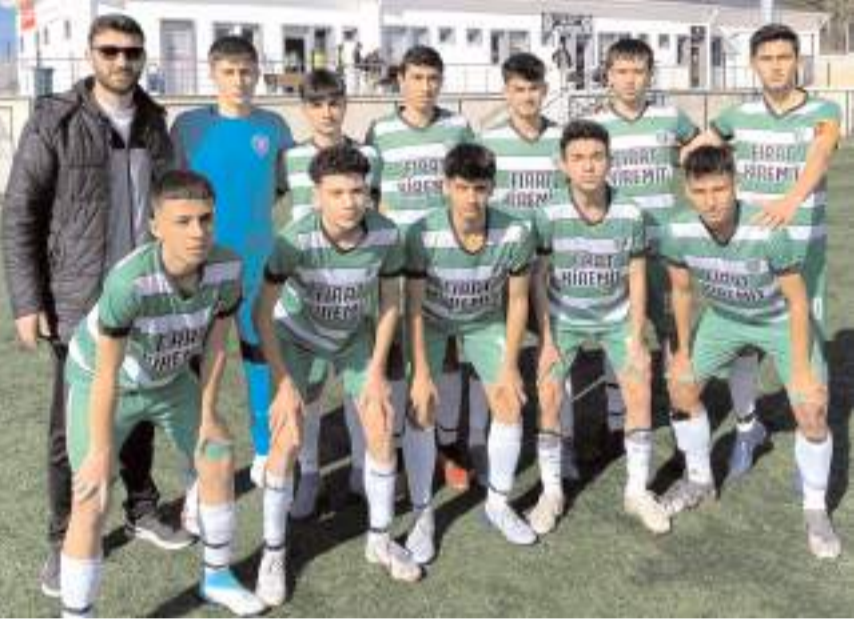
Mimar Sinan U 16 takımı ilk maçını farklı kazanarak ilk haftanın lideri oldu