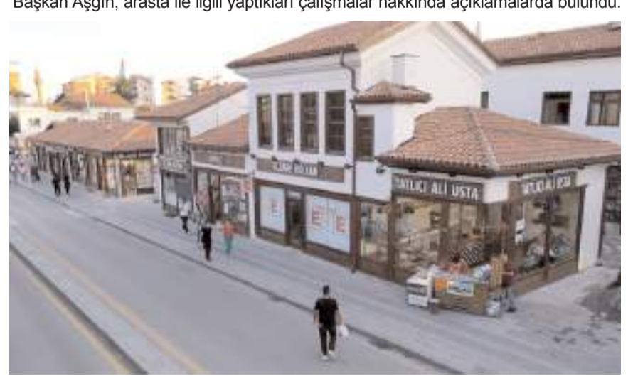
Proje kapsamında ilk olarak Saat Kulesine bakan cepheler yenilendi.