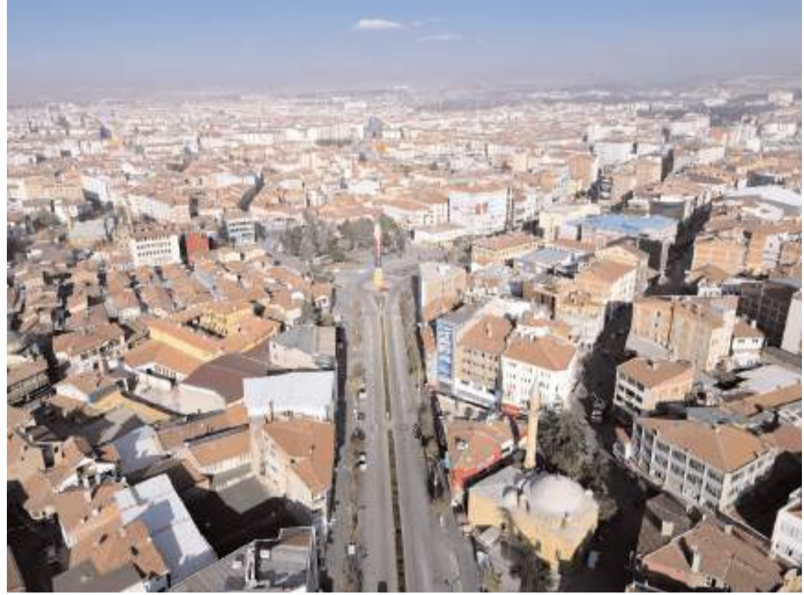
Çorum'un en büyük mahallesi 59 bin 943 ile yine Ulukavak Mahallesi oldu.

2023 yılı sonu itibarıyla Çorum'un en büyük mahallesi olan Ulukavak, Türkiye'nin 6 il ve 191 ilçesinden daha fazla nüfusa sahip. Ulukavak Mahallesi 32 bin 65 mahalle bulunan Türkiye genelinde ilk 50 mahalle arasında yer aldı. Çorum'daki bütün ilçe merkezlerinden daha büyük olan Ulukavak Mahallesi, 4 büyük ilçe dışındaki bütün ilçelerin nüfusunun toplamından daha fazla nüfusa sahip. Ulukavak'ı 44 bin 436 ile Bahçelievler, 38 bin 532 ile Gülabibey, 30 bin 130 ile Buharevler, 25 bin 039 ile Üçtutlar, 17 bin 642 ile Kale, 15 bin 107 ile Mimar Sinan, 7 bin 111 ile Akkent, 6 bin 543 ile Yavruturna, 5 bin 631 ile Karakeçili, 3 bin 892 ile Çepni, 2 bin 606 ile Kunduzhan, 1 651 ile Çöplü, 1 212 ile Yeniol ve son olarak 118 nüfusu ile Bayat izledi.