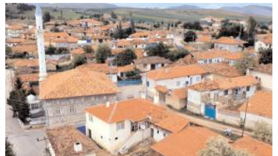
Konaklı köyünün 613 nüfusu bulunuyor.

Köyün adı, 1928 yılı kayıtlarında Ferzend, 1946 yılı kayıtlarında ise Farzant olarak geçmektedir. Daha önceleri Mecitözü ilçesine bağlıyken, 10 Temmuz 1970'te Çorum merkez ilçeye bağlandı. 30 Aralık 1998 tarihinde beledi-