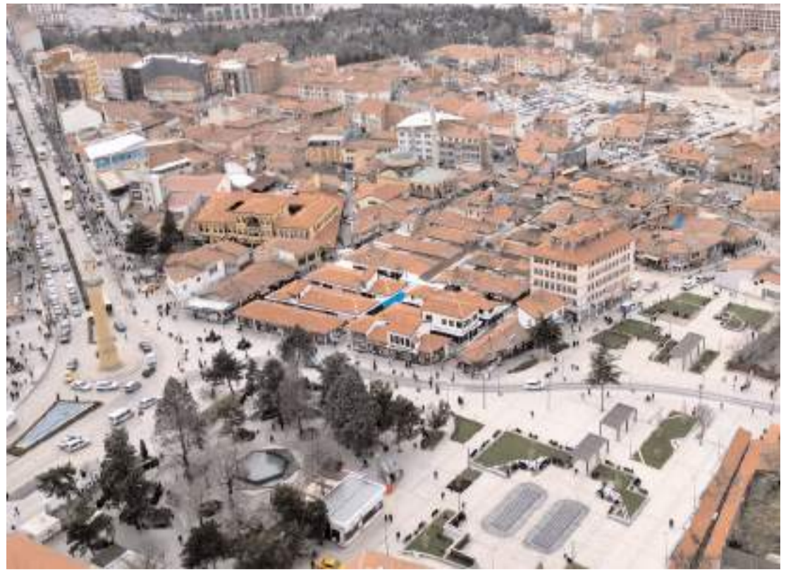
Tarihi Çöplü Arastasında birinci ve ikinci etap dahilinde 4 adada yenileme çalışmalarını tamamladı.