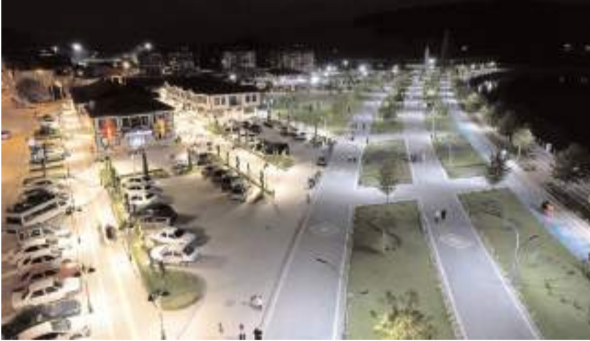
Millet Bahçesi 35 bin metrekare alana sahip.