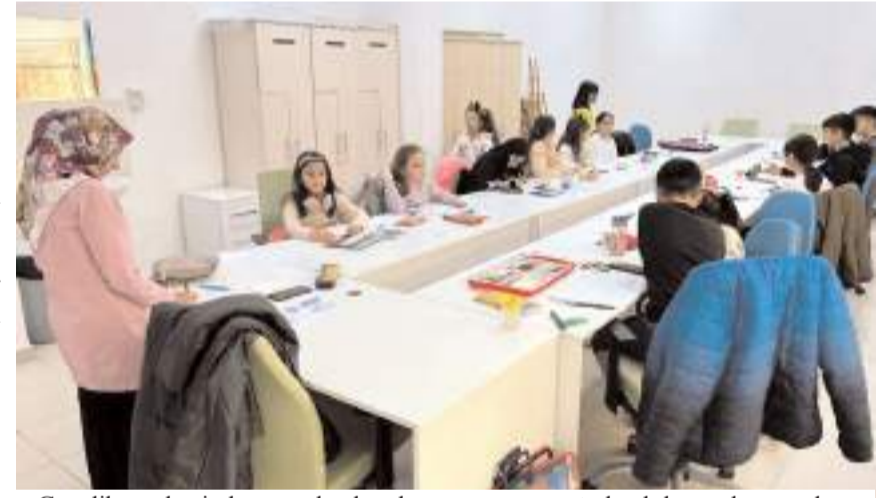
Gençlik merkezi, devam eden kursların yanı sıra matrik, akıl ve zeka oyunları, masa tenisi, bilardo, satranç ve daha bir çok aktivitelerle hizmet veriyor.