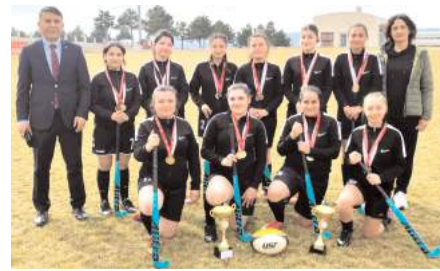
Bahçelievler Mesleki ve Teknik Anadolu Lisesi Çim Hokeyi takımı kupası ile birlikte

Dün Ragbi il birinciliğinde oynanan maçın ardından düzenlenen törenle Bahçelievler Mesleki ve Teknik Anadolu Lisesi hem ragbide hem çim hokeyinde çifte şampiyonluk kupasının sahibi oldu.