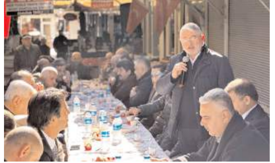
Başkan Aşgın, arasta esnafıyla bir araya geldi.