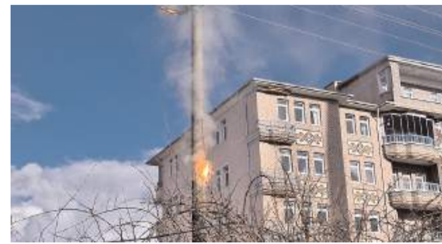
Kısa devre nedeniyle duyulan patlama sesleri ve alevler çevrede paniğe neden oldu.