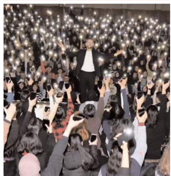
Seminere ilgi yüksek oldu.

■ TÜİK rakamlarına göre geçen ay konut satış rakamları bir önceki aya göre neredeyse yarı yarıya azaldı. * HABERİ4'TE