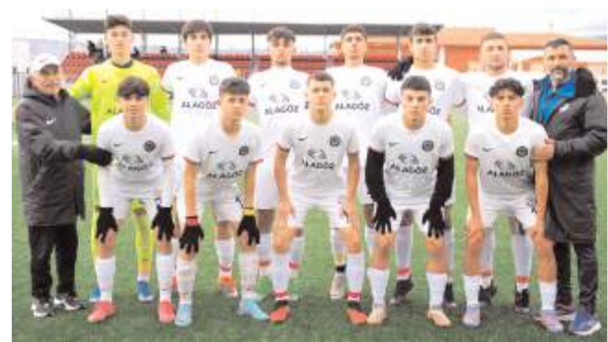
Ahlatcı Çorum FK U 17 takımı bugün Ispartaspor önünde galibiyet arayacak

Bu maçın ardından aynı sahada saat 13'de ise takımın U 15 kadroları mücadele edecekler. Bu kategoride ev sahibi Boluspor 11 puanla dördüncü sırada yer alırken Çorum FK ise 5 puanla altıncı sırada bulunuyor. Bu maçı ise Ali Semer, İsmail Ali Küçük ve Mehmet Ali Torun hakem üçlüsü yönetecek.