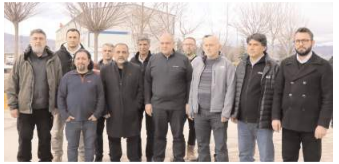
Bilim insanları toprak kayması meydana gelen alanda inceleme yaptı.