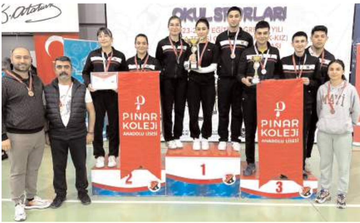
Özel Pınar Koleji bayanlarda Türkiye Şampiyonu erkeklerde ikinci olan takımı ile kupa töreni sonrasında toplu halde

Liseli Gençler Masa Tenisi Türkiye Şampiyonasında Özel Pınar bayan takımı şampiyon, erkeklerde Çorum Spor Lisesi ikinci Özel Pınar Koleji ise üçüncü oldu.