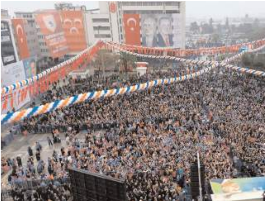
Cumhuriyet Meydanı'nda yapılan mitinge katılım yüksek oldu.