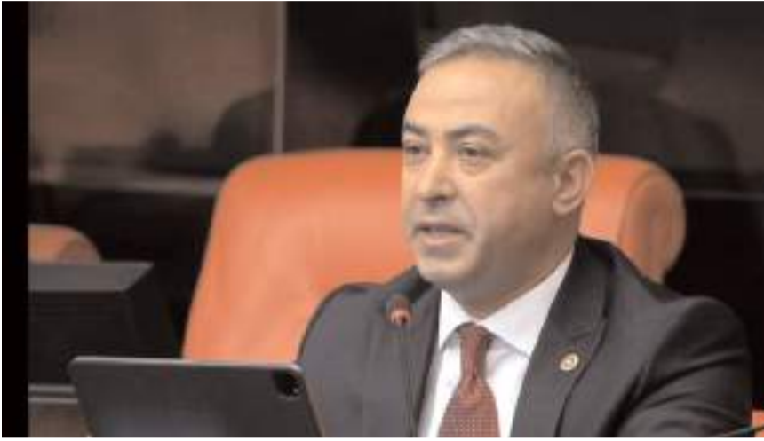
CHP Çorum Milletvekili Mehmet Tahtasız, TBMM'de konuşma yaptı.

met Eroğlu da 22/10/2022 yılında para yatırdı ve kuraya katıldı. "Asil olarak hak sahibi olduk. Asil Kura Sıra No: 145" Hemşehrim ve kurada ismi çıkanlar büyük bir sevinç yaşadılar ancak AKP iktidarının boş vaatleri nedeniyle sevinçleri kursaklarında kaldı. Yıl 2024, ortada ne ev var ne de arsa. Türkiye'de olduğu gibi Çorum'da da emekli, dul, yetim, şehit ve gaziler için "İlk Evim Arsa" kampanyası için 13 bin arsanın kurası çekildi. 1 kişi dahi arsasını teslim alamadı. TOKİ sosyal konut projesinde kuradan çıkan tüm halkımız gibi Çorumlu hemşehrimiz de kandırıldı ve hüsrana uğradı. Oy uğruna her seçim öncesi insanlarımızın hayalleriyle kim oynar. Verdiği sözleri kim tutmaz? AKP." (Haber Merkezi)