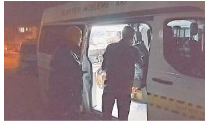
Polis ekipleri olay yerinde inceleme yaptı.

Çorum'da komşuları tarafından uzun süredir haber alınmayan 87 yaşındaki adam evinde ölü bulundu.