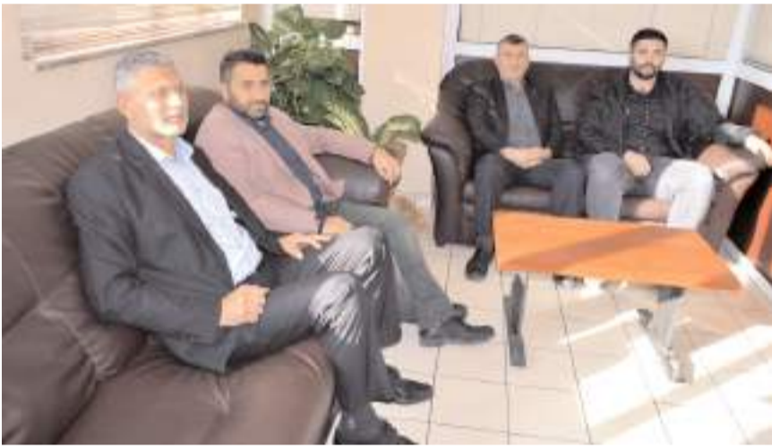
Ziyarete partililerde katıldı.