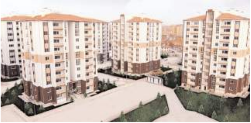
Ocak ayında konut satışları bir önceki aya göre yüzde 50 oranında azaldı.

2023 yılı Aralık ayında ise Çorum'da 829 konut satılmıştı.