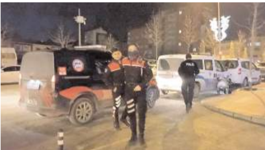
Polis ekipleri olay yerinde inceleme yaptı.