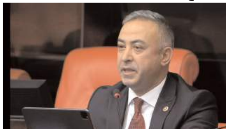
CHP Çorum Milletvekili Mehmet Tahtasız, TBMM'de konuşma yaptı.

■ Cumhuriyet Halk Partisi (CHP) Çorum Milletvekili Mehmet Tahtasız, TOKİ ilk evim ve ilk evim arsa projesine başvuruların sorunlarını TBMM gündemine getirdi. * HABERİ6'DA