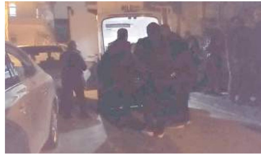
Yaşlı adamın cenazesi Hitit Üniversitesi Erol Olçok Eğitim ve Araştırma Hastanesi morguna kaldırıldı.