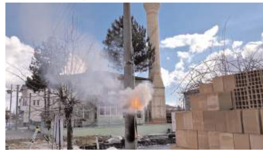
Olay Denizhan Mahallesi, Yozgat Caddesinde meydana geldi.

Elektrik direğinde yangının başlaması ile yapılan ihbara hızlı bir şekilde müdahale eden ekipler muhtemel bir faciayı önlemiş oldu. Ekipler tarafından direk ve panonun yenilenmesi için bakım ve onarım çalışması başlatıldı. (İHA)