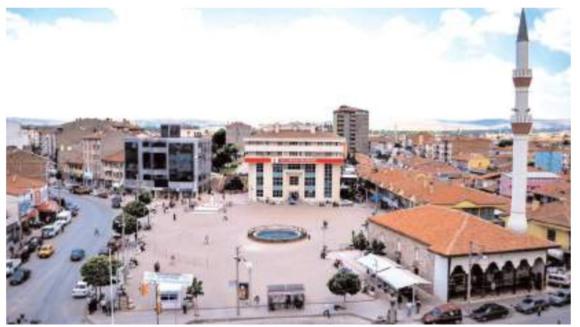
Alaca'nın toplam nüfusu 29 bin 952 olarak açıklandı.