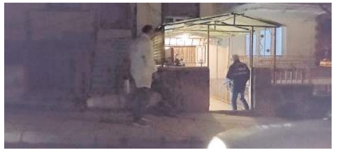
Olay, Gülabibey Mahallesi Beytepe 3. Caddesi'nde meydana geldi.

Olayla ilgili başlatılan soruşturma sürüyor. (İHA)