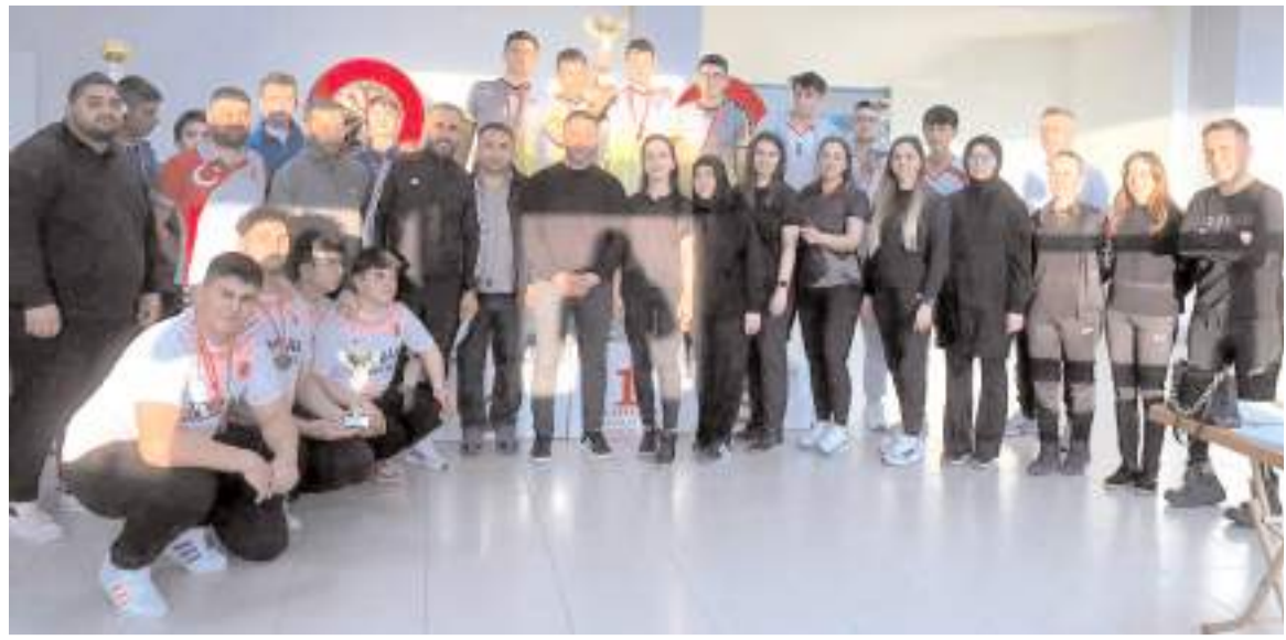
Genç erkekler Dart il birinciliğinde dereceye giren okullar ödül töreni sonunda toplu halde görülüyor