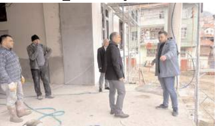
Ebusuud Efendi İlkokulu ve Ortaokulu'nun inşaatı devam ediyor.