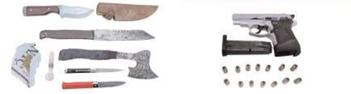
Operasyonlarda çok sayıda kesici ve ateşli silah ele geçirildi.