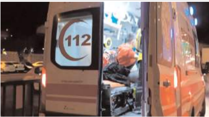
Yaralı şahsa ilk müdahale olay yerinde 112 acil sağlık ekipleri tarafından yapıldı.