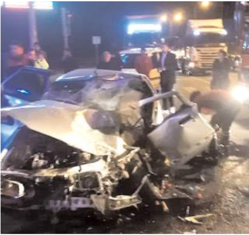
Kaza, Sungurlu-Kırıkkale kara yolu Ocaklı Kavşağı'nda meydana geldi.

Kazayla ilgili soruşturma başlatıldı. (İHA)