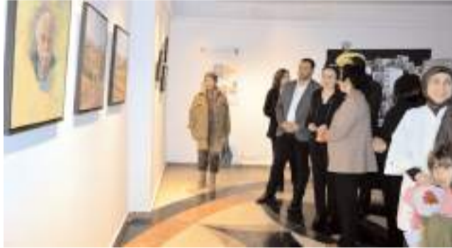
Davetliler sergiyi gezerek eserleri incelediler.

2014 yılında eşiyile birlikte Çorum'a gelerek Baykuş Resim Atölyesi'ni kurdu.