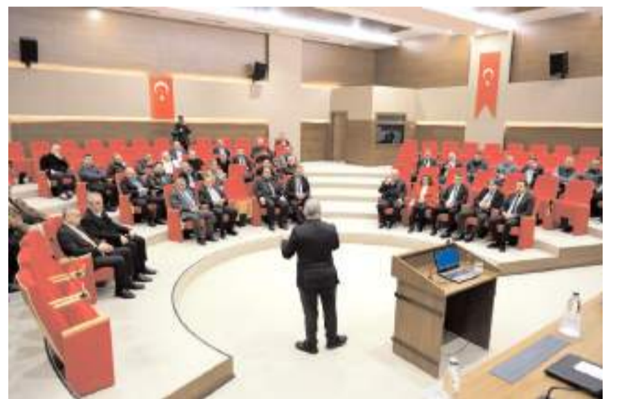
Başkan Aşgın, ziyaretinde projeleri hakkında bilgiler verdi.