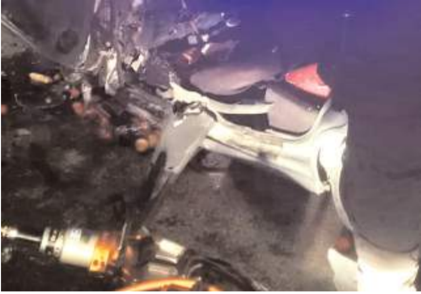
Kazada otomobil hurdaya döndü.