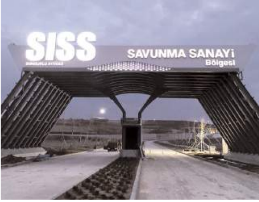
Sungurlu İhtisas Savunma Sanayi Bölgesinin tabelası asıldı.

■ Ankara'da Uzay ve Havacılık İhtisas Sanayi Bölgesi ve Kırıkkale'deki Silah Sanayi Organize Bölgesi'nden sonra Türkiye'nin 3.İhtisas Savunma Sanayi Bölgesi Çorum'da kuruldu.