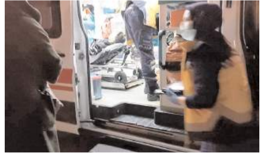
Yaralı gence ilk müdahale 112 acil sağlık ekipleri tarafından olay yerinde yapıldı.