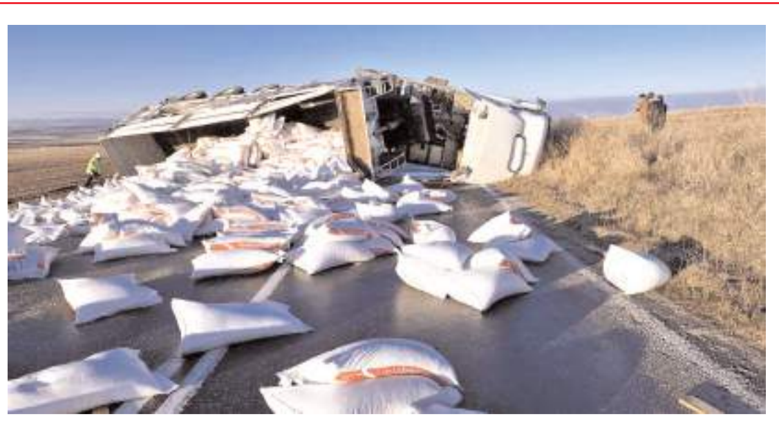
Kaza, Alaca ilçesi Çöplü köyü mevkiinde meydana geldi.