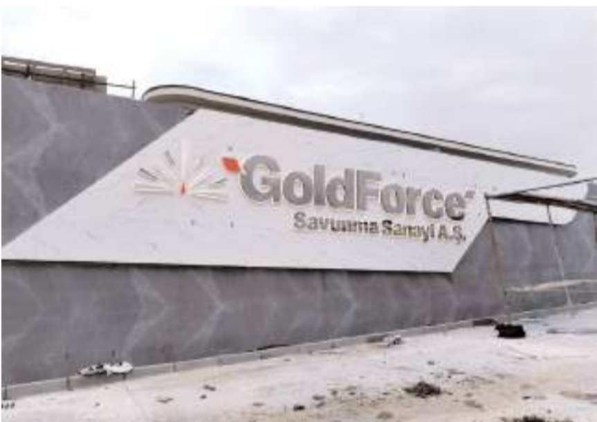
Gold Force Sungurlu Barut Fabrikasının açılışını Cumhurbaşkanı Recep Tayyip Erdoğan yapacak.