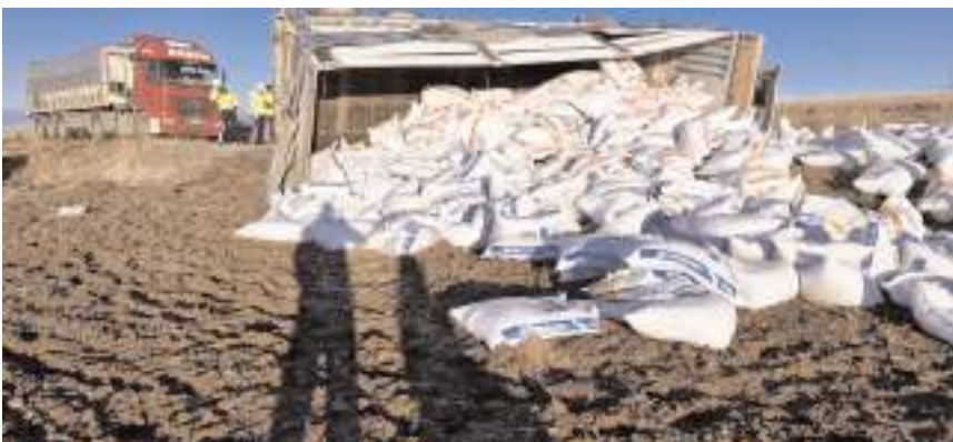
Tırda yüklü olan yem çuvalları etrafa saçıldı.

Alaca'da yem yüklü tırın devrildiği kazada yaralanan sürücü sıkıştığı yerden itfaiye ekipleri tarafından kurtarıldı.