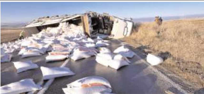
Kaza, Alaca'nın Çöplü köyü mevkiinde meydana geldi.