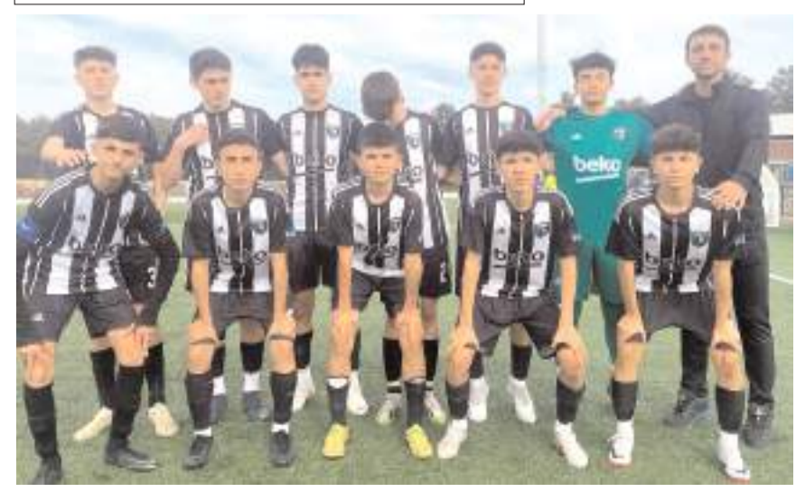
Çorum Anadolu FK ikinci yarının ilk maçını kazanarak liderliğini sürdürmek istiyor

21 Şubat Çarşamba : HE Kültürspor- Çorum Anadolu FK. Hattuşa Gençlikspor-Mimar Sinan Gençlik