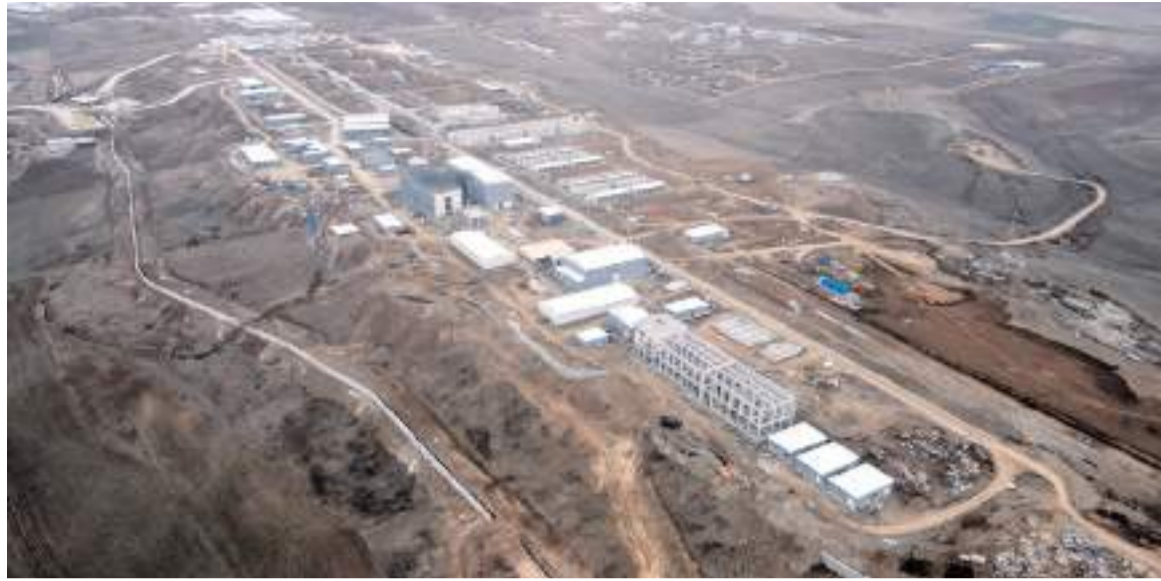
Sungurlu İhtisas Savunma Sanayi Bölgesi çok geniş bir alana inşaa ediliyor.

Organize Sanayi Bölgesinin ihtisas savunma sanayi bölgesi olacak olan bölümünün girişine tabelalar yerleştirilirken, barut fabrikasının da tabelası takıldı.