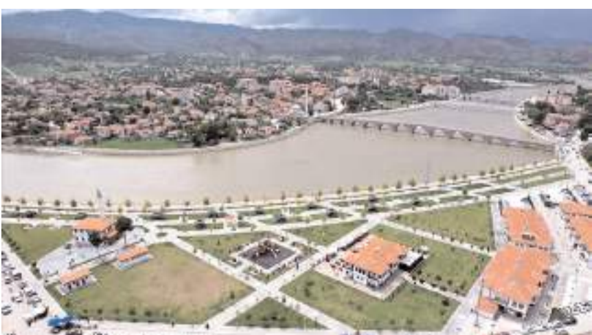
Ocak ayında Çorum'da sadece Osmancık'ta hava sıcaklıkları mevsim normallerinde seyretti.

Güneydoğu Anadolu Bölgesi'nde ortalama sıcaklıklar, bölgenin genelinde mevsim normallerinin üzerinde gerçekleşti. Bölgenin 4,6 derece olan uzun yıllar ortalama sıcaklığı, ocakta 7,1 derece olarak kayda geçti. Bölgede en düşük sıcaklık sıfırın altında 4,4 dereceyle Diyarbakır'da, en yüksek sıcaklık ise 18,8 dereceyle Ceylanpınar'da tespit edildi.