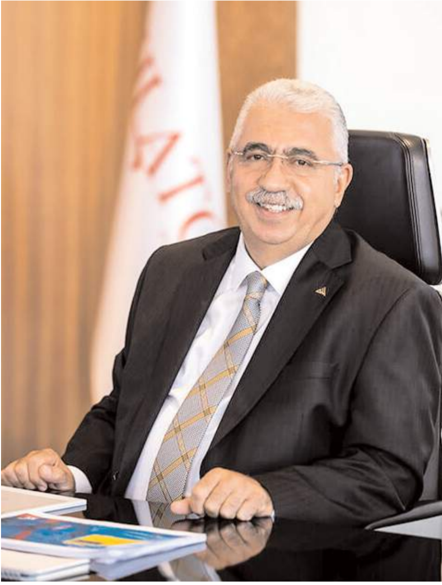
Ahlatçı Holding Yönetim Kurulu Başkanı Ahmet Ahlatçı