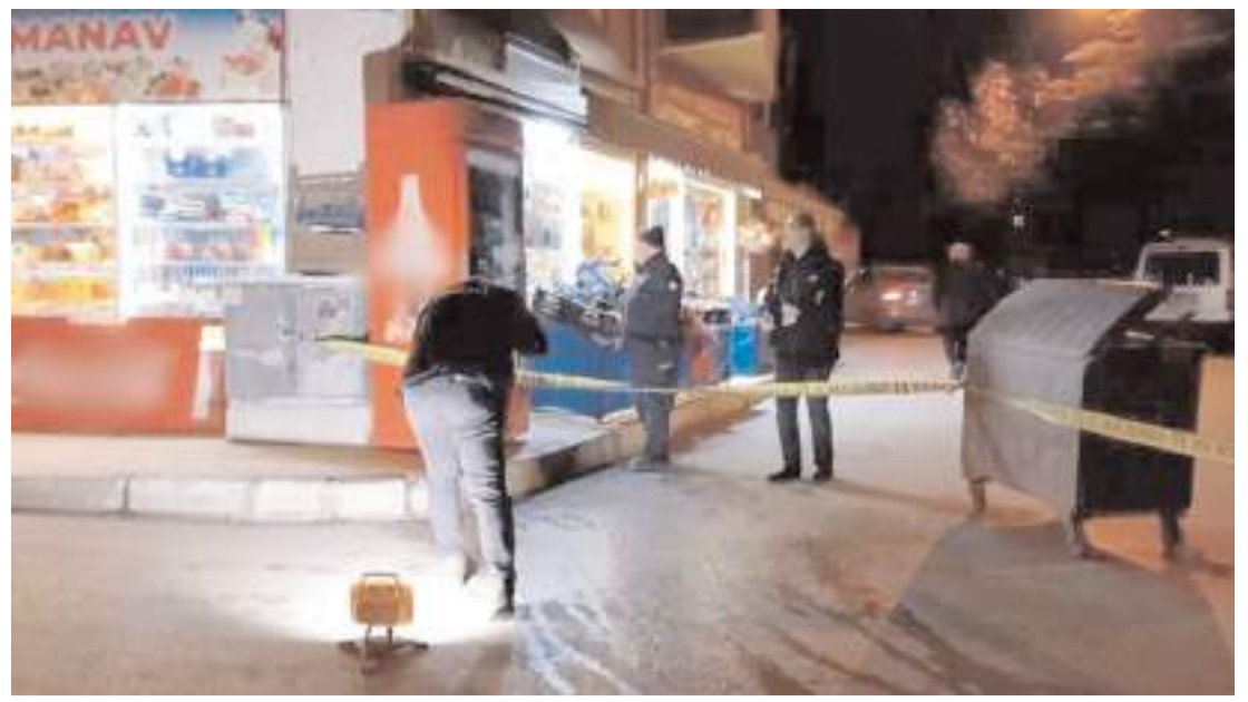
Olay Üçtutlar Mahallesi Üçtutlar Caddesi'nde meydana geldi.

Kaza ile ilgili inceleme başlatıldı. (İHA)