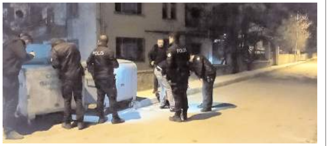
Polis ekipleri caddede inceleme yaptı.

Eğitimin ilçedeki diğer okullarda devam edeceği bildirildi. (AA)