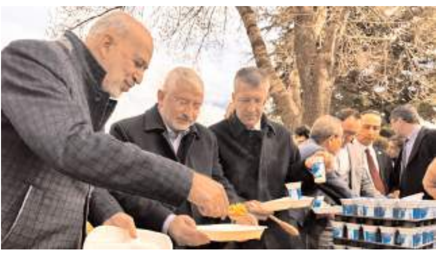
Programa protokol üyeleri de katıldı.