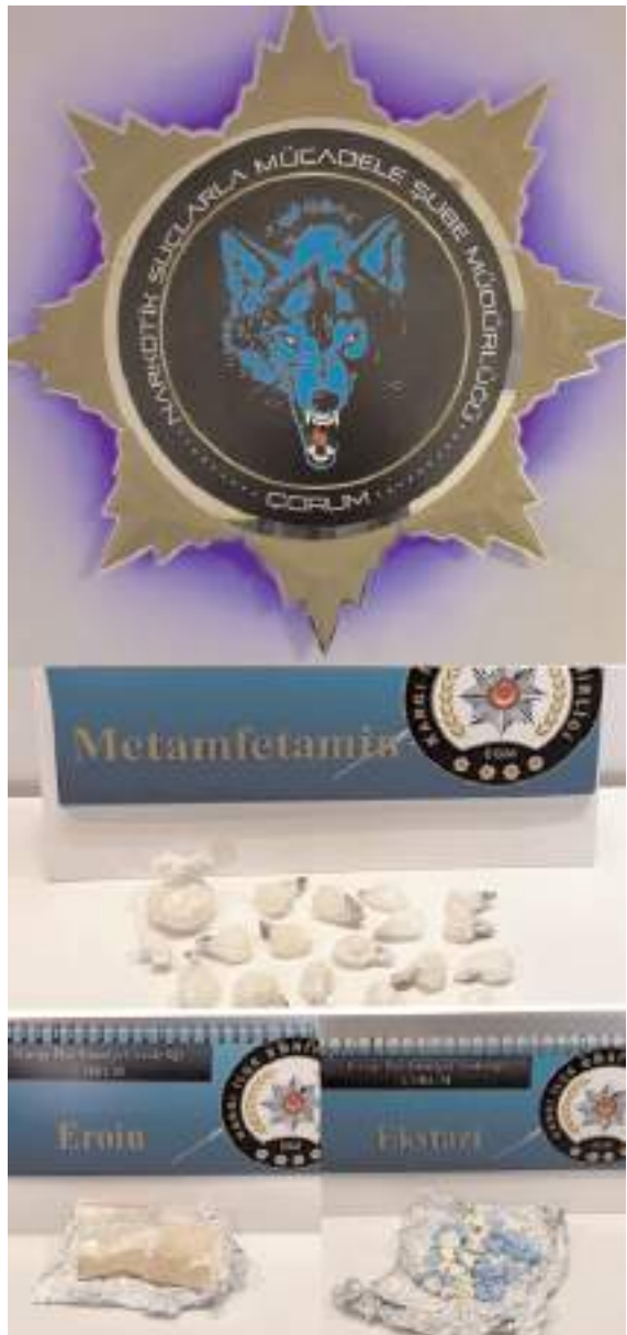
3 farklı operasyonda çok miktarda uyuşturucu madde ele geçirildi.

Suç unsurları ile birlikte yakalanarak adli mercilere sevk edilen 6 şüpheli şahsın 4'ü tutuklanarak Çorum L Tipi Kapalı Ceza İnfaz Kurumuna teslim edildi. (Haber Merkezi)