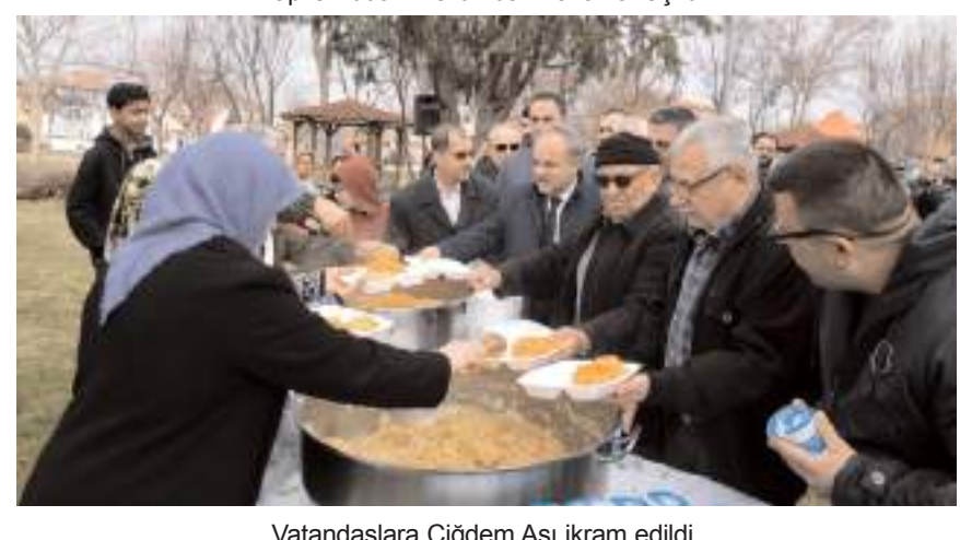
Vatandaşlara Çiğdem Aşısı ikram edildi.