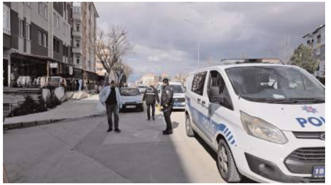
Olay Cemilbey Caddesi'nde meydana geldi.

Yüce'nin cenazesi, olay yeri incelemesinin ardından otopsi işlemleri için Hitit Üniversitesi Erol Olçok Eğitim ve Araştırma Hastanesi morguna kaldırıldı.(AA)