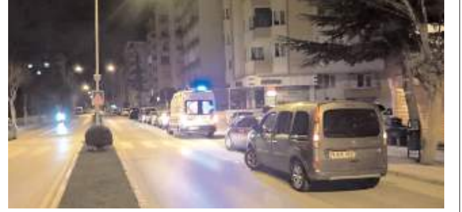
Olay Ulukavak Mahallesinde meydana geldi.

Edinilen bilgiye göre, K.Ü. (18) ile E.Ü. (21) oturdıkları ikamette bilinmeyen bir nedenle kavgaya başladılar. Çocukları arasında çıkan kavgayı ayırmak isteyen baba N.Ü. aldığı bıçak darbeleriyle yaralandı. Yaralı baba Ulukavak Mahallesi Fatih Caddesi üzerine gelerek 112 Çağrı Merkezini arayarak yardım istedi. İhbar üzerine cadde üzerine 112 sağlık ekibi ve polis ekibi sevk edildi. Yaralı şahıs olay sağlık ekibince yapılan müdahalenin ardından Hitit Üniversitesi Erol Olçok Eğitim ve Araştırma Hastanesi'ne kaldırılarak tedavi altına alındı.