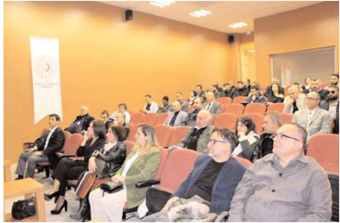
Sanayide Yeşil Dönüşüm bilgilendirme seminerinden bir görüntü...

Ajansımız Katma Değerli Üretim ve İhracat Sonuç Odaklı Programı kapsamında İmalat Sanayinde Yeşil Dönüşüm Yönetim Danışmanlığı faaliyeti yürütülmüştür. AB ile ticari ilişki içinde bulunan tüm tarafları ilgilendiren Avrupa Yeşil Mutabakatının TR83 Bölgesinde yer alan işletmelere etkisini ortaya koymak ve onların hazırlıklarına destek olmak için 5