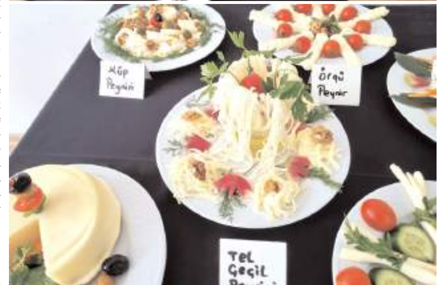
Kadınlar peynir yaprak ev ekonomisinde katkıda bulunacaklar.

dim. Ezine peynirini, şirden mayasını burada öğrendim." ifadelerini kullandı.