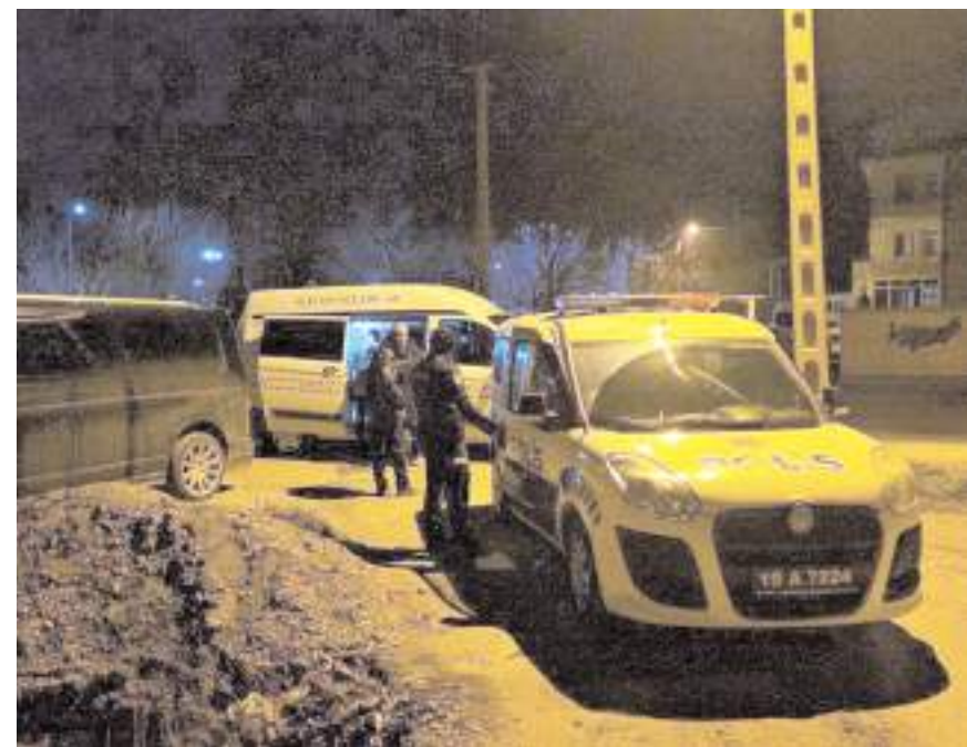
Polis ekipleri olay yerinde inceleme yaptılar.