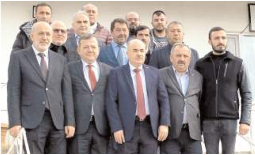
Ziyaretin sonunda hatıra fotoğrafı çekildi.