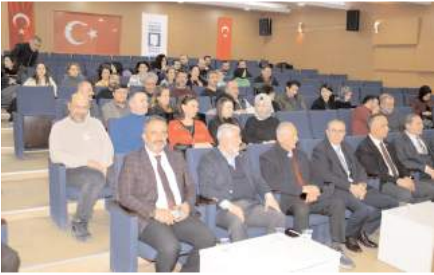
Söyleşi Turgut Özal Konferans Salonunda yapıldı.