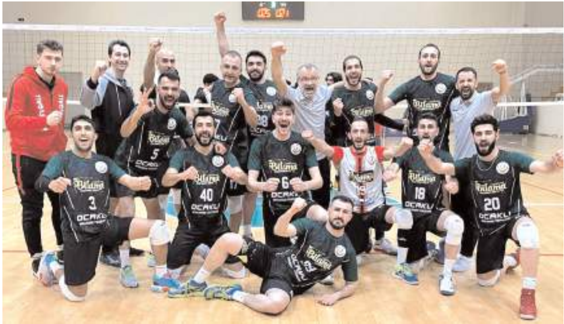
Sungurlu Belediyespor erkek voleybol takımı Osmaniye'de ilk maçını kazanarak 1. lig yolunda adım attı

Maç listesinde 2001 ve daha küçük doğumlu altı futbolcu bulunması gerekirken beş futbolcu yazıldığı için yenik sayılan Alaca Belediyespor'un AFDK'ya yaptığı itiraz sonucuna göre 1. Amatör Küme'de şampiyon belli olacak.