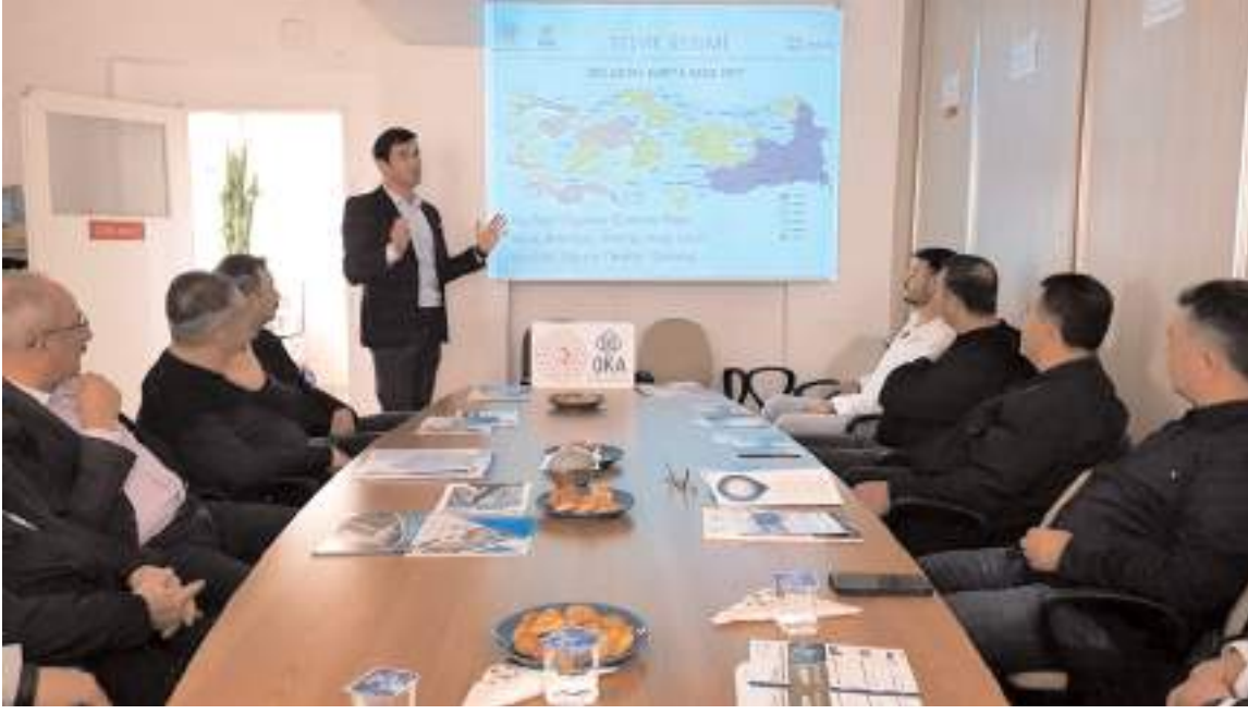
OKA, Yatırım Teşvik Sistemi ve Çorum'da Teşvik Avantajları bilgilendirme faaliyetleri gerçekleştirdi.

Ajansımız 2023 SOGEP başvuru sürecinde 12 adet ön başvuru almıştır. Proje geliştirme sürecinde Çorum Belediye Başkanlığı'nın başvuru sahibi olduğu "Çorum Belediyesi İşim Gücüm Üretim Projesi" ve Alaca Kaymakamlığının başvuru sahibi olduğu "Bir Şehri Büyütmek" projelerinin geliştirilme süreçlerinde mentörlük hizmeti vermiştir. 2024 Yılı Sosyal Gelişmeyi Destekleme Programı (SOGEP) Ön Başvuru Süreci başlamış, 30 Ocak 2024 tarihine kadar ön başvurular alınmaya devam edilmektedir. Ajansımız Çalışma Programı'nda yer alan OKA koordinatörlüğünde hazırlanacak "Hattuşa Alan Yönetim Planı" için Boğazkale ilçesi ziyaret edilerek paydaş görüşmeleri yapılmış, Hattuşa Ören Yeri, Yazılıkaya Açık Hava Tapınağı ve Budaközü Vadisi alan ziyareti gerçekleştirilmiştir. Ajansımız MARKA birimi, Amasya ve Çorum YDO katılımında gerçekleşen ziyarette Hattuşa kazı başkanı Prof. Dr. Andreas Schachner ve Boğazköy müze müdürü Resul İbiş ile görüşülmüştür. Hizmet satın alma sürecine devam edilmektedir. Kooperatif ürünlerinin satış kanallarının geliştirilmesi amacıyla Ajansımız 2023 Yılı Çar-