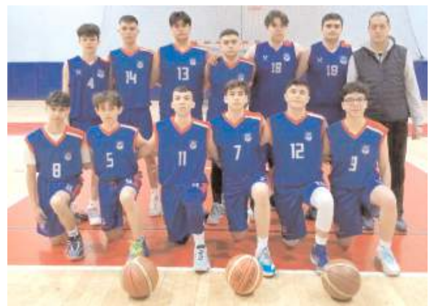
Çorum Yıldızları U 16 Kastamonu grubunda ilk maçını kazanarak iyi başlangıç yaptı

Çorum Yıldızları ilk maçında Kastamonu Basketbol önünde 78-57 gibi farklı skorla galip gelecek gruba galibiyet ile başladı. Temsilcimiz dün akşam ikinci maçında Düzce Basketbol takımı ile son maçında ise