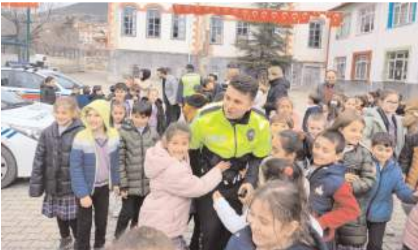
İskilip İlçe Emniyet Müdürlüğü ve İskilip İlçe Jandarma Komutanlığı ekipleri öğrencilere trafik kuralları hakkında bilgi verdiler.