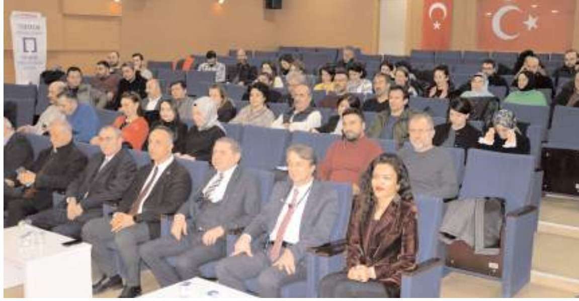
Söyleşi Turgut Özal Konferans Salonunda yapıldı.