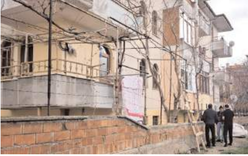
Olay Gülabibey Mahallesi Cumhuriyet 1. Sokak'ta meydana geldi.