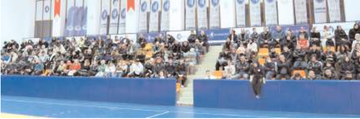
Spor Oyunları açılış ve kura çekim törenine mücadele edecek sporcular büyük ilgi gösterdiler