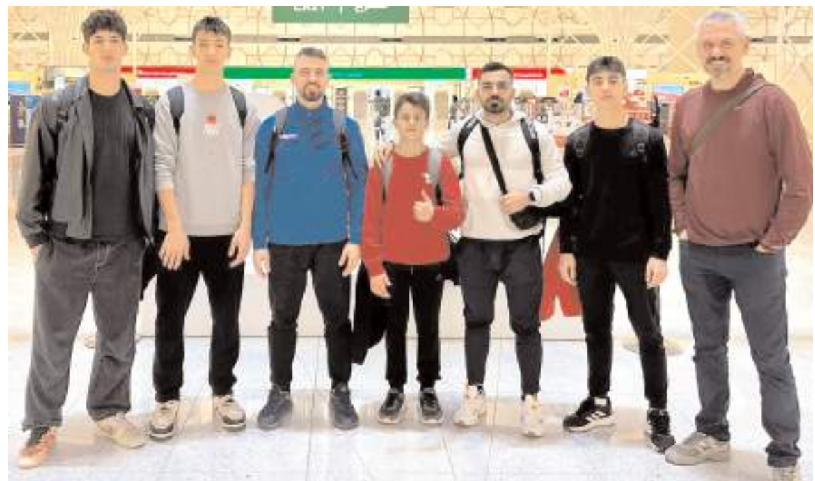
Birleşik Arap Emirliklerinde mücadele edecek Çorum Belediyespor kafilisi havaalanında toplu halde

Osmaniye'de B grubunda son maçlar bugün oynanacak. Saat 15.30'da Sungurlu Belediyespor, Kayapınar Halk Eğitim ile karşılaşırken son maçta ise Serik Belediyespor ile Kastamonu Yıldızlar Topluluğu karşılaşacak. Grupa ilk iki sırayı alan takımlar final grubuna yükselme ve 1. lige yükselmek için mücadele edecekler.