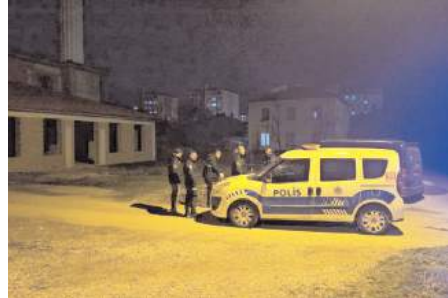
Olay Ulukavak Mahallesi Namazgah Parkı civarında meydana geldi.

Olayla ilgili başlatılan soruşturma sürüyor. (İHA)