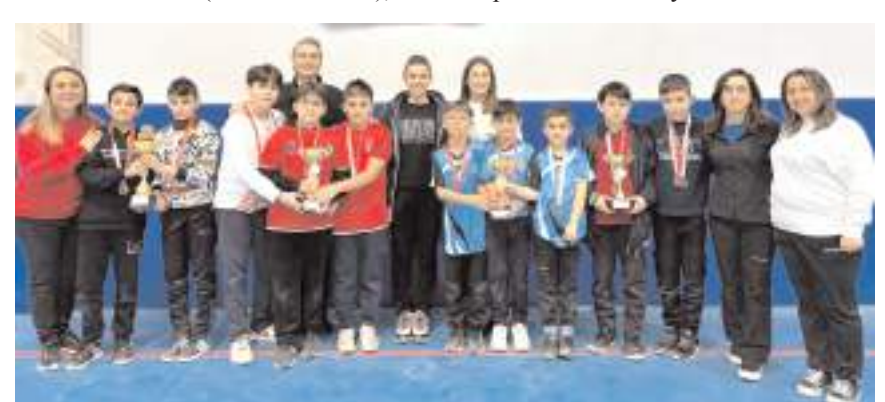
Floor Curling erkeklerde dereceye giren okullar ödül töreninde öğretmenleri ile

sümbül - Yusuf Yağlı - Fatih Kazankaya), 4. Necip Fazıl Kısakürek Ortaokulu (Hasan Ömer Topaç - Sarp Burak Koculu) Karma: 1. Sungurlu Kale-dere Şehit Bayram Kesek Ortaokulu (Hatice