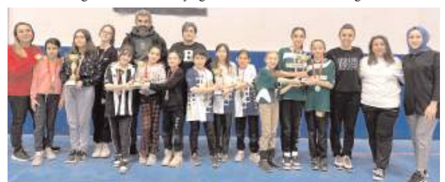
Kızlarda dereceye giren okullar ve sporcuları ödül töreninde toplu halde