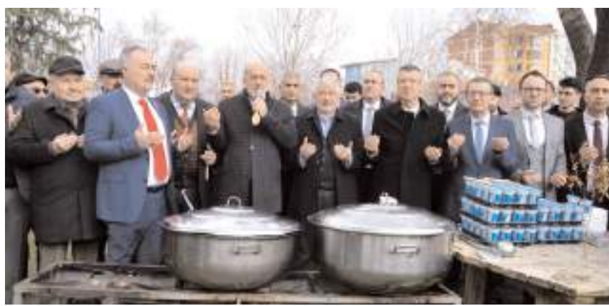
Yapılan duanın ardından kazanlar açıldı.

■ Namazgah Parkında gerçekleştirilen etkinlikte Çiğdem Aşı geleneği yaşatıldı.