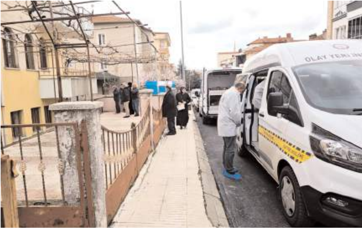
Polis ekipleri olay yerinde inceleme yaptı.

Çorum'da evinin önündeki ağacı budadığı sırada merdivenden düşen kişi yaşamını yitirdi.