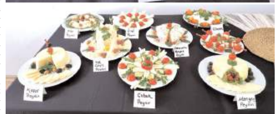
Ekim ayından bu yana devam eden kursta kadınlar 25 çeşit peynirin yapılışını öğrendi.