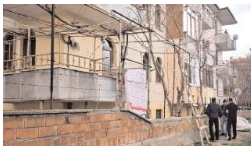
Olay Gülabibey Mahallesi Cumhuriyet 1. Sokak'ta meydana geldi.