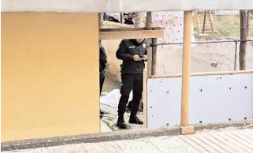
Yaşlı adamın olay yerinde vefat ettiği belirlendi.