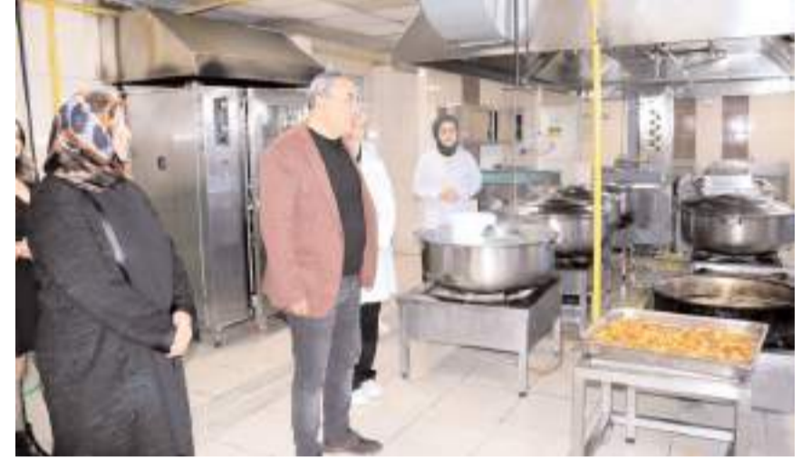
Yurtların yemekhaneleri kontrol edildi.

Öğrenciler ile sohbet edip taleplerini dinleyen Ünlüler, sonrasında yurt müdürleri ile denetimler ve kalite standartlarına ilişkin değerlendirme toplantısı yaptı.