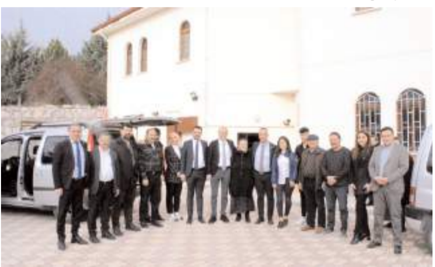
Nadık Cemevi'nde hatıra fotoğrafı çekildi.