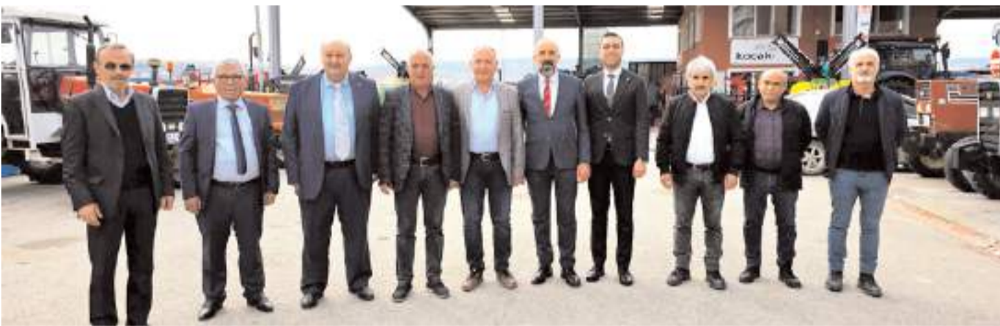
Ziyaretin ardından toplu hatıra fotoğrafı çekildi.