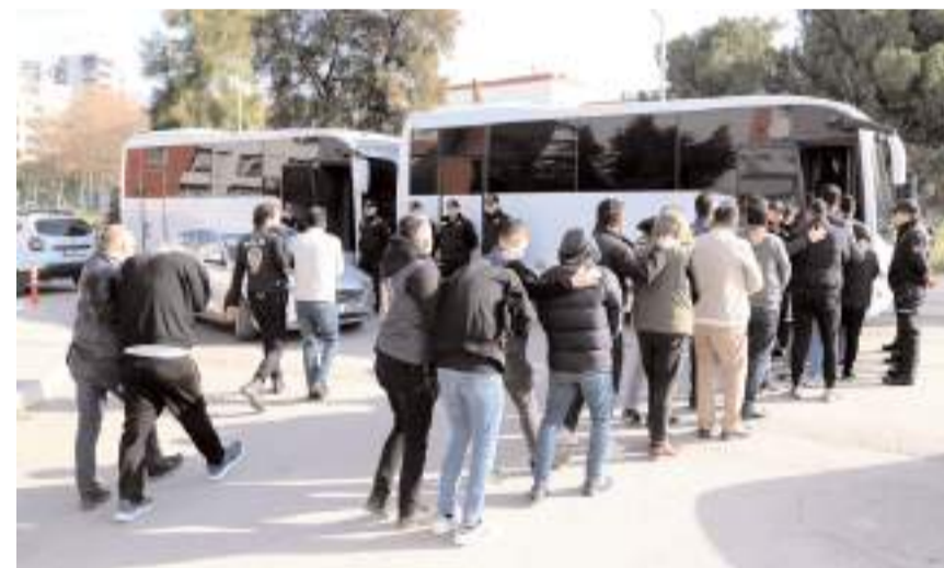
146 şüpheliden 74'ü çıkarıldığı mahkemece tutuklandı.

Operasyonda söz konusu şüphelilerin evleri didik didik arandı. Yapılan aramalarda 2 ruhsatsız