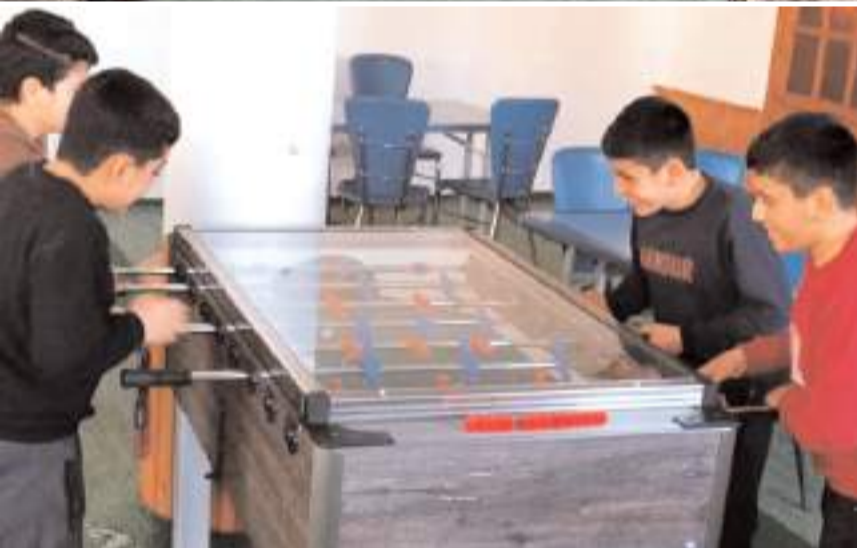
Düvenci Diyanet Gençlik Merkezinde, satranç, havallı hokey, langırt ve masa tenisi oynamak mümkün.