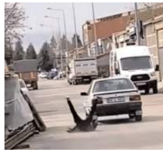
Otomobilin tavanına çıkan genç, araçtan düşerek yaralandı.