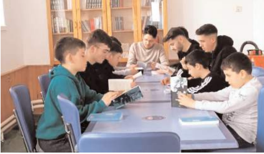
Merkezde yapılan kitap okuma programlarına ilgi yüksek.