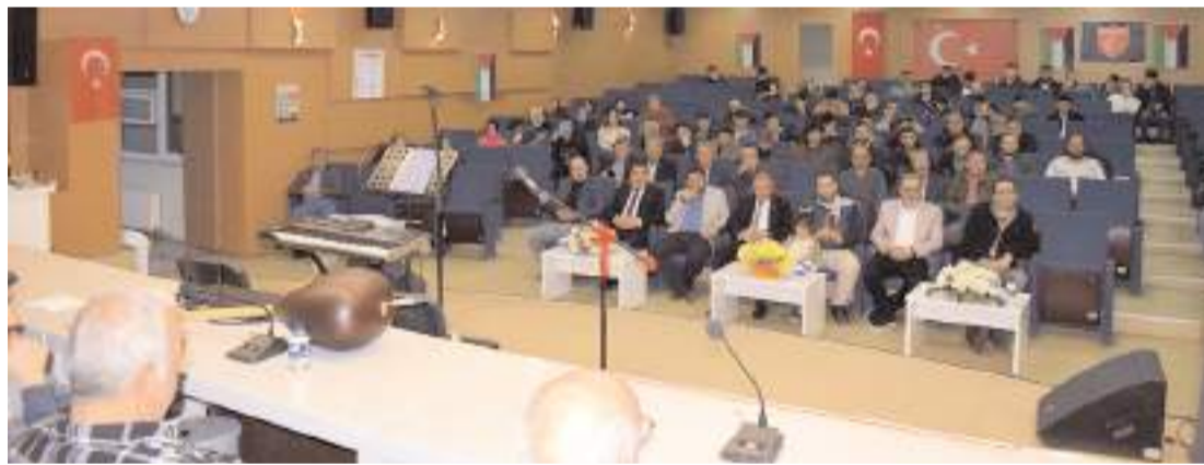
Program "Mahallede Gençler Var" projesi kapsamında yapıldı.