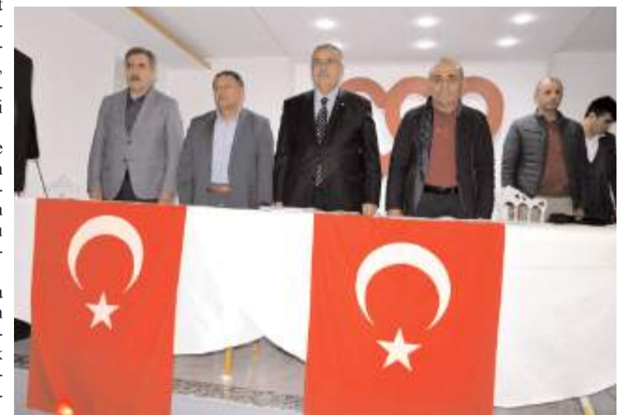
Genel kurulda ilk olarak divan heyeti belirlendi.

Toplantıda ayrıca oda üyesi esnafa özel hastaneler başta olmak üzere bazı firmalardan yararlanacakları üye kimlik kartları teslim edildi.