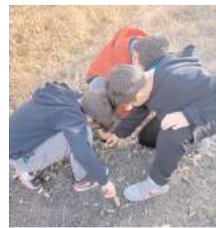
Çiğdemler Sıklık Tabiat Park'ından toplandı.

Etkinlik kapsamında veli ve öğrenciler çiğdemleri Sıklık Tabiat Park'ında toplayarak okulda ikram ettiler. (Haber Merkezi)