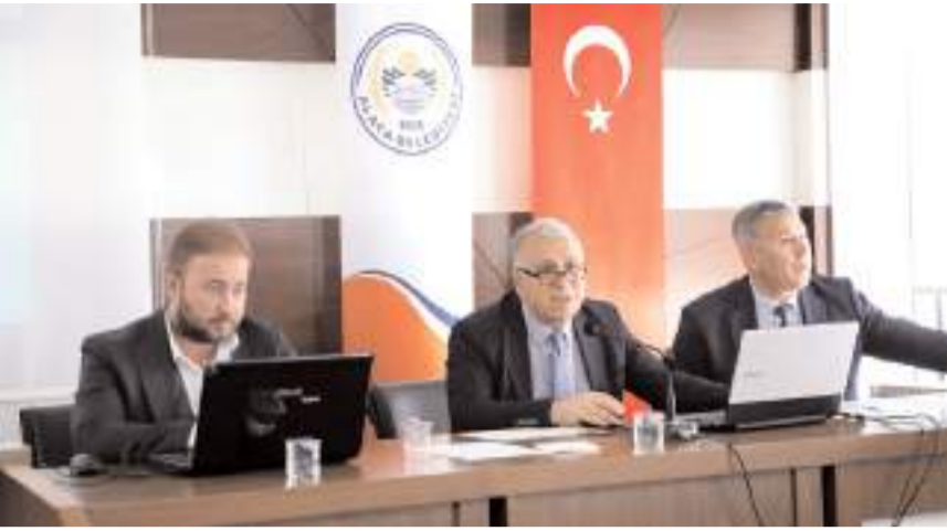
Toplantıya Teknoloji ve Sanayi Bölgeleri Genel Müdürlüğü yetkilileri de katıldı.