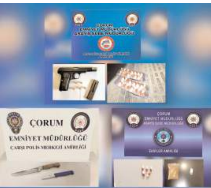
Denetimlerde silah ve uyuşturucu madde ele geçirildi.

23 Şubat - 1 Mart tarihleri arasında yapılan uygulamalarda 7 tabanca, 3 kurusıkı tabanca, 5 av tüfeği, 11 adet kesici ve delici alet, 10 adet şarjör, 65 adet fişek, 97 adet sentetik ecza maddesi, 1,93 gram esrar, 1 gram metamfetamin, 4,09 gram bonzai ile 3 adet altın bilezik ele geçirildi. (İHA)