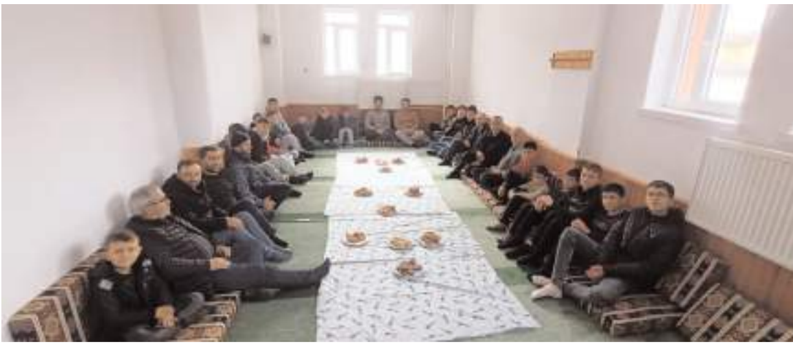
Düvenci Diyanet Gençlik Merkezine çocuk ve gençlerin ilgisi yüksek.