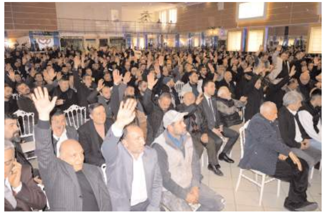
Oda'nın ünvan değişikliği talebi oy birliği ile kabul edildi.