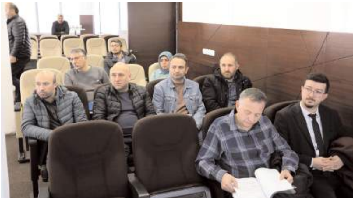
Toplantıda Alaca OSB'nin yeri ile ilgili istişarelerde bulunuldu.