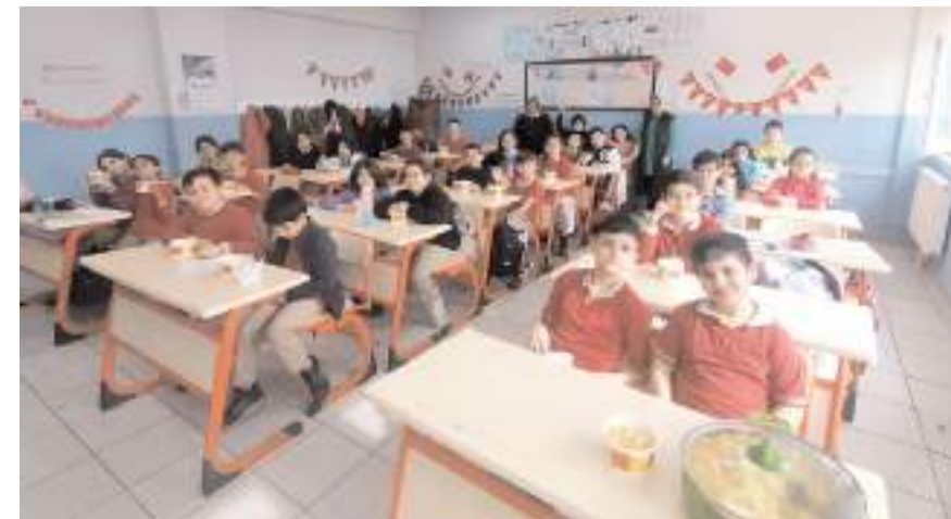
Toplanan çiğdemlerden yapılan Çiğdem Aşı sınıfta ikram edildi.