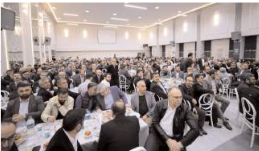
Programa katılım yüksek oldu.