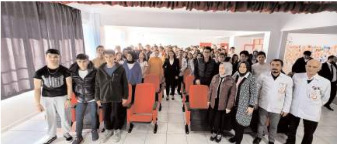
Söleşinin sonunda günün anısına toplu fotoğraf çekinildi.

Programın sonunda ise okul yöneticileri tarafından Kaymakam Emine Karataş Yıldız'a teşekkür plaketi verildi. (Haber Merkezi)