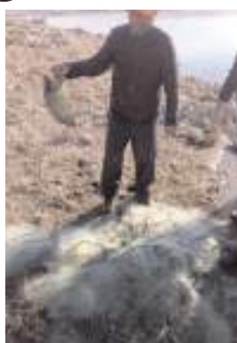
Balık ağlarına el konuldu.

Kaçak avcılara göz açtırılmayacağını dile getiren Tarım ve Orman Müdürlüğü ekipleri, doğada yaşayan canlıları korumak için ellerinden gelen çabayı göstermeye devam edeceklerini ifade ettiler. (İHA)