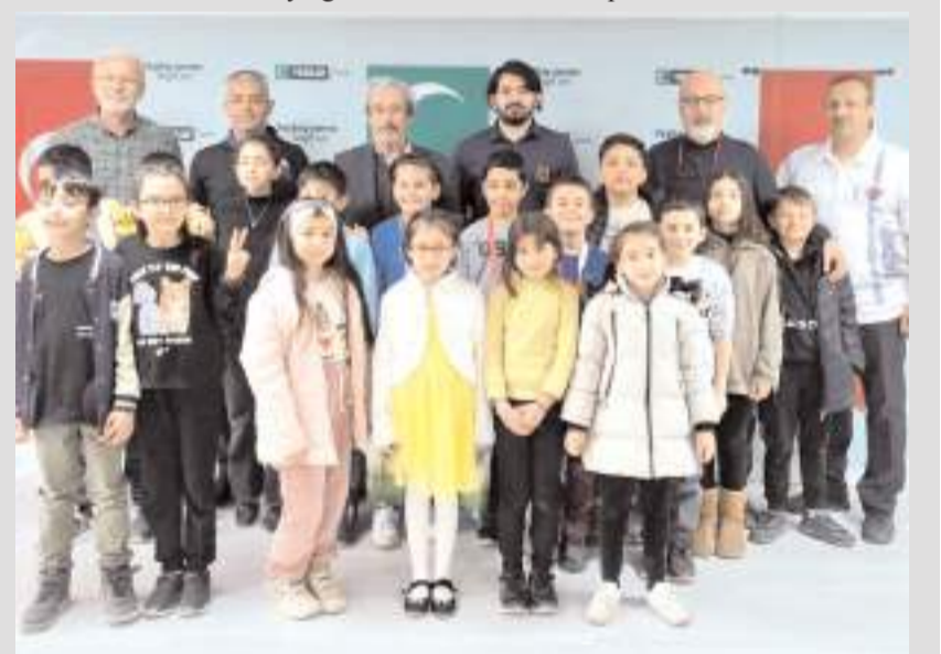
10 ve 14 yaş altında dereceye giren sporcular ödül töreninde toplu halde