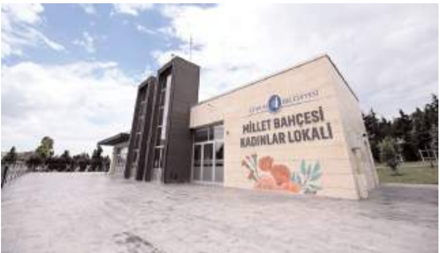
Millet Bahçesi içerisine Kadınlar Lokali açılacak.

za ulaştırmış olacağız. Ramazan ayımızın tüm İslam aleminin hayırlar getirmesini niyaz ediyorum" dedi. (Haber Merkezi)