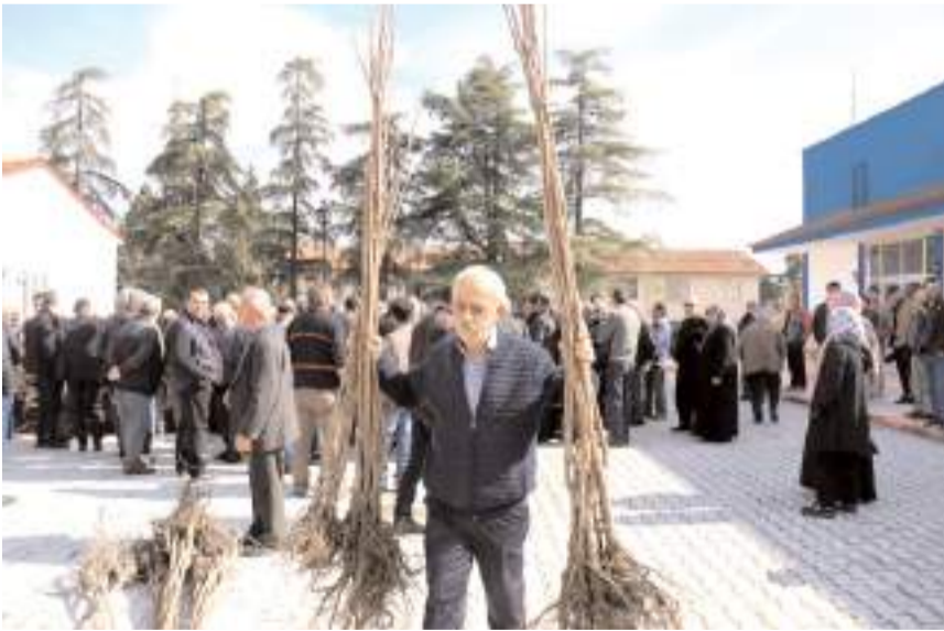
Dodurga'da 'Cennet Hurması Yetiştiriciliği' projesi hayata geçirildi.