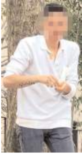
Olay İnegöl'de yaşandı.

Polis olayla ilgili soruşturma başlattı.