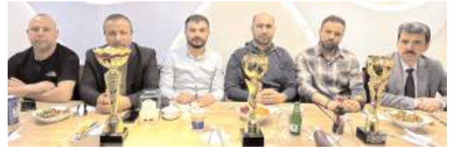
Gençler Masa Tenisinde kazanılan kupalar ile ASKF Yönetimi ve antrenörleri bir arada

21-25 Şubat tarihlerinde Amasya'da yapılan 100. Yıl Gençler Masa Tenisi Türkiye Şampiyonasında Çorumlu sporcular takımlar, tekler, çiftler ve karışık çiftlerde dört Türkiye Şampiyonluğu 2 Türkiye ikincili, 2 Türkiye üçüncülü ve 2 Türkiye dördüncülüğü kazanan Çorum Spor ihtisas ve Çorum Gençlikspor kulübü antrenörleri Mesut