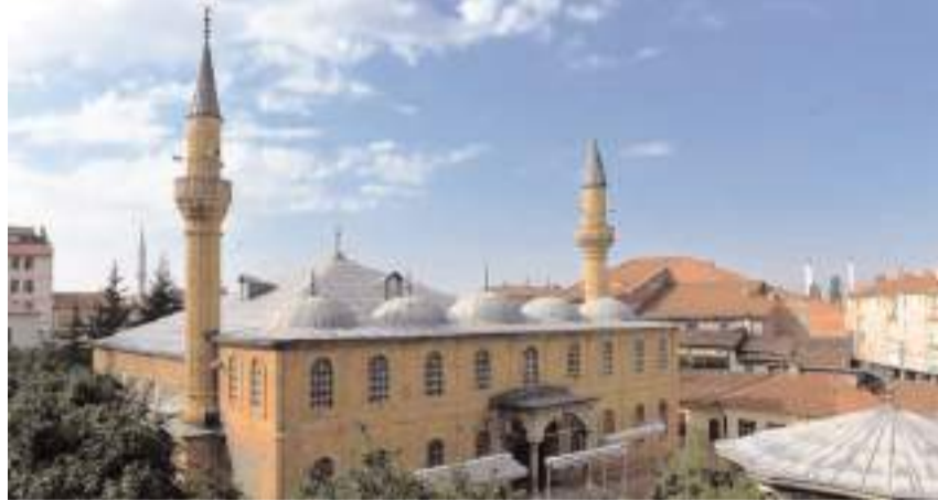
Ulu Camii restorasyon çalışmaları nedeniyle yaklaşık bir yıldır ibadete kapalıydı.

Restorasyon çalışmaları tamamlanan Murad-i Rabi Ulu Camii'nin, Ramazan ayı öncesinde Cuma namazı ile birlikte ibadete açılacağı belirtildi.