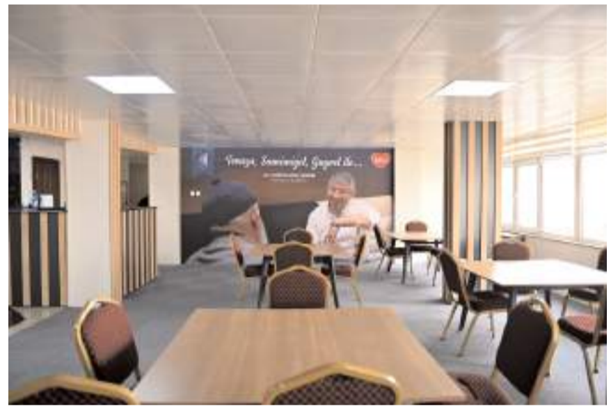
Emekliler Lokali, belediye eski hizmet binasında açılacak.