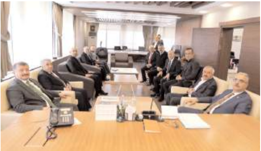
Milletvekili Ahlatcı, Alaca Belediye Başkanı Halil İbrahim Şaltu'yu ziyaret etti.

İlk olarak Boğazkale'de gerçekleştirilen AK Parti Seçim Bürosu açılışına katılan Milletvekili Ahlatcı, burada yaptığı konuşmada doğalgaz ile ilgili müjde vererek, "İlçenin daha modern bir yaşam standardına kavuşması için çalışmalarımızı sürdürüyoruz. Analarımız kışın artık doğalgaz kullanacak" dedi.