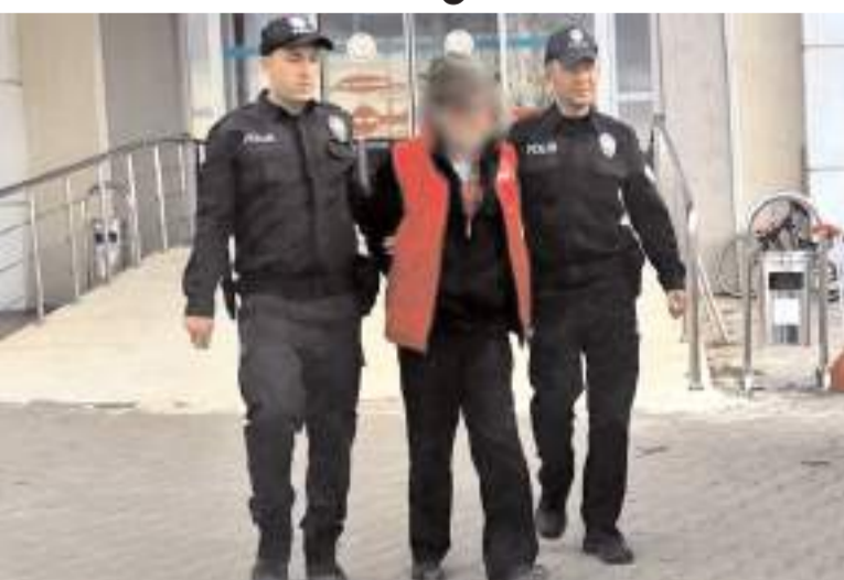
Yaşlı adam çıkarıldığı mahkeme tarafından tutuklandı.

Alaca'da, çocukları taciz ettiği iddiasıyla gözaltına alınan şahıs tutuklanarak cezaevine gönderildi.