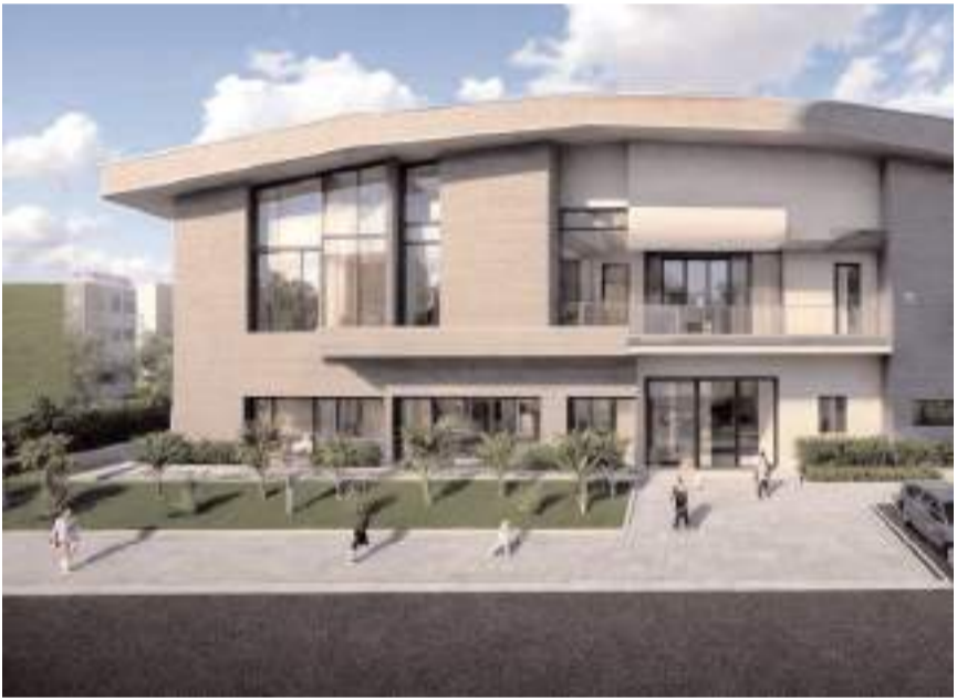
Başkan Aşgın, Aile Yaşam Merkezi, yapacak.