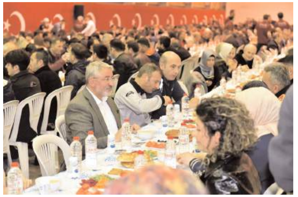
Çorum Belediyesi bu yıl iftar sofrasını hava şartları nedeniyle Afra Düğün Salonu'nda kuracak.