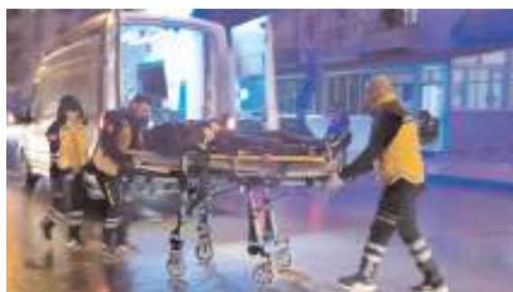
Yaralıları hastanede tedavi altına alındı.