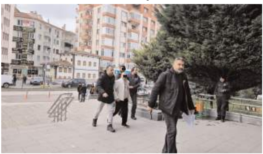
2 hükümlü emniyetteki işlemlerinin tamamlanmasının ardından cezaevine gönderildi.

Turhal İlamat ve İnfaz Bürosunca, alkol veya uyuşturucu maddenin etkisi altındayken araç kullanma, cebir tehdit veya hile kullanarak kişiyi hürriyetinden yoksun kılma, trafik güvenliğini tehlikeye sokma, görevi yaptırmamak için direnme, tefecilik yapmak suçlarından toplam 9 yıl 11 ay 22 gün hapis cezası bulunan M. A. (48), polis ekiplerince Akent