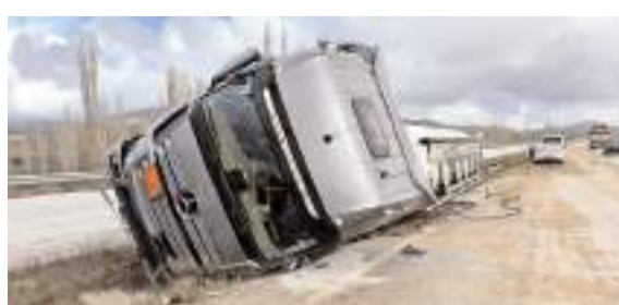
Kaza Sungurlu-Çorum karayolunun 20. kilometresinde meydana geldi.

Kazada ölen ya da yaralanan olmazken, devrilen tanker vinç yardımı ile kurtarılarak çekici ile olay yerinden kaldırıldı. (İHA)