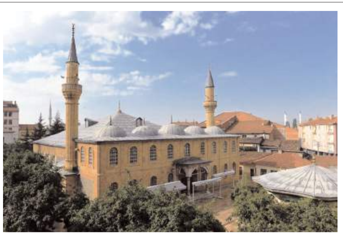
Ulu Camii restorasyon çalışmaları nedeniyle yaklaşık bir yıldır ibadete kapalıydı.

M.M. ve Ö.B. ise polis ekiplerince gözaltına alındı.(AA)