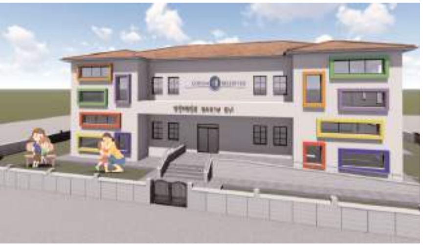
Şehrin 3 farklı bölgesine Kreş ve Gündüz Bakımevi açılacak.