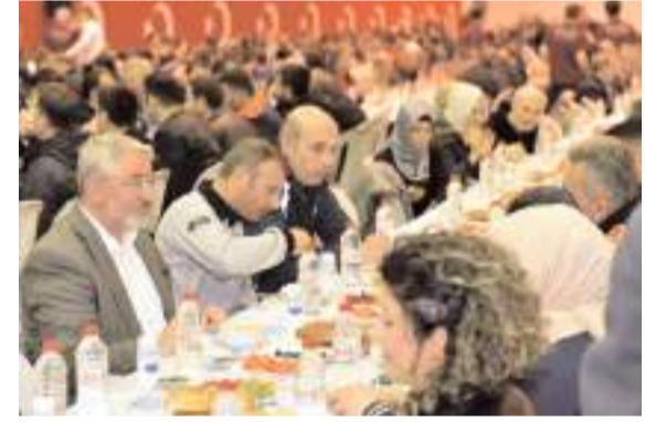
Çorum Belediyesi bu yıl iftar sofrasını hava şartları nedeniyle Afra Düğün Salonu'nda kuracak.