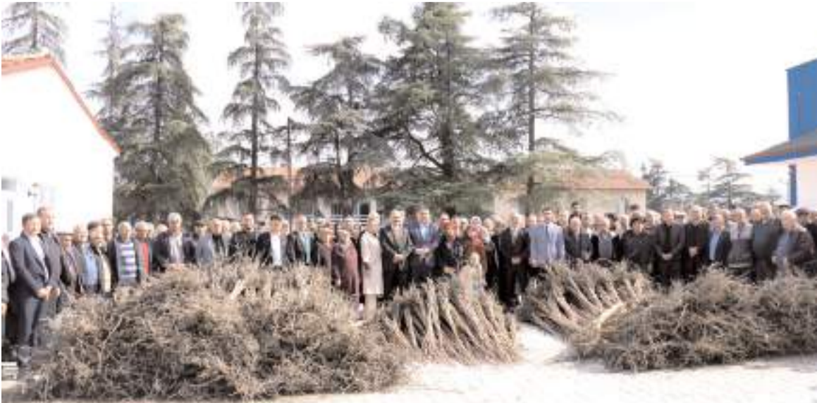
Toplam 70 çiftçiye 3 bin 300 adet cennet hurması fidanı dağıtıldı.