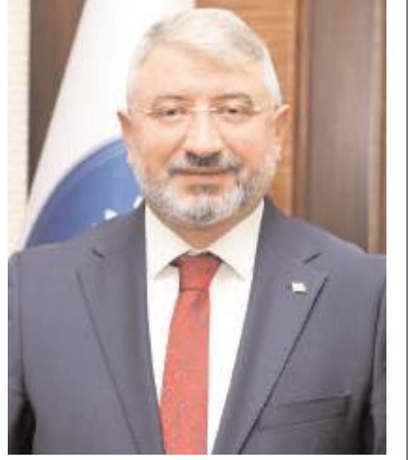
Belediye Başkanı Halil İbrahim Aşgın

Belediye Başkanı Aşgın açıklamasında "Çorum FK'ya her zaman destek olmamız gerekiyor. Benim dönemimde üç lig atladık. Bunda da bir "Halil İbrahim bereketi" olabilir. Başkan ve ekibini takdirle karşılıyorum. Zor bir dönemde büyük bir fedakarlıkla çalışıyorlar. Bu yıla kadar mali, nakdi imkan sağlayabiliyorduk. Bu anlamda çalışmalar yaptık. 2018'in ödemesini biz yaptık. 2019'u üdedik. 1-2 yıl daha nakdi destek verdik ancak şu an Çorum Belediyesi olarak profesyonel bir takıma nakdi des-