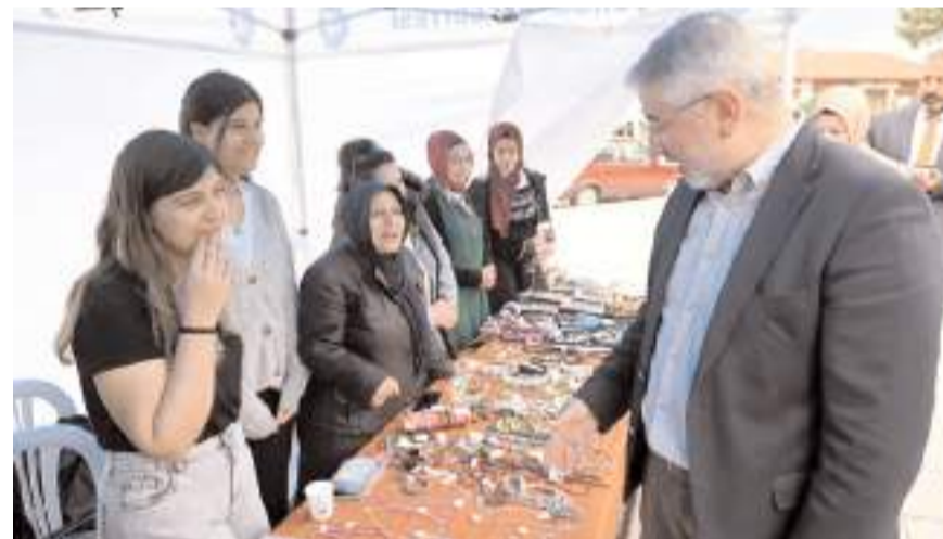
Etkinlikler kapsamında Kadeş Barış Meydanı'nda Kadın El Emegi Ürünleri Satış Standı açılacak.

Çorum Belediyesi tarafından kurulan Kadın El Emegi Çarşısı da Kadın Kültür Günleri etkin-