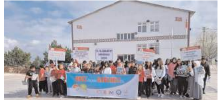
Eğitim 75. Yıl Cumhuriyet Ortaokulunda düzenlendi.

Eğitimin ardından ise okul bahçesinde öğretmen ve öğrencilerle yürüyüş yapılarak obezite ile ilgili döviz ve pankartlar açılıp farkındalık oluşturul-