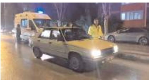
Olay İskilip Sanayi Sitesi'ndeki iş yerinde meydana geldi.

Ekipler, olay yerinden kaçan zanlının yakalanması için çalışma başlattı. (AA)