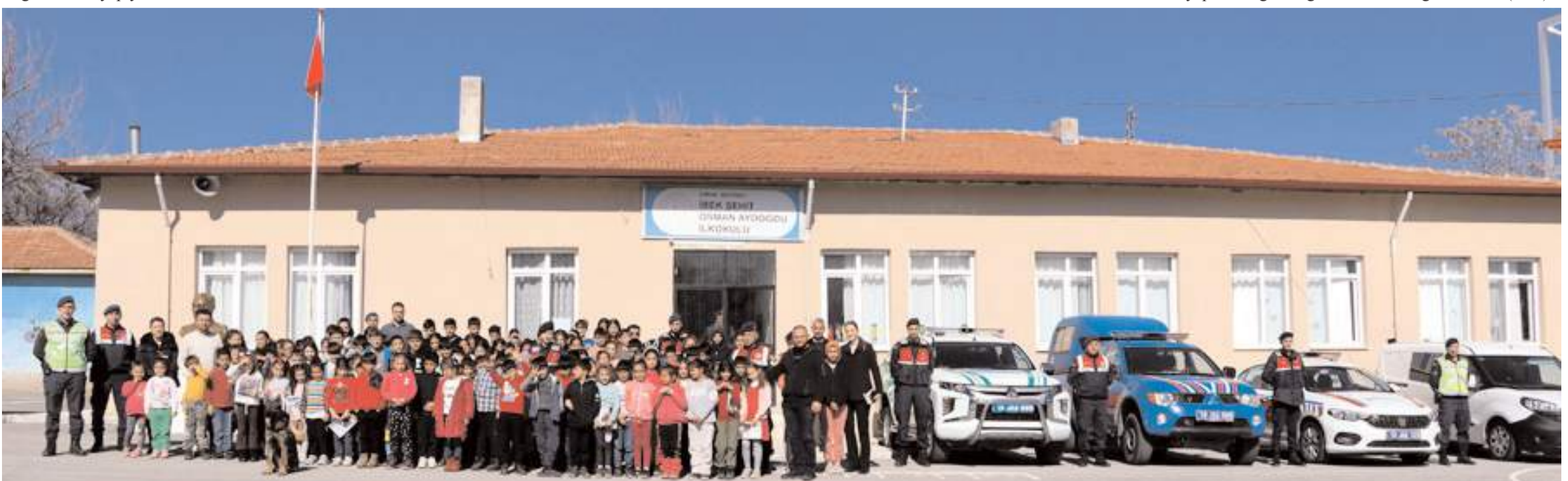
Köy köy gezen jandarma ekipleri çocukları ve ailelerini madde bağımlılığı, kadına yönelik şiddet, çevre sorunları ve trafik konularında bilgilendiriyor.

İl Jandarma Komutanlığı Aile İçi Şiddetle Mücadele ve Çocuk Kısımları Amirliği ekipleri, paydaş kurumlarla ilçeler ve kırsalda Kadın Destek Uygulaması KADES hakkında bilgi vererek kadın ve çocuklara, acil bir durum ile karşı karşıya kalmaları durumunda, neler yapmaları gerektiği konusunda bilgilendirildi. (İHA)