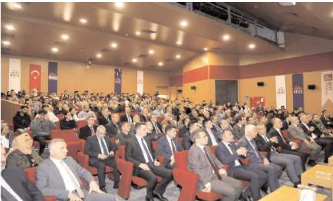
Panele katılım yüksek oldu.