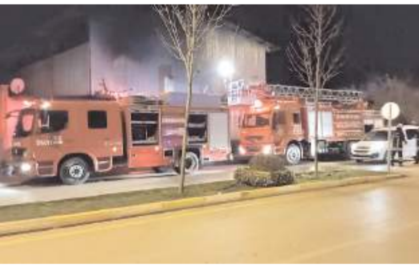
Yangın Akşemssetin Caddesi'nde bir işyerinde meydana geldi.

Çorum'da bir akaryakıt istasyonunun eklenti kısmındaki kazan dairesinde çıkan yangını itfaiye ekipleri kontrol altına aldı.