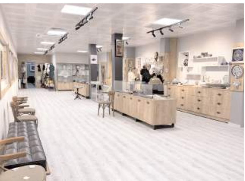
Kadın Emegi Çarşısı, eski belediye hizmet binasında bulunuyor.