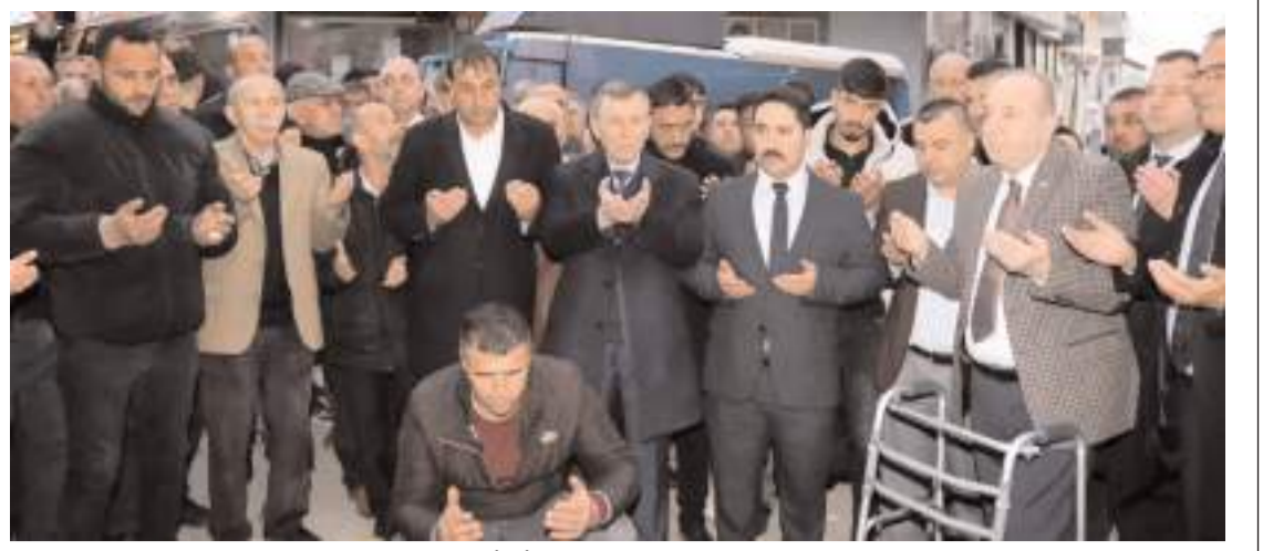
Sungurlu Belediye Başkanı ve İYİ Parti Belediye Başkan Adayı Abdulkadir Şahiner, seçim çalışmalarına dualarla başladı.