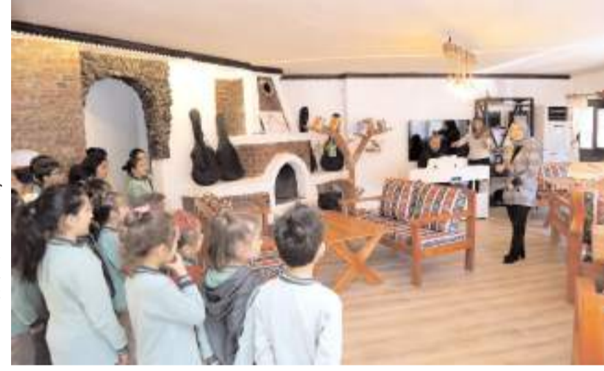
Orman Okulunda, doğada matematik, tarımsal aktiviteler, çevre bilinci, oryantiring, doğal yaşam gözlemevi, çevre bilimi konularında eğitimler verilecek.