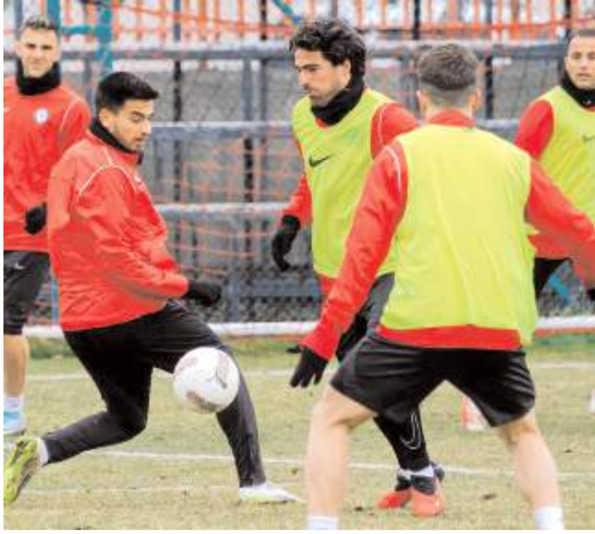
Kırmızı Siyahlı takım dünki çalışmada Eyüpspor maçının taktiğini çalıştı