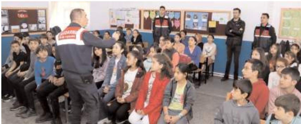
Seminerlerde öğrencilere trafik işaret ve levhaları, emniyet kemeri gibi trafik kuralları ile ilgili bilgiler veriliyor.

Çocukların ve gençlerin uyuşturucu kullanımının önüne geçerek anne duyarlılığından faydalanmak amacıyla İçişleri Bakanlığının hayata geçirdiği "En İyi Narkotik Polisi: Anne Projesi" çerçevesinde Jandarma ekipleri, madde bağımlılığının önlenmesi için izlenmesi gereken yollar hakkında annelere sunum yapıyor. Eğitimlerde madde bağımlılığı, bağımlılık yapıcı maddeler, bağımlı kişinin özellikleri, uyuşturucu ile mücadelede hayata geçirilen ihbar mekanizmaları ve çözüm merkezleri konusunda bilgilendirme yapan Jandarma ekipleri, katılımcılara "UYUMA" projesi hakkında da bilgilendirme yapıyor.