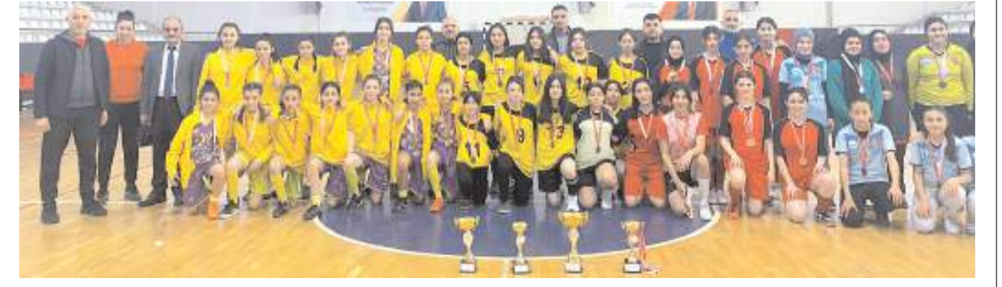
Yıldız Kızlar futsalda kürsüye çıkmayı başaran dört okulun sporcu, öğretmen ve idarecileri ödül töreni sonrasında toplu halde