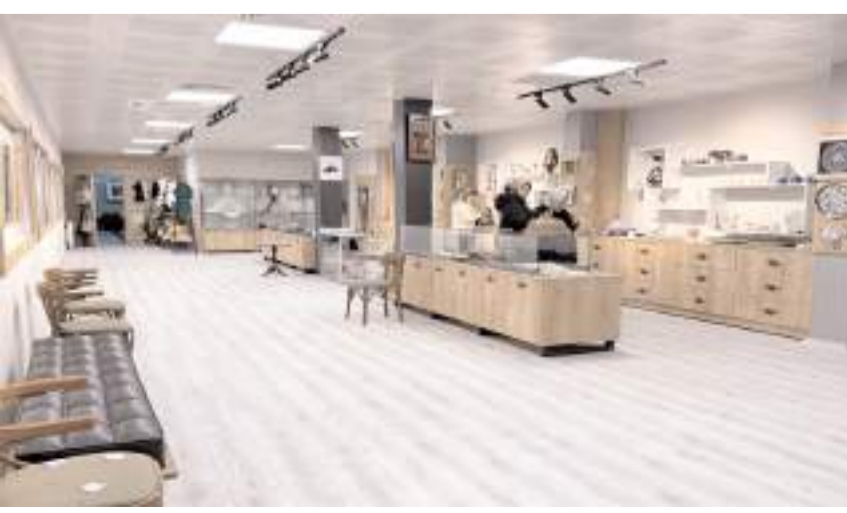
Kadın Emeği Çarşısı, eski belediye hizmet binasında bulunuyor.

Kadınların el emeği göz nuru ürünleri ekonomiyeye kazandırıyor. Çorum Belediyesi'nin eski belediye hizmet binasında hazırladığı Kadın Emeği Çarşısı, 8 Mart Dünya Kadınlar Günü'nde hizmete girecek. * HABERİ'7'DE