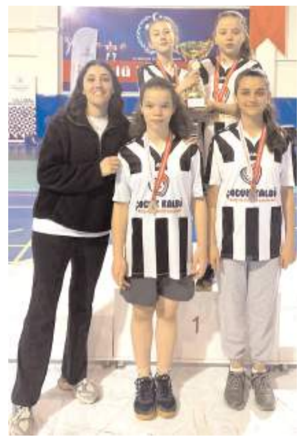
Cumhuriyet Ortaokulu yıldız kız badminton takımı şampiyonluk kupasını ile birlikte kürsüde toplu halde

Ortaokulu ise üçüncü grupta ilimisi temsil etmeye hak kazanırken Müsabakalar sonunda şampiyon olan Cumhuriyet Ortaokulu üç okula kupa sporculara ise madalyaları verdi.