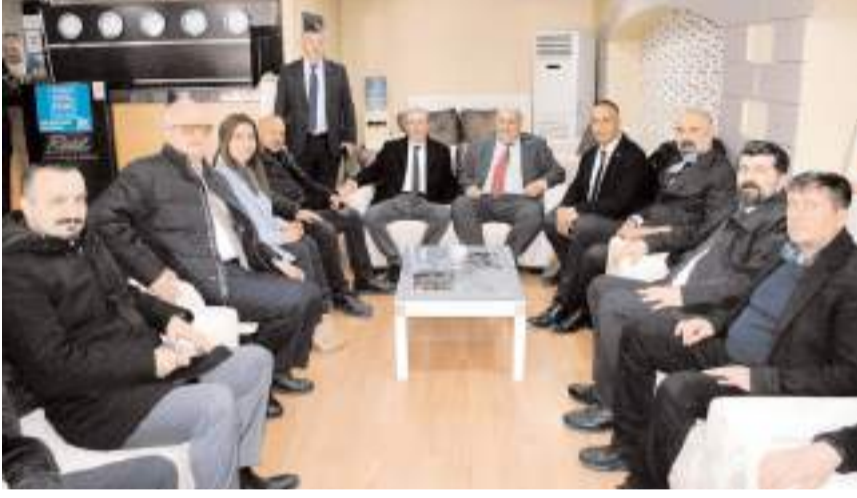
Esnaf ziyaretleri sırasında CHP ve İYİ Parti heyetleri karşılaştı.