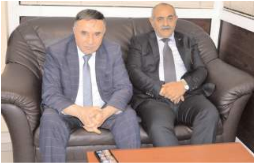
Ziyarete parti yöneticileri de katıldı.

Evi olmayan vatandaşlara Belediye olarak ev yapmak şartıyla arsa tahsis edeceklerini belirten Teryaki, "Arsa bizden ev onlardan olacak. Ayrıca sadece emekli maaşı ile evini geçindiren emeklilerimize 'Çorum 19' kartı vererek, her ay 5 bin lira destek vereceğiz" de-