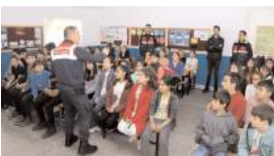
Seminerlerde öğrencilere trafik işaret ve levhaları, emniyet kemeri gibi trafik kuralları ile ilgili bilgiler veriliyor.