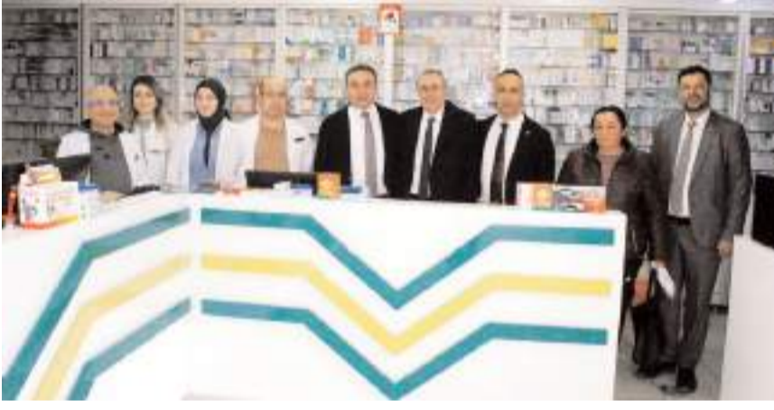
Çöphüseyinoğlu, ziyaretlerinde esnafların sorun ve taleplerini dinledi.