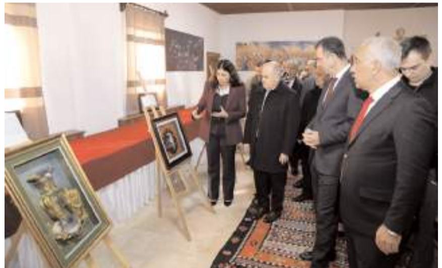
Vali Dağlı Kağıt Rölyef Kursu sergisinin açılışını yaptı.