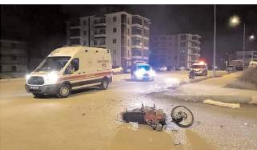
Kaza Kale Mahallesi Ata 1. Caddede meydana geldi.

Kaza Kale Mahallesi Ata 1. Caddede meydana