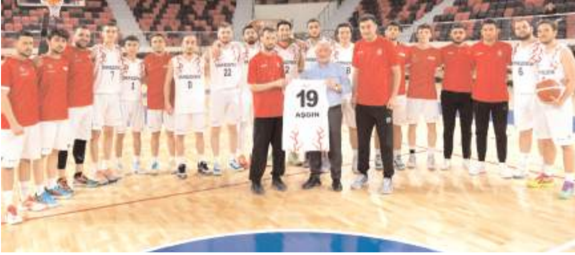
Basketbol takımı antrenmanını ziyaretinde Belediye Başkanı Dr. Halil İbrahim Aşgın'a forma hediye edildi

Öte yandan Bandırmaspor maçındaki çirkin ve kötü tezahürattan dolayı ceza alan D4 ve D5 ile Kuzey Tribünü E 1 ve E 2 bloklarında o maça giriş yapan taraftarların kartlarına bloke olduğu için maça giremeyecekler. Bu taraftarlar kombinelerini başkalarına aktarabilecekler. Bandırmaspor maçına kombinesi olduğu halde giriş yapmayanlar bu maça girebilecekler.