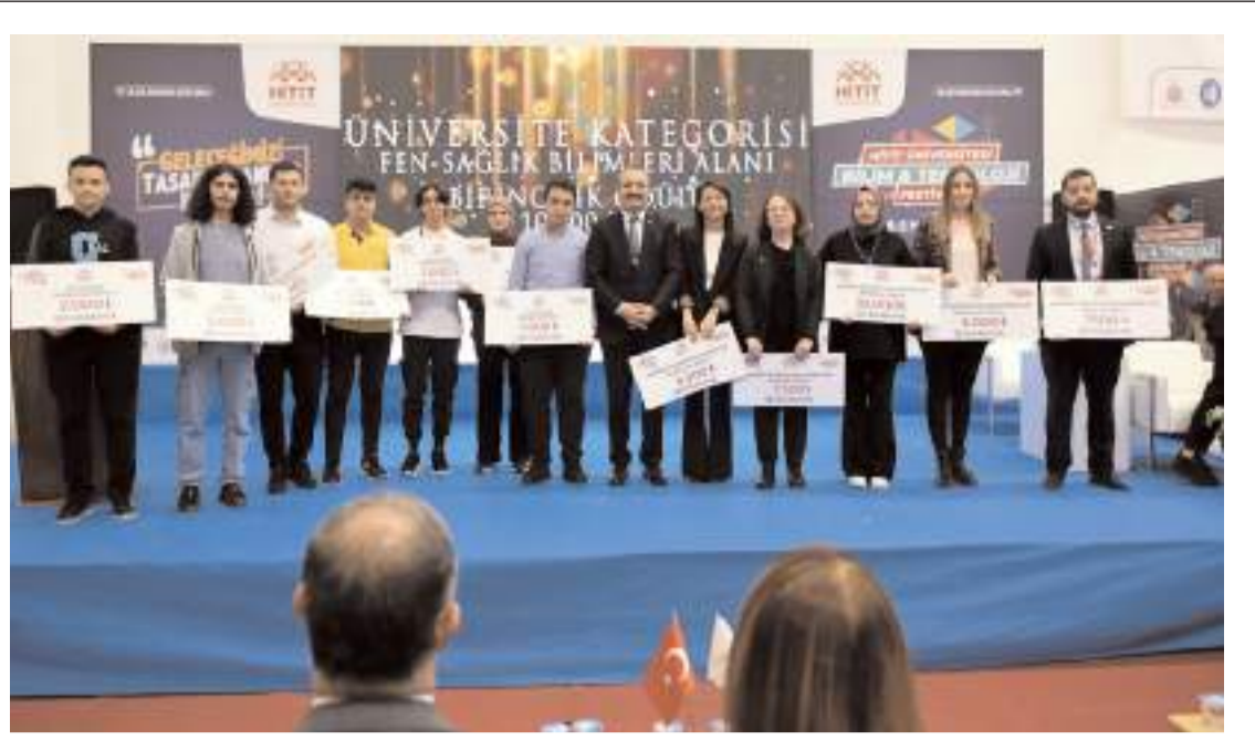
Hitit Üniversitesi Bilim ve Teknoloji Festivalinde en başarılı proje sahiplerine ödülleri törenle verildi.