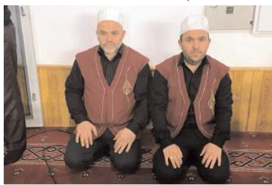
Enderun Usulü Teravih Namazı, yatsı ve vitir namazı ile birlikte teravihin her 4 rekatında farklı olmak üzere 7 çeşit makamda 5 din görevlisi tarafından kılınıyor.