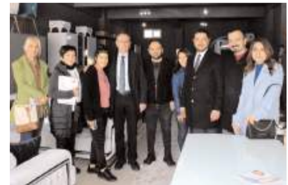
CHP Çorum Belediye Başkan Adayı Levent Çöphüseyinoğlu, Mehmet Akif Ersoy Caddesi'nde esnafları ziyaret etti.