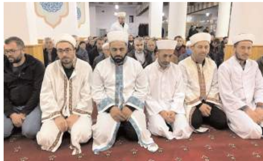
Enderun Usulü Teravih Namazı ilk olarak Abdi Bey Camii'nde kılındı.

8 Nisan 2024 Pazartesi Akşemsettin Camii." (Haber Merkezi)