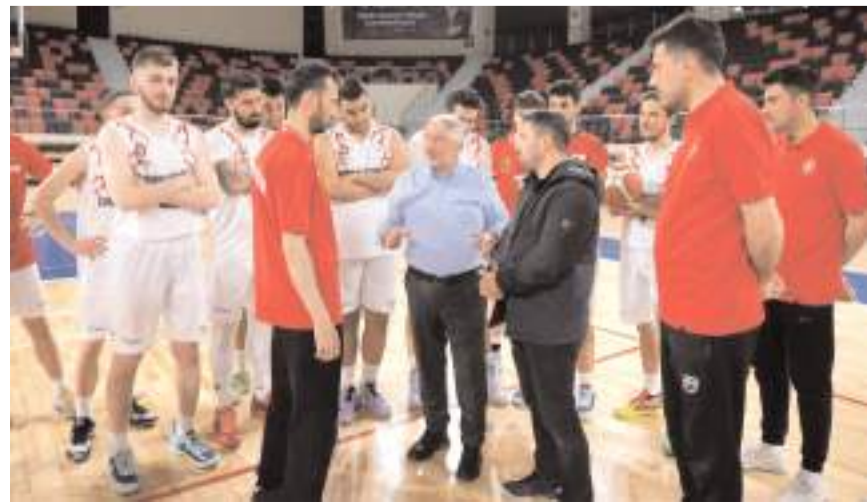
Ziyaret sırasında Aşgın takımın çalışmalarını hakkında antrenörlerden bilgi aldı

takımı ile karşılaşacak. 20 Mart çarşamba günü saat 14'de Erzincan Merkez Spor Salonu'nda İliçspor ile karşılaşacak olan Çorum Belediyespor 24 Mart pazar günü ise Yeni Spor Salonu'nda Trabzonspor takımını konuk edecek. Ligde sonraki haftaların programı daha sonra açıklanacak.