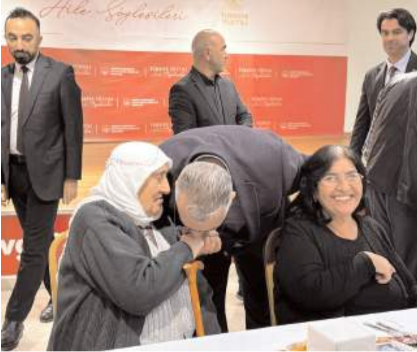
AK Parti Çorum Milletvekili Av. Yusuf Ahlatcı, huzurevinde kalan yaşlılarla sohbet etti.

AK Parti Çorum Milletvekili Av. Yusuf Ahlatcı, Ramazan ayının ilk iftarını huzurevi sakinleriyle açtı.