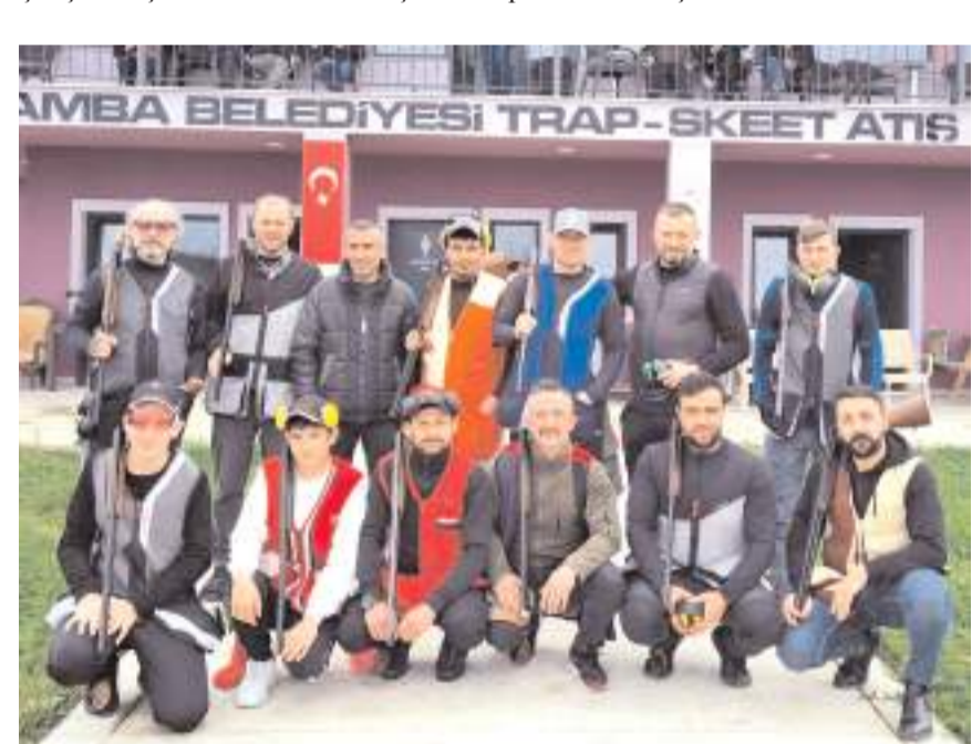
Çorumlu Atıcılar Türkiye Şampiyonası antrenman için Çarşamba Poligonuna gittiler