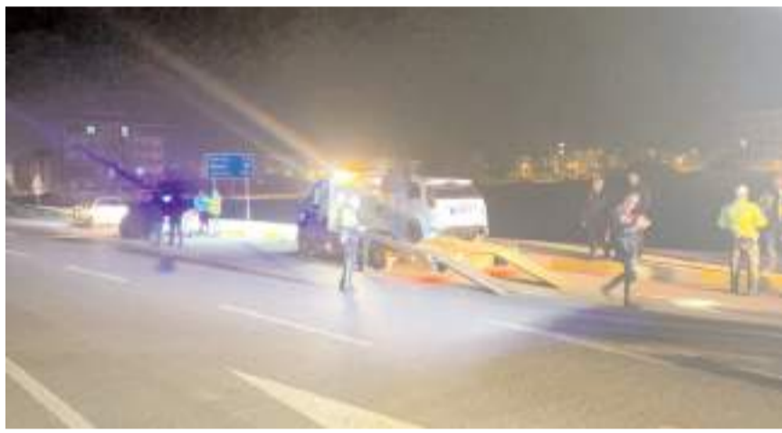
Otomobil Akşemseddin Köprülü Kavşağı'nda durduruldu.