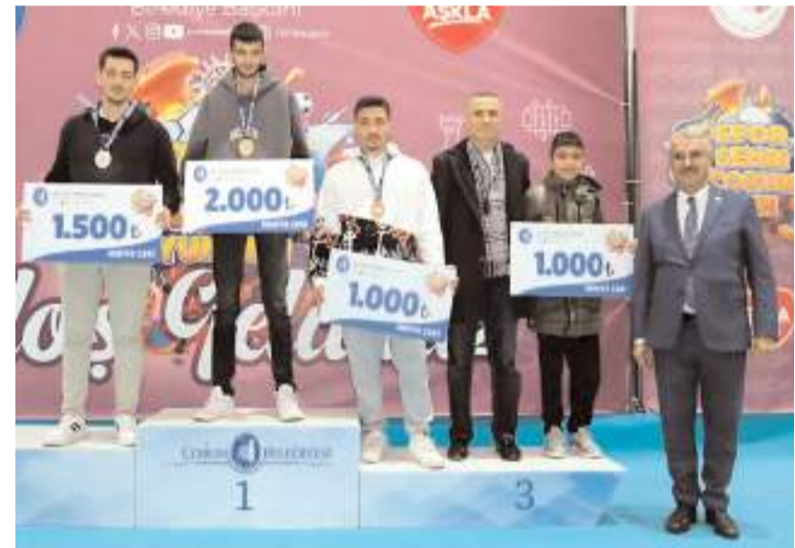
AK Parti Milletvekili Yusuf Ahlatcı dereceye girenlere madalya ve ödülleri verdi