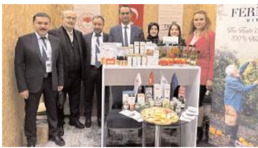
TKDK Çorum İl Koordinatörlüğü açtığı stantla örnek kadın yatırımcılarıyla birlikte yöresel ürünleri tanıtarak zirveye katkı sağladı.