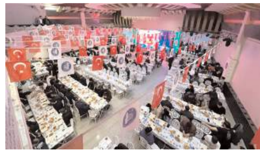
Çorum Belediyesi iftari Afra Düğün Salonunda veriyor.

Hayırseverin katkılarıyla, bu yıl sıcak bir ortamda kurulan iftar sofrasında çocuklar da unutulmadı. İftar yemeğinde, çocuklar için çeşitli hediyeler, film gösterileri gibi etkinlikler de yer aldı. İlahiler ve Kuran'ı Kerim