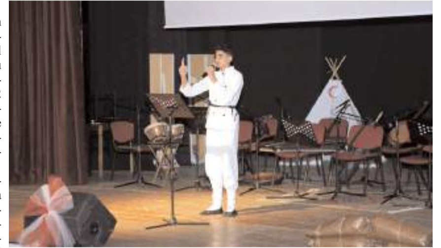
Programda oynan piyes bol bol alkış aldı.

Saygı duruşu ve İstiklal Marşı'nın okunmasıyla başlayan programda öğrenciler hazırladıkları gösterileri sergilediler.