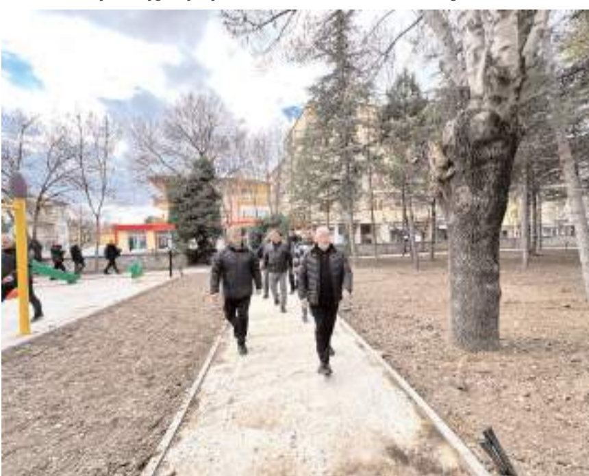
Park, Eti Anadolu Lisesinin bahçesine yapılıyor.

Çorum Belediyesi Eti Anadolu Lisesi bahçesini mahalle halkı için park haline getirdi. Çocuk oyun alanları, kameriyeler, yürüyüş yolları ve yeşil alanların bulunduğu Eti Park'ta çalışmalar tamamlanmak üzere.