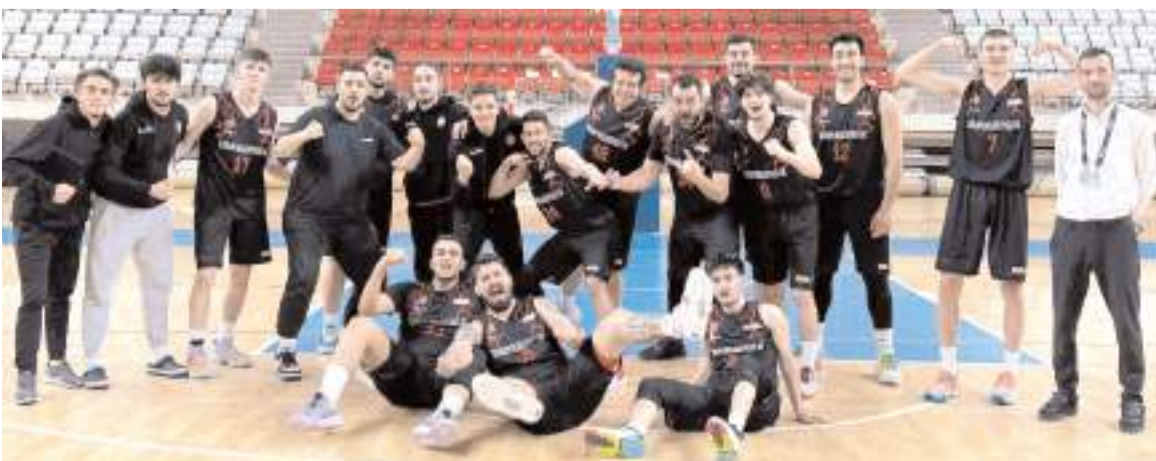
Çorum Belediyespor basketbol takımı Erzincan deplasmanında kazandığı maçın ardından galibiyet pozunu

Kızlarda ise Çorum Cumhuriyet Ortaokulu ile Kırıkkale Şehit Mustafa Uğurelli, Amasya Yeşilirmak, Kırşehir Merkez Yunus Emre, Ordu Atatürk, Sivas Mehmet Akif İnan, Yozgat Erdoğan M. Akdağ, Samsun Atatürk, Sinop Atatürk ve Ankara birincisi-Batkent Şehit Erdal Çetin ile ikincisi Tarhuncu Ahmet Paşa Ortaokulu mücadele edecek.