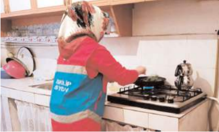
Günlük işlerini kendi başlarına idame ettiremeyen vatandaşların ev temizliği, kişisel bakımları, yemek yapımı gibi ihtiyaçları karşılanıyor.