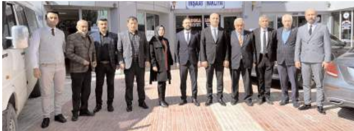
Milliyetçi Hareket Partisi heyeti ÇESOB'u ziyaret etti.