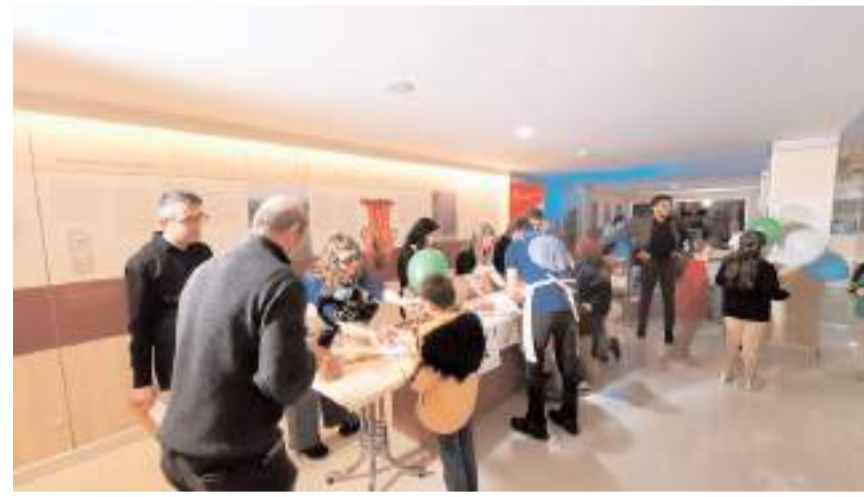
Boğazkale İlkokulu'ndan 50 öğrenci, Boğazkale Müzesi'ne konuk oldu.

Kültür ve Turizm Bakanlığınca yürütülen "Köy Sohbetleri Projesi" kapsamında da Kaçakçı-