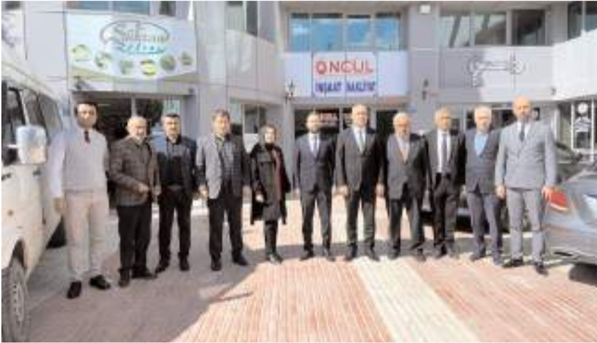
Milliyetçi Hareket Partisi heyeti ÇESOB'u ziyaret etti.