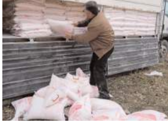
Hayırseverler tarafından alınan unlar ihtiyaç sahiplerine dağıtıldı.