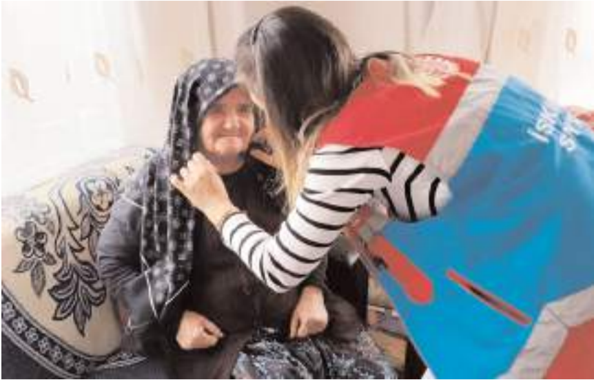
Sosyal Yardımlaşma ve Dayanışma Vakfı personeli yaşlıların ihtiyaçlarını gideriyor.