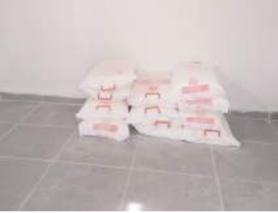
Unlar muhtarlığın deposunda muhafaza ediliyor.

ile çimler üzerine unlar görülmektedir. Çuval içerinde olan unlar depomuzda yerleştirilmiş ve ihtiyaç sahiplerine dağıtımına başlanmıştır. Unlarda insan sağlığına olumsuz etkileyecek herhangi bir bozulma da olmamıştır" ifadelerini kullandı.