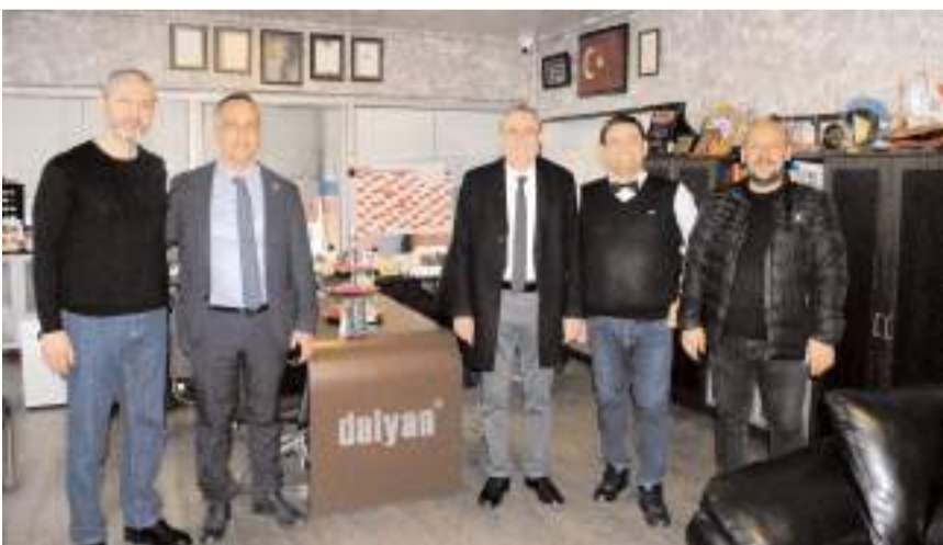
Çöphüseyinoğlu, esnafların sorun ve taleplerini dinledi.