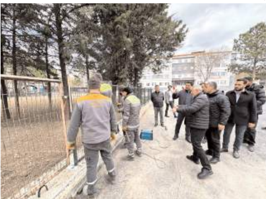
Başkan Aşgın, çalışmaların son durumu hakkında bilgiler aldı.