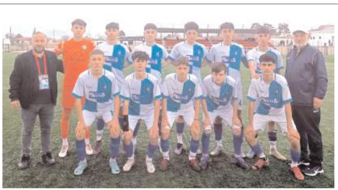
Gençlerbirliği dördüncü maçlar sonunda ligde maç fazlası ile liderliğe yükseldi