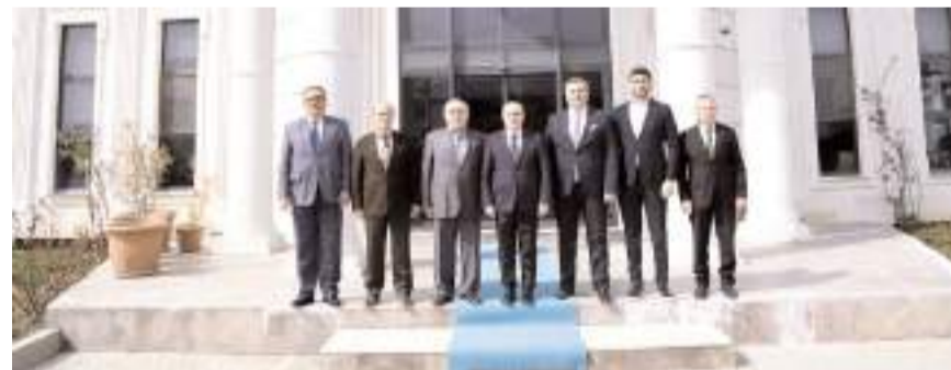
Ziyaretin sonunda toplu fotoğraf çekinildi.