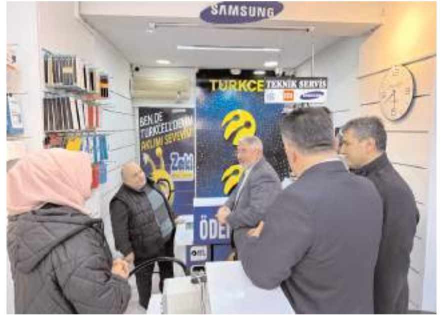
Başkan Aşgın, esnafların sorun ve taleplerini dinledi.