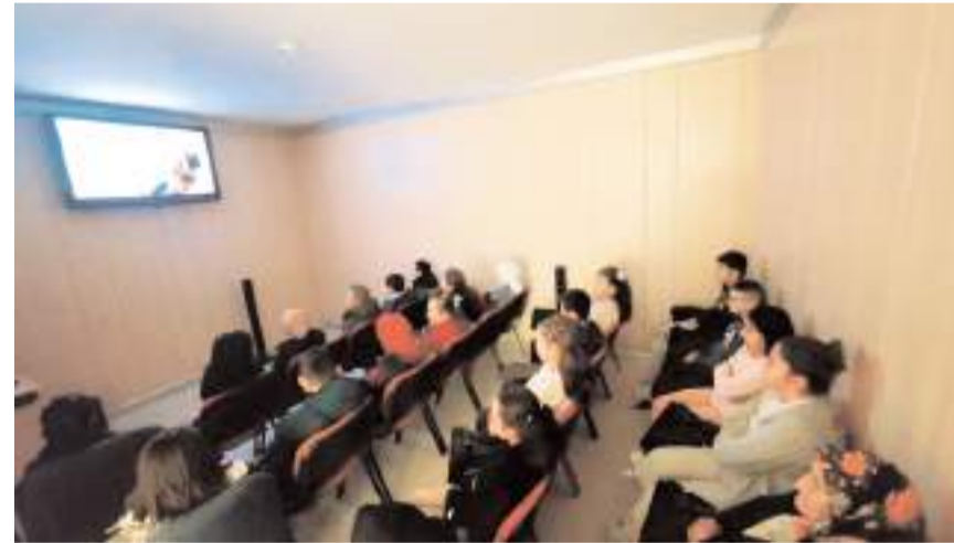
Öğrenciler, "kültürel miras" temalı Hacivat-Karagöz gösterisini izledi.