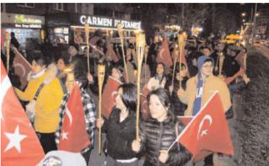
Partililer, ellerinde Atatürk resimleri ve Türk bayrakları ile sloganlar eşliğinde yürüdüler.