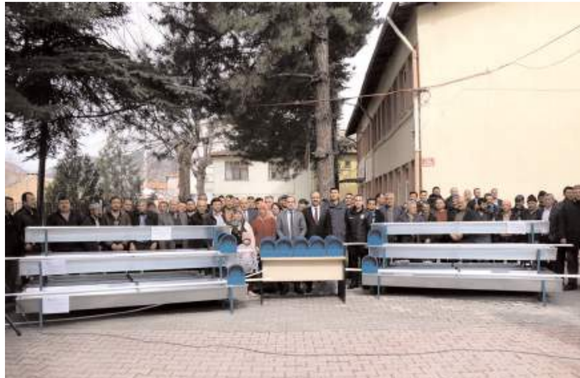
Törenin sonunda toplu hatıra fotoğrafı çekildi.

Tören hak sahibi çiftçilere suluklarının teslim edilmesi ile sona erdi. (Haber Merkezi)