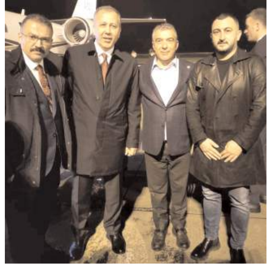
Ahlatıcı Çorum FK Başkanı Oğuzhan Yalçın, İçişleri Bakanı Ali Yerlikaya, AK Parti Milletvekili ve Alagöz Holding Başkanı Cantürk Alagöz ile birlikte görüşüyor

rın çok üzücü ve düşündürücü olduğunu belirterek bu konuda üzerlerine düşeni yapmaya hazır olduklarını söyledi.