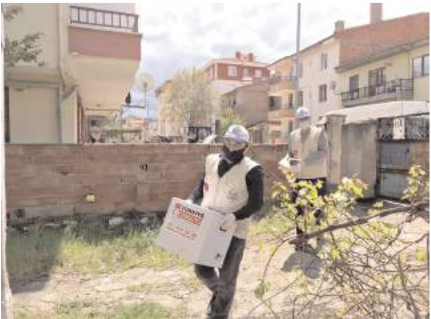
Cansuyu Derneği Çorum Şubesi Ramazan'da yardımlarına devam ediyor.

Vatandaşlar tarafından gerçekleştirilecek bağışlara ilişkin belirlenen rakamlar da açıklanırken, Gazze için bir kişilik fitre ve fidiye bağışlarında alt limit 400 TL, bir kişilik iftar 225 TL, bir adet kumanya bin 900 TL olarak belirlendi. Türkiye ve diğer bölgelerde belirlenen rakamlar ise, bir kişilik fitre ve fidiye bağışlarında alt limit 130 TL, bir kişilik iftar 90 TL, bir adet kumanya 700 TL olarak açıklandı. Bağışta bulunan hayır severler derneğe Saat Kulesi yanındaki standından, temsilcilik yada cansuyu.org.tr adresinden ulaşabilirler. (Haber Merkezi)