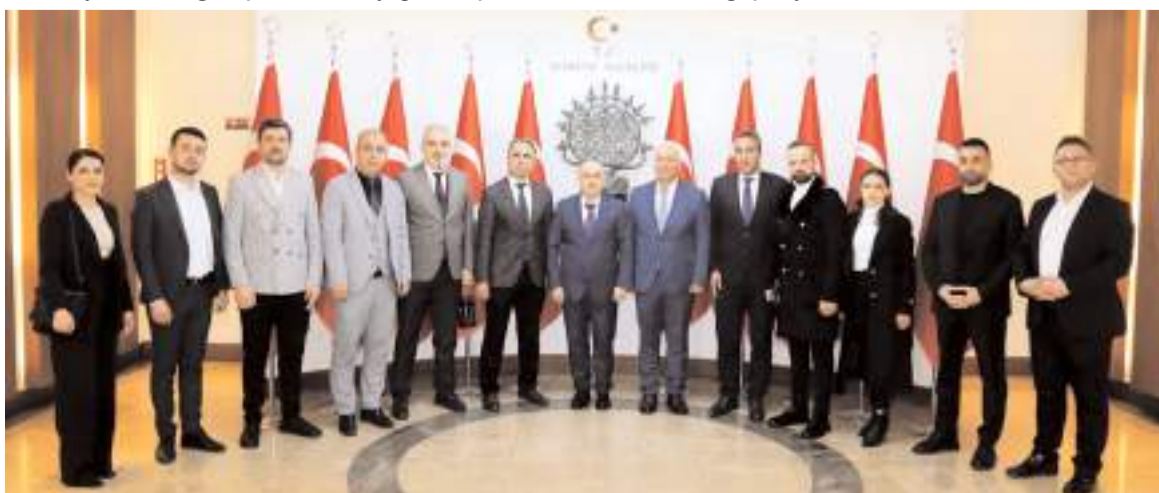
Ziyaretin sonunda günün anısına toplu fotoğraf çekinildi.