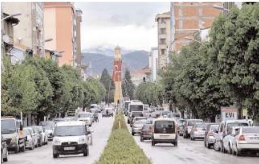
Çorum'da trafiğe kayıtlı araç sayısı şubatta ocak ayına göre artış gösterdi.

Şubat ayında trafiğe kayıtlı araç sayısı Samsun'da 460 bin 655, Tokat'ta 220 bin 248, Amasya'da ise 143 bin 416 olarak gerçekleşti. (Haber Merkezi)