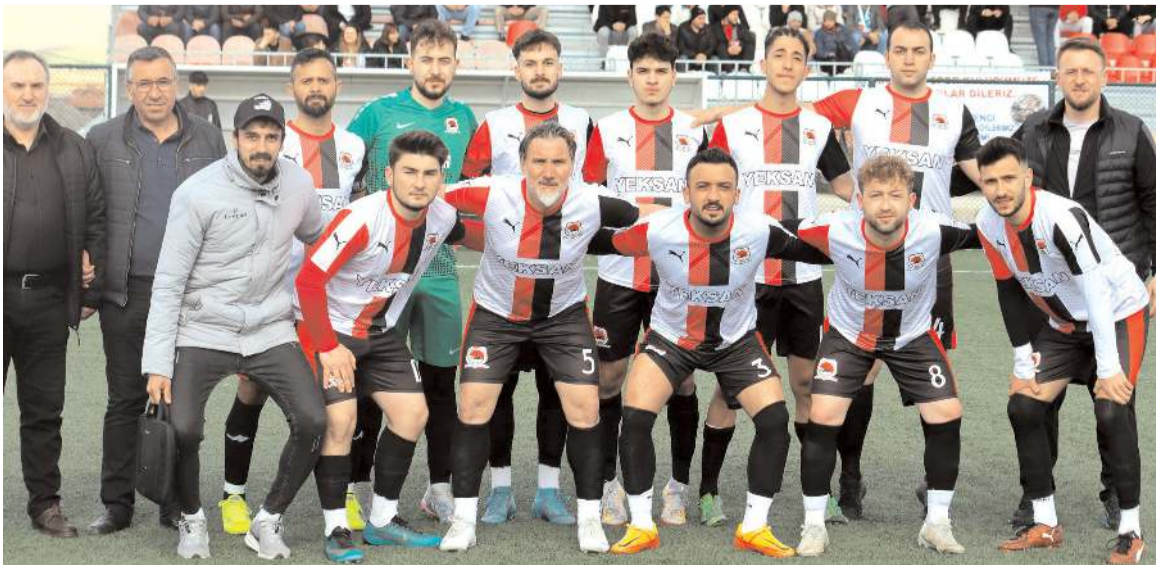
Mecitözü Gençlerbirliği üst üste iki maçı kazanarak grupta liderliğe yükseldi

Ligde bu hafta sonu yerel seçim nedeni ile maç olmayacak. 2. Amatör Küme'de ilk yarı 7 Nisan pazar günü oynanacak maçlarla sona erecek.