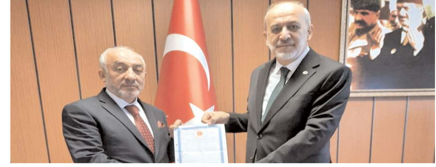
Emekli ikramiyesiyle aldığı arsasını bağışladı * HABERİ 4'TE