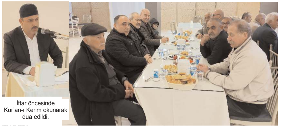
İftar öncesinde Kur'an-ı Kerim okunarak dua edildi.