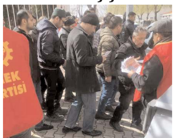
EMEP Çorum İl Örgütü, seçim çalışmaları kapsamında Organize Sanayi Bölgesi'nde bulunan işçilere bildiri dağıttı.

Emek Partisi (EMEP) Çorum İl Örgütü, seçim çalışmaları kapsamında Organize Sanayi Bölgesi'nde bulunan işçilere yönelik bildiri dağıtımını gerçekleştirdi.