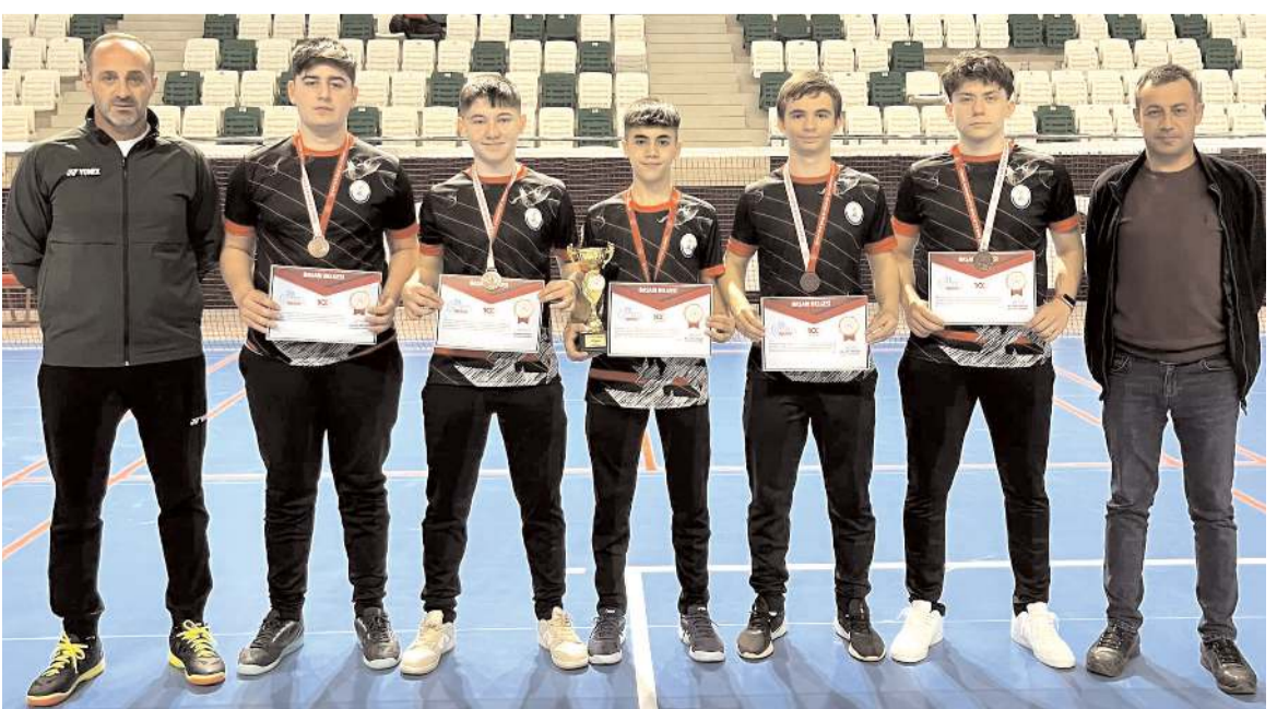
Türkiye üçüncüsü Osmancık Cumhuriyet Anadolu Lisesi ödül töreni sonrasında öğretmen ve idarecileri ile