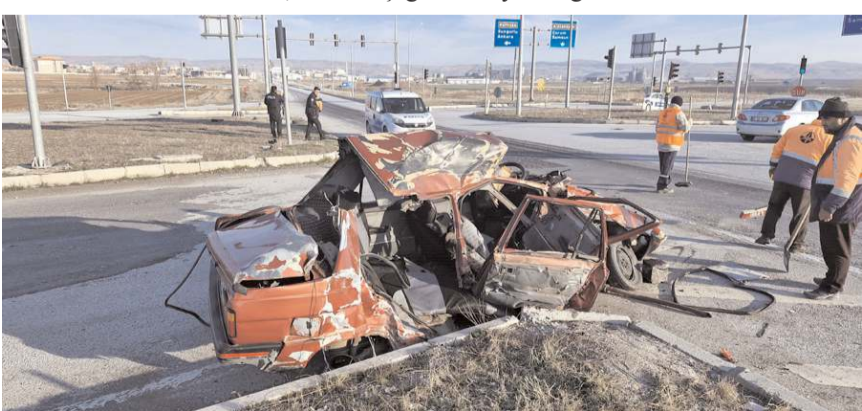
Kazada otomobil hurdaya döndü.