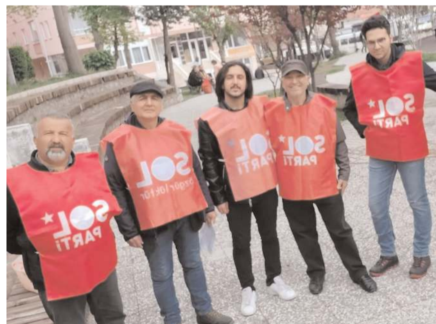
Sol Partililer, başta Cumartesi Pazarı olmak üzere kentin farklı bölgelerinde bildiri dağıttı.

Belediye Meclisi üyeliğinde Sol Parti'ye oy verme çağrısı yapan partililer, "Haklarımız, özgürlüklerimiz için mücadeleden başka yol yok. Mücadelede devam, şimdi daha kararlı, daha ısrarlı, birleşerek ve örgütlenecek. Koltuk kapmaca oynayan, kişisel çıkar peşinde koşan düzen partilerine boş ver. Devrimciler var. AKP'ye karşı 21 yıllık mücadelenin onurunu taşıyan, yılmayan,