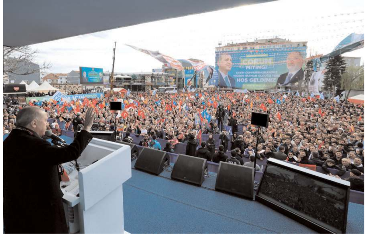
Cumhurbaşkanı Erdoğan Kadeş Meydanı'nda Çorumlulara seslendi.