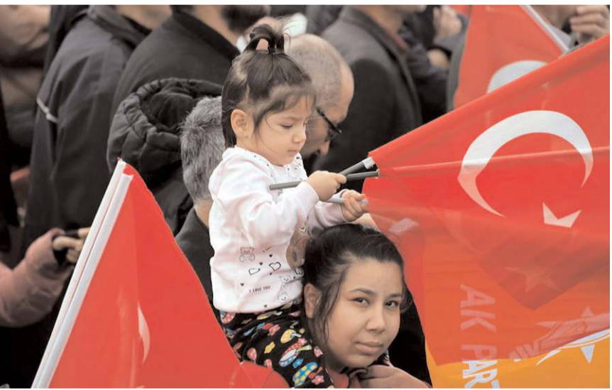
Erdoğan'ın görmek isteyen küçük çocuk annesinin omzuna çıktı.