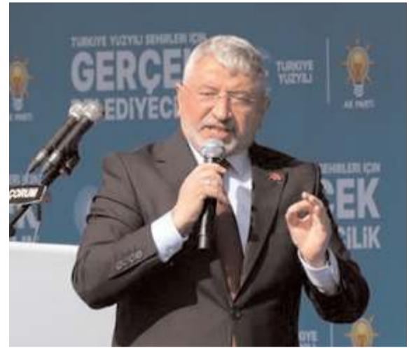
Belediye Başkanı Halil İbrahim Aşgın

len Ferhat gibi 53 km'den suyu getirdik. Hiçbir hasta yakını bankalarda hastasını beklemesin diye Refakatçi Misafirhanesi'ni hizmete sunduk. Çorum Belediyesi olarak 255 km asfalt döktük. Ayrıca 110 bin metrekare bordur taşı döşedik. Büyükşehir olmamıza rağmen bütün ilçelere hizmet götürdük. Ço-