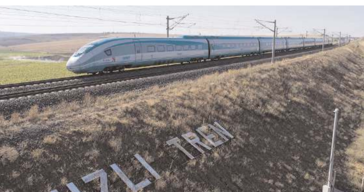
Cumhurbaşkanı Erdoğan hızlı tren projesinde en kritik aşamamın geçildiğini söyledi.

■ Cumhurbaşkanı ve AK Parti Genel Başkanı Recep Tayyip Erdoğan, miting de Çorumluların yıllardır beklediği hızlı tren projesiyle ilgili konuştu. Erdoğan, hızlı tren projesinde en kritik aşamaya geçildiğini söyledi.