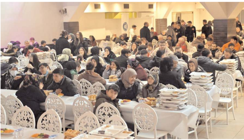
Belediyenin İftar Çadırı bu Ramazan'da Afra Düğün Salonunda kuruluyor.

Her yıl olduğu gibi bu yıl da Çorumlu hayırseverlerin desteğiyle Ramazan ayı süresince hizmet verecek iftar çadırı yemekleri ve sıcak ortamıyla büyük beğeni topluyor. Her gün bir hayırsever vatandaşın katkısı verdiği iftar çadırını bu sene hava koşulları nedeniyle bir düğün salonunda kuruyor.