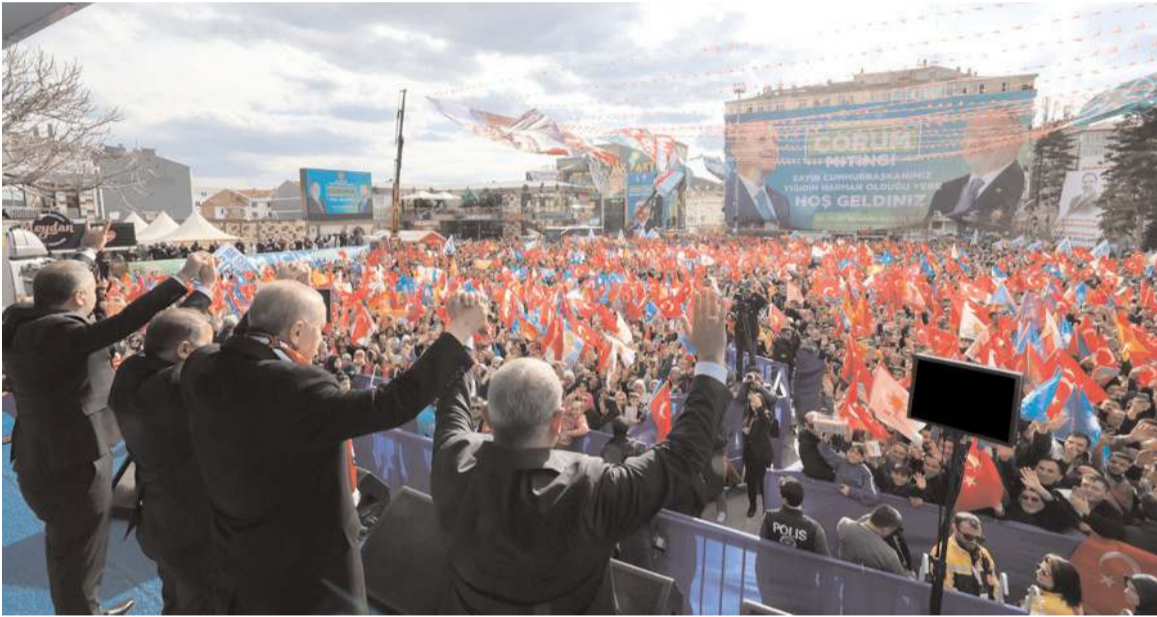
Cumhurbaşkanı Erdoğan, coşkulu kalabalığa böyle hitap etti.