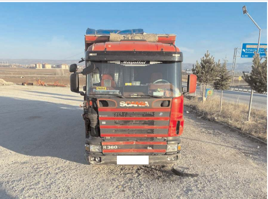
Kaza, Zile kavşağında meydana geldi.

Kazayla ilgili inceleme başlatılırken, otomobil ile kamyonun çarpıştığı feci kaza güvenlik kamerasına yansdı. Görüntülerde otomobilin kavşaktan geçiş yaptığı sırada kamyonla çarpıştığı görülüyor. Çarpmanın etkisi ile otomobil metrelerce savruluyor. (İHA)