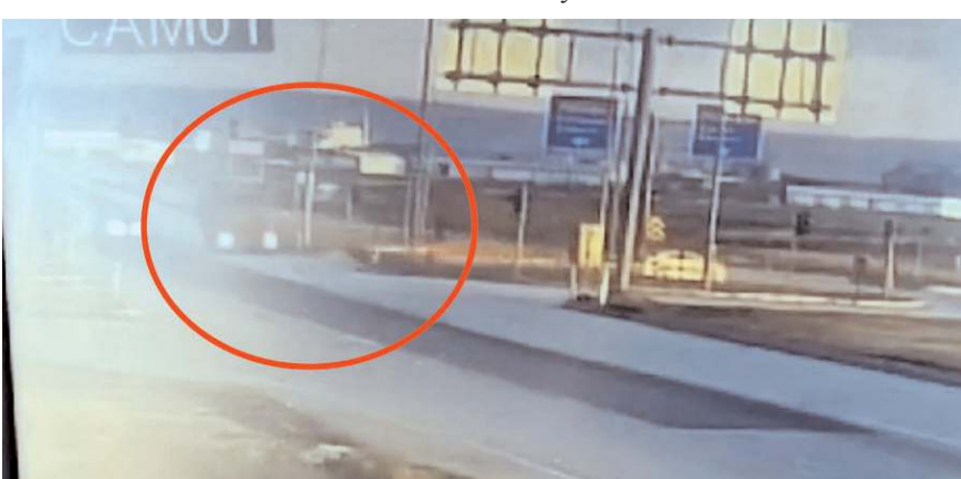
Kaza anı kameralara yansdı.