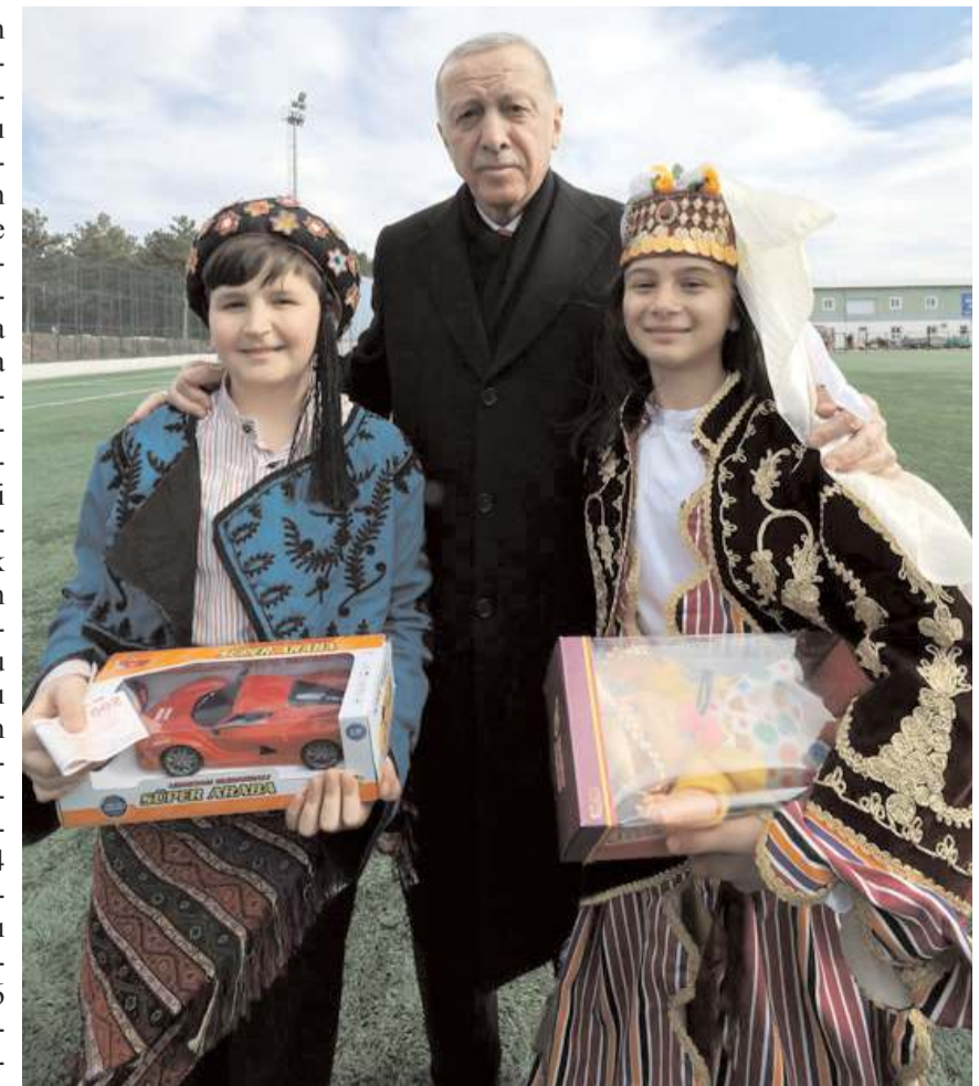
Cumhurbaşkanı Erdoğan karşılama töreninde öğrencilerle fotoğraf çekildi.