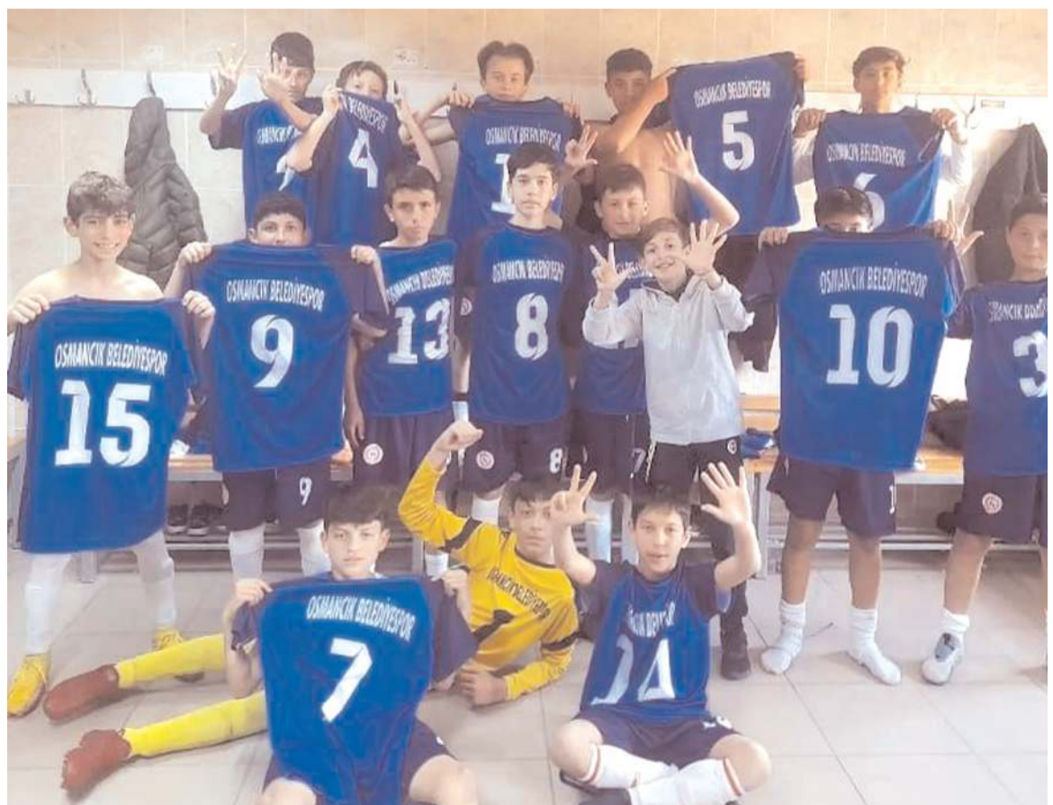
Osmaniçk Belediyesi spor U 13 takımı evinde farklı kazandığı maçın ardından soyunma odasında galibiyet pozunu

19-26 Mart tarihlerinde Antalya'da yapılan ve 33 ülkeden 850 sporcunun mücadele ettiği Trisome Games 2024 Dünya Şampiyonası Down Sendromlular Atletizm milli takımında yer alan Zübeyde Hanım Özel Eğitimspor'dan Enes Borucu ilk kez katıldığı Dünya Şampiyonasında 800 metre yürüyüşte dördüncülüğü cirrit atmada ise dünya beşinciliğini kazandı.