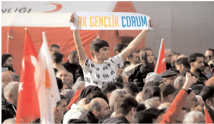
Mitinge çok sayıda genç katıldı.