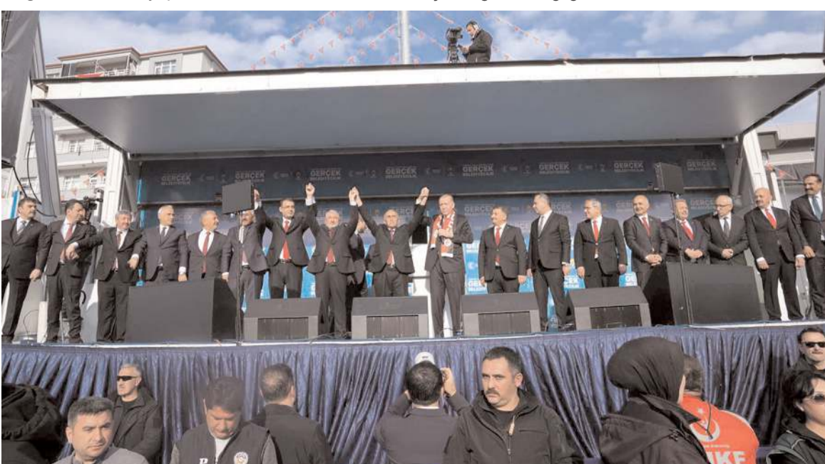
Cumhurbaşkanı Erdoğan, Çorum ve ilçe belediye başkan adaylarını sahneye çağırarak birlikte poz verdi.