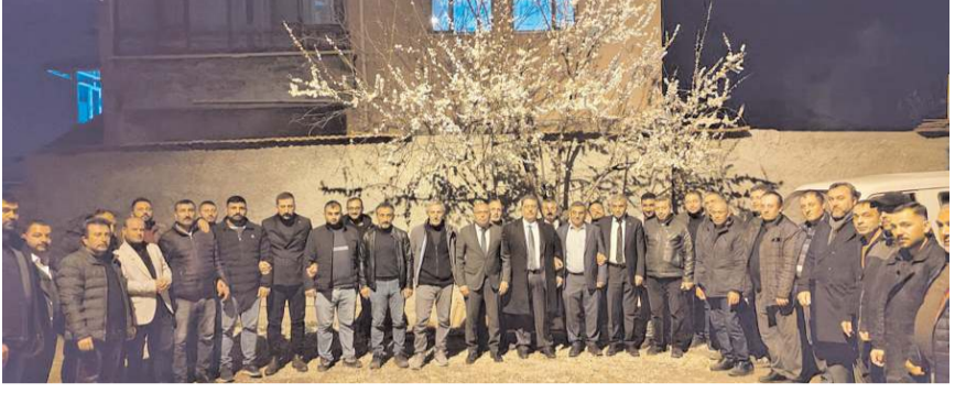
MHP İl Genel Meclis Üyesi ve Belediye Meclis Üyesi Adayları köylerde seçim çalışmalarına devam etti.

MHP olarak adaletli ve eşit hizmet anlayışını şiar edindiklerini belirten İl Genel Meclis Üyesi Adayları, köylerin kalkınabilmesi ve köylerdeki refah seviyesinin yükselebileceğine adına MHP'nin mecliste güçlü bir şekilde yer alması gerektiğini vurguladılar. (Haber Merkezi)