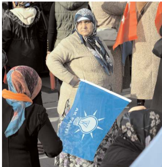
Elinde AK Parti bayrağı ile Cumhurbaşkanı Erdoğan'ı bekleyen bir vatandaş...

Onbinlerce vatandaş Cumhurbaşkanı Recep Tayyip Erdoğan'a sevgi gösterisinde bulundu