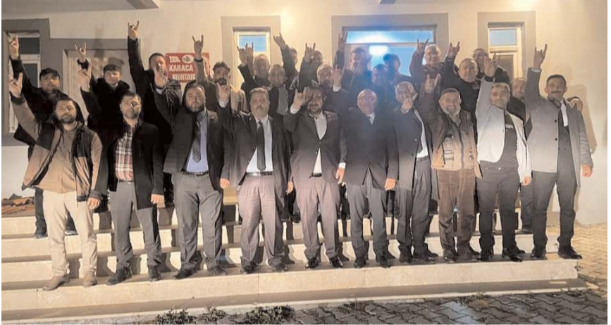
MHP İl Genel Meclis Üyesi ve Belediye Meclis Üyesi Adayları köylerin sorun ve taleplerini dinledi.