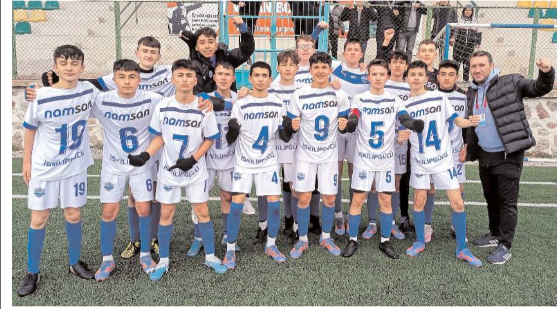
İskilipgücüspor dördüncü maçında kazanarak play-off iddiasını artırarak devam ettirdi

Haftanın üst sıraları yakından ilgilendiren maçında Mimar Sinan Gençlikspor play-off mücadelesi veren Osmaniçkücüspor deplasmanında 7-0 gibi farklı skorla galip gelerek dördüncü maçından da üç puanla ayrıldı. Haftanın diğer kritik maçında ise İskilipgücüspor sahasında konuk ettiği Kültürspor önünde tek golle üç puanı aralar ayrıldı ve play-off yarışına devam dedi. Ligde galibiyeti bulunmayan iki takım Buharaspör ile Sungurluspor arasındaki maç ise başladığı gibi 0-0 beraberlik ile bitti ve iki takımda ilk puanlarını aldılar.