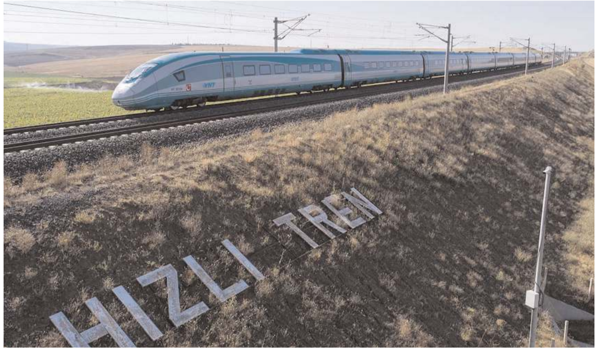
Cumhurbaşkanı Erdoğan hızlı tren projesinde en kritik aşamamın geçildiğini söyledi.

Program sonunda Erdoğan, Çorum ve ilçe belediye başkan adaylarını sahneye çağırarak birlikte poz verdi.