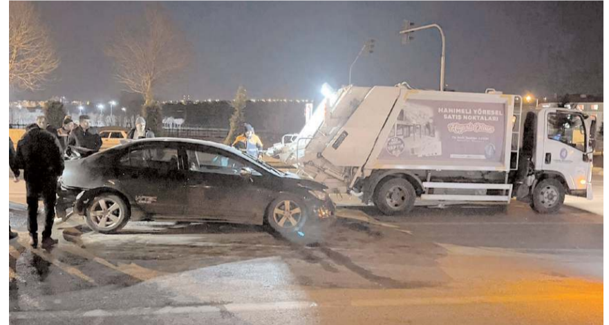
Kaza İnönü Caddesi'nde meydana geldi.

Kaza nedeniyle kapanan yol, araçların çekici yardımıyla kaldırılmasının ardından tekrar trafiğe açıldı. (AA)