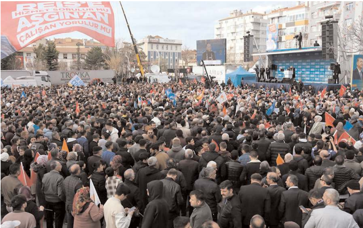
Binlerce Çorumlu sabahın erken saatlerinden itibaren alanı doldurdu.