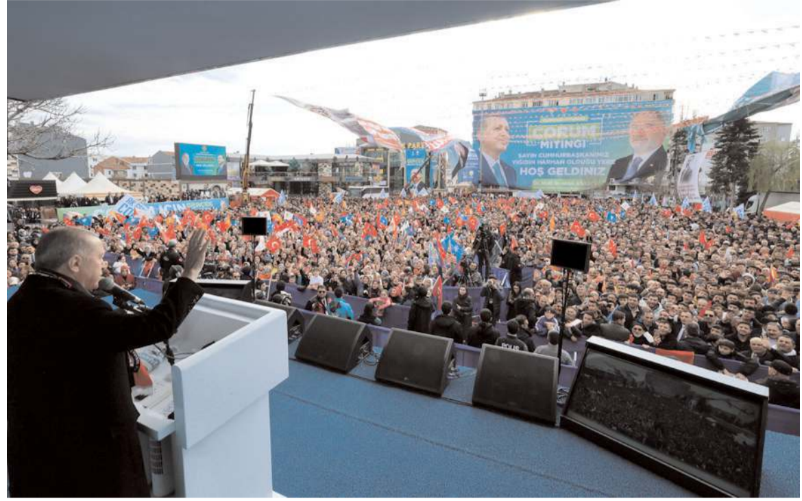
Cumhurbaşkanı Erdoğan Kadeş Meydanı'nda Çorumlulara seslendi.

Ülke gündemine de ilişkin açıklamalarda bulunan Cumhurbaşkanı Erdoğan, şu ifadeleri kullandı; "Bizim sadece şu son 10 yılda yaşadıklarımızı bir başka ülke yaşasa, bırakın bizim gibi istikrarını, barışını, büyümesini sürdürmeyi; yerle yeksan olmaktan kendini kurtaramazdı. Avrupa'sı ve Amerika'sı dâhil hiç kimse, bu kadar kısa sürede bu derece zorlu mücadeleleri başarıyla veremezdi. Ama biz tüm sıkıntıları göğüsledik, tüm badireleri atlattık, projelerimizi hayata geçirerek hedeflerimizi doğru emin adımlarla yürütdük. Yani milletçe hem şeytan taşladık, hem de tavafımızı yaptık. Milletimizin birlik ve beraberliğine hâle getirmedi. İnsanımızın işini, aşını, istihdamını korumasını sağladık. Memurun, işçinin, emeklinin aylıklarında yüzde 50'ye varan oranlarda artışa gittik. Emeklimizin sıkıntılarını hafifletmek amacıyla tek seferlik 5 bin lira ödemesi, bayram ikramiyelerinin yüzde 50 artırılması, banka promosyonlarının yükseltilmesi gibi çeşitli çözüm yollarını devreye aldık. Aylık miktarna göre 8 ila 12 bin liraya yükselen promosyon ödemeleri için kamu bankalarımız başvuruları almaya başladı. Ramazan Bayramı ikramiyesini hesaplara gelecek hafta yatırıyoruz. Depremin ekonomimize yüklediği 104 milyar dolarlık ilave fatüraya rağmen bu adımları attık. 53 binden fazla canımızı kaybettiğimiz 6 Şubat depreminin ardından inşa çalışmalarına sızatle başlayarak, vatan-