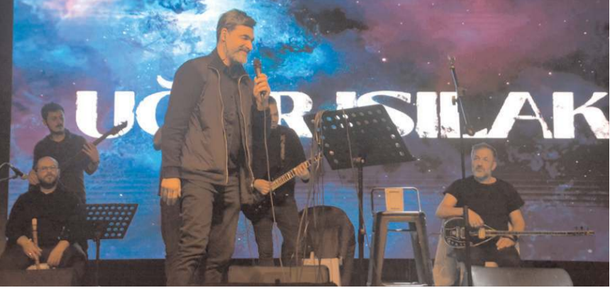
Uğur Işılak konserde eserlerini seslendirdi.