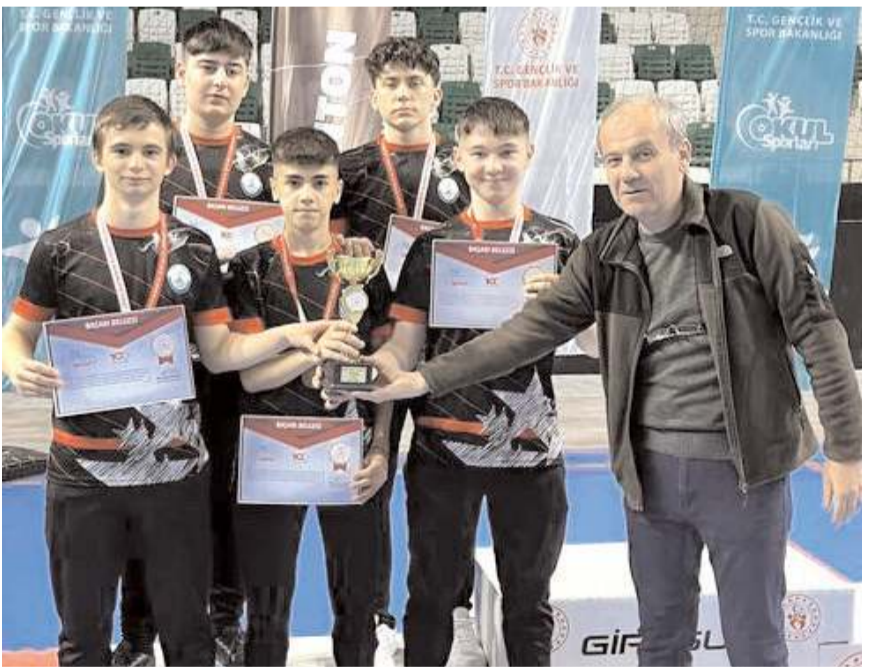
Osmancık Cumhuriyet Anadolu Lisesi Türkiye üçüncülüğü kupasını alırken