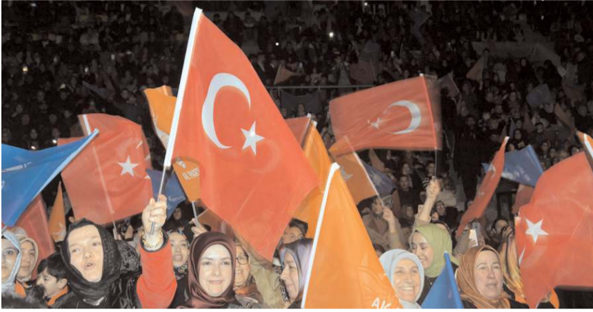
Konsere ilgi yüksek oldu.