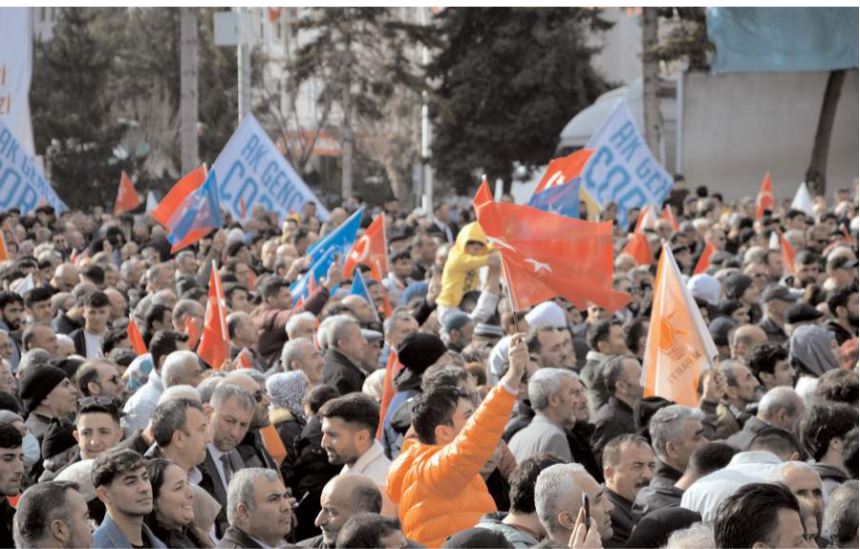
Binlerce vatandaş Erdoğan'a sevgi gösterisinde bulundu.

Yoğun kalabalık zaman zaman izdihama neden oldu. Vatandaşlar yoğunluk nedeniyle miting alanına girmekte zorluk yaşadı.