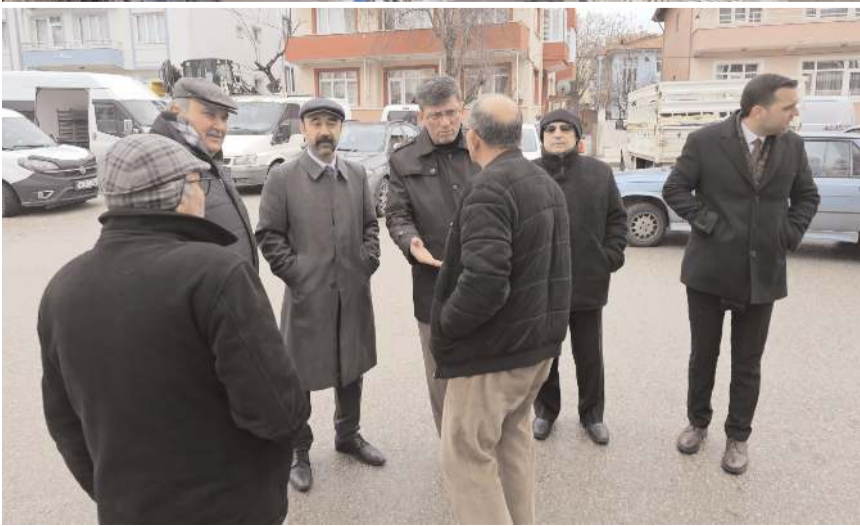
İYİ Parti heyeti pazar ziyaretinde vatandaşlarla sohbet etti.