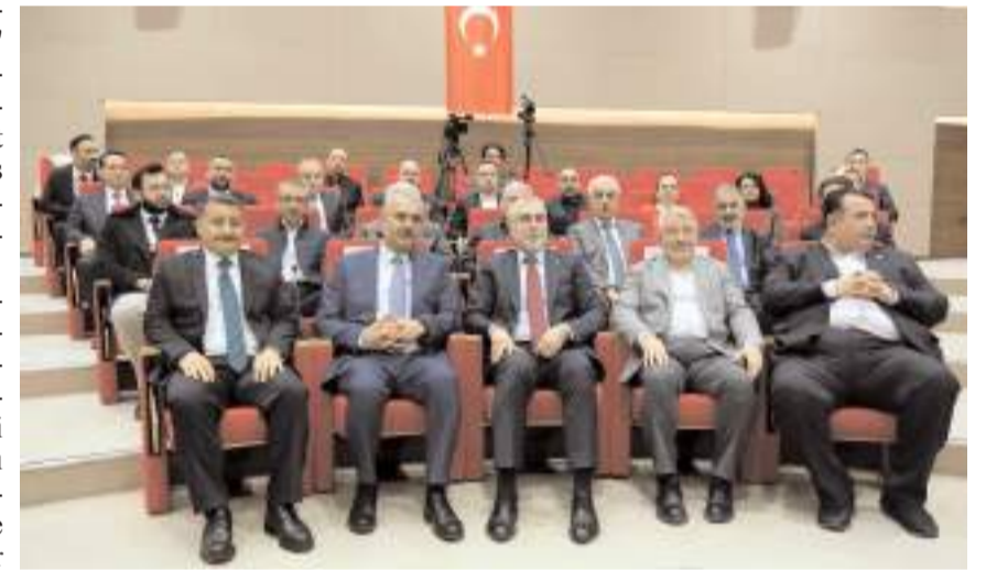
Çalışma ve Sosyal Güvenlik Bakanı Vedat Işıkhan, protokol üyeleri ile bir araya geldi.