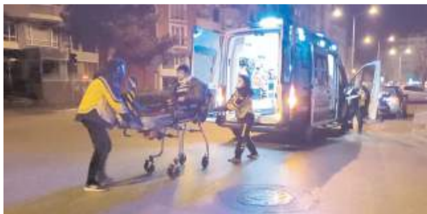
Yaralılar ilk müdahalenin ardından hastaneye kaldırıldı.

Çorum'da otomobil ile motosikletin çarpışması neticesinde meydana gelen trafik kazasında 2 kişi yaralandı.