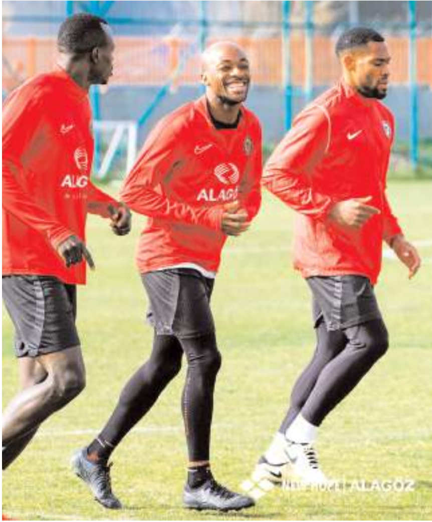
Kirmızı Siyahlı takım antrenmanında futbolcuların moralli olduğu gözlemlendi