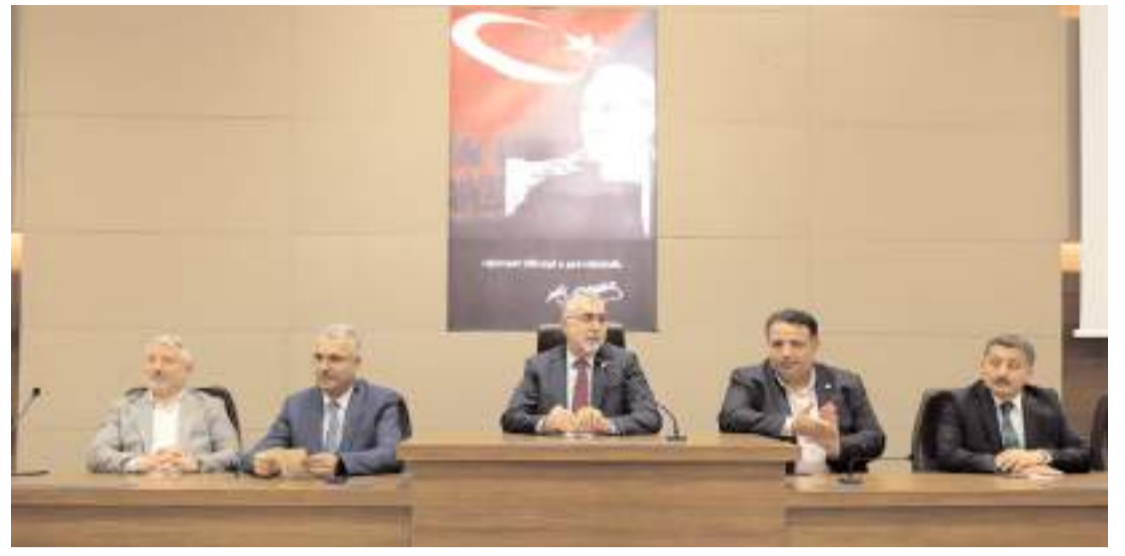
Çalışma ve Sosyal Güvenlik Bakanı Vedat Işıkhan, iş dünyasının temsilcileri ile buluştu.