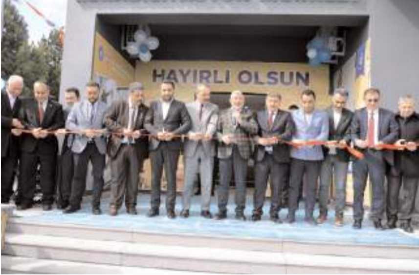
Açılış kurdelesini protokol üyeleri kesti.