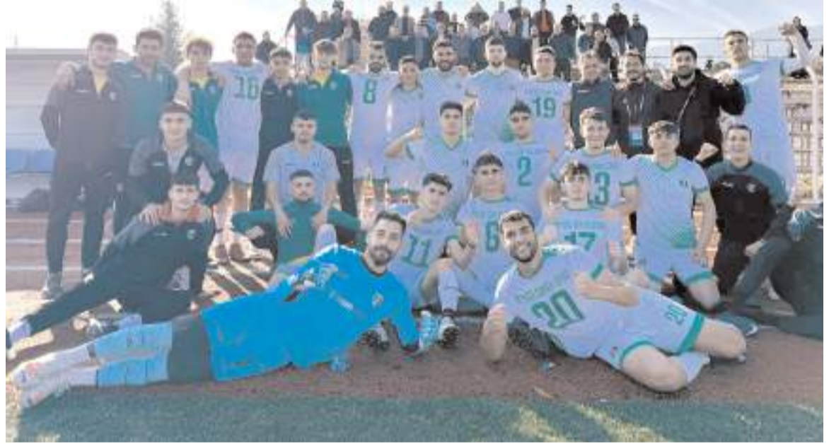
Mimar Sinanspor takımı geçte olsa şampiyonluğu tescil edildi ve yeni sezonda BAL'da ilimizi temsil edecek

Bu karar ile birlikte Mimar Sinan Gençlikspor'un şampiyonluğu resmen onaylandı.