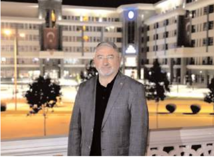
Dr. Halil İbrahim Aşgın

Başkan Aşgın, "Doğup büyüdüğüm, havasını teneffüs ettiğim, her mahallesini her sokağımı, her caddesini karşı karşıya bildiğim güzel memleketim Çorum için yaptıklarımı ve yapacaklarımı yeniden aday olarak karşınızdayım. Bundan 5 yıl önce büyük bir teveccühle Şehr-ül Emin görevini şahsıma verdiniz ve beni başkan seçtiniz. Bu süre zarfında emanetinize hallettiğimden çok şükür almınım akıyla yeniden huzurunuzdayım. 5 yıllık süre içinde farklı bir belediye başkanı olmak için büyük bir gayret gösterdiğimin hepiniz şahidisiniz. Parolamız tevazu, samimiyet ve gayretti. Bu düstur ile içinizden biri olarak, içinizden biri kalarak büyük bir coşkuyla hizmet ettik. Şehrin tamamını kucaklayarak, sizlerle el ele verdiğimizde neler yapılabileceğini çok şükür göstermiş olduk. Pandemi, depremden şuydu buydu demeden mazeret üretmeden yolumuza devam ettiğimizde, olmaz denilen pek çok meseleyi yağdan kıl çeker gibi çözdüğümüzü, şehrin önünü açtığımızı hepiniz gördünüz."