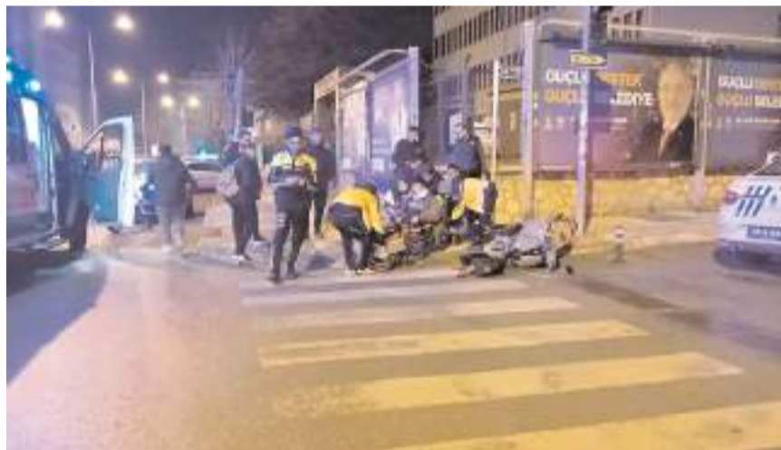
Kaza, Bahçelievler Mahallesi Bahabey Caddesi'nde meydana geldi.