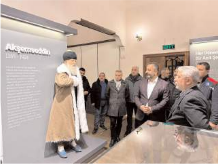
Şehir Müzesi, Veli Paşa Hanı içerisinde faaliyete başladı.