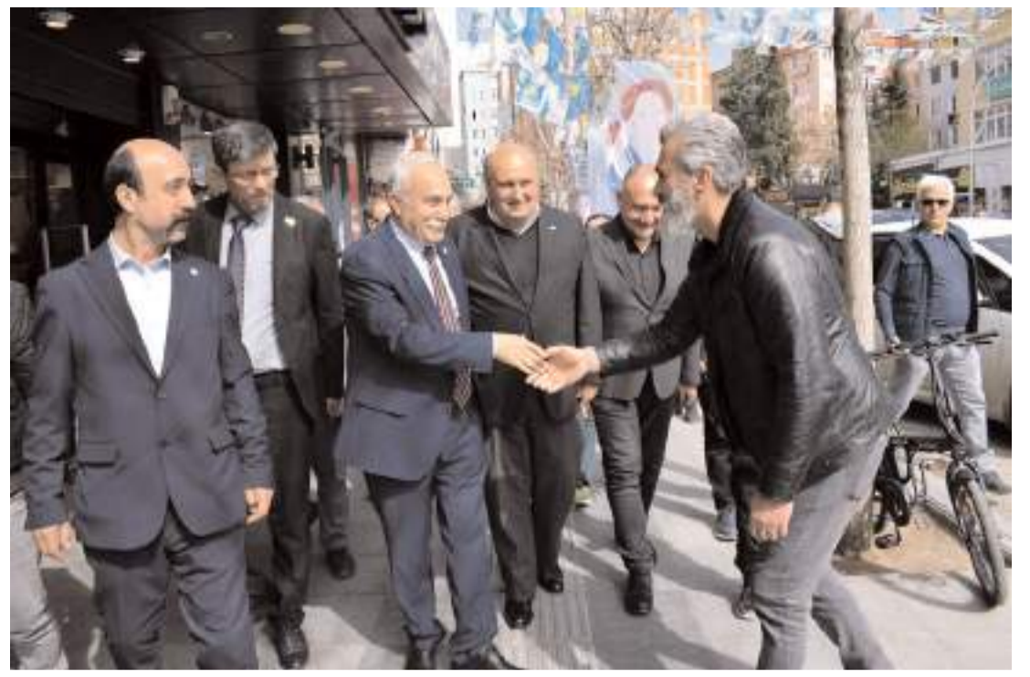
İYİ Parti Ankara Milletvekili Ahmet Eşref Fakıbaba, Çorum'da partinin seçim çalışmalarına katıldı.

İnanyorum ki, kendisinin saygın, güvenilir kişiliği, partili-partisiz tüm Çorumlu hemşhrilerimiz tarafından da bilinmekte, takdir edilmektedir. Yine inanyorum ki, merhum belediye başkanlarımızın izinde, çok başarılı bir belediye başkanı olacaktır." (Haber Merkezi)