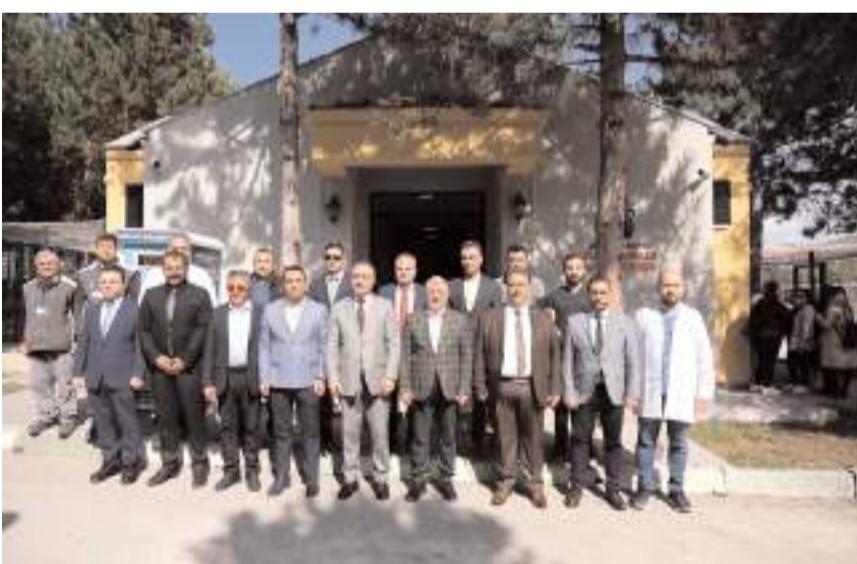
Hayvan Hastanesi Bahabey Çamlığı yanında açıldı.