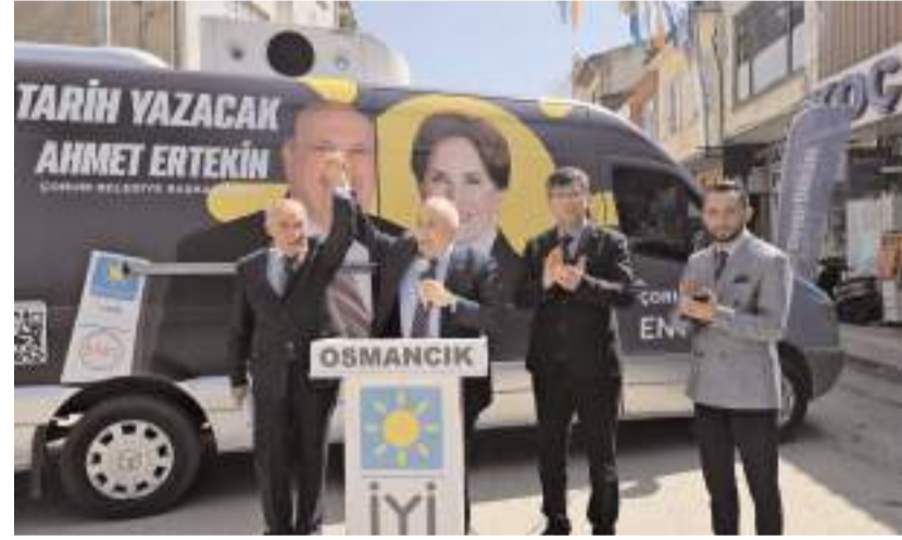
İYİ Parti Ankara Milletvekili Ahmet Eşref Fakıbaba, ilçelerde seçim çalışmalarına katıldı.