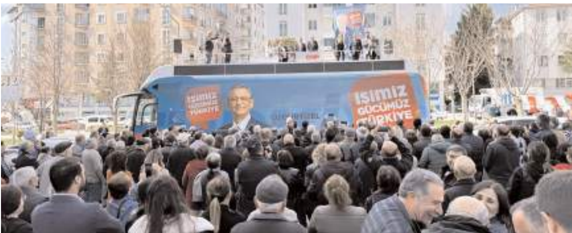
CHP Kadın Kolları Genel Başkanı Aylin Nazlıka, partililere seslendi.