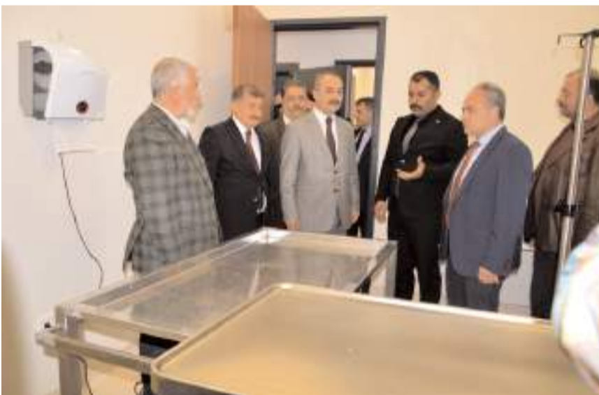
Davetliler hastaneyi gezerek faaliyetleri hakkında bilgi aldılar.