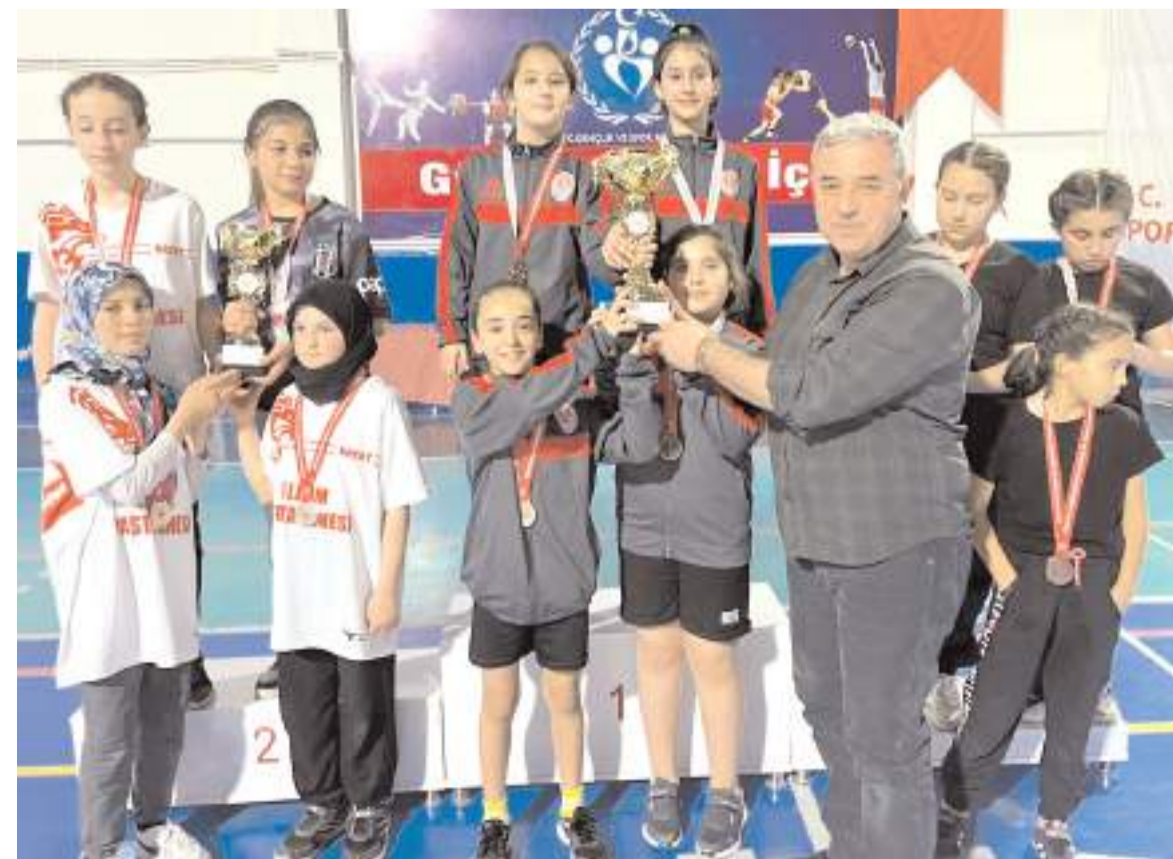
Küçük Kızlar Badminton'da mücadele eden ve dereceye giren üç okul takımı kupa töreni sonrasında toplu halde

Üç okulun mücadele ettiği il birinciliği sonunda dereceye giren okullara kupa sporculara ise madalyaları verildi.