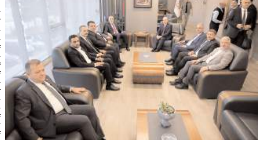
Çalışma ve Sosyal Güvenlik Bakanı Vedat Işıkhan, protokol üyeleri ile bir araya geldi.

kamu bankaları tutarları asgari olmak üzere promosyon miktarlarını güncelleyecekler. Biz, sağlam politikalarla emeklilerimize mümkün olan en iyi hizmeti vermeye gayret ediyoruz. 2002 yılında iktidara geldiğimizde, iflas noktasına gelmiş bir sosyal güvenlik ve sağlık sistemi devralmıştık. Bunu en iyi kıymetli emeklilerimiz hatırlar. Attığımız adımlarla, sürdürülebilir bir sosyal güvenlik sistemi inşa ettik. Sağlık sigortası kapsamında, ilaca ve tedaviye erişim noktasında dünyanın en ileri ülkelerinden biri haline geldik" dedi.