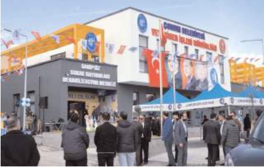
Hayvan Hastanesi Bahabey Çamlığı yanında açıldı.