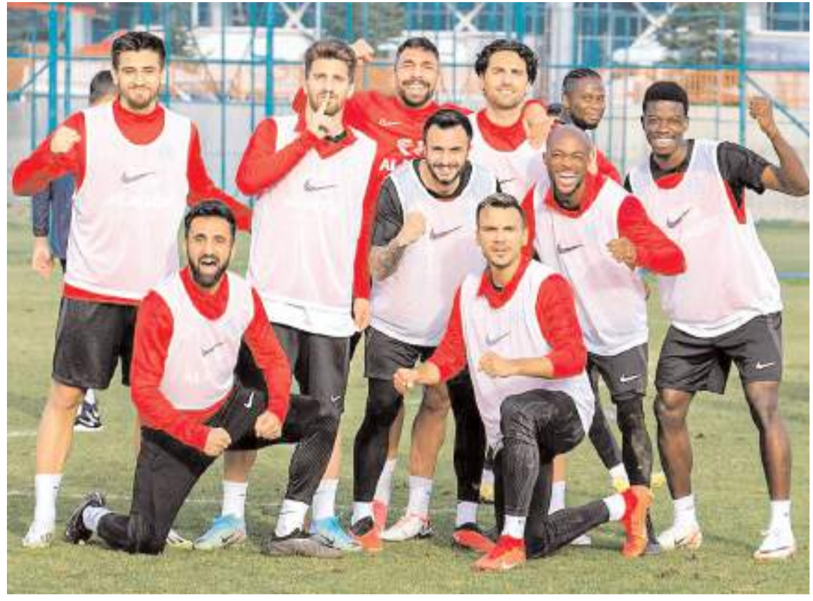
Kirmızı Siyahlı takımın antrenmanında turnuvaya kazanan takımın maç sonu geleneksel galibiyet pozunu

Lige verilen iki haftalık ara nedeni sonrasında futbolcularda yaşanan motivasyon düşüklüğünün hafta başından buyana devam eden çalışmalar ile