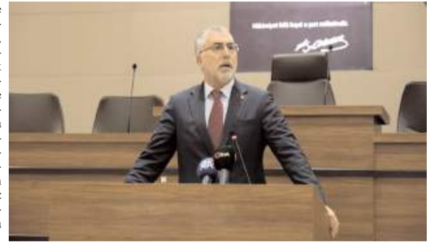
Çalışma ve Sosyal Güvenlik Bakanı Vedat Işıkhan, programda konuşma yaptı.

Emeklilere yönelik olarak başlatılan banka promosyonları ile ilgili de açıklamada bulunan Bakan Işıkhan, "Biliyorsunuz geçtiğimiz günlerde Cumhurbaşkanımız Sayın Recep Tayyip Erdoğan, emeklilerimize yönelik olarak başlattığımız promosyon ödemesi uygulamasının kamu bankalarında 2 katına çıkarılarak 8 ile 12 bin lira arasında olacağını duyurmuştu. Bunun dışında ölüm aylığı hak sahiplerine de 5 bin lira promosyon duyurusunu yapmıştık. Bu hafta pazartesi gününden itibaren de promosyonlar için başvurular almıştı. Bugün itibariyle kamu bankalarımız emeklilerimize promosyon ödemelerini yapmaya başladılar. Tüm emeklilerimize hayırlı uğurlu olsun. Bununla birlikte, Kamu bankaları haricinde diğer bankalarla da protokol imzalama sürecini tamamladık. Özel bankalar da,