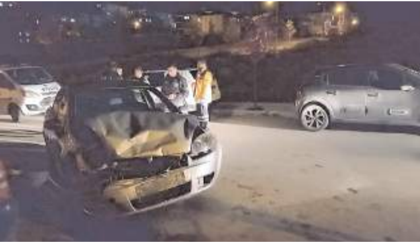
Kazada araçlarda maddi hasar meydana geldi.