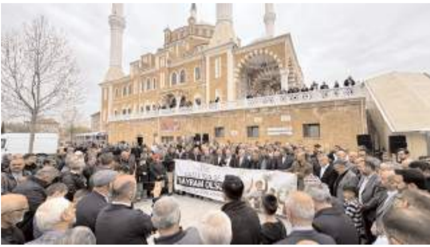
Eyleme katılım yüksek oldu.