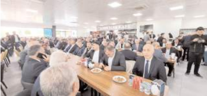
Bayramlaşma törenine katılım yüksek oldu.

Sungurlu'da bir asırdır devam eden toplu bayramlaşma geleneği bu yıl da sürdürüldü.