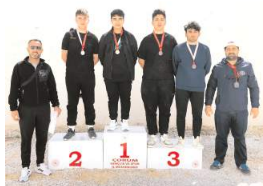
yapılacak. Bu önemli şampiyonada mücadele

le edecek sporcuların belirlendiği Bocce Petank İl Birinciliği küçüklük, yıldızlar, gençler ve büyükler kategorisinde yapılan müsabakalarda 42 sporcu mücadele etti. Müsabakalar sonunda kategorilerinde dereceye giren sporcular şu şekilde oluştu;