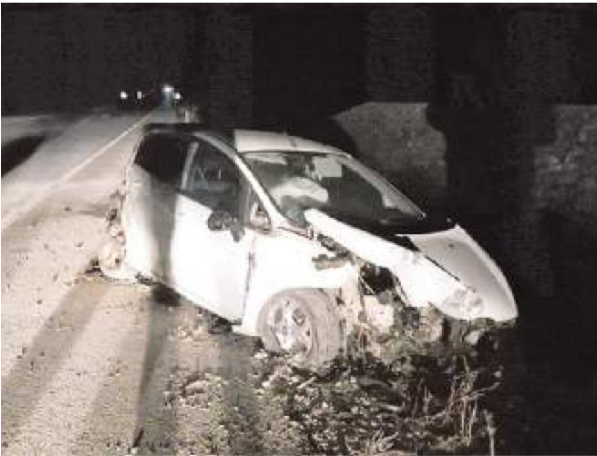
Kazada her iki araçta da maddi hasar meydana geldi.

Kaza ile ilgili soruşturma sürüyor. (İHA)