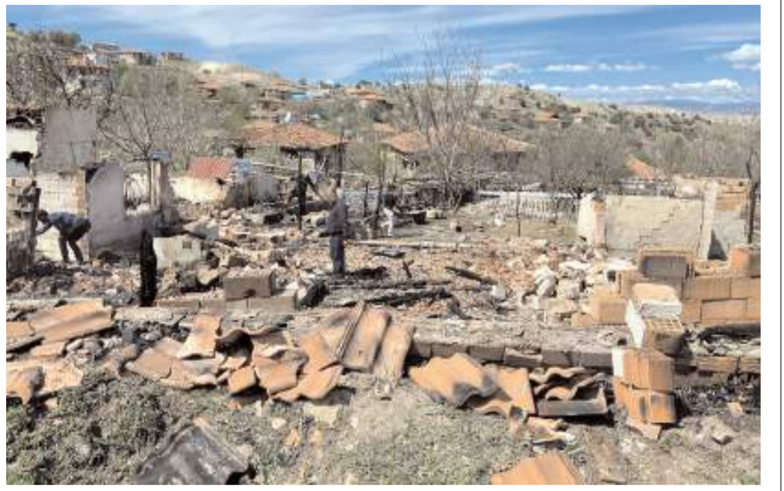
Olay Şahinkaya köyünde meydana geldi.

Boran, "Çok daha ekonomik bir teknik, çünkü ürün kayyumuz yok. Ekstra pahalı ekipmanlara, sistemlere ihtiyaç duymuyoruz. Kimyasal atıklar oluşmayacak. Dolayısıyla bu teknik atık artımı, atıkların yok edilmesi konularında bize fayda sağlayacaktır." ifadesini kullandı.(AA)