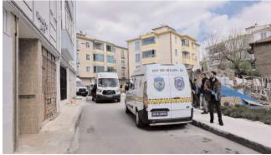
Olay Yavruturna Mahallesi Esnafevler 12. Sokak'ta bir evde meydana geldi.