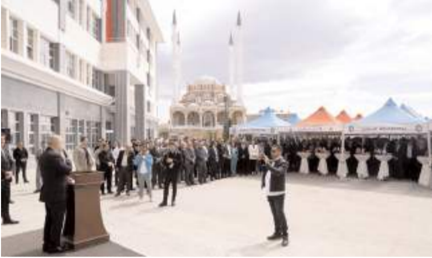
Bayramlaşma programına katılım yüksek oldu.