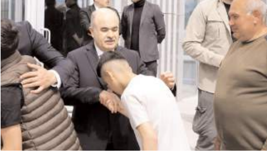
Bayramlaşma töreni Belediye önünde yapıldı.

CHP Çorum Milletvekili Mehmet Tahtasız ve Yeniden Refah Partisi Kocaeli Milletvekili Mehmet Aşla da programa katılanların bayramını kutlayarak İslam alemi, ülkemiz ve insanlık için hayırlara vesile olması temennisinde bulundular. (İHA)