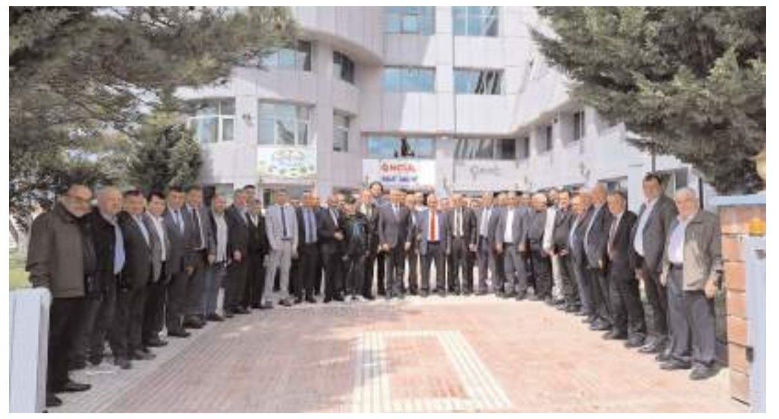
ÇESOB'ta yapılan bayramlaşmanın ardından toplu hatıra fotoğrafı çekildi.

Bazı şehit yakınlarının şehit kabirlerinin yanına Ramazan Bayramı dolayısıyla bayram şekeri bıraktığı görüldü. (AA)