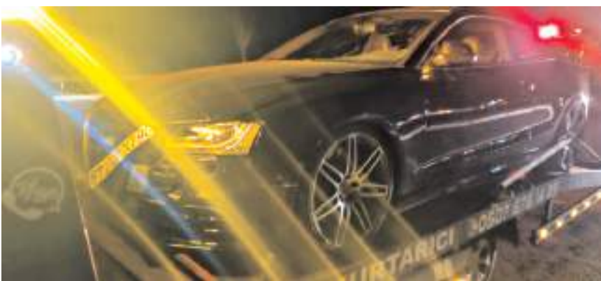
Kaza, Alaca-Sincan Köyü karayolunda meydana geldi.