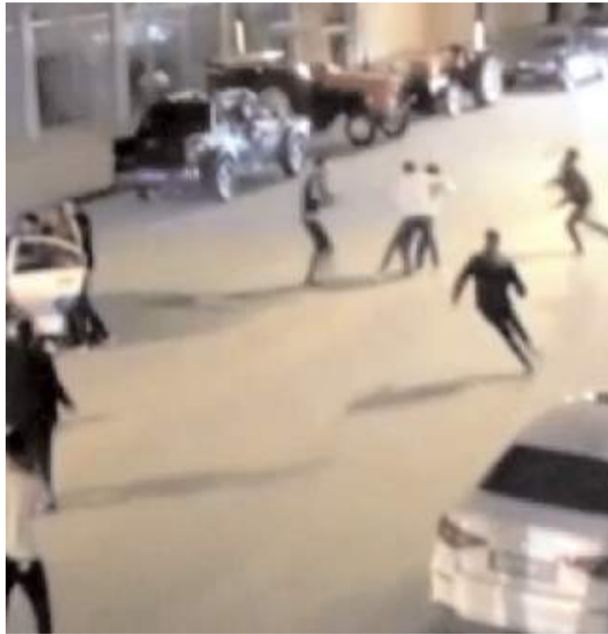
Olay Alaca'da, Zile Caddesi'nde meydana geldi.

Alaca'da yol verme tartışması neticesinde çıkan kavgada 3 kişi yaralandı, 6 kişi gözaltına alındı.