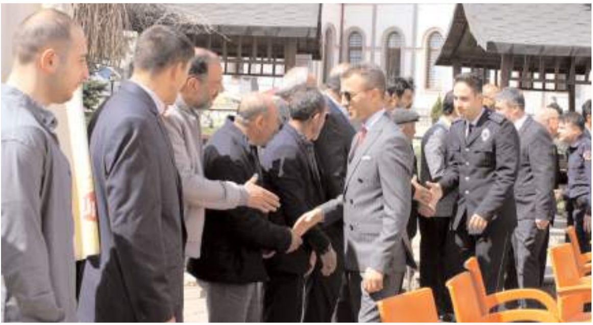
Alaca ilçe protokolü ile vatandaşlar bayramlaştı.