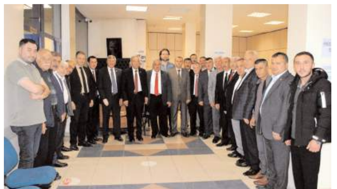
ÇESOB heyeti ilk olarak Çorum Esnaf ve Sanatkarlar Kredi ve Kefalet Kooperatifi'ni ziyaret etti.