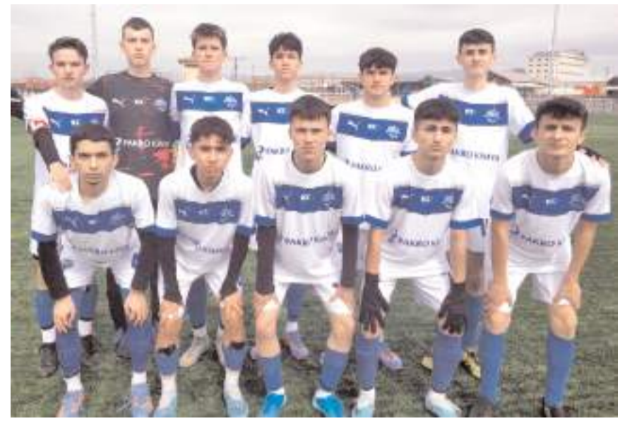
İskilipgücüspor yarın evinde kazanarak final grubuna yükselmeyi amaçlıyor

Haftanın en kritik maçı ise İskilip ilçe sahasında oynanacak. Saat 16'da başlayacak maçta 15 puanla dördüncü sırada bulunan İskilipgücüspor ile 16 puanla ikinci