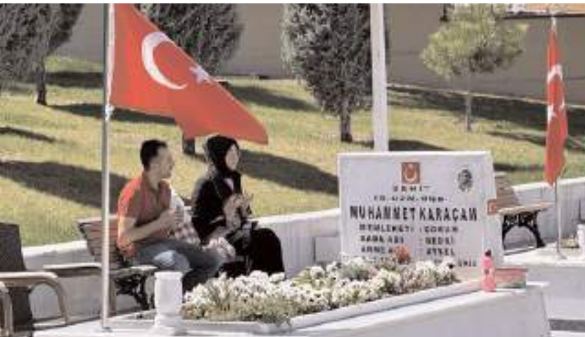
Vatandaşlar, kabirlerin başında Kur'an okuyup dua etti.

■ Çorum'da şehit yakınları, Ramazan Bayramı dolayısıyla ziyaret ettiği şehit kabirlerine bayram şekeri koydu. Erken saatlerden itibaren Şehitlik'e giden vatandaşlar, kabirlerin başında Kur'an okuyup dua etti.