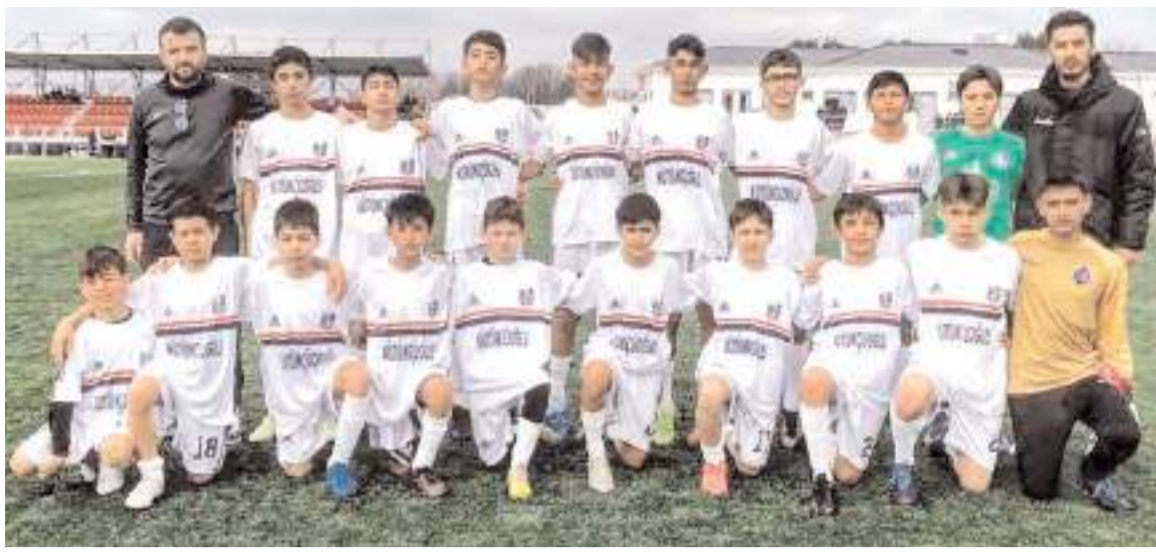
Vefa Gençlikspor U 13 takımı çeyrek finalde Hattuşa Gençlikspor ile yarı finale yükselmek için mücadele edecek