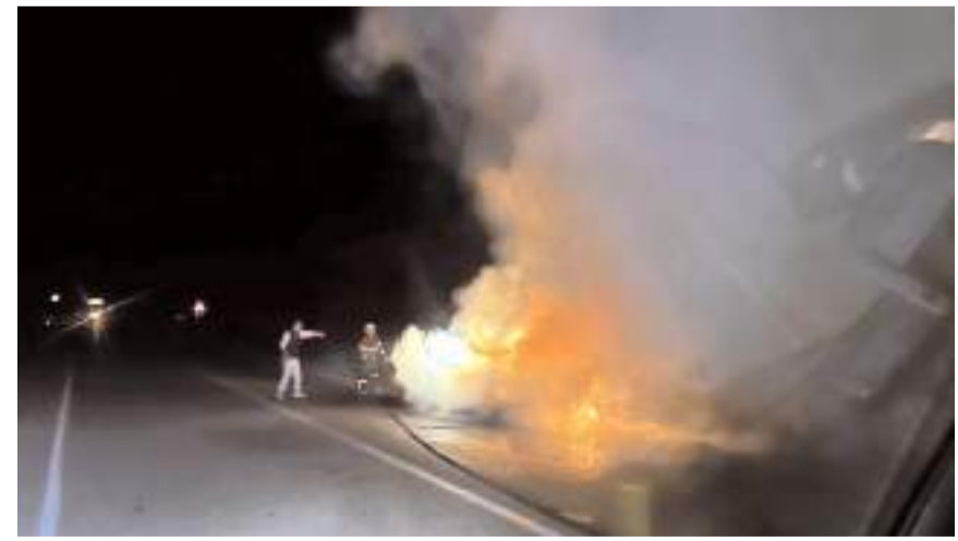
Olay İskilip-Tosya karayolunda meydana geldi.

Yangınla ilgili inceleme başlatıldı. (İHA)