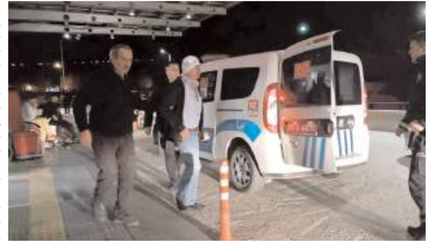
Yaralılar hastanede tedavi edildi.

Sopa ve bıçakların kullanıldığı kavgada Ali H.A. bıçakla, 8 kişi ise darp sonucu yaralandı. Yaralılar sağlık ekiplerinin olay yerinde yaptığı ilk mü-