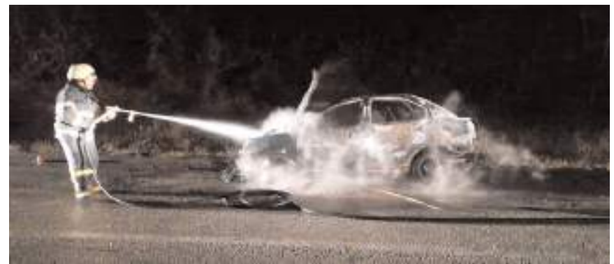
İtfaiye ekiplerinin müdahalesine rağmen araç kullanılmaz hale geldi.