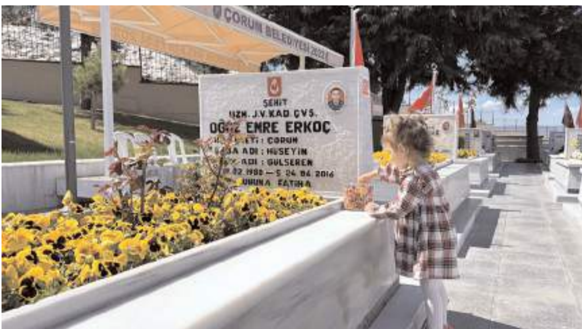
Bazı şehit yakınları kabirlere şeker bıraktılar.