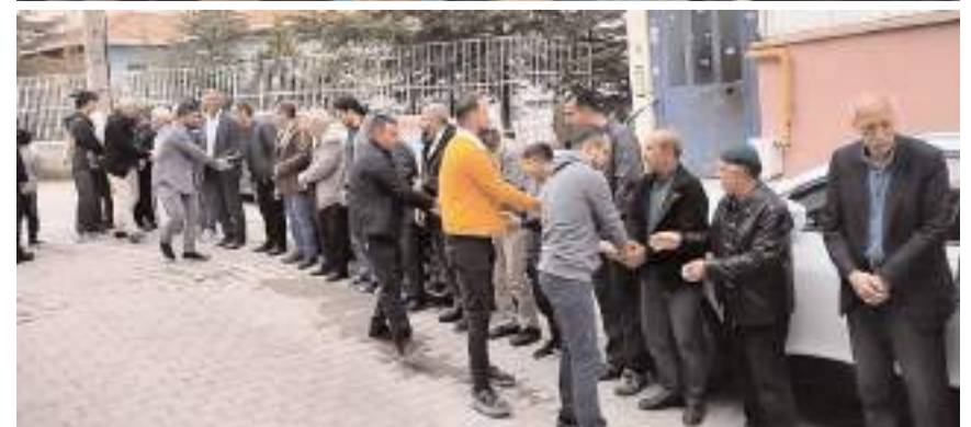
Vatandaşlar namaz sonrasında bayramlaştılar.