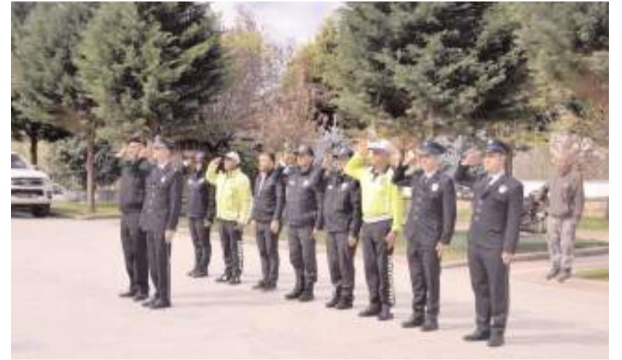
Törende saygı duruşunun ardından İstiklal Marşı okundu.