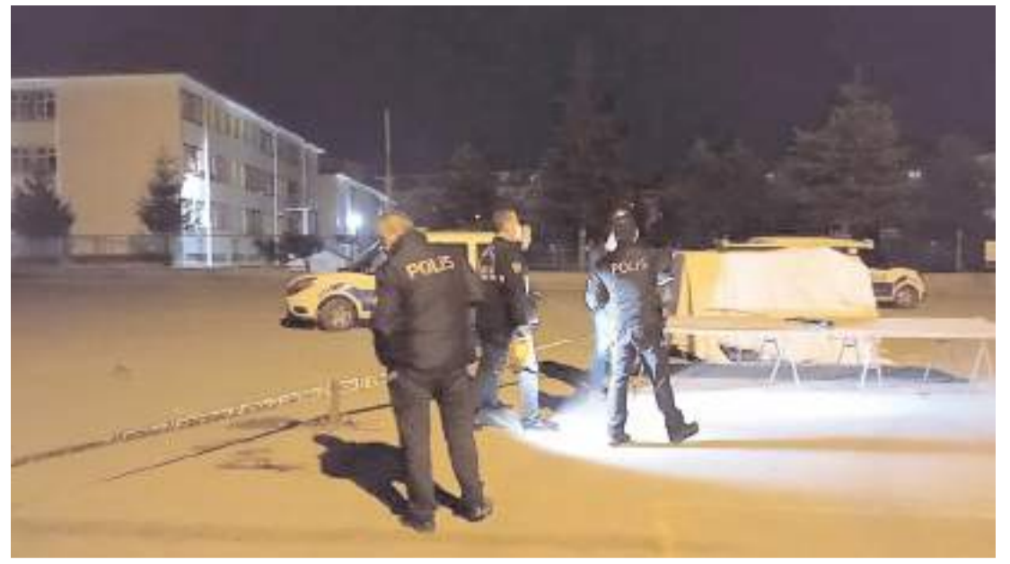
Olay, gece saatlerinde Kale Mahallesi Salı Pazarı'nda meydana geldi.