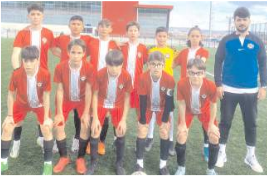
Çorum FK U 13 takımı çeyrek final maçında Çorumspor ile eşleşti

Dokuz takımın mücadele edeceği U 13 play-off liginde ikinci tur maçlarında sekiz takım mücadele edecek. 23 Nisan salı günü oynanacak ikinci tur ilk maçında saat 12'de İtfaiye sahasında Osmaniye Belediyesi spor ile Çorum İdman Yurdu takımları karşılaşılabilecek. Bu maçın ardından saat 13.30'da Vefa