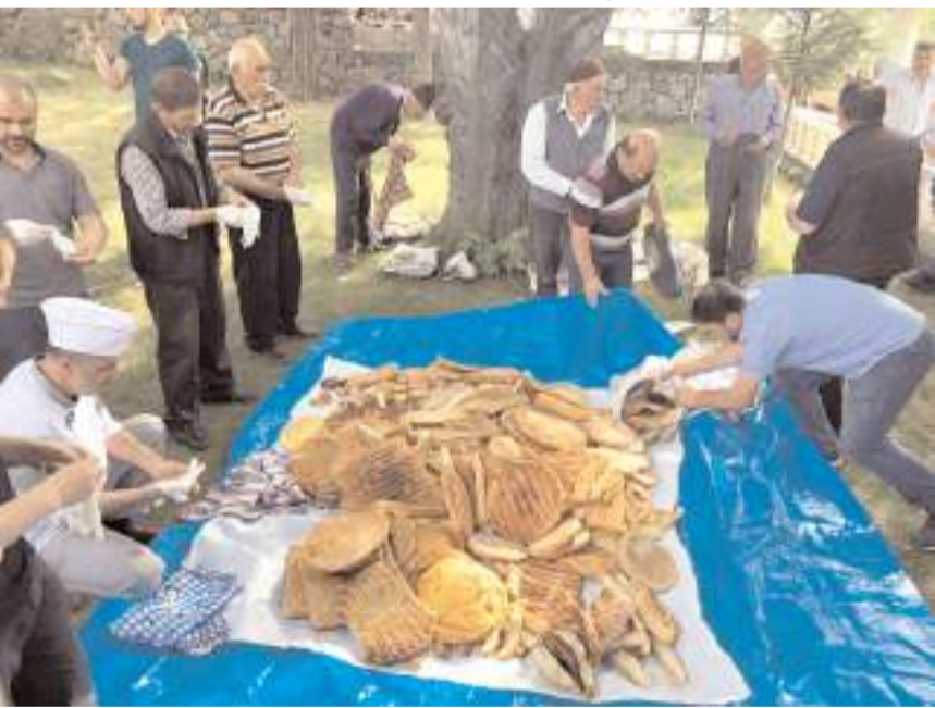
Kış mevsiminde 50 olan nüfus sayısı bayram nedeniyle 500'e kadar çıkıyor.

Çorum'un Osmancık ilçesinde uzun yıllardır her yıl dini bayramların bir gün öncesinde ikinci namazı sonrası düzenlenen çörek bayramına köylüler yoğun katılım gösteriyor. Çörek bayramı için İstanbul, Ankara gibi farklı illere göç eden aileler de Osmancık ilçesine bağlı Kuz köyüne geliyor. Evlerde yapılan çörekler, köylüler tarafından cami bahçesine getiriliyor. Burada açılan brandaya serilen çörekler, cemaatin namazdan çıkmasının ardından dualanıyor. Herkese eşit şekilde dağıtılan çörekler, Ra-