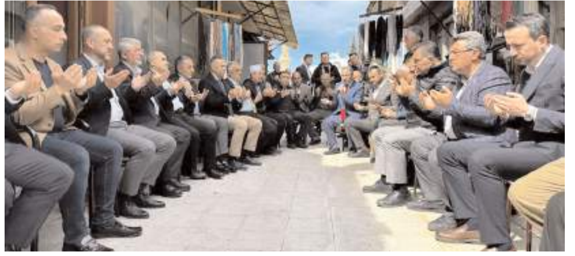
Arefe duasında eller esnafın hayırlı, bereketli ve bol kazançlı yıl geçirmesi için semaya kalktı.

Protokol üyeleri, bayramların toplum içerisinde kardeşlik duygusunu bütünlediğini, örf ve adetlerimizi yücelttiğini belirterek, tüm İslam âleminin mübarek Ramazan Bayramı'nı kutladıklarını dile getirdi. (İHA)