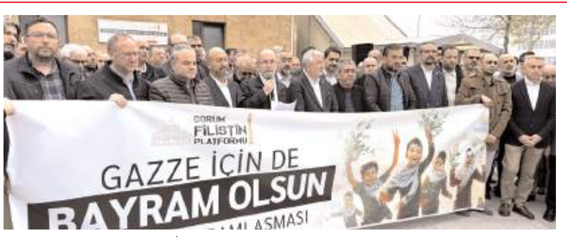
Eylemde İsrail'in Gazze'de yaptığı soykırma tepki gösterildi.

'Gazzeli mücahitler Haçlı ordusuna karşı direniyor'