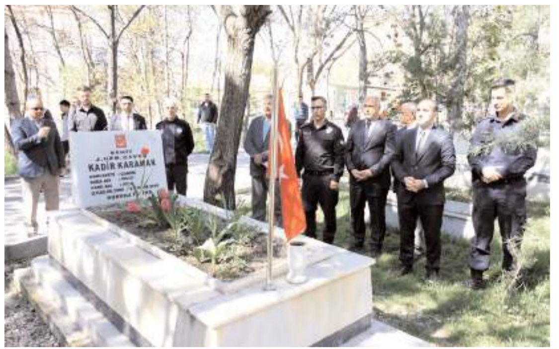
İskilip ilçe protokolü şehit kabirlerini ziyaret etti.