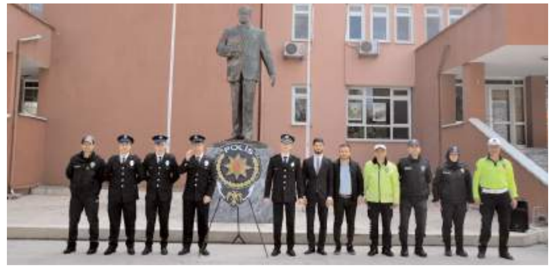
Hükümet Konağı önündeki Atatürk Anıtı'na çelenk sunuldu.