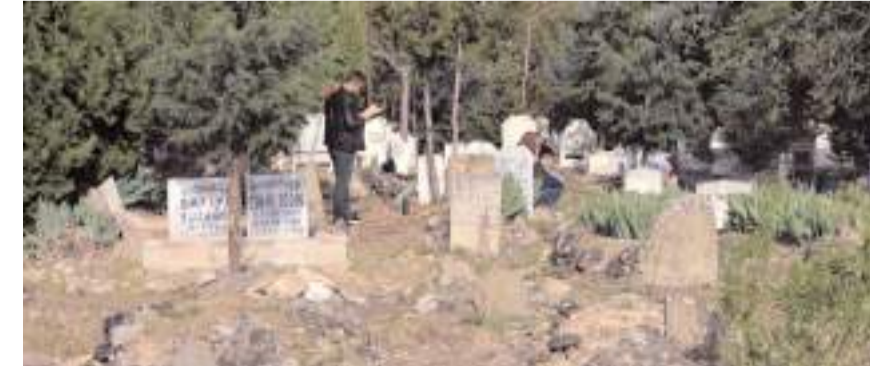
Vatandaşlar yakınlarının kabirlerini ziyaret ederek dua ettiler.

Kabirleri sulayıp çiçek bırakarak vatandaşlar, mezarlıklarda yoğunluk oluşturdu.