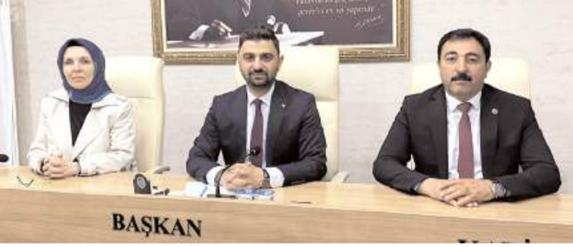
İlk toplantıda meclis başkanı ve katip üyelerin seçimi yapıldı.