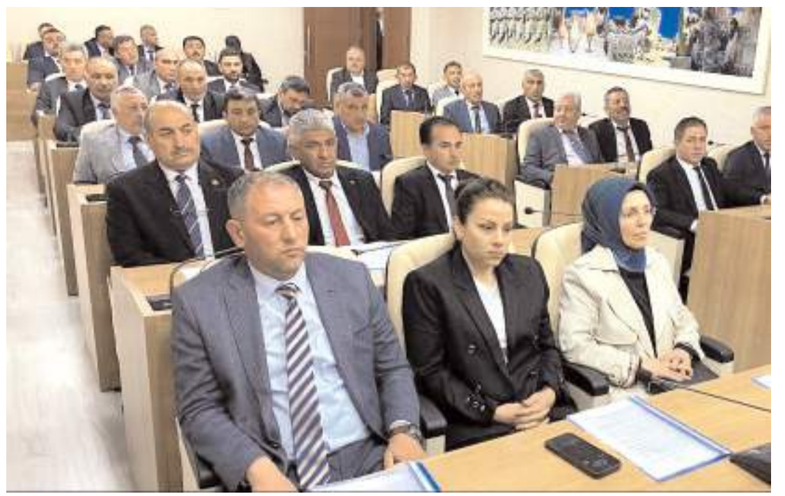
Yerel seçimlerde oluşan yeni İl Genel Meclisi ilk toplantısını yaptı.