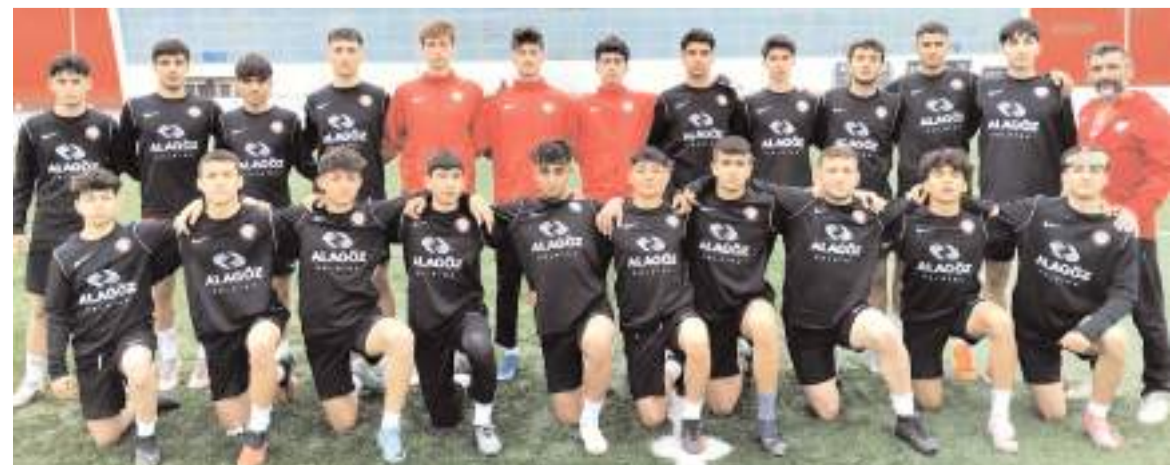
Çorum FK U 17 takımı play-off hazırlıklarını bayram sürecinde teknik direktör Barış Kılıç yönetiminde sürdürdü

Almanya'da devam eden Büyükler Avrupa Badminton Şampiyonasında Teknik Kurul Başkanlığı Barış Boyar'ın yaptığı milli takımda çift kadınlarda Bengisu Erçetin ve Nazlıcan İnci eleme maçlarının ardından çeyrek final maçında Danimarka'lı rakiplerini zorlu mücadele sonunda 2-1 yenerek yarı finale yükseldi ve madalyayı garantiledi. Çift kadınlarda yarı final ve final maçları bugün oynanacak.