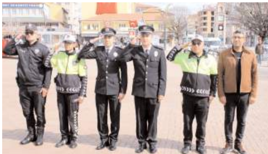
Tören Hükümet Konağı önündeki Atatürk Anıtı'nda yapıldı.

Türk Polis Teşkilatının kuruluşunun 179. yıl dönümü Alaca'da törenle kutlandı.