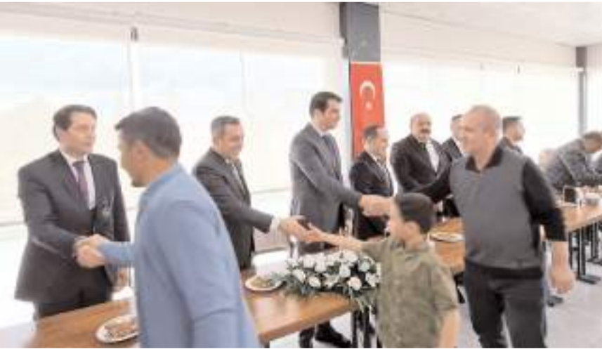
Tören Sungurlu Kaymakamlığı tarafından yapıldı.