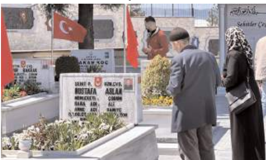
Vatandaşlar, kabirlerin başında Kur'an okuyup dua etti.

Çorum'da şehit yakınları, Ramazan Bayramı dolayısıyla ziyaret ettiği şehit kabirlerine bayram şekeri koydu.