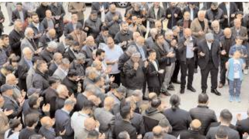
Eylemin sonunda Gazze'de soykırımın sona ermesi ve Filistin halkının özgürlüğü için dua edildi.