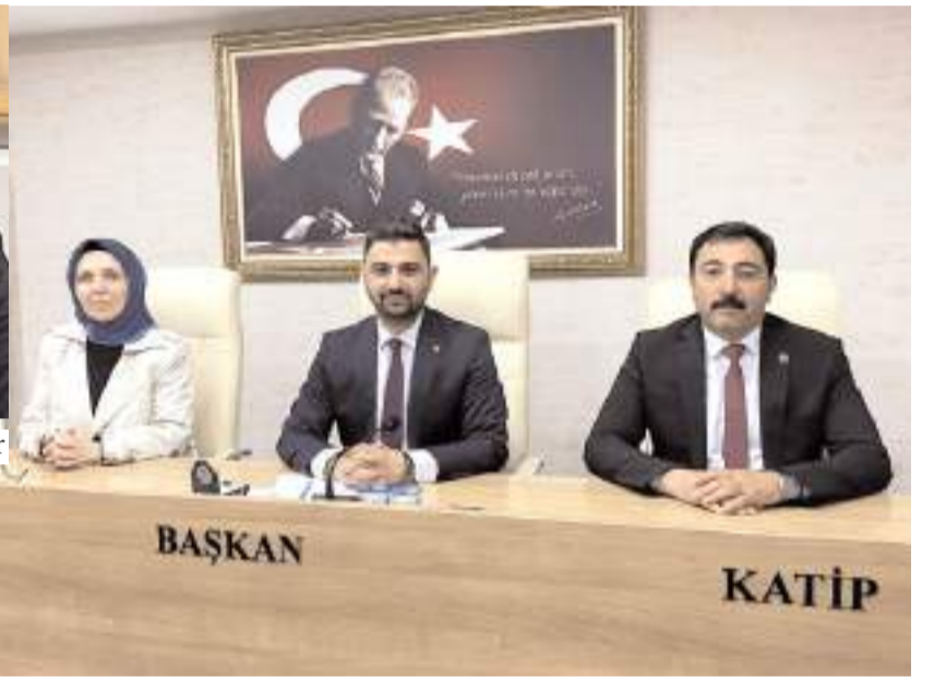
İlk toplantıda meclis başkanı ve katip üyelerin seçimi yapıldı.