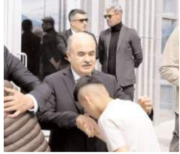
Bayramlaşma töreni Belediye önünde yapıldı.