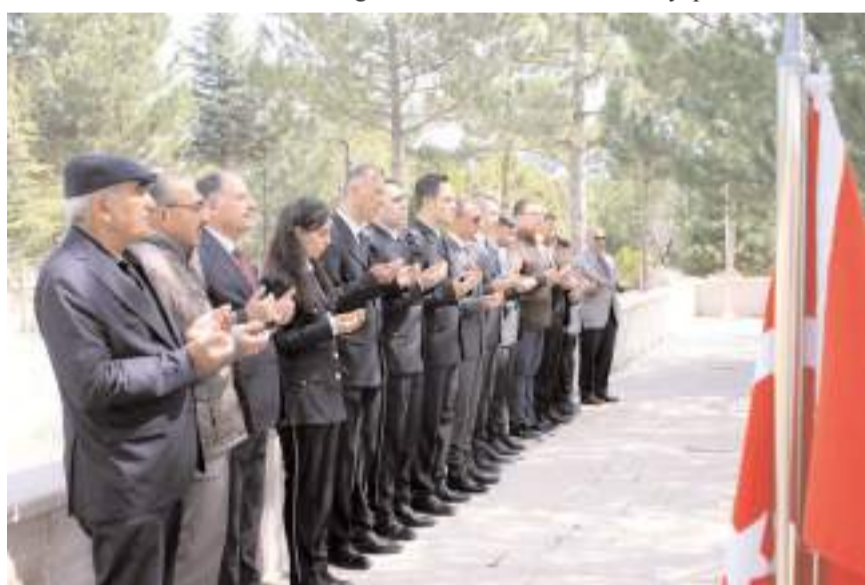
Şehit kabirleri ziyaret edilerek dua edildi.