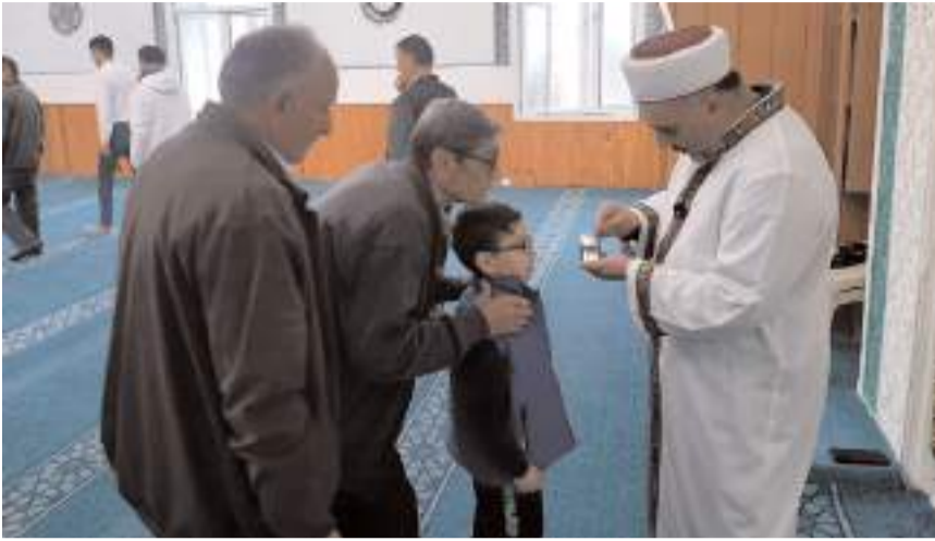
63 parça beze sarılı Sakal-ı Şerif, dua ve salavatlar eşliğinde ziyaret alanına getirildi.

Sakal-ı Şerif'i görmek için sraya giren vatandaşlar, dua eşliğinde cam fanusa doku-narak ziyaretlerini sonlandırdı.