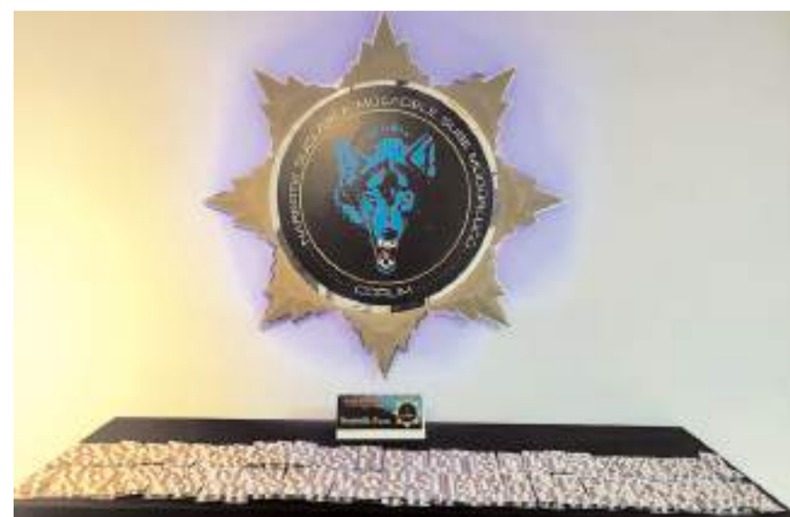
5 farklı operasyonda; 23 bin 210 adet sentetik ecza maddesi ele geçirildi.

lüğü'nden yapılan açıklama da, "Ülkemizin geleceği, yarınlarımızın teminatı gençlerimize zehirleme niyetindeki şahıslar ve örgütlerle mücadele-