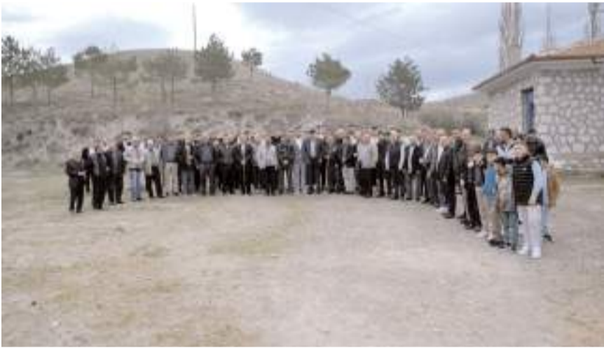
Kahvaltının ardından toplu hatıra fotoğrafı çekildi.

Köy muhtarlığından yapılan açıklamada, "Her sene olduğu gibi bu sene de çok şükür bayram kahvaltımızı yapıp bayramlaştık, daha önceki senelerde pandemiden dolayı ara vermiştik tekrardan Bismillah diyerek tüm Köy sakinlerini bir araya getirerek bayramlaşmamızı gerçekleştirdik, emeği geçen herkese teşekkür ederiz, Allah hayırlarını kabul eylesin" ifadelerini kullandı. (İHA)