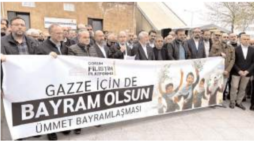
Eylemde İsrail'in Gazze'de yaptığı soykırma tepki gösterildi.