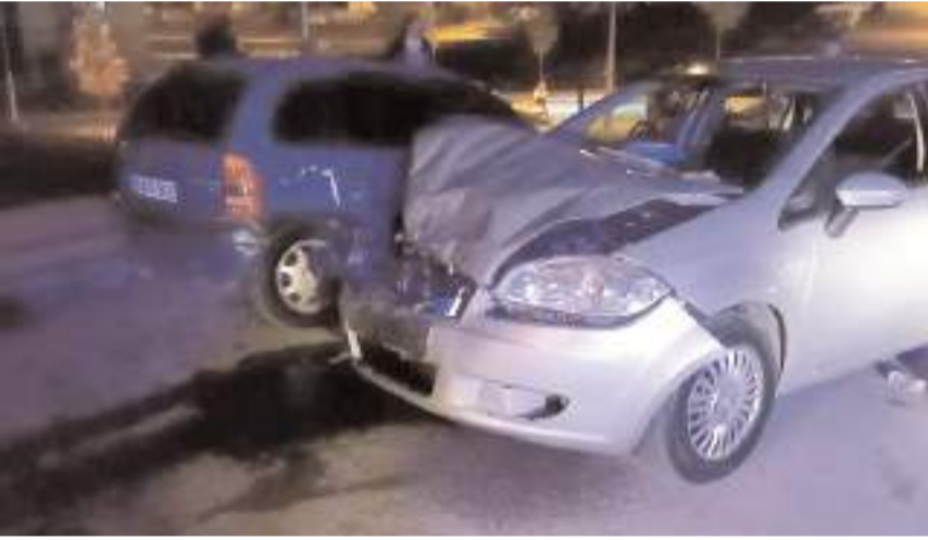
Kaza Bahçelievler Mahallesi Bahar 20. Sokak'ta meydana geldi.

Kazayla ilgili inceleme başlatıldı. (İHA)