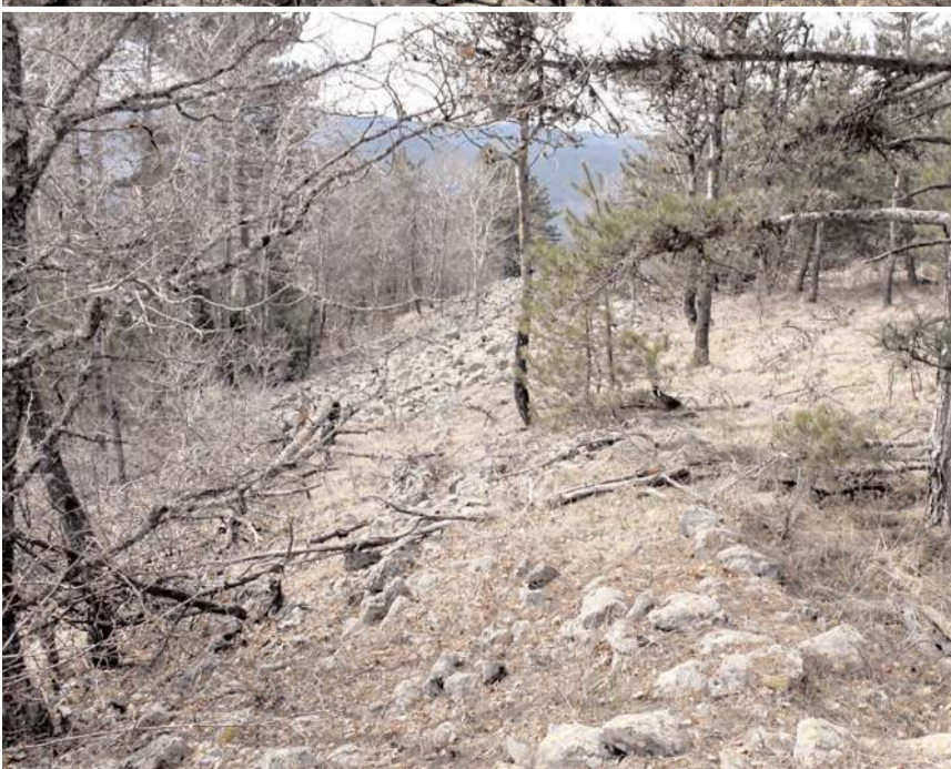
Dikmen Tepesindeki bazı tarihi kalınlar, mezar ve odalar defneciler tarafından tahribata uğratılmış.