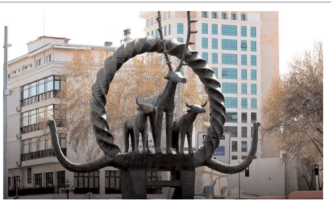
Ankara Sıhhiye Meydanı'nda "Hitit Güneşi" anıtı bulunuyor.

miz sınırları dahilinde seyrinin yasaklanması uygun görülmüş olup, güzergah üzerinde bahse konu araçlar için depolama alanlarının oluşturulması, gerekli duyuruların yapılarak uygulamada herhangi bir aksaklığa mahal verilmemesi gerekmektedir" denildi. (İHA)