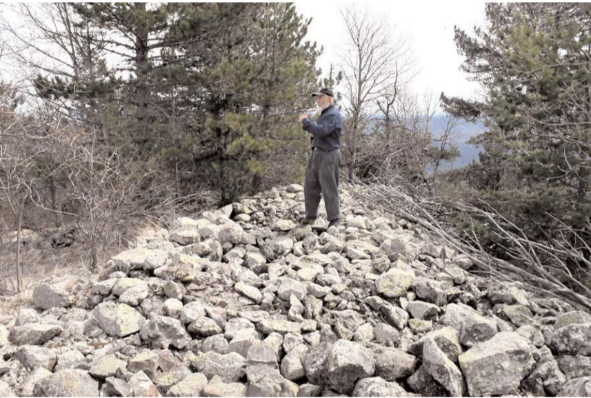
Dikmen Tepesi Çorum, Sinop ve Kastamonu sınırlarının kesiştiği ortak bir yerde bulunuyor.

Haberal, bölgenin Çorum ilinin Kargı ilçesi, Sinop'un Boyabat ilçesi ile Kastamonu'nun Taşköprü ilçelerinin kesiştiği bir noktada bulunduğunu ve tepenin zirvesinden Karadeniz'in dahi görülebildiğini kaydetti. (İHA)