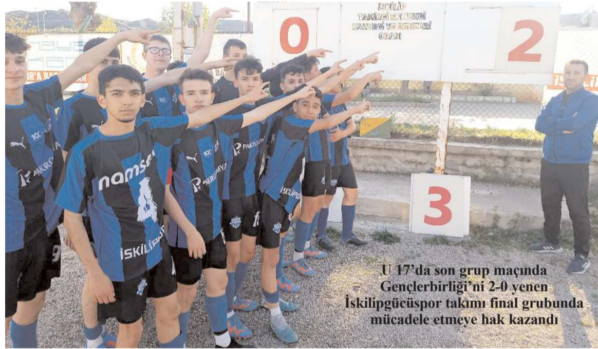
U 17'de son grup maçında Gençlerbirliği'ni 2-0 yenen İskilipgücüspor takımı final grubunda mücadele etmeye hak kazandı

Türkiye genelinden çok sayıda sporcunun katılacağı Türkiye Şampiyonası için Gençlik ve Spor İl Müdürlüğü gerekli hazırlıkları yaptı. Üç gün sürecek olan Türkiye Şampiyonasında milli takım kadrosunda belirlenmesi amaçlanıyor. Şampiyonada ilimizden de sporcuların katılması bekleniyor.