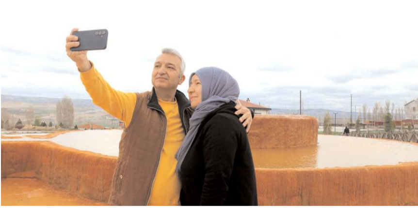
Ziyaretçiler Altinkale bol bol hatıra fotoğrafı çekiniyor.