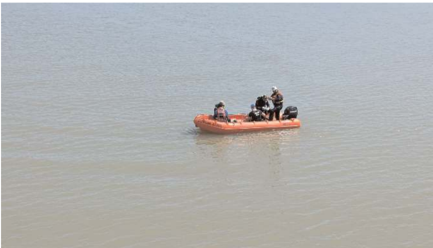
Dalgıç ekiplerinin yaptığı arama sonucu kayıp gencin cenazesi Kızılırmak'tan çıkarıldı.

Olayla ilgili soruşturma başlatırken, gencin intihar ettiği şüphesi üzerinde duruluyor.