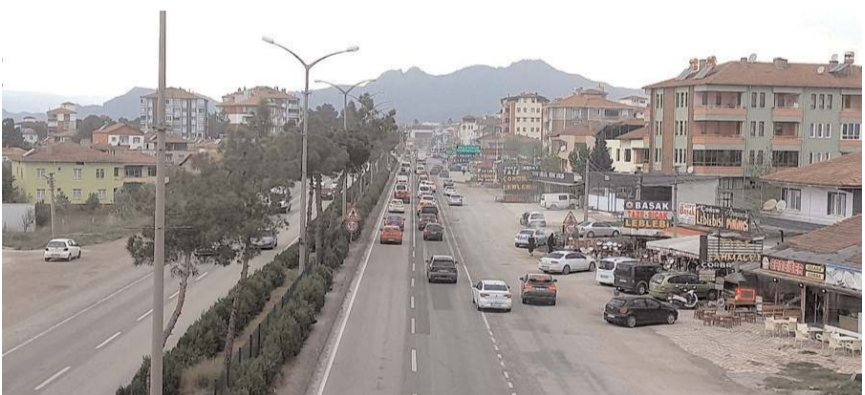
D-100 karayolu Osmancık geçişinde yoğunluk yaşanıyor.

Çorum Valiliği, D-100 Karayolu Osmancık geçişinde 1 gün süreyle kamyon, çekici ve tankerlerin geçişini yasakladı. İl Emniyet Müdürlüğü Bölge Trafik Denetleme Şube Müdürlüğü tarafından yapılan yazılı açıklamada, "2024