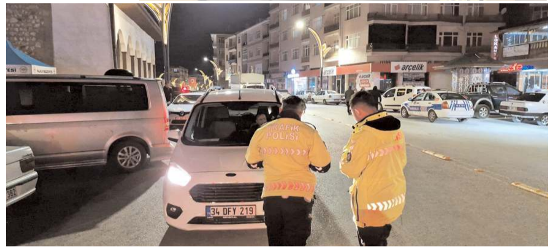
Şok uygulamaların devam edeceği belirtildi.