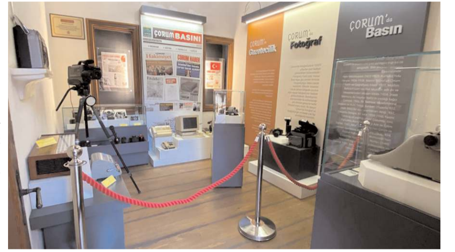
Müzede Çorum Basınına özel bir bölümde bulunuyor.

kültür ve tarihine ilişkin materyallerin Şehir Müzesinde sergilenmesinden duydukları memnuniyeti dile getirerek emeği geçenlere teşekkür ettiler.