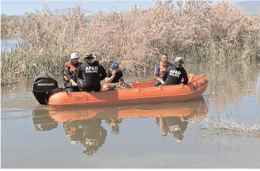
AFAD ekipleri Kızılırmak'ta arama yaptı.