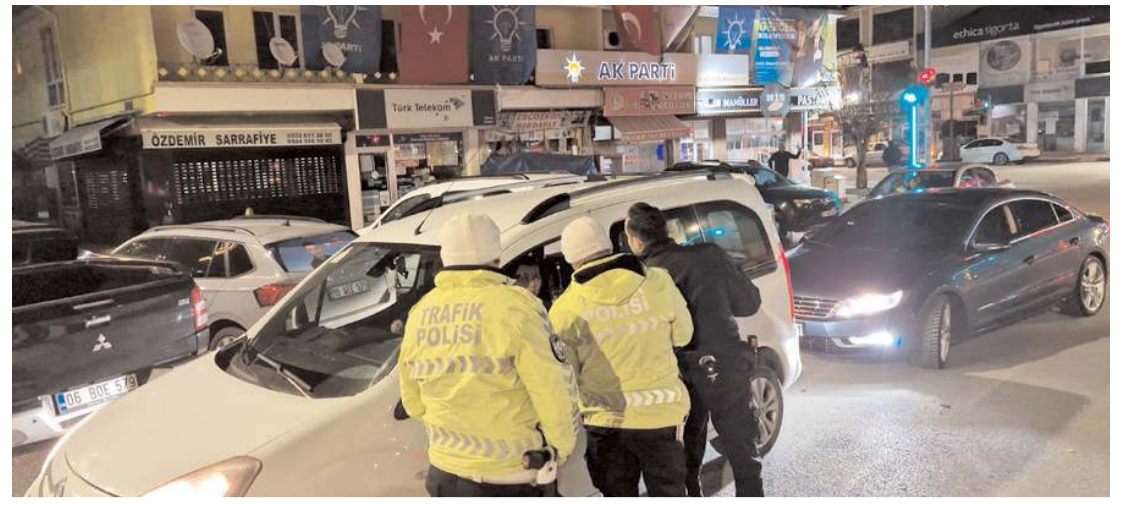
Denetimlerde 140 şahsın GBT kontrolü yapıldı.