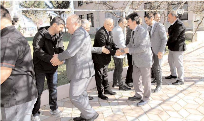
Bayramlaşma programı İl Özel İdaresi Sosyal Tesislerinde yapıldı.

Konuşmaların ardından İl Özel İdaresi personeliyle tek tek bayramlaşırken, şeker ve kolonya ikramında bulunuldu. (Haber Merkezi)