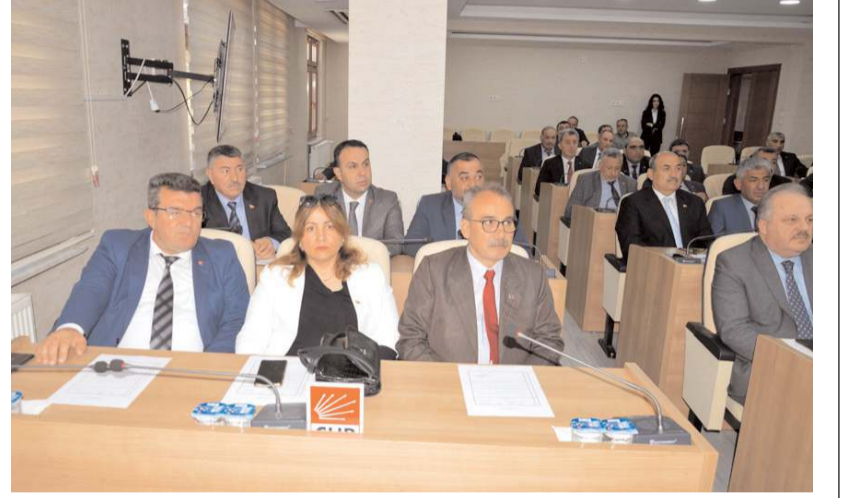
Toplantıda gündem maddeleri görüşülerek karara bağlandı.