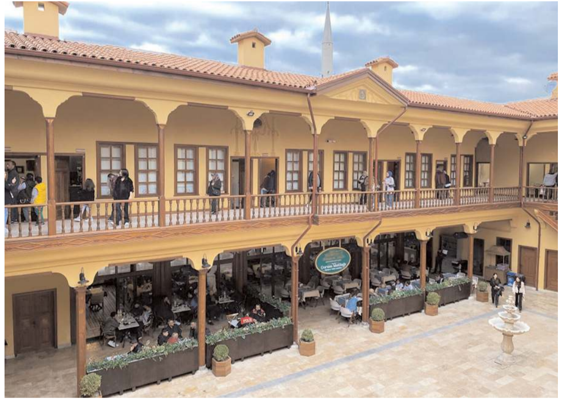
Veli Paşa Hanında bulunan Şehir Müzesinde 15 oda bulunuyor.