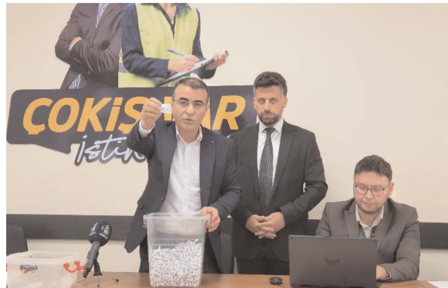
Kura çekilişini noter gerçekleştirdi.