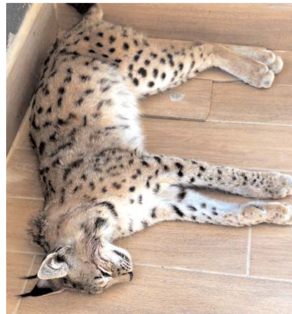
Ölü vaşak Çorum-Ortaköy kara yolu Danişin mevkiinde bulundu.