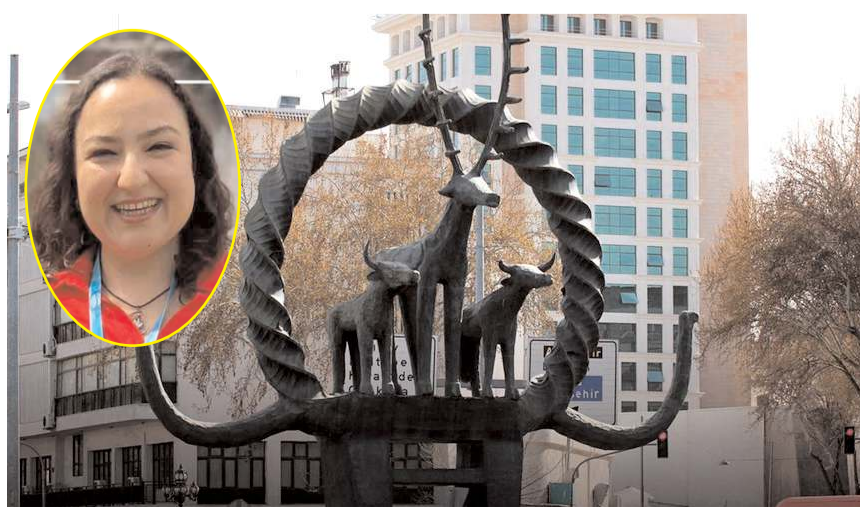
Ankara Sıhhiye Meydanı'nda "Hitit Güneşi" anıtı bulunuyor.