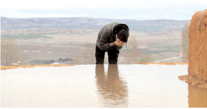
Altinkale, doğal güzellikleriyle görenleri mest ediyor.