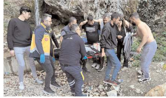
Olay Laçın Yeşil Göl bölgesinde meydana geldi.

■ 31 Mart Mahalli İdariler seçiminin ardından İl Genel Meclisi dün ikinci kez toplandı. * HABERİ 3'DE