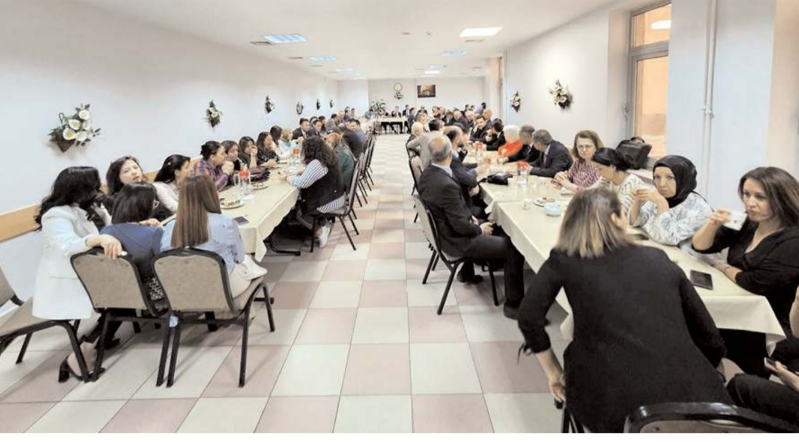
Adliye'de yapılan bayramlaşma programına katılım yüksek oldu.