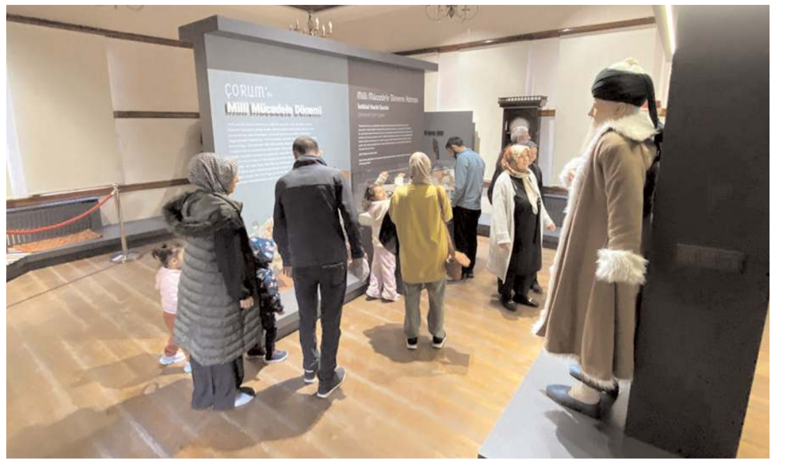
Veli Paşa Hanında bulunan Şehir Müzesinde farklı dönemlere ait çok sayıda materyal sergileniyor.