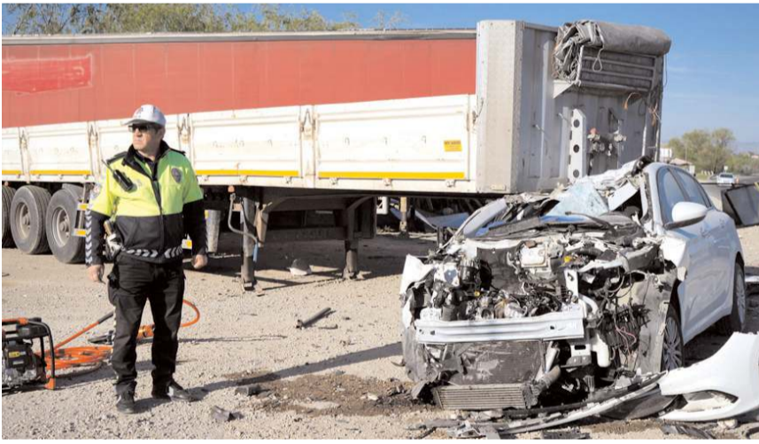
Kaza, Kırıkkale-Çorum D200 karakolu Yukarımahmutlar köyü mevkiinde meydana geldi.