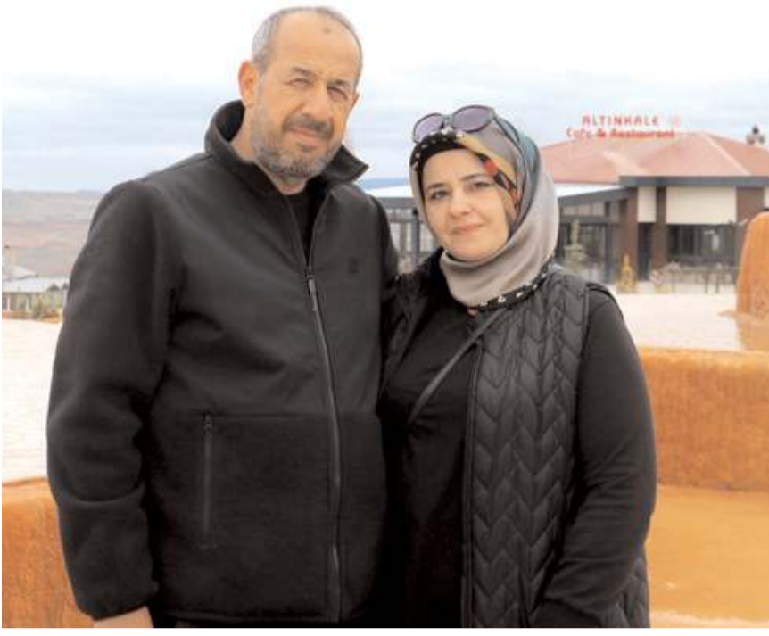
Pamukkale'nin kardeşi Altinkale, bayram tatilinde ziyaretçi akınına uğruyor.