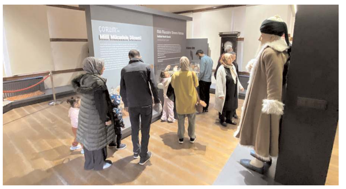
Veli Paşa Hanında bulunan Şehir Müzesinde farklı dönemlere ait çok sayıda materyal sergileniyor.