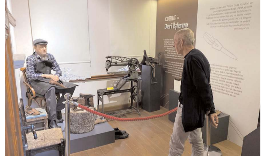
Veli Paşa Hanında bulunan Şehir Müzesinde 15 oda bulunuyor.