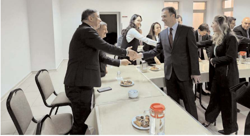
Cumhuriyet Başsavcısı Ahmet Bektaş, Adliye personeli ve yargı mensuplarıyla bayramlaştı.