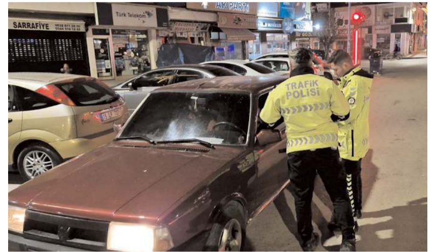
Uygulamalarda 70 araçta alkol ve evrak kontrolü gerçekleştirildi.

Alaca İlçe Emniyet Müdürlüğü'ne bağlı Asayiş ve Trafik Şube Müdürlüğü ile mahalle beğçilerinin katılımı ile Ankara Caddesi üzerinde uygulama yapıldı. Denetimlerde 140 şahsın GBT kontrolü yapılırken uygulamalar sırasında 70 araçta alkol ve evrak kontrolü gerçekleştirildi. Yapılan kontrollerde herhangi bir olumsuzlukla karşılaşılmazken, Polis ekiplerinin huzur uygulamaları ve şok denetimlerinin devam edeceği bildirildi. (İHA)