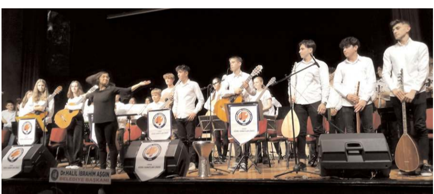
Programın finali, 7 Nisan Pazar akşamı Çorum Devlet Tiyatrosu'nda yapılacak.

Proje yetkilileri vatandaşları Devlet Tiyatro Salonunda gerçekleştirilecek olan konsere davet ettiler.