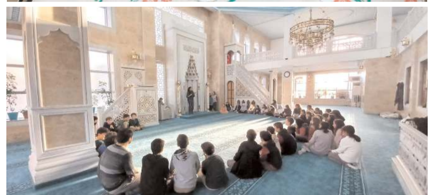
Mehmet Zahit Kotku Camiinde buluşan gençlerle namaz kıldıktan sonra çeşitli etkinlikler yapıldı.