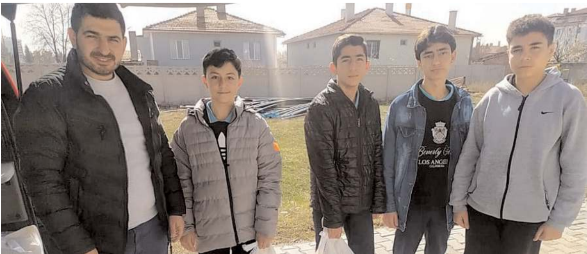
Okul idaresi tarafından belirlenen ihtiyaç sahibi vatandaşlara öğrenciler tarafından yardım kolileri teslim edildi.