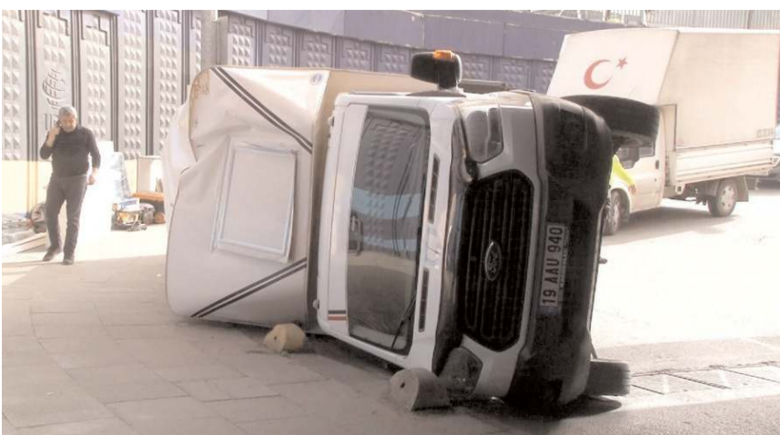
Kazada araçta maddi hasar meydana geldi.

Kadıköy'de mobilya yüklü kapalı kasa kamyonet önce üst geçitte çarptı, ardından da devrildi. Kazada ölen veya yaralanan olmazken kamyonetin içindeki mobilyalar kullanılamaz hale geldi.