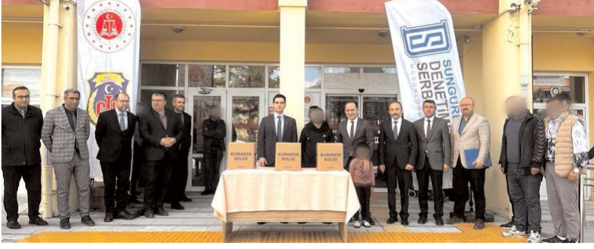
Denetimli serbestlik tedbiri altında bulunan ve maddi durumu zayıf olan yükümlülere Ramazan ayında gıda yardımı yapıldı.