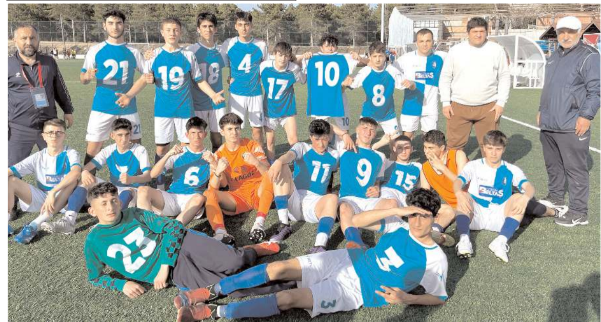
Gençlerbirliği U 17 takımı Osmancıkücü maçı kazanarak final grubuna yükselmeyi başardıktan sonra toplu halde