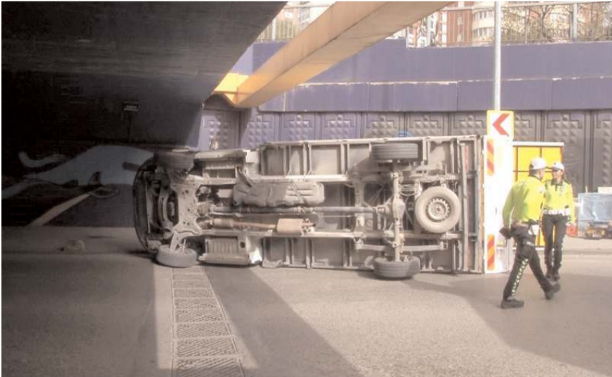
Kaza Kadıköy Göztepe Mahallesi Ömer Paşa Caddesinde meydana geldi.