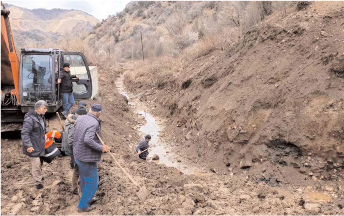
Çalışmalar köylü-devlet iş birliği ile gerçekleştirildi.

Laçın'e bağlı Gözübüyük köyünde içme suyu kaynağının azalması sonucu İl Özel İdaresi drenaj çalışması yaptı. Köylü-devlet iş birliği ile gerçekleştirilen çalışmayla köye 1,00 Lt/sn yeterli ve sağlıklı içme suyu sağlandı. (Haber Merkezi)