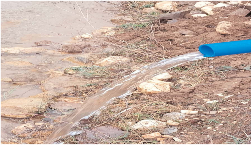
Çalışmayla köye 1,00 Lt/sn yeterli ve sağlıklı içme suyu sağlandı.

Çorum İl Özel İdaresi Gözübüyük köyünün içme suyu sorununu çözdü.