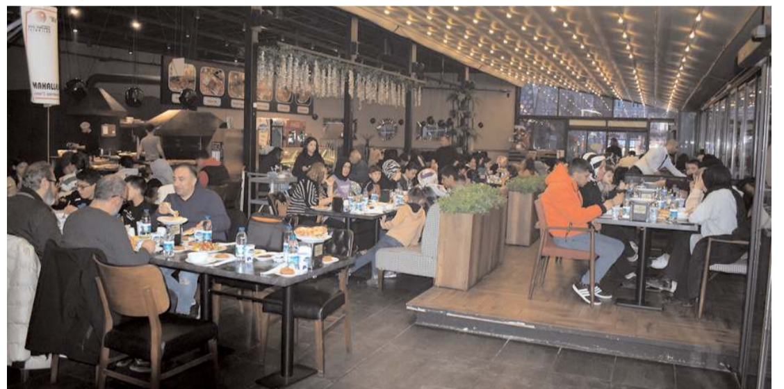
İftar programına öksüz ve yetim aileleri ile gençler ve vatandaşlar katıldı.