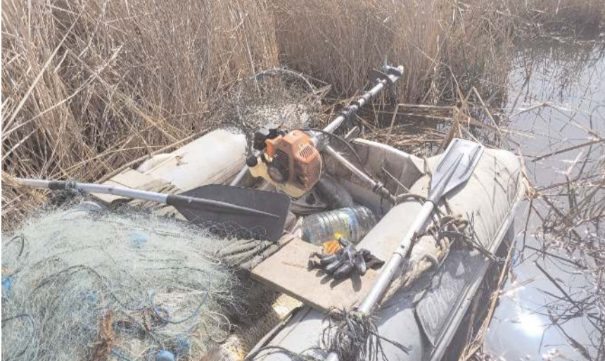
Denetimlerde çok miktarda ağ ele geçirildi.