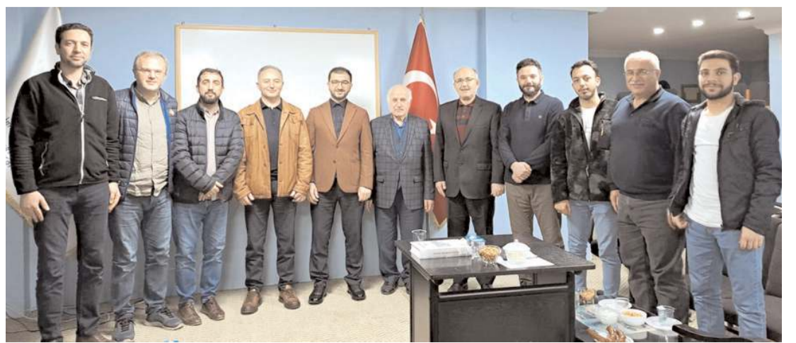
Konferansın ardından hatıra fotoğrafı çekildi.