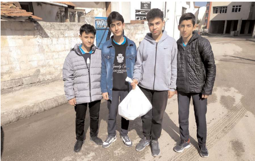
Alaca İmam Hatip Ortaokulu öğrenci ve velileri ihtiyaç sahibi vatandaşlara yardımda bulundu.

Alaca İmam Hatip Ortaokulu yönetiminden konuya ilişkin olarak yapılan açıklamada, "Okulumuz öğrenci ve velileri ile birlikte yardım kardeşlik sloganı ile başlatmış olduğumuz faaliyetlerimiz ramazan ayı süresince devam edecektir" denildi. (İHA)