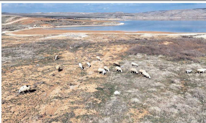
Baraj sularının çekilmesi ile boşalan arazilerde koyunlar otluyor.

Kırıkkale'de karsız ve yağmursuz geçen bir kış mevsiminin ardından bahar yüzünü göstermeye başladı. Hava sıcaklıklarının yükseldiği kentte, kuraklık tehlikesi alarm veriyor. Türkiye'nin en uzun nehri Kızılırmak'ın beslediği Kapulukaya Barajı'nda da su seviyesi düştü. Karaahmetli köyünde çift-