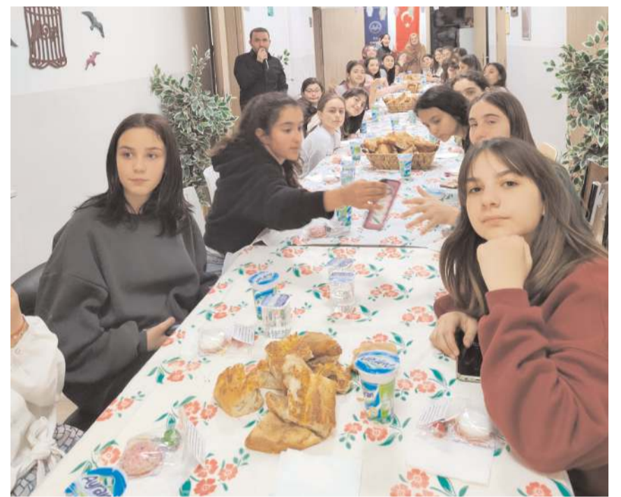
İftara Ahmet Tevfik İleri Ortaokulu ve Yıldırım Beyazıt İmam Hatip Ortaokulu öğrencileri katıldı.

Bir grup öğrenci iftar vaktini Çorumlu Obasında diğer bir grup Diyanet Gençlik Merkezinde kurulan sofralarda beklerken, ezanların okunmasıyla gençler iftarlarını yaptılar. (Haber Merkezi)