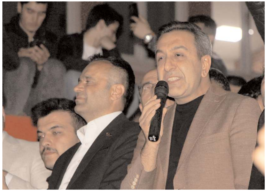
Muhsin Dere seçim sonuçlarının açıklamasının ardından vatandaşlara hitap etti.