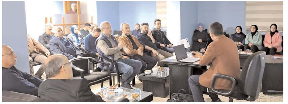
İMVAK'ın haftalık konferanslarının bu seferki konusu "Türk-İslam Sanatlarında Estetik" oldu.