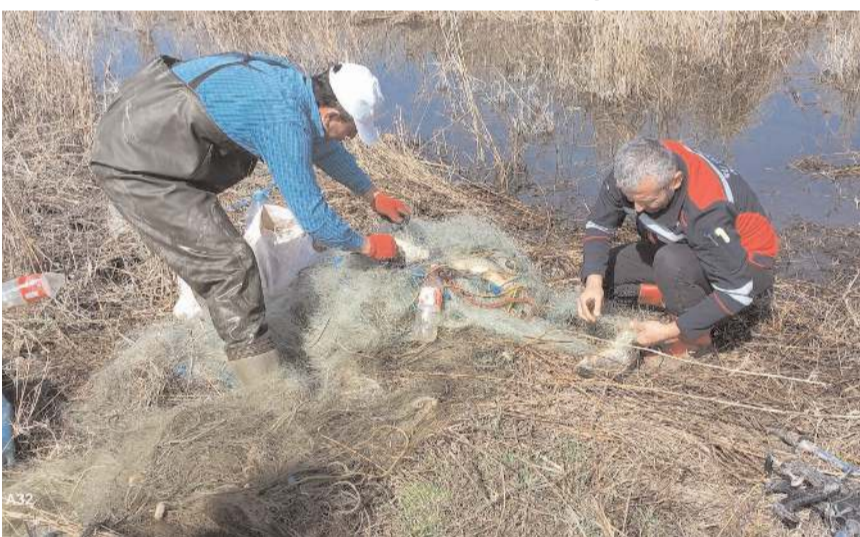
İl Tarım ve Orman Müdürlüğü ekiplerinin kaçak avcılıkla mücadele için denetimleri devam ediyor.