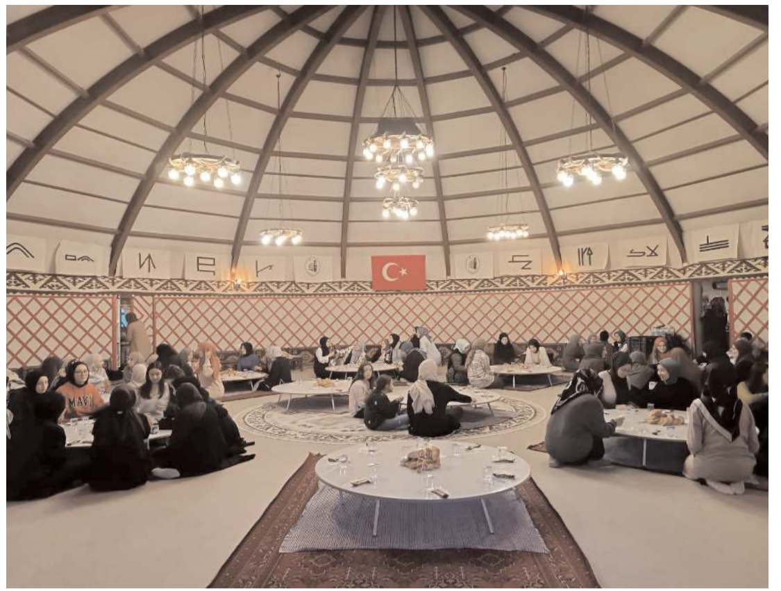
Çorumlu Obasında da iftar düzeldi.