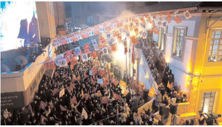
Cumhur İttifakı taraftarları Taş Bina önünde geç saatlere kadar kutlama yaptılar.