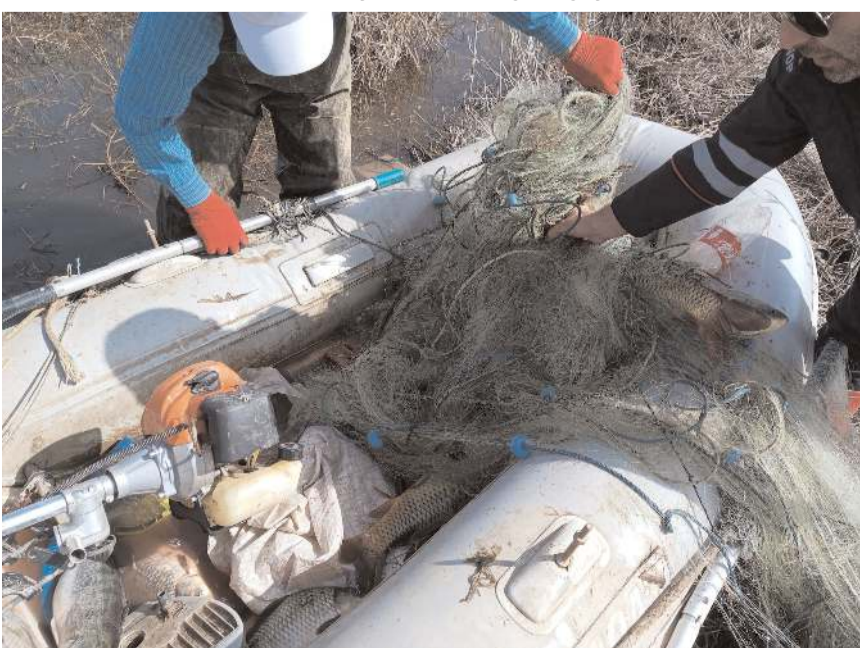
Ele geçirilen avcılık malzemelerine el konuldu.

İl Tarım ve Orman Müdürlüğü ekiplerinin kaçak avcılıkla mücadelesi devam ediyor.