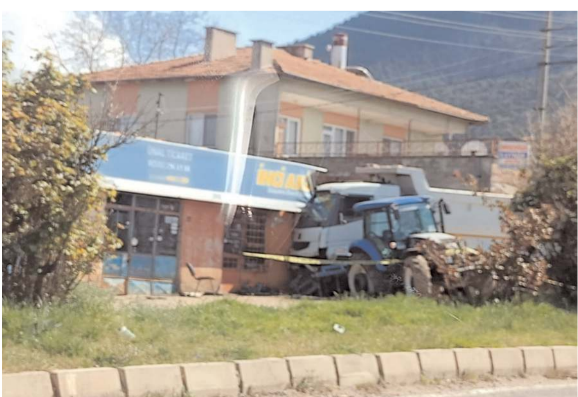
Kaza dün öğlen saatlerinde Sanayi Bölgesinde meydana geldi.