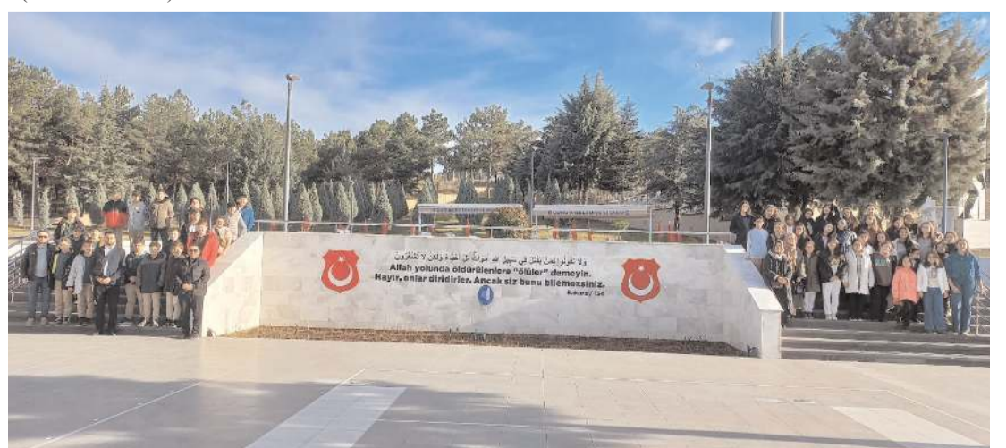
Gençler Çorum Şehitliğini ziyaret etti.