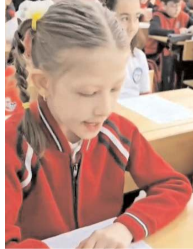
Öğrenciler Bitlis'in Güroymak ilçesindeki polislere duygu yüklü mektuplar yollamıştı.