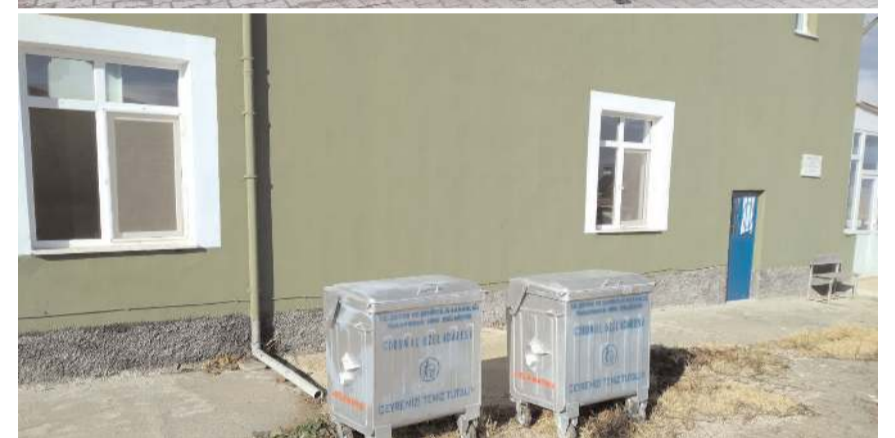
Köylere çöp konteynerleri de verildi.