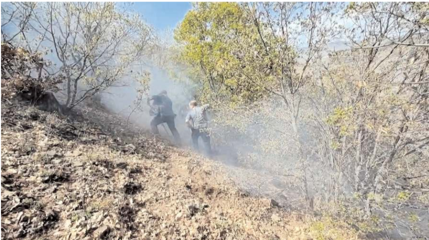
Yangın yaklaşık 10 dekar alanda etkili oldu.

Cebeci, AA muhabirine yaptığı açıklamada, yangında 10 dönüm alanın zarar gördüğünü söyledi.