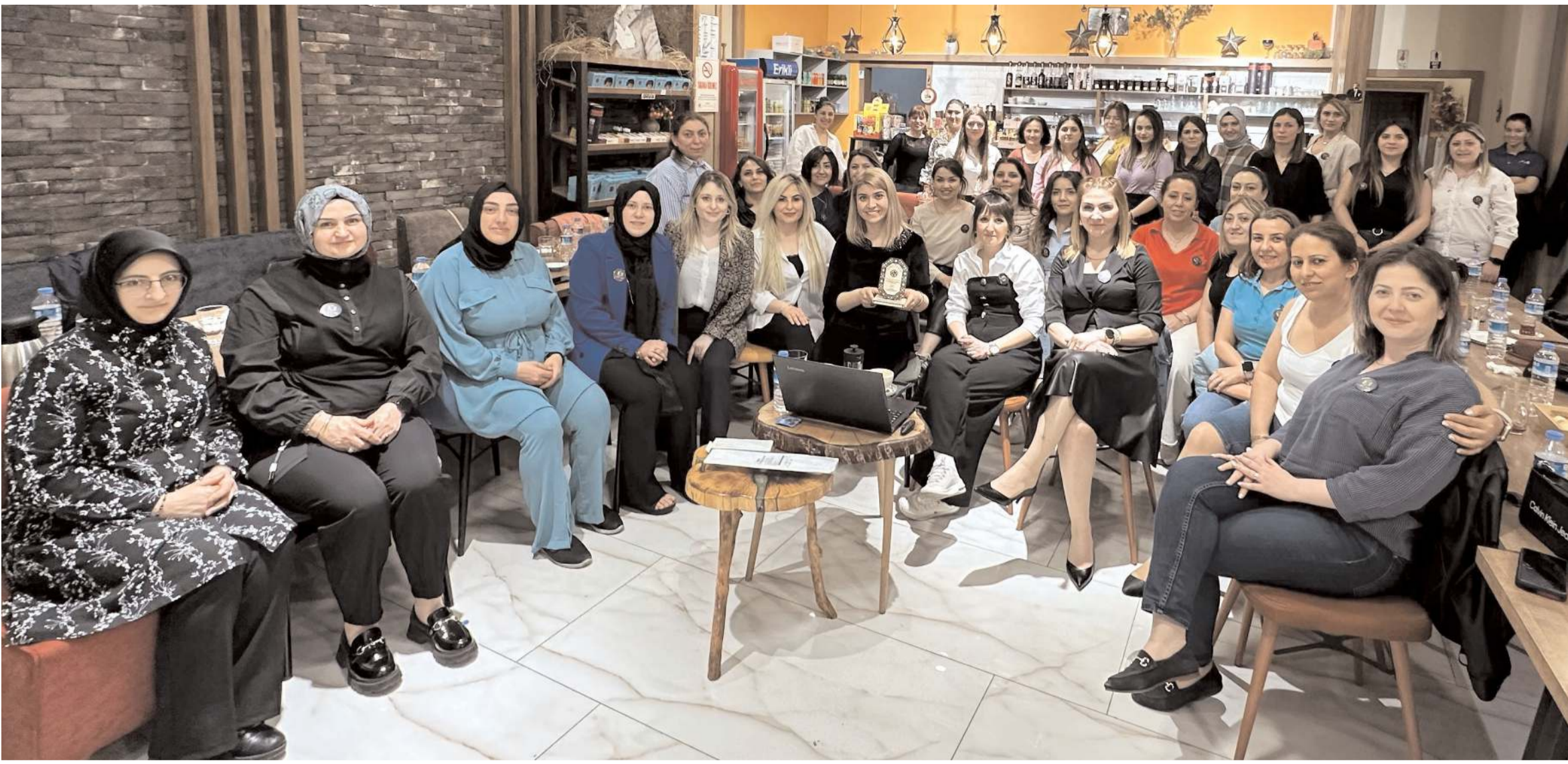
Kadın Muhasebeciler ve Muhasebe Çalışanları Derneği (KADMUDER) eğitim seminerlerine devam ediyor.