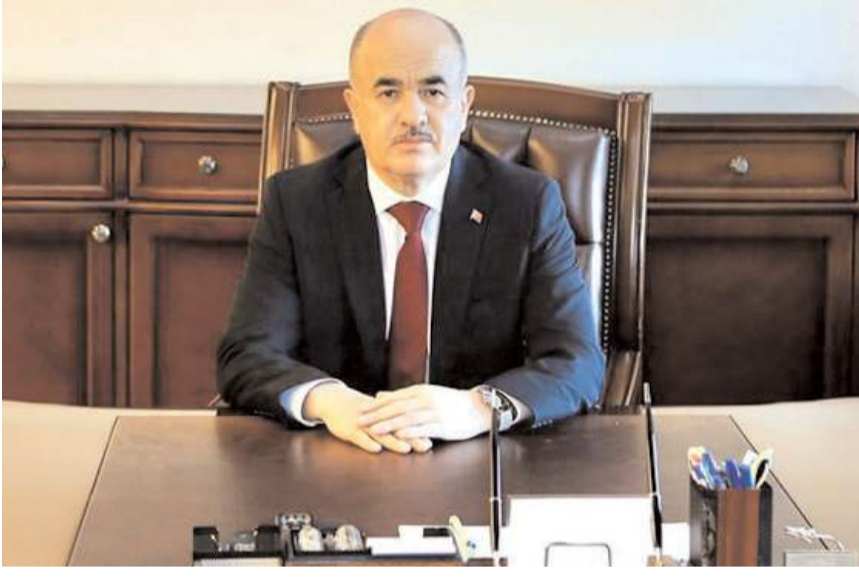
Çorum Valisi Zülkif Dağlı

Tokat ili Sulusaray ilçesinde meydana gelen 5.6 büyüklüğündeki deprem sonrasında ilk tespitlere göre Çorum'da olumsuz bir ihbar alınmadığını belirten Vali Dağlı, "Gelişmeleri takip ediyoruz. Depremden etkilenen tüm vatandaşlarımıza geçmiş olsun dilekelerimizi sunuyoruz" ifadelerini kullandı.