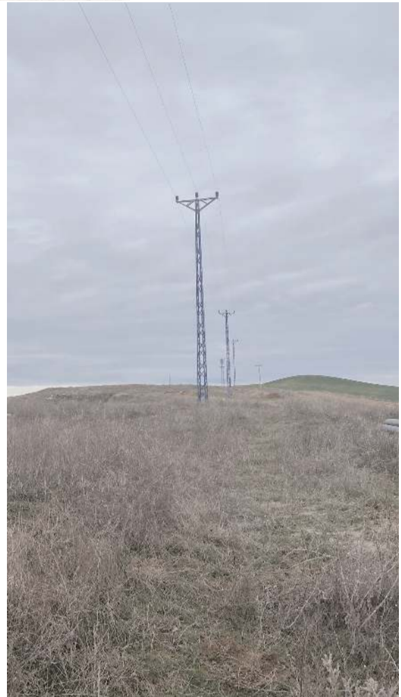
Pompaj tesisinin tamamlanması ile Karlık köyüne ait 2097 dekar arazi sulanabilecek.