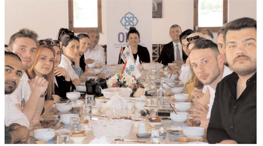
Öğrenciler Boğazkale Kaymakamı Emine Karataş Yıldız ve Boğazkale Belediye Başkanı Adem Özel'in konduğu oldular.

Kafile daha sonra Hattuşa Ören Yeri, Boğazköy Müzesi ve Yazılıkaya Açık Hava Tapınağı'nı gezdi.(AA)