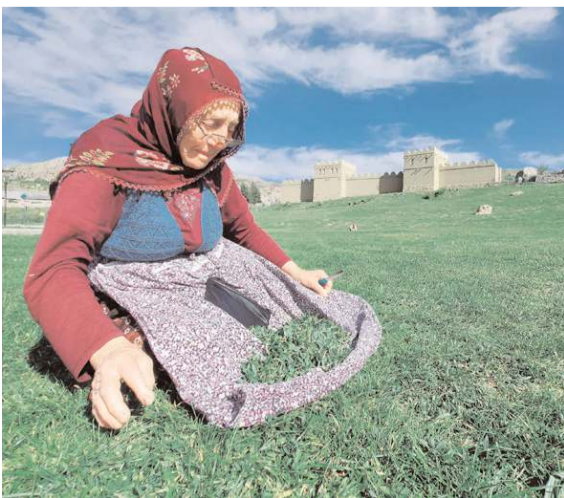
Doğada kendiliğinden yetişen madımak, zahmetli bir sürecin ardından sofralara geliyor.