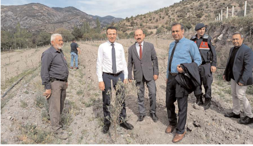
Kamil köyünde çok sayıda zeytin fidanı toprakla buluşturuldu.