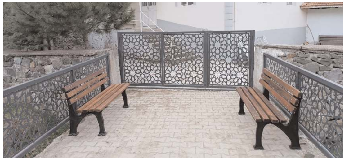
Çorum İl Özel İdaresi, bazı köylerin oturma bankı ihtiyacını karşıladı.