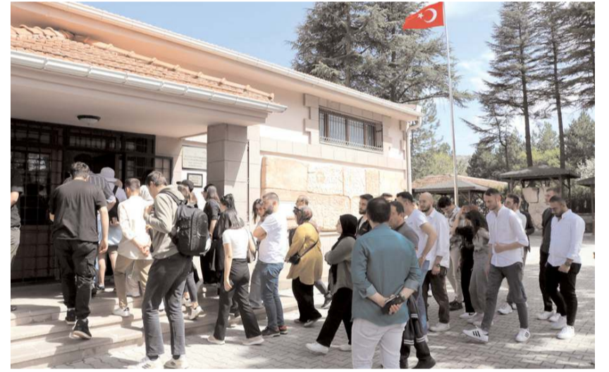
Kafile Hattuşa Ören Yeri, Boğazköy Müzesi ve Yazılıkaya Açık Hava Tapınağı'nı gezdi.