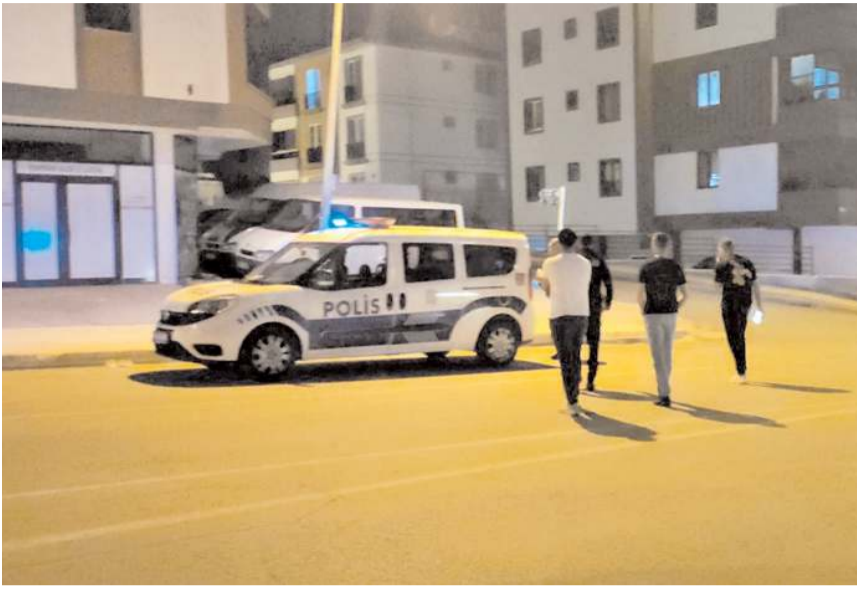
Alkollü araç kullanan 13 sürücüye 153 bin 710 lira ceza uygulandı.