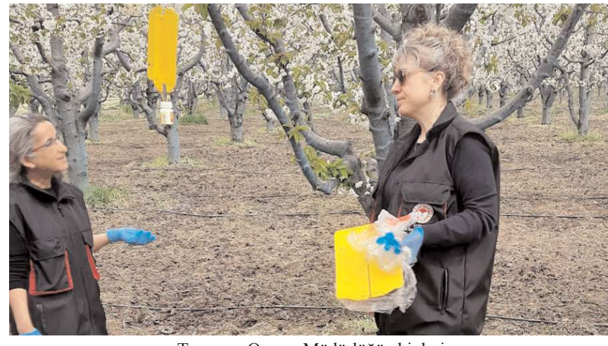
Tarım ve Orman Müdürlüğü ekipleri Deliler ve Ömerbey köylerinde çalışma yaptı.