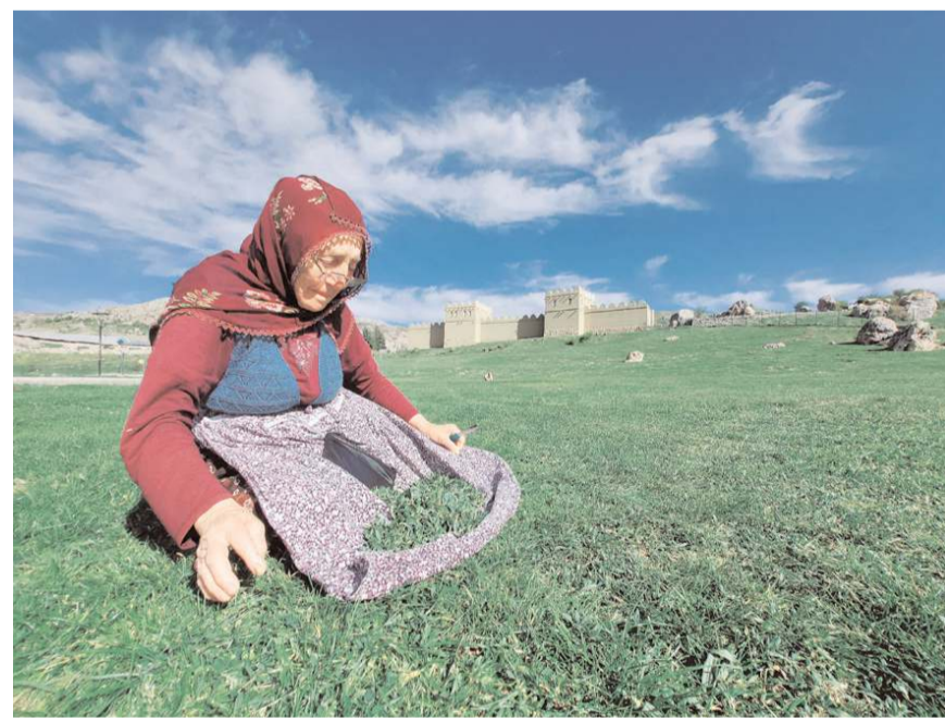
Doğada kendiliğinden yetişen madımak, zahmetli bir sürecin ardından sofralara geliyor.

Zahmetli bir sürecin ardından mutfağa ulaşan madımak otu, geleneksel yöntemlerle pişirildikten sonra sarmsaklı yoğurt ile servis ediliyor.(AA)