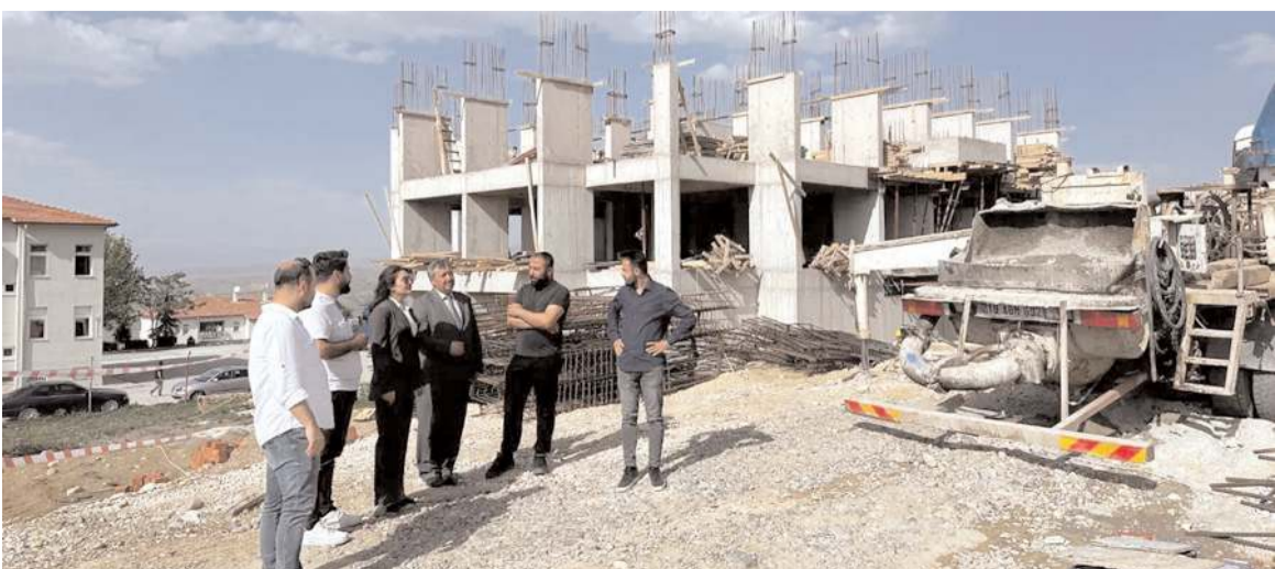
TOKİ Laçın'e 59 konut yapıyor.