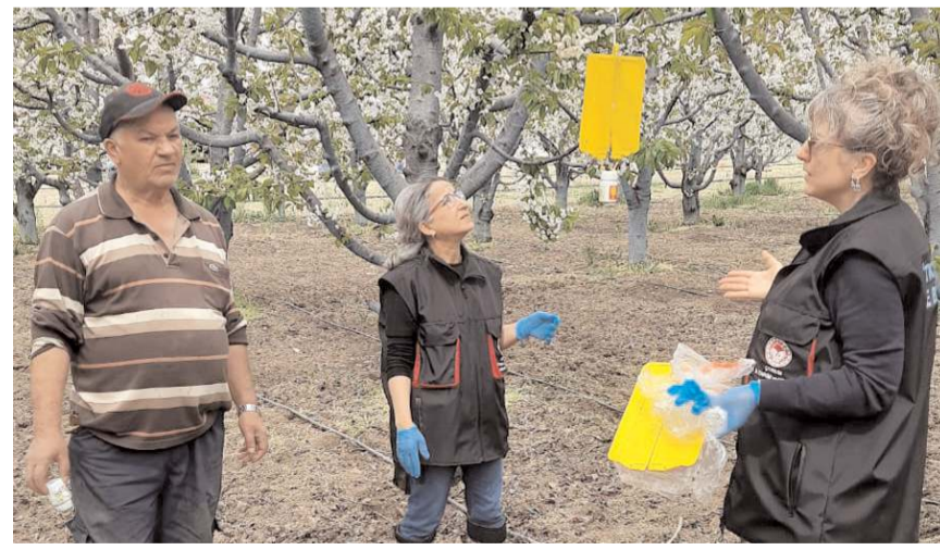
Kiraz sineği mücadelesinin başarıyla yapılabilmesi için sarı yapışkan tuzaklar kiraz bahçelerine asıldı.

Kurulan sarı tuzaklarla zararlı canlıların ağaçlara verdiği zararın önüne geçmesi hedefleniyor.