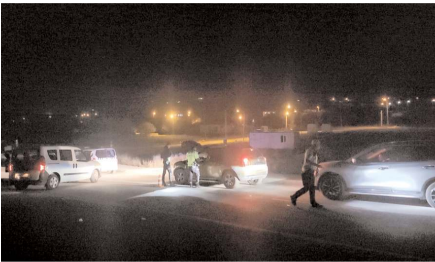
Kentin farklı noktalarında yapılan trafik kontrollerinde ise 125 araç sorgulandı.

Çorum Emniyet Müdürlüğüne yapılan genel asayiş uygulamasında, aranması bulunan iki şahıs yakalandı, alkollü araç kullanan 13 sürücüye 153 bin 710 lira ceza uygulandı.