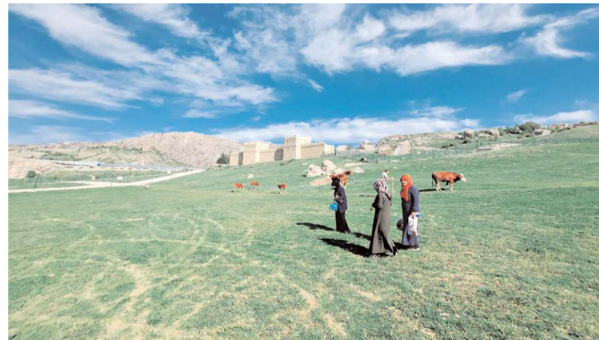
Kadınlar, tek tek doğadan topladıkları madımakla hem aileleri için yemek yapıyor hem de pazarlarda satarak ek gelir elde ediyor.