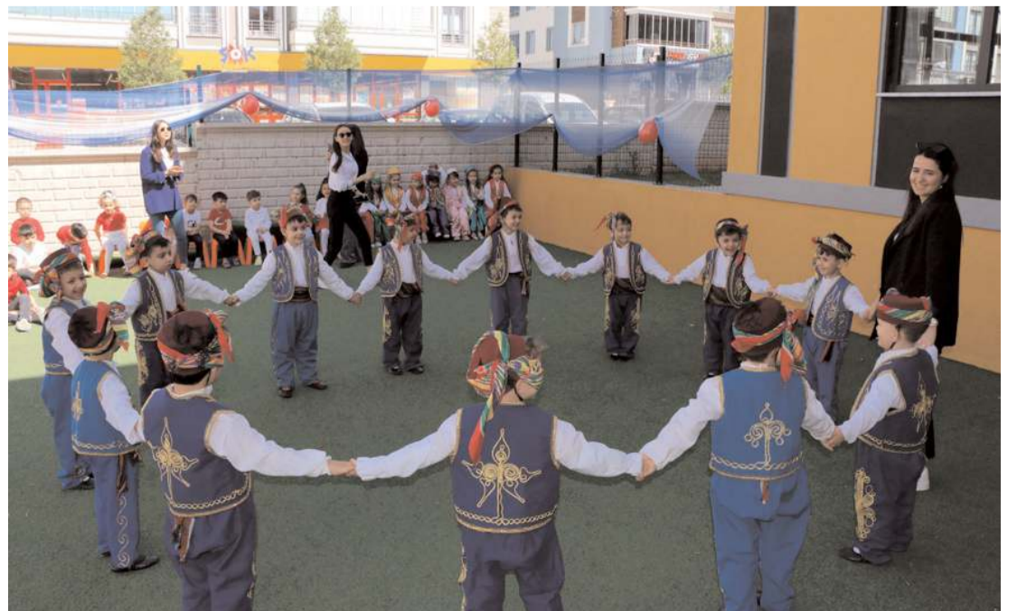
Öğrenciler yaptıkları gösterilerle ailelerinden bol bol alkış aldılar.