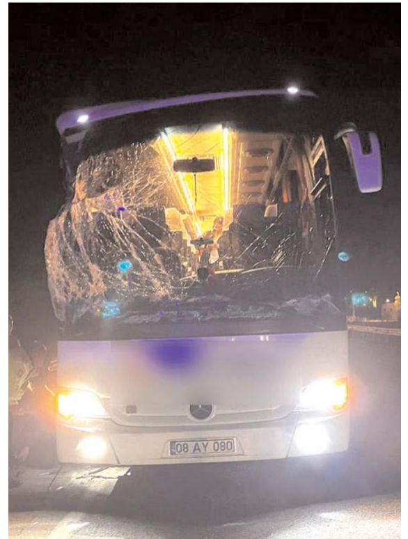
Kazada otobüste maddi hasar meydana geldi.