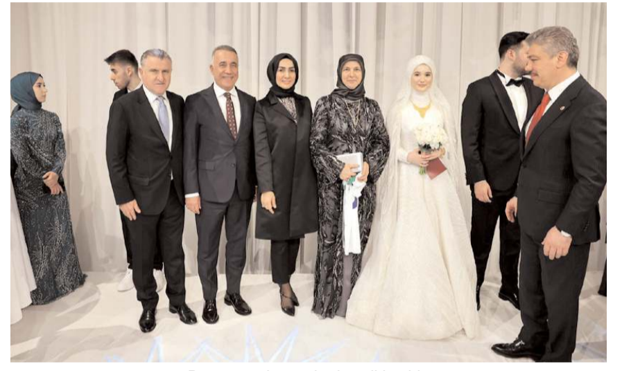
Düğüne çok sayıda davetli katıldı.