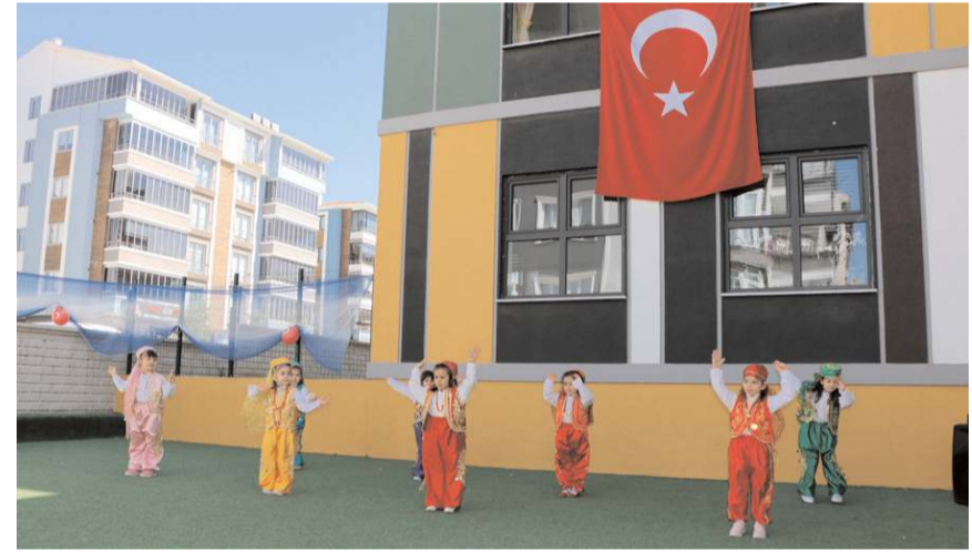
Minikler hazırladıkları gösterileri sundular.

Renkli görüntülere sahne olan programda Pırlantalar, Yıldızlar, İnci Taneleri ve Bilginler sınıfı öğrencileri hünelerini sergilediler.