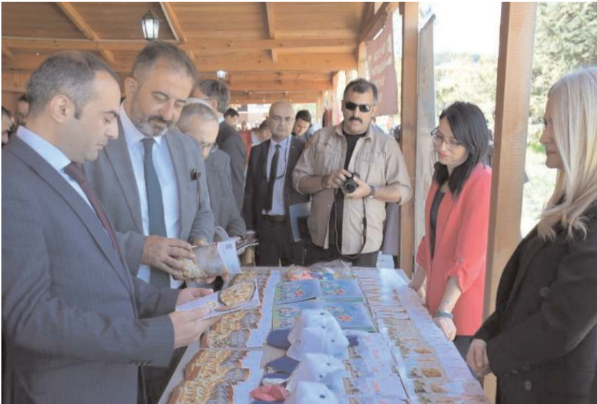
Elvançeşme'de yapılan törende stantlar açıldı.