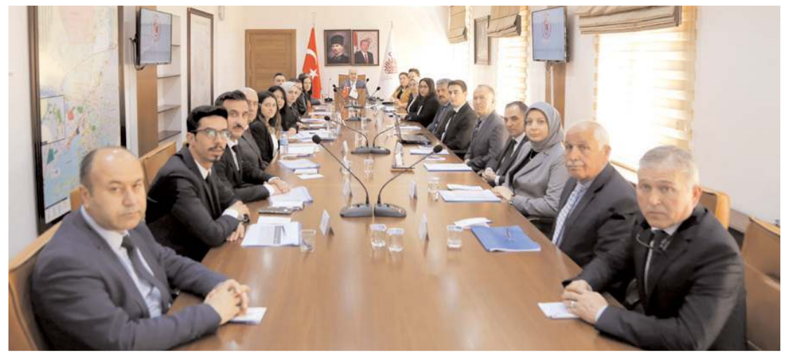
Toplantıda kütüphanelerde yapılan çalışmalar değerlendirildi.

Çorum'da, hiçbir eğitim çalışanına neden ödül verilmediği yetkililerce izah edilmelidir. Bu ödül uygulamasının neye göre kime göre belirlendiği ise merak konusudur. MEB gerekli açıklamayı yapmalıdır."