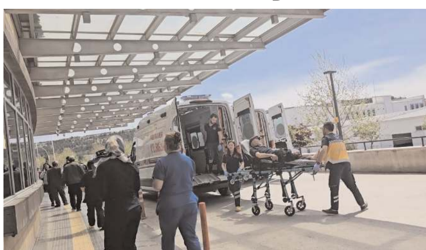
Yaralılar hastanede tedavi altına alındı.