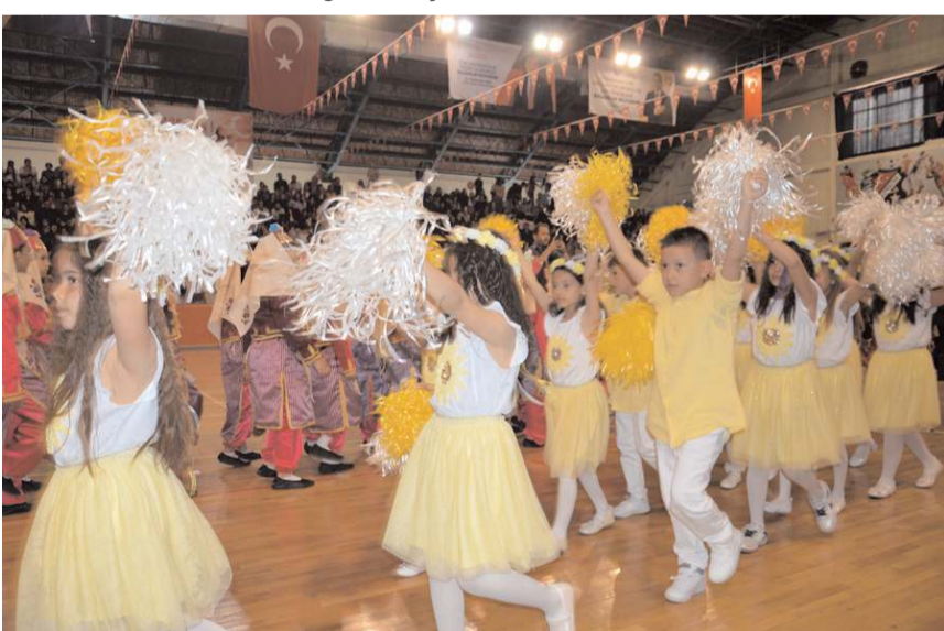
Öğrenciler hazırladıkları gösterileri sergilediler.