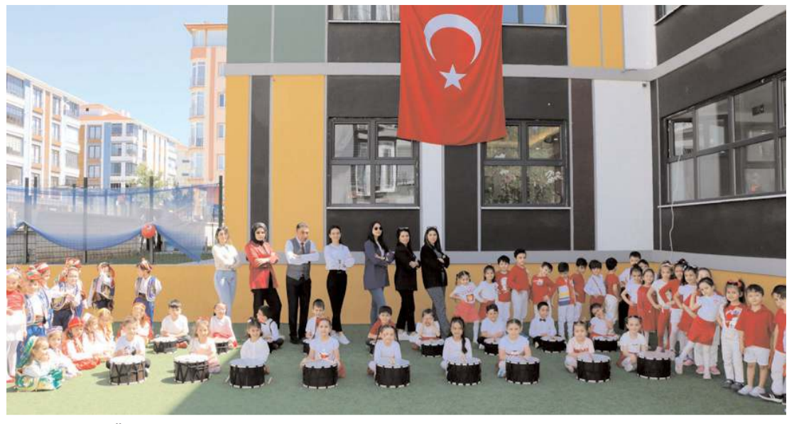
Ümit Kreş ve Gündüz Bakımevi, 23 Nisan nedeniyle kutlama programı düzenledi.