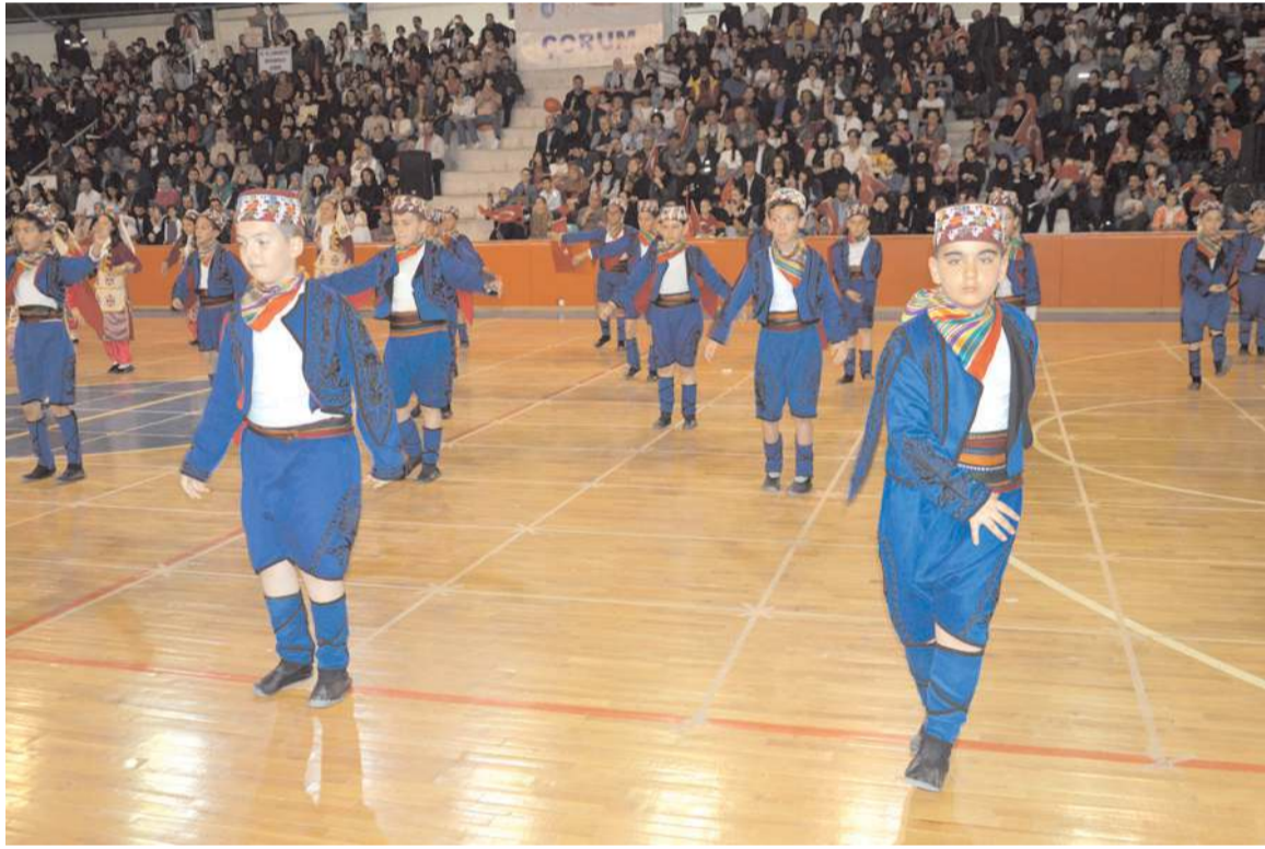
23 Nisan Ulusal Egemenlik ve Çocuk Bayramı nedeniyle Atatürk Spor Salonunda kutlama programı yapıldı.