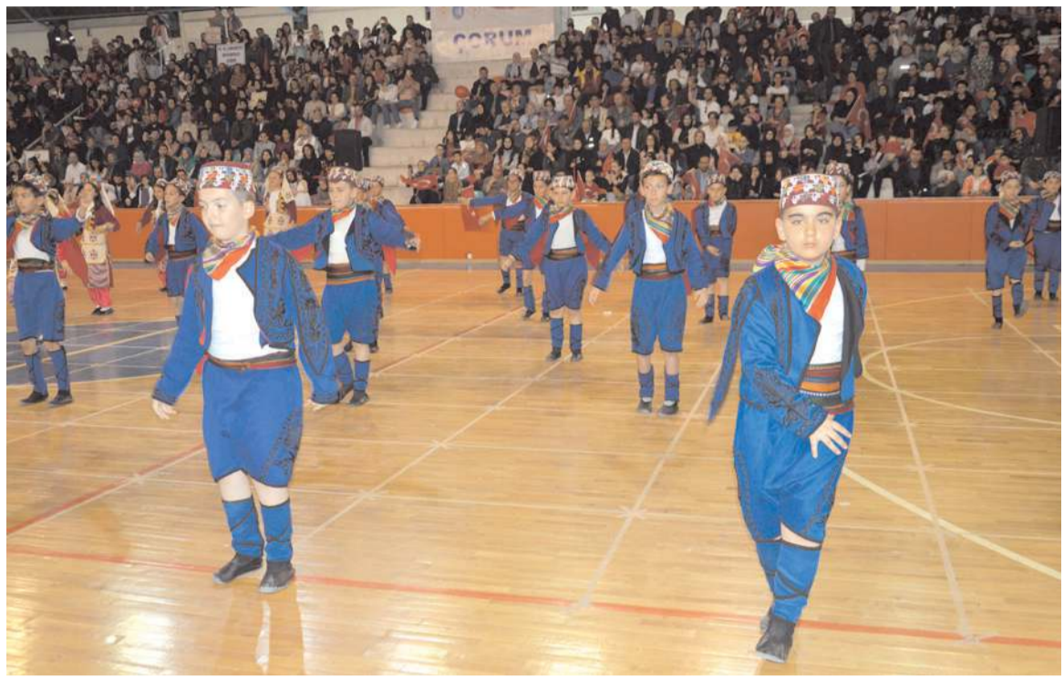
23 Nisan Ulusal Egemenlik ve Çocuk Bayramı nedeniyle Atatürk Spor Salonunda kutlama programı yapıldı.