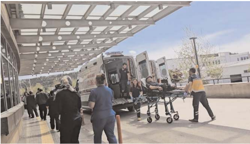
Yaralılar hastanede tedavi altına alındı.

Yaralılar sağlık ekiplerince yapılan müdahalenin ardından Hitit Üniversitesi Erol Olçok Eğitim ve Araştırma Hastanesi'ne kaldırılarak tedavi altına alındı.(AA)