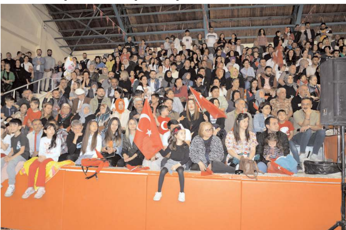
Vatandaşlar gösterileri büyük bir ilgiyle takip etti.