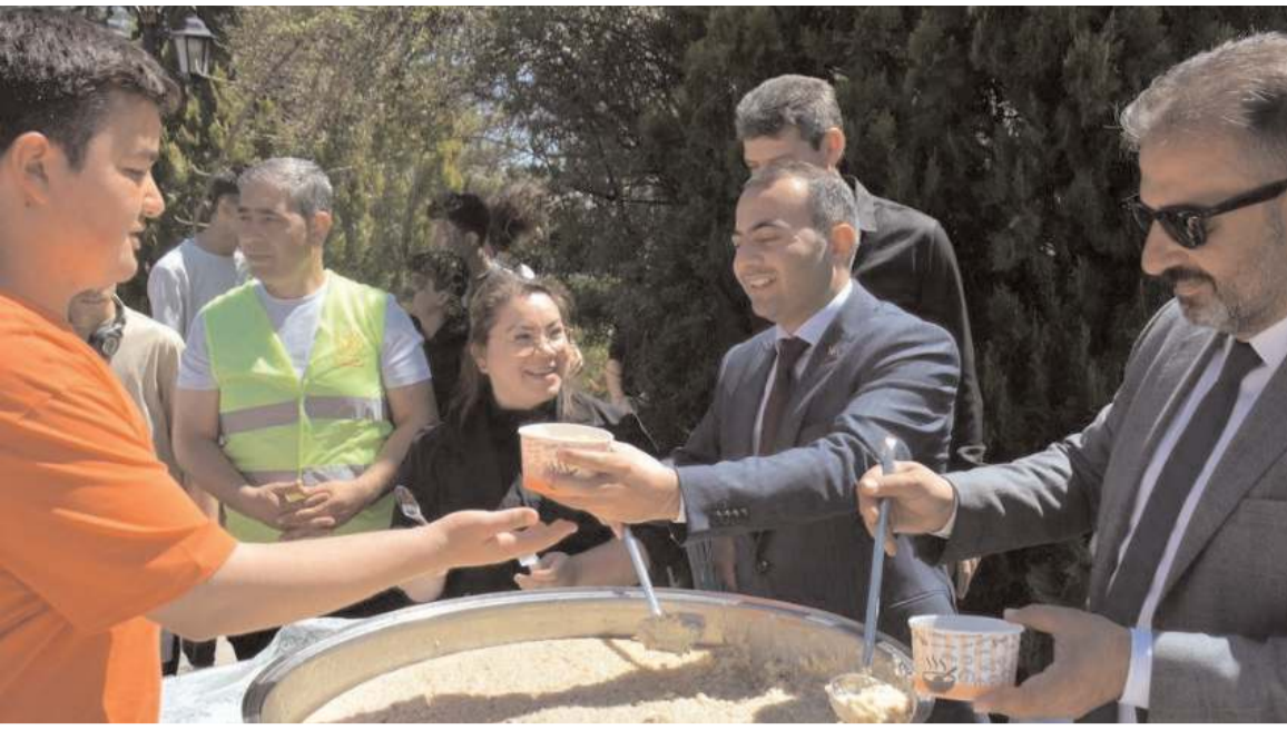
Turizm Haftasının açılış programı Elvançeşme'de yapıldı.