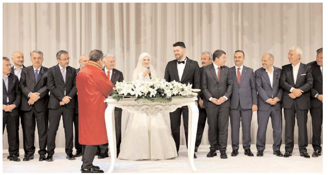
Genç çiftin düğün töreni İstanbul'da yapıldı.