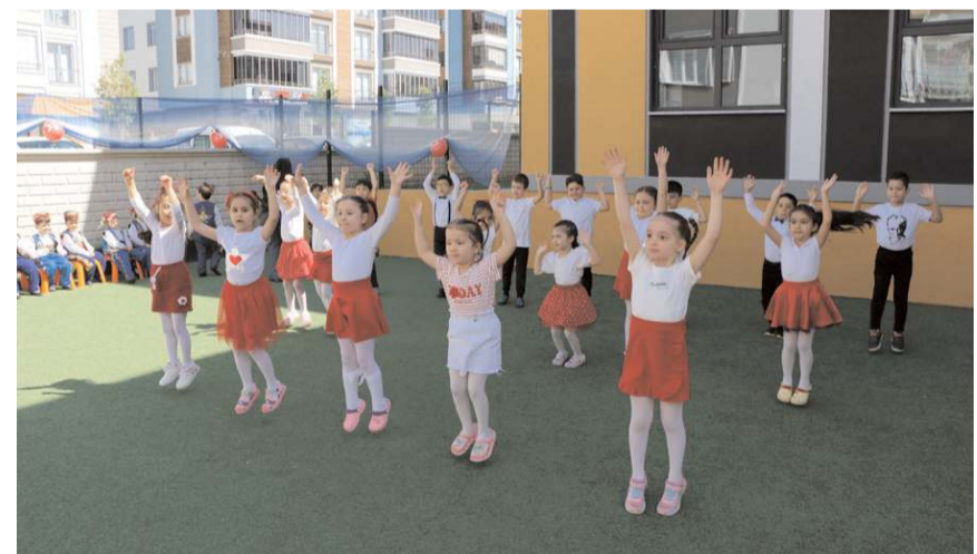
Miniklerin gösterileri büyük bir ilgiyle izlendi.