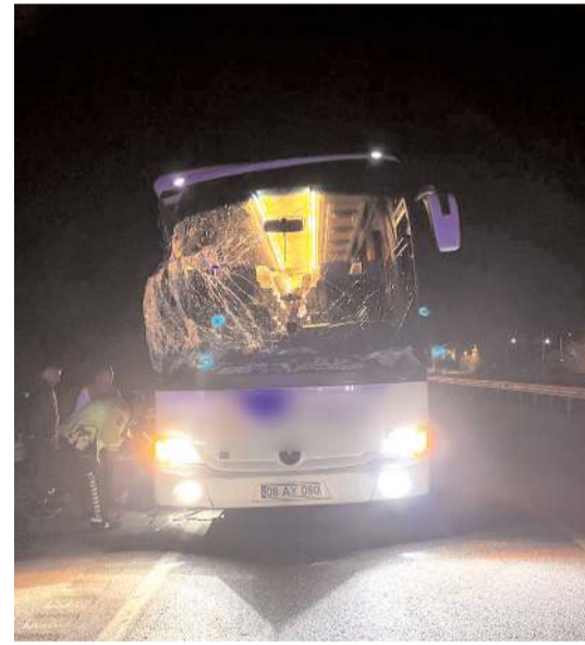
Kazada otobüste maddi hasar meydana geldi.