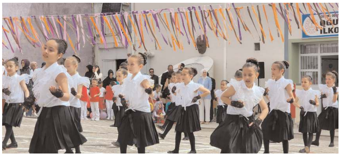
Öğrencilerin gösterileri izleyenlerden bol bol alkış aldı.