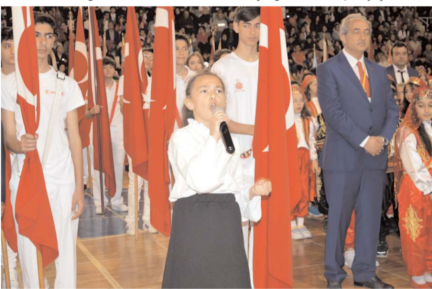
Öğrenciler şiirler seslendirdiler.