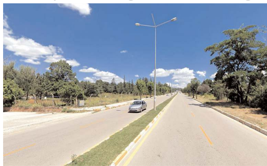
Gazi Caddesi-Şehitlik Kavşağı ile Çevre Yolu arası iki gün boyunca trafiğe kapatıldı.