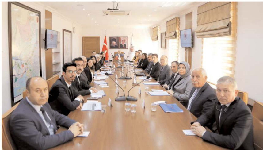
Toplantıda kütüphanelerde yapılan çalışmalar değerlendirildi.