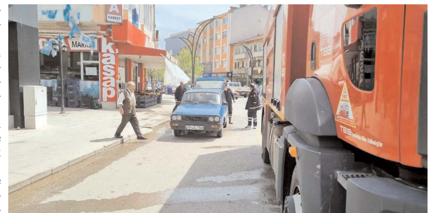
Olay Denizhan Günhan Mahallesi Yozgat Caddesi'nde meydana geldi.

Küçük çaplı patlamaların meydana geldiği yangın itfaiye ekiplerince söndürüldü.