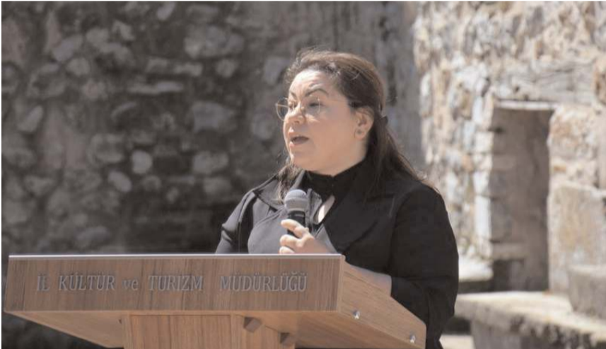
İl Kültür ve Turizm Müdürü Sümeyra Bektaş