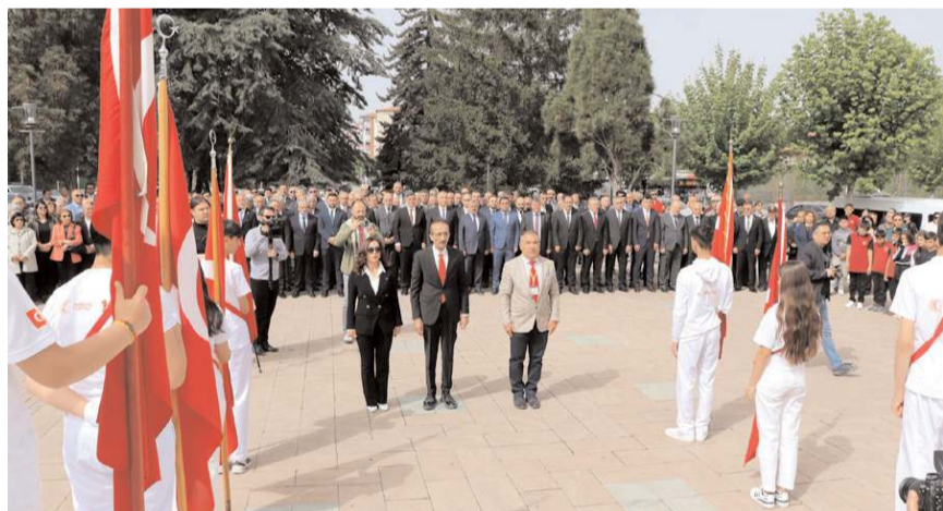
23 Nisan Ulusal Egemenlik ve Çocuk Bayramı dolayısıyla Atatürk Anıtı'nda program düzenlendi.