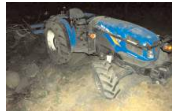
Olay Mehmet Dede Tekke köyünde meydana geldi.