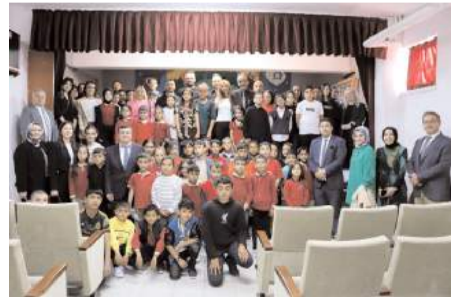
Öğrencilerin tiyatro gösterisinin ardından toplu hatıra fotoğrafı çekildi.