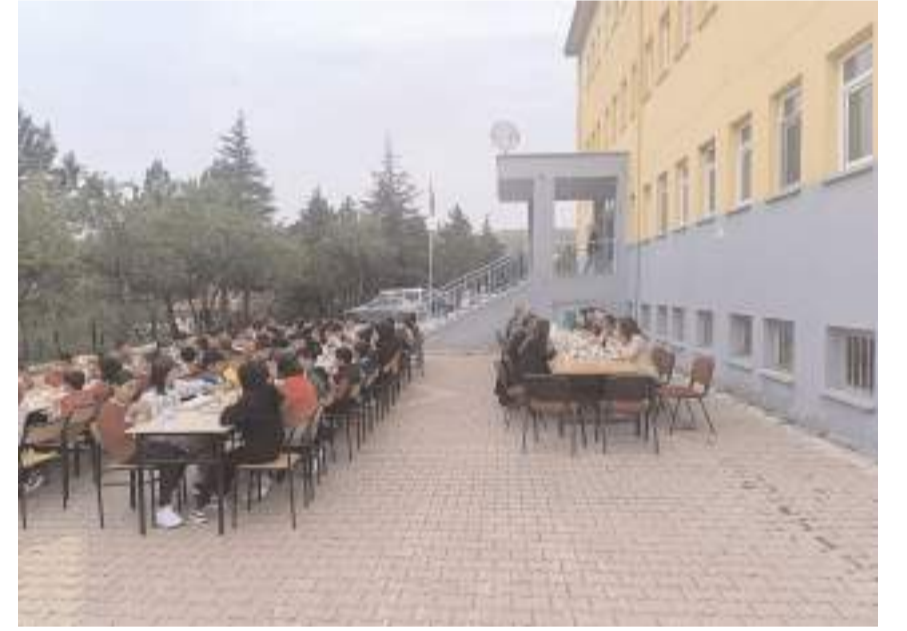
Okul bahçesinde ikramda bulunuldu.