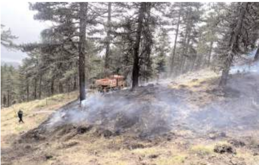
Kargı Orman İşletme Müdürlüğü itfaiye ekipleri yangını büyümeden söndürdü.

Kargı'da ormanlık alanda başlayan yangın itfaiye ekiplerince söndürüldü.