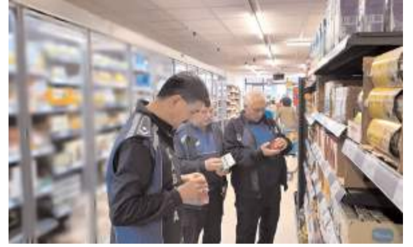
Çorum Belediyesi zabıta ekipleri zincir marketlerde denetim yaptı.

Son tüketim tarihi, kasa-reyon fiyat farklılığı ve etiketsiz ürün konularında kusurlu bulunan 5 iş yerine cezai işlem uygulandı.