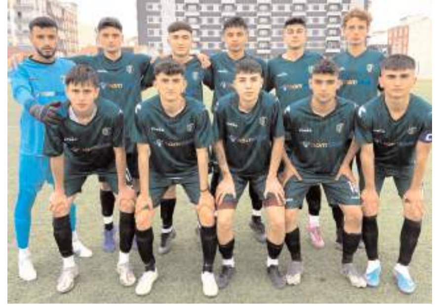
Mimar Sinan U 18 takımı Kırıkkale grubunda ilk maçında rahat kazandı