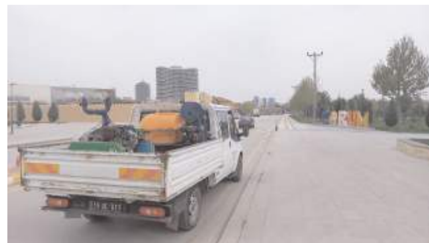
Ekipler, cadde ve sokaklarda ilaçlama çalışması yapıyor.

Nisan 2024 tarihinde ULV (soğuk sisleme) cadde ve sokak ilaçlama çalışmaları başlatılmıştır” dedi.