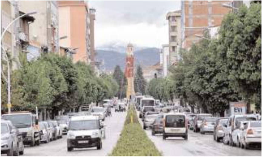
Çorum’da mart ayında trafiğe kayıtlı araç sayısı 200 bin 587’ye yükseldi.

Mart ayında trafiğe kayıtlı araç sayısı Samsun’da 463 bin 844, Tokat’ta 221 bin 816, Amasya’da ise 144 bin 456 olarak gerçekleşti.