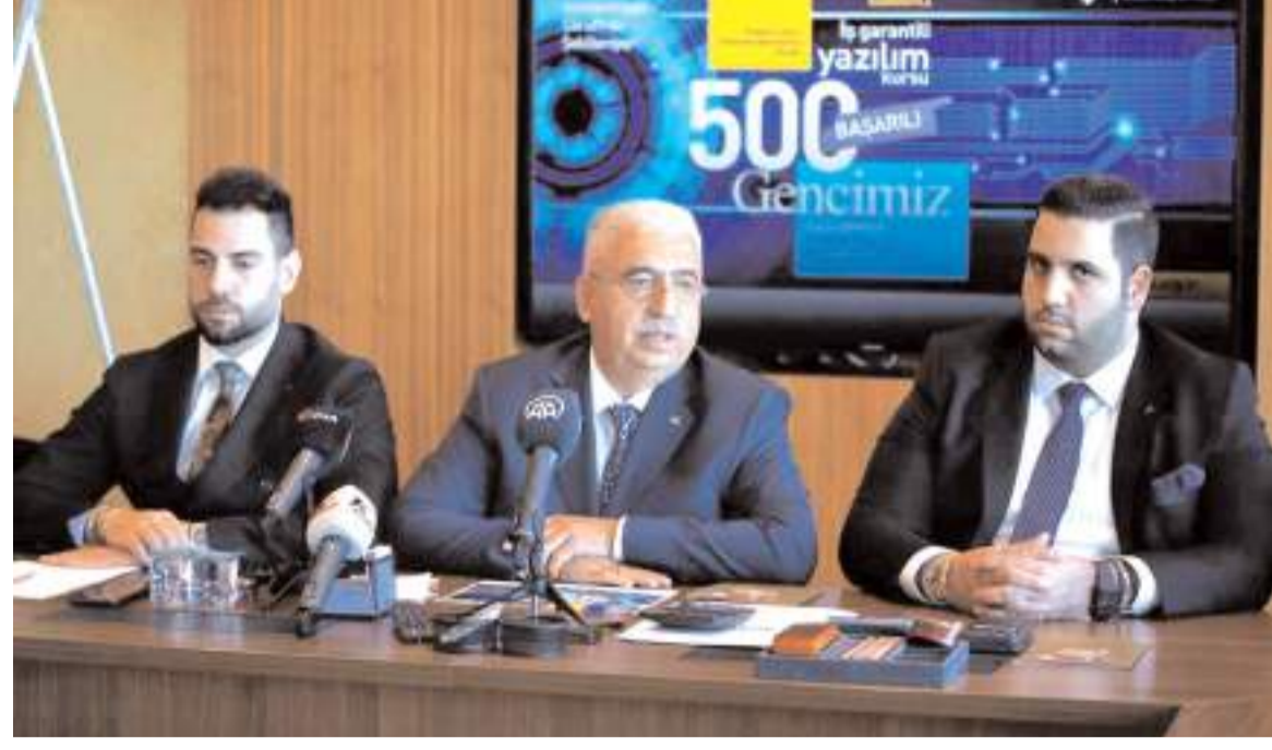
Armağaz Arsan Marmara Doğalgaz Dağıtım A.Ş.'nin Dağıtım Şebekesinin Satış İhalesi'ne en yüksekteklifi Ahgaz - Ahlatıcı Doğal Gaz ve Elektrik A.Ş. verdi.

"Şirketimizin %51, Şirketimizin bağlı ortaklığı Enerya Enerji Anonim Şirketi'nin %49 oranında pay sahibi olduğu A Doğal Gaz ve Elektrik A.Ş., Enerji Piyasası Düzenleme Kurumu tarafından 24.04.2024 (bugün) tarihinde gerçekleştirilen, "Armağaz Arsan Marmara Doğalgaz Dağıtım A.Ş.'nin Dağıtım Şebekesinin Satış İhalesi" konulu ihaleye katılmış ve açık artırma turunda en yüksek teklifi vererek ihalede 1.000.000 TL'dir. Doğalgaz sektöründe büyüme hedefimiz kapsamında dağıtım yaptığımız bölge sayısını 11'e çıkardık. Organik ve inorganik büyüme ile sektördeki payımızı büyüteceğiz. Yalova ve ilçeleri ihalesi gibi inorganik büyüme fırsatlarını değerlendirmeye devam edeceğiz. İhale ile ilgili gelişmeler, kamuoyu ve yatırımcılarımıza bildirilecektir. Kamuoyuna saygıyla sunarız."