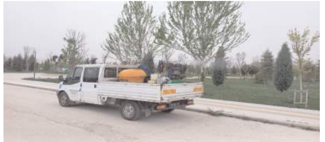
Hava sıcaklığının artması nedeniyle bu yıl vektörel mücadele çalışmalarına erken başlandı.