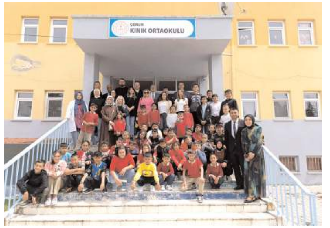
Çorum Eczacı Odası, 23 Nisan Ulusal Egemenlik ve Çocuk Bayramı nedeniyle Kınık Köyü Ortaokulunda kutlama programı düzenledi.

Aşılama her çocuk için yaşamsaldır, her çocuğun sağlıklı yaşama hakkı vardır. Çocukların aşılatmak ebeveynlerin en önemli sorumluluklarından biridir." (Haber Merkezi)