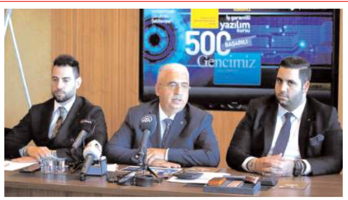
Ahlatıcı Holding doğalgaz dağıtım alanında büyümeye devam ediyor.