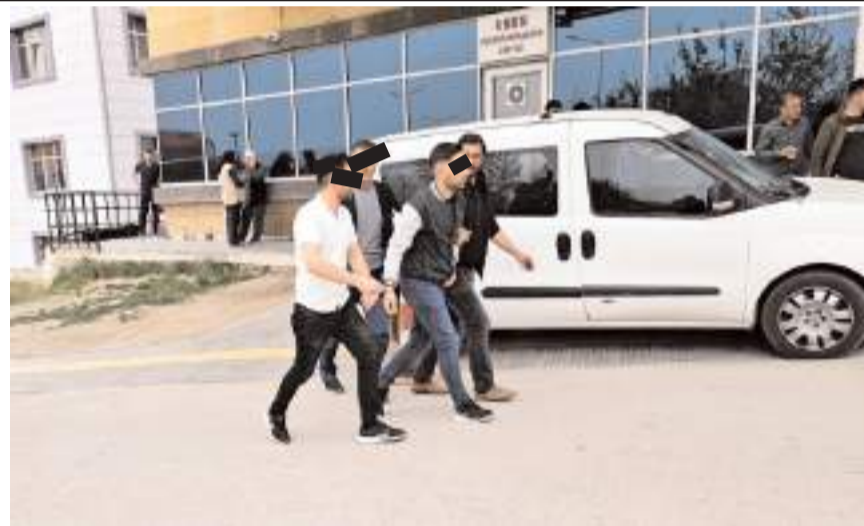
2 firari hükümlü, yakalanarak cezaevine gönderildi.

Çalışmalar kapsamında, kasten adam öldürme suçundan hakkında 12 yıl 2 ay kesinleşmiş hapis cezası bulunan K.F. (25) ile kasten yaralama suçundan 3 yıl 7 ay cezası bulunan U.D. (22) yakalandı.