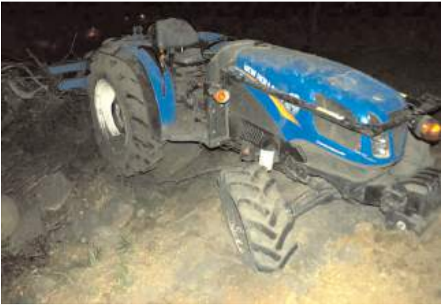
Olay Mehmet Dede Tekke köyünde meydana geldi.

Dodurga'da devrilen traktörün sürücüsü hayatını kaybetti.