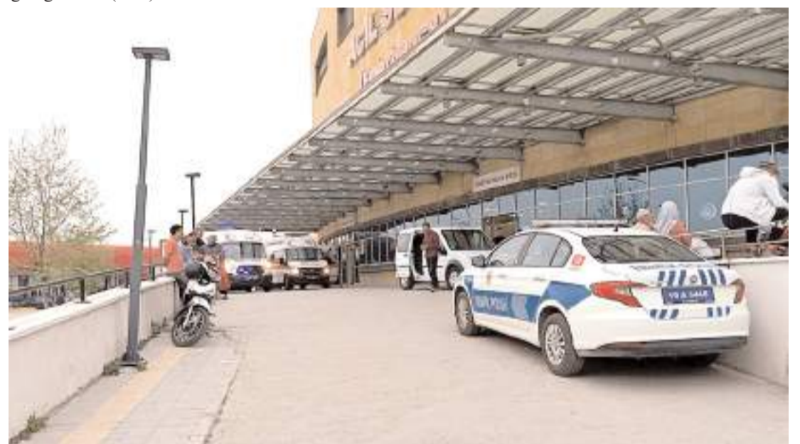
Yaralılar hastanede tedavi altına alındı.