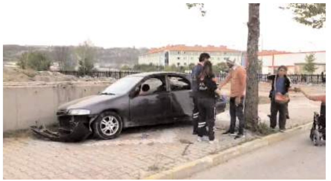
Kaza İnönü Caddesi'nde meydana geldi.

lendikleri için mutlu ve heyecanlı olduklarını anlattı.(AA)