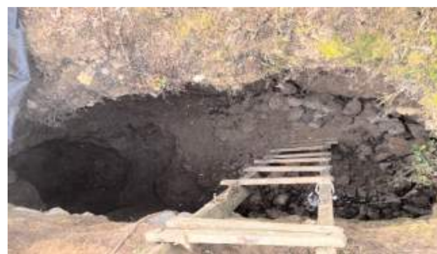
Olay Dikenli köyü yakınlarında meydana geldi.

Şüphelilere ait dektör ve kazı malzemelerine de el konuldu.(AA)