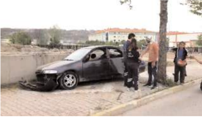
Kaza İnönü Caddesi'nde meydana geldi.

■ Çorum'da otomobil ile elektrikli motosikletin çarpıştığı kazada 1'i çocuk 3 kişi yaralandı.