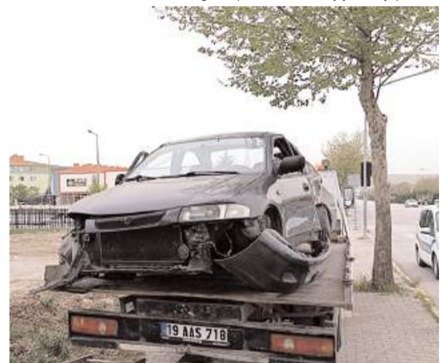
Kaza yapan araç çekici ile olay yerinden kaldırıldı.