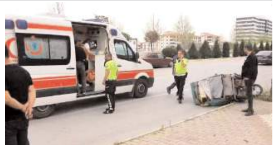
Yaralılara ilk müdahale 112 acil sağlık ekipleri tarafından olay yerinde yapıldı.

Otomobil sürücüsü Volkan Ç.'nin alkollü olduğu öğrenildi.