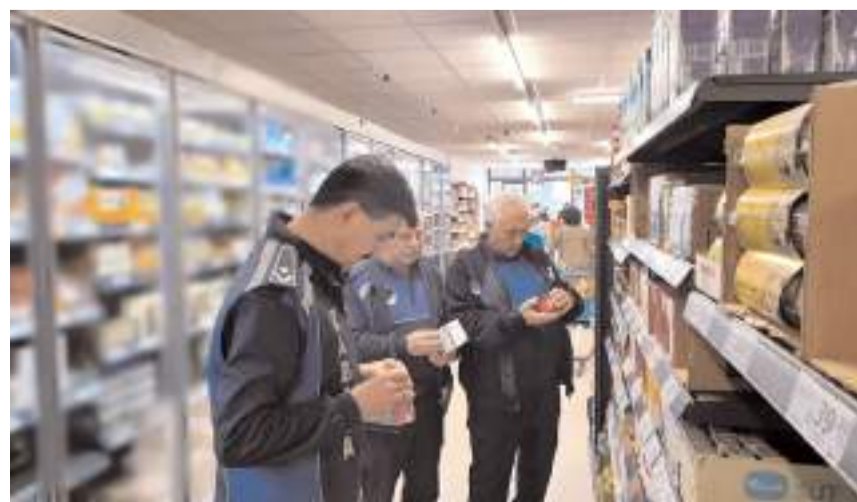
Çorum Belediyesi zabıta ekipleri zincir marketlerde denetim yaptı.