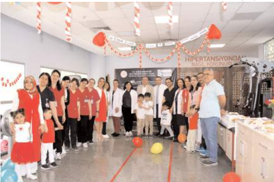
Etkinliğin sonunda toplu hatıra fotoğrafı çekinildi.