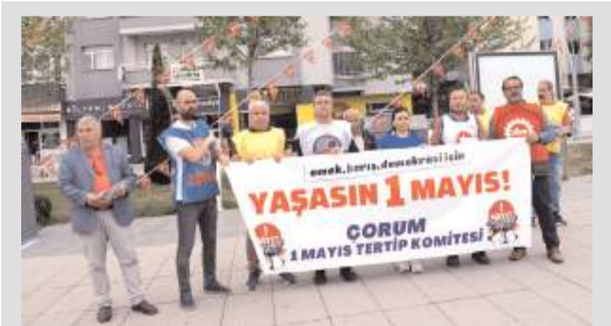
Bildiri dağıttı Kadeş Barış Meydanında yapıldı.