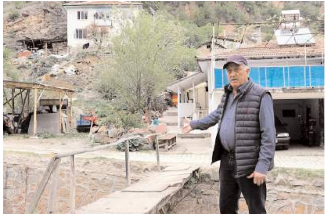
Obruk köyünde yaşayan vatandaşlar, köy merkezinden geçen derenin ıslah edilmesini talep etti.

Nihat Polat daha sonra Kıbrıs BRT Tv'de yayınlanan Türksöy ile Geleceğe programına katılarak Türkiye Sürücü Eğitimi İşverenler Sendikası olarak hazırladıkları Türk Cumhuriyetleri Sürücü Eğitimi programı hakkında bilgiler verdi. (Haber Merkezi)