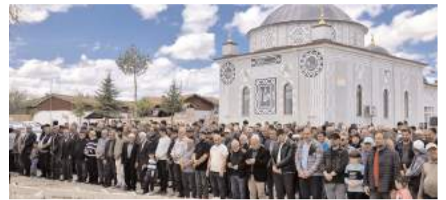
Yağmur dualarına katılım yüksek oldu.