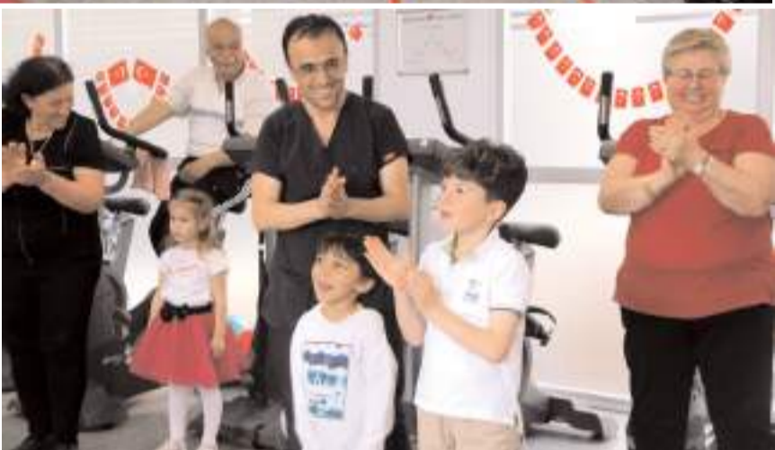
Programda çocuklar, dedeleri ve nineleri ile birlikte egzersiz yaptı.