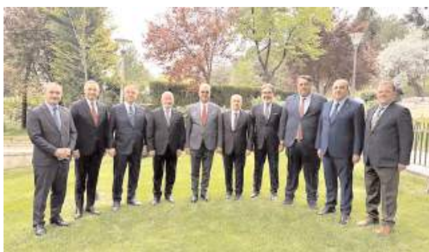
Buluşmada Çorumla ilgili konular istişare edildi.