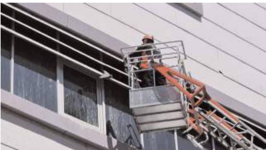
Hitit Üniversitesi Erol Olçok Eğitim ve Araştırma Hastanesi penceresine güvercinin sıkıştığı görülen vatandaşlar itfaiyeye haber verdi.