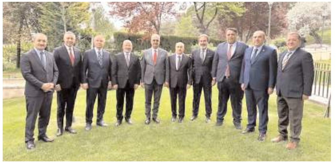
Buluşmada Çorumla ilgili konular istişare edildi.