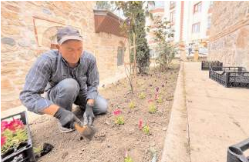
Şeyh Yavsi Camisi'nin bahçesinde peyzaj ve çevre düzenleme çalışması yapıldı.

Çizikci, benzer çalışmaların ilçedeki diğer tarihi mekanlarda da yapılacağını kaydetti. (AA)