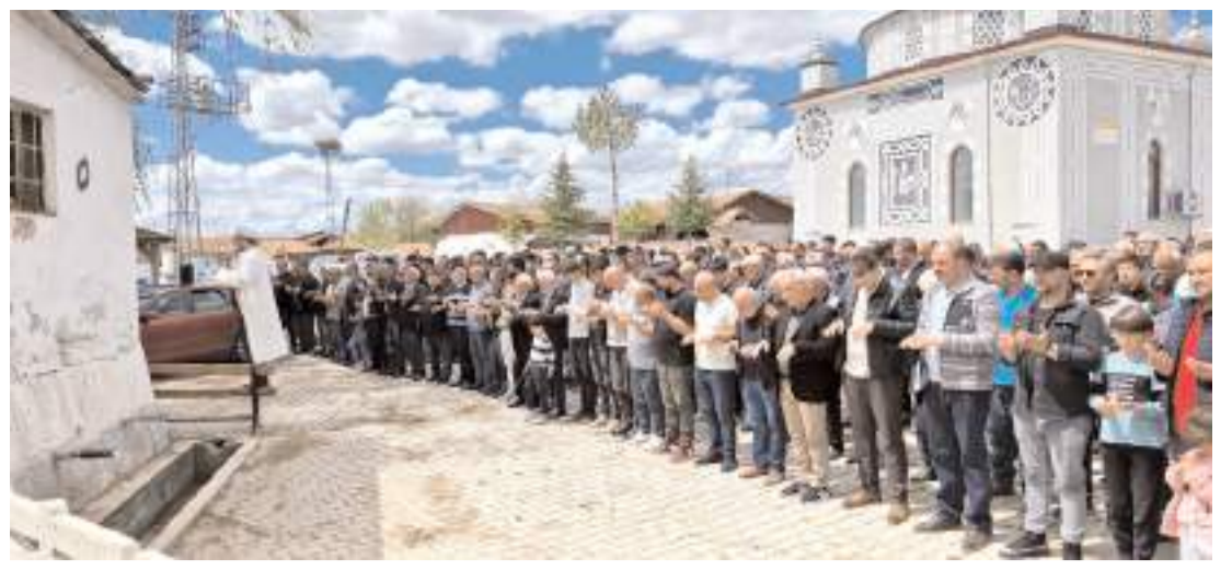
Altı farklı köyde yaşayan vatandaşlar yağmur duasına çıktı.