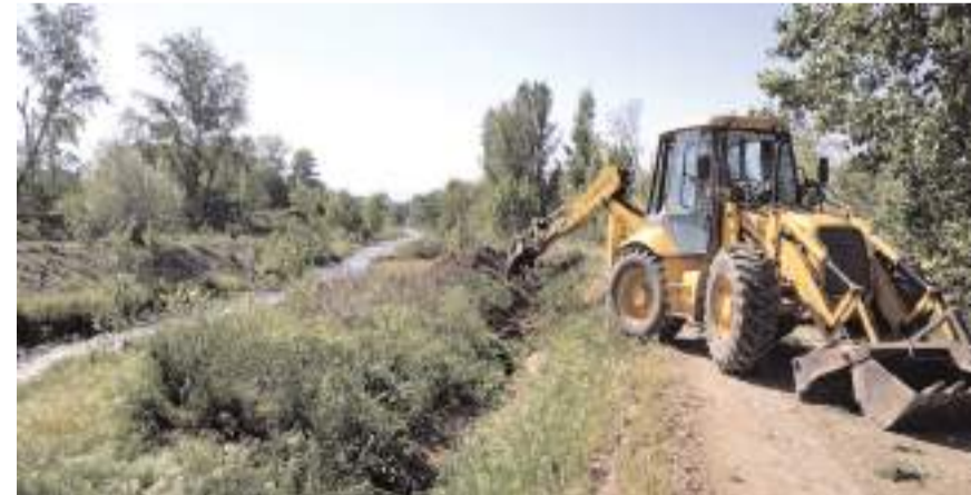
Belediye ekipleri çiftçilerin ekili arazilerini sulayabilmeleri için önemli olan kanallarda temizlik yapıyor.

İlçedeki bütün kanalları temizleyeceklerini belirten Çizikçi, çalışmaların İskilip Şimali Sitesi ile ilçe merkezi arasında, Bağözü mevkiindeki 15 kilometrelik kanalda sürdüğünü kaydetti.(AA)