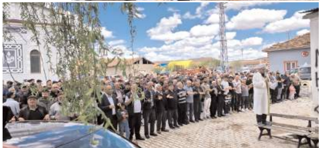
Yağmur duaları Çöplü köyü, İbrahim köyü, Kapaklı köyü, Bolatcık köyü, Belpınarı köyü ve Örukaya köyünde yapıldı.