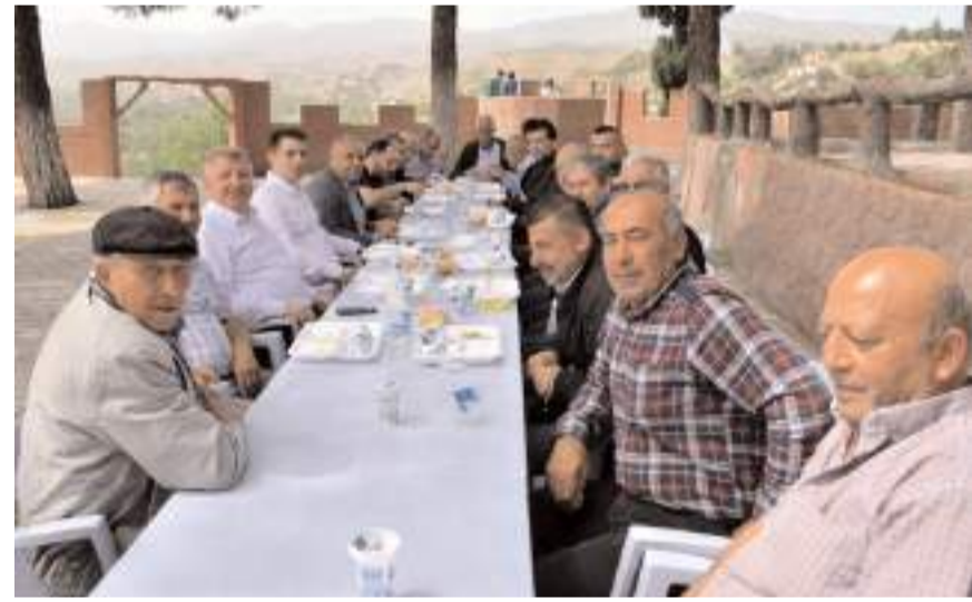
Duanın ardından vatandaşlara Dodurga Belediyesi Kayabaşı Kültür Salonu'nda yemek ikram edildi.