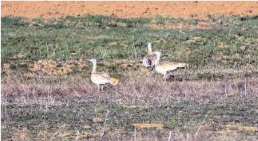
Toy kuşlarının tüm dünyada sayılarının sadece 44 bin ile 57 bin arasında olduğu tahmin ediliyor.