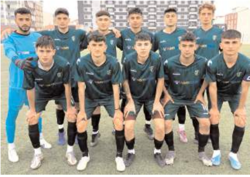
Mimar Sinan U 18 takımı bugün finale yükselmek için karşılaşacak