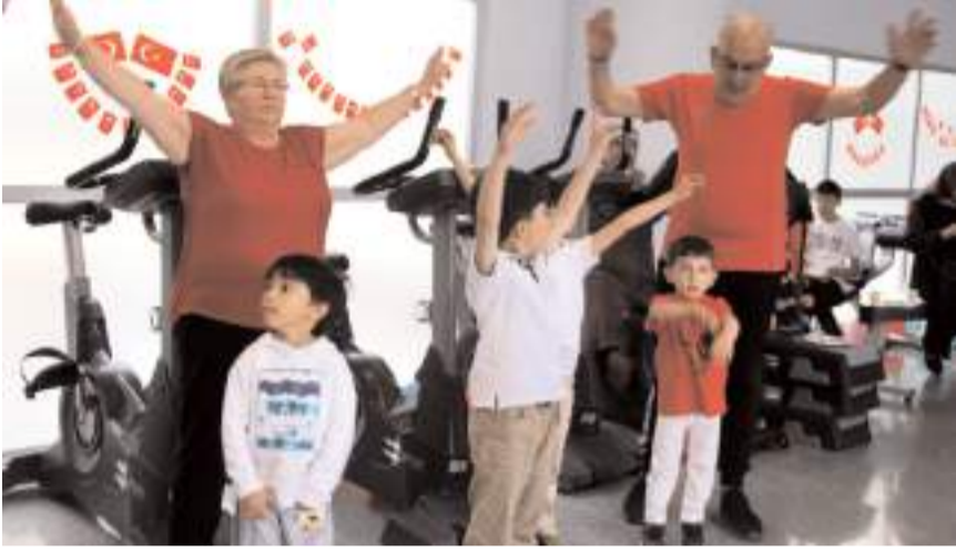
Etkinlik Hitit Üniversitesi Erol Olçok Eğitim ve Araştırma Hastanesi Kardiyak Rehabilitasyon Merkezinde yapıldı.