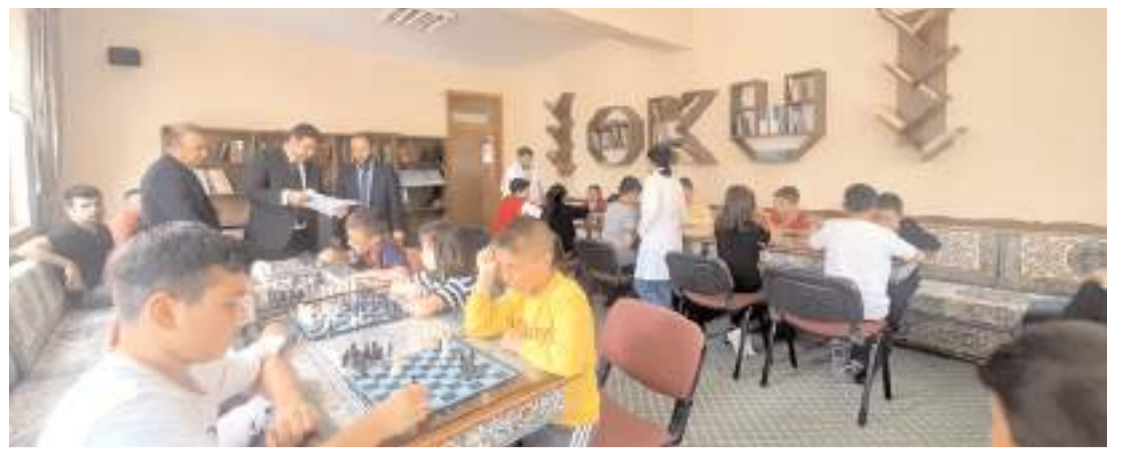
Turnuvayı Gençlik ve Spor İlçe Müdürlüğü, İlçe Milli Eğitim Müdürlüğü ve İlçe Müftülüğü düzenledi.