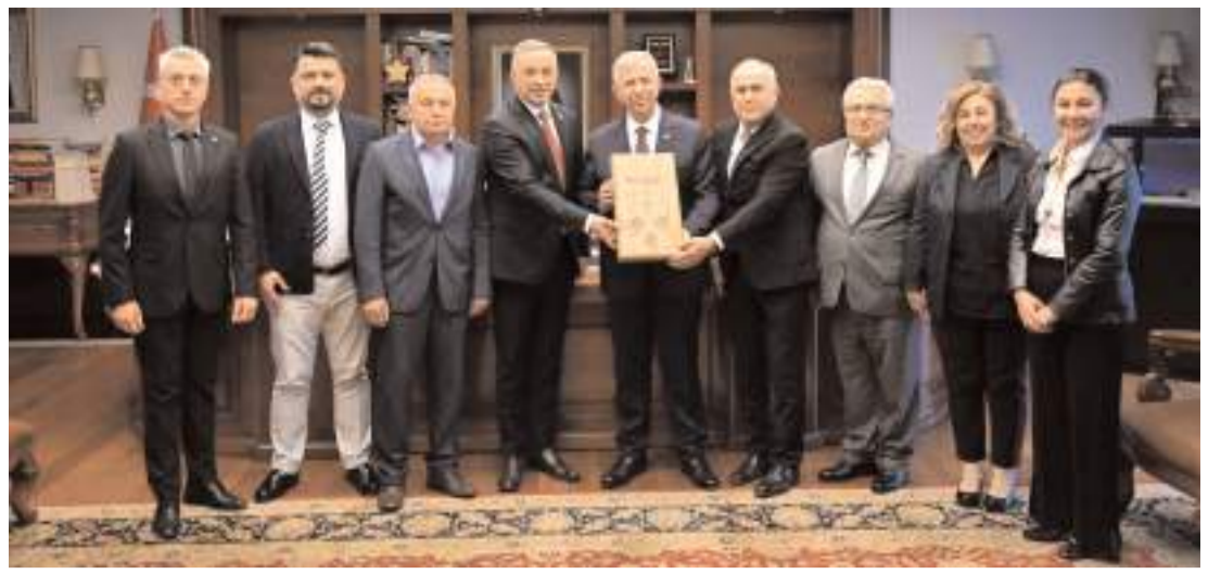
Vakıf 19 Başkanı Alper Bilan, CHP Çorum Milletvekili Mehmet Tahtasız ve Yönetim Kurulu Üyeleri Ankara Büyükşehir Belediye Başkanı Mansur Yavaş'ı ziyaret etti.

Bir ayağı kopan ve kanadından yaralanan güvercin, tedavi için Çorum Belediyesi Veteriner İşleri Müdürlüğüne götürüldü. (AA)