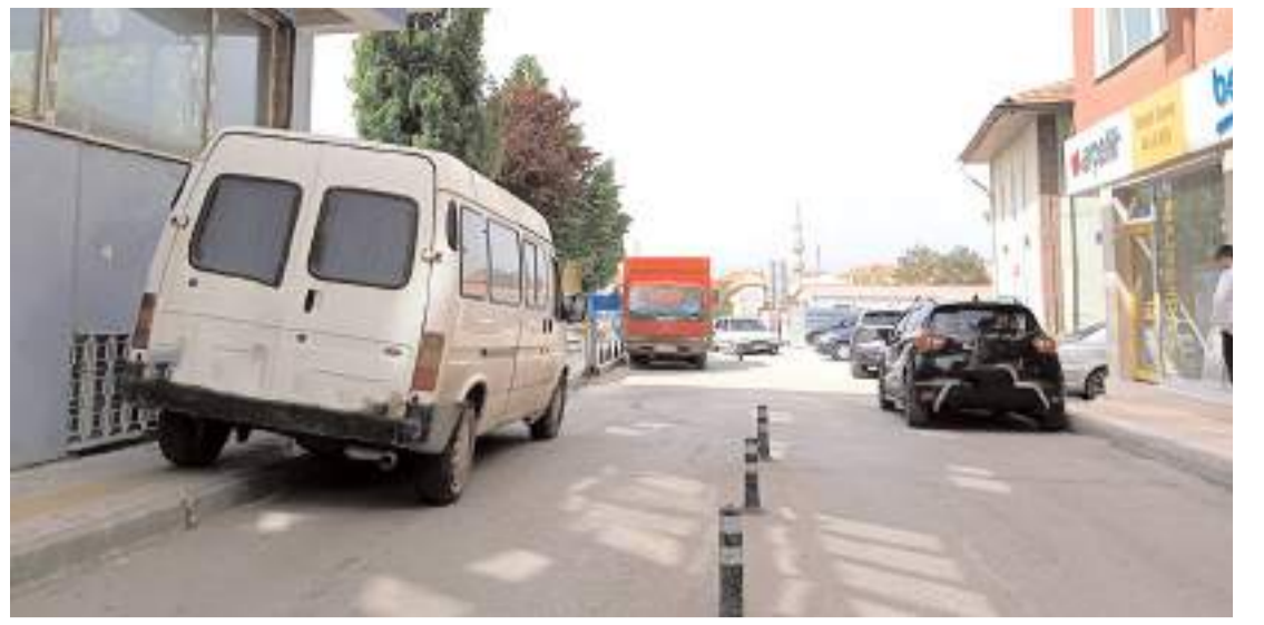
Minibüs sürücüsüne vatandaşlar tepki gösterdi.