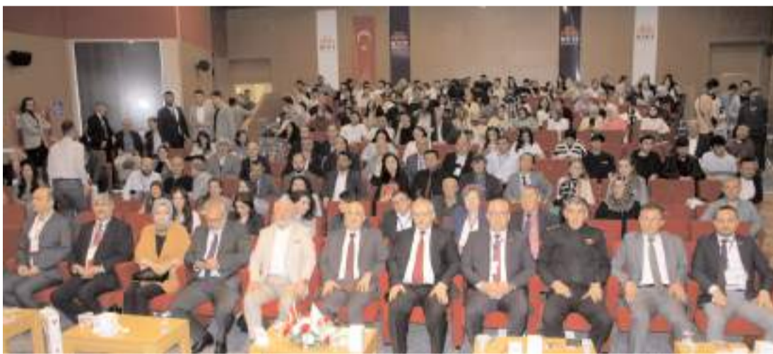
Sempozyumun açılış programı MYO Ethem Erkoç Konferans Salonunda yapıldı.