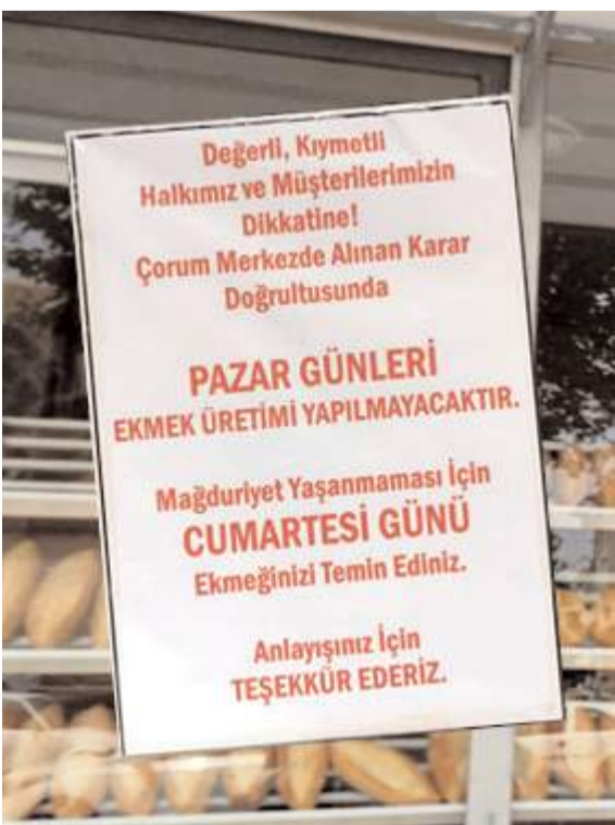
Fırınlara asılan duyuruda pazar günleri ekmek üretimi yapılmayacağı belirtildi.