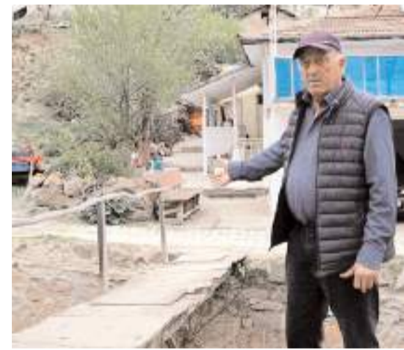
Obruk köyünde yaşayan vatandaşlar, köy merkezinden geçen derenin ıslah edilmesini talep etti.