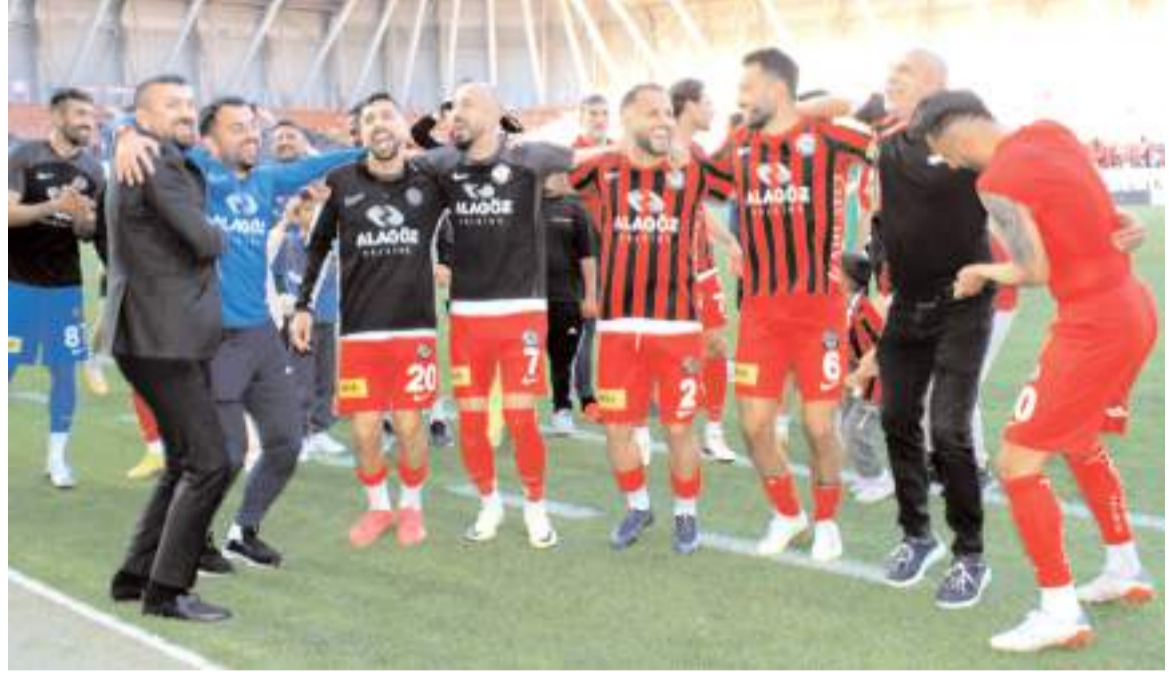
Kırmızı Siyahlı takım bu sevinci yarın Erzurumspor deplasmanında da kazanarak devam ettirmek istiyor