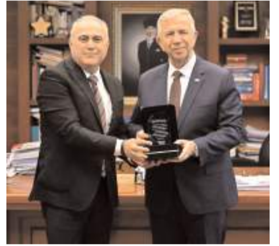
Vakıf 19 Başkanı Alper Bilan, Ankara Büyükşehir Belediye Başkanı Mansur Yavaş'a plaket verdi.

Bilan, daha sonra aynı heyetle 31 Mart Yerel Seçimlerinde Mamak'tan Belediye Başkanı seçilen hemşhremiz Veli Gündüz Şahin'i ziyaret ettiklerini ifade ederek, hayırlı olsun dileklerini ilettilerini aktardı.