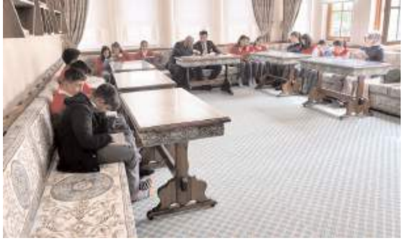
Etkinlik Ortaköy Gençlik Merkezi'nde yapıldı.

Etkinliğin ardından öğrencilerle sohbet eden Yampal, bol bol kitap okumalarını tavsiye etti. (AA)