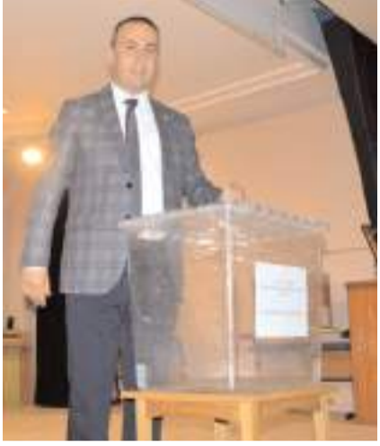
KÖYDES seçimleri Şehit Emin Güner Mesleki ve Teknik Anadolu Lisesi Konferans Salonu'nda gerçekleştirildi.