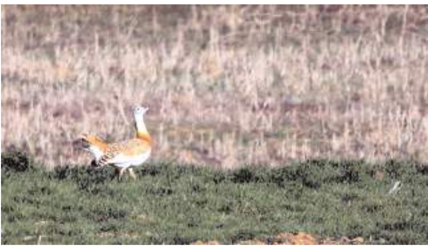
"Toy Kuşu Eylem" planı çerçevesinde Çorum'da izleme ve envanter çalışması yapıldı.

Doğa Koruma ve Milli Parklar 11. Bölge Müdürlüğü tarafından envanter ve izleme çalışmalarına ilişkin yapılan açıklamada, "Doğa Koruma ve Milli Parklar Genel Müdürlüğümüzce Toy Kuşu (Otis tarda)'na yönelik olarak hazırlanan ve uygulamaya konulan 'Toy Tür Eylem Planı' çerçevesinde tanımlanan faaliyetlerin uygulanması her yıl yapılıyor. Eylem planı çerçevesinde, Çorum ilinde envanter ve izleme çalışması Bölge Müdürlüğümüz Avcılık ve Yaban Hayatı Şube Müdürlüğü elemanlarının katılımı ile tarihinde gerçekleştirildi. Ülkemizde 100-500 arasında birey kaldığı tahmin edilmekte olup eylem planı kapsamında envanter ve izleme çalışmaları eş tutma, üreme, kuluçka, yavru büyüme dönemi olarak yıllar itibari ile devam edecektir" ifadelerine yer verildi. (İHA)