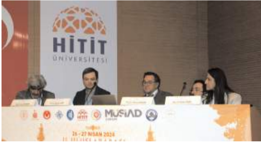
Açılış konuşmalarının ardından sempozyumun ilk oturumu yapıldı.