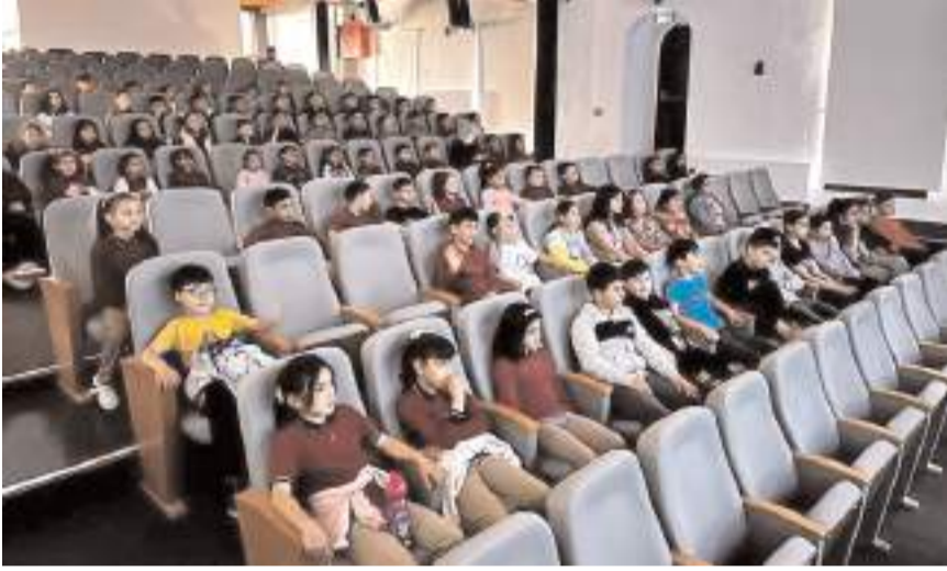
İskilip Halk Kütüphanesi Müdürlüğü tarafından öğrenciler için film gösterimi etkinliği düzenlendi.