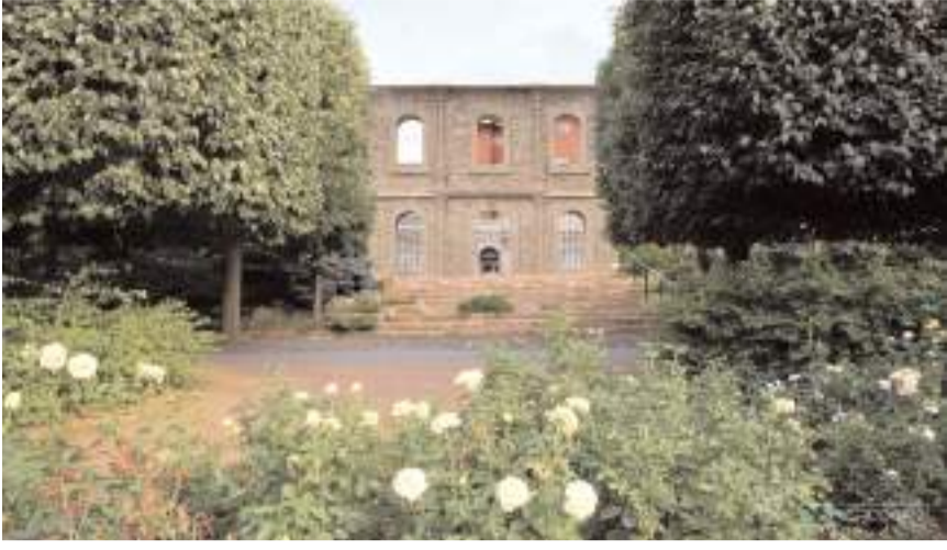
İskilip Redif Kışlasının restorasyonu tamamlandı.