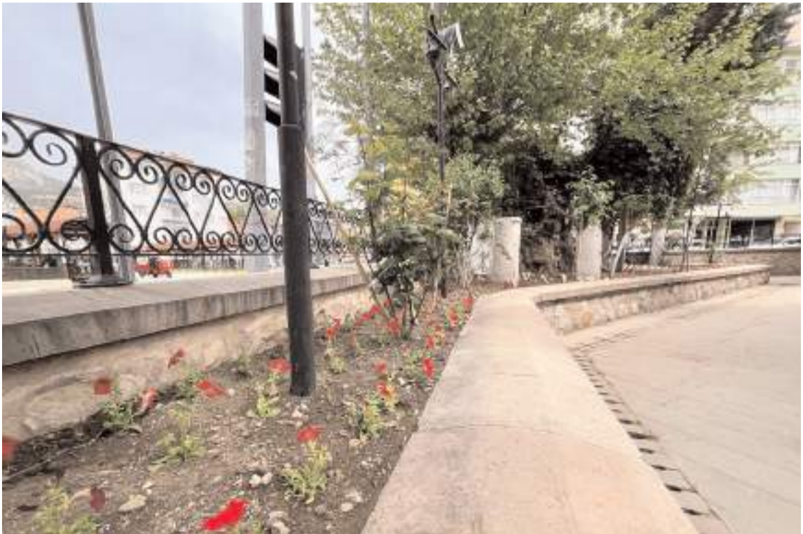
Tarihi camide yürütülen çalışmalarda bahçeye yaklaşık 3 bin petunya çiçeği dikildi.