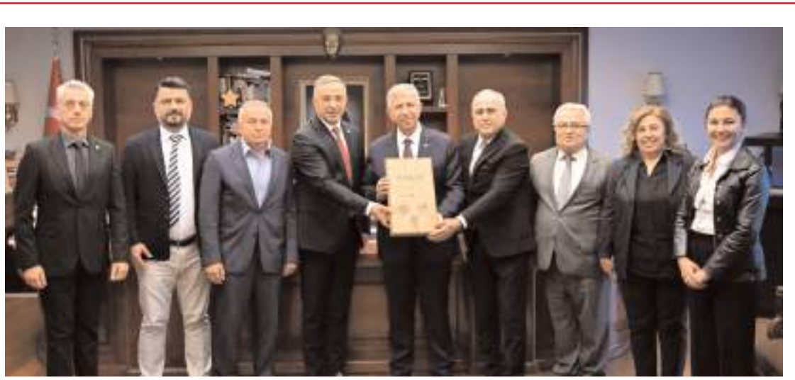
Çorum heyeti Ankara Büyükşehir Belediye Başkanı Mansur Yavaş'ı tebrik etti.