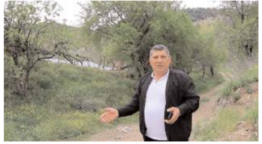
Köy halkı dereye taşkın olmasından endişeli.

yoruz. Çocuklarımız taşımaları olarak servis ile okula gidiyor. Sel geldiği zaman ya yolda kalıyor eve geçmiyor ya da evden okula gönderemiyoruz. Yağmur yağdığında sel gelir diye korkuyor, evde kalamıyoruz. Acil bir durum olsa, hastamız olsa evde kalıyor, derenin atlatamıyoruz. Bu sıkıntılarını giderilmesini istiyoruz" şeklinde konuştu. (İHA)