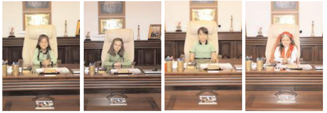
İstiklal İlköğretim Okulu öğrencileri İl Jandarma Komutanı makamına temsili olarak oturdular.