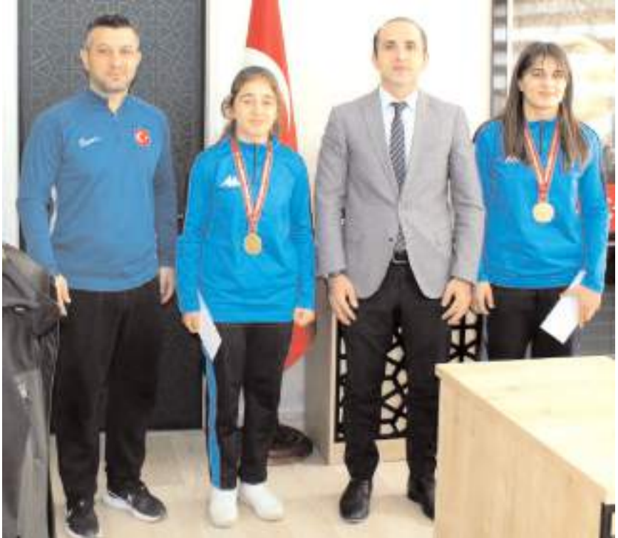
Kaymakam Ramazan Polat şampiyon güreşçiler ve antrenörleri ile birlikte

İskilip Kaymakamı Ramazan Polat ta ilçelerinden çıkan iki sporcunun şampiyon olarak milli takımında Avrupa Şampiyonasında mücadele edecek olmasından dolayı antrenör ve sporcuları tebrik etti ve başarılarının devamını diledi. (AA)