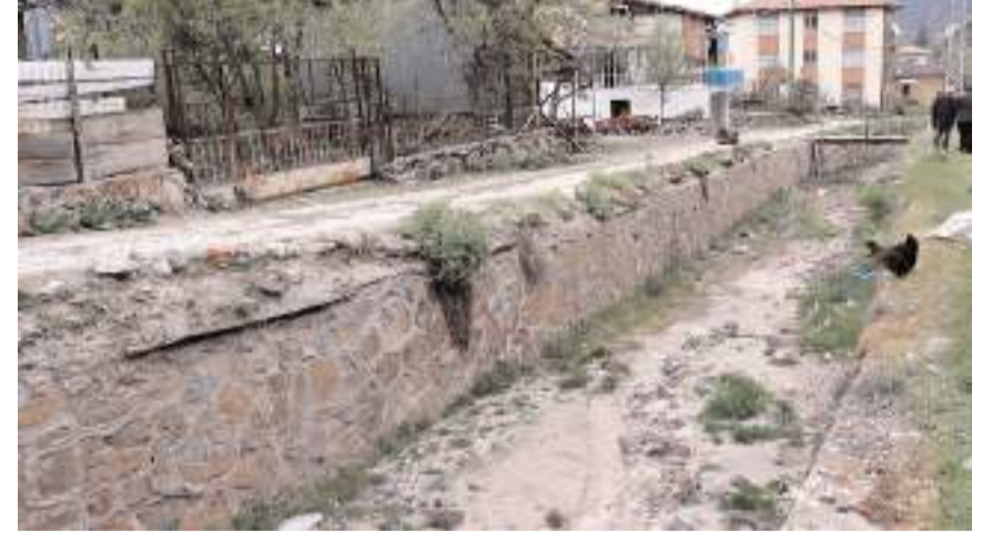
Dere köyün tam ortasından geçiyor.