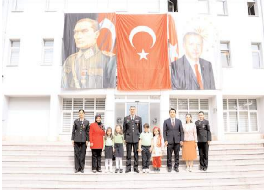
Ziyaretin sonunda hatıra fotoğrafı çekinildi.

23 Nisan Ulusal Egemenlik ve Çocuk Bayramı Kutlama etkinlikleri kapsamında, İstiklal İlköğretim Okulu öğrencileri ve okul idarecileri Çorum İl Jandarma Komutanlığı ziyaret etti.