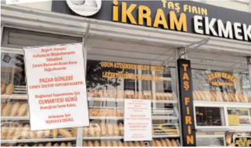
Fırınlara asılan duyuruda pazar günleri ekmek üretimi yapılmayacağı belirtildi.

Sektörde yaşanan kalifiyeli eleman sıkıntısı nedeniyle fırıncılar günlük ekmek üretmekte zorlanıyor.