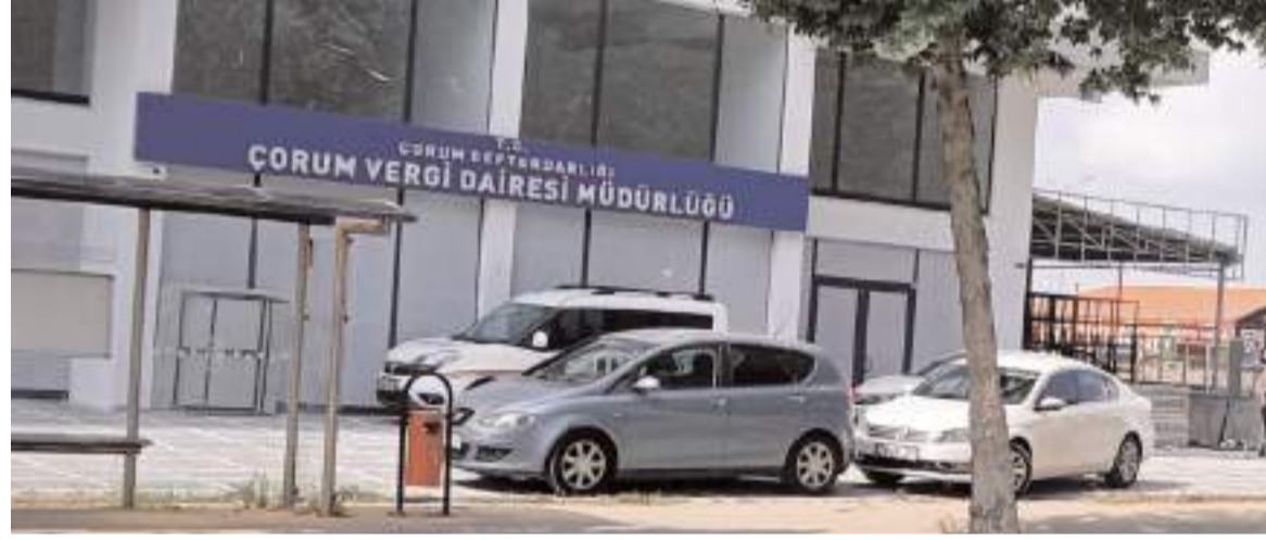
Çorum Vergi Dairesi Müdürlüğü Karayolları Şube Şefliği karşısında faaliyete başladı.

Eski binanın akıbeti ise önümüzdeki günlerde belli olacak.