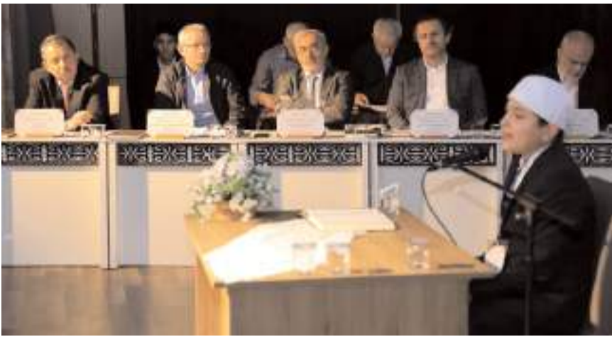
"Genç Sâda Kur'an-ı Kerim'i Güzel Okuma Yarışması" bölge finalleri Karabük'te yapıldı.

Türkiye finallerinde Çorum'u temsil edecek