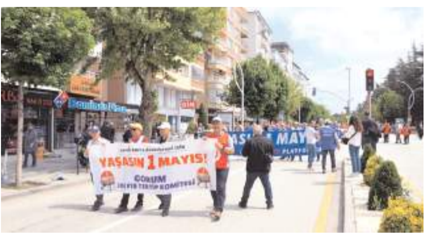
1 Mayıs'a Türk İş, Yol-İş, DİSK-Emekli Sen, DİSK-Sosyal-İş, KESK'e bağlı Eğitim-Sen, BES, SES ve Tüm Bel-Sen, CHP, EMEP, Yeşil Sol Parti gibi bir çok siyasi parti ve sivil toplum kuruluşu katıldı.