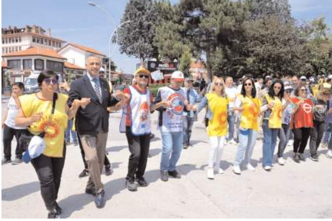
Konuşmaların ardından türküler eşliğinde halay çekildi.