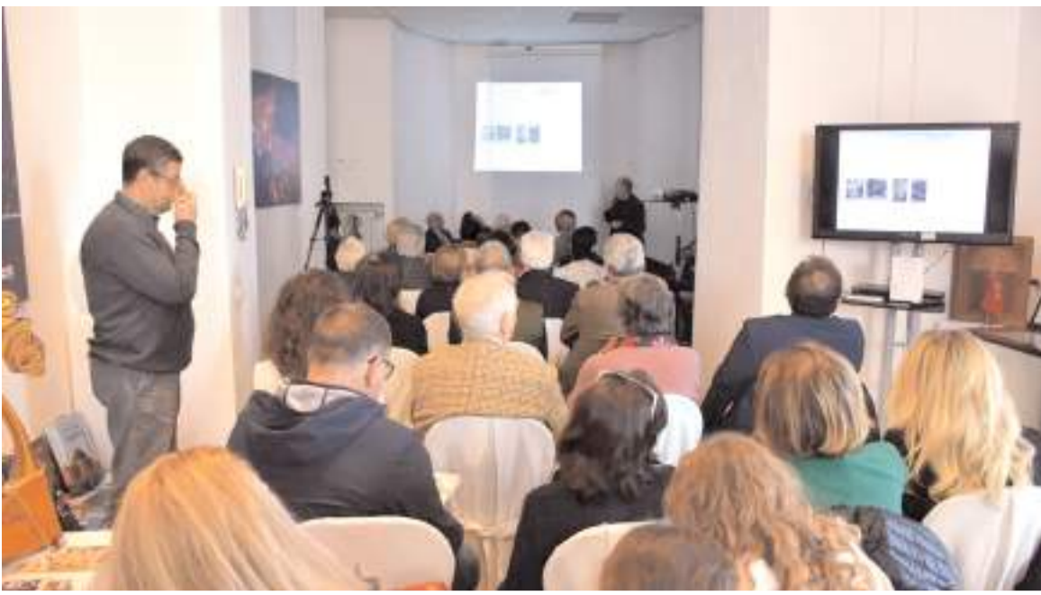
Konferans Türkiye'nin Roma Büyükelçiliği Kültür ve Tanıtma Müşavirliği'nde düzenlendi.