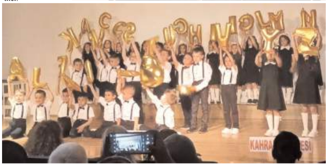
Program Buhara Kültür Merkezi'nde yapıldı.