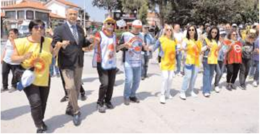
Konuşmaların ardından türküler eşliğinde halay çekildi.