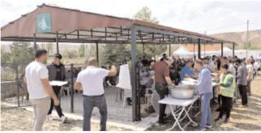
Programın ardından katılımcılara yemek ikram edildi.