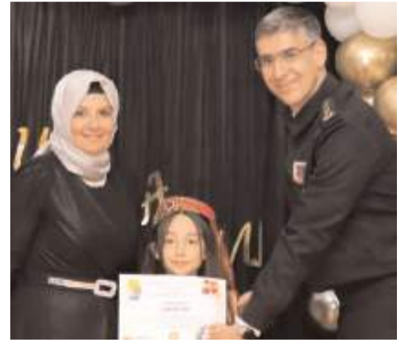
Programın sonunda öğrencilere okuma belgesi verildi.