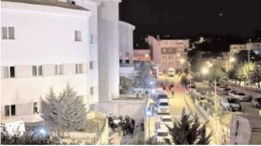
Yaralıları ilk olarak İskilip Atf Hoca Devlet Hastanesi'ne kaldırıldı.

řüphelinin akřam saatlerinde de Sungurlu çifti ile tartiřma yařadıđı, çiftin řikayeti üzerine gözaltına alındıđı ve ifade iřlemleri sonrası serbest bırakıldıđı öğrenildi.(AA)