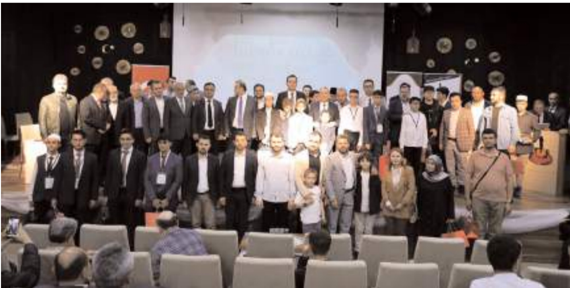
Yarışmanın sonunda hatıra fotoğrafı çekildi.

Bu benzersiz deneyime katılarak, bilgi ve deneyimlerinizi paylaşacak, yeni dostluklar kuracak ve geleceğin tıp dünyasına yön verecek adımları birlikte atacağız. Detaylı bilgi ve kayıt için kongre sayfamızı ziyaret edebilirsiniz. Unutmayın, tıbbın yarını için bugün, bu kongrede sizinle olacak."