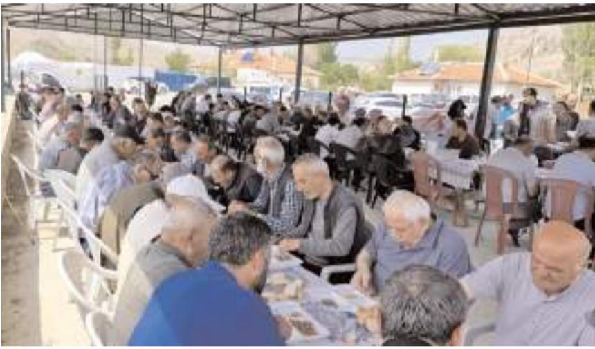
Yağmur duası programına katılım yüksek oldu.

görüldü. Bu yıl baraj sulama sisteminde sorun yok deniyor ancak gelecek yıl için Koçhisar Barajı'nda alarm çanları çalıyor. Bunları göz önünde bulundurarak köy halkımızla istişare ederek vatandaşlarımızın talepleri üzerine yağmur duasına çıkmayı uygun gördük. Öğle namazı sonrası hep birlikte Allah'a el açıp dua ettik. Yağmur duamıza destek veren köy halkına ve iştirak edenlere şükranlarımızı sunuyorum" dedi. (İHA)