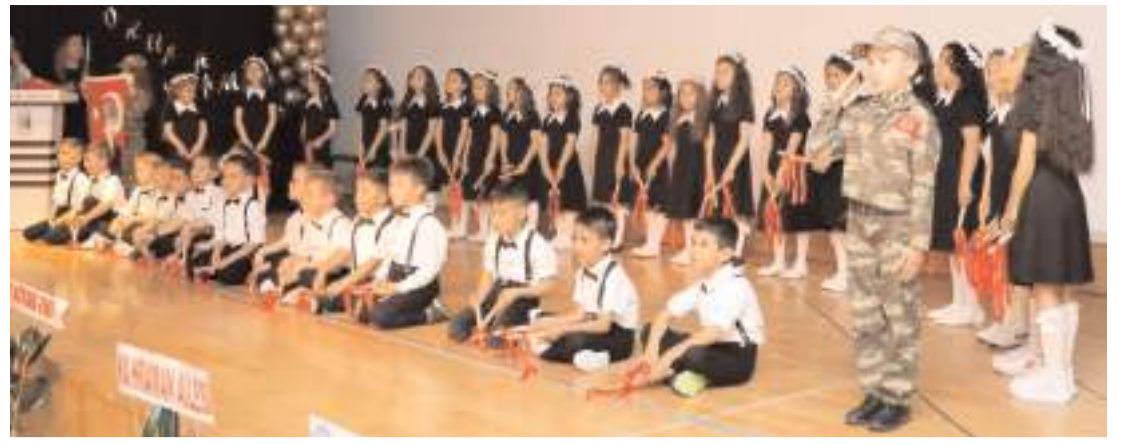
İstiklal İlkokulu 1/A Sınıfı öğrencileri okuma bayramı etkinliği düzenlediler.