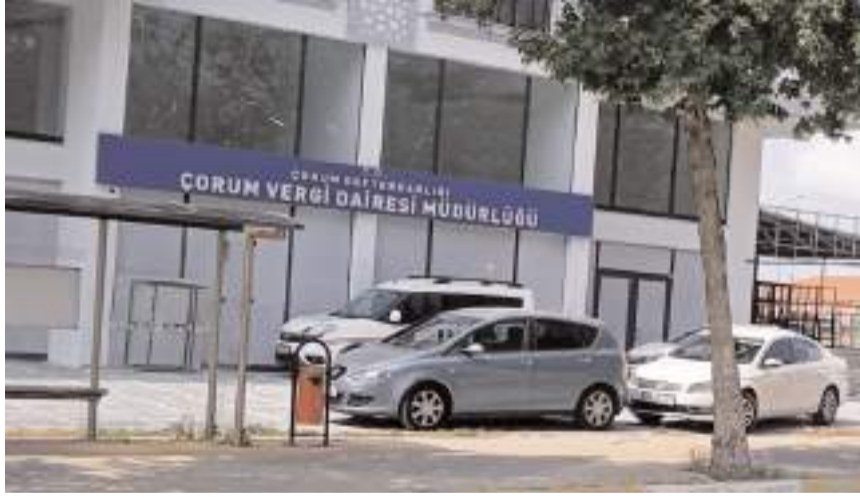
Çorum Vergi Dairesi Müdürlüğü Karayolları Şube Şefliği karşısında faaliyete başladı.

Çorum Vergi Dairesi Müdürlüğü, mevcut binanın deprem yönetmeliğine uygun olmaması nedeniyle yeni bir binada hizmet vermeye başladı.