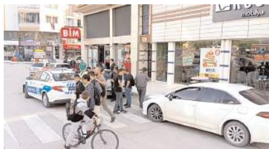
Kaza, Ulukavak Mahallesi Çiftlik Caddesinde meydana geldi.

Çorum'da otomobilin, bisiklete çarpması sonucu meydana gelen trafik kazasında gelen trafik kazasında bisiklet sürücüsü yaralandı.