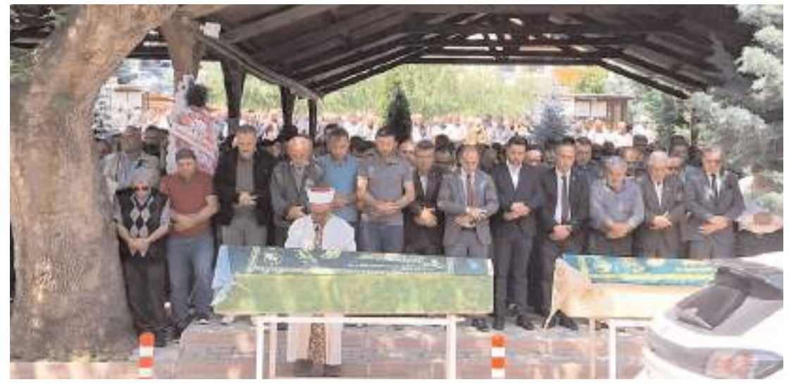
Anne ve kızı için İskilip Ulu Camiinde cenaze namazı kılındı.

Hastanedeki tedavisinin 68'inci gününde ifadesi alınan E.ř.A, babasının amcası, babasının amcasının kızı ve ođlu tarafından silahla ateř edilerek yaralandıđını belirtmiř, bařlatılan soruřturmada baba ve kızı tutuklanmıř, ođlu hakkında ise askerde olması nedeniyle adli kontrol tedbirleri uygulanmıřtı.(AA)