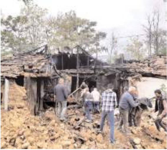
Olay Aşdağul beldesinde bir evde meydana geldi.