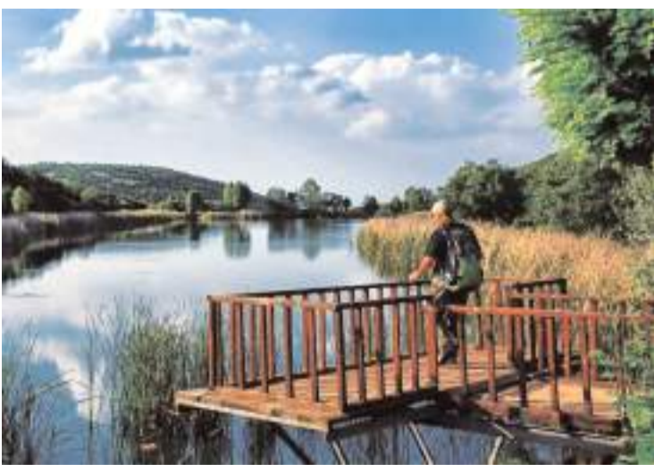
İbikçam Göleti doğal güzelliği ile büyülüyor.