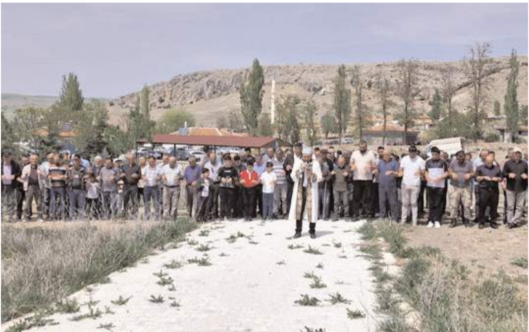
Köy sakinleri ilkbahar aylarının yağmurlu geçmesi için dua ettiler.