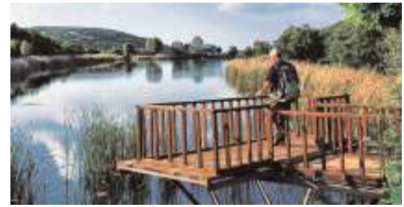
İbikçam Gölü doğal güzelliği ile büyülüyor.