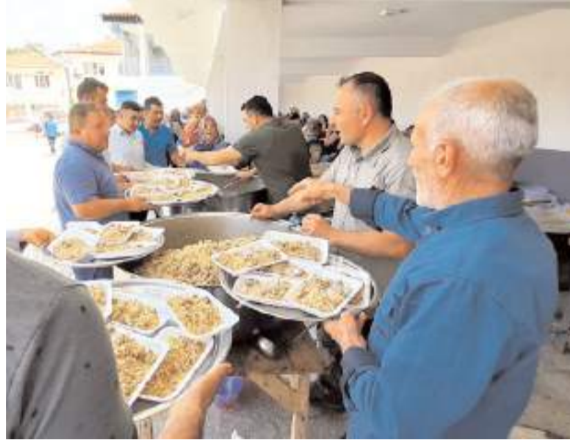
Programın sonunda yemek ikram edildi.