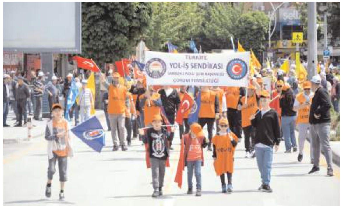
Pir Baba önünde toplanan grup, sloganlarla Hürriyet Meydanı'na kadar yürüdü.

1 Mayıs'ın kutlanacağı alan olan Hürriyet Meydanı'na sloganlar atarak 1 Mayıs'ı kutlamak için alana giriş yapanlar, polisler tarafından arandıktan sonra alana alındı.