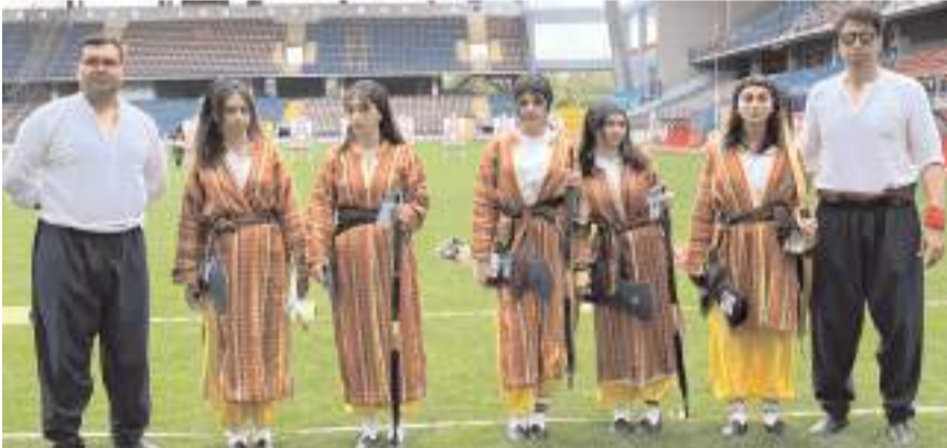
Genç kızlarda beşinci olan Bayat Şehit Osman Arslan Anadolu Lisesi takımı toplu halde