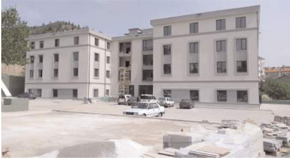
4 katlı binanın ilk 2 katında çalışmalar tamamlandı.

Ayrıca, tüm vatandaşlarımızı da temel ilk yardım bilgisini edinmeye ve gerektiğinde bu bilgiyi kullanmaya davet ediyorum" ifadelerini kullandı. (Haber Merkezi)