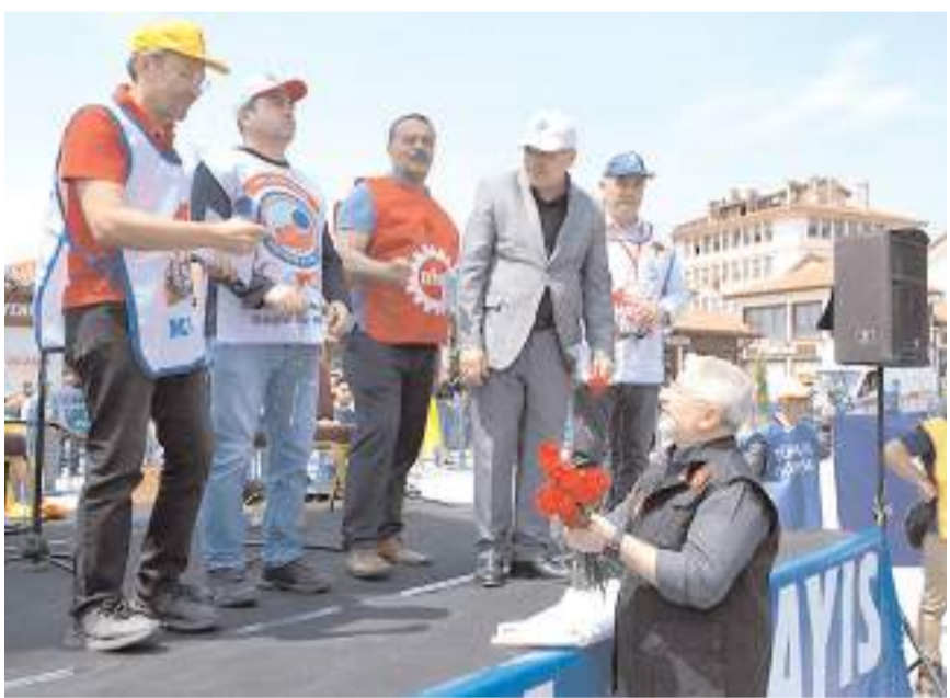
Başkan Aşgın, 1 Mayıs kutlamalarına katılanlara karanfil hediye etti.

Aşgın; "Bir emekçi olarak tüm emekçi, işçi kardeşlerimin 1 Mayıs Emek ve Dayanışma Günü'nü yürekten kutluyorum." dedi