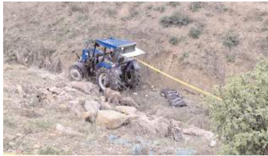
Kaza, Çorum-Alaca karayolunda meydana geldi.