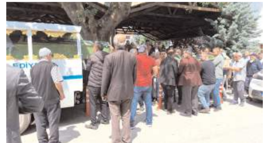
Anne ile kızının cenazeleri Hacı Karani Mezarlıđı'nda toprađa verildi.