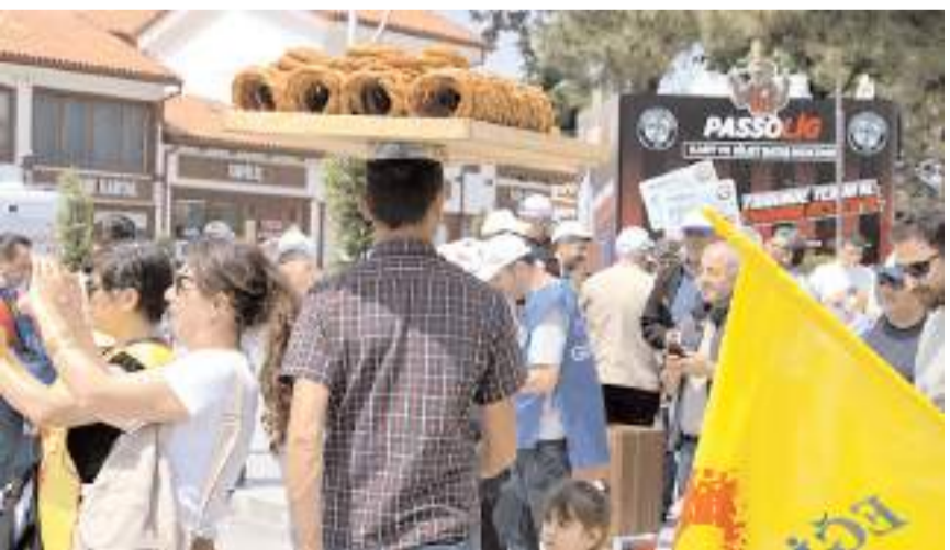
1 Mayıs'ta simitçiler ve inşaat ustaları işlerinin başındaydı.