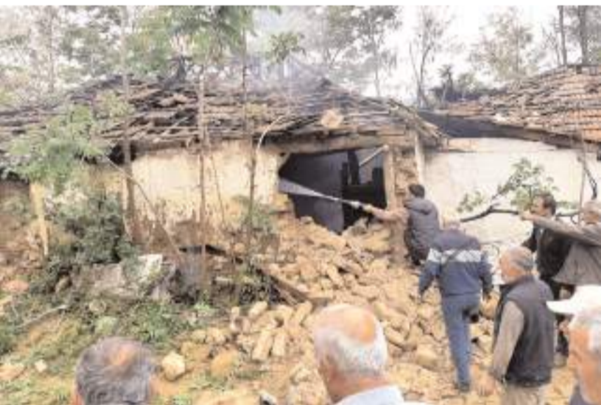
Bir duvarı yıkılan ve eşyaları yanan ev kullanılmaz hale geldi.

Ev sahibi Öncül'ün yeni aldığı tüpü mutfak ocağına bağladıktan sonra çakmakla kaçak kontrolü yaptığı sırada patlama meydana geldiği, Öncül'ün saçlarının yandığı, yüzünde de yanıklar oluştuğu öğrenildi.(AA)