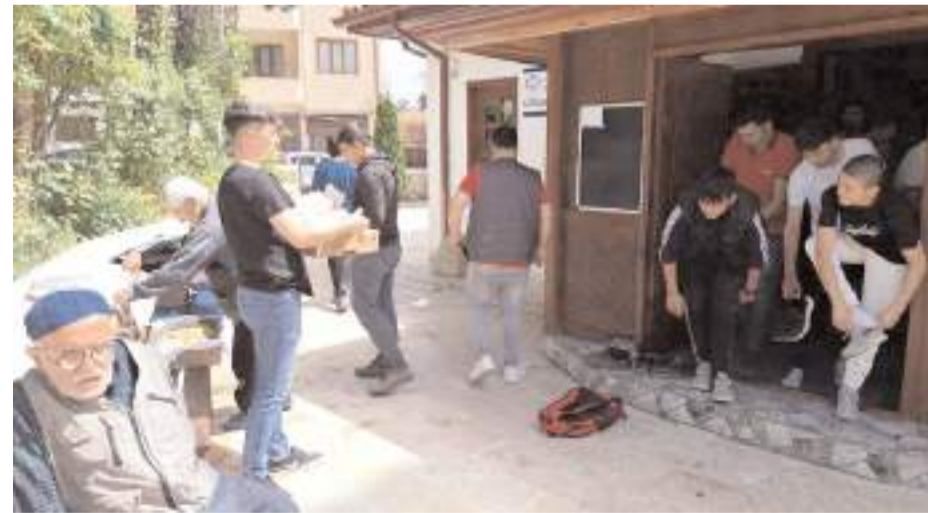
Kadınlar tarafından yapılan bazlamalar camiden çıkan cemaate dağıtıldı.