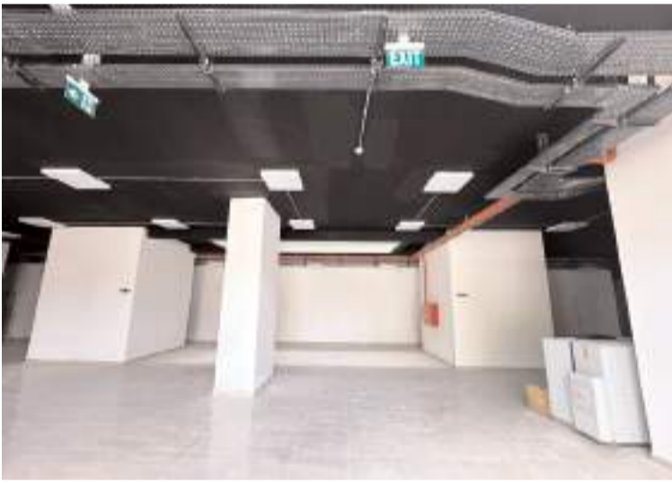
Bina hazırlanarak üniversiteye teslim edilecek.

İşi vaktinde tamamlamak için yoğun şekilde çalıştıklarını dile getiren Diken, binayı hazırlanarak üniversiteye teslim edileceğini sözlerine ekledi. (AA)