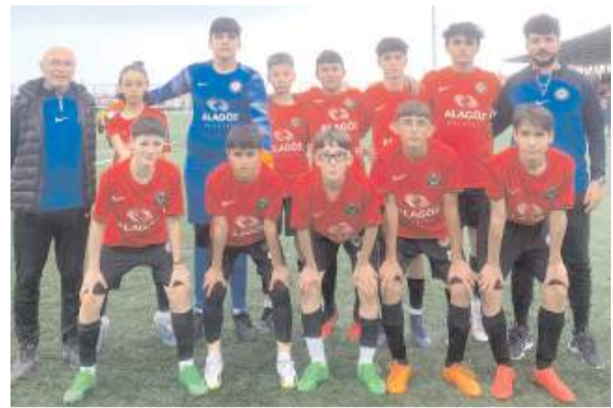
Çorum FK U 13 takımı yarı final maçını kazanarak finale yükselmeyi başardı