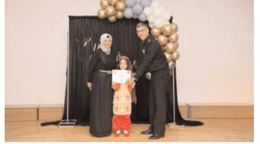
Programın sonunda öğrencilere okuma belgesi verildi.