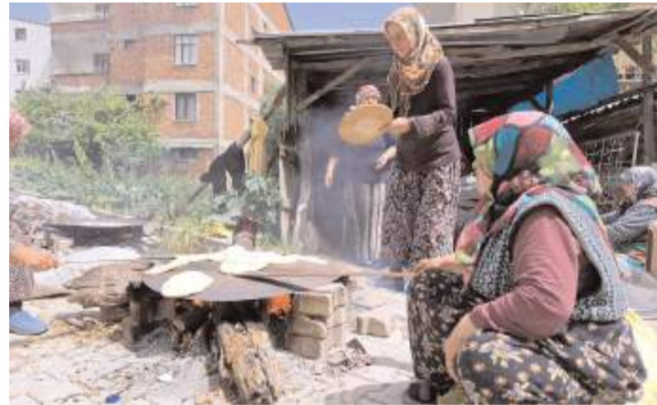
Kadınlar yağmur duasına katılanlara ikram edilmek üzere bazlama yaptılar.