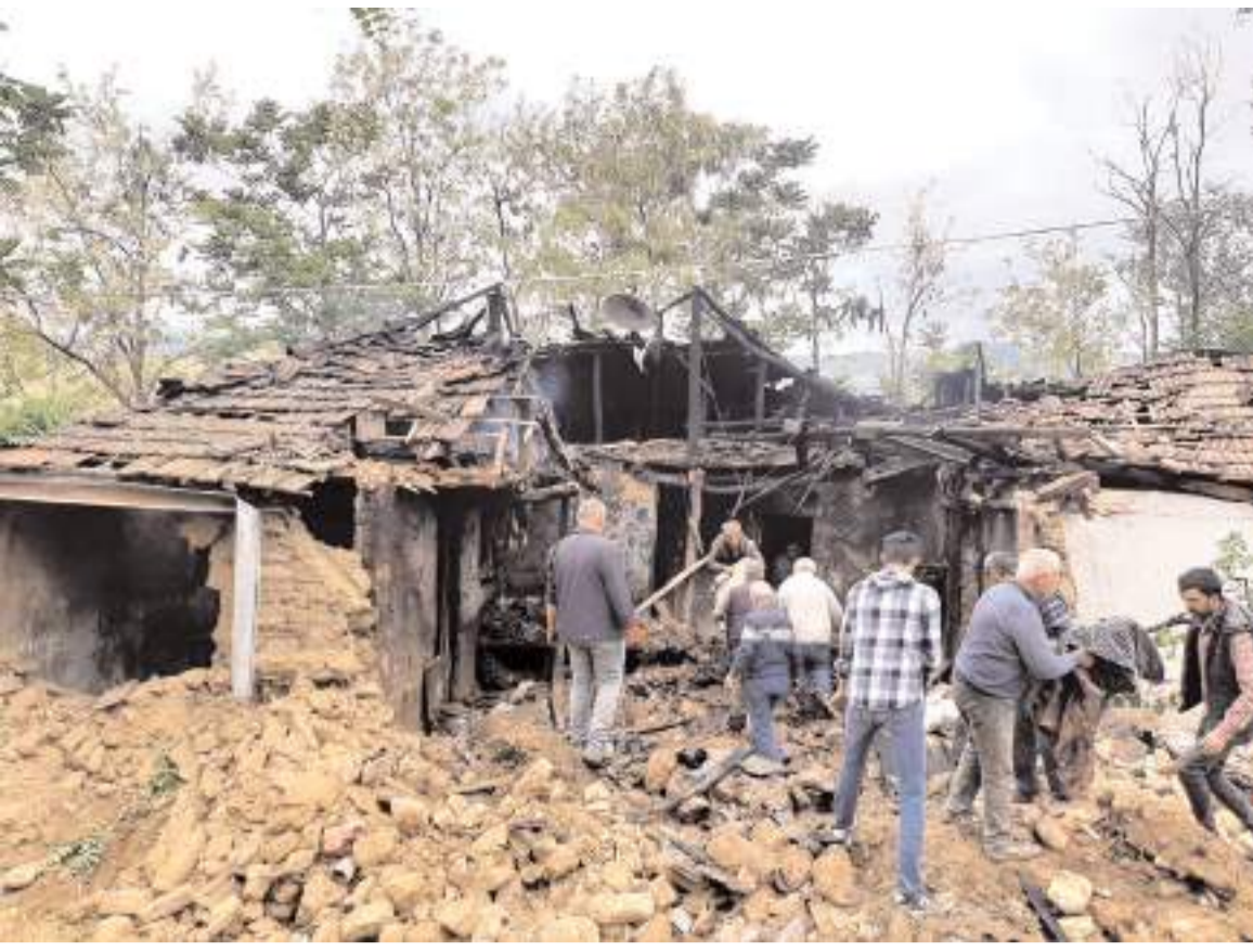
Olay Aşdağul beldesinde bir evde meydana geldi.