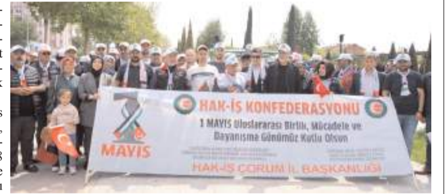
Basın açıklamasının ardından toplu hatıra fotoğrafı çekildi.

ruz. Kriz dönemlerinde gelir vergisi diliminin %10'a indirilmesini istiyoruz. Milli gelirden, ekonomik büyümeden ve refah artışından hak ettiğimiz payı almak istiyoruz. Emekçilerin enflasyona karşı ezdirilmemesini ve hayat pahalılığı ile yoksulluğa karşı korunmasını talep ediyoruz. İnsan merkezli alan daha adil ve sürdürülebilir yeni bir model istiyoruz. Bireysel ve düzenli asgari gelir yardımı sisteminin kurularak, sosyal koruma sistemi güçlendirilmelidir. İş kazası ve meslek hastalıklarının yaşanmadığı bir çalışma hayatı talep ediyoruz. Sendikal örgütlülüğün artması için gerçek iş güvencesi istiyoruz.