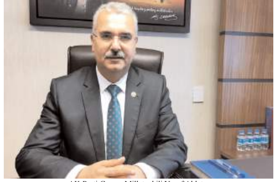
AK Parti Çorum Milletvekili Yusuf Ahlatcı

1 Mayıs vesilesiyle bir kez daha söylüyoruz. İşçiler, emekçiler geleceğimize, umudumuzdur. Türkiye Yüzyılı hedefine tüm emekçilerle birlikte yürüyeceğiz.