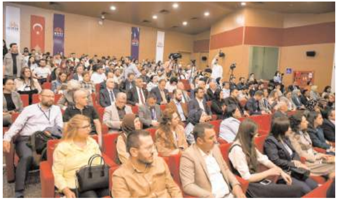
Hitit Üniversitesi Meslek Yüksek Okulu Ethem Erkoç Konferans Salonunda gerçekleştirilen sempozyuma dijital ortamda da ilgi yüksek oldu.