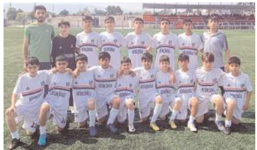
Vefaspor yarı final maçında Osmancık Belediyespor'u yenerek finale yükseldi

GOLLER: 1. dak. Gazi, 14. dak. Emir, 39. 40. ve 43. dakikalarda Elvan Efe (Vefaspor), 36. dak. Bulut Efe (Osmancık Belediyespor).