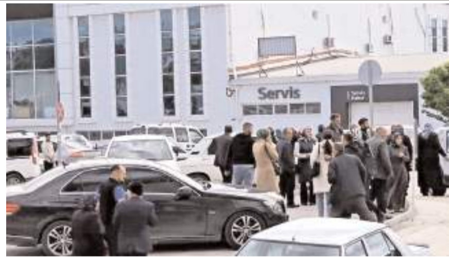
Olay İskilip Sokak'taki kiremit fabrikasında meydana geldi.

Danacı'nın cenazesi, otopsi yapılmak üzere hastane morguna kaldırıldı.(AA)