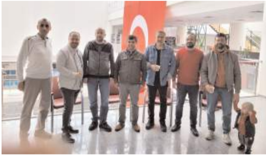
Çorum Tabip Odası'nın Olağan Genel Kurulu geçtiğimiz hafta sonu yapıldı.

■ Çorum Tabip Odası'nın hafta sonu yapılan Olağan Genel Kurul Toplantısında yeni yönetim belirlendi.