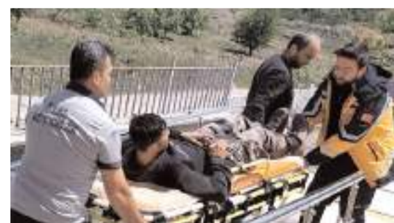
Orhan Kambuk yapılan ilk müdahalenin Hitit Üniversitesi Erol Olçok Eğitim ve Araştırma Hastanesi'ne sevk edildi.