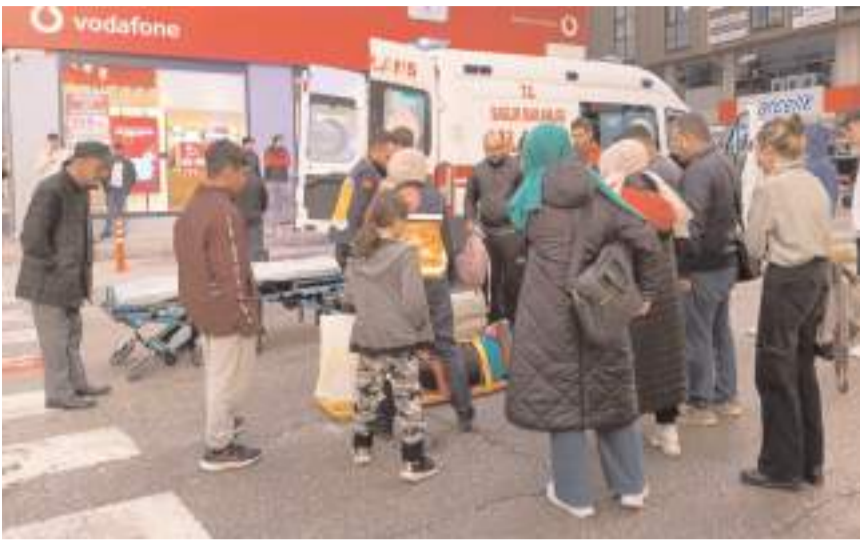
Yaralılara ilk müdahaleyi 112 acil sağlık ekipleri yaptı.