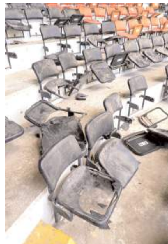
Stadyumda 172 koltuğun kırıldığı rapor edildi

172 koltuk ve üç pisuvar kırığı rapor edildi ve bunun maliyeti Urfaspor'dan tahsil edilecek.