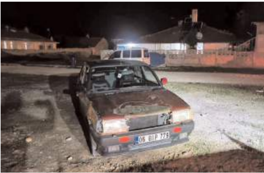
Olay Alaca'da Zile Caddesi'nde meydana geldi.

Bir müddet daha devam eden kavganın ardından M.Ç. arkadaş