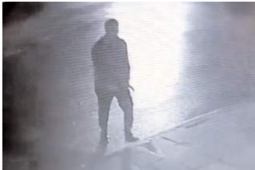
Olay, Gülabibey Mahallesi Nurettin Bey Caddesi'nde meydana geldi.

Öte yandan, hırsızlık anı güvenlik kameralarına yansdı. Görüntülerde şahsın iş yerinin önüne geldiği görülüyor. Daha sonra içeri giren şahıs kasadan parayı ve sigaraları alıyor. (İHA)