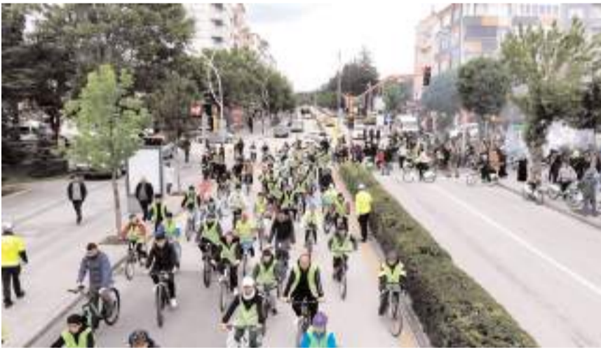
Bisiklet tutkunları Gazi ve İnönü Caddelerinden Millet Bahçesi'ne pedal çevirdi.