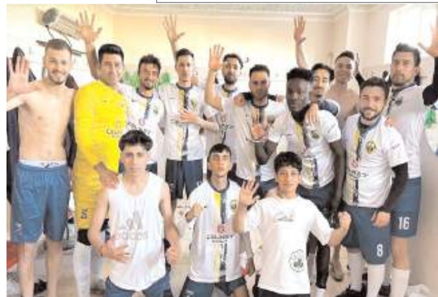
Alacagücüspor evinde farklı kazanarak play-off yarışına ortak oldu