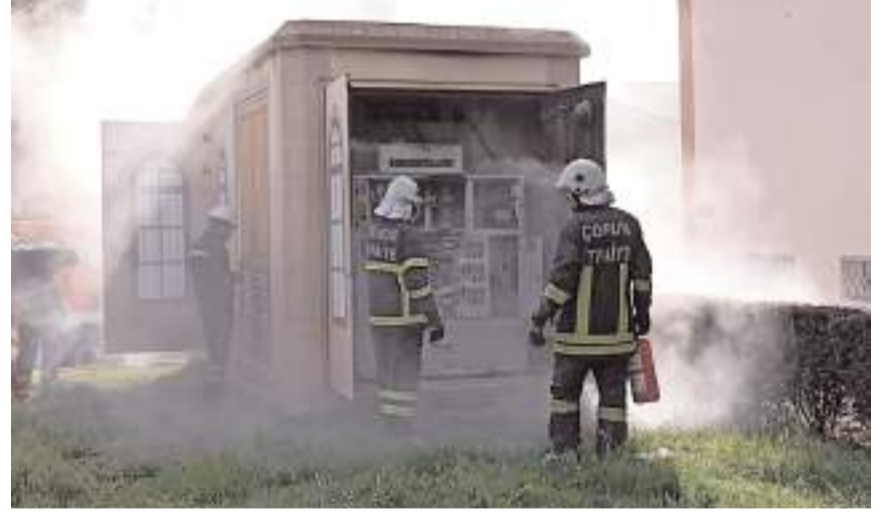
İtfaiye ekipleri yangını büyümeden söndürdü.

YEDAŞ'tan yapılan açıklamada elektrik trafosunda çıkan yangına, bölgedeki aşırı tüketimin neden olduğu bildirildi. (İHA)