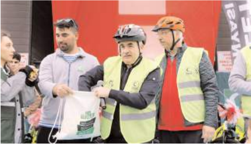
Vali Dağlı, çekilişte kazandığı bisikleti şehit çocuğuna hediye etti.

■ Çorum Valisi Zülkif Dağlı, düzenlenen bisiklet turundaki çekilişte kazandığı bisikleti şehit çocuğuna hediye etti.