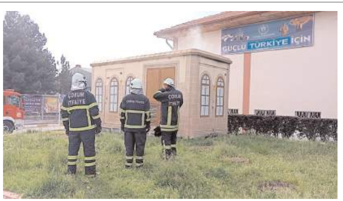
Olay, Gazi Caddesi'nde meydana geldi.

Kambuk, burada yapılan ilk müdahalenin ardından Hitit Üniversitesi Erol Olçok Eğitim ve Araştırma Hastanesi'ne sevk edildi.(AA)