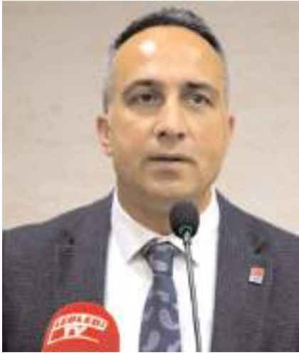
CHP İl Başkanı Dinçer Solmaz