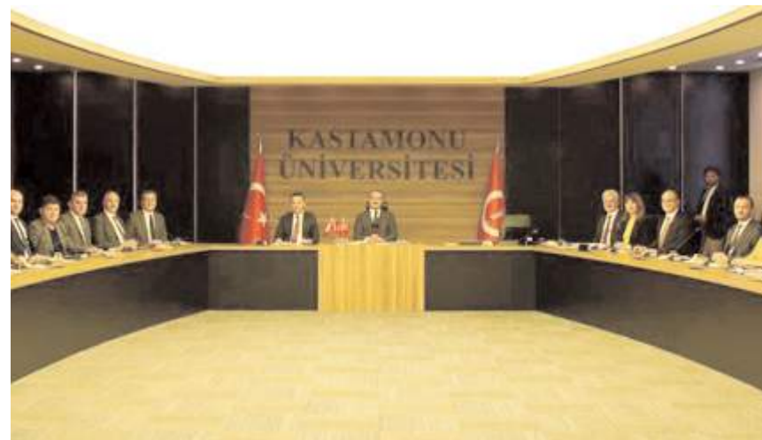
Hitit Üniversitesi ve Kastamonu Üniversitesi, başta ihtisaslaşma alanları olmak üzere akademik ve Ar-Ge odaklı iş birliklerini geliştirmek üzere toplandı.

■ Hitit Üniversitesi ile Kastamonu Üniversitesi arasında gerçekleştirilen görüşmelerde iş birliğinin artırılması için istişarelerde bulunuldu. * HABERİ 4'DE