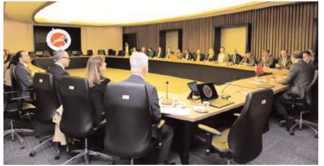
Oturumlarda, mevcut iş birliği alanları ele alınarak ortak projelere dair fikir alışverişi yapıldı.

Toplantılarda her iki üniversitenin stratejik hedeflerini belirleme ve performanslarını ölçme konusundaki yaklaşımları paylaşıldı. Daha sonra, katılımcılar arasında akademik ve teknolojik iş birliği imkanlarını artırmak için atılabilecek adımları tartışmak üzere bir dizi oturum gerçekleştirildi. Oturumlarda, mevcut iş birliği alanları ele alınarak ortak projelere dair fikir alışverişi yapıldı. (İHA)