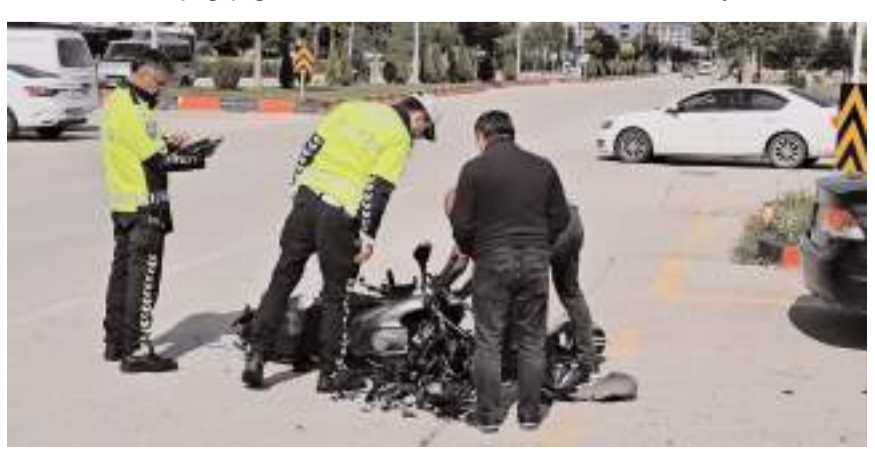
Kaza Fen Lisesi Caddesi'nde meydana geldi.

Yaralı sağlık ekiplerince yapılan müdahalenin ardından Hitit Üniversitesi Erol Olçok Eğitim ve Araştırma Hastanesi'ne kaldırıldı.(AA)