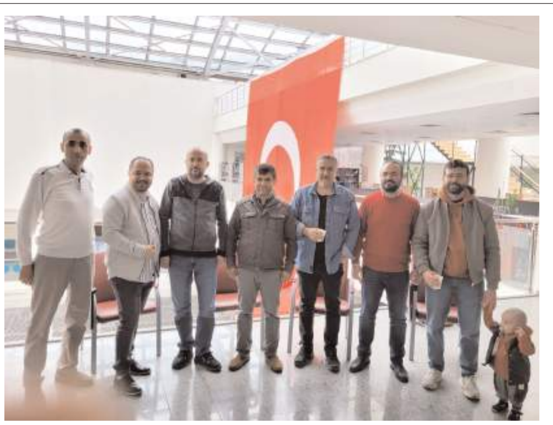
Çorum Tabip Odası'nın Olağan Genel Kurulu geçtiğimiz hafta sonu yapıldı.

Saat 09.39'da açılış konuşmalarıyla başlayacak sempozyum, 2 gün boyunca oturumlarla devam edecek.(AA)