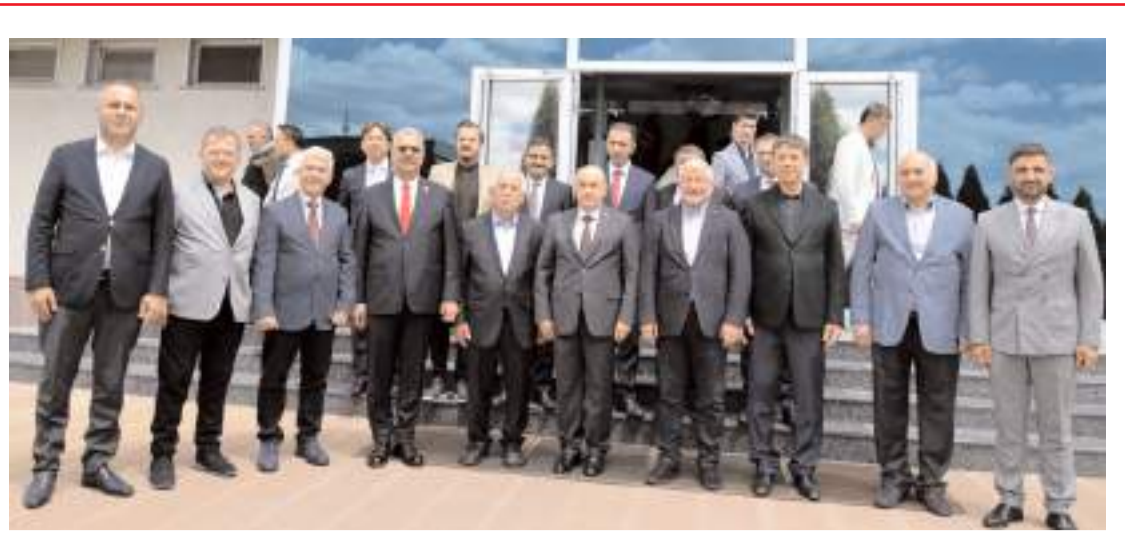
Duduoglu Çelik Döküm, Hıdırellez Günü nedeniyle İskilip Dolması ikram etti