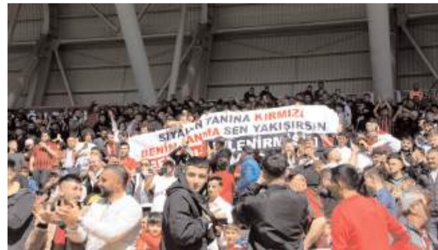
Eren'e taraftarlarda, "evet desene" tezahüratıyla destek verdi.

Gaz Altı ve Argon Kaynak yapabilen deneyimli elemanlar alınacaktır. Müracaatların şahsen yapılması gerekmektedir. İrtibat Tel: 0553 7354350