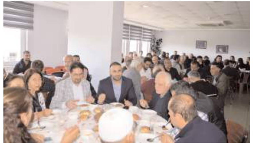
Etkinliğe çok sayıda protokol üyesi ve davetli katıldı.