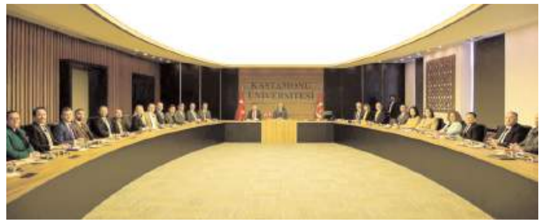
Hitit Üniversitesi ve Kastamonu Üniversitesi, başta ihtisaslaşma alanları olmak üzere akademik ve Ar-Ge odaklı iş birliklerini geliştirmek üzere toplandı.

Protokol çerçevesinde ilçede LGS ve YKS sınavlarına girecek olan öğrencilere ücretsiz deneme sınavları gerçekleştirilecek.