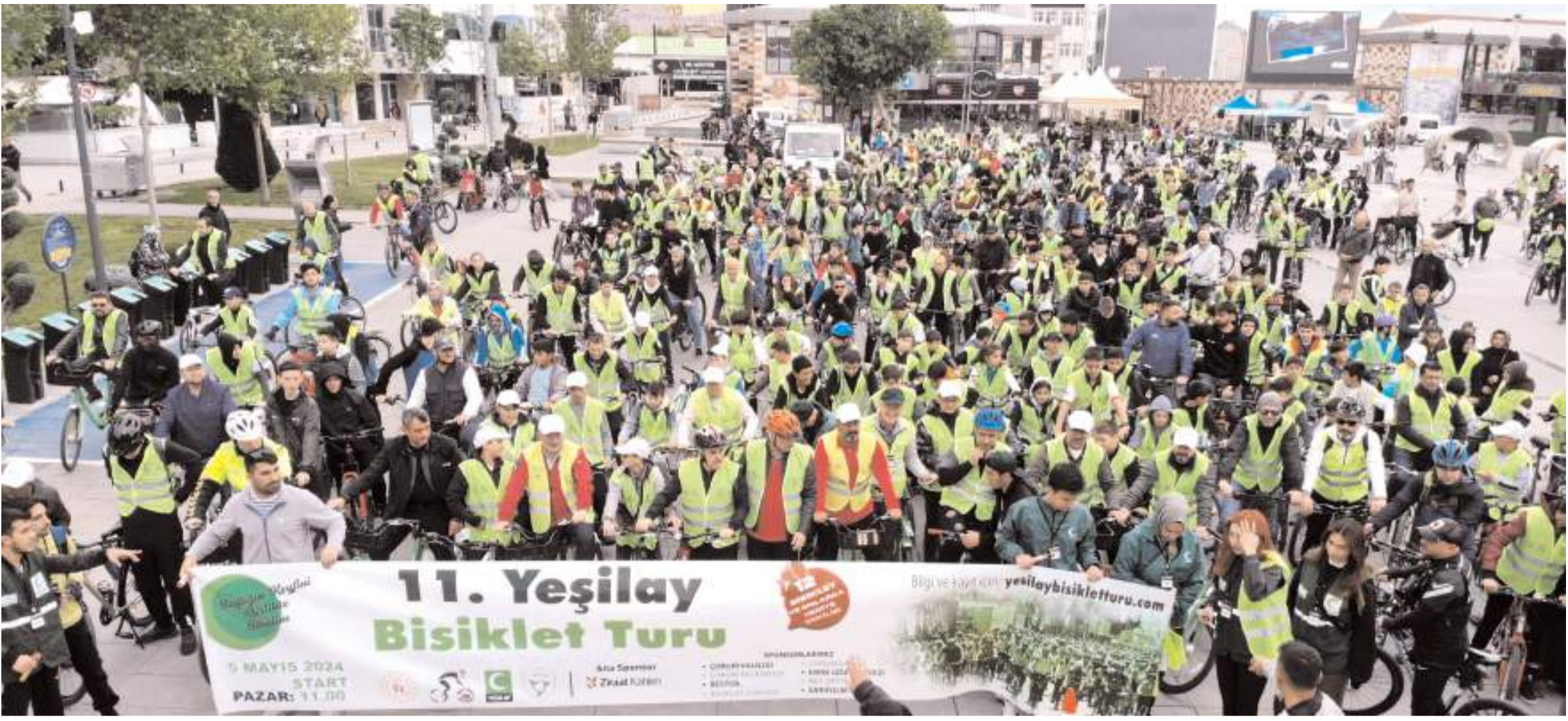
11. Yeşilay Bisiklet Turu, tüm Türkiye'de olduğu gibi Çorum'da da düzenlendi.