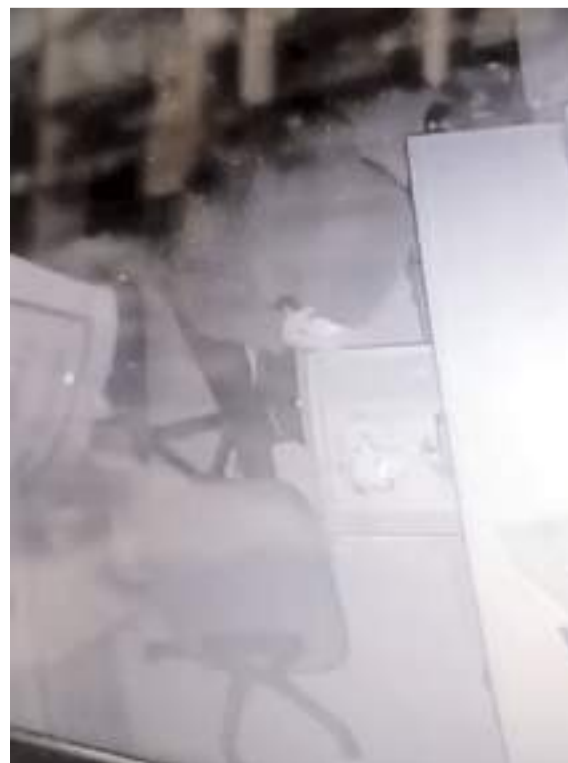
Hırsızlık anı güvenlik kameralarına yansdı.