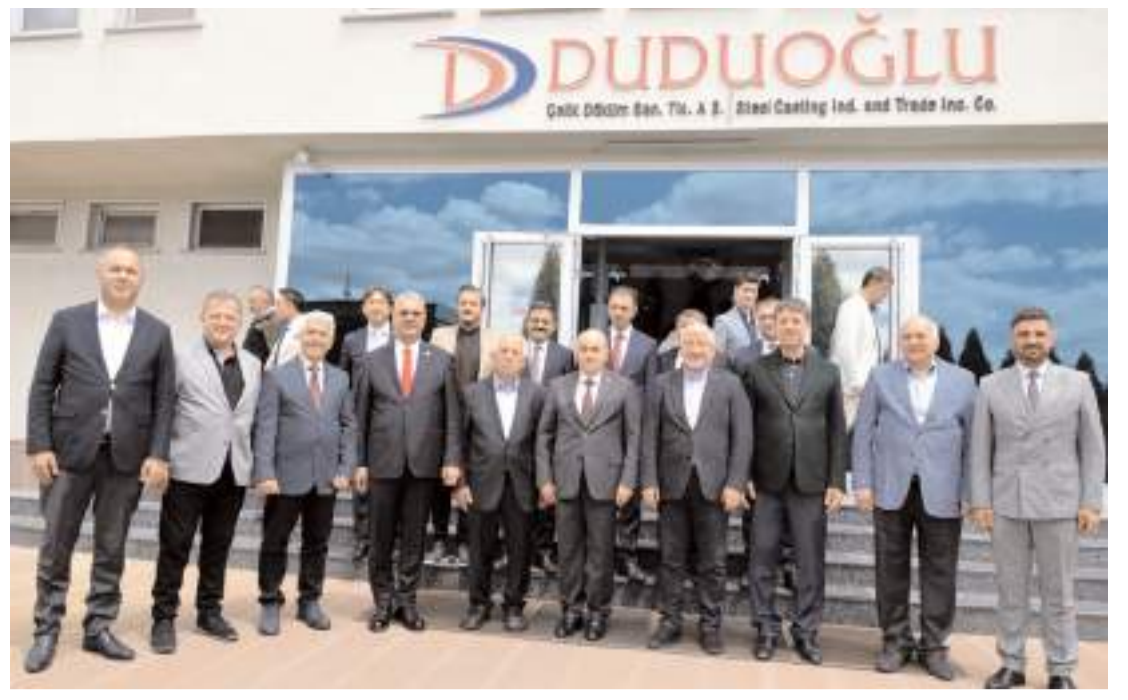
Duduoglu Çelik Döküm, Hıdırellez Günü nedeniyle İskilip Dolması ikram etti