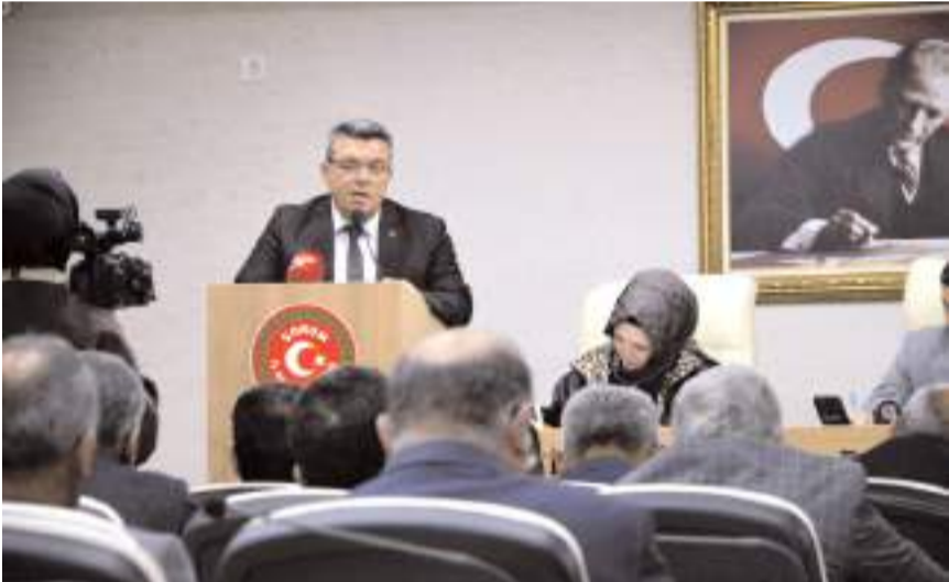
Toplantıda gündem maddeleri görüşüldü.