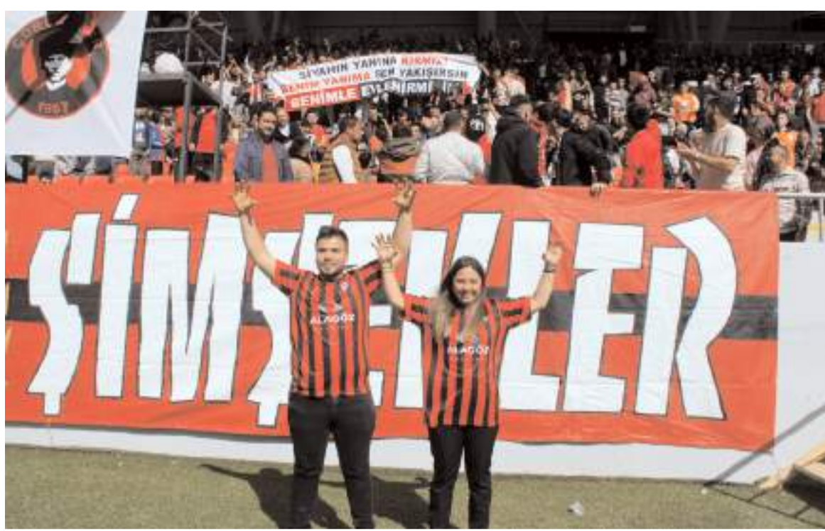
Çorum FK Şanlıurfaspor maçında tribündeki bir genç, kız arkadaşına pankartla evlilik teklifinde bulundu.