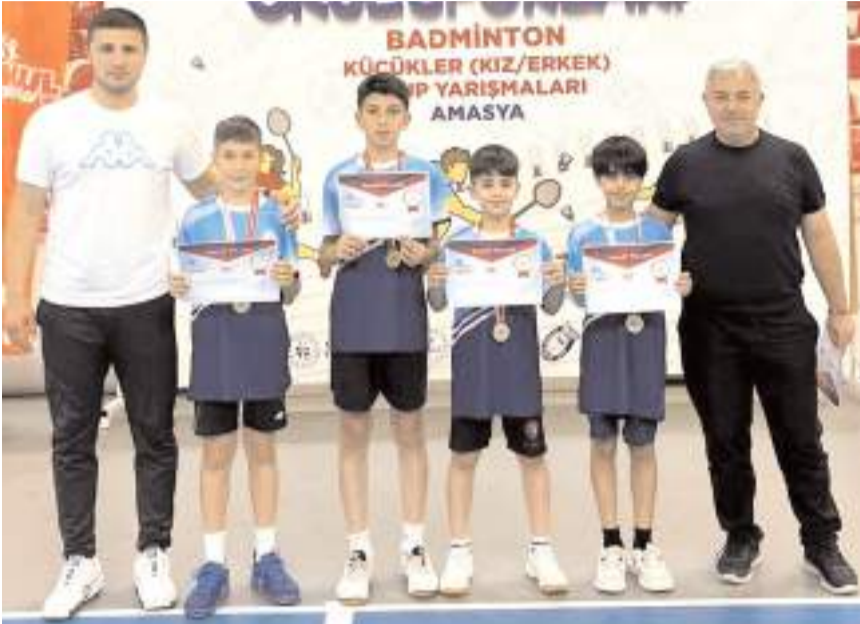
Şehit Öğretmen Şenay Aybüke Yalçın Ortaokulu ikincilik ödülleri ile toplu halde