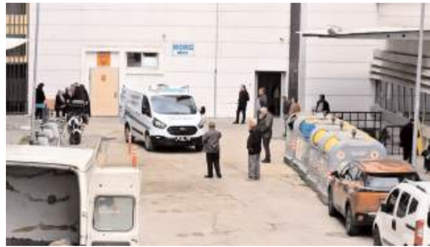
Danacı'nın cenazesi, otopsi yapılmak üzere hastane morguna kaldırıldı.