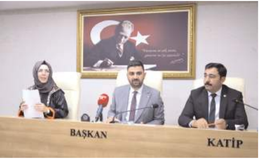
Il Genel Meclisi Mayıs ayı toplantıları başladı.

Toplantı diğer gündem maddeleri görüşülerek komisyonlara havale edildi.