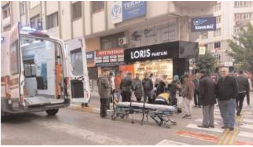
Kaza Gazi Caddesi'nde meydana geldi.

Çorum'da otomobilin çarpması sonucu yaralanan anne ve 8 yaşındaki oğlu, tedavi altına alındı.