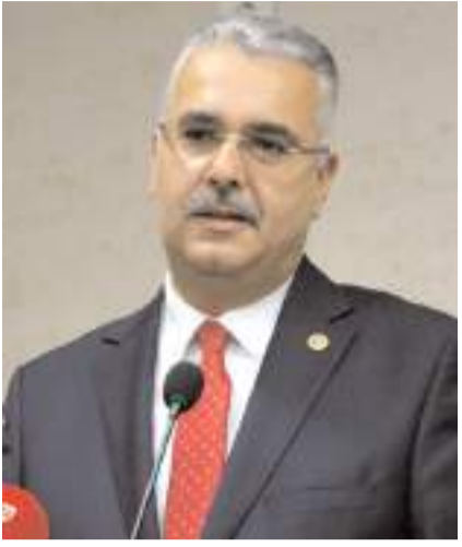
AK Parti Çorum Milletvekili Yusuf Ahlatcı