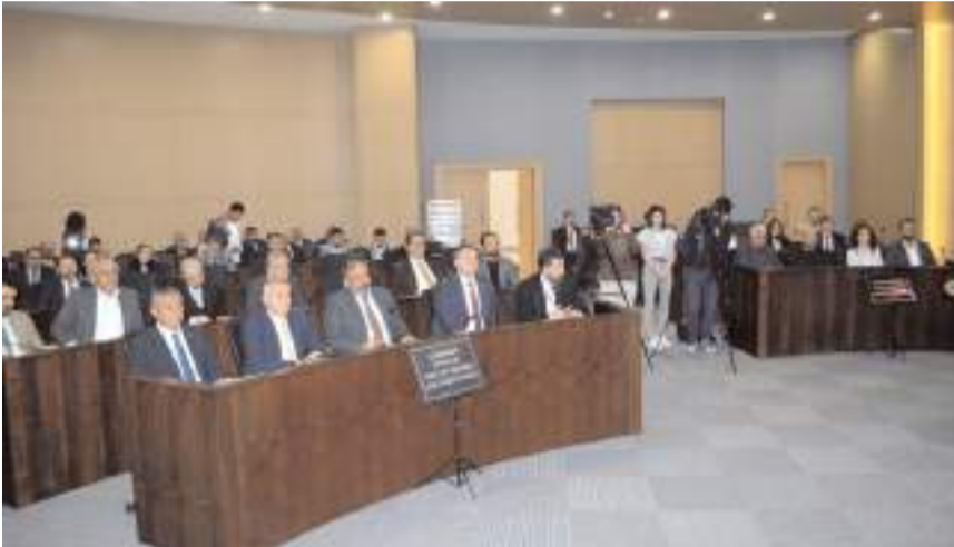
Toplantıda gündem maddeleri görüşülerek kabul edildi.