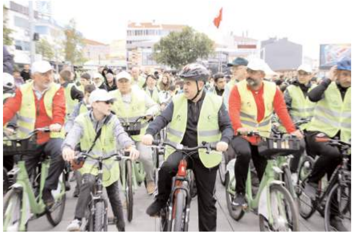
Bine yakın bisikletçi, Kadeş Barış Meydanı'nda toplandı.

"Yeşilay Bisiklet Turu" çerçevesinde etkinliğe katılanlar arasında hediye çekilişi düzenlendi. Renkli görüntülere sahne olan çekilişte hediye edilecek bisikletlerin çekilişi için sahneye çıkan Çorum Valisi Zülkif Dağlı, "Torbada kendi ismini çektim. Ancak bu bisikletimizi şehit çocuğumuza hediye edeceğiz" dedi. Turun kapanış programında Vali Zülkif Dağlı, amaçlarının sağlıklı yaşam ve bağımlılıkla mücadelede katkıda bulunmak ve farkındalık oluşturmak olduğunu belirterek, "Belediyelerimiz, sivil toplum kuruluşlarımız ve ilgili ku-