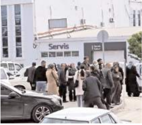
Olay İskilip Sokak'taki kiremit fabrikasında meydana geldi.