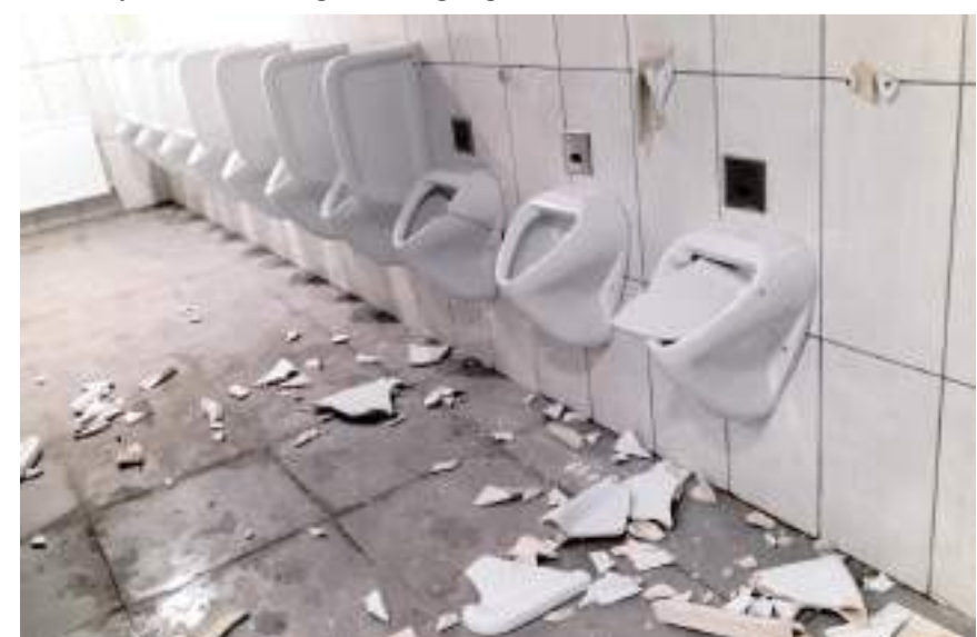
Tuvaletlerde ise üç pisuvar kırıldığı maçın temsilcisi tarafından rapor edildi

Öte yandan maç sonunda Urfaspor'u taşıyan otobüslerden birininde camının kırıldığı tesbit edildi.