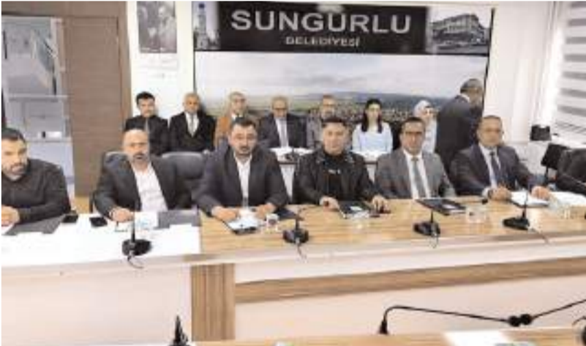
Toplantıda gündem maddeleri görüşülerek karara bağlandı.