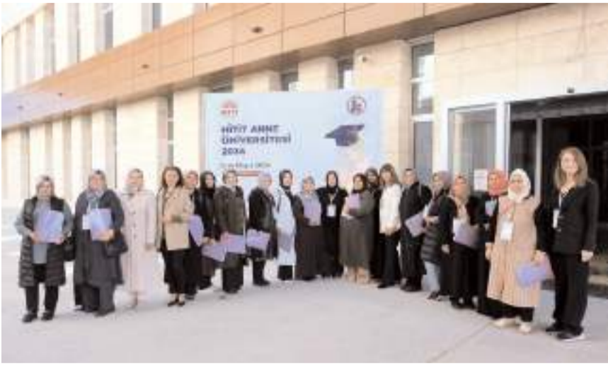
Anne Üniversitesi Çorum Valiliği ile Alaca, Bayat, Boğazkale ve Laçın Kaymaklıkları işbirliğinde hayata geçirildi.