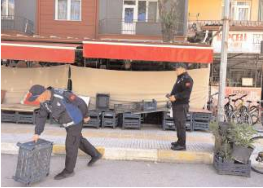
Zabıta Müdürlüğü ekipleri, kaldırım işgallerine son vermek amacıyla denetim yaptı.

Çorum Belediyesi Zabıta Müdürlüğü ekipleri, kaldırım işgallerine son vermek amacıyla denetimlerini sıklaştırdı. Ekipler, vatandaşların kaldırımlarda rahatça yürüyebilmelerini sağlamak ve kent estetiğini korumak için kaldırım işgali yapan esnafı uyardı.