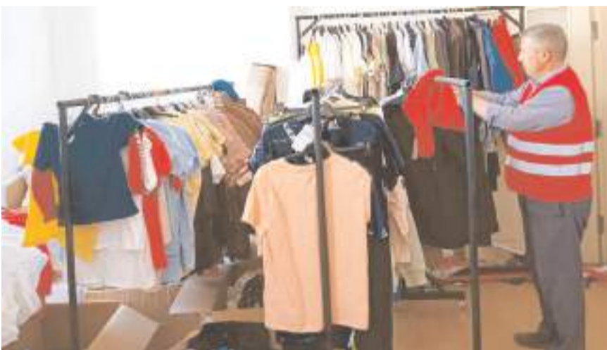
Genel merkez ve bağışçılardan gelen kıyafetler için Kızılay Butik'i hazır hale getirdi.