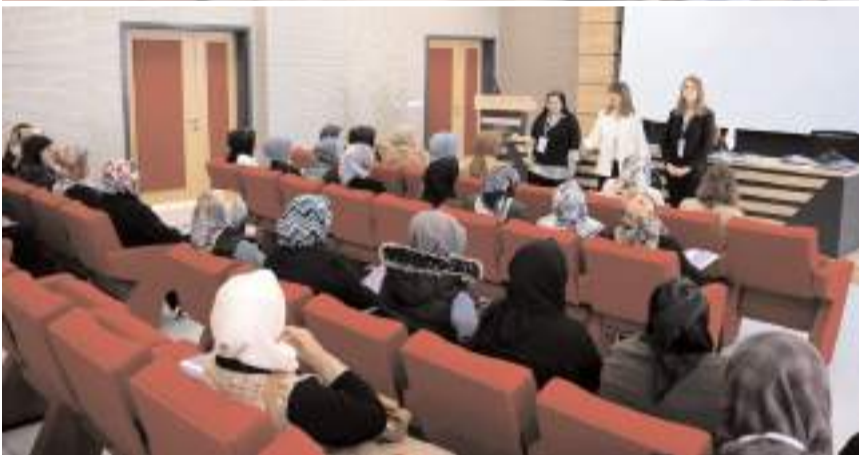
Annelere mikrobiyoloji, ev kazaları, ebru atölyesi, müzik atölyesi, bağımlılıkla mücadele, eşler arası iletişim, akılcı ilaç kullanımı, kültürümüzde kadın ve aile konularında eğitimler verilecek.