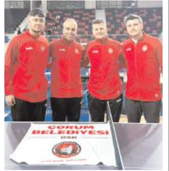
Çorum Belediyespor erkek masa tenisi takımı play-off maçları sonunda yedinci oldu ve önümüzdeki sezonda Süper Lig'de mücadele etmeye hak kazandı

Kadınlarla mücadele eden Çorum Spor İhtisas 10. ve Çorum Belediyesi Gençlikspor kulübü ise 12. olarak ligi tamamlayarak önümüzdeki sezonda Süper Lig'de mücadele etmeye hak kazandı.