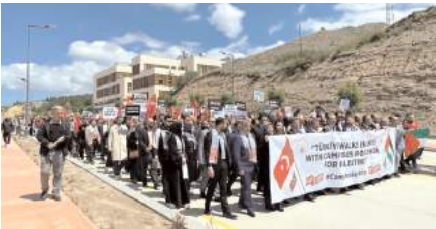
Eylemde İsrail'in Gazze'de yaptığı katliamlar protesto edildi.