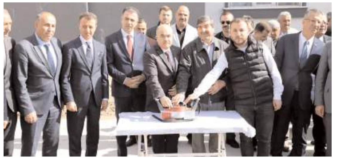
4-6 Yaş Kur'an Kursu ve Diyanet Gençlik Merkezi için temel atma töreni yapıldı.

nadıklarını kaydeden Afacan, "Eczacılar, astım ilaçları hakkında bilgi vererek, hastalara ilaçlarını nasıl kullanmaları gerektiğini öğretirken ve astım tetikleyicilerinden kaçınmaları konusunda tavsiyelerde bulunarak hastalara yardımcı olmaktadır. Eczanelerimiz 1. basamak sağlık hizmeti sunucularıdır ve eczacılarımız toplum sağlığının kilit taşıdır. Dünya Astım Günü'nde, astım hastalarını, hastalıklarını kontrol altına almaları için gerekli adımları atmaya teşvik ediyoruz. Eczacılarımız bu konuda hastalara yardımcı olmak için her zaman yanlarında olacaktır. Eczacılarla ve eczanelere danışarak: Astım tedavisinde kullanılan ilaçlar hakkında bilgi edinebilirsiniz. İlaçlarınızı nasıl kullanmanız gerektiğini öğrenebilirsiniz. Astım tetikleyicilerinden nasıl kaçınabileceğiniz konusunda tavsiyeler alabilirsiniz. Astım krizi planınızın güncel olduğundan emin olabilirsiniz. Unutmayın, astım kontrol altına alınabilir ve sağlıklı bir yaşam sürmeniz mümkündür. Eczacılarımız ve eczanelerimiz bu konuda size yardımcı olmak için her zaman yanınızdayır. Dünya Astım Günü'nde astım hastalarına ve yakınlarına sağlıklı ve mutlu bir yaşam dileriz" ifadelerini kullandı. (Haber Merkezi)