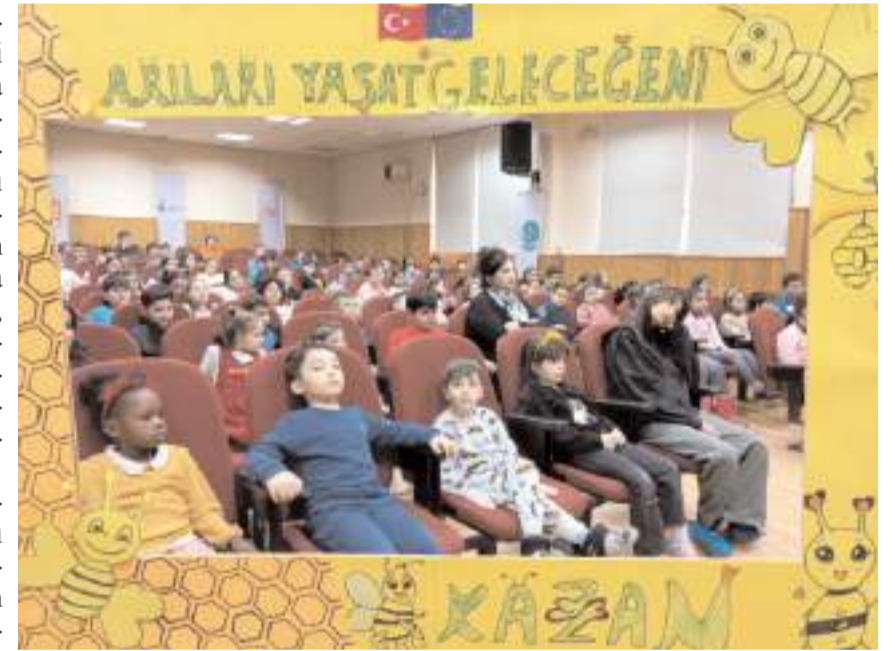
Anlatılanları öğrenciler büyük bir ilgiyle dinledi.