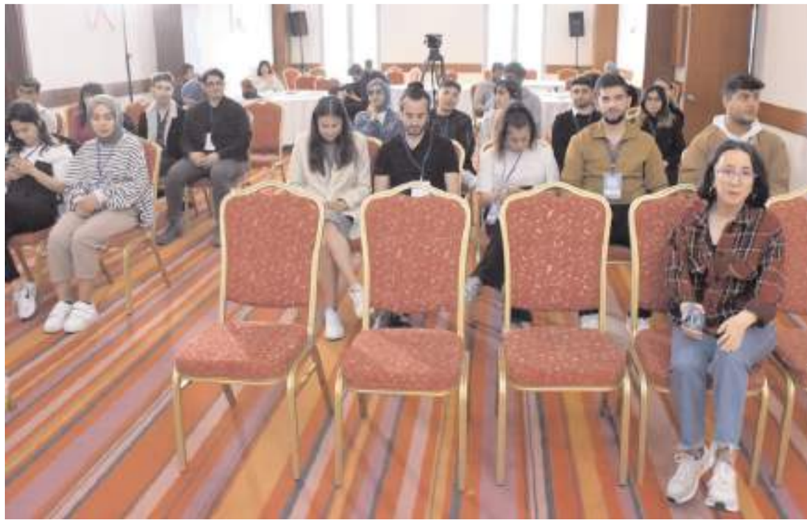
Gençlere yönelik "Orta Karadeniz Bölgesi NEET Toplantısı" Ordu'da gerçekleştirildi.

dik. Az sonra gençlerimiz karar alıcılarla bir araya gelecek. Daha sonrasında ise gençlerden yerel gençlik politika reformlarını oluşturmalarını hedefleyeceğiz. Sonrasında da bu reformların hayata geçmesi için hem bireysel hem proje olarak adımlar atacağız."(AA)