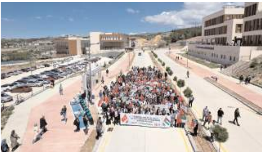
AK Parti İl Gençlik Kolları ve Hitit Üniversitesi ÜNİAK Kulübü İsrail'in Gazze'ye yönelik saldırılarını Kuzey Kampüsünde protesto etti.