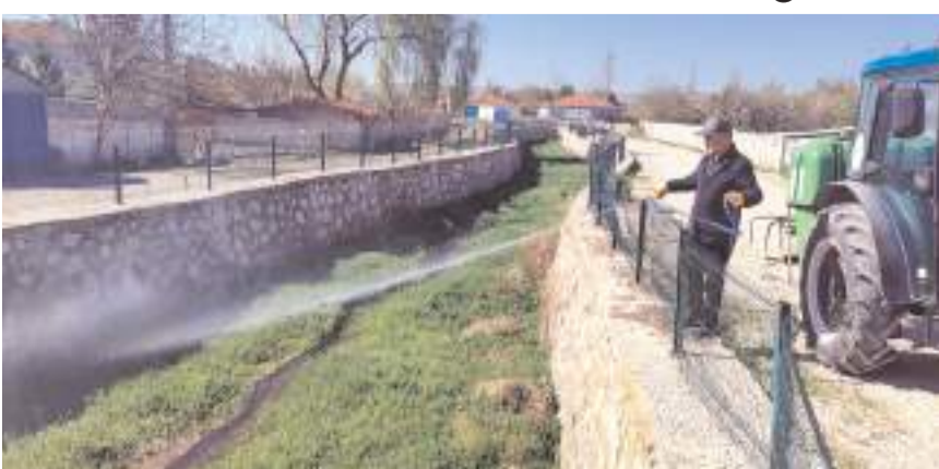
Belediye ekipleri, ilçe genelinde kanal ve göletleri düzenli olarak ilaçlıyor.

Alaca Belediyesi, halk sağlığını tehdit eden sinek, sivrisinek ve larvalara karşı ilaçlama çalışmalarına hız verdi.