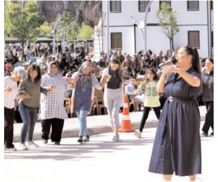
Programda yerel sanatçılar konser verdiler.

İlçede Hıdırellez'in geleneksel olarak kutlandığını hatırlatan Gelgör, "Son yıllarda pandemi süreci nedeniyle Hıdırellez etkinlikleri yapamamıştık. Geçtiğimiz yıl da 6 Şubat depremindeki yasamız nedeniyle etkinlik yapmadık. Ancak Hıdırellez ilçemizin kültüründe önemli bir yere sahip. Asırlardır kültürel olarak kutlanıyor. Biz de kültürümüzü yaşatmaya, gelecek nesillere aktarmaya devam edeceğiz." dedi.(AA)