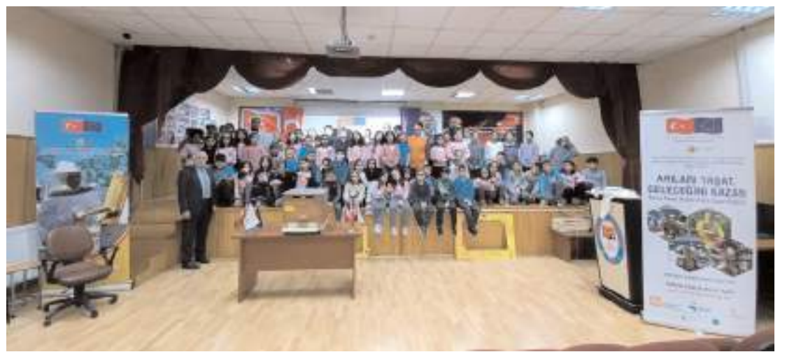
"Arılar Yaşat, Geleceğini Kazan" projesi kapsamında, 20 ilkokulda farkındalık eğitimleri yapıldı.

"Deniz Gezmiş ve arkadaşlarının mücadelesine omuz verdiği Filistin halkı, o gün olduğu gibi bugün de İsrail Siyonizmi'nin emperyalizm destekli katliamlarıyla yüz yüze. İşgalci İsrail ordusunun Gazze'ye 7 Ekim 2023'ten bu yana düzenlediği saldırılarda hayatını kaybedenlerin sayısı 35 bine yaklaştı. Bizler bu ülkenin emekten, demokrasiden ve barıştan yana güçleri tıpkı Denizler'in yolunda Filistin'in yanındayız" dedi. (Haber Merkezi)