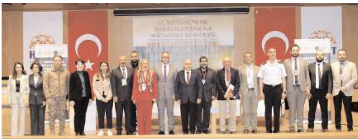
Panelin sonunda hatıra fotoğrafı çekildi.