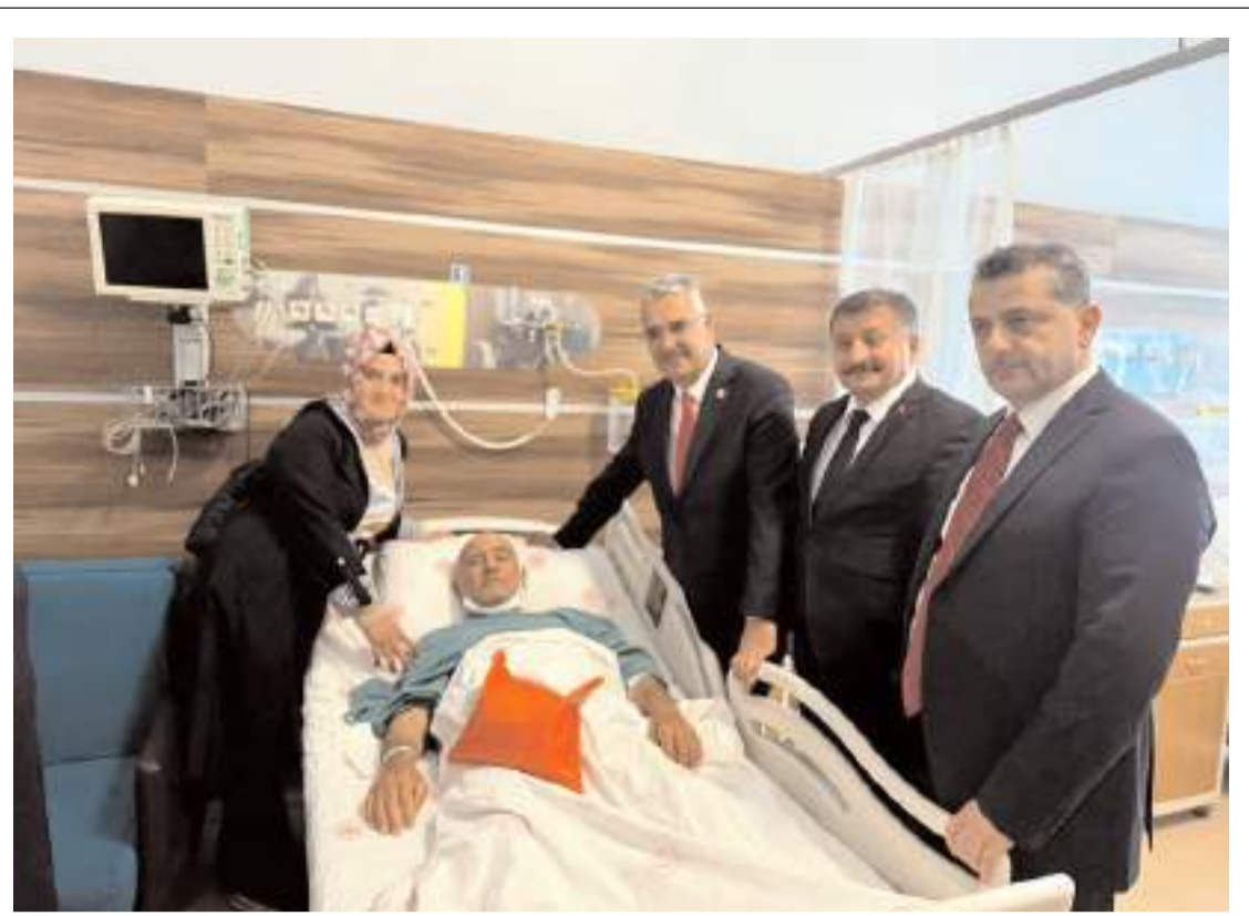
Milletvekili Yusuf Ahlatcı, Hitit Üniversitesi Erol Olçok Eğitim ve Araştırma Hastanesinde tedavi gören hastaları ziyaret etti.