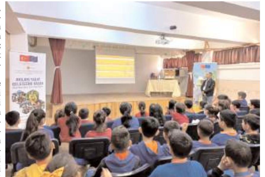
Öğrencilere proje tanıtım filmi ve arılarla ilgili animasyon filmi izletildi.