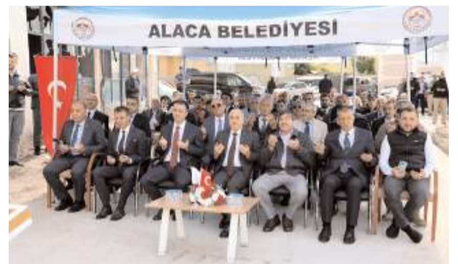
4-6 Yaş Kur'an Kursu ve Diyanet Gençlik Merkezinin temeli dualarla atıldı.