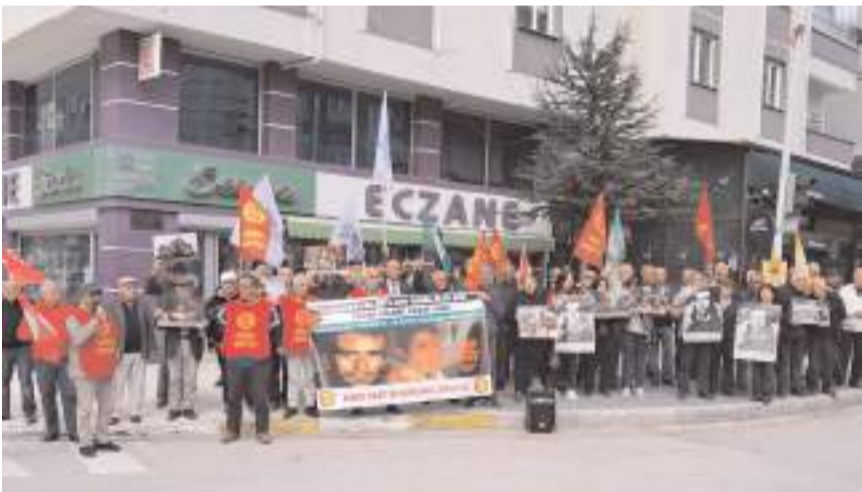
Programa CHP, DEM Parti, SOL Parti ve Çorum Emek ve Demokrasi Platformu da destek verdi.