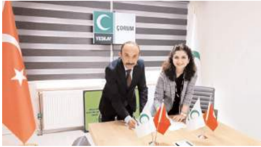
Sungurlu Denetimli Serbestlik Müdürlüğü ile Çorum Yeşilay Danışmanlık Merkezi işbirliği yapacak.

Yapılan protokol kapsamında; yükümlülere madde bağımlılığı, alkol bağımlılığı, sigara bağımlılığı, kumar bağımlılığı ve internet bağımlılığı gibi konularda farkındalık oluşturulması ve bilgilendirmelerin yapılması, Denetimli Serbestlik Müdürlüğü'nde yapılan iyileştirme çalışmaları kapsamında yükümlülere bilgilendirme seminerlerinin verilmesi konularında mutabakat sağlandı. TCK'nın 191/3. maddesi gereğince haklarında madde bağımlılığı tedavisi verilen yükümlülerin Çorum Yeşilay Danışmanlık Merkezine yönlendirilmesi, yönlendirme yapısı yükümlülere burada ba-