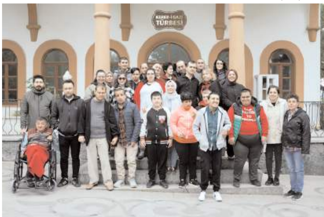
Öğrenciler, Hıdırellez etkinliklerinde sahabe türbelerini ziyaret ederek dua ettiler.