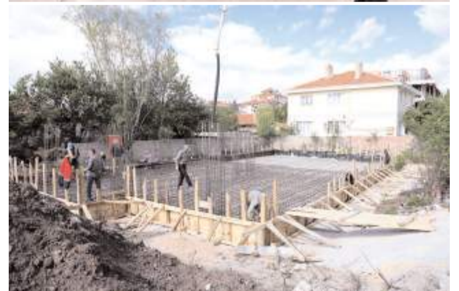
4-6 Yaş Kur'an Kursu ve Diyanet Gençlik Merkezi 897 metrekare arsaya 2 katlı olarak inşa edilecek.