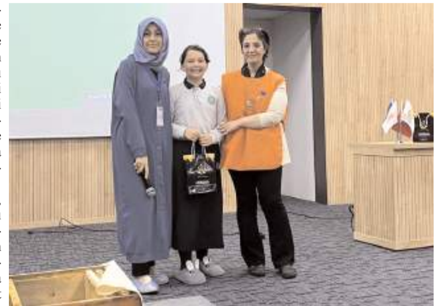
Öğrencilere çeşitli hediyeler verildi.

Eğitimlerde, Kadeş Barış Meydanında 20 Mayıs 2024 tarihinde düzenlenecek olan Dünya Arı Günü programına bütün öğrenciler aileleriyle birlikte davet edildi. (Haber Merkezi)