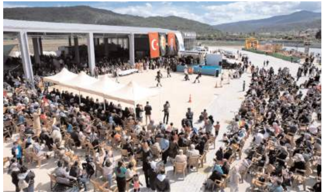
Şenliğe ilçe halkının ilgisi yüksek oldu.