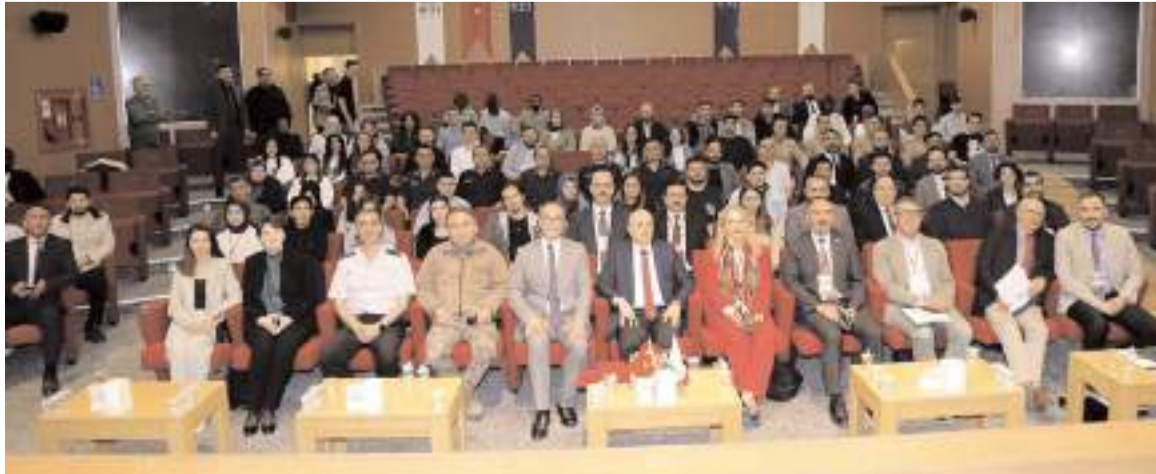
Kongre Hitit Üniversitesi İktisadi ve İdari Bilimler Fakültesi ile Terörizm ve Radikalleşme ile Mücadele Araştırma Merkezi işbirliğinde yapıldı.