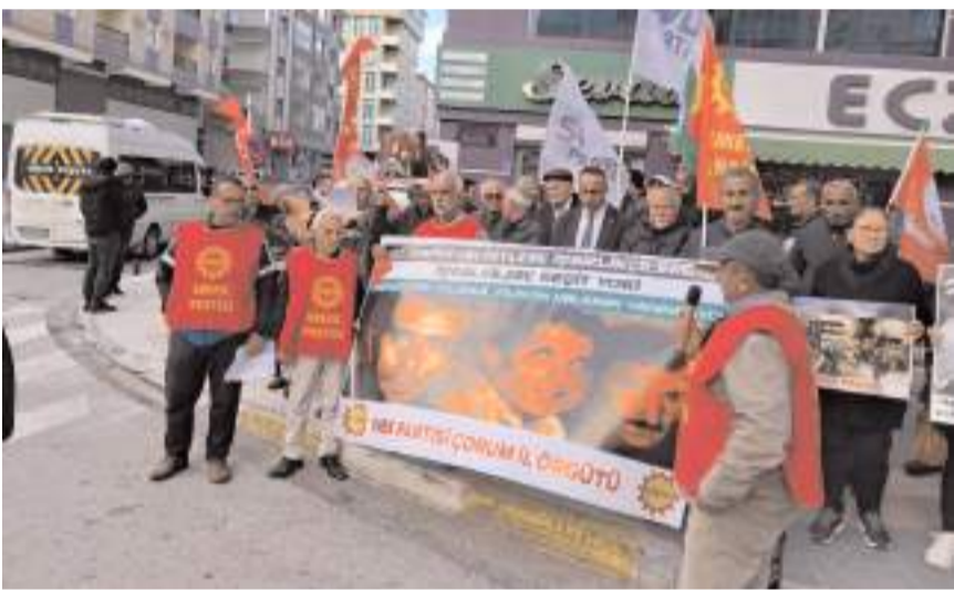
Program Özdoğanlar Kavşağı'nda yapıldı.