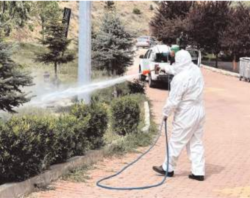
Ekipler, vatandaşlardan gelen istek ve şikayetlere anında müdahale ediyor.

Belediye ekipleri, sivrisineklerin ürediği su birikintisi olan yerlerde ve derelerde tablet uygulaması ile sivrisinekle mücadele çalışması yapıyor. Sivrisineklerin özellikle durgun su birikintilerinden kaynaklandığını ifade eden yetkililer "Vatandaşlarımız sivrisineklerin oluşmaması için bahçelerinde ve çevrelerinde durgun su birikintilerinin oluşmasını engellemelidirler. Bahçede ve balkonda saksı altlarında kalan su birikintileri sinek oluşumunu tetiklemektedir. Hemşerilerimizden bu konuda daha hassas olmalarını rica ediyor-