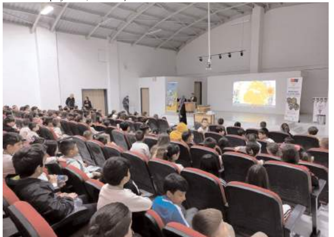
Öğrenciler, kovanları yakından inceleyerek arıların yaşam döngüsü hakkında bilgi sahibi oldular.