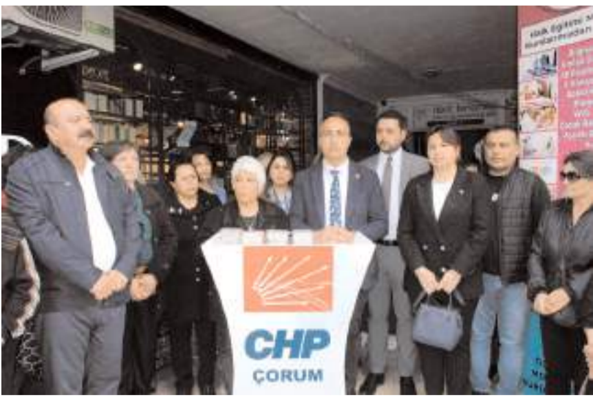
CHP İl Başkanı Av. Dinçer Solmaz, açıklama yaptı.