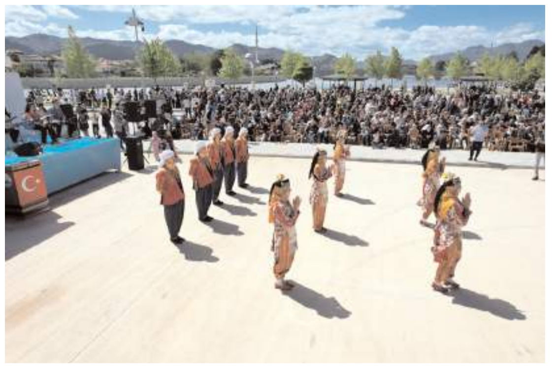
Şenlik Osmaniye Belediyesiince Millet Bahçesi'nde düzenlendi.

Kaçak döküm yapılan gübrelik alanlar ve küçük su birikintilerinde binlerce larvanın üreyebileceğine dikkat çeken belediye ekipleri, "Vektörel mücadelede vatandaşlarımızın desteği bizim için çok önemli. Yaptığımız çalışmalarla vatandaşlarımızın aldığı tedbirler birleşince daha etkili ve daha güzel sonuçlar ortaya çıkmaktadır. Hemşerilerimiz evsel katı atıklarını çöp poşetlerinin ağzını kapatarak çöp konteynırına bırakıp konteynır kapaklarını da kapalı tutmaları gerekmektedir. Alınacak bu önlemler vektörel mücadelemize çok önemli katkılar sağlayacaktır" denildi. (İHA)