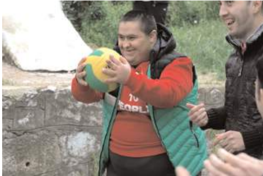
Yeşillikler arasında gerçekleşen etkinlik, renkli görüntülere sahne oldu.