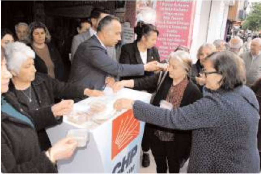
Hıdırellez günü nedeniyle parti binası önünde helva dağıtıldı.