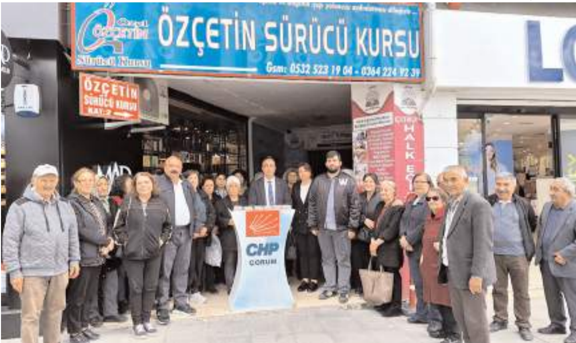
Helva dağıtımının ardından toplu hatıra fotoğrafı çekildi.

Cumhuriyet Halk Partisi (CHP) Çorum İl ve Merkez İlçe Kadın Kolları tarafından, Deniz Gezmiş ve arkadaşlarının idam edilmelerinin yıl dönümü ve Hıdırellez günü nedeniyle parti binası önünde helva dağıtıldı.