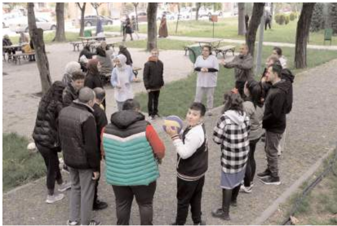
Kutlama programı Hıdırlık Parkı'nda yapıldı.

Yapılan konuşmaların ardından Kadın Kolları tarafından hazırlanan helvalar, parti yöneticileri tarafından vatandaşlara ikram edildi. (Haber Merkezi)