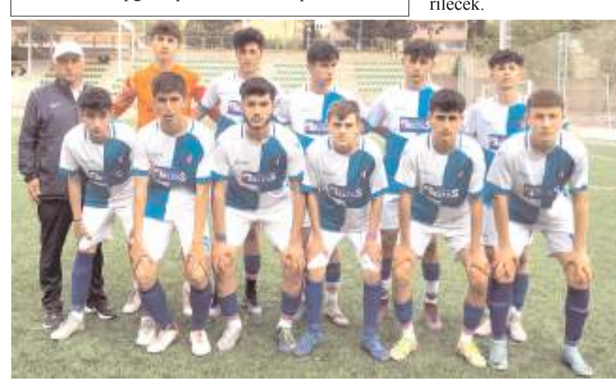
Gençlerbirliği U 17 takımı bugün lider önünde puan mücadelesi verecek