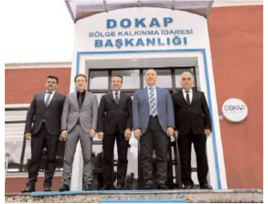
İmza töreninin ardından hatıra fotoğrafı çekildi.

gularının gelişmesini sağlayacak "Oyuncak Müzesi ve Masal Evi" yapılacak. Masal Evi içerisinde tiyatro gösterimi ve geleneksel oyunlar sergilenerek çocuklarımızın kültürel aktarım sağlanmış olacaktır. Masal Evi sayesinde öğretmenlerimiz sınıf dışında uygulamalı eğitim yapacak; masal anlatıcılığı, müzede öğrenme, tiyatro, oyun, drama ve müzik gibi birçok faaliyet gerçekleştirilecektir. Ayrıca Masal Evi ve Oyuncak Müzesi, sınıf rehber öğretmenlerimiz tarafından masal ve oyun terapisi, resim analizi, çocukları tanıma ve bilgi toplama amacıyla veri kaynağı olarak kullanmaya olanak sağlayacak olup oyuncak müzesi bölgemizde ilk ve tek olacaktır. Genel hedefleri ile geleneksel oyun ve oyuncağın kullanılarak kültürel aktarımın sağlanması, çocukların anne babaları ile oyun oynayarak aile içi iletişimin güçlendirilmesi sağlanacak olan projemizin toplam yatırım tutarı 778.000,00 TL olarak belirlenmiştir" denildi. (Haber Merkezi)