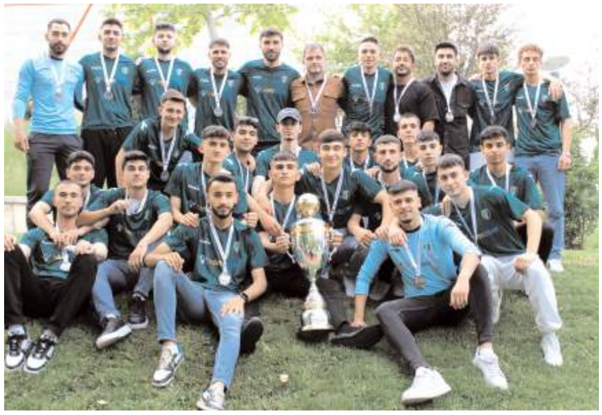
1. Amatör Küme'de şampiyon olan Mimar Sinan Gençlikspor takımı teknik heyet ve sporcuları kupa töreni sonrasında kazandıkları kupa ile birlikte toplu halde görüldü