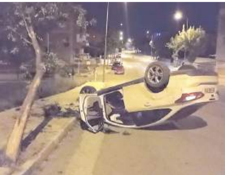
Kaza, Mimar Sinan 10. Caddede meydana geldi.

Çorum'da alkollü olduğu öğrenilen sürücünün kontrolünden çıkan otomobil yol kenarındaki ağaca çarpıp takla attı. Kazada sürücü yaralandı.