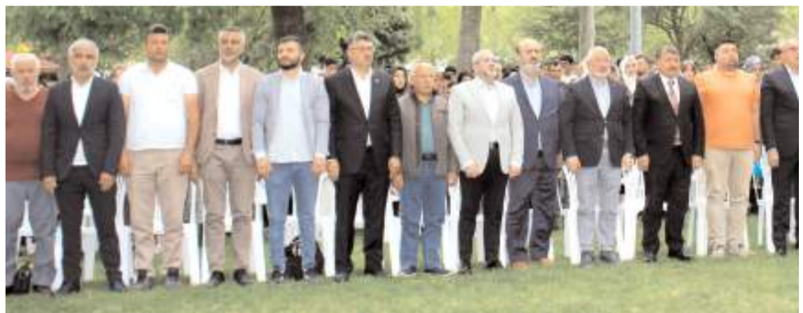
Mimar Sinan Gençlikspor'un kupa törenine çok sayıda davetli ile birlikte sporcu aileleri ve sporcular katıldılar.