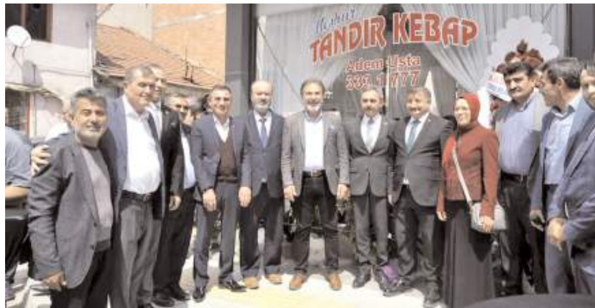
Açılış törenine çok sayıda davetli katıldı.