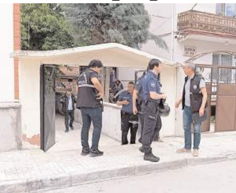
Olay Ulukavak Mahallesi'nde meydana geldi.

Çorum'da bir apartman dairesinde piknik tüpünün patlaması sonucunda, evde bulunan karı-koca yaralandı.