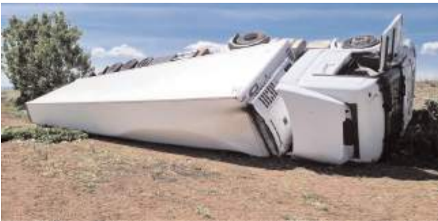
Kaza, Çorum'un Alaca ilçesi İbrahim köyü mevkiinde meydana geldi.

Kaza, Çorum'un Alaca ilçesi İbrahim köyü mevkiinde meydana geldi. Edinilen bilgiye göre, meyve yüklü tır, ismi öğrenilemeyen sürücüsünün direksiyon hakimiyetini kaybetmesi neticesinde şarampole devrildi. Kazada sürücü yara almadan kurtuldu. Devrilen tırın kaldırılması için çalışma başlatıldı. (İHA)