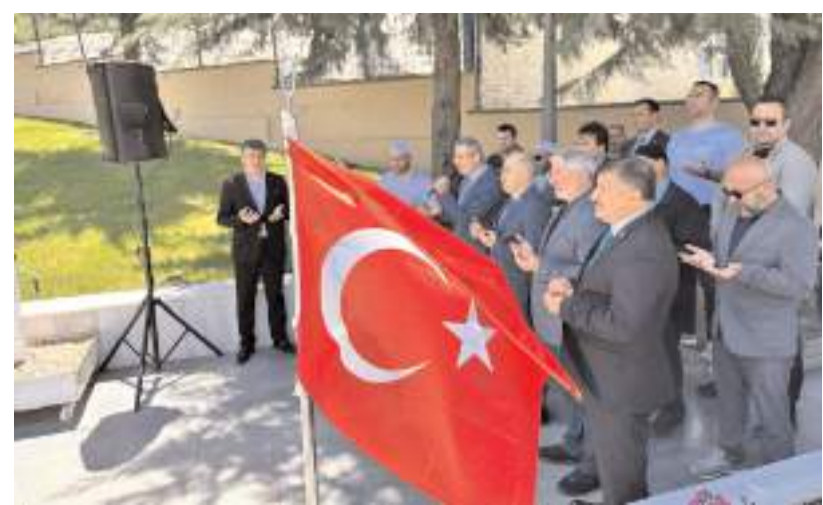
Şehitlikte yapılan programda şehitler için dua edildi.

İngilizce bilen Aksoy, evli ve 2 çocuk babasıydı.