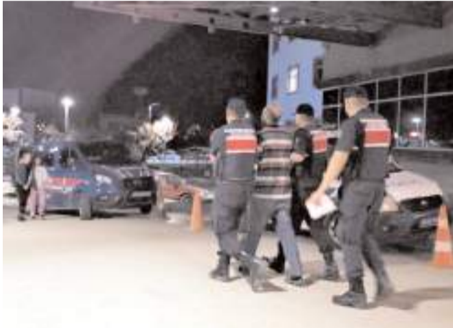
B.Ö. jandarma ekiplerince gözaltına alındı.

B.Ö. ise olayda kullandığı silahlarla jandarma ekiplerince gözaltına alındı.(AA)