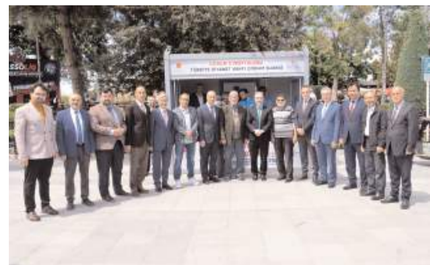
Açılışın ardından hatıra fotoğrafı çekildi.

ile beraber yaptıkları önemli hizmetlerden birinin de "Vekaletle Kurban Kesim Organizasyonu" olduğunu kaydeden Müftü Yıldırım, Diyanet İşleri Başkanlığı ve TDV'nin 2024 yılı vekaletle kurban kesim bedelini yurt içinde 11.750 TL, yurt dışında ise 4.750 TL olarak