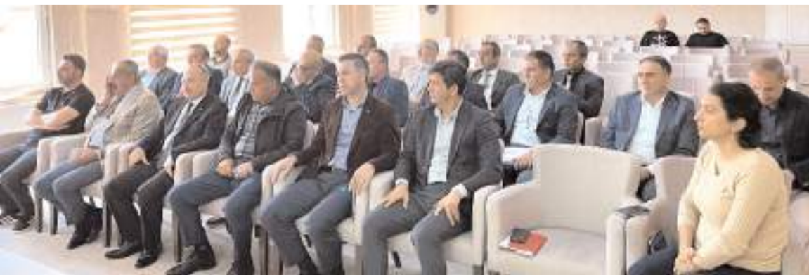
İl Müdürlüğü toplantı salonundaki toplantıya Şube Müdürleri ve Gençlik Merkezi müdürleri katıldı

Çorum'da dört gün süre ile Nazmi Avluca sahasında yapılan okullu Yıldızlar Ragbi Türkiye Şampiyonasında 16 erkek 16 bayan 32 takım mücadele etti. Zorlu maçlar sonunda kızlarda Samsun Yörükler Ortaokulu erkeklerde ise Adana Çeş Sofulu Ortaokulu şampiyon oldu.