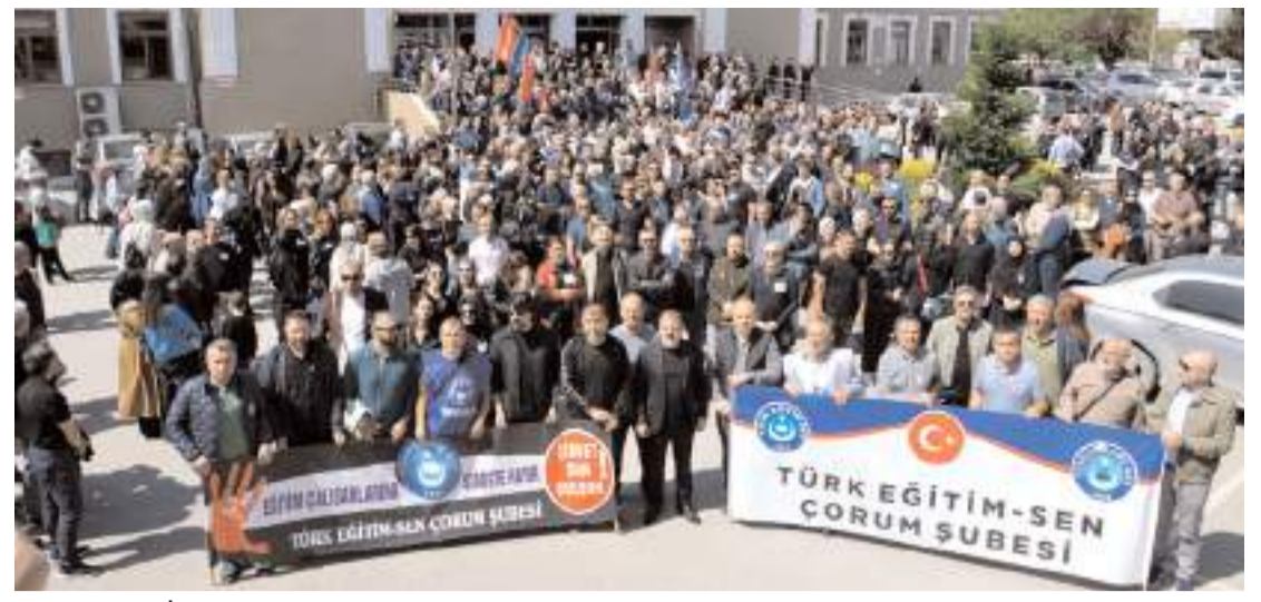
İl Millî Eğitim Müdürlüğü önünde yapılan basın açıklamasına katılım yüksek oldu.