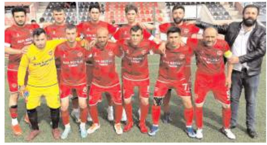
Düvenci Belediyespor lideri yenerek final grubu için umutlanmak istiyor

İl birinciliğine merkez ve ilçelerden minik güreşçilerin katılımı bekleniyor.