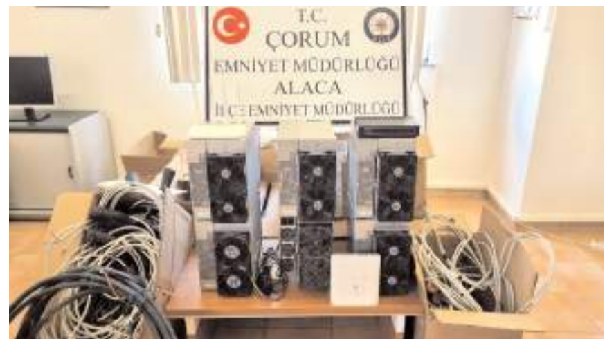
Ele geçirilen cihazlara el konuldu.

Burada yapılan incelemede, ayrıca binaya kaçak elektrik hattı çekildiği tespit edildi.