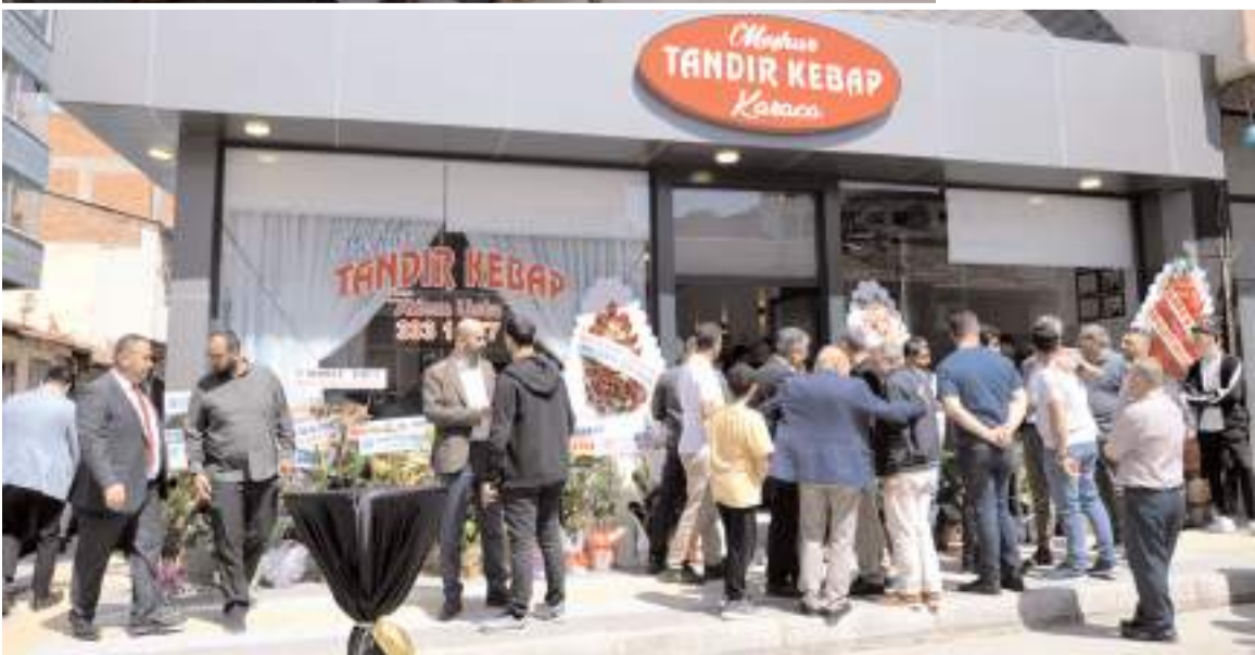
Karaca Tandır Kebap, Sobacılar Arastası girişinde faaliyete başladı.

Gel al paket servislerinin olduğunu da ifade eden Biçer, müşterilerinin 333 1 777 numaralı telefondan sipariş verebileceklerini kaydetti.