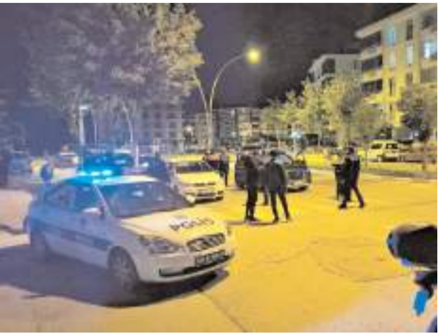
Kentin 9 farklı noktasında gerçekleştirilen huzur uygulamalarında 462 araç kontrol edildi.

Çorum'da yapılan asayiş ve trafik uygulamalarında haklarında kesilmiş hapis cezası bulunan 5 kişi yakalandı.