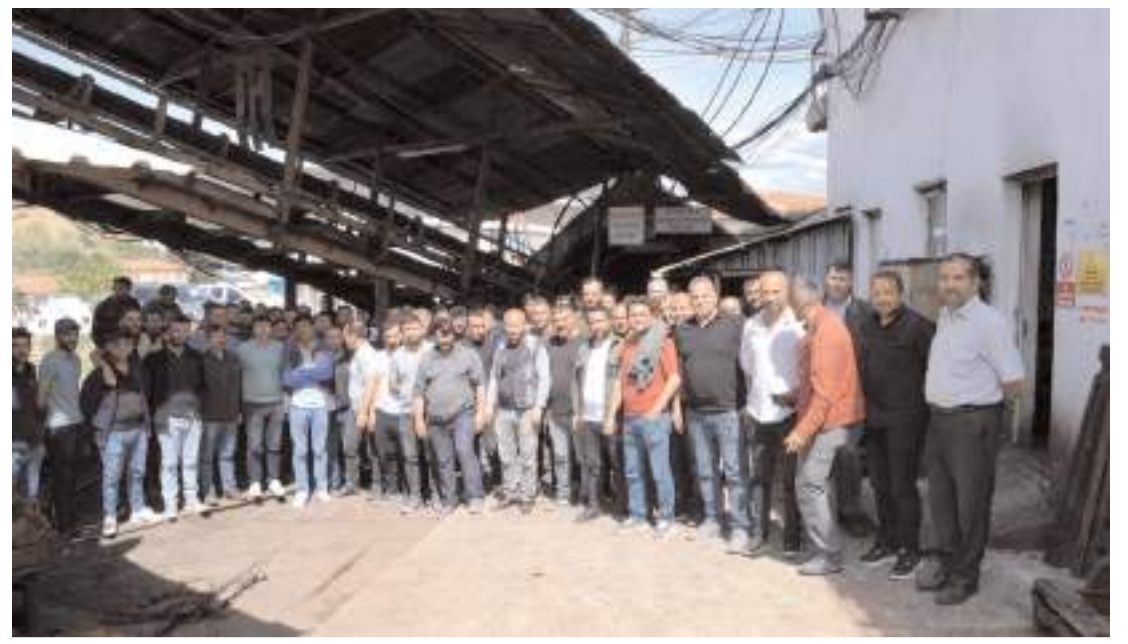
Maden işçileri sorunun çözülmesini istiyor.

Patlamanın şiddetiyle apartman dairesinin camları kırıldı, maddi hasar meydana geldi. (İHA)