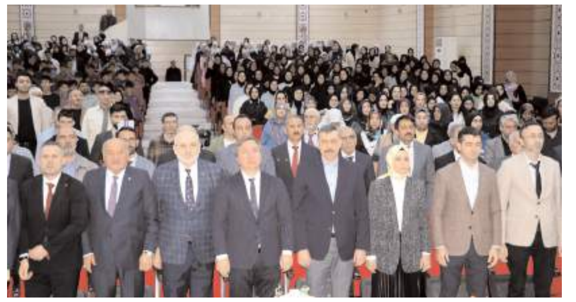
Yarışmanın finali Erzincan İl Müftülüğü konferans salonunda yapıldı.