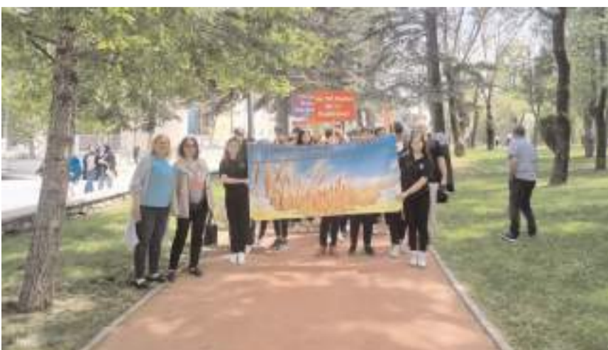
Yürüyüşte Çölyak hastalığı ile ilgili pankart ve dövizler açıldı.