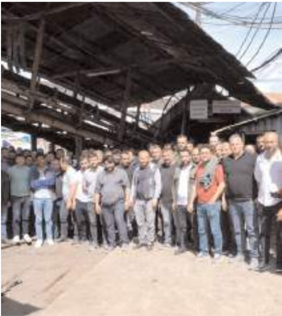
Maden işçileri sorunun çözülmesini istiyor.

■ Türk siyaseti ve bürokrasisinin önemli isimlerinden eski Devlet Bakanı hemşehrimiz Bekir Aksoy 74 yaşında hayatını kaybetti. * HABERİ10'DA