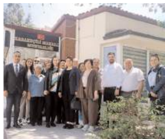
CHP heyeti muhtarların sorun ve taleplerini dinledi.

Ziyaretten duyduğu memnuniyeti dile getiren muhtarlar ise, CHP heyetine nazik ziyaretleri için teşekkür ettiler. (Haber Merkezi)