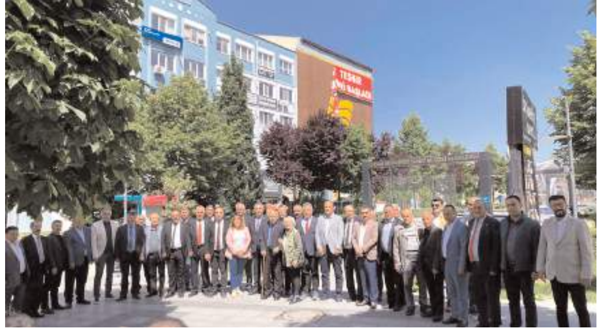
Basın toplantısının ardından toplu hatıra fotoğrafı çekildi.

"Devlet Hastanesi inşallah tasarruf tedbirlerine takılmaz. Temel kazıldı ama göreceksiniz ki büyük devlet hastanesi yerine yatak sayısı düşürülmüş Semt Polikliniği şeklinde bir temel atacaklar. Ona da şükür dedik ama hala onun da temel atma törenini yapmadılar. Sağlıkta ikinci ayak olan devlet hastanesini 7 yıldır kapalı tutarsanız, ilçelerin çoğunda doğru düzgün uzman doktor bırakmazsanız bütün hastalar Çorum merkeze gelmek zorunda kalıyor. Bu yüzden merkezde hastanenin kapasitesi kaldırmıyor. Çorum'a gelen uzman doktorlarımızı-