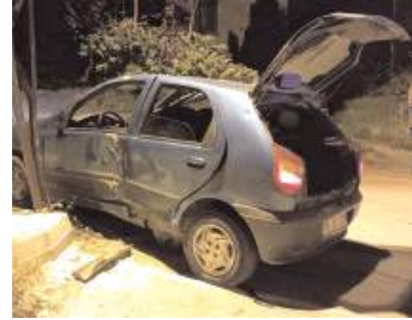
Olay, Bahçelievler Mahallesi Cumartesi Pazarı içerisinde meydana geldi.

Ote yandan, kaçan 3 şüpheli şahıs hakkında yakalama çalışması başlatıldı. (İHA)