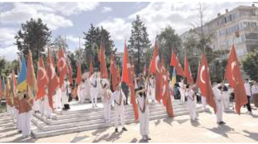
Kutlamalar kapsamında ilk töreni Atatürk Anıtında yapıldı.

Kutlama programı Çorum Belediyesi Halk Oyunları Ekibinin gösterisi ile sona erdi.