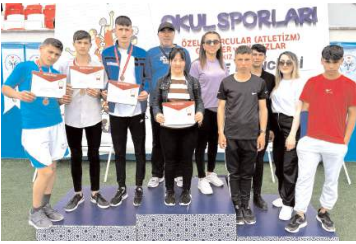
Konya'da yapılan Türkiye Şampiyonasında mücadele eden Çorum takımı sporcuları tören sonunda toplu halde