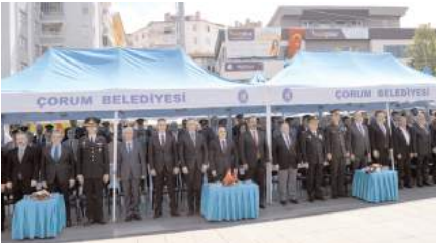
19 Mayıs Atatürk'ü Anma, Gençlik ve Spor Bayramı nedeniyle Kadeş Barış Meydanında kutlama programı yapıldı.