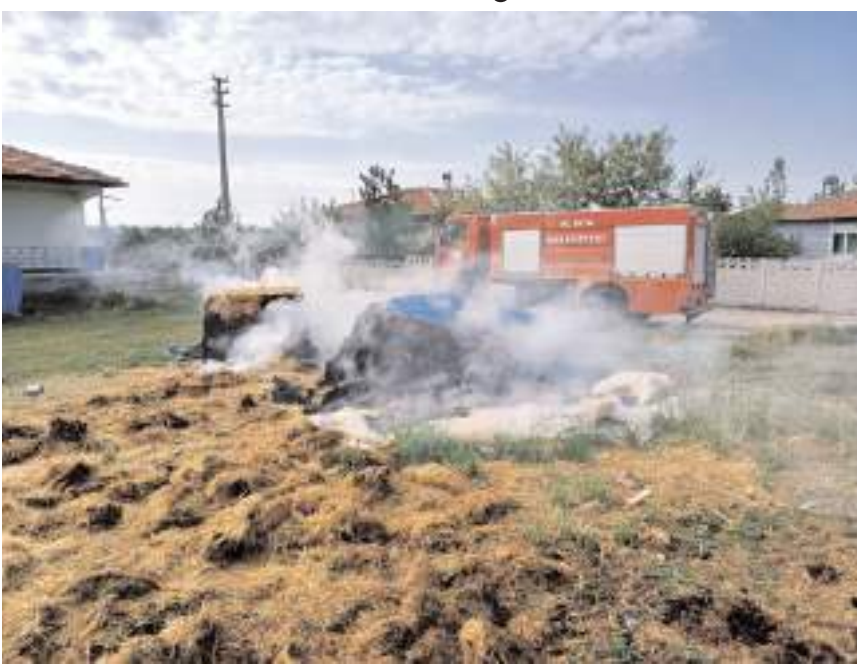
Denizhan Mahallesi Çamlıca Sokak'ta meydana geldi.

Alaca'da çıkan yangında, çok sayıda saman balyası yandı.