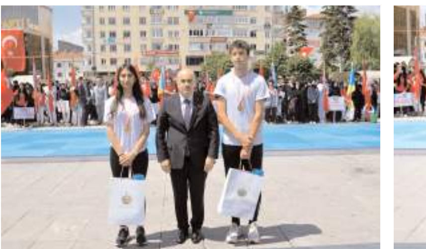
Gençlik Haftası kapsamında Gençlik ve Spor İl Müdürlüğü tarafından düzenlenen atletizm yarışmalarında derece elde eden sporculara ödülleri protokol üyeleri tarafından verildi.