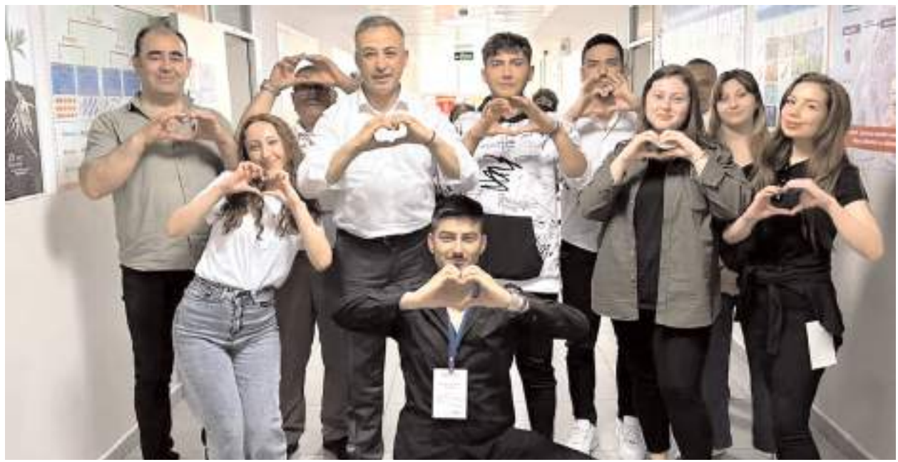
Milletvekili Mehmet Tahtasız, yaptığı açıklama ile 19 Mayıs Atatürk'ü Anma, Gençlik ve Spor Bayramını kutladı.