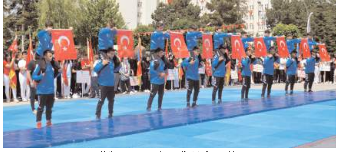
Kutlama programında sportif gösteriler yapıldı.

Binlerce şehit vererek sıkıntı ve yokluk içinde büyük özveriyle kurulan Türkiye Cumhuriyeti'nin gençlere emanet olduğunu kaydeden Cemil Çağlar, "Bu değerli emaneti yaşatmak ve son-