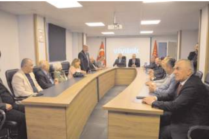
CHP Çorum Milletvekili Mehmet Tahtasız, parti binasında basın toplantısı düzenledi.