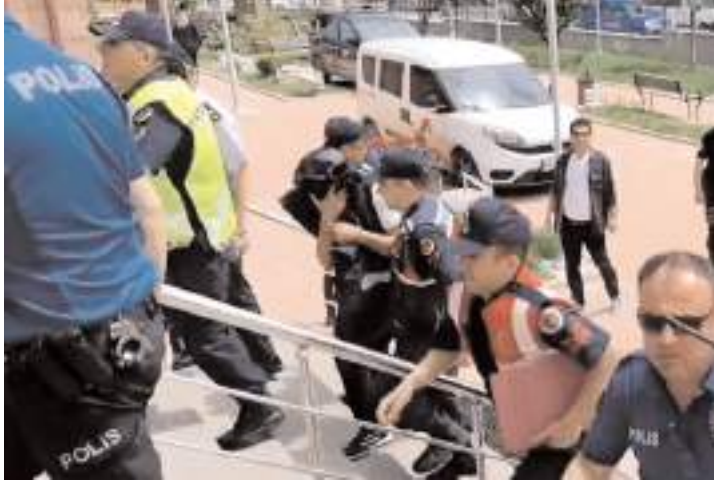
Hüseyin Ç, çıkarıldığı hakimlikçe tutuklandı.

Sağlık ekiplerince kaldırıldığı Osmançık Devlet Hastanesi'nde hayatını kaybeden Afacan'ın cenazesi ise Osmançık İlçe Mezarlığı'nda defnedildi.(AA)