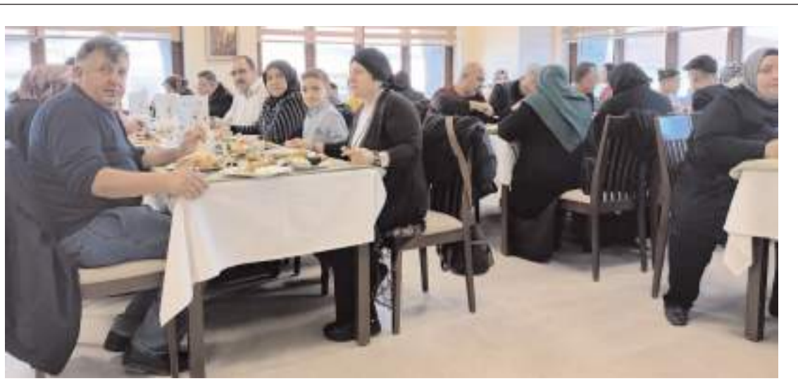
Ka-Der yönetimi yeni dönemde de çok sayıda etkinlik yapmayı planlıyor.

"Doğadaki mantarların zehirli olup olmadığını ayırt etmek için bir metot yok. Doğadan toplanılan yabani mantarların içerdiği zehri herhangi bir uzaklaştırma yöntemi de yok. Bol suyla yıkama, tuzlu suda bekletme, pişirme gibi yöntemlerle asla toksinlerden uzaklaştıramıyoruz çünkü mantarların içerisinde bulunan zehirli toksinlerin yükseği bile dayanıklı olduğu biliniyor." (AA)