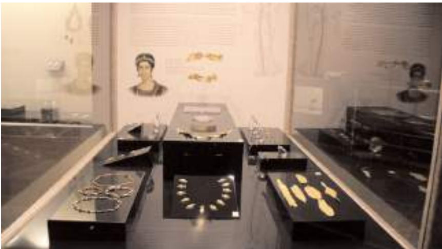
Müzedeki 2023-2024 sezonunda 10 vitrinde yeni düzenleme yapıldı.