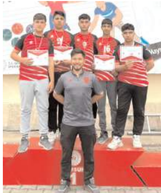
Şehit Erol Olçok Anadolu İmam Hatip Lisesi erkek takımı grupta ilk üç içinde yer alarak finallere yükseldi