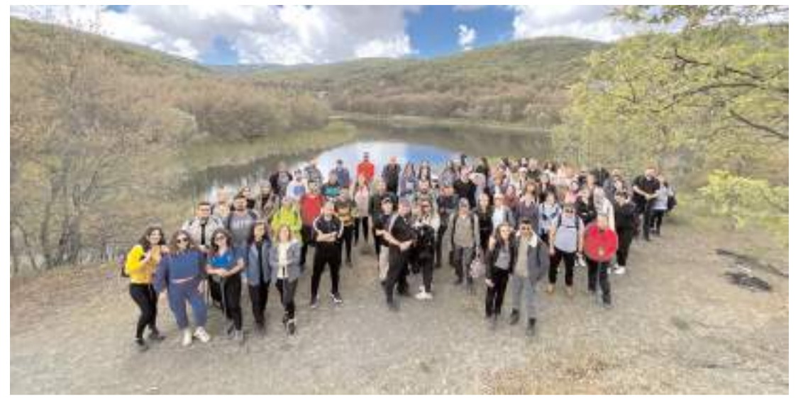
Doğaseverler, Hititlerin başkenti Hattuşa'ya ev sahipliği yapan Boğazkale'de Hitit Yolu'nda yürüyüş yaptı.

Oğan, akabinde saat 12.00'de Türkiye İttifakı Partisi'nin İl Başkanlığının açılışını yapacak.