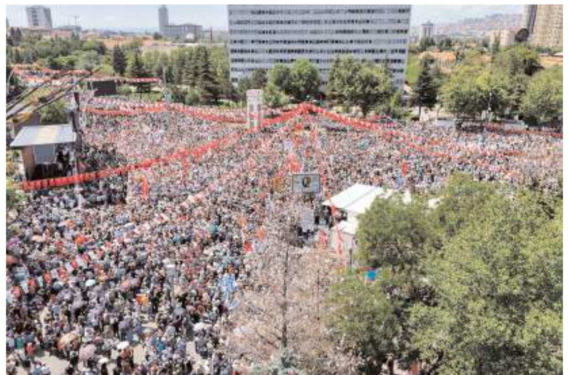
Miting Ankara Tandoğan Meydanı'nda gerçekleştirildi.