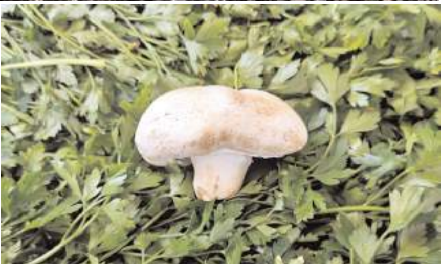
Doğada bulunan 10 binin üzerinde mantar çeşidinin 100'den fazlası zararlı.

sında doğru bilinen yanlışların da etkili olduğuna işaret etti.