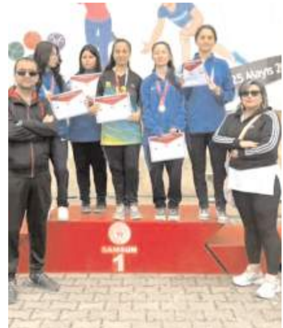
Sungurlu Şehit Ali Altın Anadolu İmam Hatip Lisesi bayan takımı Türkiye finallerine yükselmeyi başardı