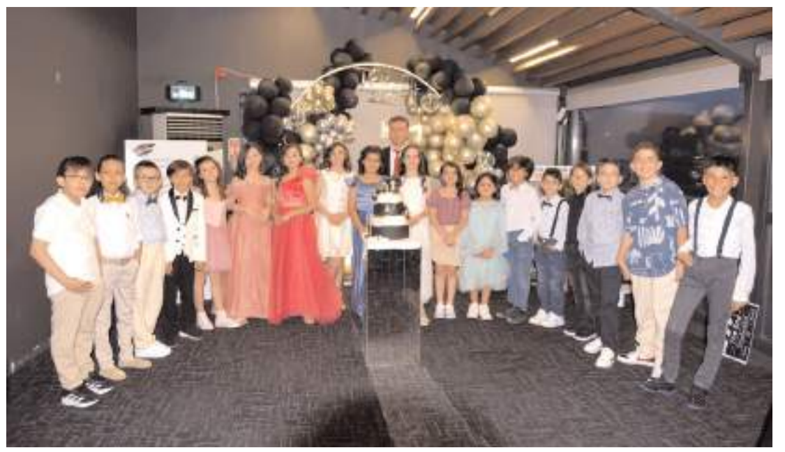
TED Çorum Koleji 4-B sınıfı öğrencileri mezun olmanın sevincini yaşadılar.

Yarısmada sonunda, birinciye 5000 TL, ikinciye 3000 TL, üçüncüye 2000 TL, dördüncüye (mansiyon) 1000 TL, beşinciye (mansiyon) 500 TL ödül verildi. Program ödüllerin verilmesiyle sona erdi. (Haber Merkezi)