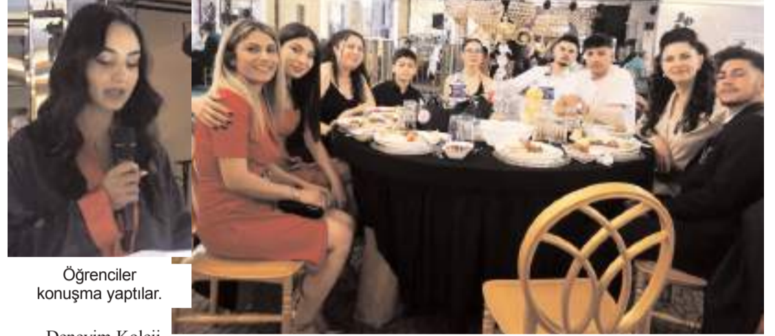
Öğrenciler konuşma yaptılar.