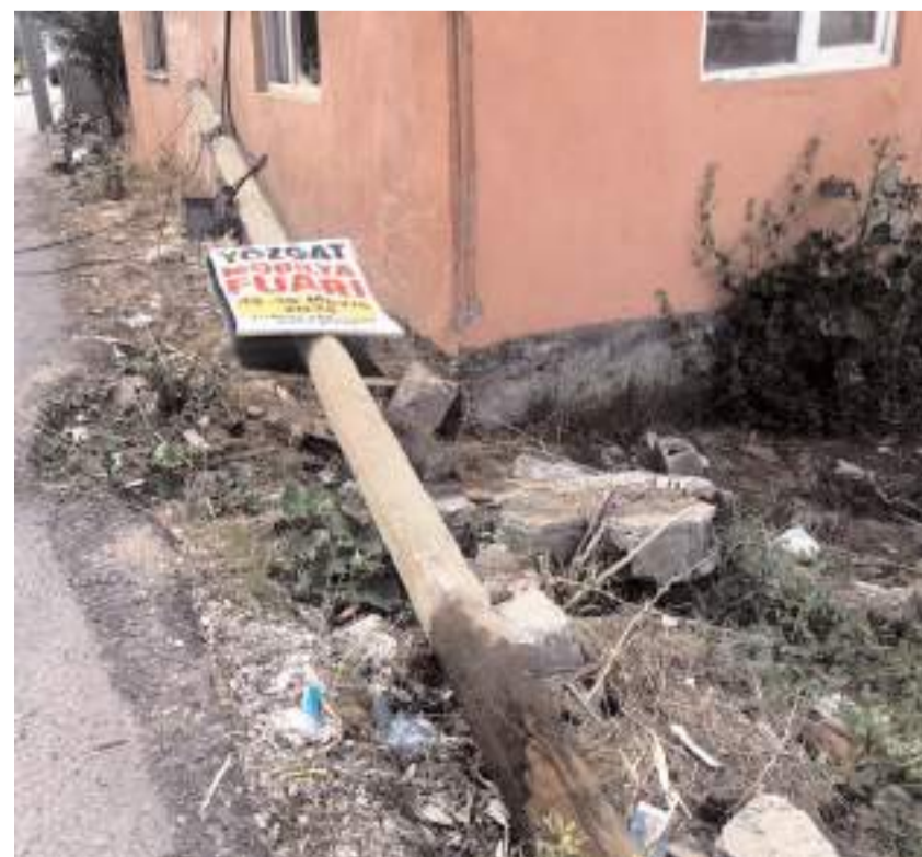
Devrilen direktteki kablolar da koptu.

Alaca'da yol kenarındaki telefon direğine çarpan kepecin sürücüsü olay yerinden kaçtı.