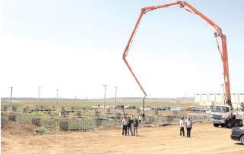
Fabrikada 12.7 milimetreden 155 milimetre kalibreye, uzunlukta ise 2 metreden 12 metreye kadar orta ve büyük kalibre namlu üretimi yapılacak.

Sungurlu Organize Sanayi Bölgesinde (OSB) Masav Savunma Sanayi Firması tarafından temeli atılan fabrikada orta ve büyük kalibre namlu üretilcek.