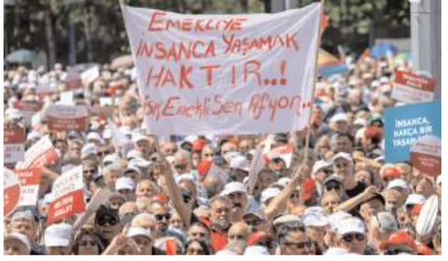
Mitingde emeklilerin talepleri dile getirildi.