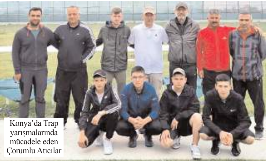
Konya'da Trap yarışmalarında mücadele eden Çorumlu Atıcılar