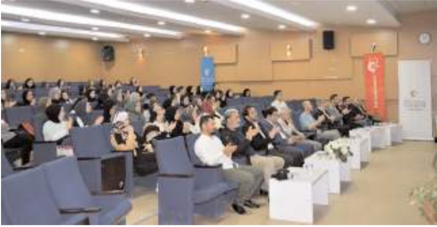
Yarısmanın finali Turgut Özal Konferans Salonunda yapıldı.