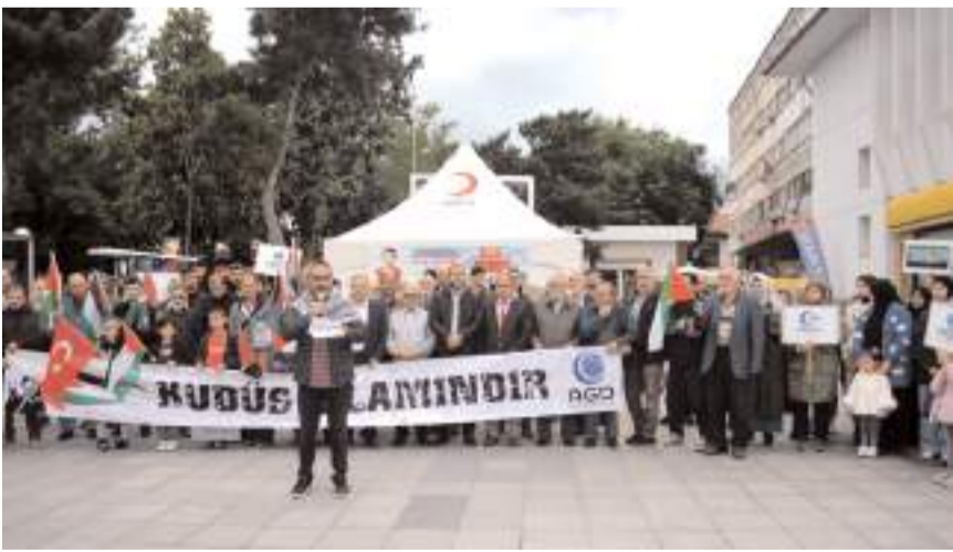
Eylemde İsrail'e tepki gösterildi.

Sözümüzü alimlerimiz tarafından Filistin mücadelesi için verilen fetvadan bir bölüm ile sonlandırmak isteriz; Gazze'yi desteklememek cihaddan kaçmaktır. Siyonistlerin Kudüs, Aksa ve Filistin'e yönelik saldırıları Müslümanların savunma cihadı yapmasını gerektirmektedir. Müslüman halkın elinden geldiğince seferber olması, elindeki tüm imkanlarla düşmana saldırması veya düşmanın ve destekçilerinin elçiliklerine giderek protesto etmesi farzdır" diyerek sözlerini tamamladı. Eylem yapılan dua ile sona erdi.