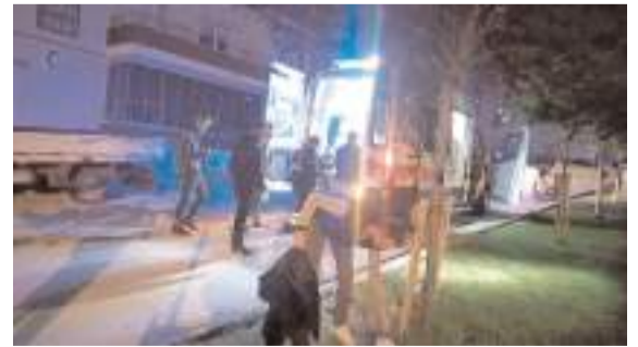
Olay, Gülabibey Mahallesi'nde meydana geldi.