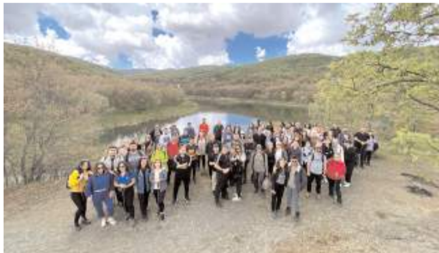
Doğaseverler, Hititlerin başkenti Hattuşa'ya ev sahipliği yapan Boğazkale'de Hitit Yolu'nda yürüyüş yaptı.