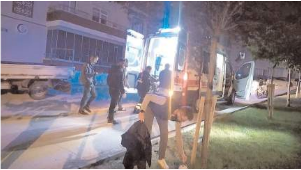
Olay, Gülabibey Mahallesi'nde meydana geldi.

Polis ekipleri olayla ilgili inceleme başlattı. (İHA)