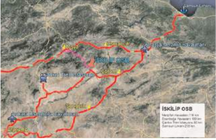
İskilip OSB ilçe merkezine 8 km mesafede bulunuyor.