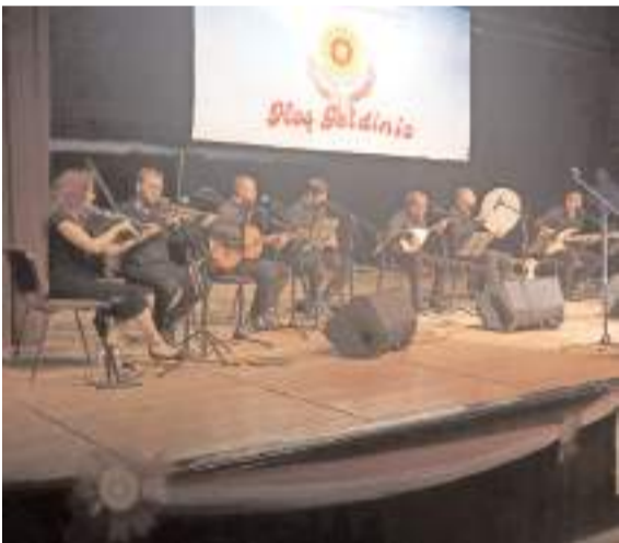
Konserde koro ve solo olarak eserler seslendirildi.