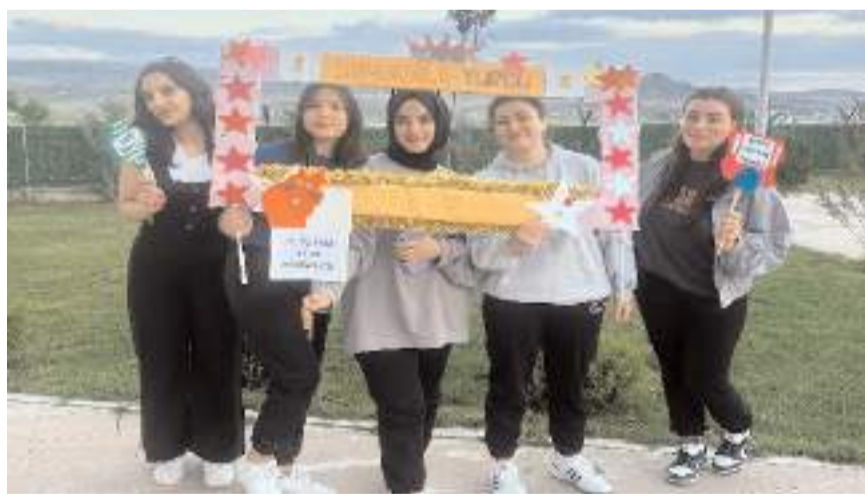
Öğrenciler bol bol hatıra fotoğrafı çekindiler.

Sungurlu KYK Yurdu'nda, öğrencilerin eğlenmesi ve mezuniyet kutlamaları için moral etkinliği yapıldı.