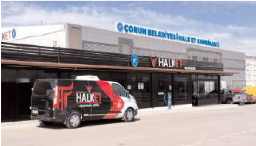
Halk Et Kombinasında kurbanlıkların kesimi yapılacak.

■ Çorum Belediyesi "Kurbanlarımız Çorumlu Kardeşlerimize" sloganıyla başlattığı kurban bağışi sistemini hizmete açtı.