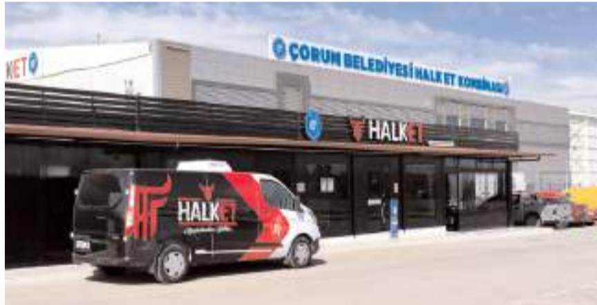
Halk Et Kombinasında kurbanlıkların kesimi yapılacak.