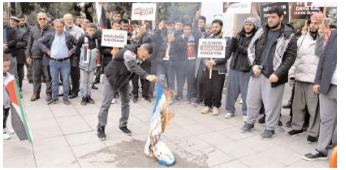
STK'lar ve vatandaşlar, 'kahrolsun İsrail, kahrolsun ABD' sloganları atarak İsrail bayrağını ateşe verdi.