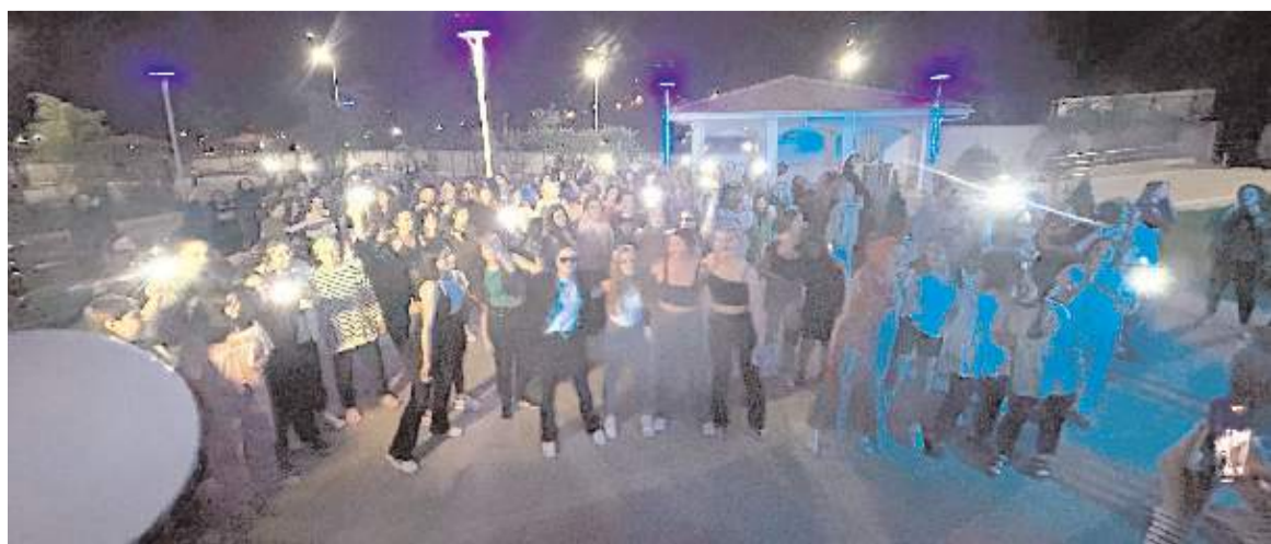
Öğrenciler kutlamada gönüllerince eğlendiler.

Yoğun sınav dönemine moral ile başlamaları için bir araya gelen öğrenciler halay çekip oyunlar oynayarak keyifli vakit geçirdiler. Programda ayrıca öğrencilere ikramlarda bulunuldu. Öğrencilerin gönüllerince eğlendiği etkinlik renkli görüntülere sahne oldu. (Haber Merkezi)