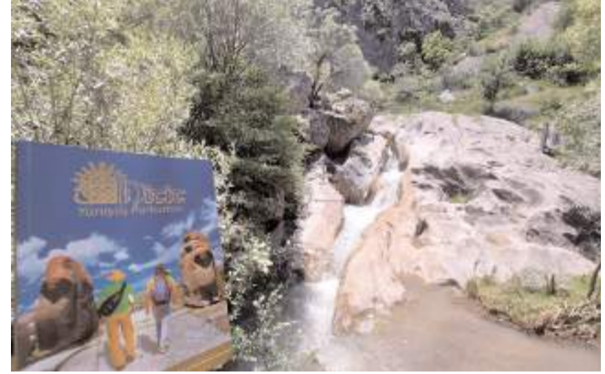
Hitit Yolu güzelliği ile dikkat çekiyor.