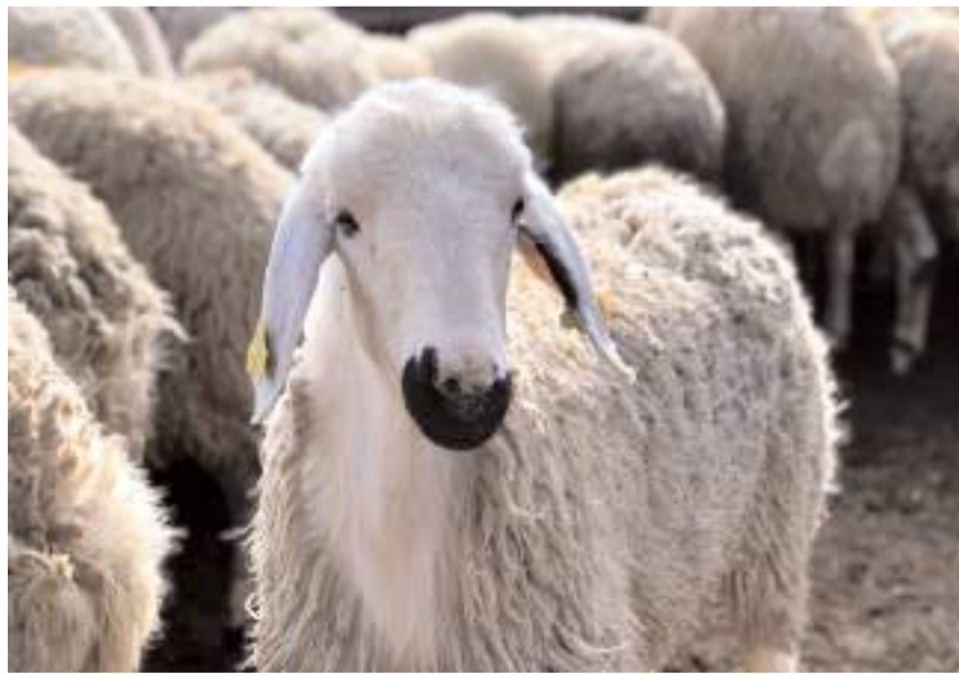
Bu yıl kurban bağış bedeli 11 bin 750 TL olarak belirlendi.

leceğini belirterek, kesilen bağış kurbanlıklarının yine aynı gün paylanarak Çorum Belediyesi Sosyal Yardım İşleri Müdürlüğü aracılığıyla da belediyenin sistemine kayıtlı şehrimizdeki ihtiyaç sahibi ailelere, geçen yılda olduğu gibi taze et olarak ulaştırılacağını söyledi.