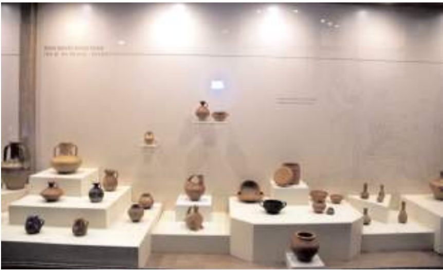
Çorum'da yürütülen 5 farklı arkeolojik kazadan çıkan özellikle eski çağ ve Hatti döneminden ve Hititler döneminden kalma pek çok eser Çorum müzesinde ziyaretçileri bekliyor