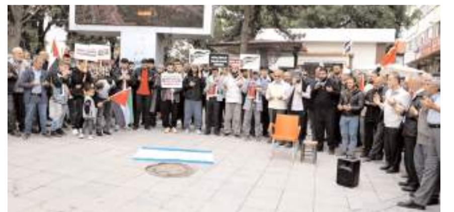
Eyleme katılım yüksek oldu.

ler? Dünyanın en güçlü ordularıyla saldırıyorlar. Bir avuç Müslüman, Hz Muhammed (S.A.V)'in davasını koruma adına yüreklerinden, annelerinden, babalarından, eşlerinden, çocuklarından vazgeçti. Müslümanlar birlik içinde olmadığı için bunlar oluyor. Ama inanıyoruz ki katil Siyonist İsrail, Allah'ın da yardımıyla mağlup olacak." ifadelerini kullandı.