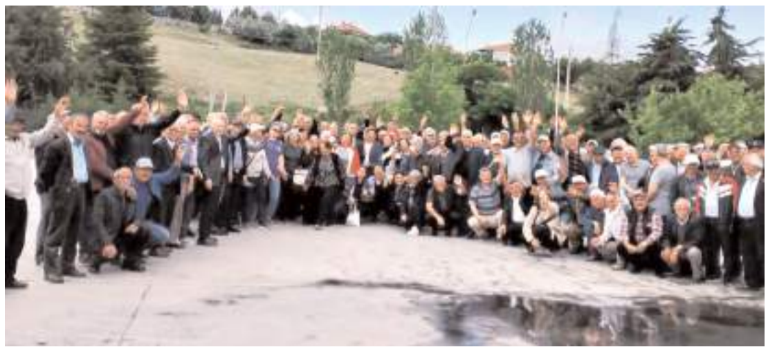
Büyük Emekli Mitingine Çorum'dan katılanlar hatıra fotoğrafı çekindiler.

Ayrıca haklarında kayıp olduklarına dair müracaatta bulunulan 3 kadın ve 3 erkek şahıs ise bulundu. (Haber Merkezi)