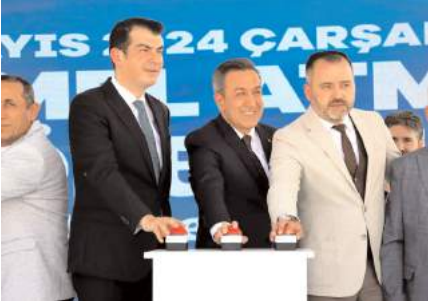
Namlu fabrikasının temeli geçtiğimiz günlerde atılmıştı.