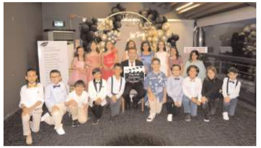
Öğrenci ve öğretmenler hatıra fotoğrafı çekindiler.

Öğrenciler, etkinlikte eğlenceli anlar yaşarken, mezuniyet pastasını kesip, hatıra fotoğrafları çektiler. Veliler ise çocuklarının bu özel gününe tanıklık etmenin gururunu yaşadılar. Ayrıca, Savaş öğretmene dört yıl