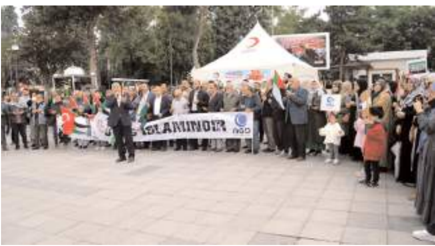
Eylem yapılan duanın ardından sona erdi.