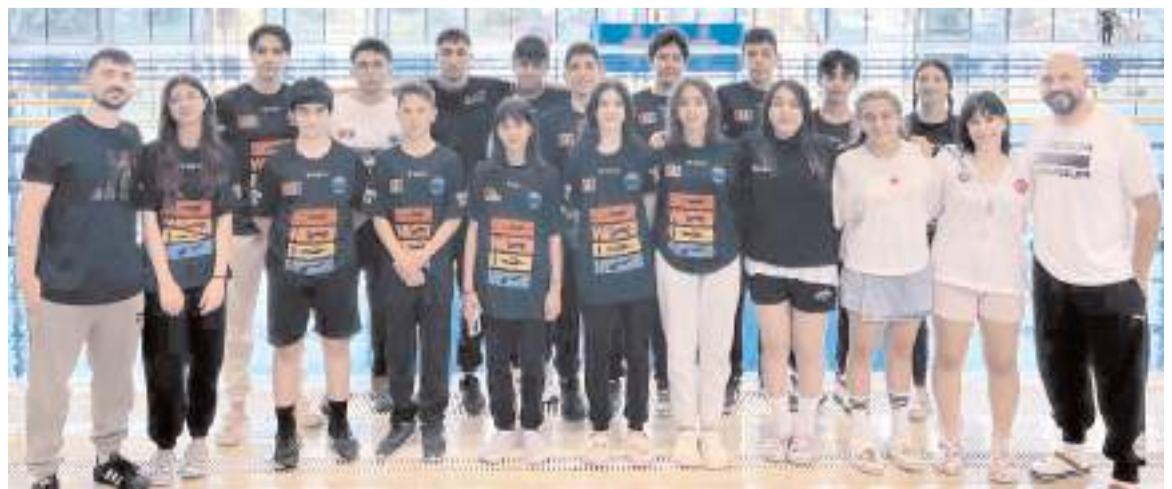
Türkiye Şampiyonasında mücadele eden Çorumlu sporcular toplu halde görülüyor