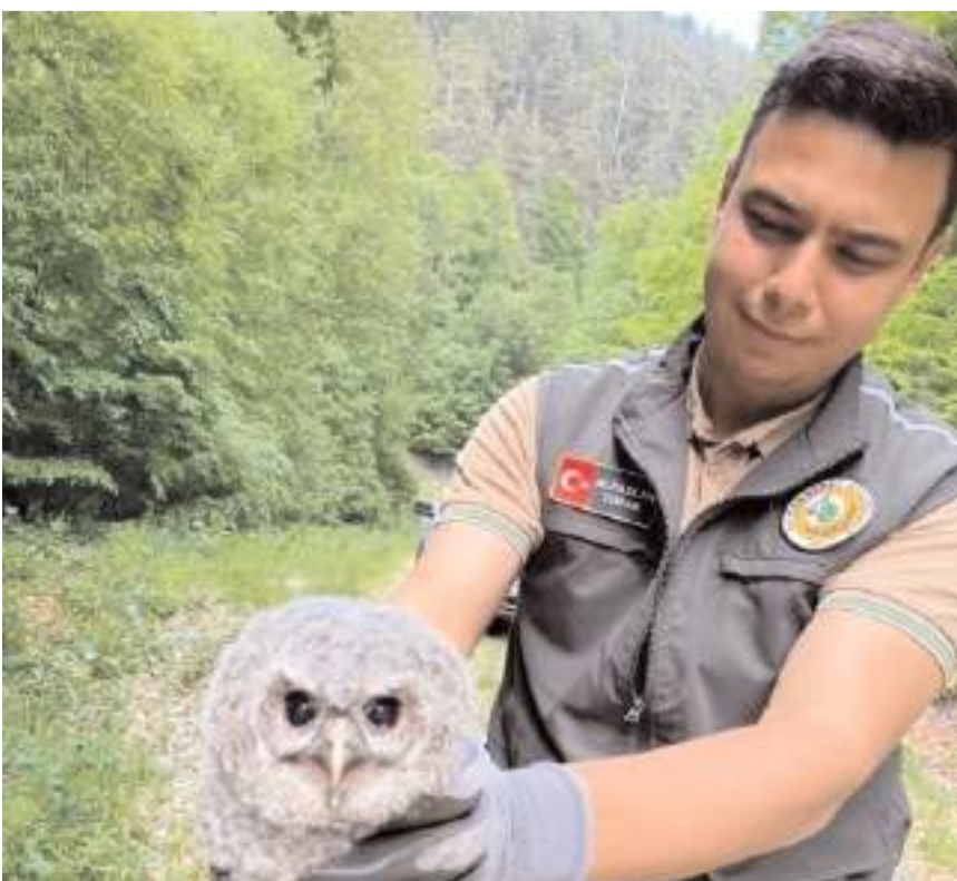
Orman Muhafaza ekipleri, baykuşu Doğa Koruma ve Milli Parklar Şube Müdürlüğüne teslim etti.

Baykuşun, sağlık kontrolünden geçirdikten sonra uygun koşulların sağlanması durumunda doğal yaşam alanına bırakılacağı bildirildi. (AA)