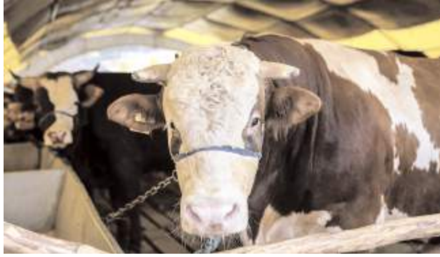
Belediye kurban bağışi sistemini hizmete açtı.

Çöplü, bağışlanan kurbanların bayramın üçüncü günü Çorum Belediyesi Halk Et Kombinası'nda kesile-