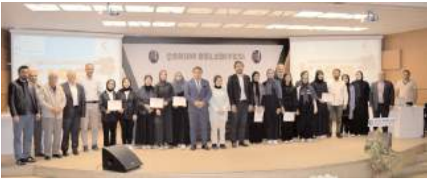
Yarısmada derece elde edenlere ödülleri törenle verildi.