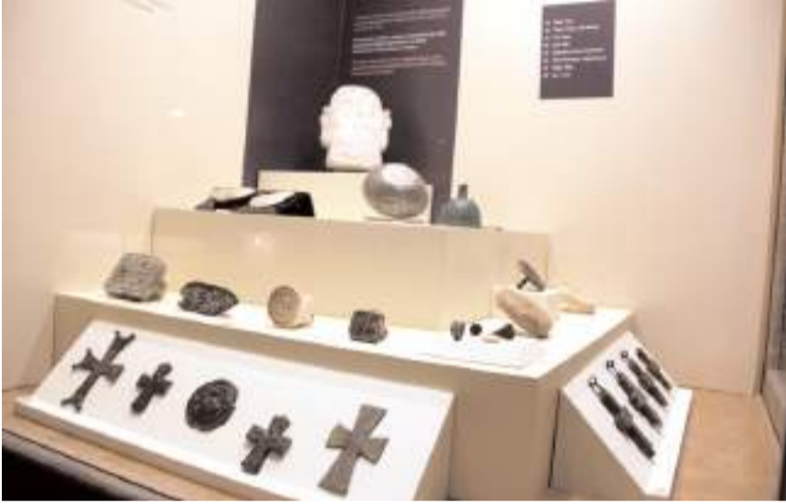
Çorum Müzesinde 15 bin eser sergileniyor.