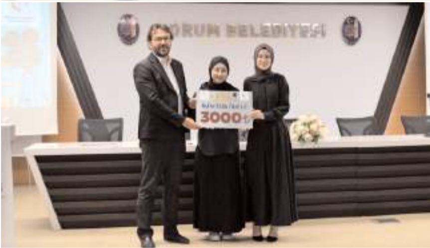
Yarısmada Boykot, Filistin/Gazze, Sosyal Medya ve Göç konuları ele alındı.