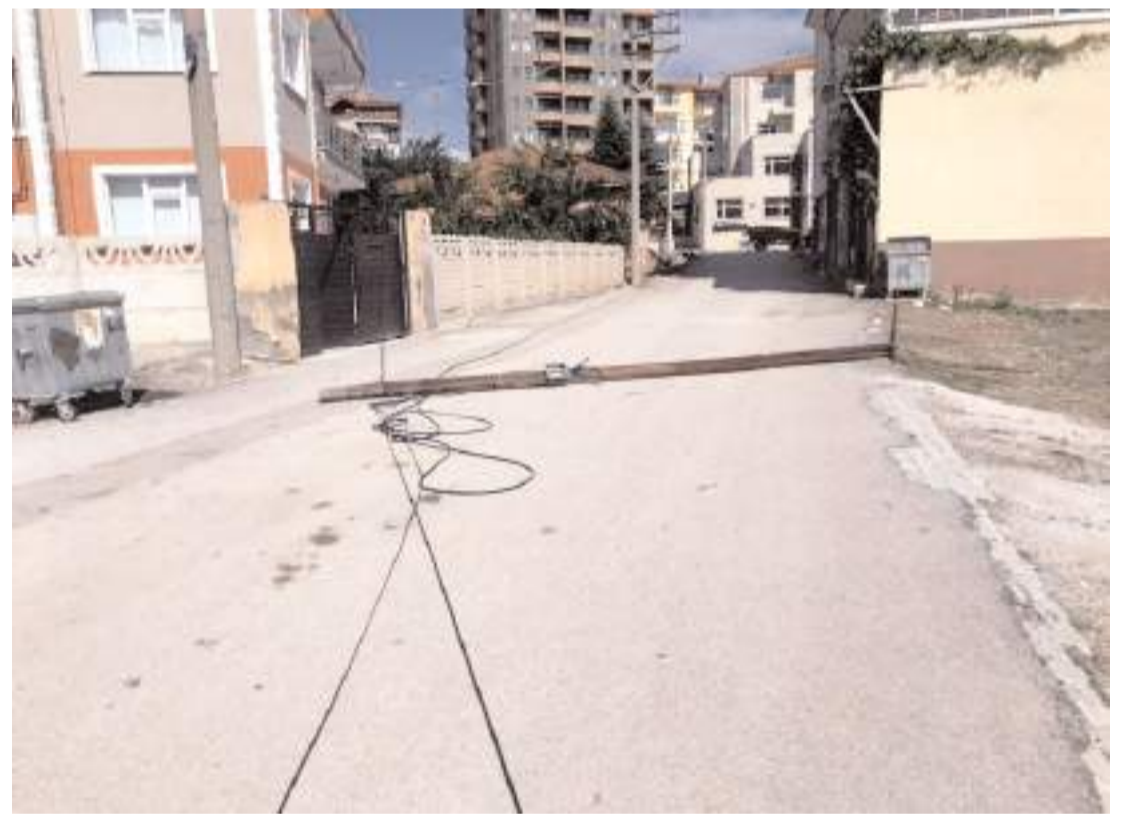
Kaza, Denizhan Mahallesi Çam Sokak'ta meydana geldi.

"Emniyet Genel Müdürlüğü KOM Başkanlığı koordinesinde, Çankırı İl Emniyet Müdürlüğü KOM Şube Müdürlüğüne yapılan çalışmalar sonucu; Çankırı merkezli Ankara, İstanbul, Rize, Kastamonu, Kırıkkale, Çorum, Düzce ve Sakarya'da düzenlenen operasyonlarda organize suç örgütü üyesi şüphelilerin; suç işlemek amacıyla yasadışı iş yeri kurulumu, uyuşturucu madde ticareti ve yasa dışı silah ticareti suçlarını işledikleri tespit edildi. Operasyonlar sonucu 15 adet ruhsatsız tabanca, 10 adet ruhsatsız tüfek, çok sayıda senet ve para ile muhtelif miktarda uyuşturucu madde ele geçirildi. Operasyonları gerçekleştiren kahraman polislerimizi tebrik ediyorum. Allah ayaklarına taş değdirmesin. Milletimizin dustası sizinle." (İHA)