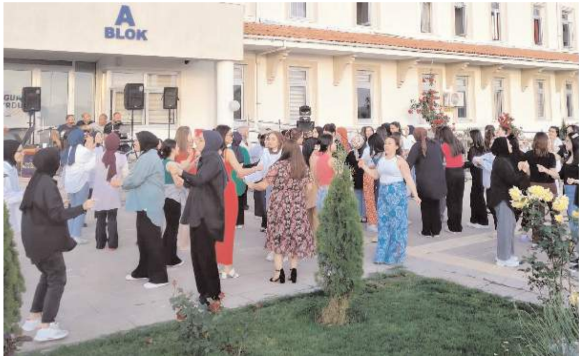
Kutlama programı Sungurlu KYK Yurdu bahçesinde yapıldı.