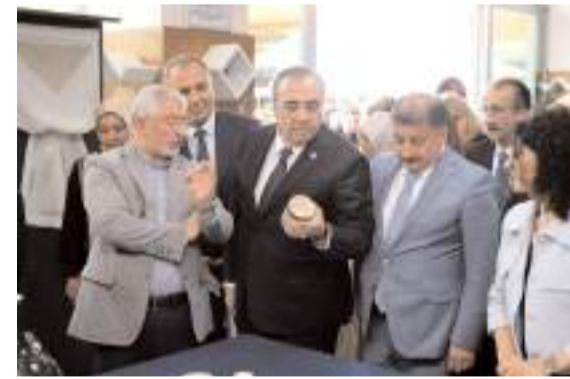
Davetliler ürünleri yakından inceledi.

■ Emlak, Çevre Temizlik ve İlan Reklam Vergilerinin ilk taksiti için ödeme süresi 31 Mayıs Cuma günü bitiyor. * HABERİ 7'DE