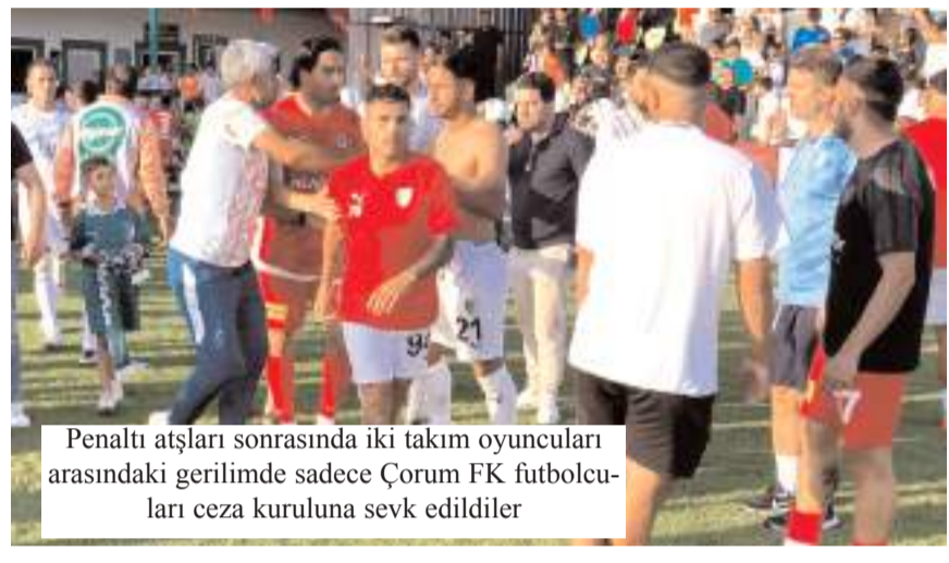
Penaltı atışları sonrasında iki takım oyuncuları arasındaki gerilimde sadece Çorum FK futbolcuları ceza kuruluna sevk edildiler

Aynı maçta ev sahibi Bodrum FK'ya ise bir maç seyircisiz oynama cezası ve 56 bin lira para cezası, eski kuzey kale arkası tribün B ve C bloklarına bir sonraki iç saha maçında giriş yasağı getirildi. Bu cezanın takıma verilen ceza dışında uygulanmasına karar verildi. Merdiven boşlukları boş bırakılmadığı için 42 bin lira para cezası verilen Bodrum FK'ya çirkin ve kötü tezahürat nedeniyle yedi bloğa bir maç ceza verildi.