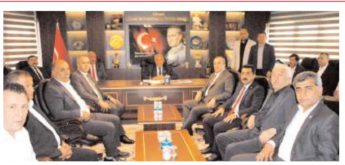
Milletvekili Kayıncı, esnafın sorun ve taleplerini dinledi.