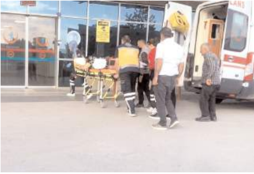
Z.A. Hitit Üniversitesi Erol Olçok Eğitim ve Araştırma Hastanesi'nde tedavi altına alındı.

Alaca'da, eşinin kazara köstebek tabancasıyla yaraladığı kadın, hastanede tedavi altına alındı.