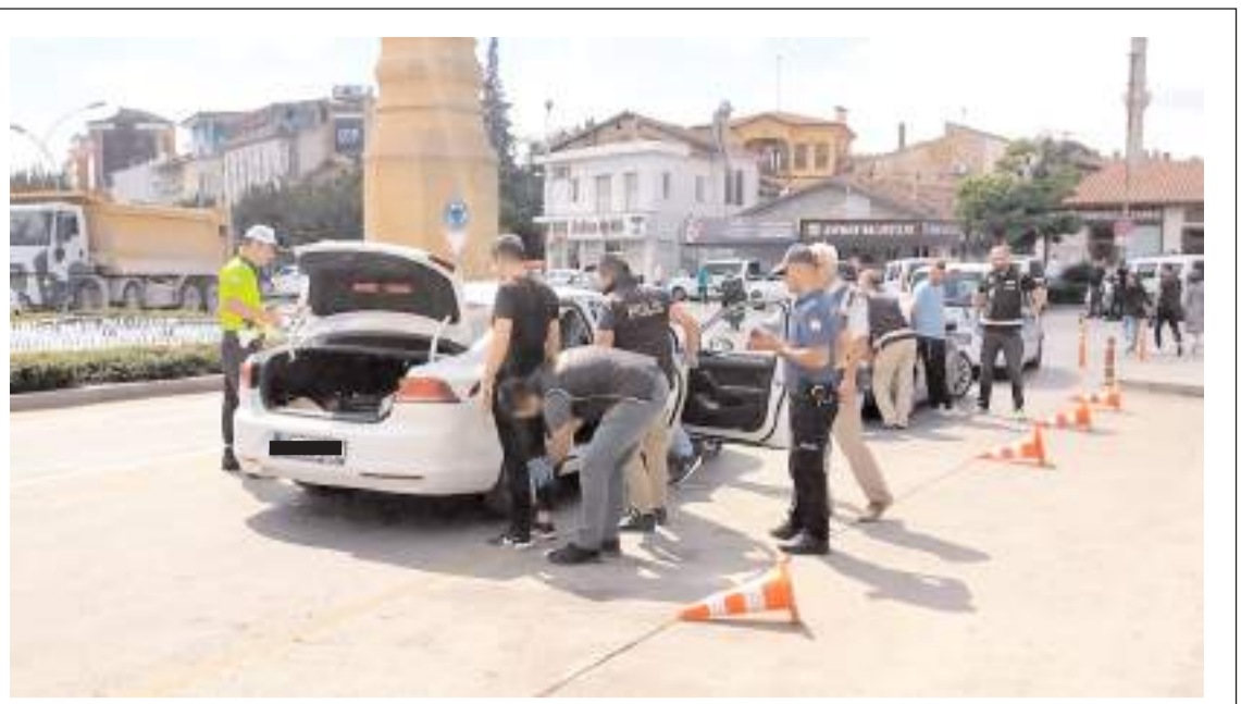
Çalışmalarda 2 bin 741 şahsın GBT kontrolü yapıldı.