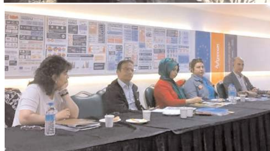
Toplantıda Türkiye'de sivil toplum örgütlerinin kendilerini güçlendirmesi gereken alanlar ve örgütlerin güçlenmesinin önündeki başlıca engeller tartışıldı.

rum'dan katılan 2 dernekten biriyiz. İlişkilerimizin artarak sürmesini ve STGM Derne-