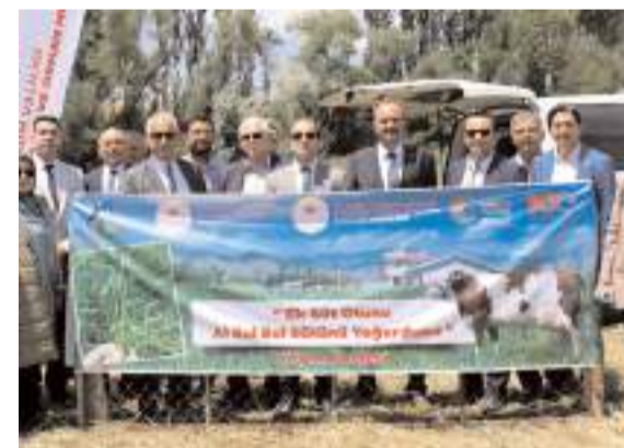
"Süt Otu (ryegrass) Yayım Projesi"nin tarla günü İskilip'te yapıldı.