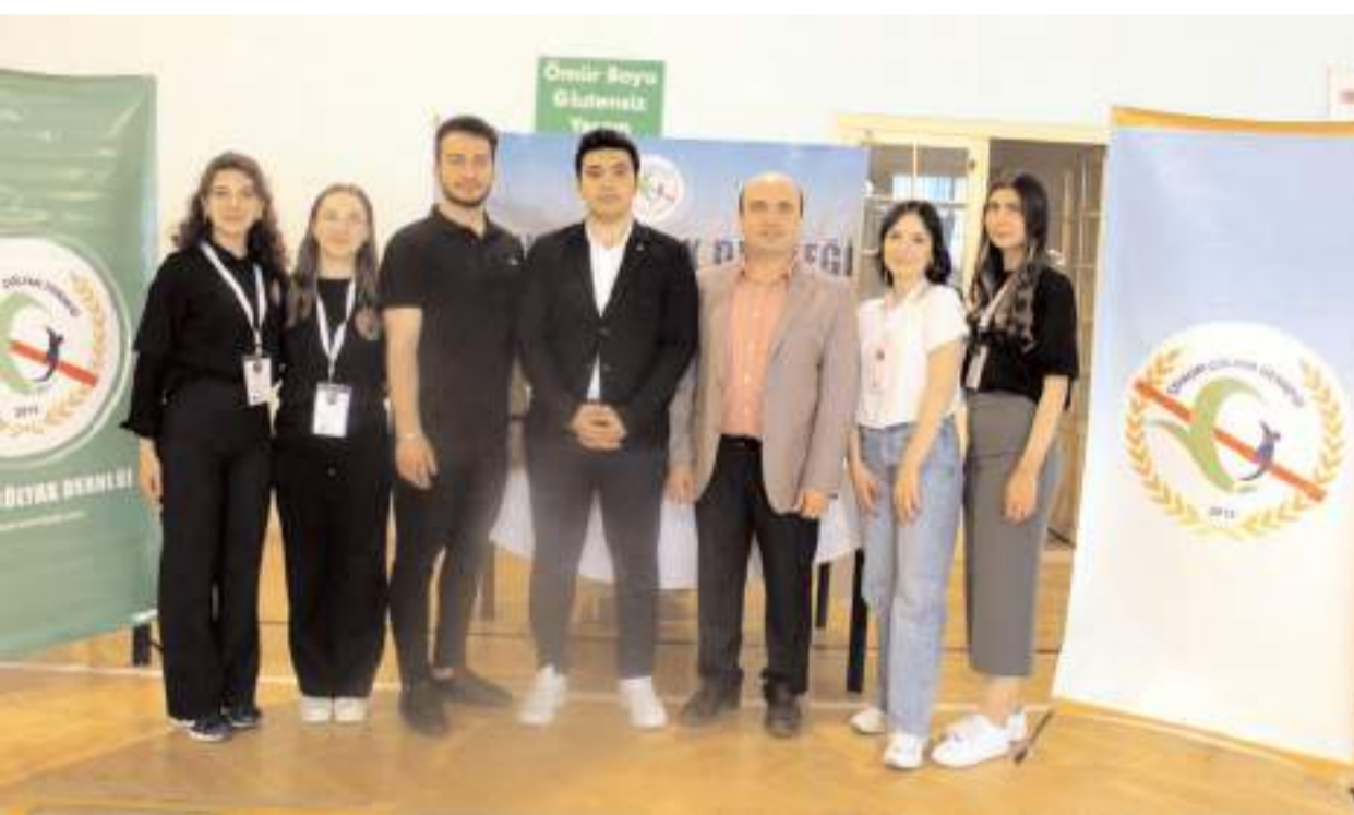
Sağlıklı Yaşam Festivali'ni Hitit Üniversitesi Beslenme ve Diyetetik Kulübü ve Sağlık Bilimleri Fakültesi işbirliğinde yapıldı.

Resmi İlanlar: www.ilan.gov.tr'de (Basın: 2040720)