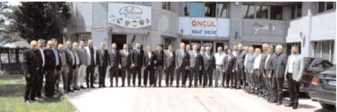
Ziyaretin sonunda hatıra fotoğrafı çekildi.