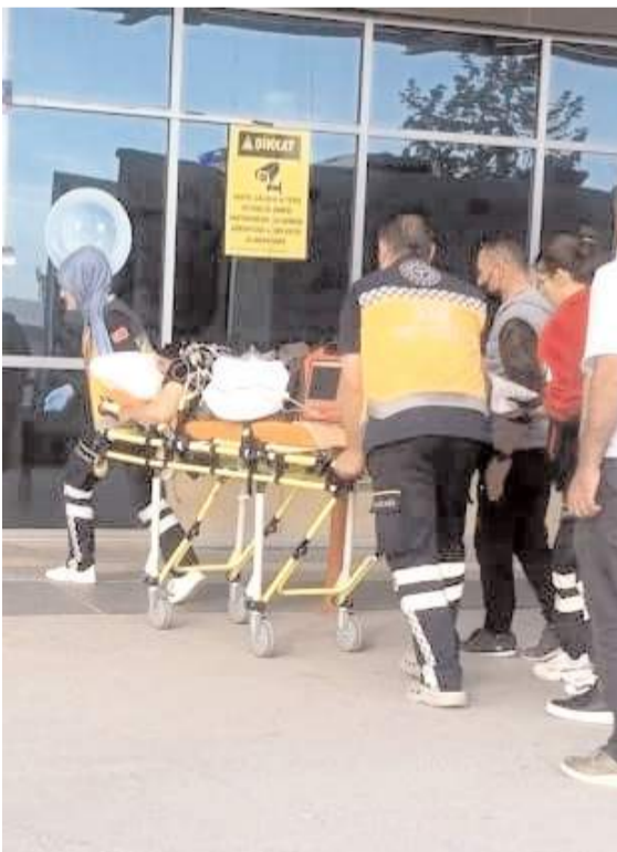
Z.A. Hitit Üniversitesi Erol Olçok Eğitim ve Araştırma Hastanesi'nde tedavi altına alındı.