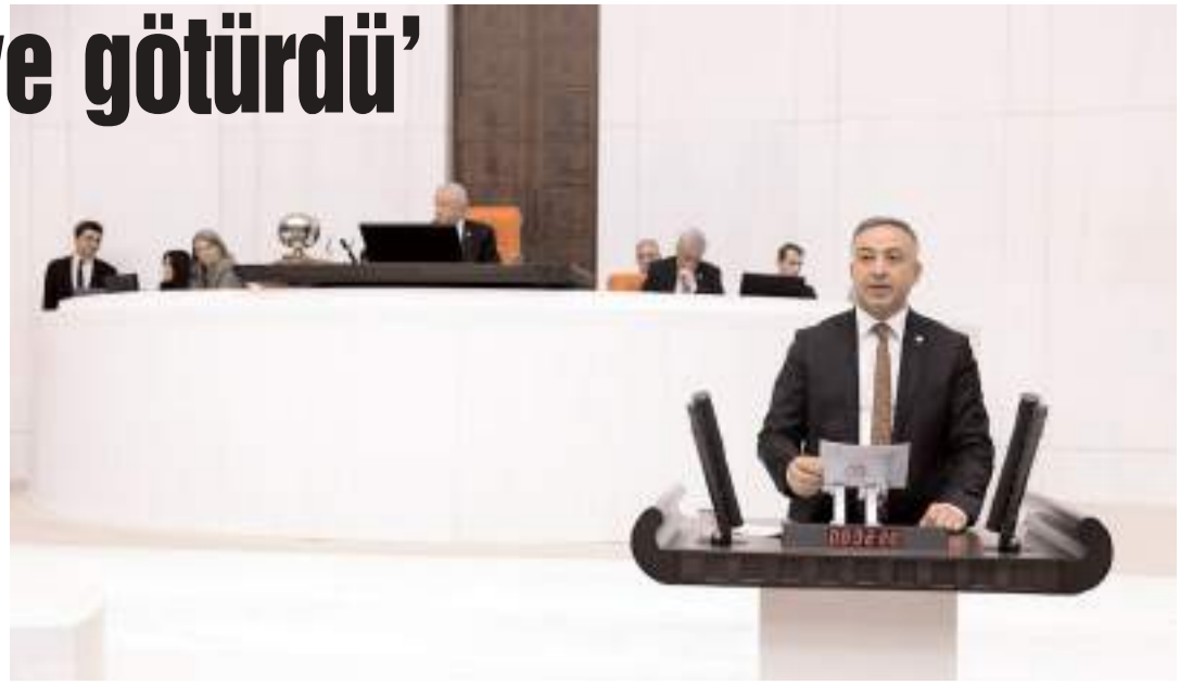
CHP Çorum Milletvekili Mehmet Tahtasız