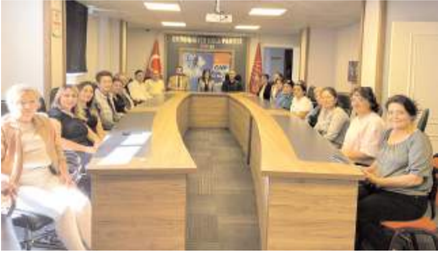
CHP Merkez İlçe Kadın Kolları kongresi parti binasında yapıldı.