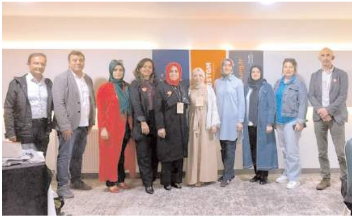
Toplantıların ilki Anitta Otel'de yapıldı.

Tokat'ta ihracat 2,1 milyon dolar, ithalat 2,8 milyon dolar, Amasya'da ihracat 12,6 milyon dolar, ithalat ise 3 milyon dolar olarak gerçekleşti.