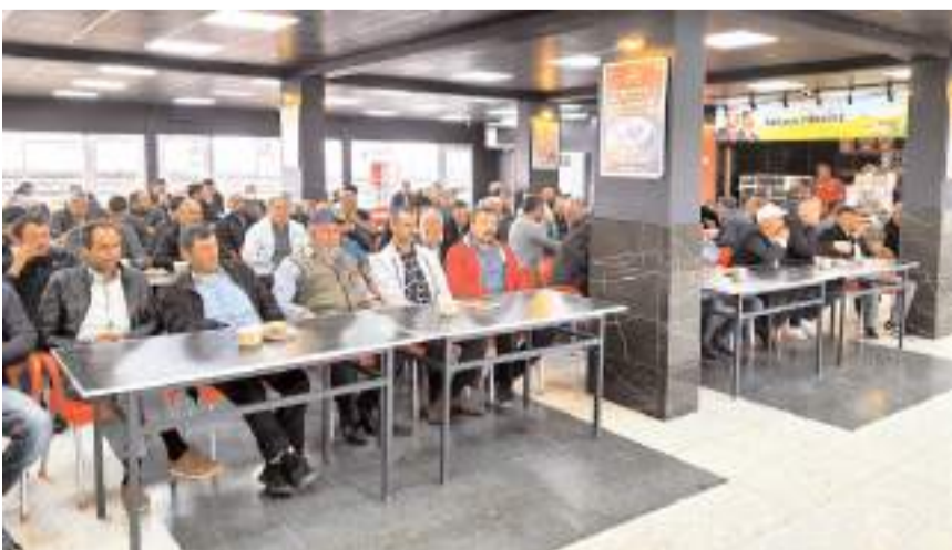
12 büyükbaş ve 76 küçükbaş besicisinin, kurbanlık satış yerleri belirlendi.

ban pazar yerimizi hiçbir mağduriyetin yaşanmaması için en iyi şekilde düzenliyoruz.