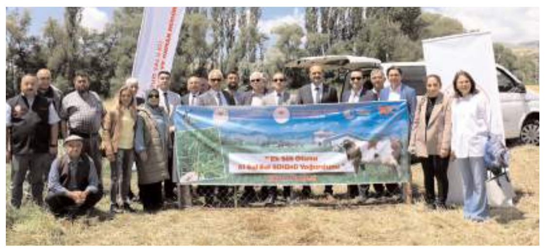
"Süt Otu (ryegrass) Yayım Projesi"nin tarla günü İskilip'te yapıldı.

ÖZGÜN BESİCİLİK Büyükbaş kurbanlık satışlarımız başlamıştır. Veteriner hekim kontrolünde ve hijyenik şartlarda kesim ve pay yapılır. Tel: 0 532 707 47 24 Adres: Güveçli (Maza) Köyü ÇORUM