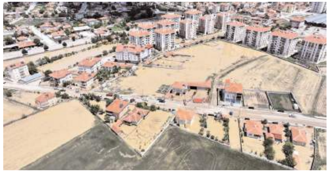
Şiddetli yağış nedeniyle taşan dereler sele neden oldu.

suslarda ilgili personellerle istişare ederek, incelemelerde bulundu.