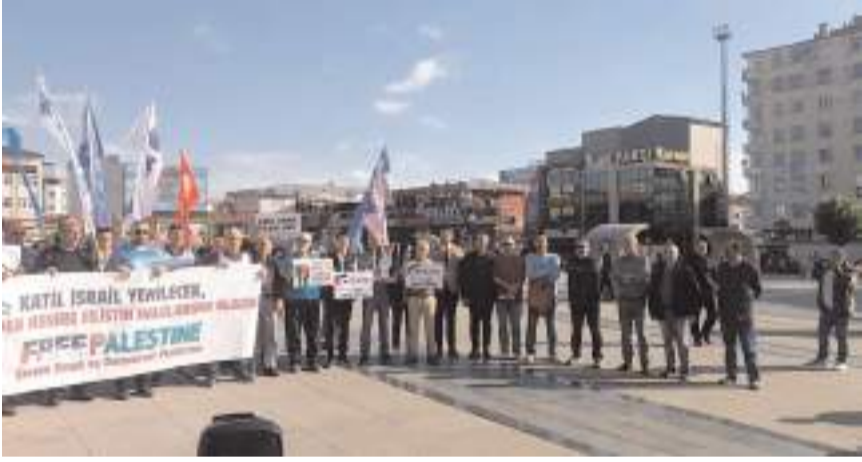
Eylemde İsrail'in Filistin'de gerçekleştirdiği katliamlara tepki gösterildi.