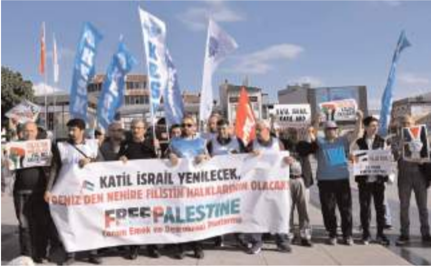
Eylem Kadeş Barış Meydanında yapıldı.