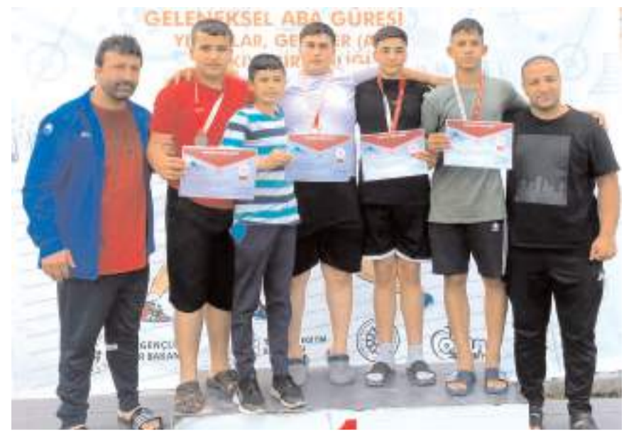
Aba Güreş'te madalya kazanan güreşçiler ödül töreni sonrasında antrenörleri ile