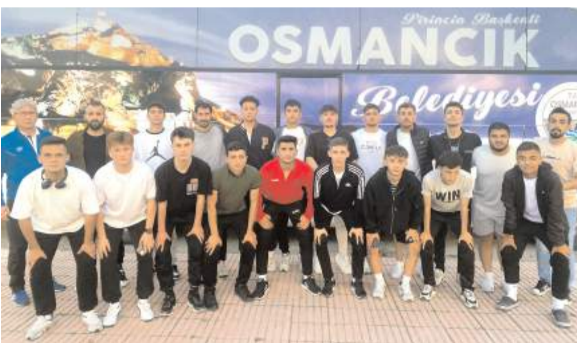
Osmancıkgücüspor Mecitözüspor deplasmanından üç puanla dönerek final grubunda ikinci maçını kazandı