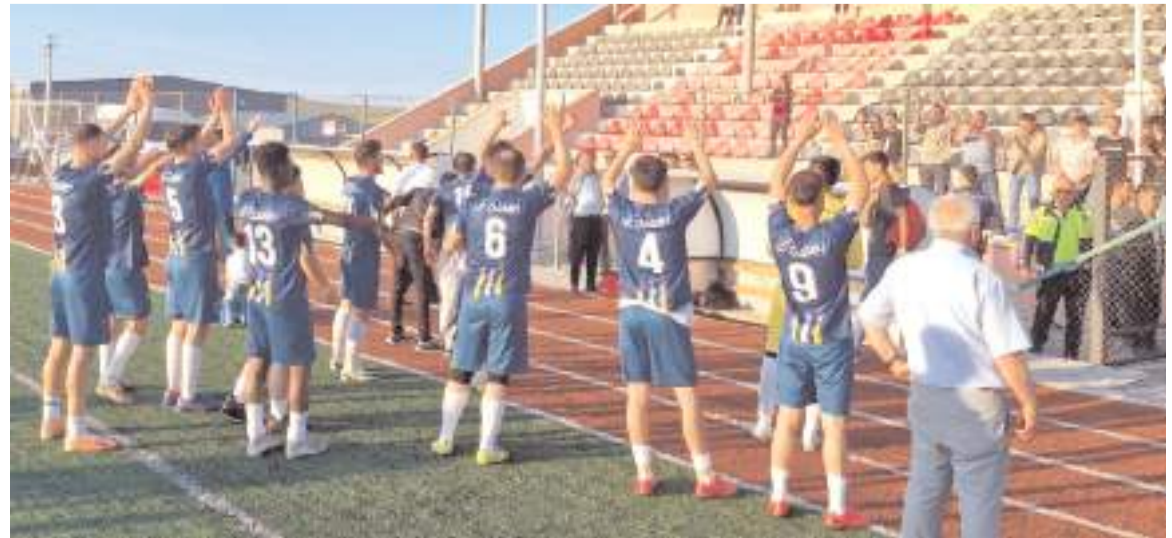
Alacagücüspor ikinci maçında evinde farklı kazandığı maçın ardından üç puan sevincini taraftarları ile paylaştı