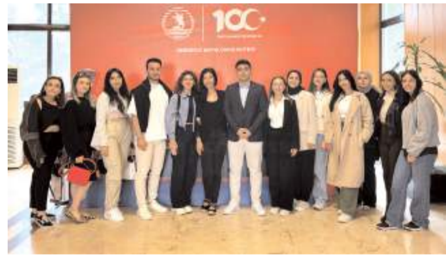
Hitit Üniversitesi Beslenme ve Diyetetik Kulübü sempozyuma kalabalık bir ekip ile katıldı.

Kulüp tarafından yapılan açıklamada, sempozyum düzenleme kuruluna, katkı sağlayan Çorum Belediyesine ve emeği geçenlere teşekkür edildi.