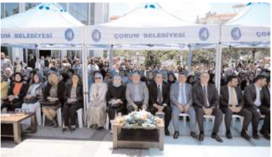
Sergi Buhara Kültür Merkezi'nde açıldı.

Konuşmaların ardından serginin açılış kurdelesi kesildi. Sergiyi gezen davetliler kadın kursiyerlerin hazırladığı el emeği ürünlere tam not verdi. (Haber Merkezi)