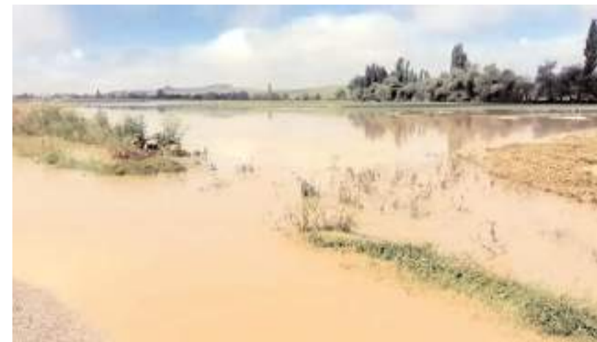
Sel nedeniyle tarım arazilerinde hasar meydana geldi.

Şiddetli yağış Sungurlu ilçesinde de tarım arazilerine zarar verdi. İlçeye bağlı Mehmetbeyli köyünde akşam saatlerinde yağın dolunun ardından yer yer beyaz örtü oluştu. Tarım arazileri suyla kaplanan köyde yollarda da hasar meydana geldi. Selin yolu ulaşım kapattığı köy sakinleri, köyden geçen dere yağı olmadığı için yolların ikiye bölündüğünü dile getirerek, İl Özel İdarelerinden köylerine dere yağı yapılmasını istediler. (İHA)