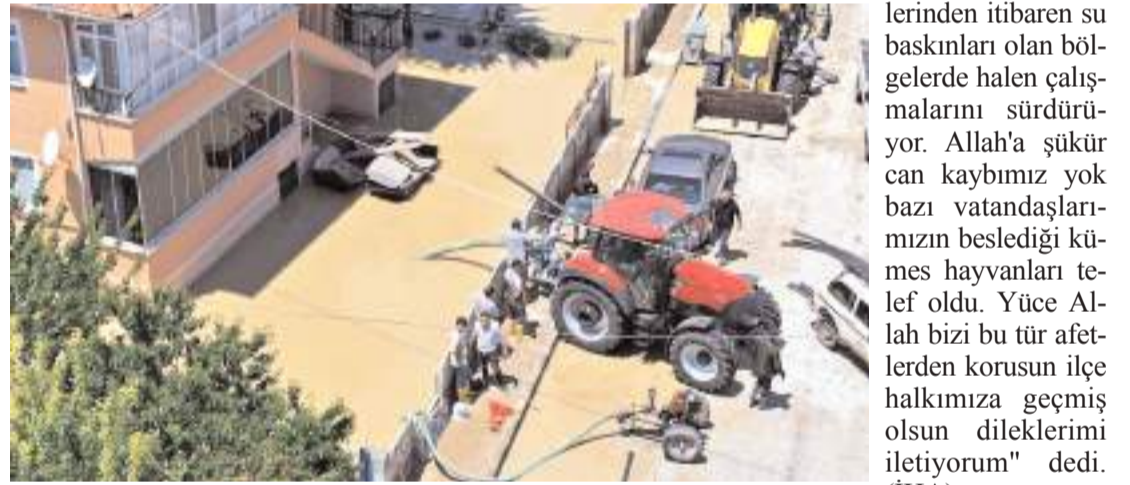
Belediye ekipleri sel sularını tahliye etmek için yoğun çaba harcadı.

Çelebibağ, Kıcılı, Eskiypar köylerinin oluşturduğu bölgeden gelen derelerin taşması sonucu oluşan sel ilçemize kadar ulaştı. Denizhan Mahallesi Terminal Sokak, Zafer Sokak, TOKİ konutları ve çevresinde bulunan 20'ye yakın evde su baskınlarından dolayı hasarlar oluştu. İlçede ekim yapan çiftçilerin mahsulleri dolu ve selden dolayı zarar gördü. Belediyemize ait ekipler dün akşam saatlerinden itibaren su baskınları olan bölgelerde halen çalışmalarını sürdürüyor. Allah'a şükür can kayıbmız yok bazı vatandaşlarımızın beslediği kümes hayvanları telef oldu. Yüce Allah bizi bu tür afetlerden korusun ilçe halkımıza geçmiş olsun dileklerimi iletiyorum" dedi. (İHA)