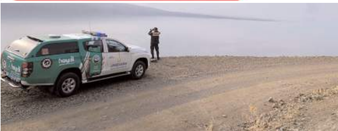
Jandarma, yüzme alanı olarak belirlenen alanlar dışında kalan alanlarda yüzülmemesi konusunda uyarıda bulundu.

Yüzme alanı olarak belirlenen alanlar dışında kalan göl, gölet, baraj, sulama kanalı, akarsu, sulama ve hayvan içme suyu göletleri, sel kapını, regülatör, su iletimi, deşarj veya taşkın kontrol kanalı gibi alanlarda suya girişlerin yasak olduğunu hatırlatıldığı açıklamada, "Bu alanları serinleme ya da yüzme amaçlı kullanımlardan 15 yaş ve üzeri kişilerin kendilerine, 15 yaş altındaki kişilerin ise veli veya vasilerine 5236 sayılı Kabahatler Kanununun 32'nci maddesi gereğince idari para cezası uygulanacaktır" ifadeleri kullanıldı. (Haber Merkezi)