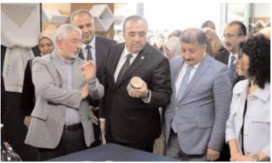
Davetliler ürünleri yakından inceledi.